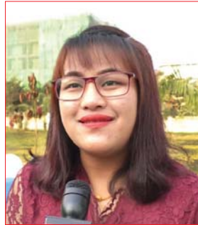
မမေသူသူအောင်

ကိုရိုနာဗိုင်းရပ်စ် COVID-19 ကူးစက်ဖြစ်ပွားရာ တရုတ်နိုင်ငံ ဝူဟန်မြို့မှ ပြန်လည်ခေါ်ယူ၍ မန္တလေးမြို့ ကန်တော်နဒီဆေးရုံတွင် ၁၄ ရက်ကြာ ရောဂါကူးစက်မှု ရှိ/မရှိ စောင့်ကြပ်ကြည့်ရှုမှုခံယူခဲ့ကြသည့် မြန်မာကျောင်းသား ကျောင်းသူ ၅၉ ဦးနှင့် ၎င်းတို့အား ပြန်လည်ခေါ်ယူရာတွင် ဝူဟန်မြို့သို့ လိုက်ပါသွားခဲ့ကြသည့် ကျန်းမာရေးဝန်ထမ်းသုံးဦးတို့သည် ဖေဖော်ဝါရီ ၁၆ ရက်က ကျန်းမာရေးကောင်းမွန်စွာဖြင့် ၎င်းတို့နေထိုင်ရာ ဒေသအသီးသီးသို့ ပြန်သွားကြပြီဖြစ်သည်။ အဆိုပါ ကျောင်းသား ကျောင်းသူ ၅၉ ဦးတို့အား ဖေဖော်ဝါရီ ၂ ရက်တွင် ဝူဟန်မြို့မှ ပြန်လည်ခေါ်ယူ၍ မန္တလေးမြို့ ကန်တော်နဒီဆေးရုံတွင် သီးသန့်ထားရှိကာ ဗိုင်းရပ်စ်ရောဂါ ကူးစက်မှု ရှိ /မရှိ ကျန်းမာရေးစောင့်ကြပ်ကြည့်ရှုမှုကို ၁၄ ရက်ကြာ ဆောင်ရွက်ပေးခဲ့ပြီး သတ်မှတ်ကာလပြည့်မြောက်သည့် ဖေဖော်ဝါရီ ၁၅ ရက်အထိ သံသယဖြစ်ဖွယ်ရာ ရောဂါလက္ခဏာမတွေ့ရှိခဲ့သည့်အတွက် ဖေဖော်ဝါရီ ၁၆ ရက်တွင် ၎င်းတို့၏ နေအိမ်အသီးသီးသို့ ပြန်ခွင့်ပြုခဲ့ခြင်း ဖြစ်ရာ ကျန်းမာစွာ အိမ်ပြန်ခွင့်ရရှိကြသည့် ကျောင်းသား ကျောင်းသူများနှင့် တာဝန်ယူစောင့်ရှောက်ပေးသူများမှ ကျန်းမာရေး စောင့်ကြပ်ကြည့်ရှုမှုခံယူသည့်ကာလအတွင်း ဆောင်ရွက်ပေးမှုများနှင့် ပတ်သက်၍ အမှတ်တရစကားများကို ယခုလို ပြောကြားခဲ့ကြသည်။