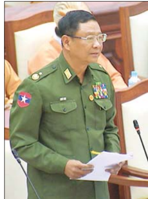
ဒုတိယဝန်ကြီး ဗိုလ်ချုပ်အောင်သူ