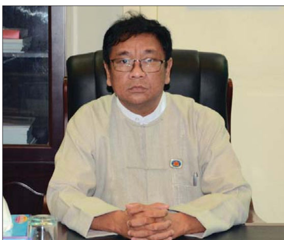
ဒေါက်တာ ဇော်လင်းထွဋ် (ဥက္ကဋ္ဌ၊ အမျိုးသားလွှတ်တော် ကျန်းမာရေး၊ အားကစားနှင့် ယဉ်ကျေးမှုဆိုင်ရာ ကော်မတီ)

ဒေါက်တာ ဇော်လင်းထွဋ် ဥက္ကဋ္ဌ၊ အမျိုးသားလွှတ်တော် ကျန်းမာရေး၊ အားကစားနှင့် ယဉ်ကျေးမှုဆိုင်ရာ ကော်မတီ (မွန်ပြည်နယ် မဲဆန္ဒနယ် အမှတ် (၉) အမျိုးသားလွှတ်တော်ကိုယ်စားလှယ်) ကျွန်တော်တို့ ကော်မတီရဲ့ အဓိက တာဝန်က ပြည်သူတွေရဲ့ ကျန်းမာရေး အဆင့်အတန်းမြှင့်တင်ပေးဖို့အတွက် အစိုးရအဖွဲ့နဲ့ ပေါင်းစပ်ဆောင်ရွက်ဖို့ ဖြစ်ပါတယ်။ ကျန်းမာရေးနဲ့ ပတ်သက်ပြီး ပြည်သူတွေ အတွက် အကျိုးရှိစေမယ့် ဥပဒေတွေ ပြဋ္ဌာန်း နိုင်ဖို့အတွက်လည်း ဆောင်ရွက်ပေးရပါ တယ်။ ကျွန်တော်တို့အနေနဲ့ လွှတ်တော်က ပေးအပ်ထားတဲ့ လွှတ်တော်ကိုယ်စားလှယ် လုပ်ငန်းတာဝန်က သုံးရပ်ရှိပါတယ်။ ဥပဒေ ပြုရေးကတော့ ကျွန်တော်တို့ လွှတ်တော် ကိုယ်စားလှယ်တွေရဲ့ အဓိကလုပ်ငန်း တာဝန် ဖြစ်ပါတယ်။ နံပါတ်နှစ်က အစိုးရနဲ့ ပေါင်းစပ်ပြီး Check and Balance လုပ်ရ တာပါ။ နံပါတ်သုံးကတော့ မဲဆန္ဒနယ်တွေကို ကိုယ်စားပြုတာပါ။ ဒါတွေကလည်း လွှတ်တော်ကိုယ်စားလှယ်တစ်ဦးရဲ့ တာဝန် တွေပါပဲ။ လွှတ်တော်ကျင်းပပြီးလို့ သက်ဆိုင် ရာ မဲဆန္ဒနယ်ကို ပြန်တဲ့အခါမှာ ကျွန်တော် တို့ဟာ ကော်မတီရဲ့ တာဝန်တွေကိုလည်း ထမ်းဆောင်ရပါတယ်။ သက်ဆိုင်ရာ မဲဆန္ဒနယ်က ဆေးရုံတွေ၊ ကျေးလက်ကျန်းမာရေးဌာနခွဲတွေကို သွား ရောက်လေ့လာပြီး လွှတ်တော် ကျင်းပချိန်မှာ ဆွေးနွေးရပါတယ်။ ပြီးရင် သက်ဆိုင်ရာ ကျန်းမာရေးနှင့် အားကစားဝန်ကြီးဌာနနဲ့ ပေါင်းစပ်ရပါတယ်။ ဒီလုပ်ငန်းတွေအပြင်