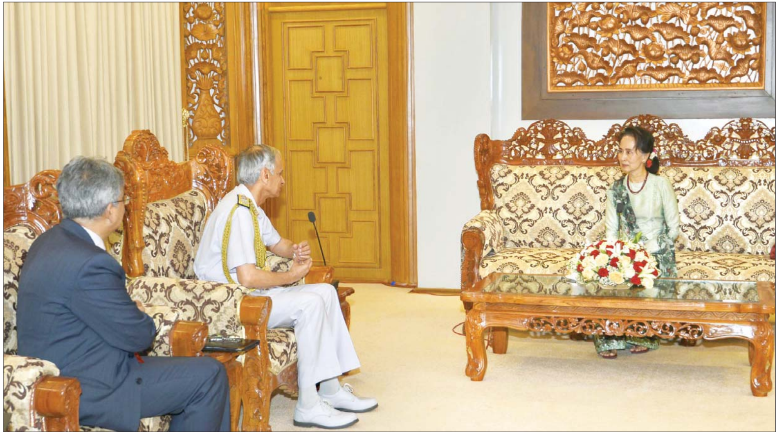
နိုင်ငံတော်၏အတိုင်ပင်ခံပုဂ္ဂိုလ် ဒေါ်အောင်ဆန်းစုကြည် အိန္ဒိယ ရေတပ်ဦးစီးချုပ် Admiral Karambir Singh, PVSM, AVSM, ADC အား လက်ခံ တွေ့ဆုံစဉ် သတင်းစဉ်

ထိုသို့ တွေ့ဆုံစဉ် လူစွမ်းအား အရင်းအမြစ် ဖွံ့ဖြိုးတိုးတက်ရေးနှင့် သဘာဝဘေးအန္တရာယ် စီမံခန့်ခွဲရေး အပါအဝင် ပူးပေါင်းဆောင်ရွက်ရေး ဆိုင်ရာ ကိစ္စရပ်များနှင့် နှစ်နိုင်ငံ ဆက်ဆံရေး ပိုမိုတိုးမြှင့်သွားရေးတို့ကို အမြင်ချင်းဖလှယ် ဆွေးနွေးခဲ့ကြသည်။ သတင်းစဉ်