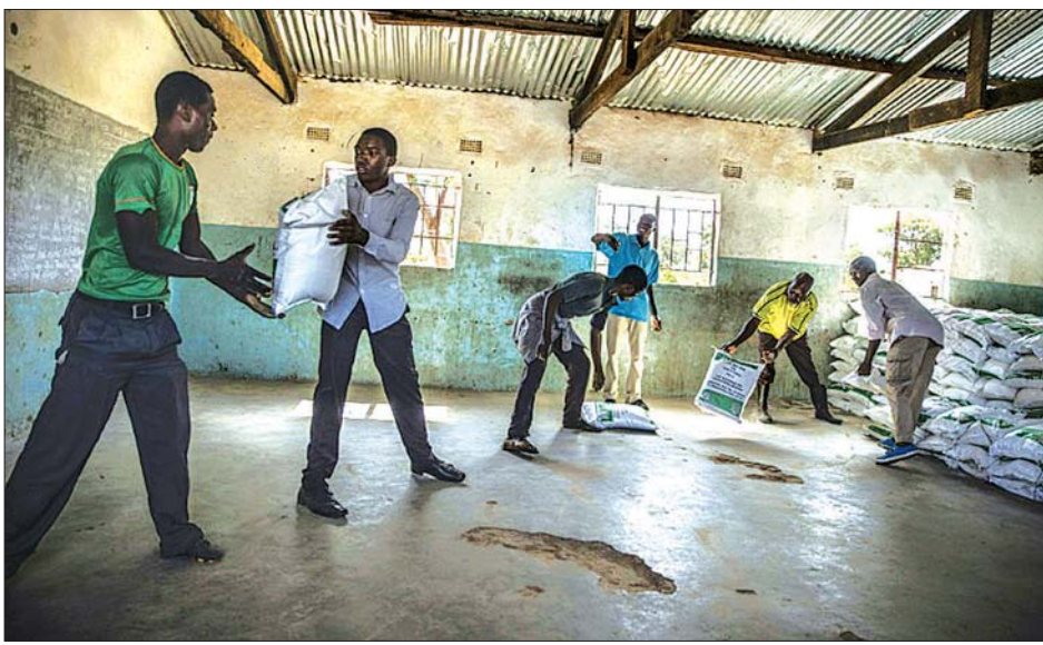
ပြောင်းအိတ်များဖြန့်ဝေရာတွင် အကူအညီပေးနေကြသည့် စေတနာ့ဝန်ထမ်းများကို တွေ့ရစဉ်။

အဆိုးရွားဆုံးမုန်တိုင်း ဆိုင်ကလွန်းမုန်တိုင်း Idai ကြောင့် မိုးအဆက်မပြတ် ရွာသွန်းမှုကြောင့် ရေကြီးမှုဖြစ်ပေါ်ခဲ့ရတာပါ။ အာဖရိကကို ဝင်ရောက်ခဲ့တဲ့ အဆိုးရွားဆုံးမုန်တိုင်းတွေထဲက တစ်ခုပါ။ အဲဒီမုန်တိုင်းဟာ ဇင်ဘာတွေ နိုင်ငံအရှေ့ပိုင်း ဘူဟီရာကျေးရွာကို ဝင်ရောက်ခဲ့ပါတယ်။ လက်ရှိ ဘူဟီရာကျေးရွာရဲ့ အခြေအနေကတော့အရင်တုန်းကနဲ့ မတူတော့ပါဘူး။ ဒါပေမယ့် ဘေးဒုက္ခတွေကလည်း အရင်အတိုင်းရှိနေဆဲပါ။