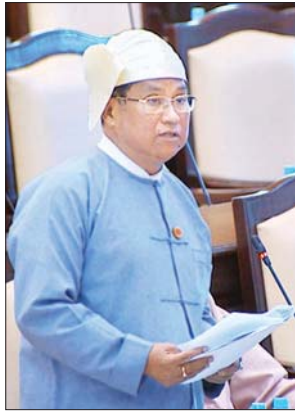
ဒုတိယဝန်ကြီး ဦးစိုးအောင်

အစည်းအဝေးတွင် မန္တလေးတိုင်းဒေသကြီး မဲဆန္ဒနယ် အမှတ်(၂)မှ ဦးထွန်းထွန်းဦး၏ မြန်မာနိုင်ငံအတွင်း၌ မြေငလျင်များ မကြာခဏလှုပ်ခတ်လာပါသဖြင့် ငလျင်ဘေးအန္တရာယ်ကာကွယ်ရေးအတွက် ကြိုတင်ပြင်ဆင်ထားမှုများနှင့် အန္တရာယ်ကျရောက်လာပါက ထိခိုက်ပျက်စီးဆုံးရှုံးမှုများ လျော့နည်းသက်သာစေရန်အတွက် မည်ကဲ့သို့စနစ်တကျ စီမံဆောင်ရွက်ထားသည်ကို သိရှိလိုခြင်းမေးခွန်းနှင့် စပ်လျဉ်း၍ လူမှုဝန်ထမ်း၊ ကယ်ဆယ်ရေးနှင့် ပြန်လည်နေရာချထားရေးဝန်ကြီးဌာန ဒုတိယဝန်ကြီး ဦးစိုးအောင်က မြန်မာနိုင်ငံတွင် မြေငလျင်ဘေးအပါအဝင် သဘာဝဘေးအန္တရာယ်များနှင့် ပတ်သက်၍ စီမံခန့်ခွဲမှုကို ဒုတိယသမ္မတ ဦးဟင်နရီဗန်ထီးယူ ဦးစီးသော အမျိုးသားသဘာဝဘေးအန္တရာယ်ဆိုင်ရာ စီမံခန့်ခွဲမှုကော်မတီကို ဖွဲ့စည်းထားရှိ ဆောင်ရွက်လျက်ရှိကြောင်း၊ ထို့ပြင် သဘာဝဘေးစီမံခန့်ခွဲမှု လုပ်ငန်းများတွင် သက်ဆိုင်ရာကဏ္ဍအလိုက် ကျွမ်းကျင်ပညာရှင်များ၏ အကြံဉာဏ်များ ရယူဆောင်ရွက်နိုင်ရန် ဘေးအန္တရာယ်စီမံခန့်ခွဲမှုဆိုင်ရာ အကြံပေးအဖွဲ့ကိုလည်း ဖွဲ့စည်းပြီး အကြံဉာဏ်များ ရယူဆောင်ရွက်ပေးလျက်ရှိကြောင်း၊ သဘာဝဘေးစီမံခန့်ခွဲမှုလုပ်ငန်းများ ဆောင်ရွက်ရာတွင် ချက်ချင်းအကောင်အထည်ဖော် ဆောင်ရွက်နိုင်ရန်အတွက် အမျိုးသားသဘာဝဘေးအန္တရာယ်ဆိုင်ရာ စီမံခန့်ခွဲမှုရန်ပုံငွေကိုလည်း နိုင်ငံတော်၏ ထည့်ဝင်ငွေနှင့် လှူဒါန်းမှုများမှ ရရှိငွေများဖြင့် ထူထောင်ထားရှိ စီမံခန့်ခွဲလျက်ရှိကြောင်း။