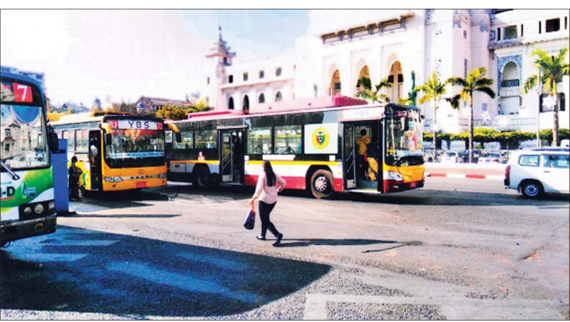
ရန်ကုန်မြို့ မဟာဗန္ဓုလပန်းခြံရေဂျီ YBS ယာဉ်လိုင်းများမှ မော်တော်ယာဉ်များ။

ရန်ကုန်တိုင်းဒေသကြီး သယ်ယူပို့ဆောင် ရေး ကြီးကြပ်ကွပ်ကဲမှု အာဏာပိုင်အဖွဲ့