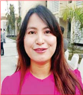
မအိအိရွှေ