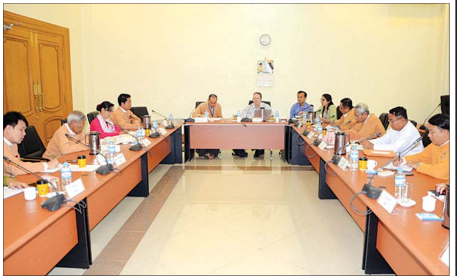
အမျိုးသားလွှတ်တော် ကျန်းမာရေး၊ အားကစားနှင့် ယဉ်ကျေးမှုဆိုင်ရာ ကော်မတီ ပြည်ပအဖွဲ့အစည်းများနှင့် တွေ့ဆုံဆွေးနွေးစဉ်။

စာမျက်နှာ ၁၀ မှ ကျွန်တော်တို့ ကော်မတီနဲ့ Westminster Foundation for Democracy ( WFD ) နဲ့ ပူးပေါင်းပြီး ကင်ဆာနဲ့ ပတ်သက်လို့ ဆောင်ရွက်နေတာလည်း ရှိပါတယ်။ အရင်တုန်းက ကျွန်တော်တို့ နိုင်ငံမှာ ကင်ဆာနဲ့ ပတ်သက်ပြီး စာရင်း ဇယားမရှိပါဘူး။ ကင်ဆာကုသဆောင်ဆိုပြီး သီးခြားမရှိဘူး။ ဒါကြောင့် တိုင်းဒေသကြီး၊ ပြည်နယ်ဆေးရုံတွေက ကင်ဆာရောဂါ ခံစားနေရသူ တွေနဲ့ တွေ့ဆုံဆွေးနွေးပါတယ်။ ဘာတွေ လိုအပ်သလဲ မေးမြန်းပါတယ်။ မြန်မာနိုင်ငံမှာ ကင်ဆာကုသဆောင် ရှိတာ ငါးနေရာပဲ ရှိပါတယ်။ ရန်ကုန်ဆေးရုံကြီး၊ မြောက်ဥက္ကလာဆေးရုံ၊ မန္တလေးဆေးရုံ၊ နေပြည်တော်ဆေးရုံနဲ့ တောင်ကြီးဆေးရုံတို့ ဖြစ်ပါတယ်။ ဒီနေရာတွေကို သွားရောက် လေ့လာခဲ့ပါတယ်။ ဒီလို လေ့လာမှုတွေက ရလာတဲ့ ရလဒ်တွေ ထွက်လာမှာပါ။ အခု လောလောဆယ်တွေ သုတေသနပြုနေပါတယ်။