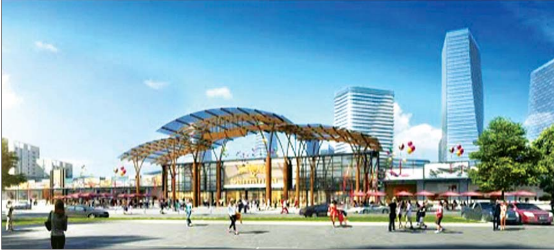
ရန်ကုန်တိုင်းဒေသကြီး ဒဂုံမြို့သစ် ဆိပ်ကမ်းမြို့နယ် ပဲခူးမြစ်နဲ့ ရတနာလမ်းထောင့်မှာရှိသည့် မြေ ၁၆၇ ဧကပေါ်မှာ တည်ဆောက်မည့် နိုင်ငံတကာအဆင့်မီ လက်ကားဈေးကြီး၏ ပုံစံငယ်ကို တွေ့ရစဉ်။

ဆိုင်ခန်းပေါင်း ၇၀၀ ကျော် တည်ဆောက် ဒီလိုအခြေအနေကို ဖြည့်ဆည်းနိုင်ဖို့အတွက် ရန်ကုန်မြို့ရဲ့ အချက်အချာကျတဲ့ စီးပွားရေးနယ်ပယ်တစ်ခုဖြစ်လာမယ့် အခုလိုနေရာမှာ နိုင်ငံတကာအဆင့်မီ လက်ကားဈေးကြီးကို တည်ဆောက်အကောင်အထည်ဖော်