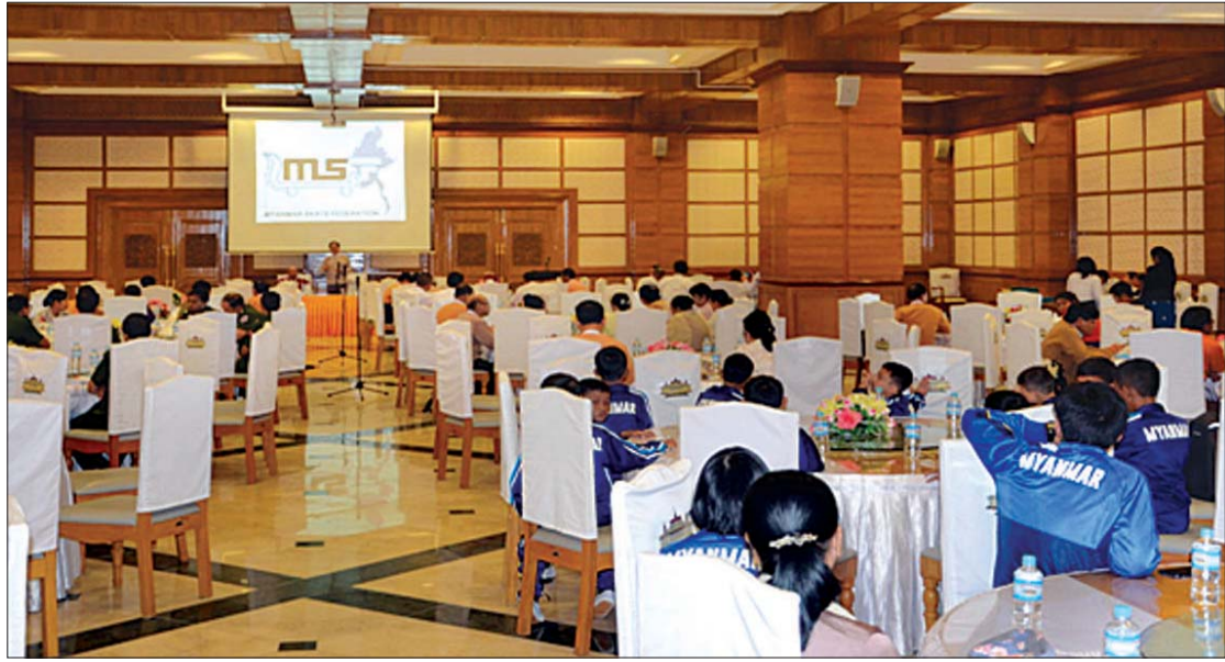
အမျိုးသားလွှတ်တော် ကျန်းမာရေး၊ အားကစားနှင့် ယဉ်ကျေးမှုဆိုင်ရာ ကော်မတီအဖွဲ့ဝင်များ အပြန်အလှန်ဆွေးနွေးကြစဉ်။

အဓိကကတော့ ကျွန်တော်တို့ နိုင်ငံက ဒီမိုကရေစီ ကူးပြောင်းစ နိုင်ငံတစ်ခုဖြစ်တဲ့အတွက် လိုအပ်ချက်တွေ ရှိနေသေးတယ်။ ဒါပေမယ့် လိုအပ်ချက်တွေထဲက ရုန်းကန်ကြိုးစားကြရမှာဖြစ်ပါတယ်။ ကျန်းမာရေးအတွက်ကတော့ သုံးနေကျ ကာကွယ်ခြင်းဟာ ကုသခြင်းထက် ပိုထိရောက်တယ်ဆိုတဲ့ စကားလို ကာကွယ်ရေးအတွက် အသိပညာပေးရမှာပါ။ အားကစားနဲ့ ပတ်သက်ပြီးတော့လည်း အားကစားသမားတွေကို မွေးထုတ်ပေးဖို့ လိုအပ်သလို သူတို့အတွက် ထိုက်တန်တဲ့ ထောက်ပံ့မှုလည်း ဆောင်ရွက်ပေးရမှာပါ။ ယဉ်ကျေးမှုနဲ့ ပတ်သက်ပြီးတော့လည်း ယဉ်ကျေးမှုအရ ကျွန်တော်တို့ နိုင်ငံမှာ တန်ဖိုးရှိတာတွေ အများကြီးရှိတဲ့အတွက် ဒါတွေကို ထိန်းသိမ်းရမှာပါ။ တစ်ဖက်ကလည်း ဒီယဉ်ကျေးမှုတွေကို နိုင်ငံတကာက သိရှိပြီး ခရီးသွားတွေ ဝင်ရောက်ဖို့ ဝင်ငွေရဖို့ကိုလည်း ဆောင်ရွက်ရမှာပါ။ ဒါတွေအတွက် ကျွန်တော်တို့ ကော်မတီကလည်း တစ်ဖက်တစ်လမ်းကနေ တတ်အားသမျှ ကြိုးပမ်းသွားမှာဖြစ်ပါတယ်။