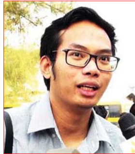
မောင်စည်သူထွန်း