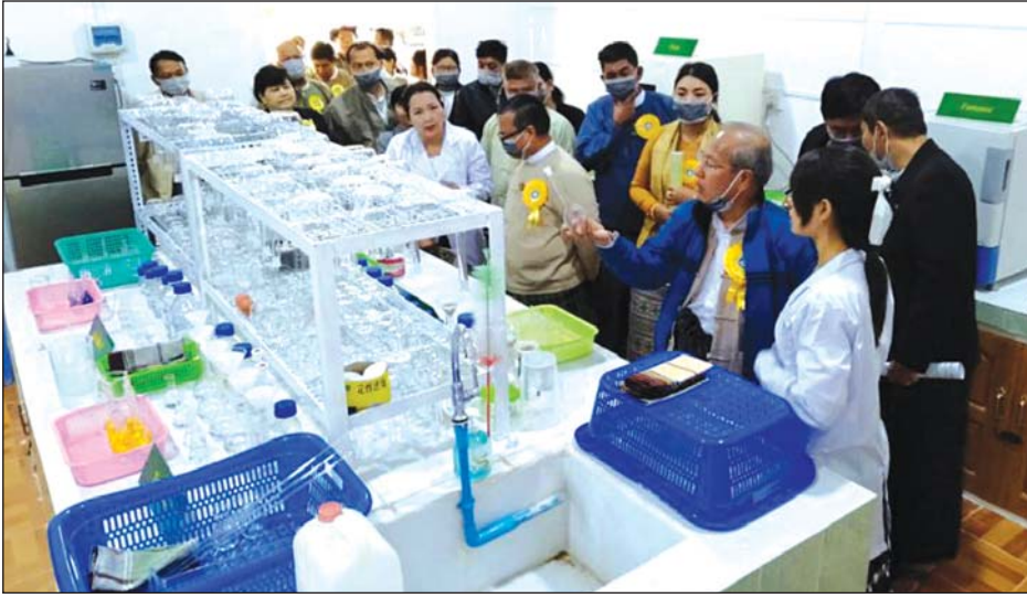
တိုင်းဒေသကြီးဝန်ကြီးချုပ် ဒေါက်တာအောင်မိုးညို ဓာတ်ခွဲခန်းအတွင်း ကြည့်ရှုစစ်ဆေးစဉ်။

မကွေးတိုင်းဒေသကြီး စိုက်ပျိုးရေး ဦးစီးဌာန၏ မြေဆီလွှာဓာတ်ခွဲခန်း (ပခုက္ကူ) ဖွင့်ပွဲအခမ်းအနားကို ဖေဖော်ဝါရီ ၁၇ ရက်က ပခုက္ကူမြို့ အမှတ်(၁၁) ရပ်ကွက်ရှိ ပါကြိတ်စက်ရုံဝင်းအတွင်း ဌာနချုပ်မှ မကွေးတိုင်းဒေသကြီး ဝန်ကြီးချုပ် ဒေါက်တာအောင်မိုးညိုနှင့် တာဝန်ရှိသူများ တက်ရောက် ဖွင့်လှစ် ပေးခဲ့သည်။