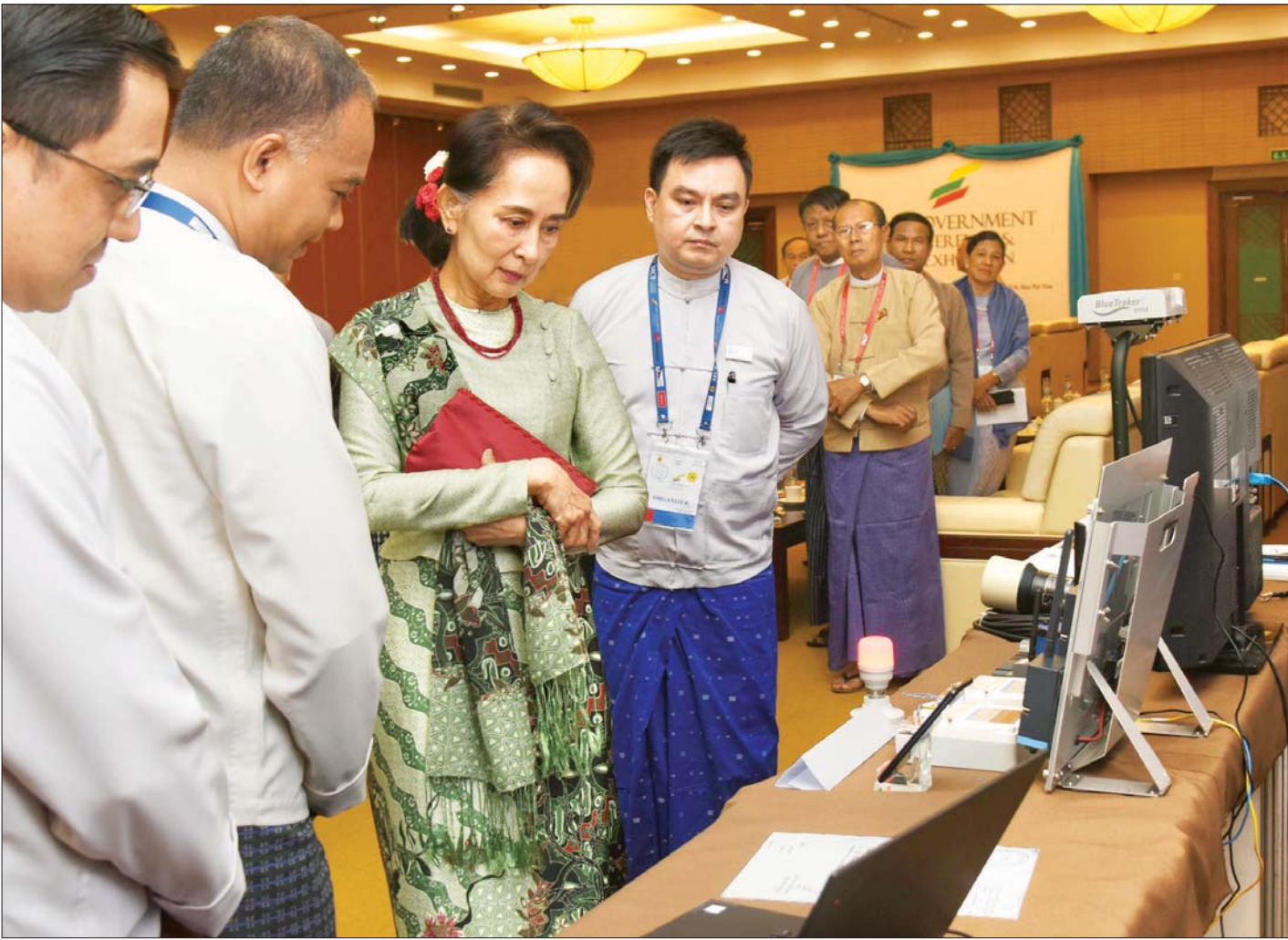
နိုင်ငံတော်၏အတိုင်ပင်ခံပုဂ္ဂိုလ် ဒေါ်အောင်ဆန်းစုကြည် ဝန်ကြီးဌာနများ၊ အသင်းချုပ်များနှင့် နည်းပညာကုမ္ပဏီများမှ ခင်းကျင်းပြသထားသည့် ပြခန်းများအား လှည့်လည်ကြည့်ရှုအားပေးစဉ်။

အကျိုးတရားများစွာကို ရည်ရွယ်ပြီး အကောင်အထည်ဖော် ဆောင်ရွက်နေတာ ဖြစ်ပါတယ်။ အစိုးရရဲ့ လုပ်ငန်း လုပ်ဆောင်မှုများ လွယ်ကူလျင်မြန်လာစေဖို့၊ လုပ်ငန်း များ ပိုမိုတွင်ကျယ်စေဖို့၊ ဆုံးဖြတ်ချက်များ မှန်မှန် ကန်ကန်နဲ့ မြန်မြန်ဆန်ဆန်ချနိုင်ဖို့၊ ဝန်ဆောင်မှုပေးရာမှာ တိုးတက်ကောင်းမွန်လာစေဖို့၊ ပြည်သူတွေရဲ့ လိုအပ်ချက် တွေကို ဖြည့်ဆည်းပေးရာမှာ ပွင့်လင်းမြင်သာမှုရှိစွာ၊ တုံ့ပြန်မှုအားကောင်းစွာနဲ့ လျင်မြန်စွာ ဖြည့်ဆည်း ဆောင်ရွက်ပေးနိုင်စေဖို့၊ ပြည်သူများရဲ့ လူမှုစီးပွားဘဝ တွေ ဖွံ့ဖြိုးလာစေဖို့ဖြစ်ပါတယ်။ e-Government ကို အကောင်အထည်ဖော်ခြင်းဖြင့် အစိုးရနဲ့ပြည်သူ့ အစိုးရနဲ့ စီးပွားရေးလုပ်ငန်းများ၊ အစိုးရဌာနအချင်းချင်း၊ အစိုးရနဲ့ နိုင်ငံ့ဝန်ထမ်းများအကြား ဝေးကွာမှုတွေ လျော့ကျလာပြီး အစိုးရဌာနများနဲ့ ဆက်ဆံဆောင်ရွက်တဲ့ ကိစ္စတွေ လွယ်ကူလျင်မြန်လာစေမှာဖြစ်ပါတယ်။