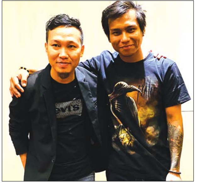
အစားစုံလင်စွာ ထည့်သွင်းထားကြောင်းနှင့် သီချင်းအကြောင်းအရာများတွင် လည်း အချစ်၊ အလွမ်း၊ ဒဿန၊ ဘဝအကြောင်းစသည်ဖြင့် မျိုးစုံပါဝင်ကြောင်း သိရသည်။ ကိုလင်း

အဆိုပါ သီချင်းခွေတွင် သီချင်း ၁၃ ပုဒ် ပါဝင်ပြီး တေးရေးဆရာ Nano Peace၊ သွန်းပူ၊ အောင်ရာ၊ တွမ်တွမ်၊ ပိုင်ထူး၊ ခင်ပီ၊ ဘိုင်းခမ်းနှင့် မြူးမြတ်အောင် တို့က ရေးသားထားကြကာ သီချင်းအမျိုးအစားအနေဖြင့် ရော့ဂီတ အမျိုး