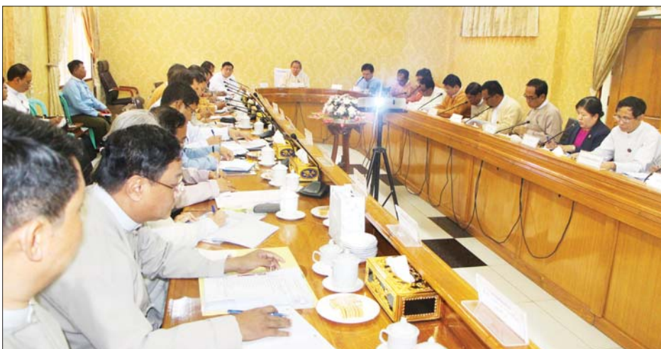
ပြည်ထောင်စုဝန်ကြီး ဦးစိုးဝင်း အခွန်အကောက်ဆိုင်ရာကိစ္စ၊ MSME ချေးငွေဆိုင်ရာကိစ္စနှင့် စပ်လျဉ်းသည့် လုပ်ငန်းညှိနှိုင်းအစည်းအဝေးတွင် အမှာစကားပြောကြားစဉ်။

ရှေးဦးစွာ ပြည်ထောင်စုဝန်ကြီး ဦးစိုးဝင်းက နိုင်ငံတော်၏အတိုင်ပင်ခံပုဂ္ဂိုလ်က ပြည်ပရောက်မြန်မာ အလုပ်သမားများအား မြန်မာနိုင်ငံသို့ ပြန်လည်ခေါ်ဆောင်နိုင်ရေးနှင့် မိမိနိုင်ငံတွင် အလုပ်အကိုင်အခွင့်အလမ်းများ ရရှိရေးအတွက် အသေးစား၊ အငယ်စားနှင့် အလတ်စားစီးပွားရေးလုပ်ငန်းများ (Micro, Small and Medium Enterprises - MSME) ဖွံ့ဖြိုးတိုးတက်အောင် ဆောင်ရွက်ရန် လမ်းညွှန်မှုပြုခဲ့ကြောင်း၊ ယခုအခါ MSME လုပ်ငန်းများ ဖွံ့ဖြိုးတိုးတက်စေရေးအတွက် လိုအပ်သည့် ဘဏ္ဍာငွေကြေးများရရှိနိုင်ရန် မြန်မာ့စီးပွားရေးဘဏ်၊ မြန်မာ့လယ်ယာဖွံ့ဖြိုးရေးဘဏ်နှင့် ပုဂ္ဂလိကဘဏ်များက MSME ချေးငွေများ ထုတ်ချေးပေး