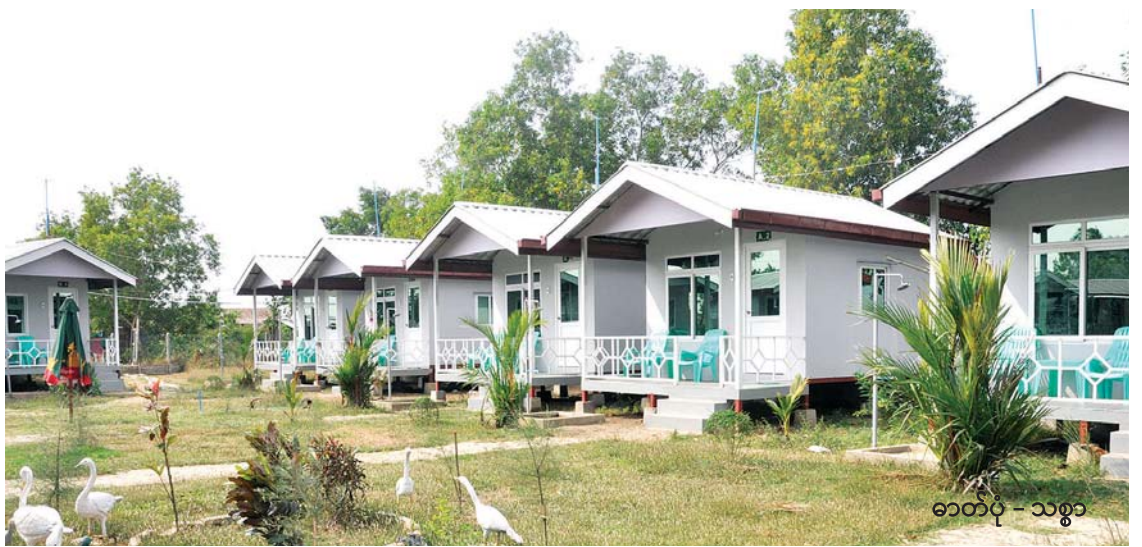
ဓာတ်ပုံ - သဏ္ဍာ