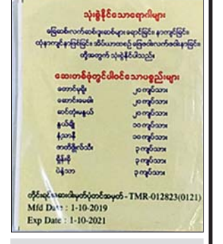
Paracetamol၊ Diclofenac ရောနှောသည့် ဆေးထုပ်နမူနာ