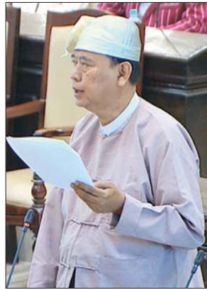
ဒုတိယဝန်ကြီး ဦးစိုးမော်ထွန်း