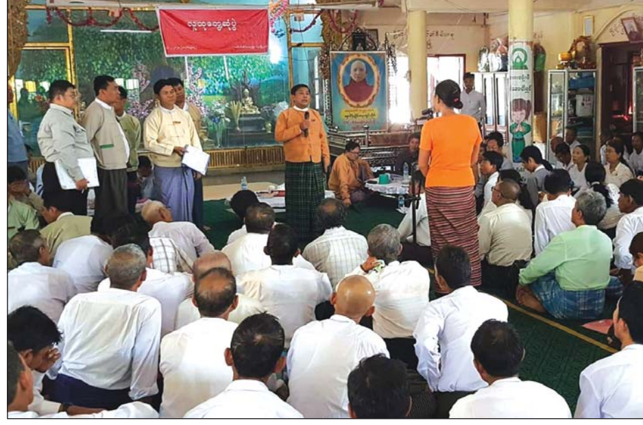
တိုင်းဒေသကြီးဝန်ကြီးချုပ် ဦးဝင်းသိန်းနှင့် ကျေးရွာနေပြည်သူများ တွေ့ဆုံဆွေးနွေးစဉ်