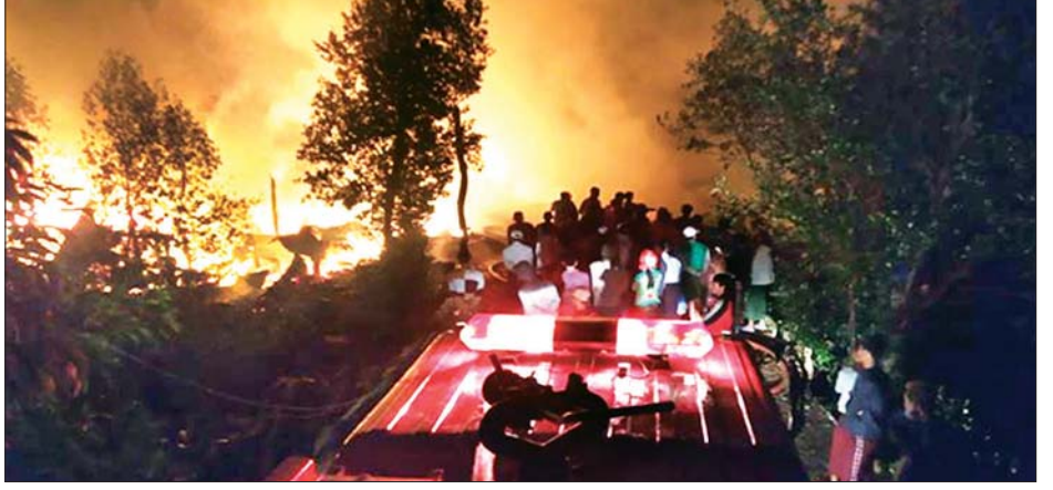
ဟိုင်းကြီးကျွန်းမြို့ အမှတ်(၃)ရပ်ကွက်ရှိ အလုပ်ရုံတစ်ခုနှင့် ဂိုဒေါင်တစ်လုံး မီးလောင်မှုဖြစ်ပွားရာသို့ မီးသတ်တပ်ဖွဲ့ဝင်များ သွားရောက်ငြိမ်းသတ်ကြစဉ်။