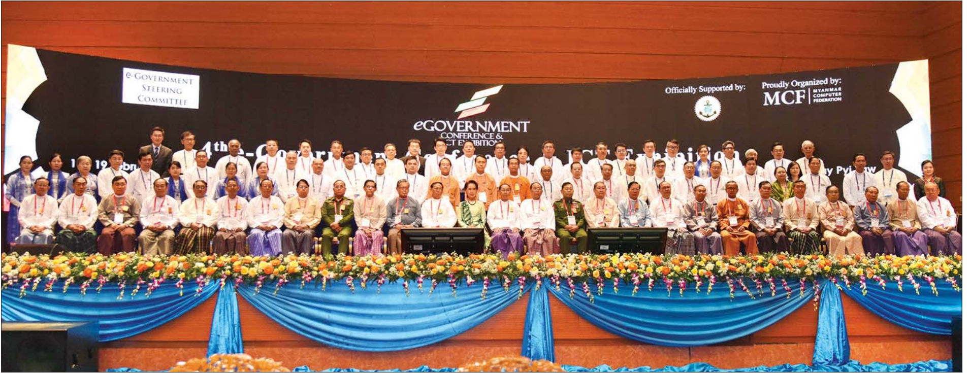
နိုင်ငံတော်၏အတိုင်ပင်ခံပုဂ္ဂိုလ် ဒေါ်အောင်ဆန်းစုကြည်၊ ဒုတိယသမ္မတ ဦးမြင့်ဆွေ၊ နိုင်ငံတော်ဖွဲ့စည်းပုံအခြေခံဥပဒေဆိုင်ရာ ခုံရုံးဥက္ကဋ္ဌ ဦးမျိုးညွန့်၊ ပြည်ထောင်စုရွေးကောက်ပွဲကော်မရှင်ဥက္ကဋ္ဌ ဦးလှသိန်း၊ ပြည်ထောင်စုအဆင့် ပုဂ္ဂိုလ်များ အခမ်းအနားသို့ တက်ရောက်လာကြသူများနှင့်အတူ စုပေါင်းမှတ်တမ်းတင် ဓာတ်ပုံရိုက်စဉ်။