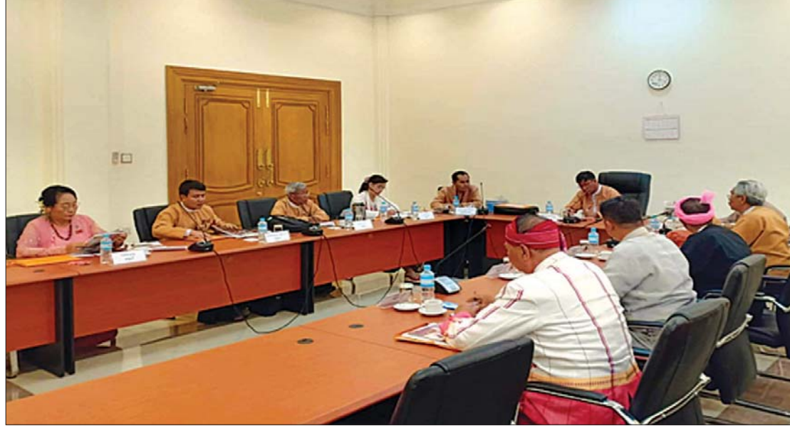
အမျိုးသားလွှတ်တော် ကျန်းမာရေး၊ အားကစားနှင့် ယဉ်ကျေးမှုဆိုင်ရာ ကော်မတီ ညှိနှိုင်းအစည်းအဝေး ကျင်းပစဉ်။