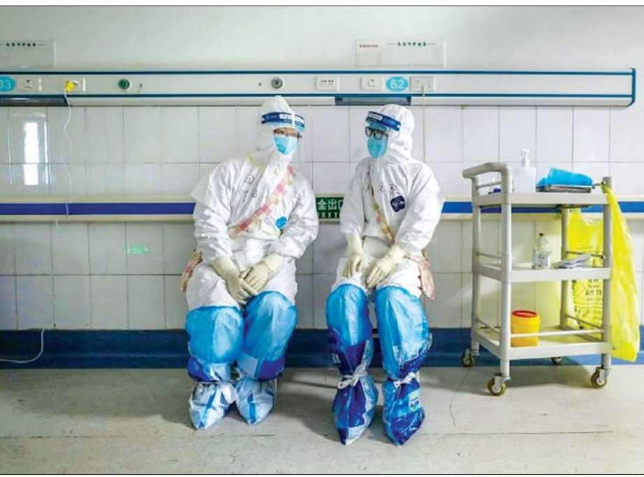
အကာအကွယ်ဝတ်စုံများ ဝတ်ဆင်ထားသည့် ဆေးဝန်ထမ်းနှစ်ဦးကို တွေ့ရစဉ်။

ချိန်တွင် အမေရိကန်မှ ဆေးဝါးနှင့် ဆေးပစ္စည်းတင်ပို့ကုန်များအပေါ် တရုတ်နိုင်ငံက အခွန်လျှော့ကောက် မည်ဖြစ်ကြောင်း တရုတ်အစိုးရက ဖေဖော်ဝါရီ ၁၈ ရက်တွင် ပြောကြား လိုက်သည်။ အခွန်လျှော့ချမှုသည် လာမည့် မတ် ၂ ရက်တွင် စတင်အသက်ဝင်