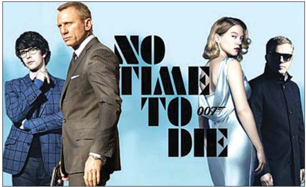
ဂျိမ်းစ်ဘွန်းဇာတ်ကားပုံစာကို တွေ့ရစဉ်။

ကိုရိုနာဗိုင်းရပ်စ်ဖြစ်ပွားမှုကြောင့် တရုတ်နိုင်ငံရဲ့ ဖျော်ဖြေရေးလုပ်ငန်းကို ထိခိုက်နှစ်နာစေပါတယ်။ ရုပ်ရှင်ရုံပေါင်း ၇၀၀၀ ကိုလည်း ပိတ်ထားရပါတယ်။ ဒါ့အပြင် ရှန်ဟိုင်းမှာရှိတဲ့ ဒီဇိုင်းလုပ်ငန်းလည်း သွားရောက်လည်ပတ်လို့ မရပါဘူး။ ရုပ်ရှင်ရုံတွေ ပိတ်ထားတဲ့အတွက် No Time To Die ရုပ်ရှင် မိတ်ဆက် ခရီးစဉ်ကို ရွှေ့ဆိုင်းလိုက်ရတာပဲဖြစ်တယ်လို့ သည်တိုင်းမိစ်မှာ ဖော်ပြထားပါ တယ်။ ရုပ်ရှင်အဖွဲ့သားတွေကတော့ ရုပ်ရှင်ရုံတွေ ပြန်လည်ဖွင့်လှစ်ဖို့ မျှော်လင့် ထားပေမယ့် လက်တွေ့မှာတော့ မလွယ်သေးပါဘူး။ စာရင်ရန်ဒေါ့ကွန်း