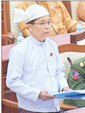
ဒုတိယဝန်ကြီး ဦးမြင့်ကြိုင်

အစည်းအဝေးတွင် မြဝတီမဲဆန္ဒနယ်မှ ဦးစိန်ဗိုလ်၏ မြန်မာနိုင်ငံအတွင်း ကျူးကျော်မှုများအဖြစ် သတ်မှတ်ခံရသော နိုင်ငံသားမိသားစုများအား အိမ်ထောင်စုစာရင်းထုတ်ပေးနိုင်ခြင်းရှိမရှိနှင့်မရှိပါကကျူးကျော်အဖြစ်သတ်မှတ်ခံရသော မြန်မာနိုင်ငံသားမိသားစုများအား အိမ်ထောင်စုစာရင်းထုတ်ပေးနိုင်ရေး မည်သို့စိစစ်ဆောင်ရွက်ထားသည်ကို သိလိုခြင်းမေးခွန်းနှင့် စပ်လျဉ်း၍ အလုပ်သမား၊ လူဝင်မှုကြီးကြပ်ရေးနှင့် ပြည်သူ့အင်အားဝန်ကြီးဌာန ဒုတိယဝန်ကြီး ဦးမြင့်ကြိုင်က မြန်မာနိုင်ငံအတွင်း အစိုးရဌာနပိုင်မြေ၊ သစ်တောကြီးပိုင်းမြေ၊ စည်ပင်ပိုင်မြေ၊ အဖွဲ့အစည်းပိုင်မြေ၊ ကုမ္ပဏီပိုင်မြေ၊ သာသနာ့နယ်မြေ၊ ပုဂ္ဂလိကပိုင်မြေ၊ မြေကုကျွန်း၊ မီးရထားလမ်းဘေး၊ ကားလမ်းဘေး စသည့်နေရာများနှင့် အုပ်ချုပ်ရေးအဖွဲ့အစည်းများက ခွင့်ပြုချက်မရှိသော မြေနေရာများတွင် ခွင့်ပြုချက်မရှိဘဲ ဝင်ရောက်နေထိုင်လျက်ရှိသော ယာယီရွှေ့ပြောင်းနေထိုင်သူများသည် ကျူးကျော်ဝင်ရောက်နေထိုင်သူများဖြစ်သောကြောင့် တည်ဆဲဥပဒေ၊ လုပ်ထုံးလုပ်နည်းများဖြင့် ညီညွတ်မှုမရှိပါသဖြင့် အိမ်ထောင်စုစာရင်းဆောင်ရွက်ပေး၍ မရပါကြောင်း၊ ယာယီရွှေ့ပြောင်းနေထိုင်သည့် ကျူးကျော်နေထိုင်သူများအနေဖြင့် နိုင်ငံတော်မှ ဥပဒေပြဋ္ဌာန်းချက်များ၊ လုပ်ထုံးလုပ်နည်း၊ ညွှန်ကြားချက်များနှင့်အညီ အကျိုးဝင်သည့်နေရာတွင် အခြေချနေထိုင်ခြင်းဖြင့် မိမိဝန်ကြီးဌာနမှ တည်ဆဲဥပဒေ၊ လုပ်ထုံးလုပ်နည်းများနှင့်အညီစိစစ်ထုတ်ပေးလျက်ရှိသော အိမ်ထောင်စုစာရင်းနှင့် နိုင်ငံသားစိစစ်ရေးကော်မရှင်၊ ကိုင်ဆောင်သင့်သည့် မှတ်ပုံတင်တစ်မျိုးမျိုးရရှိရေးအတွက် စိစစ်ဆောင်ရွက်ပေးနိုင်မည်ဖြစ်ကြောင်း ရှင်းလင်းဖြေကြားသည်။