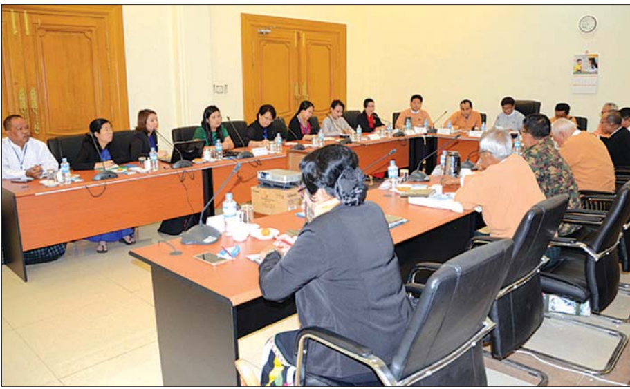
အမျိုးသားလွှတ်တော် ကျန်းမာရေး၊ အားကစားနှင့် ယဉ်ကျေးမှုဆိုင်ရာကော်မတီ ပြည်တွင်းအဖွဲ့အစည်းများနှင့် တွေ့ဆုံဆွေးနွေးစဉ်။