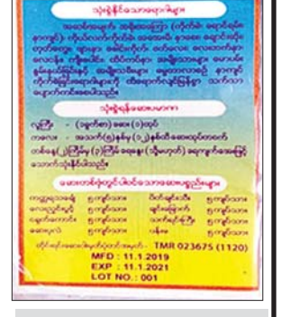
Paracetamol၊ Mefenamic acid၊ Diclofenac ရောနှောသည့် ဆေးထုပ်နမူနာ