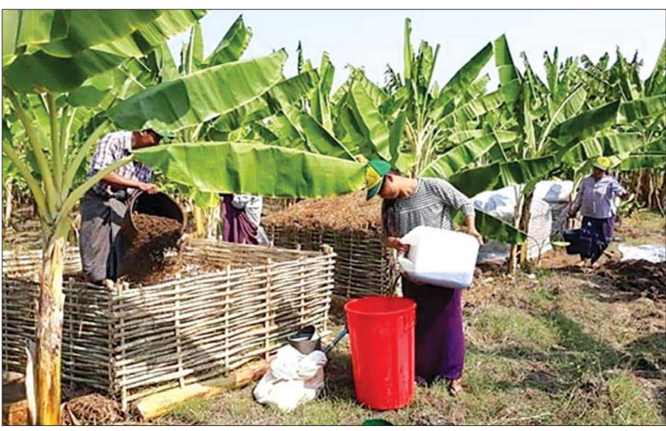
ငှက်ပျောစိုက်ခင်းအတွင်း မြေဆီ မြေဆွေးများ ထည့်သွင်းနေစဉ်။

ပွင့်ဖြူ ဖေဖော်ဝါရီ ၁၆ မကွေးတိုင်းဒေသကြီး ပွင့်ဖြူမြို့နယ် မုန်းချောင်းတစ်လျှောက်ရှိ ကျေးရွာ များတွင် ငှက်ပျောစိုက်တောင်သူ များမှာ ယခုလပိုင်းတွင် ငှက်ပျော သီးများ ဈေးကောင်းရနေသဖြင့် ငှက်ပျောဥယျာဉ်ခြံလုပ်ငန်းကို ပိုမို တိုးချဲ့ကာ စိုက်ပျိုးလာကြကြောင်း ငှက်ပျောစိုက်တောင်သူများထံမှ သိရ သည်။