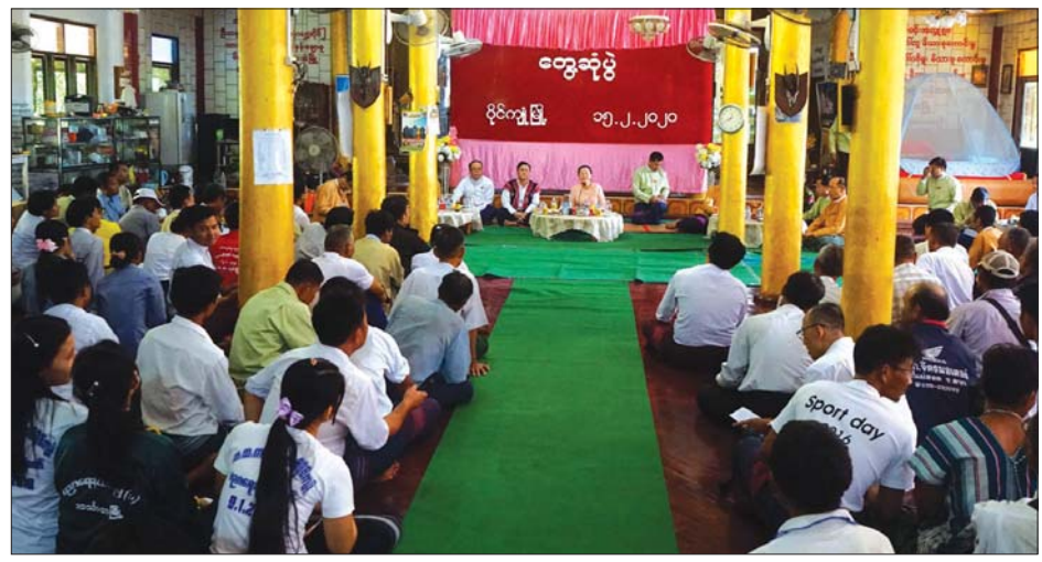
ကရင်ပြည်နယ်ဝန်ကြီးချုပ် ဒေါ်နန်းခင်ထွေးမြင့် ပိုင်ကျုံမြို့ရှိ ဒေသခံများနှင့် တွေ့ဆုံစဉ်။

ရှင်းလင်းတင်ပြကာ ကျောင်းဆောင်သစ်ကို ပညာရေးဌာနသို့ လွှဲပြောင်းပေးအပ်သည်။ ထို့နောက် ဒေသခံပြည်သူများက မိမိဒေသဖွံ့ဖြိုး တိုးတက်ရေးအတွက် တင်ပြဆောင်ရွက် စေခဲ့လိုအပ်သည့်နေရာအတွက် ဆောင်ရွက်ပေးရန်၊ ကျောင်းအတွက် လိုအပ်ချက်များကို တင်ပြဆောင်ရွက်ခဲ့ရာ များအပေါ် အကောင်အထည်ဖော်ဆောင်ရွက်ပေးနိုင်မည့် အခြေအနေများအား ရှင်းလင်းဖြေကြားသည်။ ယင်းနောက် ကျောင်းဆောင်သစ်ကို ပြည်နယ်ဝန်ကြီးချုပ်နှင့် တာဝန်ရှိသူများက ဖဲကြိုးဖြတ် ဖွင့်လှစ်ပေးပြီး ကျောင်းဆောင်သစ်ကို လှည့် လည်ကြည့်ရှုခဲ့ကြောင်း သိရသည်။ ကိုစိုင်း (လွိုင်ကော်)