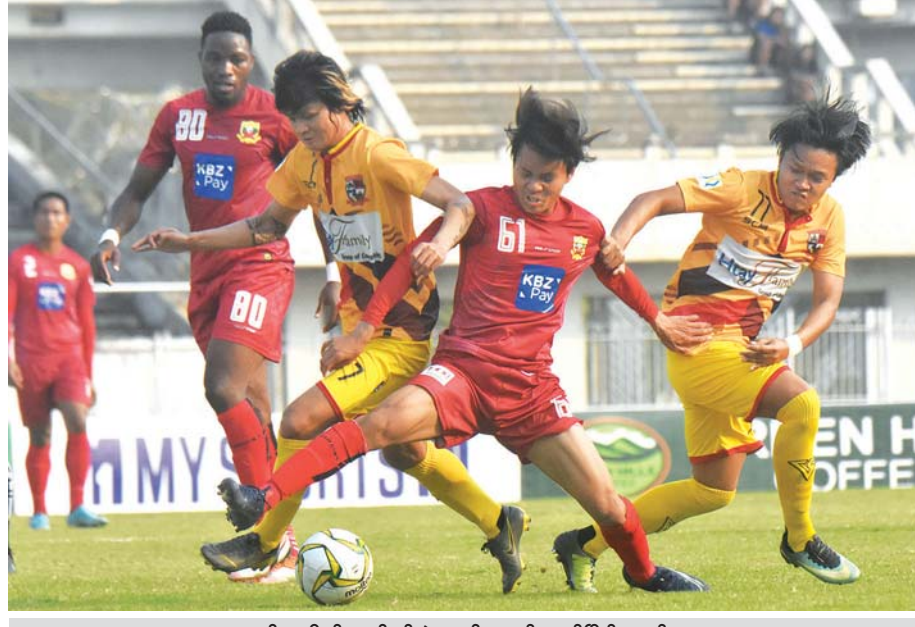
ရှမ်းယူနိုက်တက်နှင့် ဇွဲကပင်အသင်း ယှဉ်ပြိုင်နေစဉ်။

ရန်ကုန် ဖေဖော်ဝါရီ ၁၆ ၂၀၂၀ ရာသီ MNL အမှတ်ပေးပြိုင်ပွဲ ပွဲစဉ် (၆) ဒုတိယနေ့ကို ယနေ့ ညနေပိုင်းက ဆက်လက်ကျင်းပရာ လက်ရှိချန်ပီယံ ရှမ်းယူနိုက်တက်အသင်း နောက်ကျရုံးဖြင့် နိုင်ပွဲဆက်ခဲ့သည်။ သုဝဏ္ဏကွင်း၌ ကျင်းပသည့် ပွဲတွင် လက်ရှိချန်ပီယံ ရှမ်းယူနိုက်တက်အသင်းက ဇွဲကပင်အသင်းကို တစ်ဂိုး-ဂိုးမရှိဖြင့် အနိုင်ရခဲ့သည်။ လက်ရှိချန်ပီယံ ရှမ်းယူနိုက်တက်အသင်းသည် နိုင်ပွဲဆက်ပြီး အမှတ်ပေးဇယား အဆင့် (၄) နေရာအထိ တက်လှမ်းနိုင်ခဲ့သော်လည်း ဇွဲကပင်ကို အနိုင်ရရန် ရုန်းကန်ခဲ့ရသည်။ ရှမ်းယူနိုက်တက်အသင်း၏ ကစားပုံမှာ အကောင်းဆုံးအနေအထား မရှိသေးသလို ဒဏ်ရာရနေသည့် အဓိက