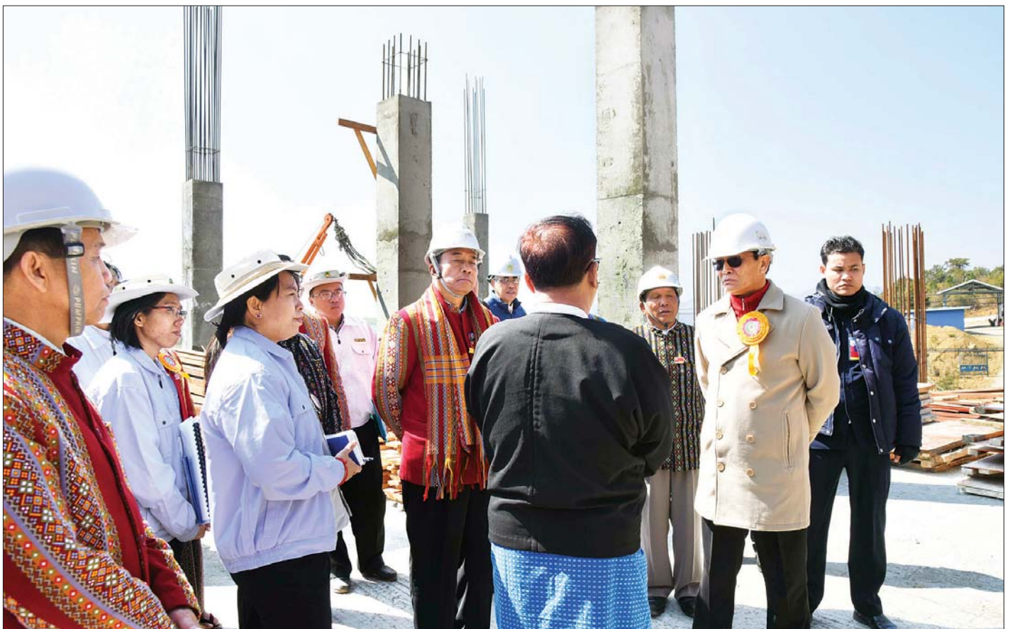
ဒုတိယသမ္မတ ဦးဟင်နရီဗန်ထီးယူ ချင်းပြည်နယ်တရားလွှတ်တော်ရုံး RC ကွန်ကရစ်သုံးထပ်ဆောင် တည်ဆောက်နေမှုကို ကြည့်ရှုစစ်ဆေးစဉ်။

ထို့နောက် ဒုတိယသမ္မတ ဦးဟင်နရီဗန်ထီးယူ ပြည်ထောင်စုဝန်ကြီး ဒေါက်တာ မျိုးသိမ်းကြီးနှင့်