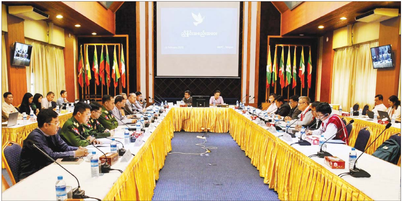
JICM အစည်းအဝေးဆုံးဖြတ်ချက် အမှတ်(၁) အကောင်အထည်ဖော်နိုင်ရန် အစိုးရနှင့် NCA လက်မှတ်ရေးထိုးထားသည့် တိုင်းရင်းသားလက်နက်ကိုင်အဖွဲ့အစည်းများ (NCA-S EAO)၏ နှစ်ဖက်အလုပ်အဖွဲ့ ညှိနှိုင်းအစည်းအဝေးကျင်းပစဉ်။

ရန်ကုန် ဖေဖော်ဝါရီ ၁၆ (၈) ကြိမ်မြောက် တစ်နိုင်ငံလုံး ပစ်ခတ်တိုက်ခိုက်မှု ရပ်စဲရေး သဘောတူစာချုပ် အကောင်အထည်ဖော်မှုဆိုင်ရာ ညှိနှိုင်းအစည်းအဝေး (JICM) အစည်းအဝေးဆုံးဖြတ်ချက် အမှတ်(၁) အကောင်အထည်ဖော်နိုင်ရန် အစိုးရနှင့် NCA လက်မှတ်ရေးထိုးထားသည့် တိုင်းရင်းသားလက်နက်ကိုင် အဖွဲ့အစည်းများ (NCA-S EAO) ၏ နှစ်ဖက်အလုပ်အဖွဲ့ ညှိနှိုင်းအစည်းအဝေးကို ယနေ့ နံနက် ၁၀ နာရီတွင် ရန်ကုန်မြို့ ရွှေလီလမ်းရှိ အမျိုးသားပြန်လည်သင့်မြတ်ရေးနှင့် ငြိမ်းချမ်းရေးဗဟိုဌာန (NRPC) ၌ ကျင်းပသည်။ ယနေ့ ကျင်းပသည့် အစည်းအဝေးသို့ အစိုးရကိုယ်စားလှယ်များ အဖြစ် အမျိုးသားပြန်လည်သင့်မြတ်ရေးနှင့် ငြိမ်းချမ်းရေးဗဟိုဌာန ဒုတိယဥက္ကဋ္ဌ ပြည်ထောင်စုရှေ့နေချုပ် ဦးထွန်းထွန်းဦး၊ ကာကွယ်ရေးဦးစီးချုပ်ရုံး (ကြည်း) မှ ဒုတိယဗိုလ်ချုပ်ကြီး ရာပြည့်၊ စာမျက်နှာ ၇ ကော်လံ ၁ *