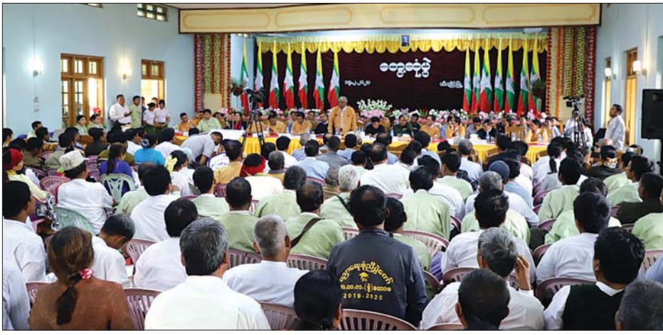
စစ်ကိုင်းတိုင်းဒေသကြီးဝန်ကြီးချုပ် ဒေါက်တာမြင့်နိုင် ထီးချိုင့်မြို့နယ်ရှိ ဒေသခံပြည်သူများနှင့် တွေ့ဆုံစဉ်။

မုံရွာ ဖေဖော်ဝါရီ ၁၆ စစ်ကိုင်းတိုင်းဒေသကြီး ဝန်ကြီးချုပ် ဒေါက်တာမြင့်နိုင်နှင့် တိုင်းဒေသကြီး လွှတ်တော် ဥက္ကဋ္ဌ၊ တိုင်းဒေသကြီး ဝန်ကြီးများနှင့် ဌာနဆိုင်ရာ တာဝန်ရှိသူများသည် ဒေသခံပြည်သူများနှင့် တွေ့ဆုံပွဲကို ယမန်နေ့က ကသာမြို့နယ် ရပ်ကွက် (၅) ရှိ မြို့တော်ခန်းမ၌ လည်းကောင်း၊ ထီးချိုင့်မြို့နယ် အမှတ်(၁)ရပ်ကွက်ရှိ ရွှေပြည်သာ ခန်းမ၌ လည်းကောင်း ပြုလုပ်သည်။