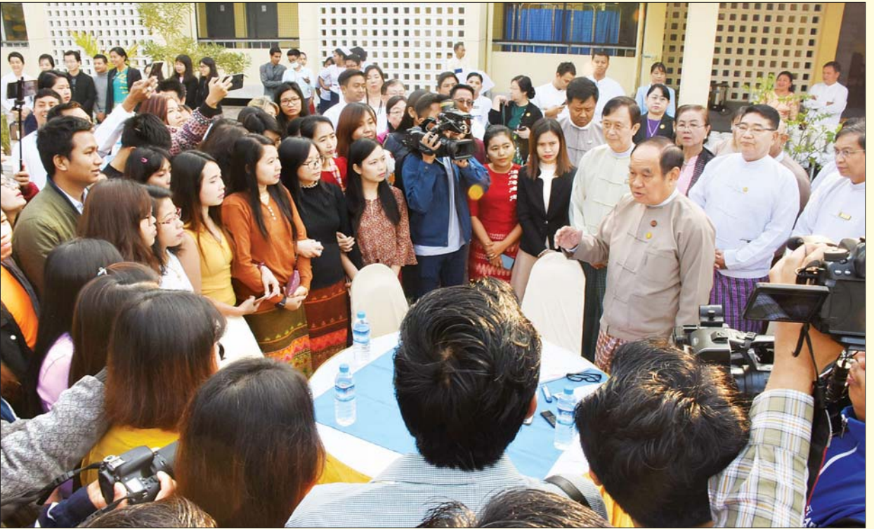
ပြည်ထောင်စုဝန်ကြီး ဒေါက်တာမြင့်ထွေး နေအိမ်အသီးသီးသို့ပြန်မည့် ဝူဟန်မြို့မှ အထူးလေယာဉ်ဖြင့် ပြန်လည်ခေါ်ဆောင်ခဲ့သည့် ကျောင်းသား ကျောင်းသူများအား တွေ့ဆုံနှုတ်ဆက်စဉ်။

လိုက်နာ ဆောင်ရွက်ရောဂါ စောင့်ကြည့်ကြည့်ရှုမှု