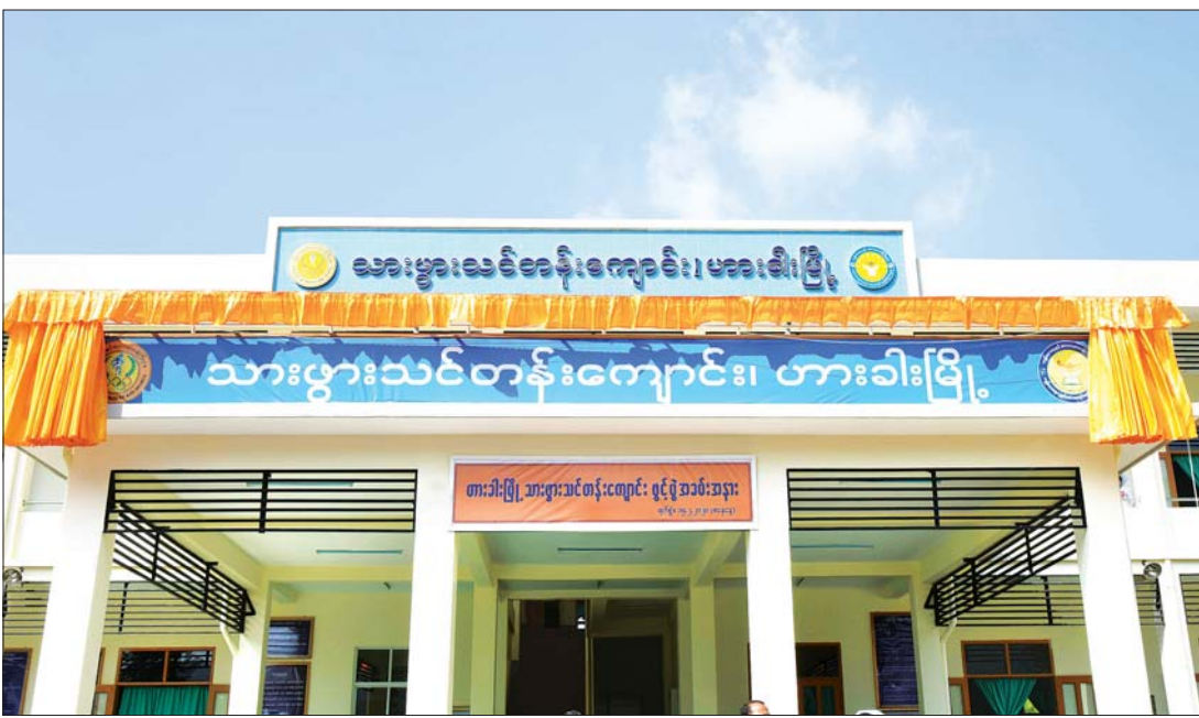
နေပြည်တော် ဖေဖော်ဝါရီ ၁၆

ချင်းပြည်နယ် ထန်တလန်မြို့တွင် ရောက်ရှိနေသည့် ဒုတိယသမ္မတ ဦးဟင်နရီဗန်ထီးယူသည် ပြည်ထောင်စုဝန်ကြီး ဒေါက်တာမျိုးသိမ်းကြီးနှင့် ဦးအုန်းမောင်၊ ချင်းပြည်နယ်ဝန်ကြီးချုပ် ဆလိုင်း လျန်လွယ်၊ ပြည်နယ်လွှတ်တော်ဥက္ကဋ္ဌ ဦးစိုဘွဲ့၊ ဒုတိယဝန်ကြီး ဗိုလ်ချုပ်သန်းထွဋ်၊ ဦးကျော်မျိုးနှင့် ဦးမြင့်ကြိုင်၊ ပြည်နယ်ဝန်ကြီးများ၊ တာဝန်ရှိသူများနှင့်အတူ ယမန်နေ့နံနက်ပိုင်းက ထန်တလန်မြို့မှ မော်တော်ယာဉ်များဖြင့် ထွက်ခွာခဲ့ကြပြီး ဟားခါးမြို့သို့ ရောက်ရှိရာ ပြည်နယ်ဝန်ကြီးများ၊ ဌာန ဆိုင်ရာ တာဝန်ရှိသူများနှင့် ဒေသခံယဉ်ကျေးမှုအဖွဲ့မှ တိုင်းရင်းသား၊ တိုင်းရင်းသူများ၊ ဒေသခံပြည်သူ များက ကြိုဆိုနှုတ်ဆက်ကြသည်။