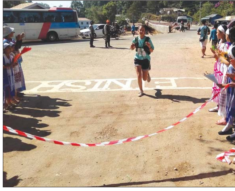
ပန်းဝင်လာသော နိုင်ငံခြားသူ အပြေးသမားတစ်ဦး