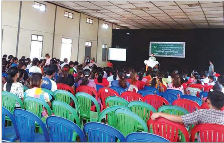
ဗိုင်းရပ်စ်ရောဂါအကြောင်း အသိပညာပေး ခေါ်သဘောပေး အခြေခံကျူဒိုပညာသင်တန်းနှင့် ပတ်သက်၍ ရှင်းလင်းပြောကြားကာ သရုပ်ပြ ဖော်ပြာသည်။ ထို့နောက် ရေမြို့နယ် အားကစားနှင့် ခြင်းများ ပြုလုပ်ခဲ့ကြောင်း သိရသည်။

ရေမြို့နယ် လမိုင်းမြို့တွင် အခြေခံ ပညာအထက်တန်းကျောင်း ၂၀၁၉-၂၀၂၀ ပညာသင်နှစ်မြို့နယ်အားကစား နှင့် ကာယပညာဦးစီးဌာနနှင့် ပညာရေးဌာနတို့ ပူးပေါင်းဖွင့်လှစ်သော အခြေခံကျူဒိုပညာသင်တန်း ဖွင့်ပွဲအခမ်းအနားကို ယမန်နေ့က လမိုင်းမြို့ အထွေထွေအုပ်ချုပ်ရေး ဦးစီးဌာန မုန့်ပါလခန်းမ၌ ကျင်းပ သည်။