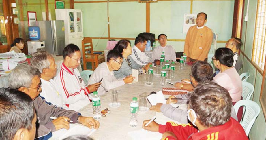
လွှတ်တော်ကိုယ်စားလှယ်များ၊ ဌာနဆိုင်ရာများ၊ ကိုယ်ပိုင်ကျောင်းများမှ တာဝန်ရှိသူများ တွေ့ဆုံဆွေးနွေးကြစဉ်။

ကျောက်ပန်းတောင်းမြို့ ကျောက်ပန်းတောင်း-ရေနံချောင်း လမ်းအထွက် ပိန္နဲတောကျေးရွာအနီးရှိ ကိုယ်ပိုင် အထက်တန်းကျောင်း တစ်ကျောင်းတွင် ဖေဖော်ဝါရီ ၁၄ ရက် က ကျောင်းသားအချို့ဖျားနာသည် ဟုဆိုကာ မြို့နယ်ပြည်သူ့ဆေးရုံကြီးသို့ ဆေးကုသမှုခံယူရန် သွားရောက်ခဲ့ကြသည်။ မြို့နယ်ဆရာဝန်ကြီး၏ လမ်းညွှန်မှုဖြင့် အခြားကျောင်းသားများ စစ်ဆေးလိုပါက တစ်ပါတည်း လာရောက်စစ်ဆေးမှု ခံယူနိုင်ကြောင်း ပြော၍ ကျောင်းရှိ ကျောင်းသား ကျောင်းသူ ၆၁ ဦးတို့ မိမိတို့ ဆန္ဒအရ စစ်ဆေးမှုခံယူခဲ့ကြောင်း သိရသည်။ ဤကဲ့သို့ မြို့နယ်ပြည်သူ့ဆေးရုံတွင် ကျောင်းသားများ စစ်ဆေးမှုခံယူသည်ကို လူအချို့က ကိုယ်ပိုင် ကျောင်းတစ်ကျောင်းတွင်