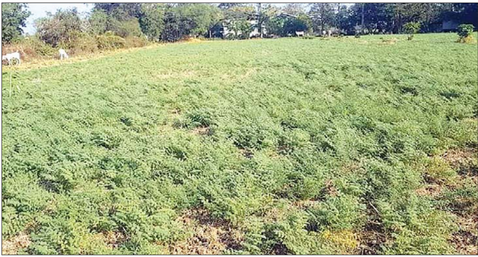
ကုလားပဲစိုက်ခင်း။

မန္တလေး ဖေဖော်ဝါရီ ၁၆ ဆောင်းသီးနှံအဖြစ် ဇန်နဝါရီလကုန် ပိုင်းမှ စတင်ထွက်ရှိလာသည့် ကုလား ပဲအုပ်စုဝင် V2၊ V7၊ 929 နှင့် တရုတ် (တိုင်ပေ) ကုလားပဲများ ယခုရက်ပိုင်း အတွင်း မန္တလေးဈေးကွက်သို့ လှိုင်လှိုင်ဝင်ရောက်ကာ အရောင်း သွက်လျက်ရှိကြောင်း မန္တလေး ပဲကုန်သည်များထံမှ သိရသည်။