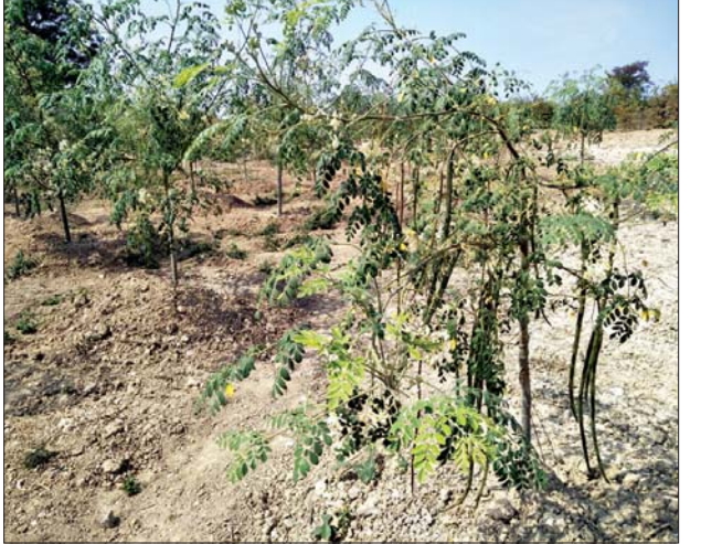
အိန္ဒိယဒန်သလွန်ပင်များ စိုက်ပျိုးထားစဉ်။