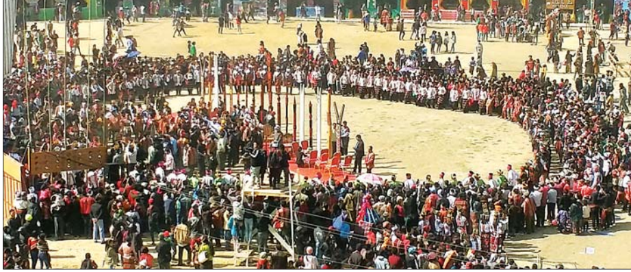
၂၀၁၉ ခုနှစ်က ဟားခါးမြို့၌ ကျင်းပခဲ့သည့် (၇၁)နှစ်မြောက် ချင်းအမျိုးသားနေ့အခမ်းအနားကို တွေ့ရစဉ်။

ချင်းအမျိုးသားနေ့ အခမ်းအနား ကို ချင်းတိုင်းရင်းသားတို့၏ ရိုးရာ ယဉ်ကျေးမှု ဓလေ့ထုံးတမ်းများ၊ ရိုးရာ ယဉ်ကျေးမှုအမွေအနှစ်များ မပျောက် ပျက်စေရေးအတွက် ရည်ရွယ်လျက် ဓလေ့ထုံးတမ်းစဉ်လာများနှင့်အညီ နှစ်စဉ်ကျင်းပလျက်ရှိရာ အစိုးရသစ် လက်ထက်တွင် ၂၀၁၇ ခုနှစ် (၆၉)နှစ် မြောက် ချင်းအမျိုးသားနေ့အခမ်း အနားကို ဖလမ်းမြို့၌လည်းကောင်း၊ ၂၀၁၈ ခုနှစ် နှစ်(၇၀)ပြည့်နှင့် ၂၀၁၉ ခုနှစ် (၇၁)နှစ်မြောက် ချင်းအမျိုးသား နေ့အခမ်းအနားကို ဟားခါးမြို့၌ လည်းကောင်း ကျင်းပခဲ့ပြီးဖြစ်ပါ သည်။ လာမည့် ဖေဖော်ဝါရီ ၂၀ ရက် တွင် ထန်တလန်မြို့၌ ကျင်းပမည့် ချင်းအမျိုးသားနေ့သည် အစိုးရသစ်