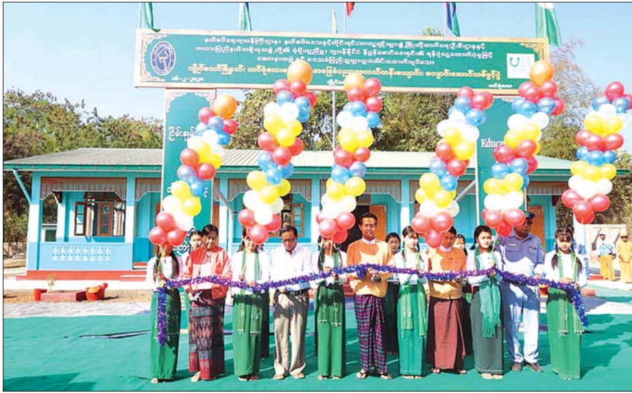
ကယားပြည်နယ်ဝန်ကြီးချုပ် ဦးအယ်လ်ဖောင်းရှိနှင့် တာဝန်ရှိသူများ ကျောင်းဆောင်သစ်ကို ဖွင့်လှစ်ပေးစဉ်။

ဆက်ကပ်လှူဒါန်းကာ ဒေသခံပြည်သူများနှင့်တွေ့ဆုံခဲ့သည်။ ထိုသို့ တွေ့ဆုံပွဲတွင် ပြည်နယ် ဝန်ကြီးချုပ်က မိမိတို့ဒေသဖွံ့ဖြိုးတိုးတက်ရေးအတွက် လိုအပ်သည်များကို ဆွေးနွေးတင်ပြကြရန် ပြောကြားသည်။ အုပ်ချုပ်ရေးမှူးများနှင့် ဒေသခံ ပြည်သူများက လျှပ်စစ်ဓါတ်ရရှိရေး၊ ကျေးရွာချင်းဆက်လမ်း၊ မိုးခိုင်းကြီး ချောင်းကူးတံတား၊ ရေဘေးရောင် အဆောက်အအုံ၊ ပညာရေးဝန်ထမ်း နေအိမ်၊ ကျောင်းဆောင်သစ် အစရှိသည့် ပညာရေး၊ ကျန်းမာရေး၊ လမ်းပန်း ဆက်သွယ်ရေး လိုအပ်ချက်များကို ဆွေးနွေးတင်ပြကြရာ ပြည်နယ် ဝန်ကြီးချုပ်က သက်ဆိုင်ရာ ဌာနဆိုင်ရာ တာဝန်ရှိသူများနှင့် ပေါင်းစပ်ညှိနှိုင်း ဆောင်ရွက်ပေးခဲ့ကြောင်း သိရသည်။ စောမျိုးမင်းသိန်း(ပြန်/ဆက်)