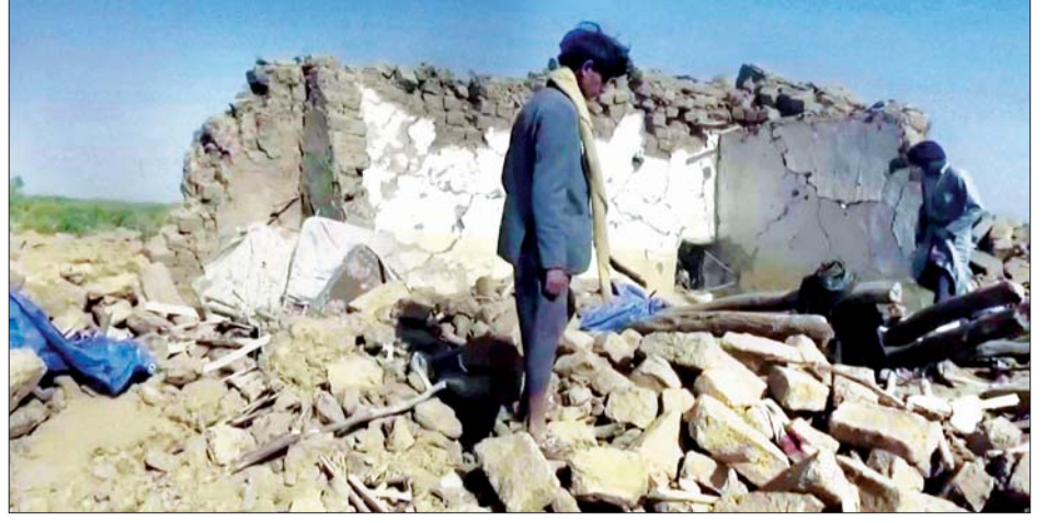
ယီမင်နိုင်ငံ အယ်ဂျေပြည်နယ်တွင် ဖေဖော်ဝါရီ ၁၅ ရက်က လေကြောင်းတိုက်ခိုက်မှုကြောင့် အပျက်အစီးများကို တွေ့ရစဉ်။

ဆာနား ဖေဖော်ဝါရီ ၁၆ ယီမင်နိုင်ငံတွင်ဖေဖော်ဝါရီ ၁၅ ရက် က လေကြောင်းတိုက်ခိုက်မှုကြောင့် ၃၁ ဦးသေဆုံးခဲ့သည်ဟု ကုလသမဂ္ဂက ပြောသည်။ အီရန်က ကျောထောက် နောက်ခံပြုထားသည့် ဟူသီသူပုန် များ၏ တိုက်ခိုက်မှုကြောင့် ဆော်ဒီ ဦးဆောင်သည့် တပ်ဖွဲ့မှ တိုက်လေယာဉ်ပစ်ချခံရပြီးနောက် ပြန်လည်တုံ့ပြန်သည့် တိုက်ခိုက်မှုလည်း ဖြစ်သည်။ ဆော်ဒီဦးဆောင်သည့် တပ်ဖွဲ့များက ယီမင်အစိုးရကို ထောက်ပံ့ရန် အယ်ဂျေပြည်နယ်တွင် စစ်ဆင်ရေးပြုလုပ်နေစဉ် ဖေဖော်ဝါရီ ၁၄ ရက်က တိုက်လေယာဉ်ပျက်ကျ သွားခဲ့ခြင်းဖြစ်သည်။ ထို့ကြောင့် ယီမင်နိုင်ငံမြောက်ပိုင်း တွင် တိုက်ပွဲများ တစ်ရိုက်ထိုးဖြစ်ပေါ်လာပြီး လူသားချင်းစာနာထောက်ထားမှုဆိုင်ရာပြဿနာများဖြစ်ပေါ်နေသည့် ယီမင်နိုင်ငံအတွက် ခြိမ်းခြောက်မှုများဖြစ်ပေါ်လာသည်။ အယ်ဂျေပြည်နယ် ရှီအယ် ဟေဂျာသေတွင် ကနဦးလေကြောင်း တိုက်ခိုက်မှုကြောင့် အရပ်သား ၃၁ ဦးသေဆုံးခဲ့ပြီး ၁၂ ဦးဒဏ်ရာရရှိခဲ့ကြောင်း ယီမင်နိုင်ငံ