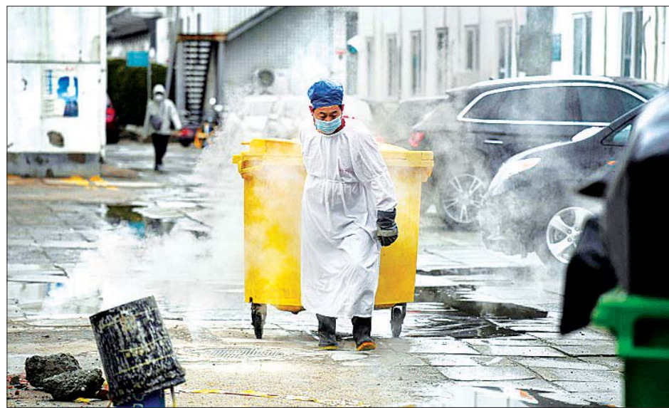
ဆေးရုံသုံးစွန့်ပစ်ပစ္စည်းများ ရှင်းလင်းနေသည့် အလုပ်သမားတစ်ဦးအား တွေ့ရစဉ်။

ဟူပေ ဖေဖော်ဝါရီ ၁၆ တရုတ်နိုင်ငံ၌ ကျန်းမာရေးအာဏာပိုင်များက ဖေဖော်ဝါရီ ၁၅ ရက်တွင် ကိုရိုနာဗိုင်းရပ်စ်ကြောင့် ထပ်မံ သေဆုံးသူ ၁၄၂ ဦးရှိကြောင်း အတည်ပြုခဲ့ပြီးနောက်တွင် တရုတ်ပြည်မကြီး၌ သေဆုံးသူအရေအတွက် ၁၆၅၅ ဦးအထိ ဖြစ်လာခဲ့သည်။ သေဆုံးသူများအနက် အများစုမှာ ဗိုင်းရပ်စ်စတင်ပျံ့နှံ့ရာ ဟူပေပြည်နယ် ဂူဟန်မြို့မှ ဖြစ်သည်။ ယခုအခါ ဗိုင်းရပ်စ်ထပ်မံကူးစက်ခံရသူ ၂၀၀၉ ဦးရှိပြီး တရုတ်ပြည်မကြီး၌ ကူးစက်ခံရသူအရေအတွက် စုစုပေါင်းမှာ ၆၈၅၀၀ အထိ ဖြစ်လာခဲ့သည်။ ဟူပေပြည်နယ်မှ ကျန်းမာရေး အာဏာပိုင်များ၏ ပြောပြချက်အရ အဆိုပါ ပြည်နယ်အတွင်းရှိ ရောဂါကူးစက်ခံရသည့် လူနာများထဲတွင် ၁၉၅၇ ဦးမှာ အရေးပေါ်အခြေအနေ ဖြစ်နေကြောင်း သိရသည်။ ဟူပေပြည်နယ်တွင် ကျန်းမာရေးအာဏာပိုင်များသည် ရောဂါလက္ခဏာပြင်းထန် ခြင်းမရှိသည့် လူနာများကို လက်ခံထားရှိရန်အတွက် အားကစားရုံများနှင့် အခြား အဆောက်အအုံများကို ယာယီဆေးကုသဆောင် ကိုးခုအဖြစ် ဆောင်ရွက်ခဲ့သည်။ အဆောက်အအုံအချို့ကို ယာယီ ဆေးကုသဆောင်များအဖြစ် အသုံးပြုခြင်းသည် ရောဂါလက္ခဏာပြင်းထန် သည့် လူနာများကို ဆေးရုံများတွင် ပိုမိုကုသမှုဆောင်ရွက်ပေးနိုင်စေရန်အတွက် ရည်ရွယ်ဆောင်ရွက်ခြင်းဖြစ်ကြောင်း သိရသည်။ အေအက်ဖ်ပီ