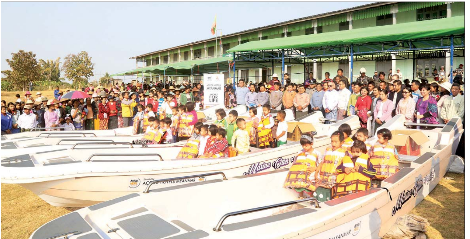
ပြည်ထောင်စုဝန်ကြီး ဒေါက်တာဝင်းမြတ်အေးနှင့်အဖွဲ့၊ ချောင်းဝကျေးရွာ အခြေခံပညာအထက်တန်းကျောင်း(ခွဲ)မှ ကျောင်းသား ကျောင်းသူများအတွက် အသက်ကယ်အင်္ကျီများ၊ စက်တပ်လေ့များ၊ ကျောင်းဝတ်စုံများနှင့် အဝတ်အစားများ လှူဒါန်းပေးအပ်ပွဲသို့ တက်ရောက်ကြသူများနှင့်အတူ စုပေါင်းမှတ်တမ်းတင်ဓာတ်ပုံရိုက်စဉ်။ သတင်းစဉ်

ဤဒေသရှိ ကျောင်းသား ကျောင်းသူများသည် မိုးတွင်းကာလတွင် ရေလမ်းခရီးဖြင့် ကျောင်းများသို့ သွားရောက်ရာ၌ အသုံးပြုသော စက်လှေများမလုံလောက်ခြင်း၊ ရာသီဥတုဆိုးရွားမှု၊ စက်ပစ္စည်းချွတ်ယွင်းမှုနှင့်