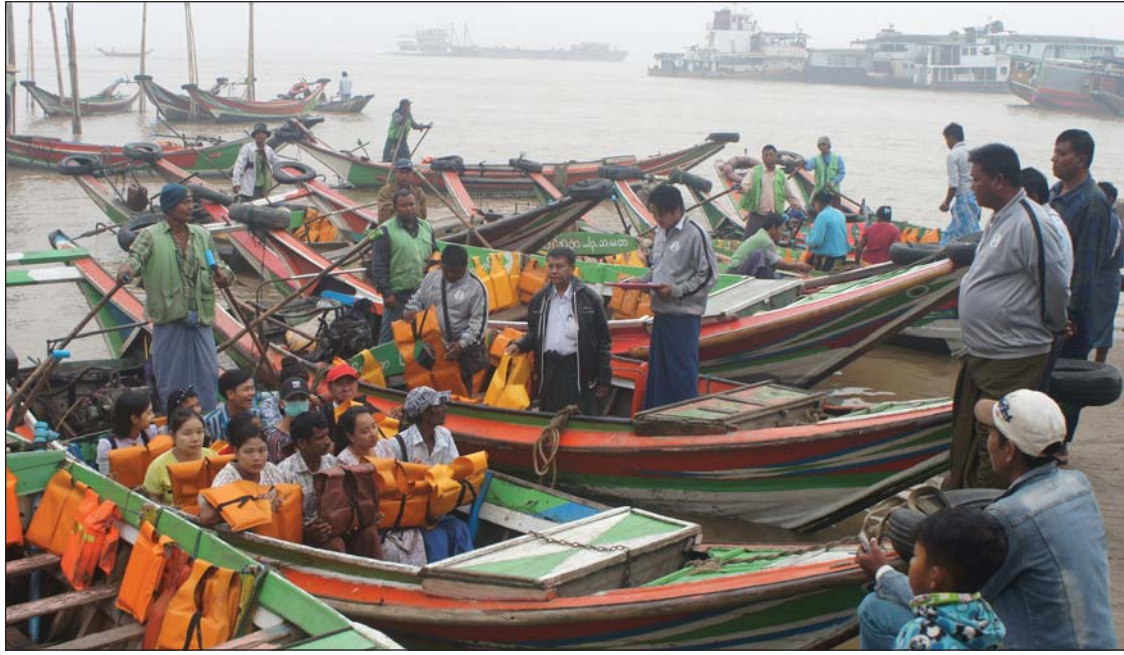
ဒလမု ရန်ကုန်ဘက်သို့ကူးမည့် ခရီးသွားပြည်သူများပါသော စက်တပ်တစ်စီးနှင့် စစ်ဆေးနေသော ကြီးကြပ်မှုကော်မတီဝင်များ

ရန်ကုန် ဖေဖော်ဝါရီ ၁၆ ရန်ကုန်မြစ်တွင်းပြေးဆွဲသော စက်တပ်သမ္မန်များ စည်းကမ်းလိုက်နာရေးနှင့် ခရီးသွားပြည်သူများ ဘေးကင်းလုံခြုံရေးအတွက် ဒေသမြို့နယ်အတွင်း ရှိကူးတို့ဆိပ် ၁၁ ဆိပ်တို့၌ ဆောင်းရာသီကာလ မြစ်အတွင်း မြို့နယ်များပိတ်ချိန်တွင် ခရီးသည် များတင်ဆောင်ပြီး မထွက်ခွာရေးအတွက် မြို့နယ် စက်တပ်ရေယာဉ်ကြီးကြပ်မှုကော်မတီ က သတိပေးထားပြီး သတ်မှတ်ထားသော စည်းကမ်းများကို လိုက်နာမှုရှိစေရေးအတွက် အဆိုပါကော်မတီမှ စက်တပ်ရေယာဉ်ကြီးကြပ် ရေးအဖွဲ့ ဥက္ကဋ္ဌနှင့် အဖွဲ့ဝင်များက ဖေဖော်ဝါရီ ၁၆ ရက်က သမ္မတကမ်းခြေ ကူးတို့ဆိပ်မှ စတင်ပြီး စက်တပ်သမ္မန် ကူးတို့ဆိပ်များကို ကွင်းဆင်းစစ်ဆေးခဲ့ကြကြောင်း သိရသည်။ ရန်ကုန်မြစ်အတွင်း မြို့နယ်များ ကျဆင်း နေချိန် မြင်ကွင်းမရှင်းလင်းပါက ခရီးသည်များ တင်ဆောင်၍ ရေယာဉ်များအား ကမ်းမှထွက် ခွာခွင့် မပြုရ။ သတ်မှတ်ထားသော လူဦးရေ ထက် ပို၍ မတင်စေရ။ သတ်မှတ်လူဦးရေနှင့် အညီ အသက်ကယ်အင်္ကျီများ ထားရှိစေရ။ ခရီးသည်များ အသက်အန္တရာယ် လုံခြုံမှုရှိစေရေး အတွက် အသက်ကယ်အင်္ကျီများ ဝတ်ဆင်ကြ စေရေးနှင့် ရေယာဉ်မောင်းနှင်သူများအနေဖြင့် အရက်သေစာ သောက်စားခြင်း မရှိစေရေး အတွက် လိုက်လံစစ်ဆေးခြင်းဖြစ်ပြီး ကူးတို့ ဆိပ်များအားလုံးရှိ ဥက္ကဋ္ဌများနှင့် ရေယာဉ် မောင်းနှင်သူများကိုလည်း အဆိုပါ စည်းကမ်း သတ်မှတ်ချက်များကို ထပ်ဆင့် ရှင်းလင်းပြော ကြားခဲ့ကြောင်း သိရသည်။