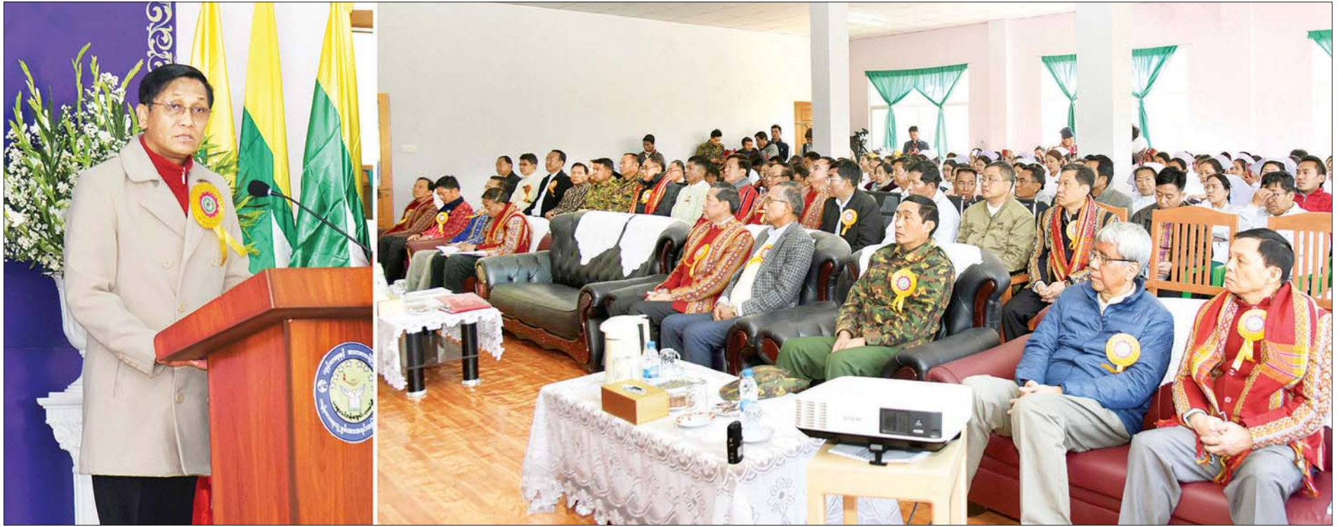
ဒုတိယသမ္မတ ဦးဟင်နရီဗန်ထီးယူ သားဖွားသင်တန်းကျောင်း (ဟားခါး) ဖွင့်ပွဲအခမ်းအနားတွင် အမှာစကားပြောကြားစဉ်။