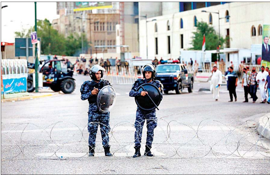
ဂရင်းစုအတွင်း၌ ကင်းလှည့်နေသည့် လုံခြုံရေးတပ်ဖွဲ့ဝင်နှစ်ဦးကို တွေ့ရစဉ်။

ဘဂ္ဂဒက် ဖေဖော်ဝါရီ ၁၆ အီရတ်နိုင်ငံအလယ်ပိုင်း ဘဂ္ဂဒက်မြို့ရှိ ဂရင်းစုနှင့် ခုံးကျည်လေးစင်းကျရောက်ခဲ့သည့် ဘဂ္ဂဒက်မြို့နယ်အချို့ရှိ ခုံးကျည်လေးစင်းဖြင့် ပစ်ခတ်ခံခဲ့ရပြီး ခုံးကျည်လေးစင်းအနက် သုံးစင်းမှာ အမေရိကန်သံရုံးရှိရာ လုံခြုံရေး အင်အားအခိုင်အမာချထားသည့် ဇုန်အတွင်း ကျရောက်ခဲ့ကြောင်း အီရတ်တပ်ဖွဲ့က ယမန်နေ့က ပြောကြားခဲ့သည်။ စစ်သွေးကြွတစ်စုက ခုံးကျည်များကို ဖေဖော်ဝါရီ ၁၅ ရက်ညပိုင်းတွင် ဂရင်းစုနယ်သို့ ပစ်ခတ်ခဲ့ခြင်း ဖြစ်ပြီး ခုံးကျည်တစ်စင်းမှာ ဘဂ္ဂဒက် အရှေ့ပိုင်း ဖာလက်စတင်းလမ်းရှိ ရဲသင်တန်းကျောင်းအနီး ဟက်ရှီရာဘီ ပြည်သူ့စစ် အဖွဲ့ရုံးချုပ်သို့ ကျရောက်ခဲ့ကြောင်း အီရတ်ပွဲတွဲ စစ်ဆင်ရေး ညွှန်ကြားမှုအဖွဲ့နှင့် ဆက်စပ်နေသည့် မီဒီယာရုံးက ဖော်ပြခဲ့သည်။ ရဲသင်တန်းကျောင်းအနီး ကျရောက်ခဲ့သည့် ခုံးကျည်ကြောင့် ပစ္စည်း များ ထိခိုက်ဆုံးရှုံးမှု ဖြစ်ပေါ်ခဲ့ကြောင်း ထုတ်ပြန်ချက်တွင် ဖော်ပြသည်။ ပြည်ထဲရေး ဝန်ကြီးဌာနမှ အမည်မဖော်လိုသူ သတင်းရင်းမြစ်တစ်ခုက ဖေဖော်ဝါရီ ၁၅ ရက် ဒေသစံတော်ချိန် နံနက် ၃ နာရီခန့်တွင် ခုံးကျည်သုံးစင်း ဂရင်းစုသို့ ကျရောက်ခဲ့ပြီး ခုံးကျည်နှစ်စင်း ပေါက်ကွဲခဲ့ခြင်းမရှိကြောင်း ပြောကြားခဲ့သည်။ လုံခြုံရေးအင်အား ထူထပ်စွာချထားသည့် ဂရင်းစုနယ်နိမိတ်သည် စစ်သွေးကြွအဖွဲ့များ၏ မော်တာ နှင့် ခုံးကျည်တိုက်ခိုက်မှုများ လုပ်ဆောင်ရန် မကြာခဏ ပစ်မှတ်ထား ခြင်းခံရ သည်။ အကျယ်အဝန်းအားဖြင့် ၁၀ စတုရန်း ကီလိုမီတာရှိပြီး တိကျစွာ အနောက်ဘက်ကမ်းတွင် တည်ရှိသည်။ ဆင်ဟွာ