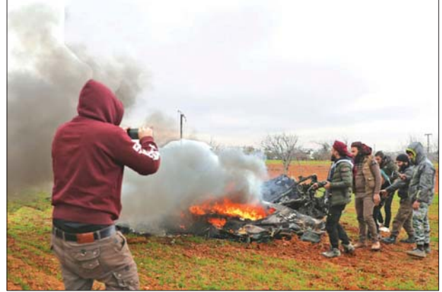
ရဟတ်ယာဉ်အပျက်အစီးများကို ကြည့်ရှုနေကြသည့် ဆီးရီးယားသူပုန်အဖွဲ့များကို တွေ့ရစဉ်။

ဒဏ်စက်ကတ် ဖေဖော်ဝါရီ ၁၂ ဆီးရီးယားအစိုးရပိုင် ရဟတ်ယာဉ်တစ်စင်း ပစ်ချခံခဲ့ရသကဲ့သို့ တူရကီဘက်ကလည်း ၎င်းတို့၏ တပ်ဖွဲ့ဝင်များ တိုက်ခိုက်ခံရသည့်အတွက် တန်ရာတန်ကြေး ပြန်လည်ပေးဆပ်ရမည်ဟု သတိပေးထားပြီးနောက် ဖေဖော်ဝါရီ ၁၁ ရက်တွင် သူပုန်များကို ကျောထောက်နောက်ခံပေးထားသည့် တူရကီတပ်များနှင့် ဆီးရီးယားအစိုးရတို့အကြား တင်းမာမှုများ မြင့်တက်လာခဲ့သည်။ ဆီးရီးယားနိုင်ငံ အနောက်မြောက်ပိုင်းရှိ သူပုန်များကို ချေမှုန်းနိုင်ရေး ဆီးရီးယားအစိုးရတပ်များသည် နိုင်ငံ၏ အဓိကမြို့ကြီးလေးမြို့နှင့် ဆက်သွယ်ထားသည့် လမ်းမကြီးကို ပိတ်ဆို့ထားသည်။ ဆီးရီးယားအစိုးရတပ်များ၏ လက်ချက်ဖြင့် တူရကီတပ်ဖွဲ့ဝင်ငါးဦး သေဆုံးပြီးနောက် ဆီးရီးယားနှင့် တူရကီတို့အကြား နောက်ထပ်တင်းမာမှု တစ်ခု ထပ်မံတိုးလာခဲ့ခြင်းဖြစ်သည်။ ဆီးရီးယားသမ္မတ အာဆတ်၏ တပ်ဖွဲ့ဝင်များသည်