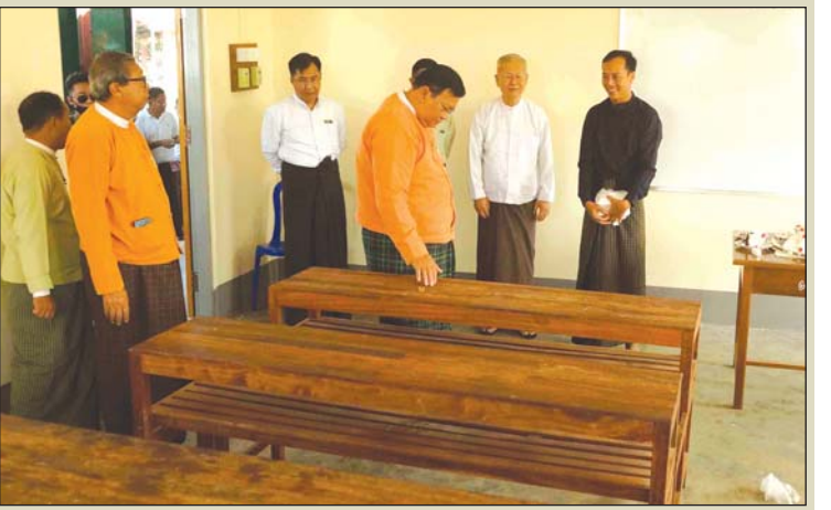
ကျောင်းဆောင်သစ်အတွင်းသို့ ရောဂါတိုင်းဒေသကြီးဝန်ကြီးချုပ် ဦးလှမိုးအောင် လှည့်လည်ကြည့်ရှုစဉ်