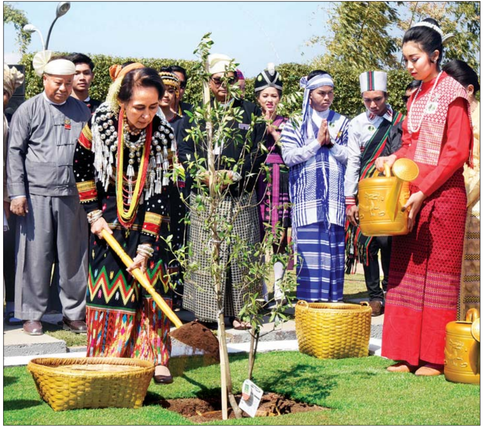
နိုင်ငံတော်၏အတိုင်ပင်ခံပုဂ္ဂိုလ် ဒေါ်အောင်ဆန်းစုကြည် ပြည်ထောင်စုငြိမ်းချမ်းရေး သံလွင်ပင် စိုက်ပျိုးပေးစဉ်။