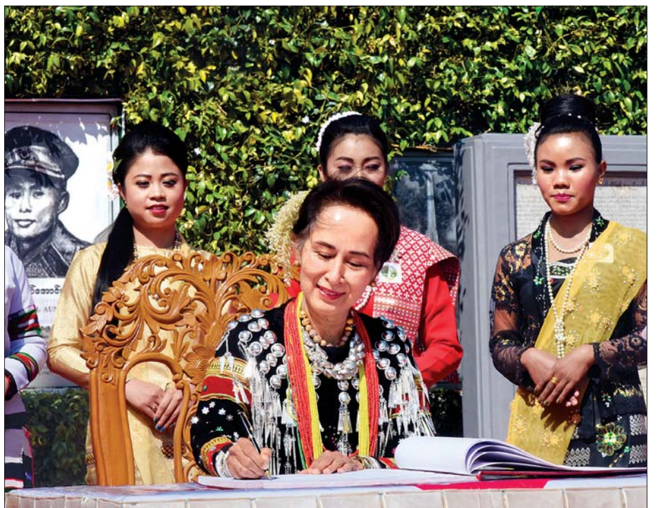
နိုင်ငံတော်၏အတိုင်ပင်ခံပုဂ္ဂိုလ် ဒေါ်အောင်ဆန်းစုကြည် ဧည့်သည်တော်မှတ်တမ်းတွင် လက်မှတ်ရေးထိုးစဉ်။ သတင်းစဉ်

ယင်းနောက် နိုင်ငံတော်၏အတိုင်ပင်ခံပုဂ္ဂိုလ် ဒေါ်အောင်ဆန်းစုကြည်က မိန့်ခွန်းပြောကြားသည်။ (နိုင်ငံတော်၏အတိုင်ပင်ခံပုဂ္ဂိုလ် ပြောကြားသည့် မိန့်ခွန်းကို စာမျက်နှာ ၆ တွင် သီးခြားဖော်ပြထားပါသည်။) ထို့နောက် နိုင်ငံတော်၏အတိုင်ပင်ခံပုဂ္ဂိုလ်သည် ဧည့်သည်တော်မှတ်တမ်းတွင် လက်မှတ်ရေးထိုးပြီး ပင်လုံ စာချုပ်တွင် ပါဝင်လက်မှတ်ရေးထိုးခဲ့သော ချင်းကော်မတီ ကိုယ်စားလှယ် ဦးထောင်ဇာအုပ်၊ ချင်းကော်မတီ ကိုယ်စားလှယ် ဦးကိုယိုမနန်း၊ လူထုကိုယ်စားလှယ်- ပင်းတယ ဦးခွန်စော၊ ကချင်ကော်မတီကိုယ်စားလှယ် ဒူဝါး ဇော်လွန်း၊ လူထုကိုယ်စားလှယ်-လင်းခေးဦးထွန်းမြင့်၊ ရှမ်းပြည်နယ် လူထုကိုယ်စားလှယ် ဦးကြာပု၊ ဆီဆိုင် စော်ဘွားကိုယ်စားလှယ် ဦးဖြူ၊ ကချင်ကော်မတီ ကိုယ်စားလှယ် (မြစ်ကြီးနား) ဒူဝါးဇော်ရစ်၊ တောင်ပိုင်း စော်ဘွားစစ်ခွန်ပန်းစိန်၊ ညောင်ရွှေစော်ဘွား စစ်ရွှေသိုက်၊ ကချင်ကော်မတီကိုယ်စားလှယ် ဆမားဒူဝါဆင်ဝါးနောင်၊ စာမျက်နှာ ၅ သို့