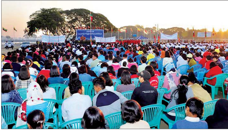
မုံရွာမြို့ ကန်သာယာရွာလှိုင်ဓမ္မကျွန်း၌ (၇၃) နှစ်မြောက် ပြည်ထောင်စုနေ့အခမ်းအနား ကျင်းပစဉ်။

ချင်းပြည်နယ် တီးတိန်မြို့တွင် (၇၃) နှစ်မြောက် ပြည်ထောင်စုနေ့ အထိမ်းအမှတ် အခမ်းအနားကို ဖေဖော်ဝါရီ ၁၂ ရက်က ခွာဒိုခန်းမ၌ ကျင်းပရာ မြို့နယ်