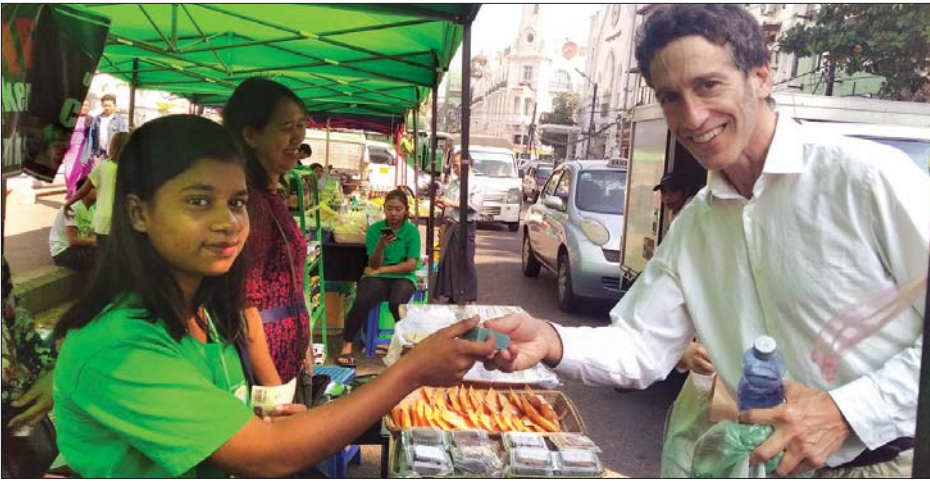
နိုင်ငံခြားသား ခရီးသွားတစ်ဦး မဟာပန္နလပန်းခြံလမ်းရှိ Consumer Green Market (1) သောကြာနေ့ဈေးတွင် သဘာဝဆေးဆပ်ပြာခဲ ဝယ်ယူအားပေးနေစဉ်။

“အဓိက အော်ဂဲနစ်လက်မှတ်ရယူ ဓာတုလွတ်၊ စိုက်ပျိုးရေးဆိုင်ရာ အလေ့အကျင့်ကောင်းများနည်းစနစ် လက်မှတ်ရယူပါမယ်။ သဘာဝဟင်းသီးဟင်းရွက်တွေကို စားသုံးသူတွေနဲ့ တိုက်ရိုက်ထိတွေ့ရောင်းချနိုင်ဖို့၊ မြို့နယ်တိုင်းမှာ ဖော်ဆောင်ပေးဖို့ ကြိုးစားရင်းနဲ့ အခု ဆူးလေမှာ Consumer Green Market (1) ဖွင့်လှစ်ထားပါတယ်။ ဟင်းသီးဟင်းရွက်၊ သစ်သီးဝလံတွေ၊ သဘာဝဓာတ်စာတွေကို သင့်တင့်တဲ့ ဈေးနှုန်းနဲ့ ၂၀၁၉ ခုနှစ် ဇူလိုင် ၆ ရက်စာစပြီး မနက် ၇ နာရီကနေ နေ့လယ်အထိ သောကြာနေ့တိုင်း ရောင်းချပေးပါတယ်။ ဒုတိယဈေးက တောင်ငူကလာ (၁၀) ရပ်ကွက် သုမင်္ဂလလမ်း ပန်းခြံရှေ့မှာ စနေနေ့ မနက်တိုင်း ဆိုင်ခန်း ၃၀ ကျော်က ရောင်းချပေးနေပါတယ်။ နောက်ထပ် Consumer Green Market (2) နဲ့ (3) ကို လှိုင်မြို့နယ်နဲ့ တာခြားမြို့နယ်တွေမှာ သက်ဆိုင်ရာနည်းနည်းဆက်လက်ဖွင့်လှစ်သွားမှာပါ။ အခု မဟာပန္နလ ပန်းခြံလမ်းမှာ ရှမ်းပြည်နယ် ကလေးကလာတဲ့ အော်ဂဲနစ်ဟင်းသီးဟင်းရွက်ဆိုင် အပါအဝင် ဆိုင်ခန်း