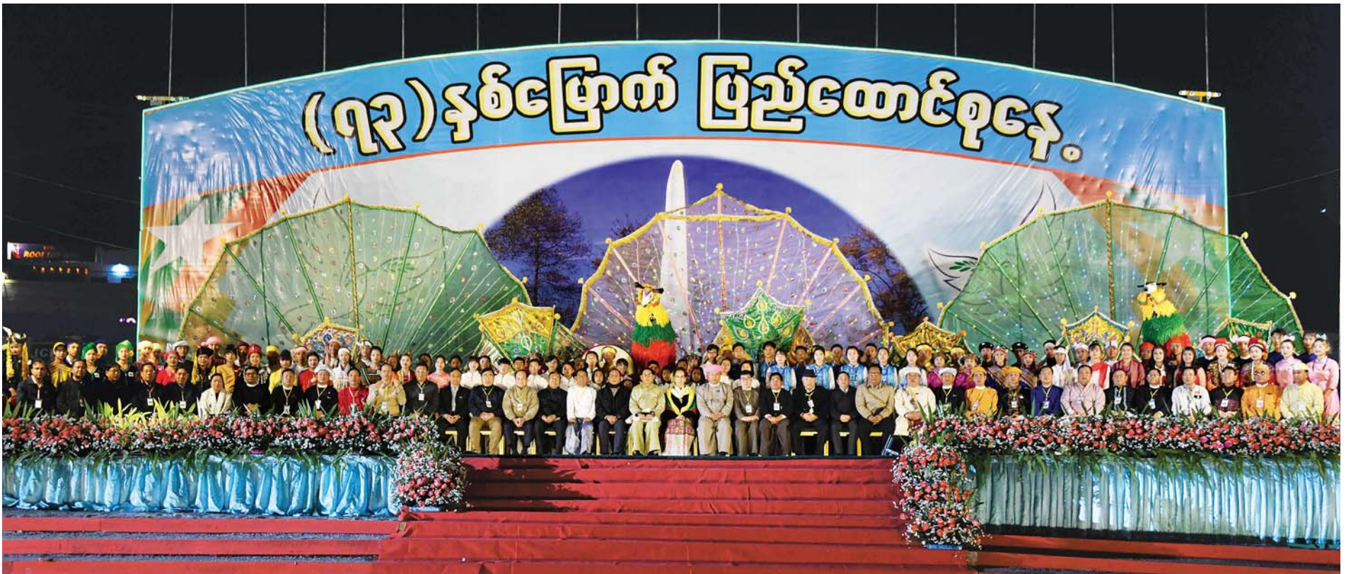
နိုင်ငံတော်၏အတိုင်ပင်ခံပုဂ္ဂိုလ် ဒေါ်အောင်ဆန်းစုကြည်နှင့် အဖွဲ့ဝင်များ (၇၃)နှစ်မြောက် ပြည်ထောင်စုနေ့ ညစာစားပွဲအခမ်းအနားတွင် တိုင်းရင်းသားရိုးရာယဉ်ကျေးမှုအကအဖွဲ့နှင့်အတူ စုပေါင်းမှတ်တမ်းတင်ဓာတ်ပုံရိုက်စဉ်။ သတင်းစဉ်