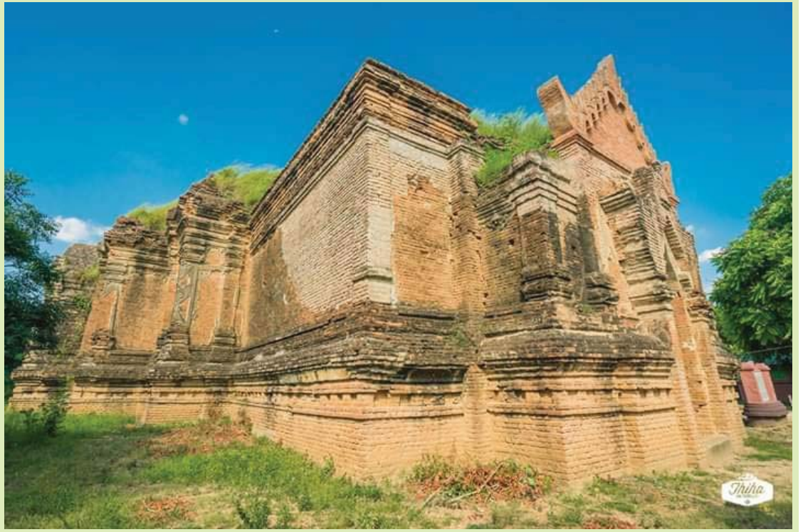
ရေးဟောင်းဂူဘုရား

ပင်းယနန်းတော်ရာ အတော်ကို ရှာရပါတယ်။ ရွာဥက္ကဋ္ဌအိမ် ပါရောက်ပြီး မေးခဲ့ရတာ အမှတ်တရပါပဲ။ ဂူကြီးသုံးလုံးကို မြောက်ဘက် နဂါးမောက်