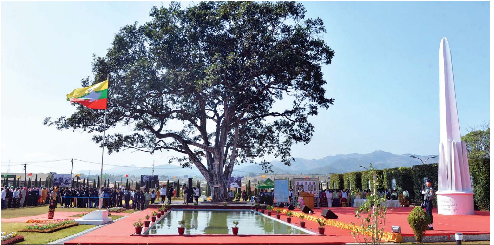
နိုင်ငံတော်၏အတိုင်ပင်ခံပုဂ္ဂိုလ် ဒေါ်အောင်ဆန်းစုကြည်နှင့် အခမ်းအနားသို့ တက်ရောက်လာကြသူများ နိုင်ငံတော်အလံအား အလေးပြုစဉ်။