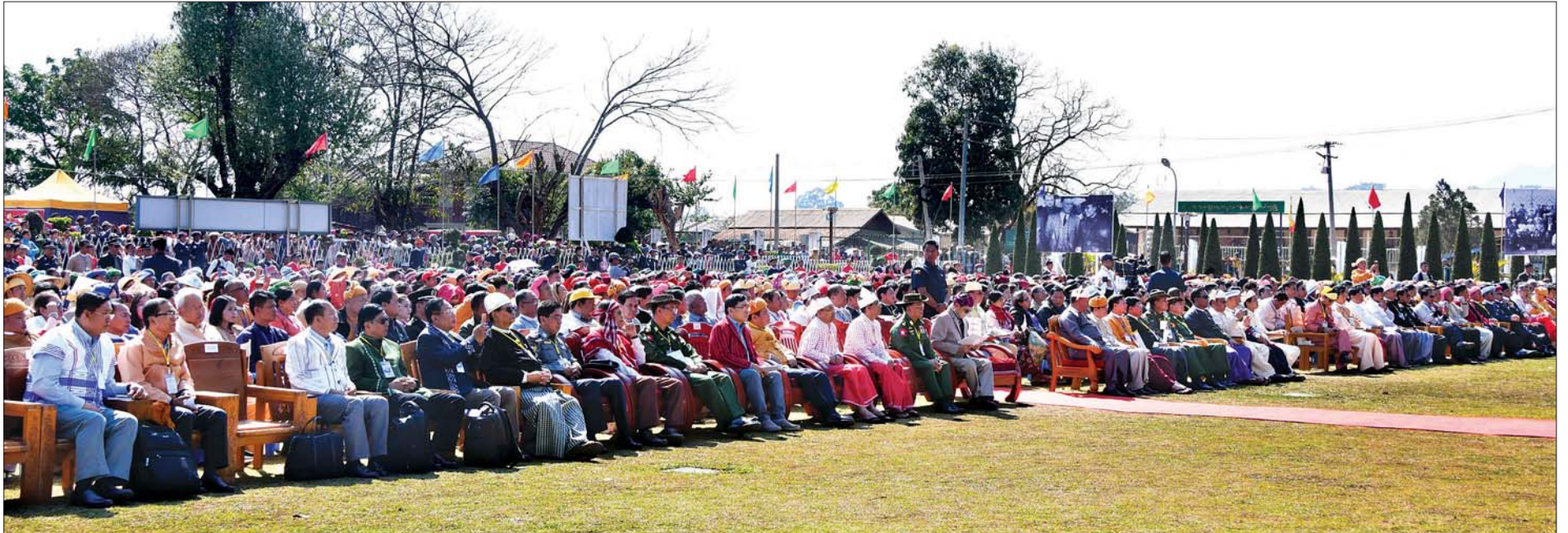
ရှမ်းပြည်နယ် လွိုင်လင်ခရိုင် ပင်လုံမြို့ရှိ ပြည်ထောင်စုကျောက်တိုင်ကွင်း၌ ကျင်းပသည့် (၇၃) နှစ်မြောက် ပြည်ထောင်စုနေ့အခမ်းအနားသို့ တက်ရောက်လာကြသူများအား တွေ့ရစဉ်။