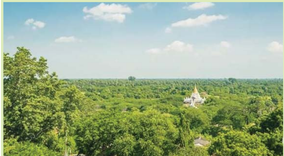
ရွှေစည်းခုံစေတီပေါ်က တွေ့မြင်ရသည့် ရှုခင်း

အားလုံးပဲ အစဉ်ဘေးကင်းလုံခြုံ ကျန်းမာပြည့်စုံပျော်ရွှင်စွာ ခရီးသွားနိုင်ကြ ပါစေ။ ။