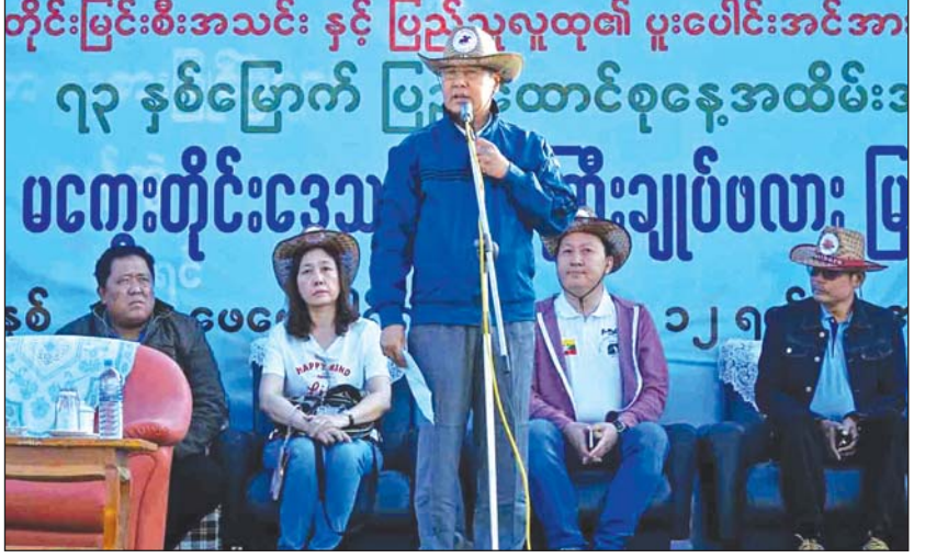
မြင်းစီးပြိုင်ပွဲ ဖွင့်ပွဲတွင် မကွေးတိုင်းဒေသကြီးဝန်ကြီးချုပ် ဒေါက်တာအောင်မိုးညို အမှာစကားပြောကြားစဉ်