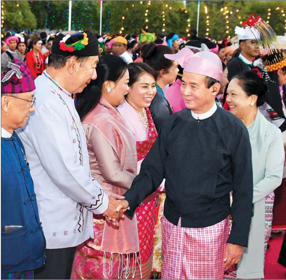
နိုင်ငံတော်သမ္မတ ဦးဝင်းမြင့်နှင့် ဇနီး ဒေါ်ချိုချို ၂၀၂၀ ပြည့်နှစ် (၇၃) နှစ်မြောက် ပြည်ထောင်စုနေ့အထိမ်းအမှတ် ဂုဏ်ပြုညစာစားပွဲ အခမ်းအနားသို့ တက်ရောက်လာကြသူများအား ရင်းရင်းနှီးနှီးဆက်ဆံခြင်း။ သတင်းစဉ်

၁၃၈၁ ခုနှစ်၊ တပို့တွဲလပြည့်ကျော် ၅ ရက် ၂၀၂၀ ပြည့်နှစ်၊ ဖေဖော်ဝါရီ ၁၃ ရက်၊ ကြာသပတေးနေ့ အတွဲ (၅၉)၊ အမှတ် (၁၃၆)