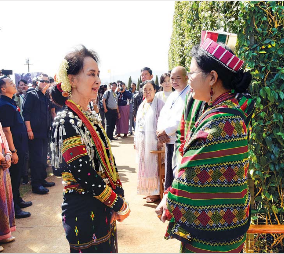
နိုင်ငံတော်၏အတိုင်ပင်ခံပုဂ္ဂိုလ် ဒေါ်အောင်ဆန်းစုကြည် ပင်လုံစာချုပ်တွင် လက်မှတ်ရေးထိုးခဲ့သော ပုဂ္ဂိုလ်များ၏ မိသားစုဝင်အား ရင်းရင်းနှီးနှီး နှုတ်ဆက်စဉ်။