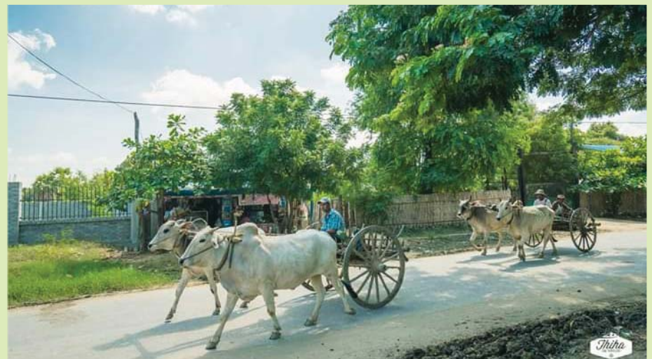
စကားအင်းရွာလေ့ လှည်းဖြင့်သွားလာမှု