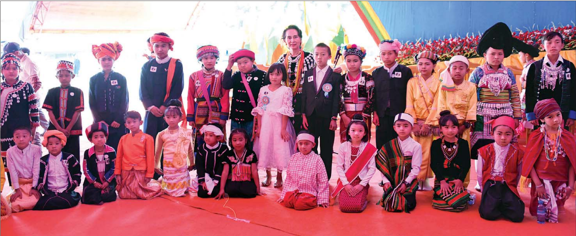
နိုင်ငံတော်အိတ်ပင်ခံပုဂ္ဂိုလ် ဒေါ်အောင်ဆန်းစုကြည် ပင်လုံမြို့ ဒေသခံ တိုင်းရင်းသား၊ တိုင်းရင်းသူကလေးငယ်များနှင့် မှတ်တမ်းတင်ဓာတ်ပုံရိုက်စဉ်။ သတင်းစဉ်

စာမျက်နှာ ၈ မှ ဒါကြောင့် ကျွန်မတို့ဟာ တစ်ယောက်ချင်း၊ တစ်ယောက်ချင်း စဉ်းစားတဲ့စိတ်ဓာတ် မဟုတ်ဘဲ အများအတွက်စဉ်းစားပြီး အများတိုးတက်ရင် ကျွန်မတို့ ဆိုရိုးစကားလို “သူတစ်ပါးအကျိုးဆောင် ကိုယ့်အကျိုးအောင်” ဆိုသလို အများအကျိုးကို ဆောင်ခြင်းဖြင့် တစ်ယောက်ချင်း၊ တစ်ယောက်ချင်းရဲ့ အကျိုးကို အောင်နိုင်မယ်ဆိုတဲ့ စိတ်ဓာတ်ကို နိုင်နိုင်မာမာထားမှ ကျွန်မတို့ ပြည်ထောင်စုကို ဆောက်တည်နိုင်မှာပါ။