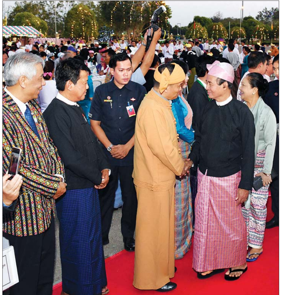
နိုင်ငံတော်သမ္မတ ဦးဝင်းမြင့်နှင့် ဇနီး ဒေါ်ချိုချို ၂၀၂၀ ပြည့်နှစ် (၇၃) နှစ်မြောက် ပြည်ထောင်စုနေ့အထိမ်းအမှတ် ဂုဏ်ပြုညစာစားပွဲ အခမ်းအနားသို့ တက်ရောက်လာကြသူများအား ရင်းရင်းနှီးနှီးနှုတ်ဆက်စဉ်။ သတင်းစဉ်

◆ ရှေ့ဖွဲ့မှ နေပြည်တော်ကောင်စီ ဥက္ကဋ္ဌ ဒေါက်တာ မျိုးအောင်နှင့် ဇနီးတို့က ကြိုဆိုနှုတ်ဆက်ကြသည်။ ရင်းရင်းနှီးနှီးလိုက်လံနှုတ်ဆက် ထိုနေ့က နိုင်ငံတော်သမ္မတ ဦးဝင်းမြင့်နှင့် ဇနီး ဒေါ်ချိုချိုတို့သည် ဂုဏ်ပြုညစာစားပွဲသို့ တက်ရောက် လာကြသည့် ပြည်ထောင်စုအဆင့် ပုဂ္ဂိုလ်များ၊ ပြည်ထောင်စုဝန်ကြီးများ၊ တပ်မတော်မှ အရာရှိကြီးများ၊ တိုင်းဒေသကြီးနှင့် ပြည်နယ်များမှ တိုင်းရင်းသားလူမျိုးရေးရာ ဝန်ကြီး များ၊ လွှတ်တော်ကိုယ်စားလှယ်များ၊ တစ်နိုင်ငံလုံး ပစ်ခတ်တိုက်ခိုက်မှု ရပ်စဲရေး သဘောတူစာချုပ် (NCA) လက်မှတ် ရေးထိုးထားသည့် တိုင်းရင်းသားလက် နက်ကိုင် အဖွဲ့