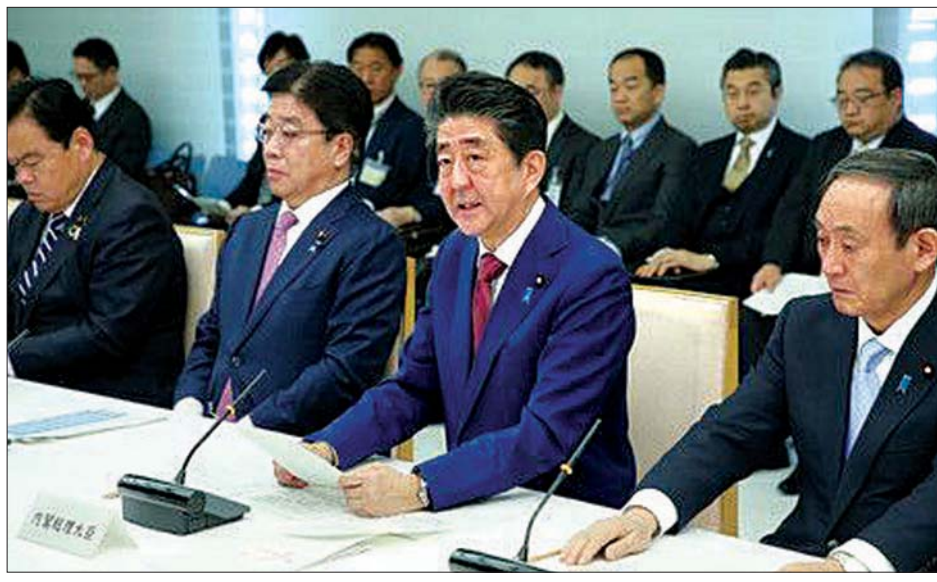
ဂျပန်ဝန်ကြီးချုပ် ရှင်ဒိုအဘေး ကိုရိုနာဗိုင်းရပ်စ်ကူးစက်မှု ထိန်းချုပ်ရေးလုပ်ငန်းအဖွဲ့နှင့် တွေ့ဆုံဆွေးနွေးစဉ်။

ပုဂ္ဂလိကကဏ္ဍတို့ ပူးပေါင်းကာ ဆောင်ရွက်သွားမည်ဟု သိရသည်။ ရောဂါလက္ခဏာ တွေ့ရှိရသည့် လူများကို ဒေသခံအစိုးရက စစ်ဆေးပေးမှုများ ပြုလုပ်ခွင့်လည်း ပေးသွားမည်ဟု မစ္စတာအဘေးက ဆက်လက် ပြောကြားခဲ့သည်။ တရုတ်နိုင်ငံ ကမ်းရိုးတန်းပြည်နယ်တစ်ခု ဖြစ်သည့် ကျယ်ကျန်းပြည်နယ်တွင် လူဦးရေ ၅၇ သန်းခန့်ရှိသည်။ တရုတ်နိုင်ငံတွင် ကိုရိုနာဗိုင်းရပ်စ် ကူးစက်ခံရသူ အရေအတွက်မှာ ဖေဖော်ဝါရီ ၁၁ ရက်တွင် ၁၁၃၁ ဦး အထိ ရှိလာကြောင်း သိရသည်။ ဟူပေပြည်နယ်နှင့် စီးပွားရေးအရ ဆက်စပ်မှုများရှိနေသည့် ဝမ်ကျိုးမြို့တွင် လူပေါင်း ၄၈၁ ဦး ကူးစက်ခံထားရသည်။