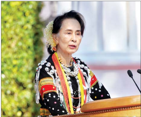
နိုင်ငံတော်၏အတိုင်ပင်ခံပုဂ္ဂိုလ် ဒေါ်အောင်ဆန်းစုကြည် မိန့်ခွန်းပြောကြားစဉ်။

ဒီနေ့ (၇၃)နှစ်မြောက် ပြည်ထောင်စုနေ့အခမ်းအနားကို တက်ရောက်လာကြတဲ့ တိုင်းရင်းသားညီအစ်မအားလုံးအားလုံးစိတ်၏ ချမ်းသာခြင်း၊ ကိုယ်၏ ကျန်းမာခြင်းနဲ့ ပြည့်စုံကြပါစေလို့ ဦးစွာပထမနှုတ်ခွန်းဆက်သလိုက်ပါတယ်။ တစ်နိုင်ငံလုံး ပစ်ခတ်တိုက်ခိုက်မှုရပ်စဲရေး သဘောတူစာချုပ်(NCA) လက်မှတ်ရေးထိုးထားတဲ့ တိုင်းရင်းသားလက်နက်ကိုင်အဖွဲ့တွေနဲ့ လက်မှတ်ရေးထိုးရသေးတဲ့ အဖွဲ့တွေပါ ပြည်ထောင်စုအခမ်းအနားကို တက်ရောက်လာကြတဲ့အတွက်လည်း ဝမ်းသာကြောင်း ပြောကြားလိုပါတယ်။