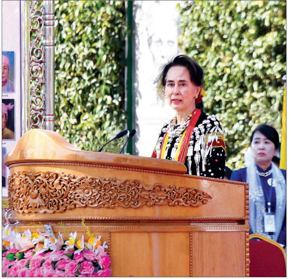
နိုင်ငံတော်၏ အတိုင်ပင်ခံပုဂ္ဂိုလ် ဒေါ်အောင်ဆန်းစုကြည် ပင်လုံမြို့၌ ကျင်းပသည့် (၇၃) နှစ်မြောက် ပြည်ထောင်စုနေ့ အခမ်းအနားသို့ တက်ရောက်မိန့်ခွန်းပြောကြားစဉ်။ သတင်းစဉ်