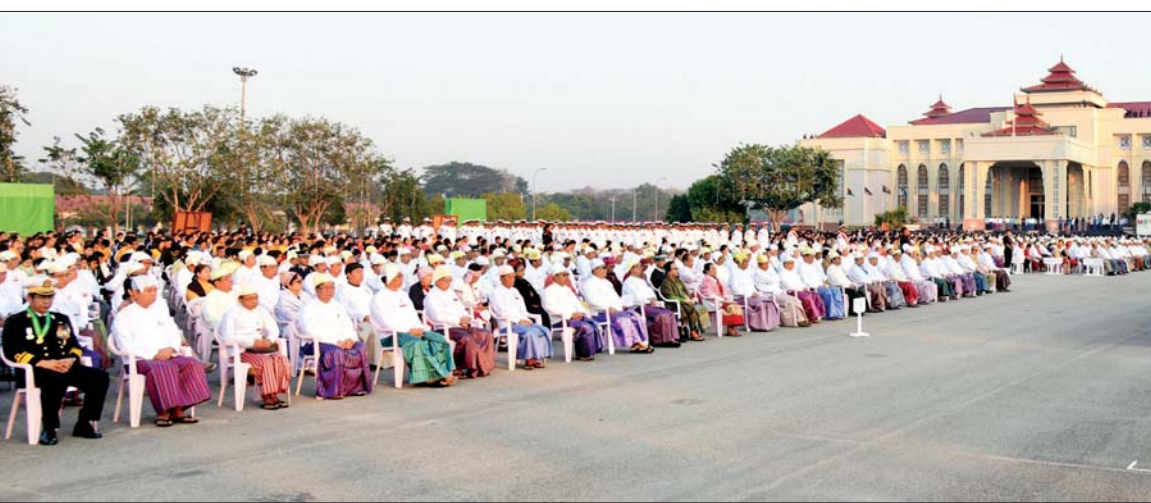
နိုင်ငံတော်သမ္မတ ဦးဝင်းမြင့်ထံမှ (၇၃) နှစ်မြောက် ပြည်ထောင်စုနေ့အခမ်းအနားသို့ ပေးပို့သည့်သဝဏ်လွှာကို ဒုတိယသမ္မတ ဦးမြင့်ဆွေ ဖတ်ကြားစဉ်။ သတင်းစဉ်

ယင်းနောက် နိုင်ငံတော်အလံ အလေးပြုပွဲ အခမ်းအနားသို့ တက်ရောက်အလေးပြုကြမည့် ဌာန ဆိုင်ရာ ဝန်ထမ်းများ၊ လူမှုရေး အသင်းအဖွဲ့များ၊ တိုင်းရင်းသား တိုင်းရင်းသူများနှင့် ဖိတ်ကြားထား သူများသည် နံနက် ၅ နာရီမှစတင်၍ အခမ်းအနားကျင်းပမည့် မြို့တော်