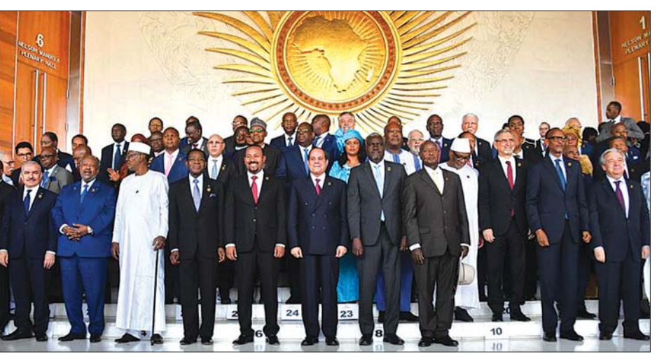
(၃၃) ကြိမ်မြောက် အာဖရိကသမဂ္ဂထိပ်သီးအစည်းအဝေးသို့ တက်ရောက်လာသည့် နိုင်ငံခေါင်းဆောင်များကို တွေ့ရစဉ်။

ကိုင်းရို ဖေဖော်ဝါရီ ၁၂ အာဖရိကတိုက်တွင် အကြမ်းဖက် တိုက်ခိုက်မှုကို တိုက်ပျက်ရန်အတွက် အာဖရိက ပူးပေါင်းတပ်ဖွဲ့တည်ထောင်ရေး အထူးထိပ်သီးအစည်းအဝေး ကျင်းပရာတွင် အိဂျစ်အဖြစ် လက်ခံပေးရန် အဆင်သင့်ဖြစ်နေပြီဟု အိဂျစ် သမ္မတအဗ္ဗဒယ်ဖက်တာ အယ်စီစီက ပြောကြားခဲ့သည်။ (၃၃)ကြိမ်မြောက် အာဖရိကသမဂ္ဂ ထိပ်သီးအစည်းအဝေး ဖွင့်ပွဲအခမ်းအနားတွင် အိဂျစ်သမ္မတက မိန့်ခွန်းပြောကြားခဲ့သည်။ ပိတ်ပွဲအခမ်းအနားတွင် အာဖရိက ခေါင်းဆောင်များက အကြမ်းဖက်မှုကို တိုက်ပျက်ရန် အာဖရိကပူးပေါင်းတပ်ဖွဲ့ ထူထောင်ရေး ဆွေးနွေးမှုများ ပြုလုပ်ရန် အထူးအစည်းအဝေးကျင်းပသင့်သည်ဟု အဆိုပြုခဲ့ကြသည်။ ပူးပေါင်း တပ်ဖွဲ့ထူထောင်ခြင်းသည် အာဖရိကတွင် ငြိမ်းချမ်းရေးနှင့် လုံခြုံရေးရရှိရန် အရေးကြီးသည့် အစီအစဉ်တစ်ခုဖြစ်ကြောင်း ဆွေးနွေး