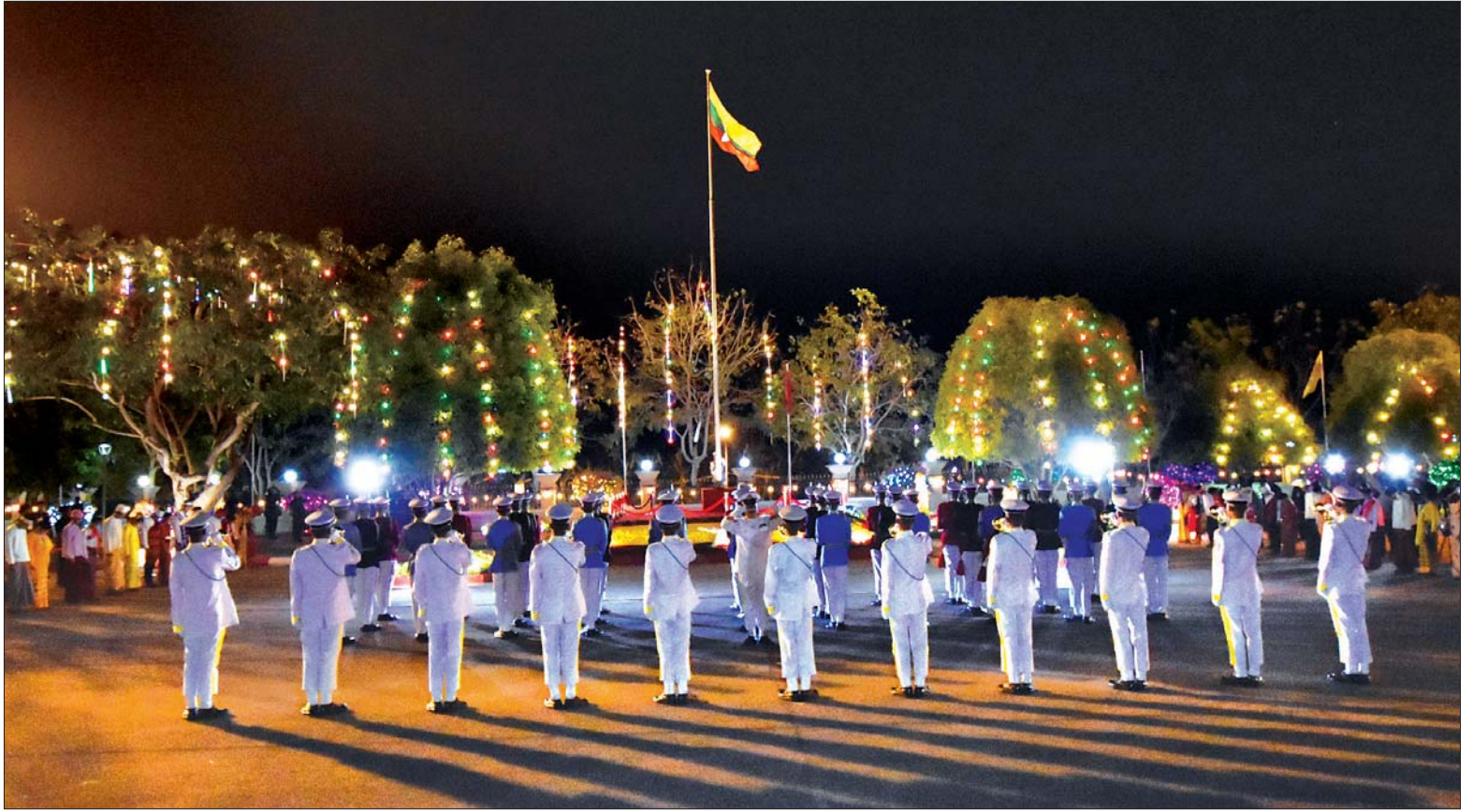
(၇၃) နှစ်မြောက် ပြည်ထောင်စုနေ့ နိုင်ငံတော်အလံတင်အခမ်းအနား ကျင်းပစဉ်။

နေပြည်တော် ဖေဖော်ဝါရီ ၁၂ ၂၀၂၀ ပြည့်နှစ်၊ (၇၃) နှစ်မြောက် ပြည်ထောင်စုနေ့ နိုင်ငံတော်အလံတင် အခမ်းအနားနှင့် နိုင်ငံတော်အလံ အလေးပြုပွဲ အခမ်းအနားကို ယနေ့ နံနက်ပိုင်းတွင် နေပြည်တော်ရှိ မြို့တော်ခန်းမ ဥပစာရင်ပြင်၌ ကျင်းပရာ ပြည်ထောင်စုနေ့ကျင်းပ ရေး ဗဟိုကော်မတီဥက္ကဋ္ဌ ဒုတိယ သမ္မတ ဦးမြင့်ဆွေ တက်ရောက်၍ နိုင်ငံတော်သမ္မတထံမှ ပေးပို့သော ပြည်ထောင်စုနေ့ သဝဏ်လွှာကို ဖတ်ကြားသည်။ (၇၃)နှစ်မြောက် ပြည်ထောင်စု နေ့ကို ပြည်ထောင်စုမပြိုကွဲရေး၊ တိုင်းရင်းသား စည်းလုံးညီညွတ်မှု မပြိုကွဲရေး၊ အချုပ်အခြာအာဏာ တည်တံ့ ခိုင်မြဲရေးတို့အတွက် တိုင်းရင်းသားအားလုံး ထိန်းသိမ်း ကာကွယ်စောင့်ရှောက်ရေး၊ ငြိမ်းချမ်း ရေးလုပ်ငန်းစဉ်များကို ပြည်ထောင်စု စိတ်ဓာတ်အရင်းခံ၍ အောင်မြင် သည်အထိ ဆက်လက်အကောင် အထည်ဖော် ဆောင်ရွက်ရေး၊ တရားဥပဒေစိုးမိုးရေး၊ မှန်ကန်သည့် တရားစီရင်ရေးနှင့် နိုင်ငံသားများ စာမျက်နှာ ၇ ကော်လံ ၁ *