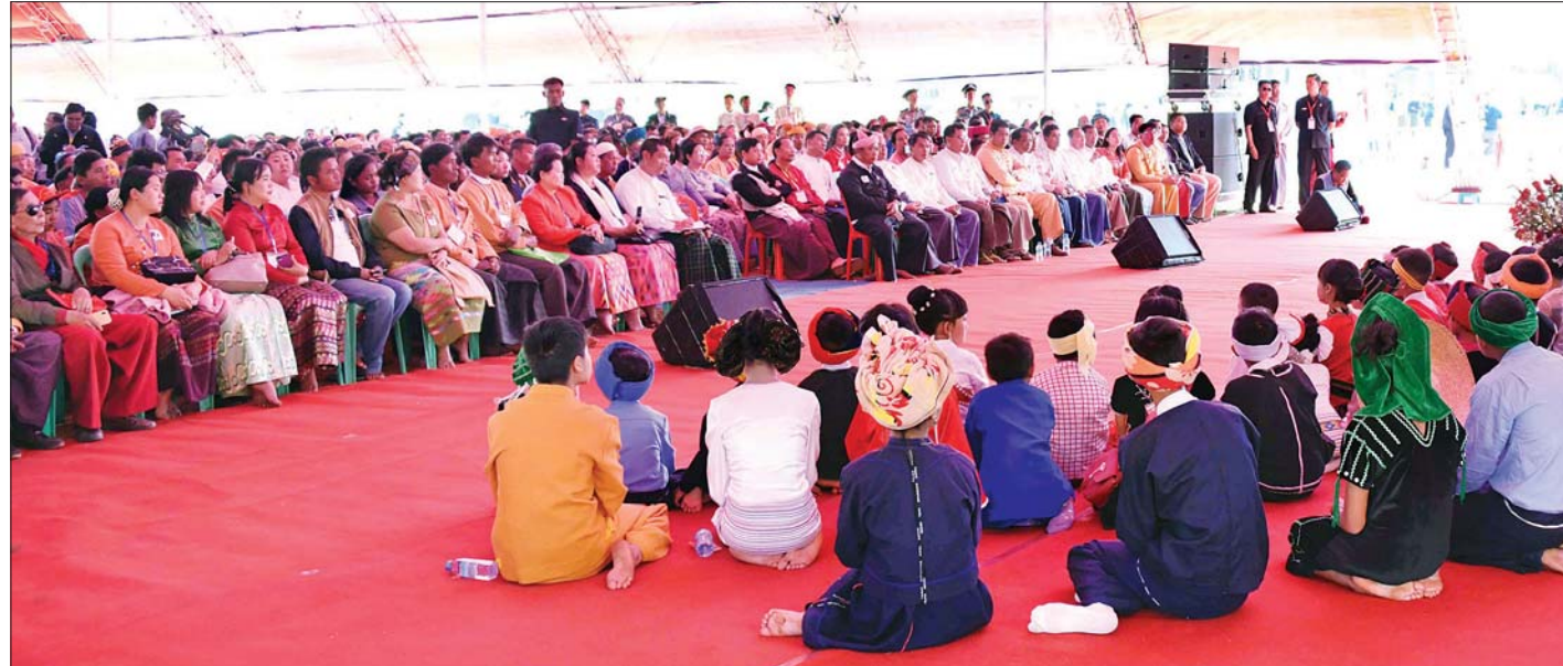
နိုင်ငံတော်၏အတိုင်ပင်ခံပုဂ္ဂိုလ် ဒေါ်အောင်ဆန်းစုကြည် လူထုတွေ့ဆုံပွဲတွင် အမှာစကားပြောကြားစဉ်။ သတင်းစဉ်

စဉ်းစားစရာတွေလည်း အများကြီးတွေ့ခဲ့ရပါတယ်။ ဖေဖေ မိန့်ခွန်းတစ်ခုထဲမှာ ဖတ်ဖူးပါတယ်။