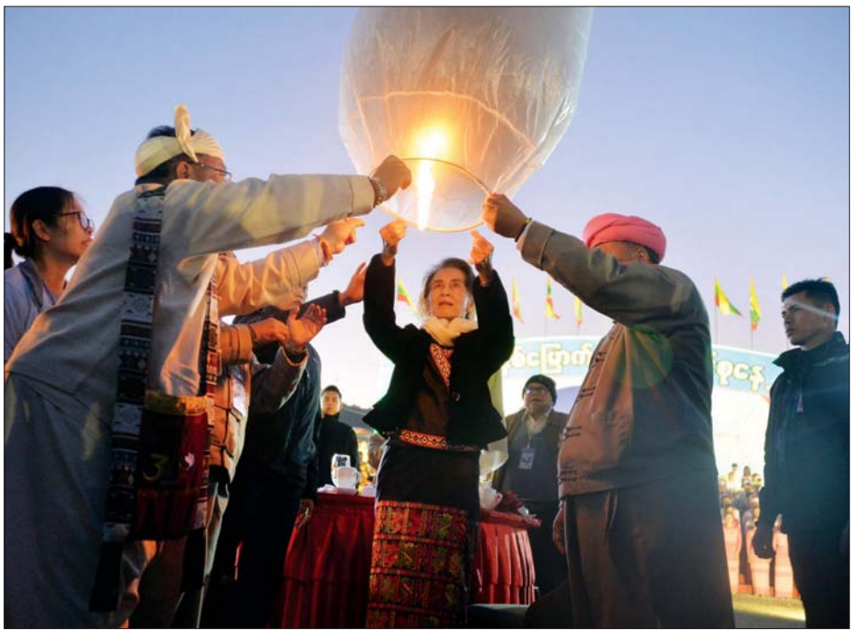
နိုင်ငံတော်၏အတိုင်ပင်ခံပုဂ္ဂိုလ် ဒေါ်အောင်ဆန်းစုကြည် (၂၁)ရာစု စတုတ္ထအကြိမ် ပင်လုံညီလာခံကို ကြိုဆိုသော အားဖြင့် မီးပုံးပျံလွှတ်တင်ပေးစဉ်။