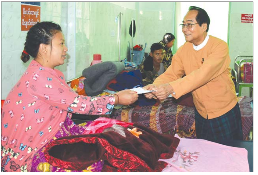
ကချင်ပြည်နယ်ဝန်ကြီးချုပ် ဒေါက်တာခက်အောင် လူနာတစ်ဦးအား ထောက်ပံ့ငွေပေးအပ်စဉ်။