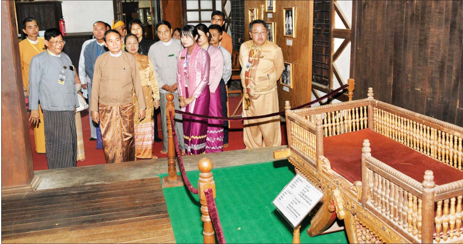
နိုင်ငံတော်သမ္မတ ဦးဝင်းမြင့်နှင့် ဇနီး ဒေါ်ချိုချို၊ ညောင်ရွှေမြို့ရှိ သမိုင်းဝင် ဟော်နန်းပြတိုက်အတွင်း ကြည့်ရှုလေ့လာစဉ်။