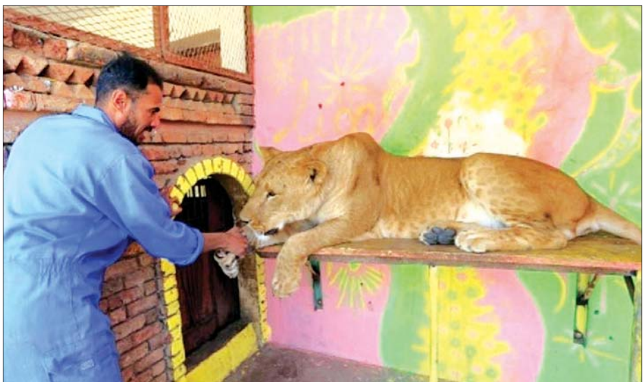
ဆာနားမြို့ တိရစ္ဆာန်ရုံအတွင်းမှ ခြင်္သေ့တစ်ကောင်ကို လေ့ကျင့်ပေးသူနှင့်အတူ တွေ့ရစဉ်။

ဆာနား ဖေဖော်ဝါရီ ၇ ယီမင်နိုင်ငံ၏ ပြည်တွင်းစစ်ကြောင့် အရပ်သားများ သန်းနှင့်ချီ၍ အသက်ရှင်ရပ်တည်နိုင်ရေး ရုန်းကန်နေရသကဲ့သို့ တိုင်းပြည်အတွင်းရှိ တိရစ္ဆာန်ရုံများအတွင်းရှိ ခြင်္သေ့၊ ကျားသစ်၊ ဘာဘွန်များက အစရှိသည့်သတ္တဝါများမှာလည်း မရေရာသည့်အနာဂတ်နှင့် ရင်ဆိုင်နေရသည်။ ၂၀၁၇ ခုနှစ်တွင် ခြင်္သေ့လေးကောင်အပါအဝင် အခြားသော တိရစ္ဆာန်များမှာ အစာငတ်ပြတ်မှုကြောင့် သေဆုံးခဲ့ရသည်။ ခြင်္သေ့များကို အစာကျွေးရန် အစာကျွေးရန်မှာ ကြီးလာသည့်အတွက် ခြင်္သေ့များကို အစာကျွေးနိုင်ရေး ခက်ခဲနေကြောင်း ခြင်္သေ့ထိန်းသိမ်းသူက အေအက်ဖ်စီသို့ ပြောသည်။ ပြည်တွင်းစစ်ဖြစ်ပွားပြီး ငါးနှစ်ကြာလာသည့် နောက်ပိုင်းတွင် တိရစ္ဆာန်ရုံများရှိ တိရစ္ဆာန်ပေါင်း ၁၁၅၉ ခန့်မှာ အစာရေစာငတ်ပြတ်မှု