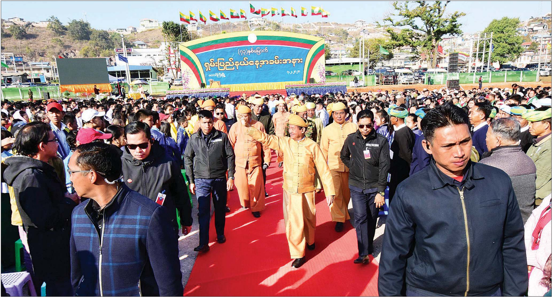
နိုင်ငံတော်သမ္မတ ဦးဝင်းမြင့် (၇၃)နှစ်မြောက် ရှမ်းပြည်နယ်နေ့ အထိမ်းအမှတ် အခမ်းအနားတွင် တက်ရောက်လာကြသည့် ဒေသခံတိုင်းရင်းသားများအား ရင်းရင်းနှီးနှီး လိုက်လံနှုတ်ဆက်စဉ်။ သတင်းစဉ်