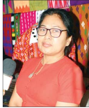
ဒေါ်လေးပျို