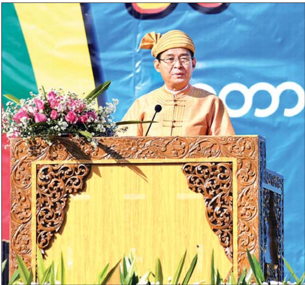
နိုင်ငံတော်သမ္မတ ဦးဝင်းမြင့် (၇၃) နှစ်မြောက် ရှမ်းပြည်နယ်နေ့အခမ်းအနား တွင် နှုတ်ခွန်းဆက်စကား ပြောကြားစဉ်။

“တိုင်းရင်းသား ညီအစ်ကိုမောင်နှမတွေအားလုံး နှစ်ပေါင်းများစွာ လိုလားတောင့်တနေတဲ့ ဒီမိုကရေစီအခွင့်အရေး၊ အခြေခံလူ့အခွင့်အရေး၊ တန်းတူညီမျှရေးနဲ့ ကိုယ်ပိုင်ပြဋ္ဌာန်းခွင့်ရရှိရေး အတွက် အားလုံးသဘောတူ လက်ခံနိုင်တဲ့ ဒီမိုကရေစီဖက်ဒရယ် ပြည်ထောင်စုကြီး ဖြစ်ထွန်း ပေါ်ပေါက်လာဖို့အတွက် နိုင်ငံတစ်ဝန်း လုံးက တိုင်းရင်းသားများက ပူးပေါင်းပါဝင်ကြဖို့ အထူးလိုအပ်”