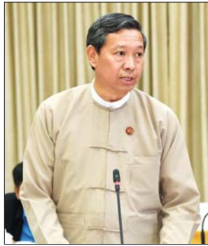
ပြည်ထောင်စုဝန်ကြီး ဒေါက်တာ မျိုးသိမ်းကြီး

ကမ္ဘာ့ဘဏ်အုပ်စု (International Finance Corporation - IFC) က “မြန်မာ့စီးပွားရေးလုပ်ငန်းများ လုပ်ကိုင်ရန်လွယ်ကူမှု လုပ်ငန်းစီမံချက် ၂၀၂၀” ကို “ကာလတို” ၊ “ကာလလတ်” ၊ “ကာလရှည်” သတ်မှတ်ကာ ရေးဆွဲပေးပို့လာပါကြောင်း၊ အဆိုပါ ရေးဆွဲပေးပို့လာသည့် စီမံချက်များအပေါ် သက်ဆိုင်ရာ ညွှန်းကိန်းနယ်ပယ် အဖွဲ့များက ဆောင်ရွက်နိုင်မည့် အခြေအနေများကို ပြင်ဆင်ဖြည့်စွက်ခဲ့ရာ စုစုပေါင်း ၈၁ ချက်ရှိခဲ့ပါကြောင်း၊ အဆိုပါ အချက် ၈၁ ချက်ကို ကာလ