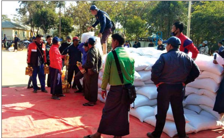
ကုန်တင်ကုန်ချလုပ်သားများအား ဆန်နှင့်ဆီ ထောက်ပံ့ပေးစဉ်။