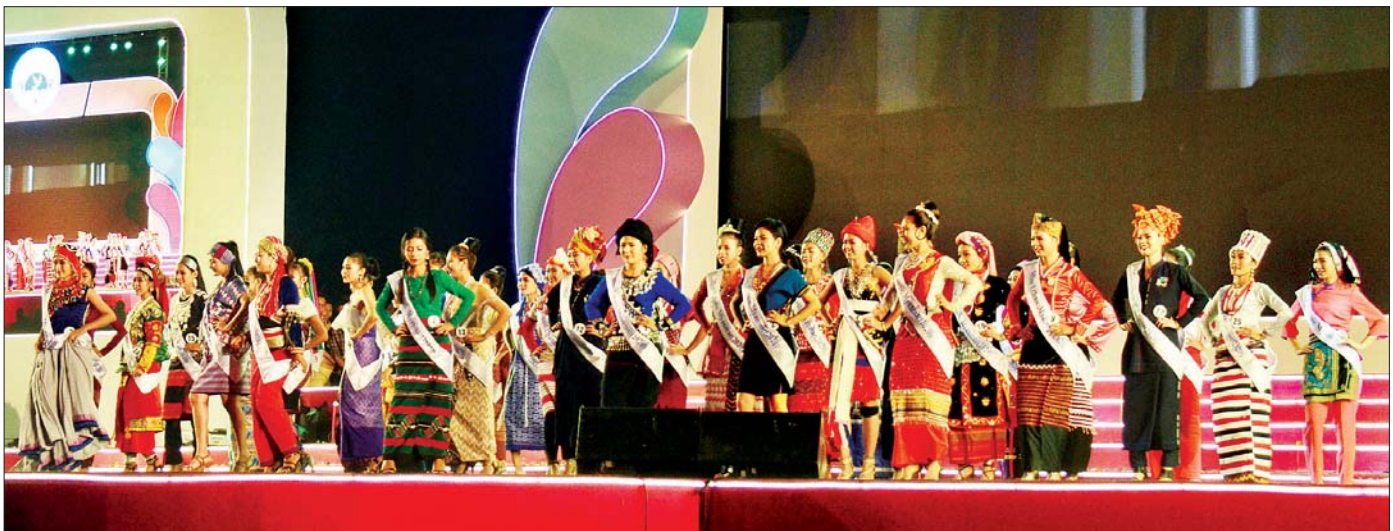
ပါပြီး ကြည့်တတ်ရမယ်သမီး"

"ဒီည ကပွဲကြည့်တဲ့အခါ ကပွဲနဲ့အတူ စီးပျော့လိုက်