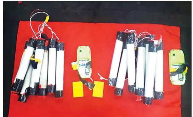
ဘဏ်အတွင်း ထားရှိခဲ့သည့် ဗုံးအတုများကို တွေ့ရစဉ်။

အဆိုပါဖြစ်စဉ်နှင့် ပတ်သက်၍ သက်ဆိုင်ရာ၏ စစ်ဆေးမှုများအရ ဘဏ်ထဲဝင်ထားရှိခဲ့သည့်ဗုံးမှာ အတု ဖြစ်ကြောင်းသိရှိရပြီး သက်ဆိုင်ရာက ကျူးလွန်သူအား အမြန်ဆုံးဖမ်းဆီး ရမိရေးအတွက် ဆောင်ရွက်လျက် ရှိကြောင်း သိရသည်။ သတင်း-ဇော်ကြီး၊ ဓာတ်ပုံ-ဖေဖော်