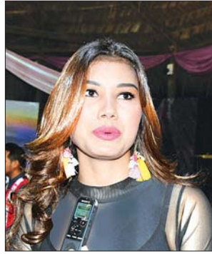
ချမ်းချမ်း(တေးသံရှင်)