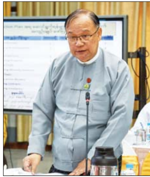
ပြည်ထောင်စုဝန်ကြီး ဦးသန်းစင်မောင်

အနေဖြင့် မြန်မာနိုင်ငံ၏ စီးပွားရေးလုပ်ငန်းများ လုပ်ကိုင်ရန် လွယ်ကူမှုအဆင့်များ တိုးတက်လာစေရေးအတွက် ဝန်ကြီးဌာနများ ပေါင်းစပ်ညှိနှိုင်းပြီး လိုအပ်သည်များ အချိန်နှင့်တစ်ပြေးညီ ချိတ်ဆက်ဆောင်ရွက်နိုင်ရန်အတွက် “စီးပွားရေးလုပ်ငန်းများ လုပ်ကိုင်ရန်လွယ်ကူမှု (Ease of Doing Business) တိုးတက်ရေးလုပ်ငန်းအဖွဲ့” ကို စီးပွားရေးနှင့် ကူးသန်းရောင်းဝယ်ရေးဝန်ကြီးဌာန ဒုတိယဝန်ကြီး ဦးအောင်ထူး ဦးဆောင်၍ ၁၄ ဦးဖြင့် ဖွဲ့စည်းတာဝန်ပေးအပ်ခဲ့ပြီး သတ်မှတ်ထားသည့် လုပ်ငန်းတာဝန်များကို အောင်မြင်အောင် တစ်စိုက်မတ်မတ် ဆောင်ရွက်စေခဲ့ပါကြောင်း၊ အဆိုပါအဖွဲ့၏ လုပ်ငန်းတာဝန်များကို အချိန်နှင့်တစ်ပြေးညီ အောင်မြင်စွာ အကောင်အထည်ဖော်ဆောင်ရွက်နိုင်ရန်အတွက် ညွှန်ကြားမှုနှင့် အထောက်အကူပြုအဖွဲ့ ၁၀ ဖွဲ့ကို ဖွဲ့စည်းဆောင်ရွက်လျက်ရှိပြီး ယခုအခါ လုပ်ငန်းလိုအပ်ချက်အရ အလုပ်သမားခန့်ထားခြင်း စည်းမျဉ်း