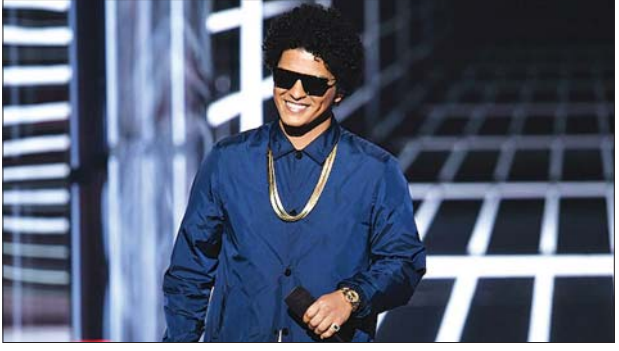
အဆိုတော် ဘရူနိုမားစ်