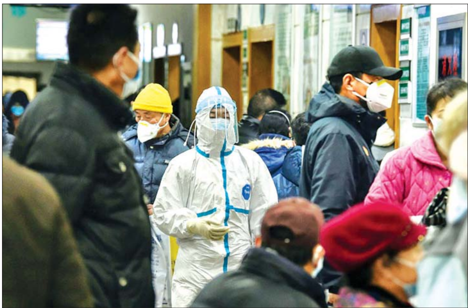
ဂျပန်ဆေးရုံတွင် ရောဂါကာကွယ်ရေးဝတ်စုံဝတ်ဆင်ပြီး အလုပ်လုပ်နေသော ဆေးဝန်ထမ်းတစ်ဦးကို တွေ့ရစဉ်။

ကိုရိုနာဗိုင်းရပ်စ် ကူးစက်ခံရသူပေါင်း ၆၁ ဦး တွေ့ရှိခဲ့သည်။ ကုန်သွယ်ရေးနှင့် လူ့အခွင့်အရေးဆိုင်ရာများကြောင့် တင်းမာနေသည့် အမေရိကန်ပြည်ထောင်စုနှင့် တရုတ်ပြည်သူ့သမ္မတနိုင်ငံတို့မှ သမ္မတများသည် ဖေဖော်ဝါရီ ၇ ရက်က အရေးပေါ်ကျွန်းမာရေးအခြေအနေကို ဖုန်းဖြင့် ဆွေးနွေးခဲ့ကြောင်း သိရသည်။ ကိုရိုနာဗိုင်းရပ်စ် ပြန့်ပွားမှုကို အမေရိကန်ဘက်ကလည်း တုံ့ပြန်ဆောင်ရွက်ရန် တရုတ်သမ္မတရုံးက တိုက်တွန်းပြောကြားခဲ့ကြောင်း ဆင်ယွာသတင်းအေဂျင်စီ၏ သတင်းဖော်ပြချက်အရ သိရသည်။ အမေရိကန်သမ္မတ ဒေါ်နယ်ထရမ်ကလည်း ကိုရိုနာဗိုင်းရပ်စ်ကူးစက်ပျံ့နှံ့မှုကို ကိုင်တွယ်ဖြေရှင်းနိုင်မည်ဟု ယုံကြည်ကြောင်း ပြောကြားခဲ့သည်ဟု အိမ်ဖြူတော်သတင်းအရင်းအမြစ်က ပြောသည်။ ဖေဖော်ဝါရီ ၇ ရက်အစောပိုင်းက အသက် ၃၄နှစ် အရွယ် ဆရာဝန်တစ်ဦး သေဆုံးခဲ့သည့်ကိစ္စနှင့် ပတ်သက်ပြီး အစိုးရ၏ကိုင်တွယ်မှုအပေါ် မကျေနပ်မှုများ ဖြစ်ပေါ်ခဲ့သည်။