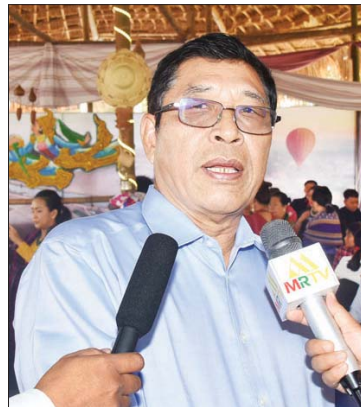
ဦးလှိုင်ခွန်ဆာ