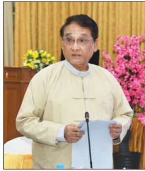
ပြည်ထောင်စုဝန်ကြီး ဒေါက်တာသန်းမြင့်

မြန်မာနိုင်ငံအနေဖြင့် ခိုင်မာသည့် စီးပွားရေးအခြေခံကို တည်ဆောက်နိုင်ရန်အတွက် အရှေ့တောင်အာရှ၊ တောင်အာရှနိုင်ငံများနှင့် ဒေသတွင်းစီးပွားရေးများကို တိုးမြှင့်ဆောင်ရွက်နိုင်ရန် လိုအပ်သကဲ့သို့ ကမ္ဘာ့စီးပွားရေးများကို လည်း ချိတ်ဆက်ဆောင်ရွက်သွားရန်