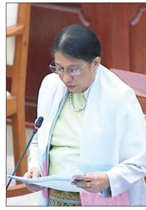
ဒုတိယဝန်ကြီး ဒေါက်တာ မြလေးစိန်