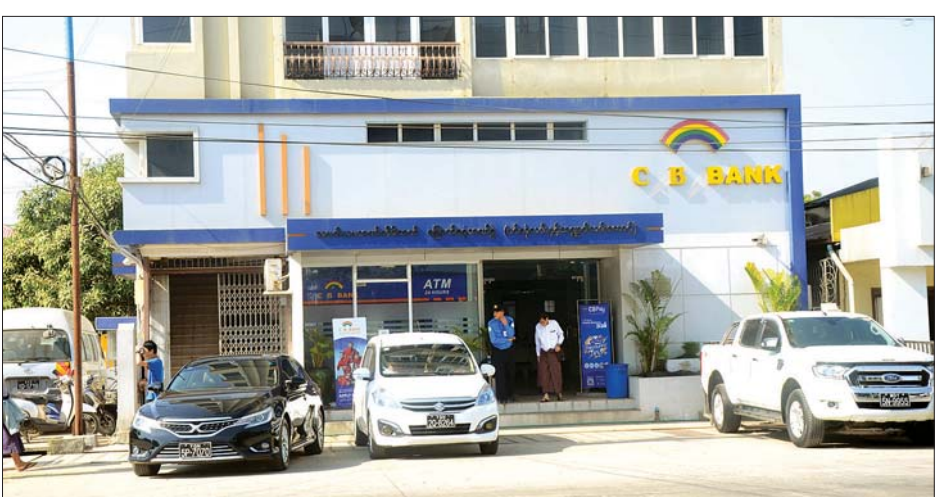
ငွေများခြိမ်းခြောက်လုယူခံခဲ့ရသည့် CB Bank ခွဲ အဆောက်အအုံကို တွေ့ရစဉ်။

ယနေ့နံနက် ၉ နာရီ ၁၅ မိနစ်ခန့် က အဆိုပါဘဏ် လုံခြုံရေးဝန်ထမ်း