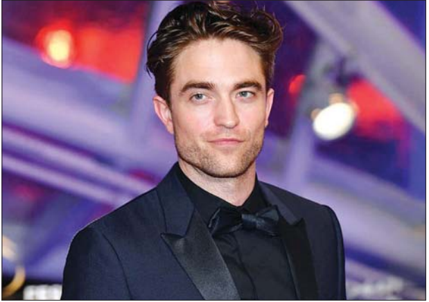
ဟောလိဝုဒ်မင်းသား ရောဘတ်ပတ်တင်ဆန်