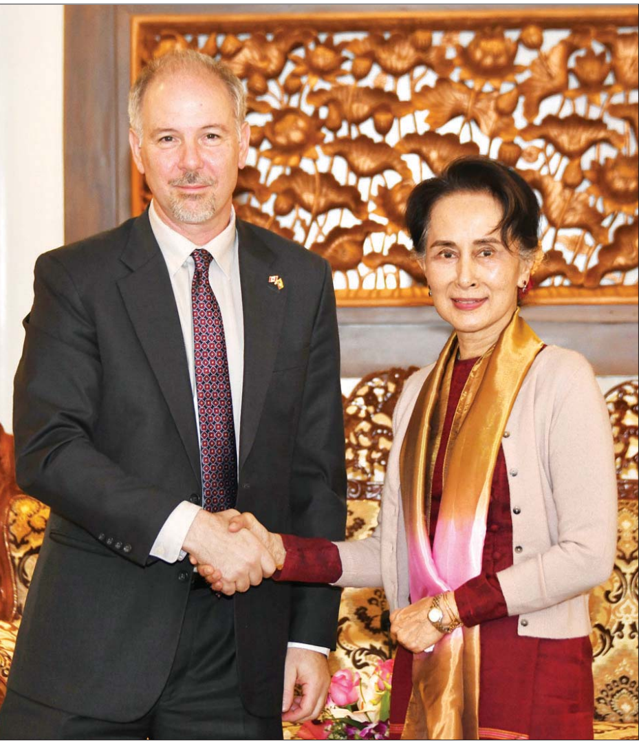
နိုင်ငံတော်၏အတိုင်ပင်ခံပုဂ္ဂိုလ် ဒေါ်အောင်ဆန်းစုကြည် မြန်မာနိုင်ငံဆိုင်ရာ ကနေဒါသံအမတ်ကြီး မစ္စတာ ဖရန်ဆွာ လက်ဖရက်နီးရစ် အား ရင်းရင်းနှီးနှီး နှုတ်ဆက်စဉ်။ သတင်းစဉ်

နေပြည်တော် ဖေဖော်ဝါရီ ၇ နိုင်ငံတော်၏အတိုင်ပင်ခံပုဂ္ဂိုလ်၊ နိုင်ငံခြားရေးဝန်ကြီးဌာန၊ ပြည်ထောင်စုဝန်ကြီး ဒေါ်အောင်ဆန်းစုကြည်သည် မြန်မာနိုင်ငံဆိုင်ရာ ကနေဒါသံအမတ်ကြီး မစ္စတာ ဖရန်ဆွာ လက်ဖရက်နီးရစ် အား ယနေ့နံနက် ၁၀ နာရီတွင် နေပြည်တော်ရှိ နိုင်ငံခြားရေးဝန်ကြီးဌာန၌ လက်ခံတွေ့ဆုံသည်။ တွေ့ဆုံစဉ် မြန်မာ-ကနေဒါ နှစ်နိုင်ငံ ဆက်ဆံရေးနှင့် ပူးပေါင်းဆောင်ရွက်မှုတိုးမြှင့်ရေး ကိစ္စရပ်များ၊ မြန်မာနိုင်ငံ ၏ ဒီမိုကရေစီအသွင်ကူးပြောင်းရေးနှင့် ဖွံ့ဖြိုးတိုးတက်ရေးအတွက် ကနေဒါနိုင်ငံမှ ဆက်လက်ကူညီပေးနိုင်မည့် ကိစ္စရပ် များနှင့်ပတ်သက်၍ ရင်းနှီးပွင့်လင်းစွာ ဆွေးနွေးခဲ့ကြသည်။ သတင်းစဉ်