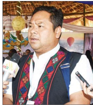
မင်းဗညားဆန်း