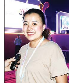
မအိဖြိုးချယ်ရီ