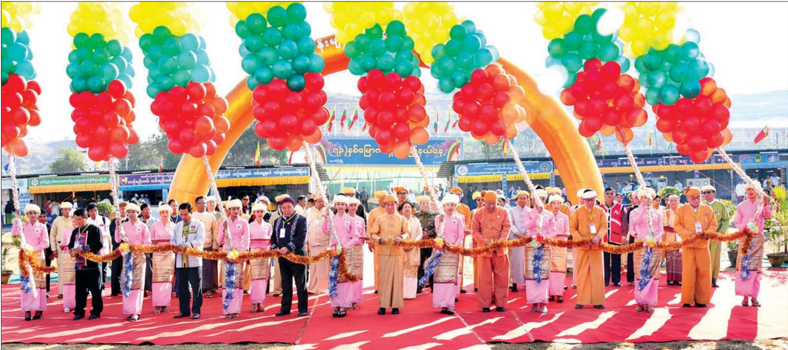
နိုင်ငံတော်သမ္မတ ဦးဝင်းမြင့်၊ ရှမ်းပြည်နယ်ဝန်ကြီးချုပ် ဒေါက်တာလင်းထွဋ်၊ ပြည်နယ်လွှတ်တော်ဥက္ကဋ္ဌ ဦးစိုင်းလုံးဆိုင်နှင့် ပြည်နယ်ဝန်ကြီးများက (၇၃)နှစ်မြောက် ရှမ်းပြည်နယ်နေ့ အထိမ်းအမှတ် တိုင်းရင်းသားရိုးရာယဉ်ကျေးမှုပြခန်းများနှင့် ဌာနဆိုင်ရာပြခန်းများကို ဖဲကြိုးဖြတ်ဖွင့်လှစ်ပေးကြစဉ်။ သတင်းစဉ်

ကျပ် ဆယ်သိန်း လှူဒါန်းသည်။ နေ့ဆွမ်းဆက်ကပ် ထို့နောက် နိုင်ငံတော်သမ္မတနှင့် ဇနီးသည် ရှမ်းပြည်နယ်ဗုဒ္ဓတက္ကသိုလ် တည်ထောင်ဖွင့်လှစ်ခြင်း ၄ နှစ်ပြည့် အထိမ်းအမှတ် ကံ့ကော်ပင်ကို စိုက်ပျိုးပေးကြပြီး ဆရာတော်၊ သံဃာတော်များအား နေ့ဆွမ်း ဆက်ကပ်လှူဒါန်းသည်။ မွန်လွဲပိုင်းတွင် နိုင်ငံတော် သမ္မတနှင့် ဇနီးနှင့် အဖွဲ့သည် တောင်ကြီးမြို့မှ မော်တော်ယာဉ် များဖြင့် ထွက်ခွာရာ ညောင်ရွှေမြို့သို့ ရောက်ရှိကြသည်။ ရှမ်းလင်းတင်ပြ နိုင်ငံတော်သမ္မတအား Inle Princess Resort ဟိုတယ်၌ အင်းသားတိုင်းရင်းသားလူမျိုးရေးရာ ဝန်ကြီး ဒေါက်တာထွန်းလှိုင်၊ သစ်တောဦးစီးဌာန ဒုတိယဥက္ကဋ္ဌကြား ရေးမှူးချုပ် ဦးကျော်ကျော်လှိုင်၊ ပြည်နယ်ဆည်မြောင်းနှင့် ရေအသုံး ချမှု စီမံခန့်ခွဲရေးဦးစီးဌာန ညွှန်ကြား ရေးမှူး ဦးထွန်းထွန်းဦးတို့က အင်းလေးကန် ရေဝေရေလဲဒေသ ထိန်းသိမ်းရေးလုပ်ငန်း ဆောင်ရွက်မှု အခြေအနေ၊ နန်းများဆယ်ယူနေမှုနှင့် နန်းတားဆည်များဖြင့် နန်းလုံချမှု နည်းပါးအောင် ဆောင်ရွက်ထားရှိမှု အခြေအနေတို့နှင့် စပ်လျဉ်း၍ ရှင်းလင်းတင်ပြသည်။ နိုင်ငံတော်၏ ပြယုဂ် နိုင်ငံတော်သမ္မတက တင်ပြ ချက်များနှင့် စပ်လျဉ်း၍ အင်းလေး ကန်သည် ရှမ်းပြည်နယ်နှင့် နိုင်ငံ တော်၏ ပြယုဂ်ဖြစ်ပါကြောင်း၊ အင်းလေးကန်၏ ရေဝပ်ဧရိယာ နှင့် ရေထိန်းသိမ်းနိုင်မှုသည် တဖြည်းဖြည်း လျော့နည်းလာနေ ပါကြောင်း၊ ယင်းစီမံခန့်ခွဲမှုကို ပြည်နယ်အစိုးရ၊ ဌာနဆိုင်ရာများနှင့် စာမျက်နှာ ၅ သို့