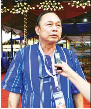
စောမိုးရှေး