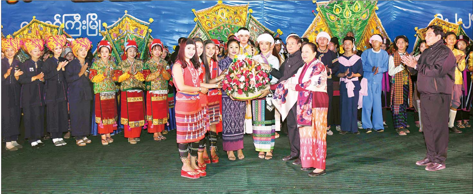
နိုင်ငံတော်သမ္မတ ဦးဝင်းမြင့်နှင့် ဇနီး ဒေါ်ချိုချို (၇၃)နှစ်မြောက် ရှမ်းပြည်နယ်နေ့ ဂုဏ်ပြုဥပဒေအဖွဲ့အစည်း တက်ရောက် ကြပြီး ရိုးရာယဉ်ကျေးမှုအဖွဲ့များအား ဆုငွေများ ပေးအပ်ချီးမြှင့်စဉ်။