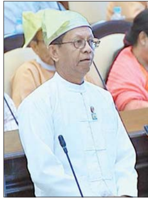
ဒုတိယဝန်ကြီး ဦးသာဦး