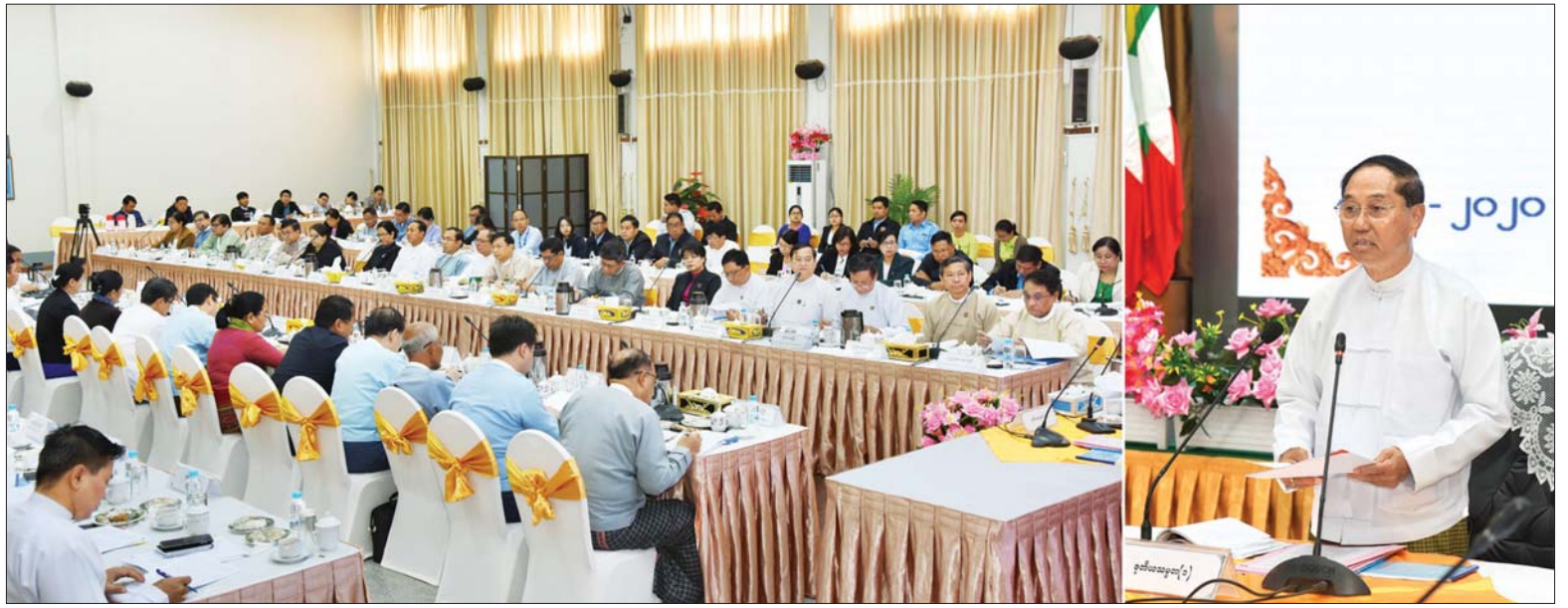
ဒုတိယသမ္မတ ဦးမြင့်ဆွေ ပုဂ္ဂလိကကဏ္ဍ ဖွံ့ဖြိုးတိုးတက်ရေးကော်မတီ၏ (၁၂) ကြိမ်မြောက် အစည်းအဝေးနှင့် စီးပွားရေးလုပ်ငန်းများ လုပ်ကိုင်ရန်လွယ်ကူမှု တိုးတက်ရေးလုပ်ငန်းအဖွဲ့တို့၏ လုပ်ငန်းညှိနှိုင်းအစည်းအဝေးတွင် အမှာစကားပြောကြားစဉ်။ သတင်းစဉ်

နေပြည်တော် ဖေဖော်ဝါရီ ၇ ပုဂ္ဂလိကကဏ္ဍ ဖွံ့ဖြိုးတိုးတက်ရေး ကော်မတီ၏ (၁၂) ကြိမ်မြောက် အစည်းအဝေးနှင့် စီးပွားရေးလုပ်ငန်း များ လုပ်ကိုင်ရန်လွယ်ကူမှု တိုးတက် ရေးလုပ်ငန်းအဖွဲ့တို့၏ လုပ်ငန်း ညှိနှိုင်းအစည်းအဝေးကို ယနေ့နံနက် ၉ နာရီခွဲတွင် နေပြည်တော်ရှိ စီးပွားရေးနှင့် ကူးသန်းရောင်းဝယ်ရေး ဝန်ကြီးဌာန အစည်းအဝေးခန်းမ၌ ကျင်းပရာ ပုဂ္ဂလိကကဏ္ဍ ဖွံ့ဖြိုး တိုးတက်ရေးကော်မတီ ဥက္ကဋ္ဌ ဒုတိယ သမ္မတ ဦးမြင့်ဆွေ တက်ရောက် အမှာစကား ပြောကြားသည်။ အစည်းအဝေးသို့ ပုဂ္ဂလိကကဏ္ဍ ဖွံ့ဖြိုးတိုးတက်ရေးကော်မတီ ဒုတိယ ဥက္ကဋ္ဌ ပြည်ထောင်စုဝန်ကြီး ဒေါက်တာသန်းမြင့်ကော်မတီအဖွဲ့ဝင် ပြည်ထောင်စုဝန်ကြီးများ ဖြစ်ကြ သည့် စာမျက်နှာ ၇ ကော်လံ ၁