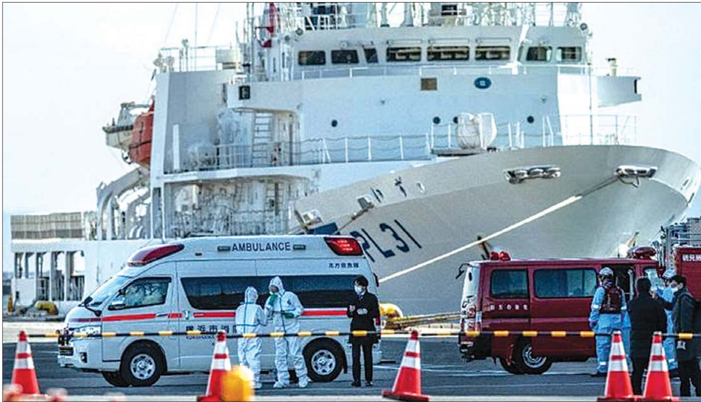
ဗိုင်းရပ်စ်ကူးစက်ခံထားရသည့် သင်္ဘောစီးခရီးသည်အချို့ကို လူနာတင်ယာဉ်များဖြင့် ဆေးရုံသို့ ပို့ဆောင်ရေးဆောင်ရွက်နေစဉ်။

သင်္ဘောပေါ်ကဆင်းသွားတဲ့ ဗိုင်းရပ်စ်ကူးစက်ခံရသူ ခရီးသည်နဲ့ နီးနီးကပ်ကပ်ရှိခဲ့တဲ့သူတွေမှာ ဗိုင်းရပ်စ်ရှိတဲ့