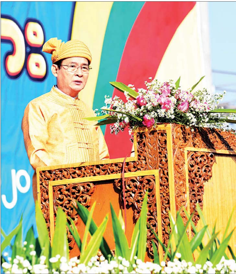
နိုင်ငံတော်သမ္မတ ဦးဝင်းမြင့် (၇၃)နှစ်မြောက် ရှမ်းပြည်နယ်နေ အထိမ်းအမှတ် နှုတ်ခွန်းဆက်အမှာစကား ပြောကြားစဉ်။ သတင်းစဉ်

တောင်ကြီး ဖေဖော်ဝါရီ ၇ (၇၃)နှစ်မြောက် ရှမ်းပြည်နယ်နေ အခမ်းအနားကို ယနေ့နံနက် ၈ နာရီခွဲတွင် တောင်ကြီးမြို့ရှိ အဝေရာ မီးပုံးပျံကွင်း၌ ကျင်းပရာ နိုင်ငံတော်သမ္မတ ဦးဝင်းမြင့်နှင့် ဇနီး ဒေါ်ချိုချိုတို့ တက်ရောက်ချီးမြှင့်သည်။ အခမ်းအနားသို့ ပြည်ထောင်စုဝန်ကြီးများဖြစ်ကြသည့် ဒုတိယဗိုလ်ချုပ်ကြီး ရဲအောင်၊ ဒေါက်တာအောင်သူ၊ ဦးအုန်းဝင်း၊ ဦးဝင်းခိုင်၊ ဦးအုန်းမောင်၊ ရှမ်းပြည်နယ်ဝန်ကြီးချုပ် ဒေါက်တာလင်းထွဋ်၊ ပြည်နယ်လွှတ်တော်ဥက္ကဋ္ဌ ဦးစိုင်းလုံးဆိုင်၊ ပြည်နယ်တရားလွှတ်တော်တရားသူကြီးချုပ် ဦးကြွယ်ကြွယ်၊ အရှေ့ပိုင်းတိုင်းစစ်ဌာနချုပ် တိုင်းမှူး ဗိုလ်ချုပ်လင်းအောင်၊ ပြည်နယ်ဥပဒေချုပ်၊ ပြည်နယ်စာရင်းစစ်ချုပ်၊ စာမျက်နှာ ၄ ကော်လံ ၁ *