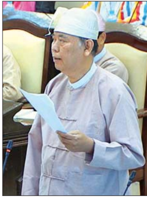
ဒုတိယဝန်ကြီး ဦးဝင်းမော်ထွန်း

ရခိုင်ပြည်နယ် မဲဆန္ဒနယ်အမှတ်(၅)မှ ဦးမြင့်နိုင်၏ ကျောက်တော်မြို့နယ် လိပ်မကျေးရွာ အခြေခံပညာအလယ်တန်းကျောင်း(ခွဲ)နှင့် သင်္ကန်းကျေးရွာ အခြေခံပညာအထက်တန်းကျောင်း(လွန်)ကျောင်းတို့တွင် RC တစ်ထပ်ကျောင်းဆောင် တစ်ဆောင်စီနှင့် ရွာမပြင်ကျေးရွာ အခြေခံပညာအလယ်တန်းကျောင်းတွင် RC နှစ်ထပ်ကျောင်းဆောင်တစ်ဆောင်တို့ကို ၂၀၂၀ - ၂၀၂၁ ဘဏ္ဍာရေးနှစ်တွင် ဆောက်လုပ်ပေးရန် အစီအစဉ် ရှိ/မရှိမေးခွန်းနှင့် စပ်လျဉ်း၍ ဒုတိယဝန်ကြီး ဦးဝင်းမော်ထွန်းက ပညာရေးဝန်ကြီးဌာနအနေဖြင့် ကျောက်တော်မြို့နယ် လိပ်မကျေးရွာ အခြေခံပညာအလယ်တန်းကျောင်း(ခွဲ)တွင် ပေ(၁၂၀ x ၃၀) RC တစ်ထပ်ဆောင်တစ်ဆောင်၊ သင်္ကန်းကျေးရွာ အခြေခံပညာအထက်တန်း(လွန်) ကျောင်းတွင် ပေ(၆၀ x ၃၀) RC တစ်ထပ်ဆောင်အသစ်တစ်ဆောင်၊ ရွာမပြင်