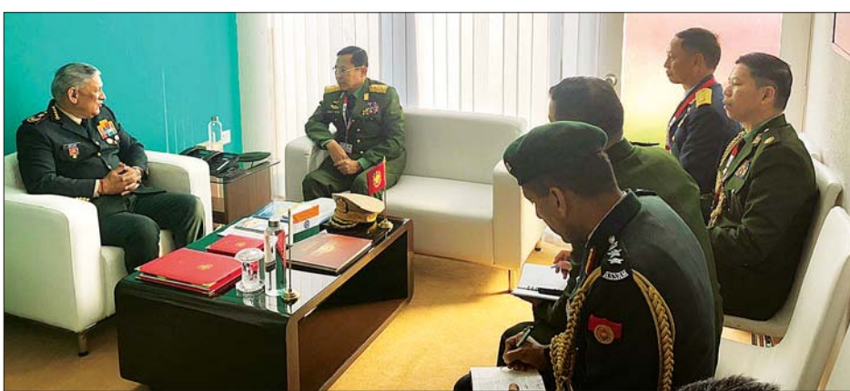
ဒုတိယတပ်မတော်ကာကွယ်ရေးဦးစီးချုပ် ကာကွယ်ရေးဦးစီးချုပ်(ကြည်း) ဒုတိယဗိုလ်ချုပ်မှူးကြီး စိုးဝင်းနှင့် အိန္ဒိယ တပ်မတော်ကာကွယ်ရေးဦးစီးချုပ် ဗိုလ်ချုပ်ကြီး Bipin Rawat တို့ တွေ့ဆုံဆွေးနွေးစဉ်။

ထုတ်လုပ်သည့် အဖွဲ့အစည်းများက ခင်းကျင်းပြသသည့် ကာကွယ်ရေး ပစ္စည်းများ အပါအဝင် ပြည်ပနိုင်ငံ အသီးသီးမှ ပြပွဲတွင် လာရောက် ခင်းကျင်းပြသသည့် ကာကွယ်ရေး ပစ္စည်းများကို လှည့်လည်ကြည့်ရှု သည်။ ယင်းနောက် မြန်မာ့တပ်မတော် ကိုယ်စားလှယ်အဖွဲ့သည် အိန္ဒိယ ကြည်းတပ်၊ အလယ်ပိုင်း တပ်မတော် ကွပ်ကဲမှုဌာနချုပ်၏ သက်သာ ချောင်ချိရေးအရောင်းဆိုင် Canteen ကို သွားရောက်ကြည့်ရှုလေ့လာရာ Canteen ၏ Chairman Colonel AVS Pawan Kumar က လုပ်ငန်းလည်ပတ် ဆောင်ရွက်မှုများနှင့် အရောင်း ဆိုင်ခန်းများကို လိုက်လံရှင်းလင်း ပြသသည်။