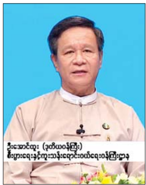
ဦးအောင်ထူး (ဒုတိယဝန်ကြီး)၊ စီးပွားရေးနှင့် ကူးသန်းရောင်းဝယ်ရေးဝန်ကြီးဌာန

အဆိုပါစကားပိုင်းဆွေးနွေးပွဲတွင် မြန်မာ့အသံနှင့် ရုပ်မြင်သံကြားမှ ဦးသုရီနှင့် အစီအစဉ်မှူးအဖြစ် ဆောင်ရွက်ပြီး စီးပွားရေးနှင့် ကူးသန်းရောင်းဝယ်ရေးဝန်ကြီးဌာန ဒုတိယဝန်ကြီး ဦးအောင်ထူး (စီးပွားရေးလုပ်ငန်းများ လုပ်ကိုင်ရလွယ်ကူမှု အထောက်အကူပြုအဖွဲ့ အဖွဲ့ခေါင်းဆောင်)၊ ရင်းနှီးမြှုပ်နှံမှုနှင့် ကုမ္ပဏီများညွှန်ကြားမှုဦးစီးဌာန ညွှန်ကြားရေးမှူးချုပ် ဦးသန်းစင်လွင် (စီးပွားရေးလုပ်ငန်းတစ်ခုစတင်ခြင်း အညွှန်းကိန်းနှင့် အနည်းစုရင်းနှီးမြှုပ်နှံသူ များအား အကာအကွယ်ပေးခြင်း အညွှန်းကိန်းဆိုင်ရာ အထောက်အကူပြုအဖွဲ့ခေါင်းဆောင်)၊ ရန်ကုန်မြို့တော် စည်ပင်သာယာရေးကော်မတီ အတွင်းရေးမှူး ဒေါ်လှိုင်မော်ဦး (ဆောက်လုပ်ခွင့်ရယူခြင်း အညွှန်းကိန်းဆိုင်ရာ အထောက်အကူပြုအဖွဲ့ ခေါင်းဆောင်)နှင့် ပြည်ထောင်စုသမ္မတမြန်မာနိုင်ငံ ကုန်သည်များနှင့် စက်မှုလက်မှုလုပ်ငန်းရှင်များအသင်းချုပ် တွဲဖက်အထွေထွေအတွင်းရေးမှူး ဒေါ်ခိုင်ခိုင်နွယ် (ပုဂ္ဂလိကကဏ္ဍ ကိုယ်စားလှယ်) တို့က ပါဝင်ဆွေးနွေးခဲ့ကြသည်။