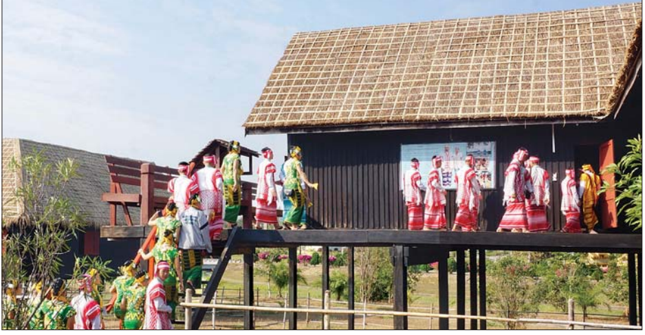
တိုင်းရင်းသားရိုးရာယဉ်ကျေးမှုအဖွဲ့များ အမျိုးသားအထိမ်းအမှတ်ဥယျာဉ် (နေပြည်တော်) ရှိ တိုင်းရင်းသား ရိုးရာနေအိမ်ကို လေ့လာနေကြစဉ်။

သတင်း-ဟန်လင်းနိုင်၊ ဟိန်းမင်းစိုး