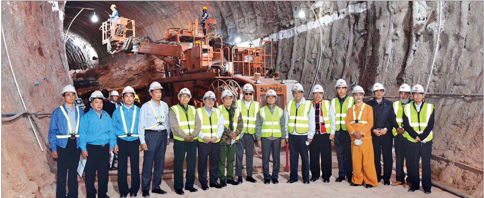
နိုင်ငံတော်သမ္မတ ဦးဝင်းမြင့် ရေသွယ်ဥမင်လိုက်တည်ဆောက်ရေးလုပ်ငန်းခွင်၌ တည်ဆောက်ရေးလုပ်ငန်းဆောင်ရွက်နေသည့် ဝန်ထမ်းများနှင့် စုပေါင်းမှတ်တမ်းတင် ဓာတ်ပုံရိုက်စဉ်။ သတင်းစဉ်

လျှပ်စစ်ဓာတ်အားထုတ်လုပ်ဖြန့်ဖြူးရာတွင် ဒေသခံများအတွက် ဦးစားပေးဆောင်ရွက်ပေးရန်၊ စီမံကိန်းလုပ်ငန်းများအား သတ်မှတ်ကာလအတွင်း အချိန်မီပြီးစီးရေးနှင့် စံချိန်စံညွှန်းပြည့်မီစေရေး၊ ဘဏ္ဍာငွေအလေအလွင့်မရှိစေရေး ကြပ်မတ်ဆောင်ရွက်သွားရန် မှာကြား