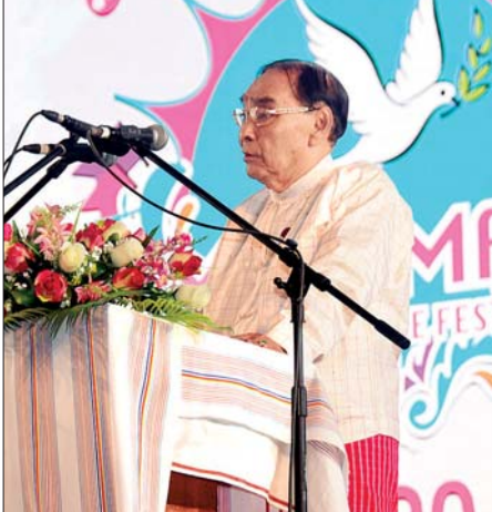
ပြည်ထောင်စုဝန်ကြီး နိုင်သက်လွင် ဂုဏ်ပြုအမှာစကားပြောကြားစဉ်။

များ၊ ရန်ကုန်တိုင်းဒေသကြီး ဝန်ကြီး ချုပ်နှင့် အစိုးရအဖွဲ့ဝန်ကြီးများ၊ လွှတ်တော်ဥက္ကဋ္ဌ၊ တရားသူကြီးချုပ် နှင့် ရန်ကုန်တိုင်းဒေသကြီး အစိုးရ အဖွဲ့ဝန်ကြီးများ၊ ကယားပြည်နယ် လွှတ်တော်ဥက္ကဋ္ဌနှင့် ဒုတိယဝန်ကြီး များ၏ ဇနီးများ၊ မြန်မာနိုင်ငံ တိုင်းရင်းသားလုပ်ငန်းရှင်များ အသင်း ဥက္ကဋ္ဌနှင့်ဇနီး၊ ဒုတိယဥက္ကဋ္ဌနှင့် ဇနီး၊ ကယားတိုင်းရင်းသား လုပ်ငန်းရှင်များ အသင်းဥက္ကဋ္ဌနှင့် လည်းကောင်း၊ ကယားတိုင်းရင်းသားလုပ်ငန်းရှင်များ ၏အလုပ်အမှုဆောင်များ၊ ကိုယ်စားပြု