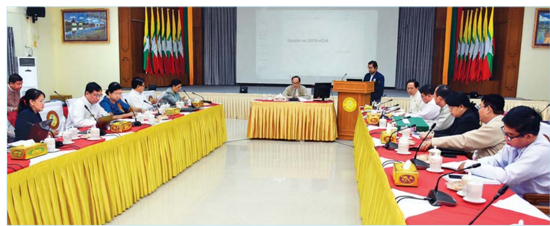
2019 Novel Coronavirus ကြောင့် ဖြစ်ပွားသော လတ်တလော အသက်ရှူလမ်းကြောင်းဆိုင်ရာ ရောဂါစောင့်ကြပ်ကြည့်ရှုရေးနှင့် ကာကွယ်ထိန်းချုပ်ရေးပဟိုအဆင့် နေ့စဉ် ညှိနှိုင်းအစည်းအဝေး (၁၀/၂၀၂၀) ကျင်းပစဉ်။

ရှိနေနိုင်ပါကြောင်း။ ပြည်သူများအနေဖြင့် မိမိတို့၏ ပတ်ဝန်းကျင်တွင် ရောဂါဖြစ်ပွားသည့် နိုင်ငံများမှ လာရောက်သည့် သံသယရောဂါလက္ခဏာရှိသူများကို တွေ့ရှိရပါက နီးစပ်ရာ ကျန်းမာရေးဌာနသို့ ချက်ချင်းအသိပေးအကြောင်းကြားရန် ဖြစ်ပါကြောင်း၊ အလားတူ ဟိုတယ်နှင့် တည်းခိုခန်းဝန်ထမ်းများ အနေဖြင့်လည်း ထိုသို့ သံသယရောဂါလက္ခဏာရှိသူများကို တွေ့ရှိရပါက မဆိုင်မတွဘဲ နီးစပ်ရာ ကျန်းမာရေးဌာနသို့ ချက်ချင်း အသိပေးအကြောင်းကြားရမည် ဖြစ်ပါကြောင်း၊ ဤကဲ့သို့ပြုလုပ်ပါက ရောဂါ သံသယရှိသူများမှတစ်ဆင့် အခြားသူများထံ ကူးစက်မှုနှုန်းကို လျှော့ချနိုင်မည်ဖြစ်ပါကြောင်း။ ကျန်းမာရေးအသိပညာအချက်အလက် ပိုစတာများ မျှဝေ ကျန်းမာရေးဌာနများကလည်း ထိုသို့ သတင်းပေးပို့မှုအပေါ် ချက်ချင်းတုံ့ပြန်ဆောင်ရွက်ရန် ညွှန်ကြားထားပြီး ဖြစ်ပါကြောင်း၊ ရောဂါနှင့် ပတ်သက်သည့် ကျန်းမာရေးအသိပညာ အချက်အလက်များကို လူစည်ကားရာဈေးများ၊ ဘတ်စ်ကားဂိတ်များ၊ ဘတ်စ်ကားများ၊ ဟိုတယ်နှင့် တည်းခိုခန်းများ၊ နိုင်ငံတကာခရီးသွားများ လည်ပတ်ရာနေရာ (tourist attraction site)များ၊