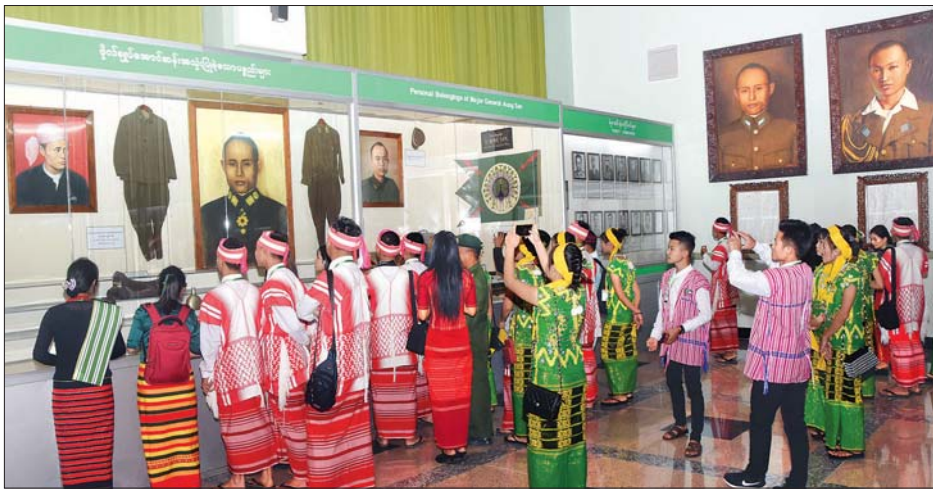
တိုင်းရင်းသားရိုးရာယဉ်ကျေးမှုအဖွဲ့များ တပ်မတော်စစ်သမိုင်းပြတိုက်တွင် လေ့လာနေကြစဉ်။

ကချင်ပြည်နယ် ရိုးရာယဉ်ကျေးမှုအဖွဲ့မှ မကိုင်ဂျာက “ဒီနေ့မှာတော့ အမျိုးသားအထိမ်းအမှတ်ဥယျာဉ်၊ စစ်သမိုင်းပြတိုက်၊ အမျိုးသားပြတိုက်၊ တိရစ္ဆာန်ဥယျာဉ်၊ နက္ခတ်တာရာပြခန်းနဲ့ နေပြည်တော်မြို့မဈေးတို့ကို ကြည့်ရှုလေ့လာခဲ့ပါတယ်။ အခုပထမဆုံးအကြိမ် ရောက်ဖူးတာပါ။ အခုလို တိုင်းရင်းသားပေါင်းစုံနဲ့ လေ့လာခွင့်ရတာ စိတ်ထဲမှာ ပျော်ရွှင်ပီတိဖြစ်မိပါတယ်။ နောက်လည်းအခွင့်ကြုံရင် လာလည်ချင်ပါသေးတယ်။ လိုက်လံပို့ဆောင်ပေးတဲ့