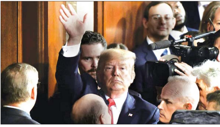
အမေရိကန်သမ္မတ ဒေါ်နယ်ထရမ်။

အဆိုပါတိုက်ခိုက်မှုသည် အိရန်ထောက်ခံသည့် တပ်ဖွဲ့များကို တိုက်ခိုက် ခြင်းဖြစ်ကြောင်း ဗြိတိန်အခြေစိုက် လူ့အခွင့်အရေး စောင့်ကြည့်အဖွဲ့က ပြောကြားခဲ့သည်။