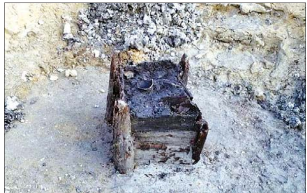
ရှေးအကျဆုံး သစ်သားရေတွင်းကို တွေ့ရစဉ်။

အဲဒီရေတွင်းကို ချက်သမ္မတနိုင်ငံ အော်စတင်မြို့အနီး အဝေးပြေး လမ်းမကြီး ဖောက်လုပ်ရာမှာ တွေ့ရှိခဲ့တာပဲ ဖြစ်ပါတယ်။ ကျောက်ခေတ် နှောင်းပိုင်းကာလ ရေတွင်းတွေကို ချက်သမ္မတနိုင်ငံမှာ တွေ့ရှိခဲ့တာ အခု တစ်ကြိမ်နဲ့ဆိုရင် သုံးကြိမ်ရှိသွားပြီလို့လည်း သိရပါတယ်။