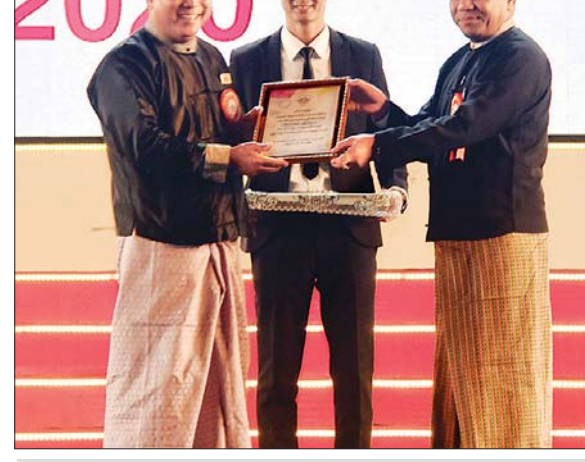
တိုင်းဒေသကြီး ရခိုင်တိုင်းရင်းသားလူမျိုးရေးရာဝန်ကြီး ဦးဇော်အေးမောင် ပွဲတော်အောင်မြင်စွာကျင်းပနိုင်ရေးအတွက် ဝိုင်းဝန်းကူညီပံ့ပိုးပေးခဲ့သည့် အစိုးရအဖွဲ့များကို ဂုဏ်ပြုမှတ်တမ်းလွှာပေးအပ်စဉ်။

ခရီးသွားလုပ်ငန်းအလားအလာ ရှေးဦးစွာ ပြည်ထောင်စုဝန်ကြီး နိုင်သက်လွင်က ဂုဏ်ပြုအမှာစကား ပြောကြားရာတွင် ယခုပွဲတော်မှ “မငြိမ်းချမ်းလို့ မဖြစ်ဘူး” ဆိုသည့် အသံကို မိမိတို့ ထပ်မံကြားသိရပါ ကြောင်း၊ ယခုပွဲတော်မှ အမြောက်သံ ဗုံးသံ၊ သေနတ်သံအစား တိုင်းရင်း သားတေးသံများကို မိမိတို့ ကြားခဲ့ ရပါကြောင်း၊ ရောင်စုံပန်းများ ဖူးပွင့် နေသည့် ပန်းဥယျာဉ်ကြီးဆီသို့ ရောက်ရှိနေသည့်အလား တိုင်းရင်း သားတို့၏ ရိုးရာယဉ်ကျေးမှု ဝတ်စား ဆင်ယင်မှုနှင့် အသုံးအဆောင်ပစ္စည်း တို့ကို တစ်ဝကြီး ကြည့်ရှုခံစားခွင့်ရပါ ကြောင်း၊ မိမိတို့၏ တိုင်းရင်းသားဒေသ