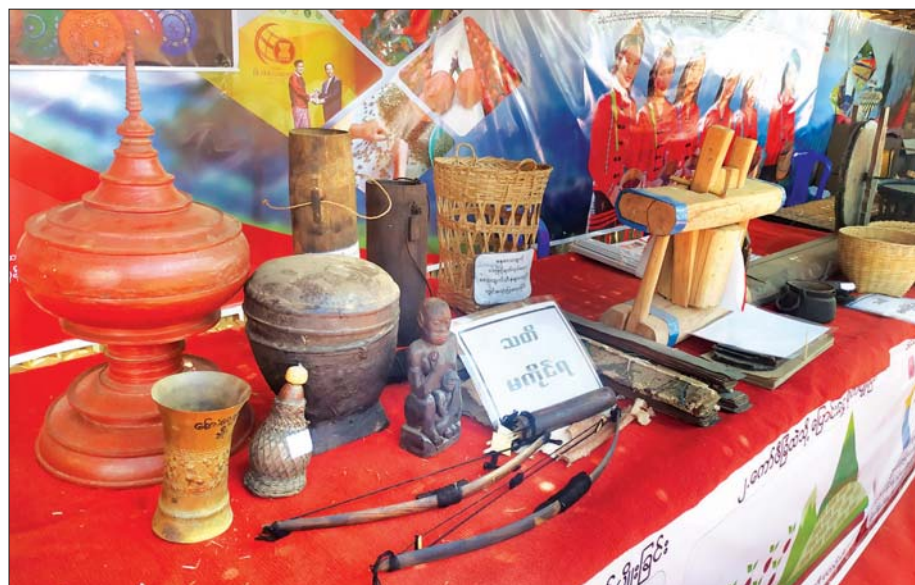
ဇန့်ကိုယ်ပိုင်အုပ်ချုပ်ခွင့်ရဒေသ ရိုးရာယဉ်ကျေးမှုပြခန်း။