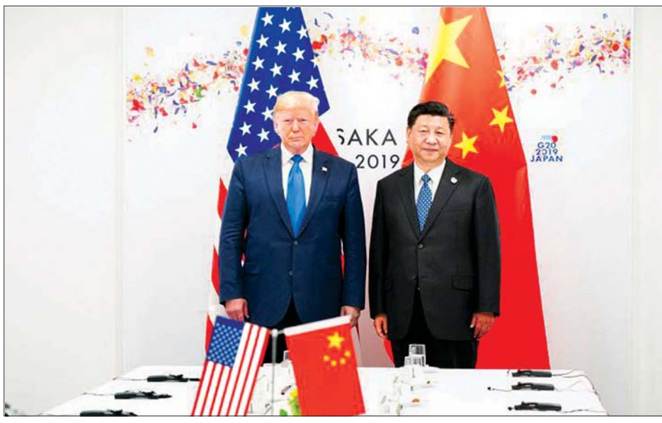
ဂျပန်နိုင်ငံ ဆိုဆာကာမြို့တွင် ကျင်းပခဲ့သော ဂျီ-၂၀ အစည်းအဝေး၏ နှစ်နိုင်ငံသီးသန့်အစည်းအဝေး၌ အမေရိကန် သမ္မတဒေါ်နယ်ထရမ်နှင့် တရုတ်သမ္မတ ရှီကျင့်ဖျင်တို့ကို တွေ့ရစဉ်။

ယခုပြုလုပ်လိုက်သည့် အခွန်လျှော့ချကောက်ခံမှုသည် လွန်ခဲ့သော စက်တင်ဘာလက သွင်းကုန်အမယ်ပေါင်း ၁၇၀၀ ကျော် ပမာဏအပေါ် ၅ ရာခိုင်နှုန်းနှင့် ၁၀ ရာခိုင်နှုန်းစီ အခွန် တိုးမြှင့်ကောက်ခံမှုအပေါ် အကျိုးသက်ရောက်မှု ရှိမည်ဖြစ်ကြောင်း