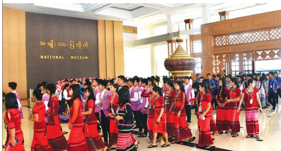
တိုင်းရင်းသားရိုးရာယဉ်ကျေးမှုအဖွဲ့များ အမျိုးသားပြတိုက်၌ လေ့လာနေကြစဉ်။