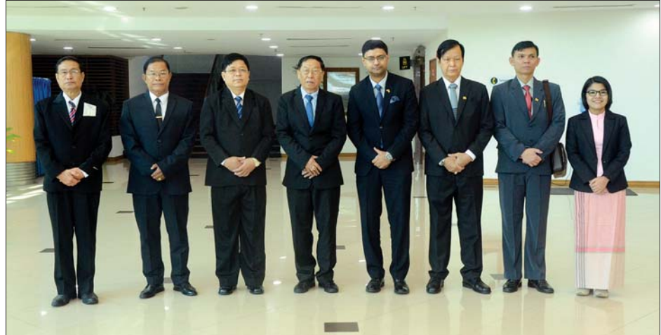
ပြည်ထောင်စုရွေးကောက်ပွဲကော်မရှင်ဥက္ကဋ္ဌ အိန္ဒိယနိုင်ငံသို့ ထွက်ခွာမီ တွေ့ရစဉ်။

●ရှေ့ဖုံးမှ ထိုသို့တွေ့ဆုံစဉ် မြန်မာ - ဆိုင်ရာ နှစ်နိုင်ငံဆက်ဆံရေးနှင့် ပူးပေါင်းဆောင်ရွက်မှု တိုးမြှင့်ရေးကိစ္စရပ်များ၊ မြန်မာနိုင်ငံ၏ ဒီမိုကရေစီအရေး၊ ဖွံ့ဖြိုးတိုးတက်ရေး၊ ငြိမ်းချမ်းရေးနှင့် အမျိုးသားပြန်လည်သင့်မြတ်ရေး လုပ်ငန်းစဉ်ဆိုင်ရာကိစ္စရပ်များ၊ ရခိုင်ပြည်နယ်အရေးကိစ္စအပါအဝင် မြန်မာနိုင်ငံ ရင်ဆိုင်နေရသည့် စိန်ခေါ်မှုများအား ကျော်လွှားနိုင်ရေးအတွက် ရှေ့ဆက်လက်ဆောင်ရွက်မည့်လုပ်ငန်းစဉ်များတွင် ဆွဲအင်နိုင်မှု ကူညီပံ့ပိုးပေးနိုင်မည့်ကိစ္စရပ်များနှင့် ပတ်သက်၍ ဆွေးနွေးအမြင်ချင်းဖလှယ်ခဲ့ကြသည်။