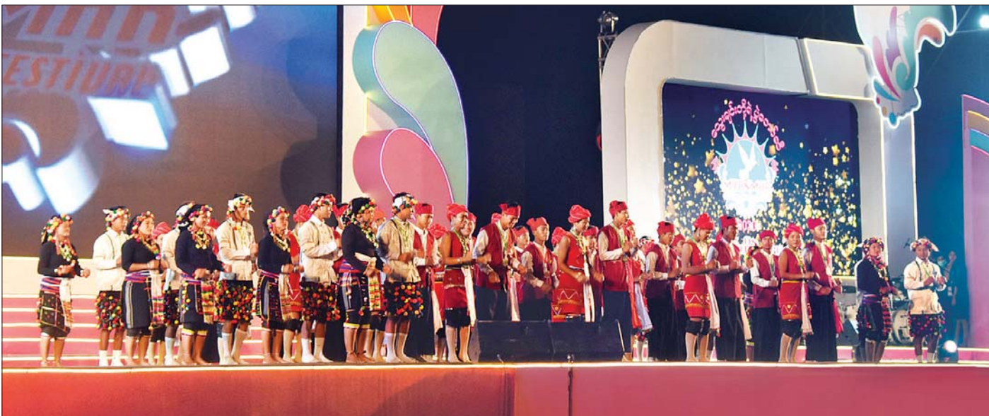
“သွေးချင်းတို့ရဲ့ ပွဲတော်ဆီ” ပွဲတော် ပိတ်ပွဲအခမ်းအနားတွင် ကယားတိုင်းရင်းသားများ ကပြဖျော်ဖြေကြစဉ်။

အခမ်းအနားသို့ ဒုတိယသမ္မတ ဦးဟင်နရီဗန်ထီးယူ ၏ဇနီး ဒေါက်တာရွှေလွမ်း၊ တိုင်းရင်းသားလူမျိုးများရေးရာ ဝန်ကြီးဌာန ပြည်ထောင်စုဝန်ကြီး နိုင်သက်လွင်နှင့်ဇနီး၊ မြန်ကြားရေးဝန်ကြီးဌာန ပြည်ထောင်စုဝန်ကြီး ဒေါက်တာ ဖေမြင့်နှင့် ဇနီး၊ စာမျက်နှာ ၁၃ ကော်လံ ၁ ❖