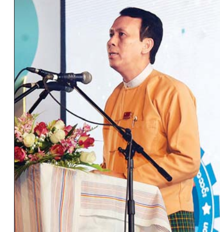
တိုင်းဒေသကြီး ဝန်ကြီးချုပ် ဦးဖြိုးမင်းသိန်း ဂုဏ်ပြုကျေးဇူးတင်စကားပြောကြားစဉ်။