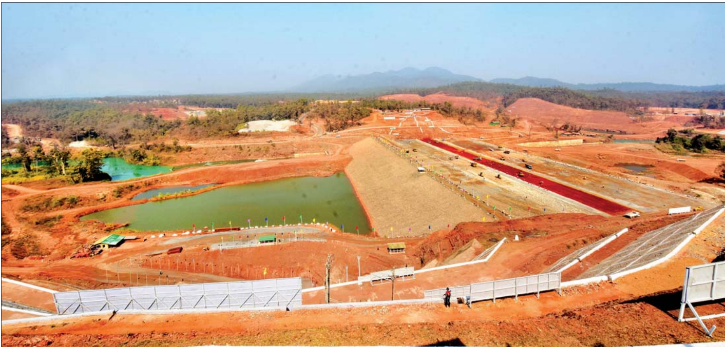
နိုင်ငံတော်သမ္မတ ဦးဝင်းမြင့် အထက်ကျိုင်းတောင်း ရေအားလျှပ်စစ်စီမံကိန်း လုပ်ငန်းခွင်အတွင်း လုပ်ငန်းများဆောင်ရွက်နေမှု အခြေအနေကို ကြည့်ရှုစစ်ဆေးစဉ်။ သတင်းစဉ်

လျှပ်စစ်ဓာတ်အားထုတ်လုပ်ဖြန့်ဖြူးရာတွင် ဒေသခံများအတွက် ဦးစားပေးဆောင်ရွက်ပေးရန်၊ စီမံကိန်းလုပ်ငန်းများအား သတ်မှတ်ကာလအတွင်း အချိန်မီပြီးစီးရေးနှင့် စံချိန်စံညွှန်းပြည့်မီစေရေး၊ ဘဏ္ဍာငွေအလေအလွင့်မရှိစေရေး ကြပ်မတ်ဆောင်ရွက်သွားရန် မှာကြား