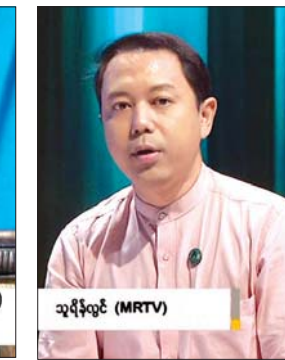
သုရီလွင် (MRTV)

အစီအစဉ်မှူး ။ ။ အခု ဒုတိယပိုင်းမှာ စီးပွားရေးလုပ်ငန်းတွေ လုပ်ကိုင်ရလွယ်ကူမှု အညွှန်းကိန်းတွေမှာ တိုးတက်တဲ့ကဏ္ဍတွေ ရှိသလို မတိုးတက်သေးတဲ့ ကဏ္ဍတွေ ရှိတယ်လို့လည်း သိရပါတယ်။ အဲဒါနဲ့ ပတ်သက်တဲ့ အကြောင်းအရာကို ရှင်းပြ ပေးပါဦးခင်ဗျာ။