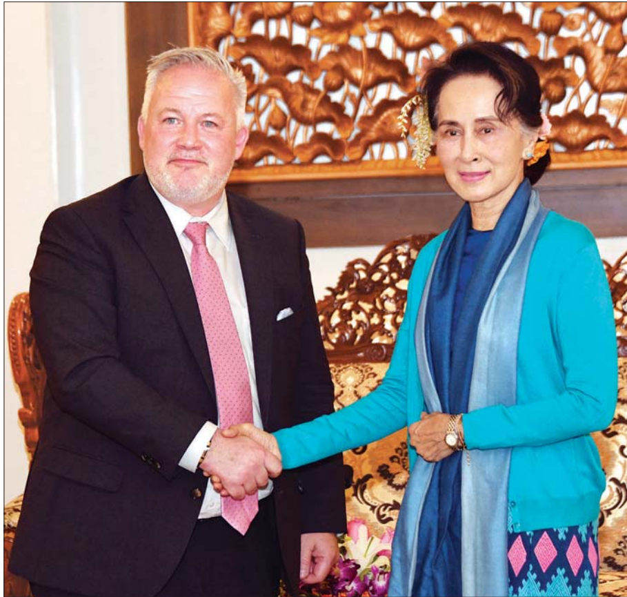
နိုင်ငံတော်၏အတိုင်ပင်ခံပုဂ္ဂိုလ် ဒေါ်အောင်ဆန်းစုကြည် ဆွဲဒင်နိုင်ငံခြားရေးဝန်ကြီးဌာန၏ အထူးကိုယ်စားလှယ် သံအမတ်ကြီး Mr. Kent Harstedt အား ရင်းရင်းနှီးနှီးနှုတ်ဆက်စဉ်။ သတင်းစဉ်