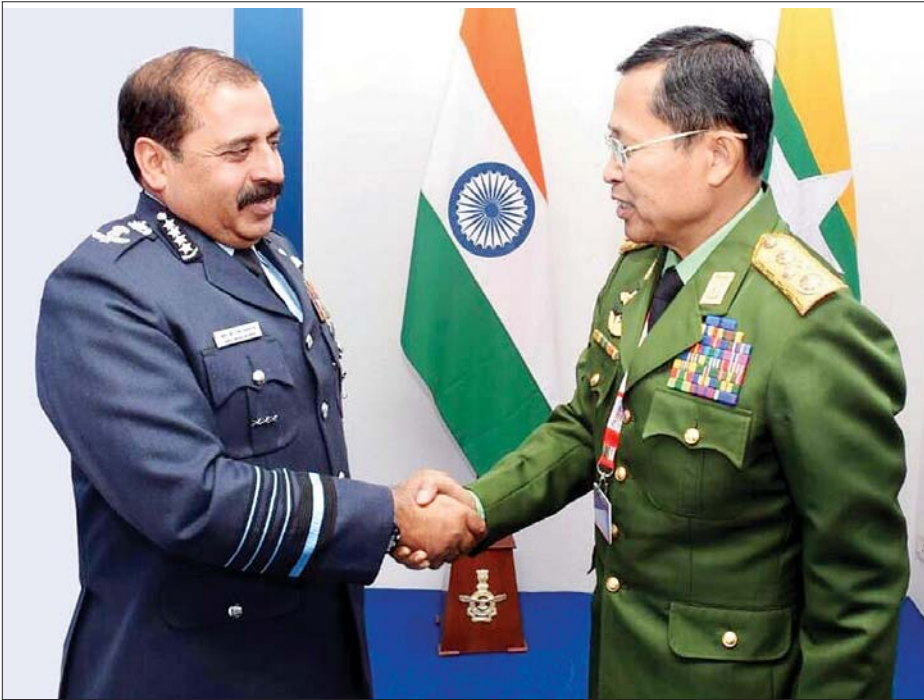
နှစ်ရပ်အကြား ပူးပေါင်းဆောင်ရွက်လျက်ရှိသည့် အခြေ တပ်မတော်ကာကွယ်ရေးဦးစီးချုပ်ရုံး၏ ထုတ်ပြန်ချက်အနေများအား အပြန်အလှန် ဆွေးနွေးခဲ့ကြကြောင်း အရသိရသည်။ သတင်းစဉ်

တွေ့ဆုံစဉ် မြန်မာ့တပ်မတော် (ကြည်း)နှင့် အိန္ဒိယကြည်းတပ်တို့အကြားတွင် ရှိရင်းစွဲ ဆက်ဆံရေး ပိုမိုတိုးတက်ခိုင်မာစေရေးကိစ္စရပ်များနှင့် ကြည်းတပ်နှစ်ရပ်အကြား ဆက်လက်ပူးပေါင်းဆောင်ရွက်နိုင်မည့် အခြေအနေများ၊ နှစ်နိုင်ငံ နယ်စပ်ဒေသလုံခြုံရေး၊ တည်ငြိမ်အေးချမ်းရေးနှင့် ဖွံ့ဖြိုးတိုးတက်ရေးတို့အတွက် တပ်မတော်