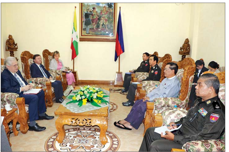
များ၊ မိမိဝန်ကြီးဌာနမှ အကောင်အထည်ဖော် ဆောင်ရွက် နေသည့် e-ID စနစ် အောင်မြင်ရေးအတွက် ဝန်ထမ်းများ အား နည်းပညာဆိုင်ရာ သင်တန်းများ ပံ့ပိုးပေးနိုင်ရေးနှင့် အနာဂတ်တွင် နည်းပညာဆိုင်ရာကဏ္ဍ၌ ပူးပေါင်း ဆောင်ရွက်နိုင်ရေး အခြေအနေများနှင့် စပ်လျဉ်း၍ ရင်းနှီးပွင့်လင်းစွာ အမြင်ချင်းဖလှယ် ဆွေးနွေးခဲ့ကြကြောင်း သိရသည်။