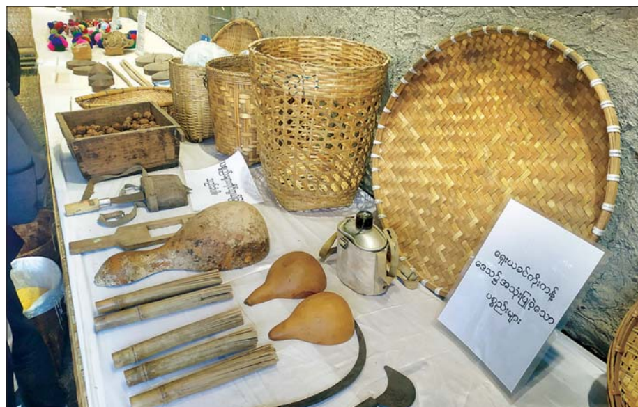
ကိုးကန့်ကိုယ်ပိုင်အုပ်ချုပ်ခွင့်ရဒေသရိုးရာယဉ်ကျေးမှုပြခန်း။