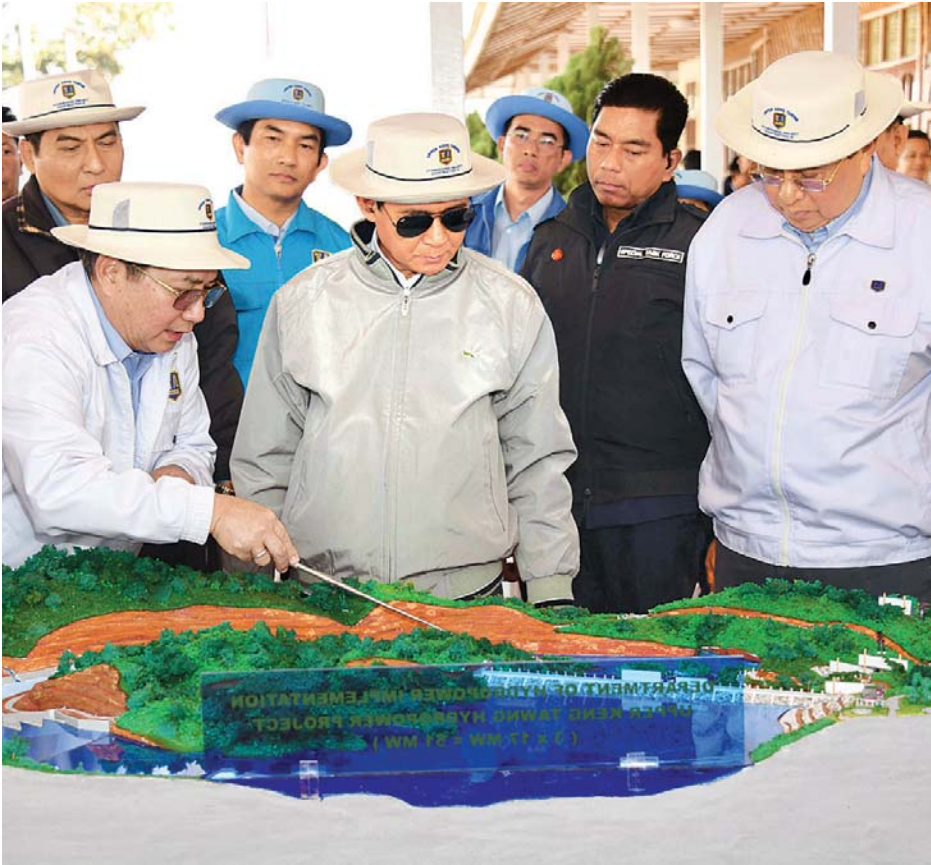
နိုင်ငံတော်သမ္မတ ဦးဝင်းမြင့် အထက်ကျိုင်းတောင်းရေအားလျှပ်စစ်စီမံကိန်းပုံစံငယ်အား ကြည့်ရှုစစ်ဆေးစဉ်။ သတင်းစဉ်

ဂုဏ်ပြုသဝဏ်လွှာပေးပို့ခွင့်ရသည့်အတွက် များစွာဂုဏ်ယူဝမ်းမြောက်မိပါသည်။ ရှေးနှစ်ပေါင်းများစွာကပင် တိုင်းရင်းသားလူမျိုးပေါင်းစုံတို့ ချစ်ကြည်ရင်းနှီးစွာ အတူတကွ နေထိုင်ခဲ့ကြသည့် မြန်မာနိုင်ငံသည် ၁၈၈၅ ခုနှစ်တွင် နိုင်ငံတော်၏ အချုပ်အခြာအာဏာနှင့် လွတ်လပ်ရေးဆုံးရှုံးကာ ဗြိတိသျှကိုလိုနီ လက်အောက်သို့ ကျရောက်ခဲ့ရပါသည်။ သို့ကျွန်ုပ်တို့လိုသော မြန်မာတိုင်းရင်းသားများသည် ဗြိတိသျှတို့အား နည်းအမျိုးမျိုးဖြင့် ဆန့်ကျင်ခဲ့ကြပြီး ဗြိတိသျှတို့ကလည်း တိုင်းရင်းသားအချင်းချင်းစိတ်ဝမ်းကွဲပြားစေရန် တောင်တန်း ဒေသနှင့် ပြည်မကိုခွဲခြားပြီး သွေးခွဲအုပ်ချုပ်ခဲ့ကြပါသည်။ ဒုတိယကမ္ဘာစစ်အပြီးတွင် အမျိုးသားခေါင်းဆောင်ကြီး ဗိုလ်ချုပ်အောင်ဆန်း၏ ဦးဆောင်မှုဖြင့် မြန်မာ့ လွတ်လပ်ရေးအတွက် တစ်မျိုးသားလုံး သွေးစည်းညီညွတ်စွာ ကြိုးပမ်းခဲ့ကြပါသည်။ စာမျက်နှာ ၆ ကော်လံ ၁ □