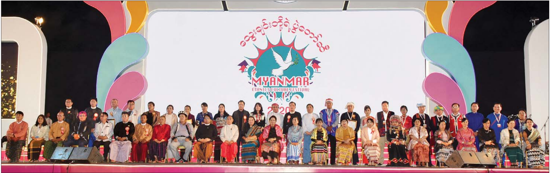
ဒုတိယသမ္မတ ဦးဟင်နရီဗန်ထီးယူ၏ ဇနီး ဒေါက်တာရွှေလွမ်း၊ ပြည်ထောင်စုဝန်ကြီး နိုင်သက်လွင်နှင့် ဇနီး၊ ပြည်ထောင်စုဝန်ကြီး ဒေါက်တာဖေမြင့်နှင့် ဇနီး၊ ပြည်ထောင်စုဝန်ကြီးများ၏ ဇနီးများနှင့် တာဝန်ရှိသူများ “သွေးချင်းတို့ရဲ့ ပွဲတော်ဆီ” ပိတ်ပွဲအခမ်းအနားသို့ တက်ရောက်ကြသူများ စုပေါင်းမှတ်တမ်းတင်ဓာတ်ပုံရိုက်စဉ်။

ကျောပုံးမှ ပြည်ထောင်စုဝန်ကြီးများ၏ ဇနီးများ၊ ရန်ကုန်တိုင်းဒေသကြီး ဝန်ကြီးချုပ် ဦးဖြိုးမင်းသိန်း၊ ရန်ကုန်တိုင်းဒေသကြီးလွှတ်တော်ဥက္ကဋ္ဌ တိုင်းဒေသကြီး ဝန်ကြီးများ၊ တိုင်းဒေသကြီးနှင့် ပြည်နယ်တိုင်းရင်းသားလူမျိုးရေးရာ ဝန်ကြီးများ၊ ကိုယ်ပိုင်အုပ်ချုပ်ခွင့် ရဒေသ/တိုင်းဦးစီးဥက္ကဋ္ဌနှင့် အဖွဲ့ဝင် များ၊ လွှတ်တော်ကိုယ်စားလှယ်များ၊