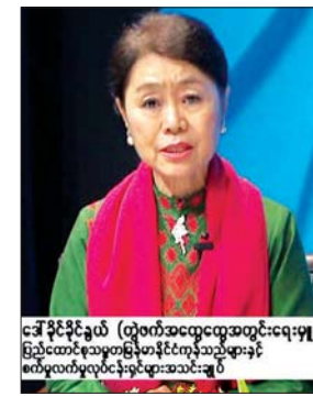
ဒေါ်ခိုင်ခိုင်နွယ် (တွဲဖက်အထွေထွေအတွင်းရေးမှူး)၊ ပြည်ထောင်စုသမ္မတမြန်မာနိုင်ငံတော်အစိုးရအဖွဲ့၊ စက်မှုလက်မှုလုပ်ငန်းနှင့် ကုန်သည်များအသင်းချုပ်