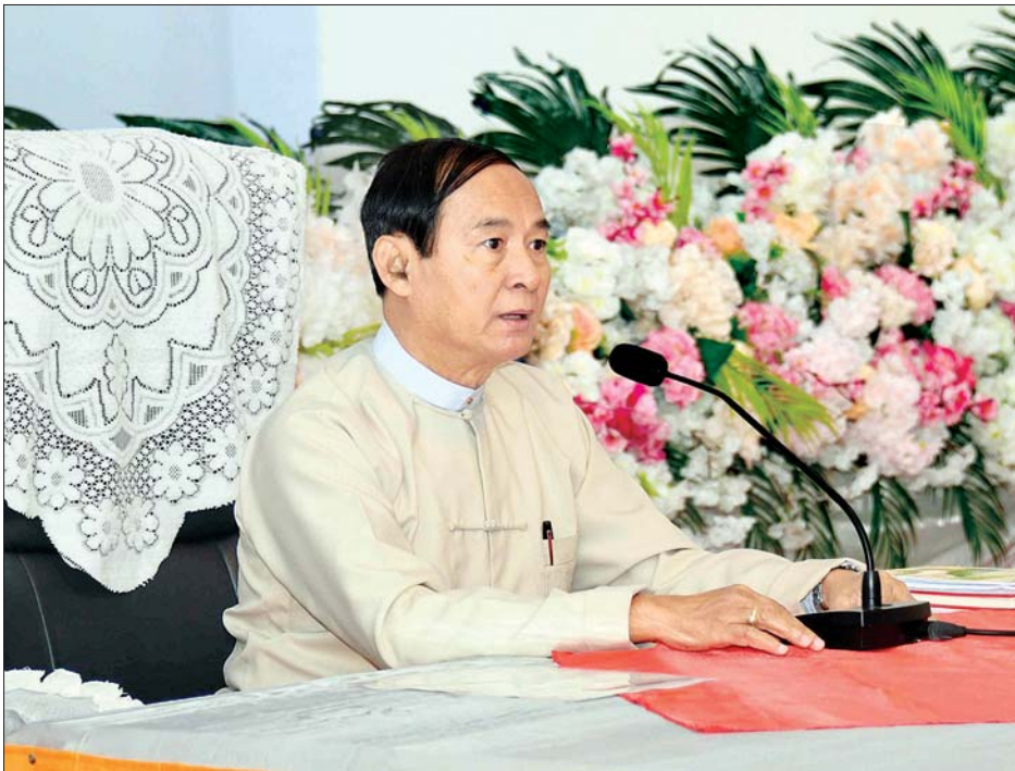
◆ရှေ့ဖုံးမှ

ရှမ်းပြည်နယ်(တောင်ပိုင်း) ဟံဟိုးမြို့သို့ ရောက်ရှိကြသည်။