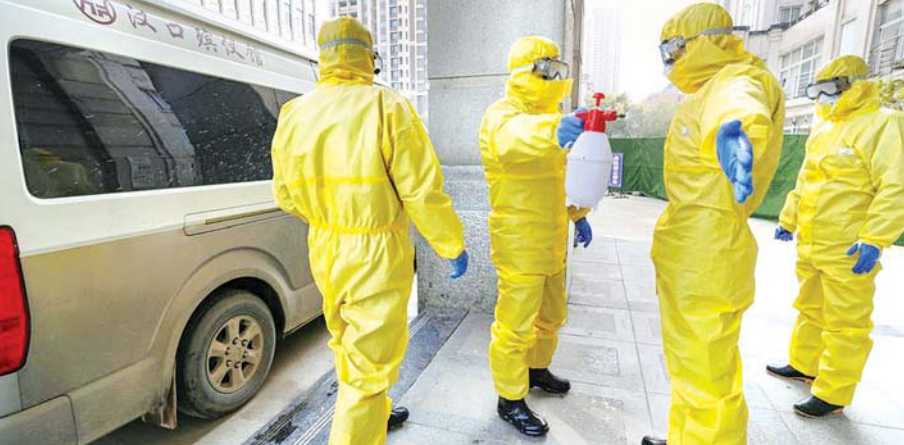
ဆေးဝန်ထမ်းများက ကိုရိုနာဗိုင်းရပ်စ်ဖြစ်ပွားသော လူနာကို ပြောင်းရွှေ့မှုများပြုလုပ်ပြီးနောက် ပိုးသတ်ဆေးများ ဖျန်းပန်းနေစဉ်။

ကုသမှု မရရှိခဲ့ကြောင်းလည်း သတင်း ရရှိသည်။ အင်န်အိတ်ချ်ကေ