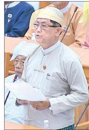
ဦးမောင်မောင်ဝင်း ဒုတိယဝန်ကြီး