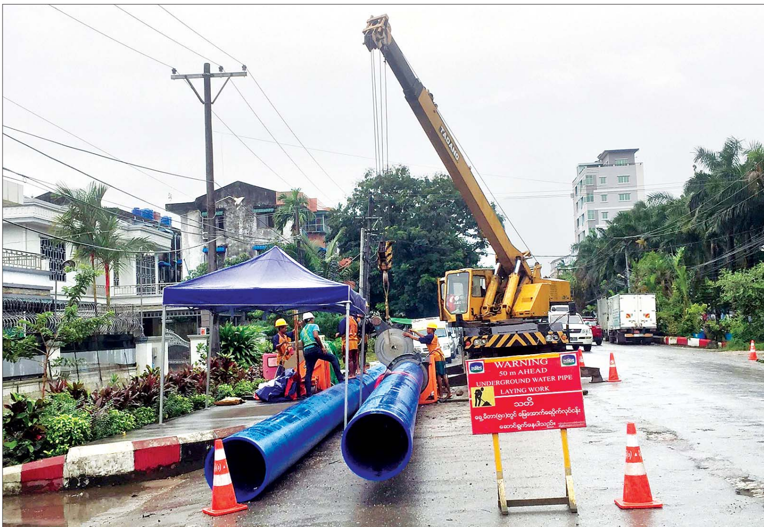
ရန်ကုန်စည်ပင်သာယာနယ်နိမိတ်အတွင်းသောက်သုံးရေရရှိရေးအတွက် ရေပိုက်လှိုင်းကြီးများ သွယ်တန်းနေစဉ်။

ယခုရန်ကုန်မြို့အတွင်း ရေပေးဝေနေသောစနစ်မှာ တိုက်ရိုက်ဖြန့်ဝေမှုစနစ်ဖြစ်ပြီး သက်တမ်းရင့်ပိုက်များနှင့် ရေပေးဝေရာတွင် အသုံးပြုသော ဆက်စပ်ပစ္စည်းများကြောင့် လည်းကောင်း၊ လျှပ်စစ်ရရှိမှုအပေါ် မူတည်၍ လည်းကောင်း၊ ရေပေးဝေမှုပြတ်တောက်ခြင်း၊ ရေဖိအားလျော့နည်းခြင်း၊ ဖြန့်ဝေရာနေရာများ ရှုပ်ထွေးနေခြင်းတို့အပြင် ဇုန်စနစ်မရှိသေးသောကြောင့် ရေလေလွင့်ဆုံးရှုံးမှုကို ထိန်းချုပ်ရန် အခက်အခဲများစွာရှိနေခြင်းဖြစ်သည်။ ရေလေလွင့်ဆုံးရှုံးမှု လျှော့ချနိုင်ရေးအတွက် ရန်ကုန်မြို့တော်စည်ပင်သာယာရေးအနေဖြင့် လည်းကောင်း၊ နိုင်ငံတကာအဖွဲ့