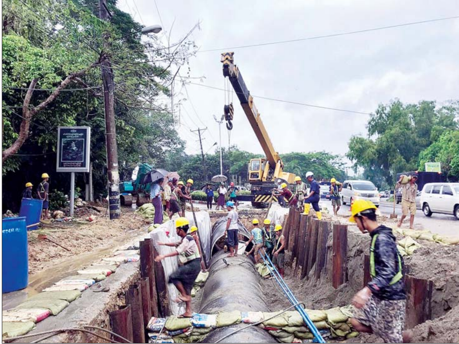
ရန်ကုန်မြို့တွင်း ရေပေးဝေရာတွင် ရေလေလွင့်ဆုံးရှုံးမှုမရှိစေရန် ပိုက်လှိုင်းများ အစားထိုးလဲလှယ်နေမှုကို တွေ့ရစဉ်။