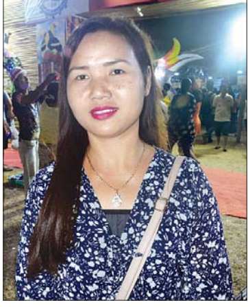
မသိန်းသိန်းအေး သာယာဝတီမြို့နယ်

ရတဲ့အတွက် ဗဟုသုတတွေ အများကြီးရပါတယ်။ တိုင်းရင်းသားတွေကလည်း ဖော်ဖော်ရွေရွေရှိတဲ့အတွက် ညီနောင်တိုင်းရင်းသားတွေနဲ့ ချစ်ချစ်ခင်ခင် ဆုံတွေ့ခွင့်ရတယ်လို့ ယူဆပါတယ်။ ဒီလိုပွဲတွေရှိခြင်းဖြင့် တိုင်းရင်းသား ညီအစ်ကိုမောင်နှမအချင်းချင်း တစ်ဦးနဲ့တစ်ဦး တွေ့ဆုံခင်မင်ရင်းနှီးခွင့်ရသလို တစ်ဦးရဲ့ သဘောထားကို တစ်ဦးက သိခွင့်ရမယ်။ အဲဒီစိတ်ဓာတ်ကို အခြေခံပြီး တိုင်းရင်းသားအားလုံး လိုလားနေတဲ့ စည်းလုံးညီညွတ်မှု ရလဒ်တွေကို ဖော်ဆောင်နိုင်လိမ့်မယ်လို့ မြင်ပါတယ်။