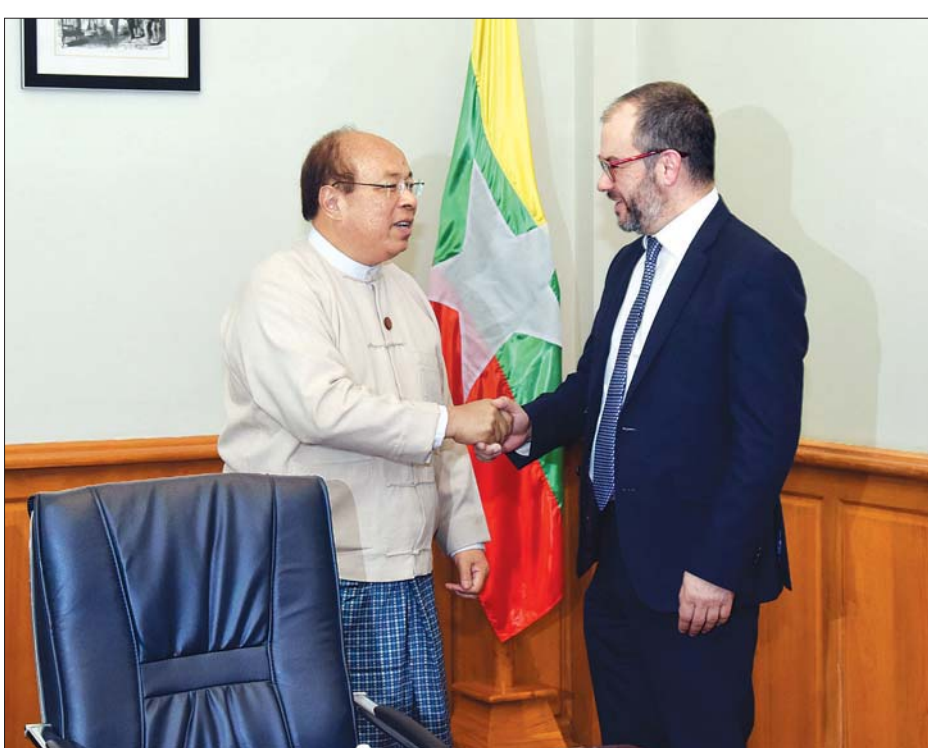
ပြည်ထောင်စုဝန်ကြီး ဦးသောင်းထွန်း ဗြိတိန်နိုင်ငံ ဝန်ကြီးချုပ်၏ မြန်မာနိုင်ငံ၊ ထိုင်းနိုင်ငံနှင့် ဘရူနိုင်းနိုင်ငံဆိုင်ရာ ကုန်သွယ်ရေး ကိုယ်စားလှယ် Mr. Paul Scully MP အား ရင်းနှီးနှီးနှုတ်ဆက်စဉ်။ သတင်းစဉ်

နေပြည်တော် ဖေဖော်ဝါရီ ၄ ရင်းနှီးမြုပ်နှံမှုနှင့် နိုင်ငံခြားစီးပွားဆက်သွယ်ရေးဝန်ကြီးဌာန ပြည်ထောင်စု ဝန်ကြီး ဦးသောင်းထွန်းသည် ဗြိတိန်နိုင်ငံ ဝန်ကြီးချုပ်၏ မြန်မာနိုင်ငံ၊ ထိုင်းနိုင်ငံနှင့် ဘရူနိုင်းနိုင်ငံဆိုင်ရာ ကုန်သွယ်ရေးကိုယ်စားလှယ် Mr. Paul Scully MP ကို ယနေ့ ဝမ်းလွဲ ၁ နာရီတွင် နေပြည်တော်ရှိ ရင်းနှီးမြုပ်နှံမှုနှင့် နိုင်ငံခြားစီးပွားဆက်သွယ်ရေးဝန်ကြီးဌာန၌ လက်ခံတွေ့ဆုံသည်။ ဆွေးနွေး တွေ့ဆုံစဉ် နှစ်နိုင်ငံအကြား ပညာရေး၊ ကျန်းမာရေး၊ ကုန်သွယ်ရေး၊ ရင်းနှီးမြုပ်နှံမှုနှင့် လူမှုစီးပွားဖွံ့ဖြိုးတိုးတက်ရေးကိစ္စရပ်များနှင့် စပ်လျဉ်း၍ ဆွေးနွေးကြသည်။ သတင်းစဉ်