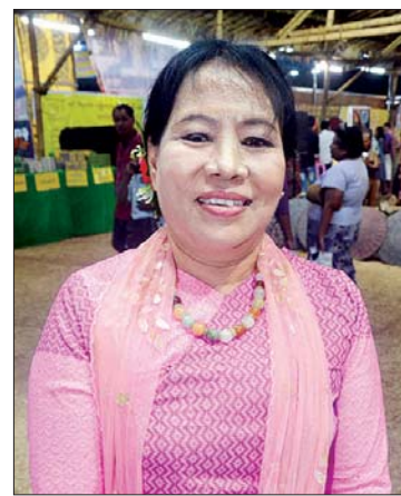
ဒေါ်စန်းရီ ထားဝယ်မြို့မှ ထားဝယ်တိုင်းရင်းသား

ရောက်ဖြစ်ပါတယ်။ တိုင်းရင်းသားအစုံလာတာကြောင့် ကိုယ်မသိသေးတဲ့ တိုင်းရင်းသား မျိုးနွယ်စုတွေနဲ့ ရိုးရာဓလေ့တွေကို သိခွင့်ရပါတယ်။ တစ်နေရာတည်းမှာ အားလုံးကို တွေ့မြင်နိုင်တဲ့အတွက် လူမျိုးစုတစ်စုနဲ့ တစ်စုတည်းမဟုတ်ဘဲ ကွဲပြားမှုတွေကိုလည်း သိရမယ်။ အဲဒီကတစ်ဆင့် တစ်ဦးနဲ့တစ်ဦးနားလည်မှုရှိလာမယ်။ ချစ်ကြည်ရင်းနှီးမှုတွေ