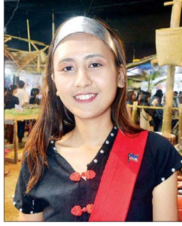
ယုတိုင်ဆီန်း “ဝ” တိုင်းရင်းသား

တစ်ဦးအနေနဲ့ ကိုယ့်ရိုးရာအကတွေနဲ့ ပါဝင်ဖျော်ဖြေခွင့်ရတဲ့အတွက် ဂုဏ်ယူမိပါတယ်။ တိုင်းရင်းသားတွေရဲ့ ယဉ်ကျေးမှုတွေကို လေ့လာခွင့်ရတဲ့အတွက် ဗဟုသုတတွေ အများကြီးရပါတယ်။ ယဉ်ကျေးမှုတွေကလည်း တိုင်းရင်းသားတစ်မျိုးနဲ့တစ်မျိုး ဆင်တူတာတွေကိုလည်း တွေ့ရပါတယ်။ တိုင်းရင်းသားလူမျိုးစုတွေ အချင်းချင်းဆက်နွယ်မှုတွေ ရှိနေတာဆိုတာမျိုး တွေ့ရပါတယ်။ ဒီပွဲတော်ကြီးဟာ တိုင်းရင်းသားတွေရဲ့ ယဉ်ကျေးမှုတွေ ဖလှယ်တဲ့နေရာဖြစ်သလို တိုင်းရင်းသားအချင်းချင်း ချစ်ခင်မှုကို ပြခွင့်ရ