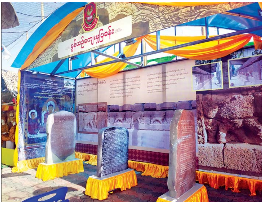
မွန်ယဉ်ကျေးမှုပြခန်း။

မွန်ဘုရင်မကြီး ရှင်စောပုနှင့် စာမ္မာဒေဝီ ဘုရင်မ မွန်ဘုရင်မကြီးရှင်စောပုနှင့် ဘုရင်မကြီး စာမ္မာဒေဝီ တို့၏ ရုပ်တုများကလည်း ပြခန်းအတွင်း ကျက်သရေ မက်လာရုံစွာဖြင့် တင့်တယ်စွာ နေရာယူလျက်ရှိသည်။ “ဒီမွန်ဘုရင်မ ရှင်စောပုရဲ့ ဝတ်စုံတွေ မတိုင်းတော့ အားလုံးက အင်္ဂလန်မှာရှိတဲ့ မတိုင်းတော့ ပုံတူယူပြီး ပြသ ထားတာဖြစ်ပါတယ်။ ဒီဘက်က စာမ္မာဒေဝီကတော့ ထိုင်းနိုင်ငံမှာရှိတဲ့ ကျောက်ရုပ်ကို ဒီမိုင်းပြန်ယူထားတာ ပါ။ တကယ်က စာမ္မာဒေဝီ နန်းစိုက်ခဲ့တဲ့မြို့က အခုဆို