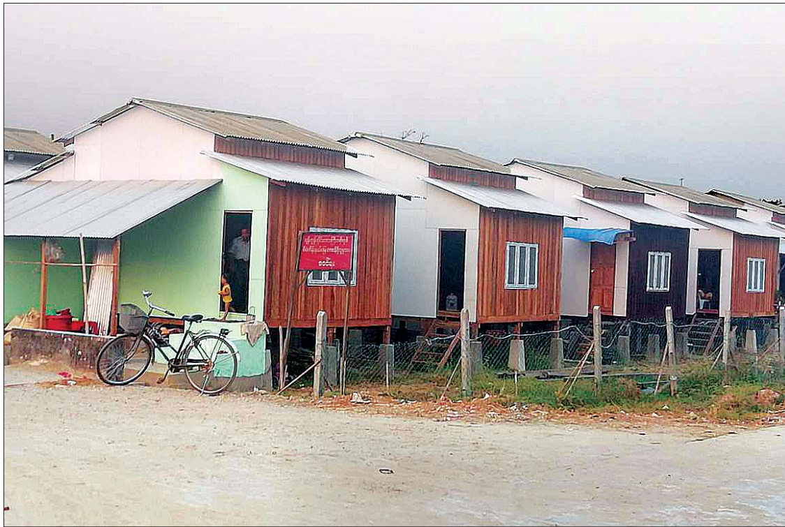
ရွှေပြည်သာမြို့နယ်၌ တည်ဆောက်ထားသည့် တန်ဖိုးနည်းအိမ်ရာများ။

ရွှေပြည်သာမြို့နယ်တွင် ပထမအသုတ်အဖြစ် ၂၆၄ လုံး တည်ဆောက်ပြီးစီး၍ နေရာများချထားပေးခဲ့ပြီး ဖြစ်သည်။ ဤစီမံကိန်းကို ရန်ကုန်တိုင်းဒေသကြီးအစိုးရအဖွဲ့က မြေနေရာများ ဖော်ထုတ်ပေးရာ ချေးငွေအပိုင်းနှင့် ပတ်သက်၍ ပျံ့မေ့အိမ်လူမှုဖွံ့ဖြိုးတိုးတက်ရေးအသင်း (အင်းစိန်)က တာဝန်ယူ ဆောင်ရွက်ပေးခဲ့ခြင်းဖြစ်သည်ဟု သိရသည်။