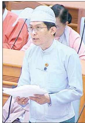
ဒေါက်တာထွန်းနိုင် ဒုတိယဝန်ကြီး