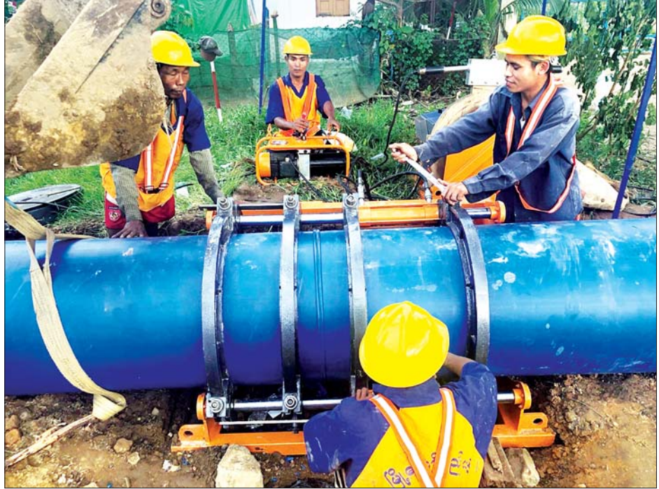
ရန်ကုန်မြို့တွင်း ရေပေးဝေရာတွင် ရေလေလွင့်ဆုံးရှုံးမှုမရှိစေရန် ပိုက်လှိုင်းကြီးများ သွယ်တန်းနေမှုကို တွေ့ရစဉ်။