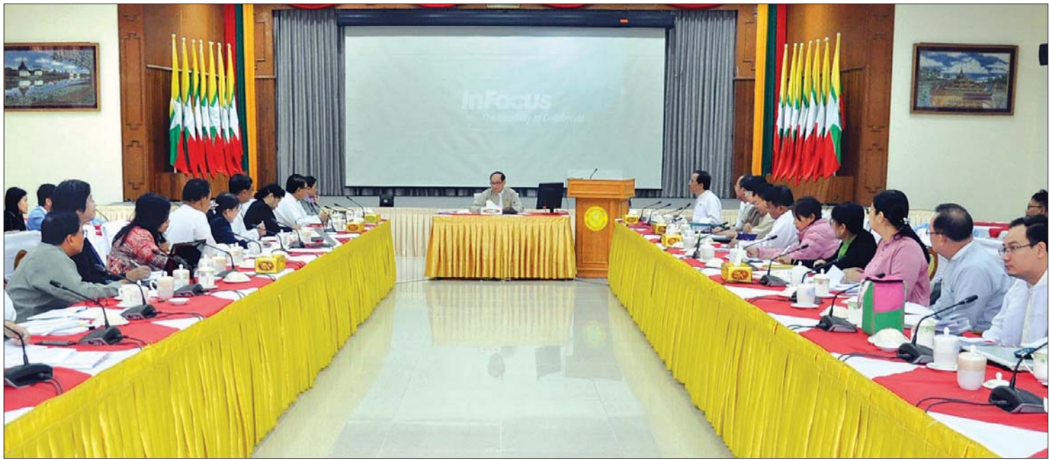
2019 Novel Coronavirus ကြောင့်ဖြစ်ပွားသော လတ်တလောအသက်ရှူလမ်းကြောင်းဆိုင်ရာ ရောဂါစောင့်ကြပ်ကြည့်ရှုရေးနှင့် ကာကွယ်ထိန်းချုပ်ရေးပဟိုအဆင့် နေ့စဉ်ညှိနှိုင်းအစည်းအဝေး (၈/၂၀၂၀) ကျင်းပစဉ်။

အစည်းအဝေးတွင် ကမ္ဘာ့ကျန်းမာရေးအဖွဲ့ဌာနချုပ်မှ နောက်ဆုံးထုတ်ပြန်ချက်များ၊ နိုင်ငံတကာပညာရှင်များမှ ကွန်ပျူတာအသုံးပြုမှုမှန်းတွက်ချက်ခြင်းဖြင့် တွက်ချက်ထားသောရောဂါဖြစ်ပွားသူတစ်ဦးထံမှ အခြားသူများထံ ကူးစက်ပြန့်ပွားနိုင်မှုအခြေခံနှုန်းတန်ဖိုး မြင့်မားနေမှု၊ တရုတ်ပြည်သူ့သမ္မတနိုင်ငံနှင့် အခြားနိုင်ငံများမှ 2019 Novel Coronavirus ရောဂါပိုးကြောင့်ဖြစ်ပွားသော လတ်တလော အသက်ရှူလမ်းကြောင်းဆိုင်ရာ ရောဂါကုသုံးသစ်များ စမ်းသပ်နေမှု၊ တရုတ်ပြည်သူ့သမ္မတနိုင်ငံနှင့် ကမ္ဘာတစ်ဝန်းတွင် ရောဂါကူးစက်ပျံ့နှံ့မှုဆိုင်ရာ ဝန်ကြီးဌာနပညာရှင်များ၏ ကူးစက်ရောဂါဗေဒထုထုထုမှ အသေးစိတ်သုံးသပ်ချက်များနှင့် ရောဂါကုသမှုဆိုင်ရာအတွက် ကုသရေးရှုထောင့်မှ သုံးသပ်ချက်များ၊ ရောဂါစောင့်ကြပ်ကြည့်ရှုခြင်းကို အရှိန်အဟုန်ဖြင့် ဆောင်ရွက်ခြင်း၊ သံသယလူနာများအား စောစီးစွာထောက်လှမ်းခြင်း၊ သံသယလူနာ/အတည်ပြုလူနာများအား အခြားသူများနှင့် မထိတွေ့စေဘဲ သီးခြားခန်းတွင် ထားရှိကုသမှုပေးခြင်း၊ သံသယလူနာ/လူနာနှင့် အနီးကပ်ထိတွေ့ဆက်ဆံမှုများကို ထောက်လှမ်း၍ ရောဂါစောင့်ကြပ်ကြည့်ရှုခြင်း၊ ရောဂါထပ်မံပျံ့နှံ့မှုကို ကာကွယ်ထိန်းချုပ်ခြင်းနှင့် ကမ္ဘာ့ကျန်းမာရေးအဖွဲ့နှင့် သတင်းအချက်အလက်များ အပြန်အလှန်ဝေမျှခြင်းတို့ကို လုပ်ဆောင်နေမှု။