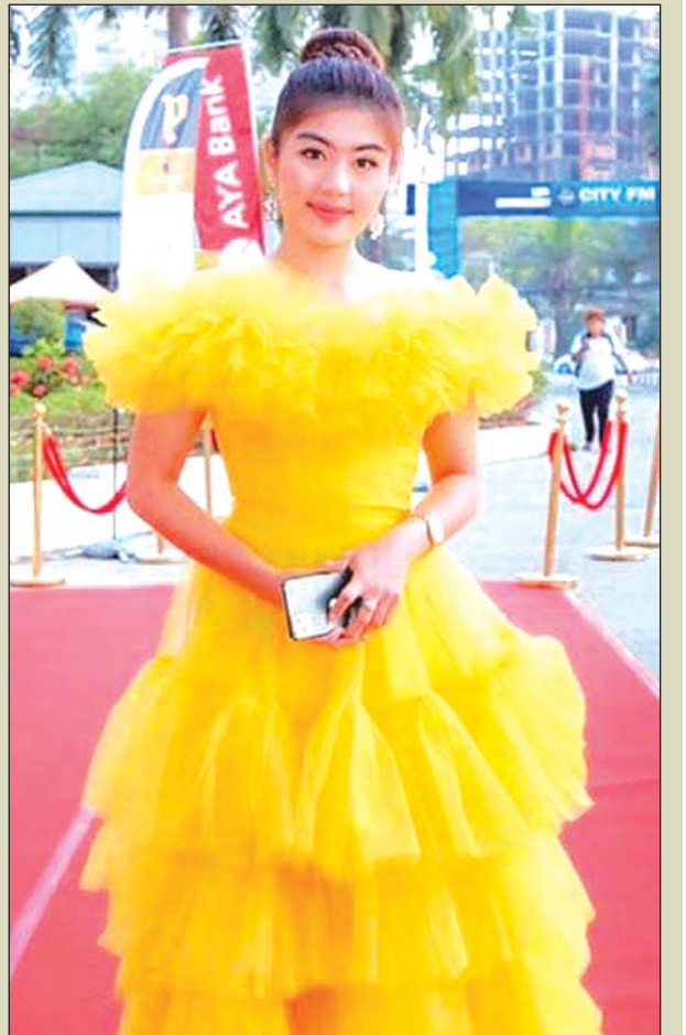
Actress Shwe Myint in a yellow dress on a red carpet.

ဆိုတာကအစ စိုးပြည့်ကလည်း ဆိုတတ်တဲ့အပြင် သရုပ်ဆောင်တာတွေကိုလည်း ဒါရိုက်တာက သေချာ သင်ကြားပေးခဲ့ပါတယ်"ဟု စိုးပြည့်သဇင်က ဆက်လက်ပြောကြားခဲ့သည်။ ကိုလင်း