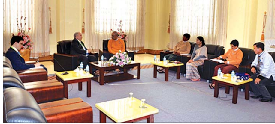
အမျိုးသားလွှတ်တော် နိုင်ငံတကာဆက်ဆံရေး၊ လွှတ်တော်ချင်း ချစ်ကြည်ရေးနှင့် ပူးပေါင်းဆောင်ရွက်ရေး ကော်မတီနှင့် ရန်ကုန်မြို့၊ တူရကီနိုင်ငံသံရုံးမှ သံအမတ်ကြီး မစ္စတာ ခရစ်ဒီဗန်လယ်ဆိုလူ ဦးဆောင်သော ကိုယ်စားလှယ်အဖွဲ့တို့ တွေ့ဆုံဆွေးနွေးစဉ်။