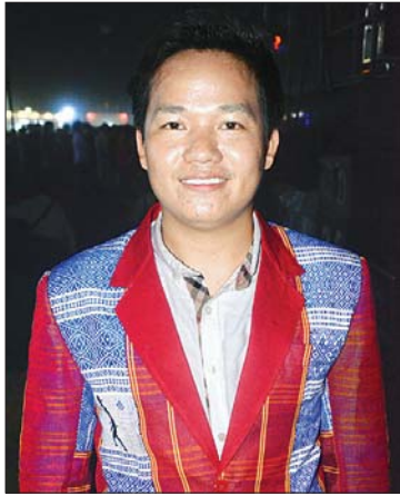
ဂျိမ်းယာကုပ် ချင်းမျိုးနွယ်စု၊ မြို့(ခေါ်) ခမီတိုင်းရင်းသား

ချင်းတိုင်းရင်းသားတို့ရဲ့ ရိုးရာအကတွေနဲ့ လာရောက်ဖျော်ဖြေတာပါ။ ကိုယ့်လူမျိုးရဲ့ ရိုးရာအကတွေကို ပြသခွင့်ရတဲ့အတွက် ဂုဏ်ယူပါတယ်။ ဒီပွဲတော်ကနေ တိုင်းရင်းသားအချင်းချင်း ရင်းနှီးမှုတွေရပါတယ်။ တစ်ဦးနဲ့ တစ်ဦး လေးစားယုံကြည်မှုတွေ ပိုရှိလာပါတယ်။ တိုင်းရင်းသားတွေရဲ့ ရိုးရာဓလေ့တွေကို ချပြခွင့်ရတဲ့အတွက် ထူးခြားတဲ့ ပွဲတော်တစ်ခုဖြစ်ပါတယ်။ ကျွန်တော်တို့ မသိသေးတဲ့ တိုင်းရင်းသားတွေနဲ့ ရိုးရာယဉ်ကျေးမှုတွေကိုလည်း သိခွင့်ရလာပါတယ်။ တိုင်းရင်းသား တွေအားလုံး တစ်စုတစ်စည်းတည်း ချစ်ချစ်ခင်ခင်ရင်းနှီးနှီးနဲ့ တွေ့ရတာ အင်မတန်ကြည်နူးဖို့ ကောင်းပါတယ်။