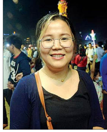
မခိုင်သဉ္ဇာအေး သာယာဝတီမြို့နယ်

တစ်ဦးအနေနဲ့ ဂုဏ်ယူပါတယ်။ ဒီပွဲတော်ကြီးကနေ တိုင်းရင်းသားတွေရဲ့ ရိုးရာယဉ်ကျေးမှုတွေကို သိခွင့်ရတာဟာ တန်ဖိုးဖြတ်လို့ မရနိုင်ပါဘူး။ အရောင်းပြခန်းတွေကလည်း တိုင်းရင်းသား ဒေသအလိုက်ထွက်ရှိတဲ့ အသီးအနှံနဲ့ ကုန်ပစ္စည်းတွေကို ရောင်းချပေးနေတဲ့အတွက် တိုင်းရင်းသားလူမျိုးစုတွေနဲ့အတူ ဒေသထွက်ကုန်တွေကို ပူးတွဲပြီး သိရှိခွင့်ရပါတယ်။ တိုင်းရင်းသားအချင်းချင်း အပြန်အလှန် လေ့လာခွင့်ရတဲ့ ပွဲတော်ကြီးပါ။