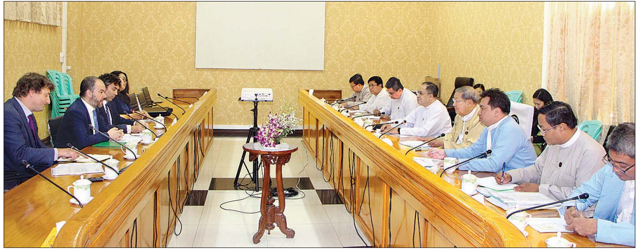
ပြည်ထောင်စုဝန်ကြီး ဦးစိုးဝင်း ဗြိတိန်နိုင်ငံဝန်ကြီးချုပ်၏ မြန်မာနိုင်ငံ၊ ထိုင်းနိုင်ငံနှင့် ဘရူနိုင်းနိုင်ငံဆိုင်ရာ ကုန်သွယ်ရေးကိုယ်စားလှယ် Mr. Paul Scully MP အား လက်ခံတွေ့ဆုံစဉ်။