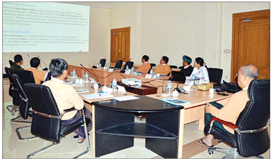
အမျိုးသားလွှတ်တော် နိုင်ငံတကာဆက်ဆံရေး၊ လွှတ်တော်ချင်း ချစ်ကြည်ရေးနှင့် ပူးပေါင်းဆောင်ရွက်ရေးကော်မတီအစည်းအဝေး ကျင်းပနေစဉ်။