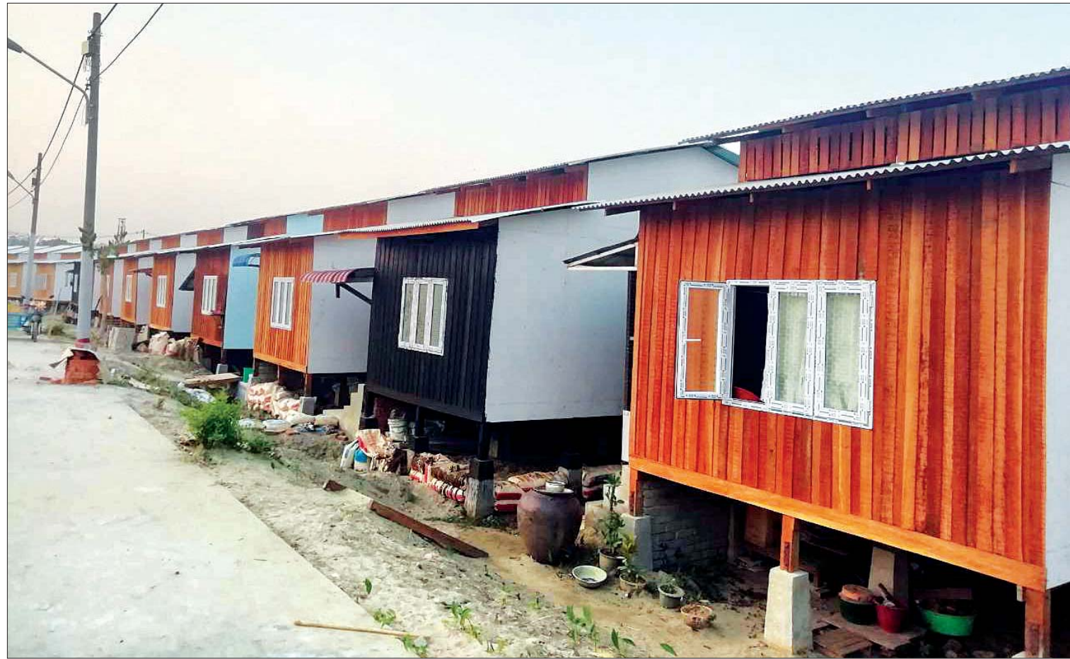
ရွှေပြည်သာမြို့နယ်၌ တည်ဆောက်ပြီးစီးသွားသည့် တန်ဖိုးနည်းအိမ်ရာများကို တွေ့ရစဉ်။

ကျူးတို့၏ အနာဂတ်ဘဝ၊ ကိုယ်ပိုင်အိမ်မရှိသူတို့၏ အနာဂတ်ဘဝများသည် ရန်ကုန်တိုင်းဒေသကြီးအစိုးရအဖွဲ့၏ စေတနာဖြင့် များကြော့မီ လှပလာတော့မည်မှာ ရွှေပြည်သာမြို့နယ်တွင် တည်ဆောက်ပြီးခဲ့သော တန်ဖိုးနည်းအိမ်ရာများက သက်သေခံနေပြီဖြစ်သည်။ ။