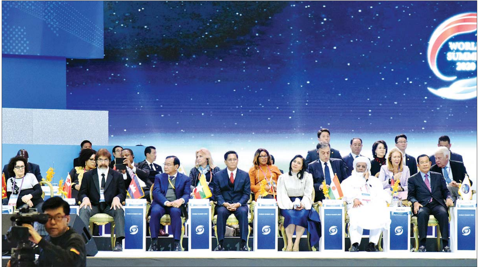
ဒုတိယသမ္မတ ဦးဟင်နရီဗန်ထီးယူ ငြိမ်းချမ်းရေး၊ လုံခြုံရေးနှင့် လူသားတိုးတက်မှုဆိုင်ရာ ကမ္ဘာ့ထိပ်သီးအစည်းအဝေး - ၂၀၂၀ (Peace , Security and Human Development World Summit 2020) ; Assembly and International Summit Council for Peace မျက်နှာစုံညီအစည်းအဝေး တက်ရောက်စဉ်။ သတင်းစဉ်

ဆိုးလ် ဖေဖော်ဝါရီ ၄ ကိုရီးယားသမ္မတနိုင်ငံ ဆိုးလ်မြို့၌ ရောက်ရှိနေသည့် ဒုတိယသမ္မတ ဦးဟင်နရီဗန်ထီးယူသည် ယနေ့တွင် ငြိမ်းချမ်းရေး၊ လုံခြုံရေးနှင့် လူသားတိုးတက်မှုဆိုင်ရာ ကမ္ဘာ့ထိပ်သီးအစည်းအဝေး - ၂၀၂၀ (Peace , Security and Human Development World Summit 2020) ; Assembly and International Summit Council for Peace မျက်နှာစုံညီအစည်းအဝေးသို့ တက်ရောက် မိန့်ခွန်းပြောကြားပြီး Dr. HakJa Han Moon ၏ အတ္ထုပ္ပတ္တိ မိတ်ဆက်ခြင်းနှင့် Mother Foundation ဖွင့်လှစ်ခြင်းအထိမ်းအမှတ် ညစာစားပွဲသို့ တက်ရောက်သည်။ ဒုတိယသမ္မတ ဦးဟင်နရီဗန်ထီးယူသည် ဒေသစံတော်ချိန်နံနက် ၈ နာရီခွဲတွင် ငြိမ်းချမ်းရေး၊ လုံခြုံရေးနှင့် လူသားတိုးတက်မှုဆိုင်ရာ ကမ္ဘာ့ထိပ်သီးအစည်းအဝေး-၂၀၂၀ (Peace , Security and Human Development World Summit 2020); Assembly and International Summit Council for Peace မျက်နှာစုံညီအစည်းအဝေး စာမျက်နှာ ၅ ကော်လံ ၁ #