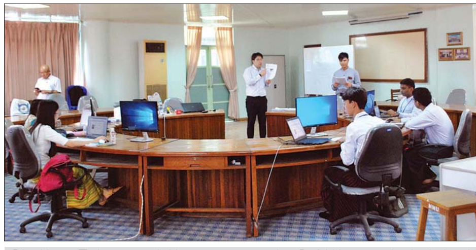
မြန်မာနိုင်ငံရေကြောင်းပညာတက္ကသိုလ်၌ 3D CAD (CATIA-V5) ကိုအခြေခံ၍ ဒီဇိုင်းရေးဆွဲသည့် သင်တန်းကို ဂျပန် သင်တန်းဆရာကိတ်တိုင်း စာတော် လက်တွေ့ သင်ကြားပို့ချနေစဉ်။

ရန်ကုန် ဖေဖော်ဝါရီ ၄ မြန်မာနိုင်ငံရေကြောင်း ပညာ တက္ကသိုလ်နှင့် ဂျပန်နိုင်ငံ Solize Engineering Cooperation တို့ ပူးပေါင်းစီစဉ်သည့် 3D CAD(CATIA -V5) ကို အခြေခံ၍ ဒီဇိုင်းရေးဆွဲသည့် သင်တန်းဖွင့်ပွဲ အခမ်းအနားကို ယမန်နေ့က မြန်မာနိုင်ငံရေကြောင်း ပညာတက္ကသိုလ် ပင်မဆောင်ရှိ ပါမောက္ခချုပ်ရှုံး အစည်းအဝေးခန်းမ၌ ကျင်းပသည်။ အခမ်းအနားတွင် မြန်မာနိုင်ငံ ရေကြောင်းပညာတက္ကသိုလ် ဒုတိယ ပါမောက္ခချုပ် (သင်ကြား)(တာဝန်) ဒေါက်တာစန္ဒာနိုင်က အမှာစကား ပြောကြားခဲ့ပြီး Solize Cooperation မှ Mr. Suzuki Yukihito က သင်တန်း ဖွင့်လှစ်ခြင်းနှင့် ပတ်သက်၍ ရှင်းလင်းပြောကြားခဲ့သည်။ ယခုဖွင့်လှစ်သည့် ဒီဇိုင်းပုံစံ များရေးဆွဲသည့် အဆင့်မြင့်ပညာရပ် သင်တန်းသည် ဒုတိယအကြိမ်မြောက် ဖွင့်လှစ်သင်ကြားခြင်းဖြစ်ပြီး ၂၀၁၈- ၂၀၁၉ ပညာသင်နှစ်၏ ၁၇ ရ ကျောင်းသား ကျောင်းသူ ၃၀ ကို မြန်မာနိုင်ငံ ရေကြောင်းပညာ တက္ကသိုလ်တွင် သုံးလကြာအခမ