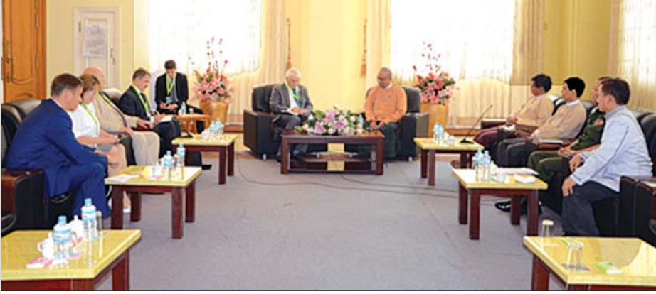
အမျိုးသားလွှတ်တော် နိုင်ငံတကာဆက်ဆံရေး၊ လွှတ်တော်ချင်း ချစ်ကြည်ရေးနှင့် ပူးပေါင်းဆောင်ရွက်ရေး ကော်မတီနှင့် ရုရှားဖက်ဒရေးရှင်းနိုင်ငံ အောက်လွှတ်တော်၊ နိုင်ငံတကာရေးရာကော်မတီ၏ ဒုတိယဥက္ကဋ္ဌ Mr. Alexei Chepa ဦးဆောင်သော ကိုယ်စားလှယ်အဖွဲ့တို့ တွေ့ဆုံဆွေးနွေးစဉ်။