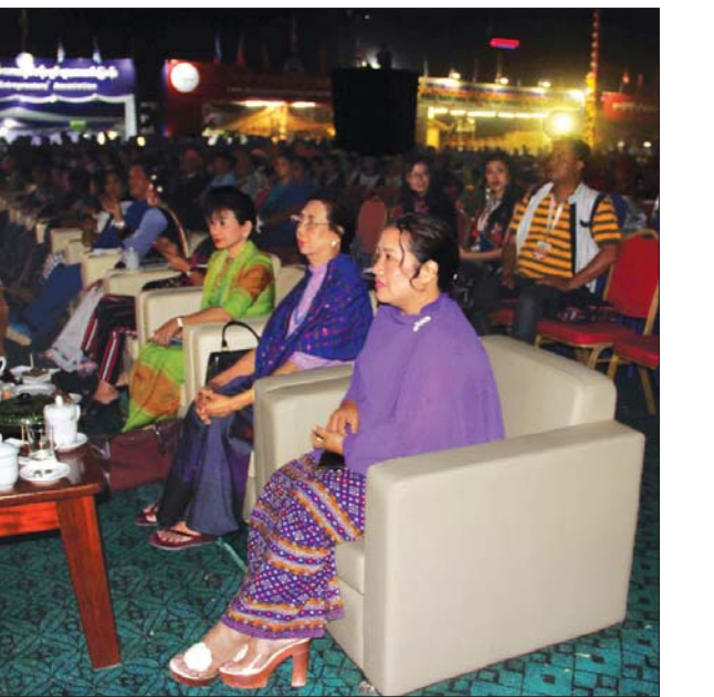
သား အချင်းချင်း စည်းလုံးညီညွတ်မှုများ တိုးတက်ဖြစ်ထွန်းစေရန်၊ ရိုးရာအစားအစာများနှင့် ယဉ်ကျေးမှုများ အချင်းချင်းဖလှယ်ကြရန် ရည်ရွယ်ချက်ဖြင့် ကချင်တိုင်းရင်းသားများ၏ ရိုးရာအစားအစာများဖြင့် တည်ခင်းဧည့်ခံသည့် ဂုဏ်ပြုညစာစားပွဲသို့ တက်ရောက်ကြသည်။ ကြည့်ရှုအားပေး ယင်းနောက် ဒုတိယသမ္မတ၏ သတင်းစဉ်

ဇနီး ဒေါက်တာရွှေလွမ်း၊ ပြည်ထောင်စုဝန်ကြီးနိုင်သက်လွင်၊ ပြည်ထောင်စုဝန်ကြီးများ၏ ဇနီးများနှင့် အဖွဲ့ဝင်များသည် ကျိုက္ကဆံအားကစားကွင်းရှိ ရည်ရွယ်ချက်ဖြင့် ကချင်တိုင်းရင်းသားများ၏ ရိုးရာအစားအစာများဖြင့် တည်ခင်းဧည့်ခံသည့် ဂုဏ်ပြုညစာစားပွဲသို့ တက်ရောက်ကြသည်။ ကြည့်ရှုအားပေးသည်။ (အပေါ်ပုံ) သတင်းစဉ်