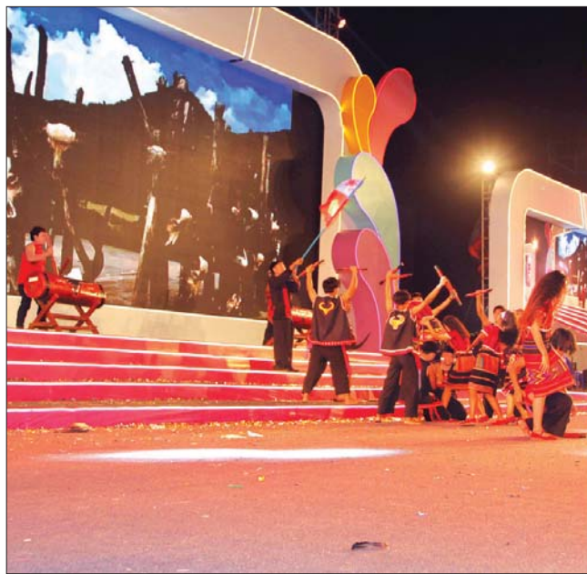
စေရန်၊ တိုင်းပြည်အေးချမ်းသာယာပြီး တိုင်းရင်းသားများ ပိုမိုချစ်ကြည်ရင်းနှီးစည်းလုံးစေရန်နှင့် မျိုးဆက်သစ် လူငယ်များ မိမိတို့ရိုးရာ ယဉ်ကျေးမှုအစဉ်အလာကောင်းများကို ထိန်းသိမ်းစောင့်ရှောက်လိုစိတ် ဖြစ်လာရန် ရည်ရွယ်၍ စုပေါင်းဆင်နွှဲကြသည့် ကယားတိုင်းရင်းသား ရိုးရာကေတုဘိုး (ခေါ်) တံခွန်တိုင် ပွဲတော်ကို ကယားတိုင်းရင်းသားများ နှင့်အတူ ပါဝင်ဆင်နွှဲသည်။

တိုင်းရင်းသားများအားလုံး စည်းလုံးညီညွတ်စွာဖြင့် မြန်မာနိုင်ငံ၏ စီးပွားရေးကို ဖွံ့ဖြိုးတိုးတက်အောင် ဆောင်ရွက်ကြရန် ရည်ရွယ်၍ ကျင်းပသည့် ဆွတ်မနော(စီးပွားရေး အောင်မြင် ဖြစ်ထွန်းသောအခါ ကသည်ပွဲ) ဖြစ်ကြောင်း သိရသည်။ ကချင်ရိုးရာ မနောအကသည် အဓိကအားဖြင့် ငါးမျိုးရှိပြီး ၎င်းတို့မှာ ပဒန်မနော (စစ်အောင်နိုင်ခြင်း အထိမ်းအမှတ်ဖြစ် အောင်ပွဲခံသည့် ပွဲ)၊ ဆွတ်မနော (စီးပွားရေး အောင်မြင်ဖြစ်ထွန်းသောအခါ ကသည်ပွဲ)၊ ဂျူမနော (မကျန်းမာသည့်အခါနှင့် အသက်အရွယ်ကြီးရင့်သောဘိုးဘွား အိုများ သေဆုံးသောအခါ ကျင်းပသောပွဲ)၊ ဝှစ်ရင်မနော (ညီအစ်ကို တစ်ဦးဦး နယ်မြေသစ်တည်ထောင် နေထိုင်သောအချိန် ကျင်းပသည့်ပွဲ)၊ ရှိဒိပ်မနော (နယ်မြေသစ်သတ်မှတ်ခြင်းနှင့် အုပ်ချုပ်ခြင်းအထိမ်းအမှတ် ဖြစ် ကျင်းပသည့်ပွဲ) စသည့် ရည်ရွယ်ချက်များဖြင့် ကျင်းပခြင်းဖြစ်ကြောင်း သိရသည်။ ယင်းနောက် ပြည်ထောင်စုဝန်ကြီး နိုင်သက်လွင်သည် မိုးလေဝသ မှန်ကန်စေရန်၊ ဆန်ရေစပါး၊ ကောက်ပဲသီးနှံ ပေါများကြွယ်ဝစေရန်၊ သဘာဝဘေးအန္တရာယ်မှ ကင်းဝေး