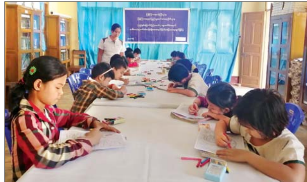
ကရင်ပြည်နယ် ဘားအံခရိုင် ရှမ်းရွာသစ်မြို့တွင် (၇၃) နှစ်မြောက် ပြည်ထောင်စုနေ့အကြိုအထိမ်းအမှတ်အဖြစ် ဖေဖော်ဝါရီ ၄ ရက်က ပြိုင်ပွဲများကျင်းပရာ ရှမ်းရွာသစ်မြို့ အခြေခံပညာမူလတန်းကျောင်းမှ ကျောင်းသားကျောင်းသူများ ဆေးရောင်ခြယ်ပြိုင်ပွဲ ယှဉ်ပြိုင်နေကြစဉ်။ စင်လေး(ပြန်/ဆက်)