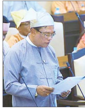
ဒုတိယဝန်ကြီး ဒေါက်တာကျော်လင်း မြေကြားစဉ်။