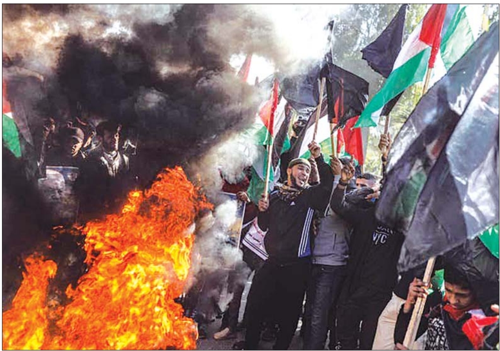
သမ္မတထရမ်၏ ငြိမ်းချမ်းရေးအစီအစဉ်ကို ဆန့်ကျင်သည့်အနေဖြင့် ပါလက်စတိုင်းပြည်သူများ ဆန္ဒပြနေစဉ်။

သဘောထားဖော်ပြ ဒီကိစ္စနဲ့ပတ်သက်ပြီး ပါလက်စတိုင်းရဲ့ သဘောထားရပ်တည်ချက်ကို ဖော်ပြဖို့အတွက် မစ္စတာအာဘတ်စ်က ကုလသမဂ္ဂလုံခြုံရေးကောင်စီ၊ နိုင်ငံတကာအဖွဲ့အစည်းတွေနဲ့ ဒေသ