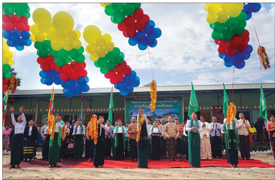
တိုင်းဒေသကြီးဝန်ကြီးချုပ် ဒေါက်တာအောင်စိုးညိုနှင့် တာဝန်ရှိသူများ အထက်တန်းကျောင်းဆောင်သစ်အား ဖဲကြိုးဖြတ် ဖွင့်လှစ်ပေးစဉ်။

ပေးနေခြင်းဖြစ်ကြောင်း ပြောကြားသည်။ ထို့နောက် တိုင်းဒေသကြီးဝန်ကြီးချုပ်နှင့် တာဝန်ရှိသူများက ရွှေပေါက်ကံဝန်ထမ်း အိမ်ရာလေးခန်းတွဲ သုံးထပ်တိုက် အဆောက်အအုံသစ်အား ဖဲကြိုးဖြတ်၍ ဖွင့်လှစ်ပေးခဲ့ကြပြီး အဆောက်အအုံမညှင်းမော်ကွန်းအား အမွေးနံ့သာရည်များ ပက်ဖျန်းပေးခဲ့ကြကာ ဝန်ထမ်းအိမ်ရာအတွင်း လှည့်လည်ကြည့်ရှုစစ်ဆေးခဲ့ကြသည်။ အဆိုပါ ရွှေပေါက်ကံဝန်ထမ်းအိမ်ရာ လေးခန်းတွဲ သုံးထပ်တိုက်အဆောက်အအုံအား ၂၀၁၈-၂၀၁၉ ဘဏ္ဍာနှစ် ရန်ကုန်တိုင်းဒေသကြီး အစိုးရအဖွဲ့၏ ရန်ပုံငွေကျပ် ၂၆၄ ဒသမ ၉၃ သန်းဖြင့် အကုန်အကျခံ၍ ATY Co., Ltd. မှ ၂၀၁၉ ခုနှစ် ဇန်နဝါရီ ၁၅ ရက်တွင် စတင်တည်ဆောက်ခဲ့ခြင်းဖြစ်ကြောင်း သိရသည်။ ဆန်းကျော်ဦး (ပြန်/ဆက်)