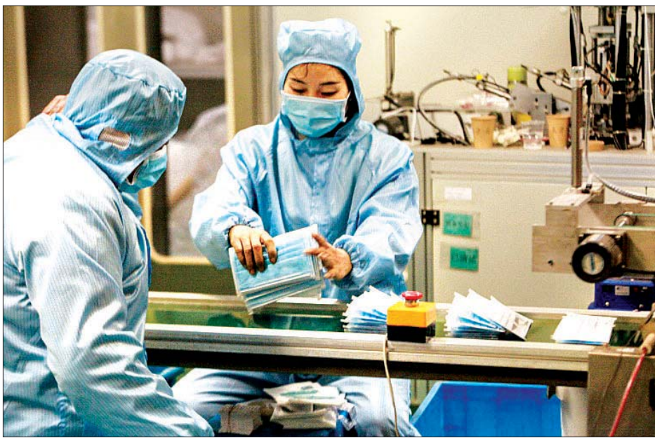
နိုဗယ်ကိုရိုနာဗိုင်းရပ်စ်အန္တရာယ် ကြိုတင်ကာကွယ်ရေးအတွက် နှာခေါင်းစည်းများ ထုတ်လုပ်နေမှုကို တွေ့ရစဉ်။

ပေကျင်း ဖေဖော်ဝါရီ ၃ တရုတ်နိုင်ငံ၌ ကူးစက်မြန် နိုဗယ်ကိုရိုနာဗိုင်းရပ်စ်ကြောင့် သေဆုံးသူ ၅၀ ကျော် ထပ်မံတိုးလာသည့်အတွက် သေဆုံးသူအရေအတွက် ၃၆၀ ဦးအထိ ရှိလာခဲ့သည်။ ယခုအခါ နိုဗယ်ကိုရိုနာဗိုင်းရပ်စ်ကြောင့် သေဆုံးသူ အရေအတွက်မှာ ၂၀၀၃ ခုနှစ် ဆားစိရောဂါဖြစ်ပွားမှုထက် သေဆုံးသူအရေအတွက် ပိုမိုမြန်ဆန်လာနေကြောင်း သိရသည်။