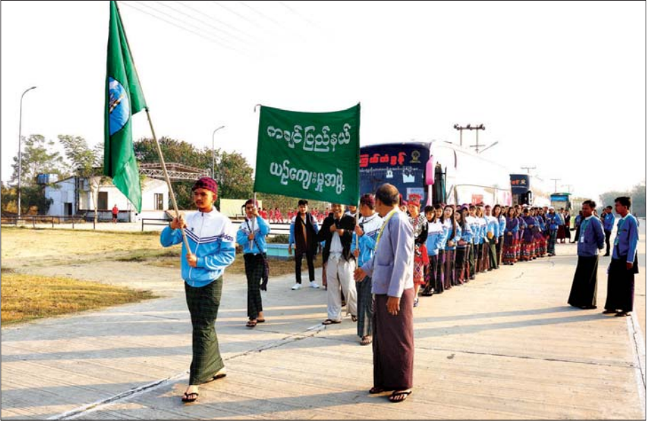
နေပြည်တော်သို့ ရောက်ရှိလာသော ကချင်ပြည်နယ် ကိုယ်စားလှယ်အဖွဲ့ဝင်များ။

နေပြည်တော် ဖေဖော်ဝါရီ ၂၃ (၇၃) နှစ်မြောက် ပြည်ထောင်စုနေ့ အထိမ်းအမှတ် အခမ်းအနားတွင် တိုင်းရင်းသားရိုးရာ ယဉ်ကျေးမှုအကများဖြင့် ဖျော်ဖြေတင်ဆက်မည့် တိုင်းဒေသကြီးနှင့်ပြည်နယ်အသီးသီးမှ တိုင်းရင်းသားယဉ်ကျေးမှုကိုယ်စားလှယ်အဖွဲ့များသည် ယမန်နေ့မှန်းလွှဲပိုင်းမှ စတင်၍ နေပြည်တော် မြို့နယ်ရှိ မြို့နယ်အတွင်းရှိ အားကစားလေ့ကျင့်ရေးစခန်းသို့ ရောက်ရှိကြသည်။ အဆိုပါတိုင်းရင်းသားယဉ်ကျေးမှုကိုယ်စားလှယ်အဖွဲ့များအား (၇၃) နှစ်မြောက် ပြည်ထောင်စုနေ့ ကျင်းပရေး ကြံဆိုင်ရေးညွှန်ကြားရေးဦးစီးဌာနနှင့် နေပြည်တော် မြို့နယ်အဖွဲ့ဝင်များ အဖွဲ့ဝင်များ အဖွဲ့ဝင်များ တာဝန်ရှိသူများက အဖွဲ့ဝင်များ စားကြိုက်အောင် စီစဉ်ဆောင်ရွက်ပေးသည်။ တိုင်းဒေသကြီးနှင့် ပြည်နယ်အသီးသီးမှ တိုင်းရင်းသားယဉ်ကျေးမှုကိုယ်စားလှယ်အဖွဲ့များမှ ကယားပြည်နယ်နှင့် ရခိုင်ပြည်နယ်တို့သည် ယမန်နေ့က ရောက်ရှိပြီး ယနေ့နံနက်ပိုင်းတွင် ကချင်ပြည်နယ် ချင်း၊ မွန်၊ ရှမ်းပြည်နယ်တို့ ရောက်ရှိကြကြောင်း သိရသည်။ ရောက်ရှိလာသော ကချင်ပြည်နယ် ကိုယ်စားလှယ်အဖွဲ့ဝင်များ။