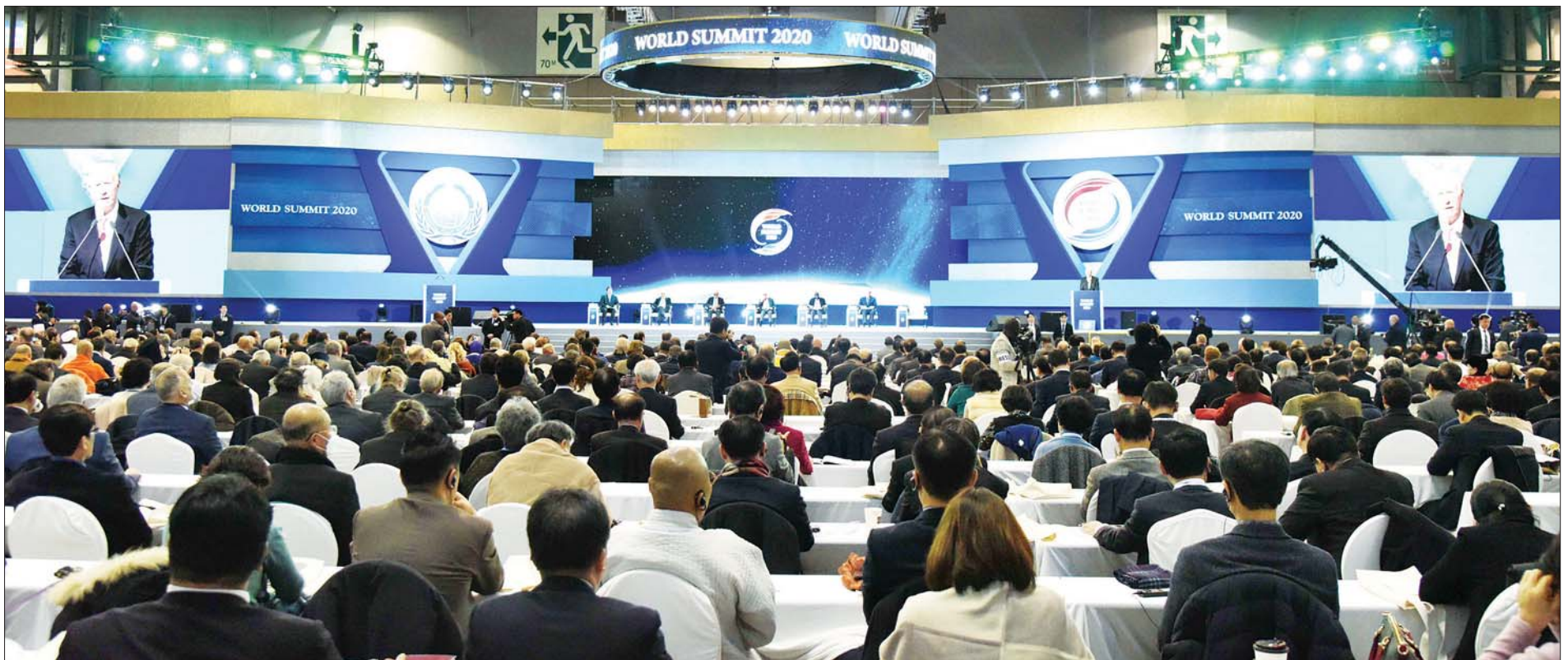
ငြိမ်းချမ်းရေး၊ လုံခြုံရေးနှင့် လူသားတိုးတက်မှုဆိုင်ရာ ကမ္ဘာ့ထိပ်သီးအစည်းအဝေး- ၂၀၂၀ (Peace, Security and Human Development World Summit 2020) ဖွင့်ပွဲအခမ်းအနား ကျင်းပစဉ်။ သတင်းစဉ်

ကို မြန်မာနိုင်ငံအစိုးရနှင့် UPF တို့ ပူးတွဲ၍ မြန်မာနိုင်ငံတွင် ယခုနှစ်အတွင်း ကျင်းပပြုလုပ်နိုင်ရေးဆိုင်ရာ ကိစ္စရပ်များကို ရင်းနှီးပွင့်လင်းစွာ ဆွေးနွေးခဲ့ကြသည်။ တက်ရောက် တွေ့ဆုံပွဲသို့ ပြည်ထောင်စု ဝန်ကြီး သူရဦးအောင်ကို၊ ကိုရီးယား သမ္မတနိုင်ငံဆိုင်ရာ မြန်မာသံအမတ်ကြီး ဦးသန့်စင်၊ နိုင်ငံခြားရေး ဝန်ကြီးဌာန အမြဲတမ်းအတွင်းဝန် ဦးစိုးဟန်နှင့် တာဝန်ရှိသူများ တက်ရောက်ကြသည်။ ဂုဏ်ပြုညစာစား ဆက်လက်၍ ဒုတိယသမ္မတ ဦးဟင်နရီဗန်ထီးယူသည် ငြိမ်းချမ်းရေး၊ လုံခြုံရေးနှင့် လူသားတိုးတက်မှု ဆိုင်ရာ ကမ္ဘာ့ထိပ်သီးအစည်းအဝေး-၂၀၂၀ ကြိုဆိုဂုဏ်ပြု ညစာစားပွဲသို့ တက်ရောက်သည်။ သတင်းစဉ်