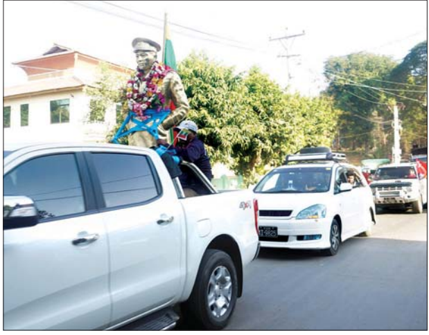
ဗိုလ်ချုပ်အောင်ဆန်းကြေးရုပ်တု ကံမမြို့သို့ ရောက်ရှိလာစဉ်။