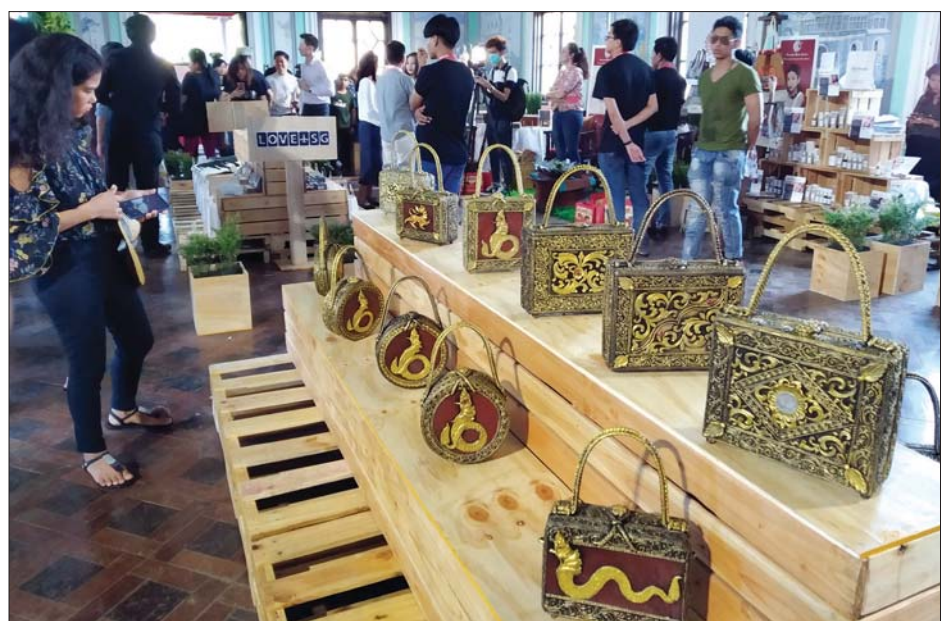
စင်ကာပူပွဲတော်တွင် ချင်းချောင်းနန်းတော်အပေါ်ထပ်၌ ပြသထားမှုကို တွေ့ရစဉ်။

ရန်ကုန် ဖေဖော်ဝါရီ ၃ - စင်ကာပူနိုင်ငံ၏ပုံရိပ်တို့ကို ထင်ဟပ်စေမည့် ပြခန်းများနှင့် နာမည်ကျော် အစားအစာများ၊ အနုပညာလက်ရာများကို ရန်ကုန် မြို့ ဗဟန်းမြို့နယ်ရှိ ချင်းချောင်းနန်းတော်တွင် ဖေဖော်ဝါရီ ၂ ရက်အထိ ကျင်းပခဲ့ရာ နှစ်နိုင်ငံခရီးသွားလုပ်ငန်းကို ပိုမိုအရှိန်မြှင့်တင်ရန်ရည်ရွယ်ချက်ဖြင့် ဖော်ဆောင်ခဲ့ခြင်းဖြစ်သည်။