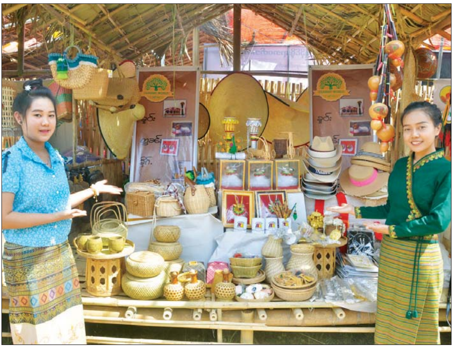
ရှမ်းတိုင်းရင်းသား ရိုးရာယဉ်ကျေးမှု ပြခန်းနှင့် ရှမ်းလူမျိုးဖြူများ။

စုစည်းတင်ပြသူ-သီသီမင်း