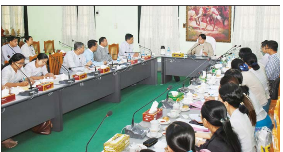
ပြည်ထောင်စုဝန်ကြီး ဒေါက်တာဖေမြင့် ပုံနှိပ်ရေးနှင့်ထုတ်ဝေရေးဦးစီးဌာနရှိ စာပေဗိမာန်မှ စာတည်းအဖွဲ့ဝင်များအား တွေ့ဆုံမှာကြားစဉ်။ သတင်းစဉ်

ညွှန်ကြားရေးမှူးချုပ် ဦးရဲနိုင်၊ ပုံနှိပ်ရေးနှင့် ထုတ်ဝေရေးဦးစီးဌာန ညွှန်ကြားရေးမှူးချုပ် ဦးအောင်မျိုးမြင့်နှင့် တာဝန်ရှိသူများ၊ ဖိတ်ကြားထားသူများနှင့် စာပေဗိမာန်မှ စာတည်းအဖွဲ့ဝင်များ တက်ရောက်ကြသည်။ တွေ့ဆုံပွဲတွင် ၂၀၁၉ ခုနှစ် နိုဝင်ဘာ ၂၇ ရက်က နိုင်ငံတော်သမ္မတ ဦးဝင်းမြင့် စာပေဗိမာန်သို့ ရောက်ရှိစစ်ဆေးစဉ် လမ်းညွှန်မှာကြားချက်များအပေါ် လိုက်နာဆောင်ရွက်မှု အခြေအနေ၊ စာပေဗိမာန်မှ ဆောင်ရွက်လျက်ရှိသော မြန်မာ့စွယ်စုံကျမ်း ပြန်လည်ထုတ်ဝေရေး၊ မြန်မာဂန္ထဝင်အတွဲ ၁၀၀ စာစဉ် ဆက်လက်ထုတ်ဝေရေး၊ ရွှေသွေးဂျာနယ်ထုတ်ဝေရေး၊ စာအုပ်အသင်းဝင် တိုးတက်ရေးဆိုင်ရာ ကိစ္စရပ်များကို ဆွေးနွေးတင်ပြကြရာ