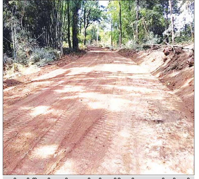
မင်းတုန်းမြို့နယ်အတွင်း ဖောက်လုပ်လျက်ရှိသည့် ကျေးလက်ကုန်ထုတ်လမ်းပိုင်းတစ်ခုခု။