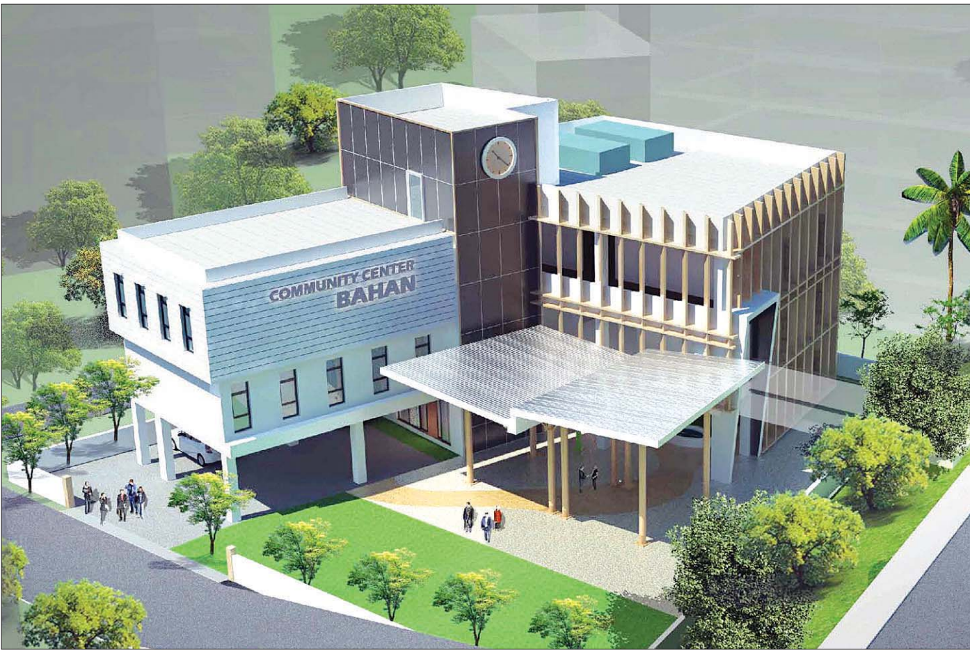
ဗဟန်းလူထုအခြေပြုဗဟိုဌာန (Community Center - Bahan) အဆောက်အဦ ဒီဇိုင်းကို တွေ့ရစဉ်။

□ ဒေသတစ်ခုတွင် ပြည်သူများစုပေါင်းတွေ့ဆုံရာ၊ ဆွေးနွေး ဖလှယ်ရာ၊ နီးနှောတိုင်ပင်ရာစသည့် ရပ်ရွာအကျိုး၊ တိုင်းပြည် အကျိုးဆောင်ရွက်မှုများအတွက် လူထုအခြေပြုဗဟိုဌာနဟု ခေါ်တွင်သည့် Community Center များသည် နိုင်ငံတော် အစိုးရသစ်တာဝန်ယူပြီးနောက် ပြန်ကြားရေးဝန်ကြီးဌာန၏ စီမံဆောင်ရွက်မှုဖြင့် စတင်သင်္ကြန်တည်ခဲ့ပြီး ဒေါ်ခင်ကြည် ဖောင်ဒေးရှင်းနှင့် ပူးပေါင်းကာ မွေးဖွားရှင်သန်လာခဲ့ခြင်း ဖြစ်သည်။