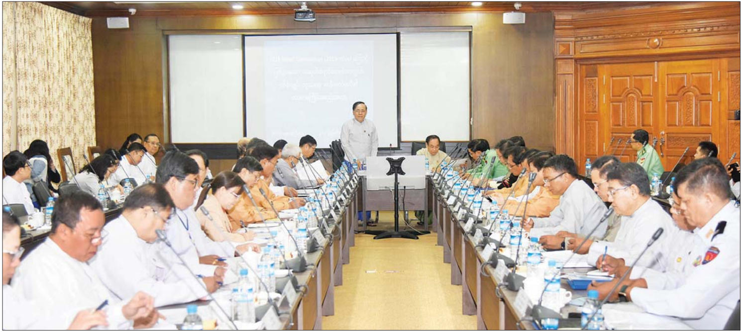
ပြည်ထောင်စုဝန်ကြီး ဦးကျော်တင် 2019 Novel Coronavirus (2019-nCoV) ကြောင့်ဖြစ်ပွားသော အဆုတ်ရောင်ရောဂါ ကာကွယ်၊ ထိန်းချုပ်၊ ကုသရေး ဗဟိုကော်မတီ၏ ပထမအကြိမ် အစည်းအဝေးတွင် အမှာစကားပြောကြားစဉ်။

2019 Novel Coronavirus (2019-nCoV) ကြောင့်ဖြစ်ပွားသော အဆုတ်ရောင်ရောဂါ ကာကွယ်၊ ထိန်းချုပ်၊ ကုသရေးဗဟိုကော်မတီ၏ ပထမအကြိမ် အစည်းအဝေးကို ဗဟိုကော်မတီဥက္ကဋ္ဌ အပြည်ပြည်ဆိုင်ရာ ပူးပေါင်းဆောင်ရွက်ရေး ဝန်ကြီးဌာန ပြည်ထောင်စုဝန်ကြီး ဦးကျော်တင်နှင့် ပူးတွဲဥက္ကဋ္ဌ ကျန်းမာရေးနှင့် အားကစား ဝန်ကြီးဌာန ပြည်ထောင်စုဝန်ကြီး ဒေါက်တာမြင့်ထွေးတို့ ဦးဆောင်၍ ယနေ့ ဖွဲ့စည်းလှုံ့ဆော်ရေးဝန်ကြီးဌာန နှစ်ထပ်တန်းအစည်းအဝေးတွင် ဝန်ကြီးဌာနမှ အဖွဲ့ဝင်များနှင့် တာဝန်ရှိသူများ တက်ရောက်ခဲ့ကြသည်။