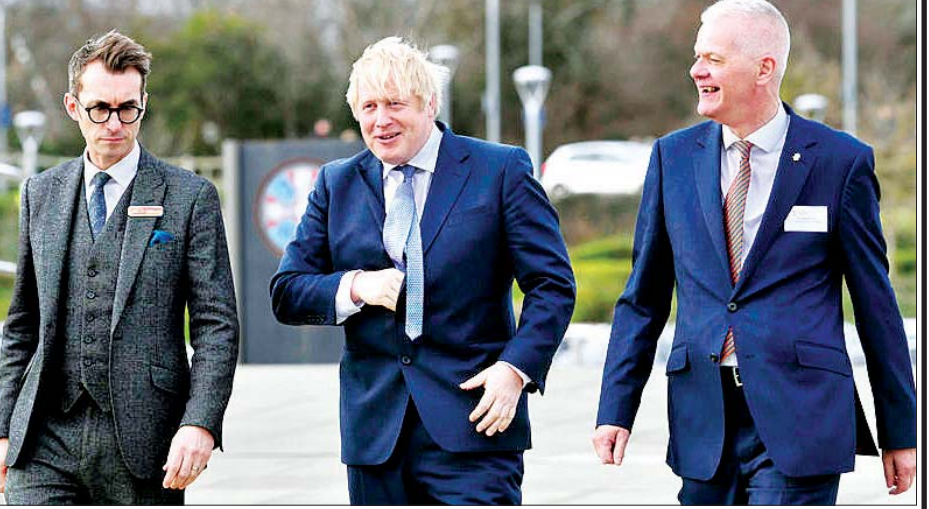
ဗြိတိန်ဝန်ကြီးချုပ် ဘောရစ်ဂျွန်ဆင် အစိုးရအဖွဲ့အစည်းအဝေးသို့ တက်ရောက်လာစဉ်။

လန်ဒန် ဖေဖော်ဝါရီ ၃ ဗြိတိန်ဝန်ကြီးချုပ် ဘောရစ်ဂျွန်ဆင် သည် ဥရောပသမဂ္ဂနှင့် ကုန်သွယ် ရေးစာချုပ် ချုပ်ဆိုရာ၌ ကနေဒါပုံစံ အတိုင်းပြုလုပ်ရန် နည်းလမ်းများ ရှာဖွေလျက်ရှိသည်။ ကနေဒါပုံစံ ကုန်သွယ်ရေးစာချုပ်မှာ ဥရောပ သမဂ္ဂ၏ စည်းမျဉ်းများကိုရှောင်ရှား ပြီး ဈေးကွက်ဖွင့်ပေးသည့် ပုံစံပင် ဖြစ်သည်။