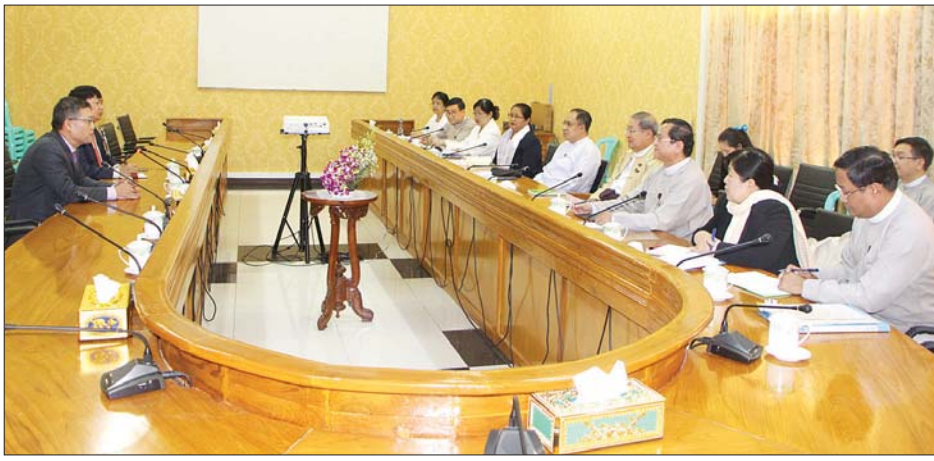
လိုသည့်ကိစ္စ၊ ရင်းနှီးမြှုပ်နှံမှုများနှင့် နှစ်နိုင်ငံအကြား ဆက်လက်ပူးပေါင်း စပ်လျဉ်း၍ ဆွေးနွေးခဲ့ကြသည်။ သတင်းစဉ် အခွန်ဆိုင်ရာကိစ္စ၊ ဆောင်ရွက်သွားမည့်ကိစ္စရပ်များနှင့်

နေပြည်တော် ဖေဖော်ဝါရီ ၃ စီမံကိန်း၊ ဘဏ္ဍာရေးနှင့် စက်မှု ဝန်ကြီးဌာန ပြည်ထောင်စုဝန်ကြီး ဦးစိုးဝင်းသည် မြန်မာနိုင်ငံဆိုင်ရာ ဗီယက်နမ်နိုင်ငံ သံအမတ်ကြီး မစ္စတာ လီကွတ်ဝံသွမ်အား ယနေ့ မွန်းလွဲ ၁ နာရီက နေပြည်တော်ရှိ စီမံကိန်း၊ ဘဏ္ဍာရေးနှင့် စက်မှုဝန်ကြီးဌာန ပြည်ထောင်စုဝန်ကြီးရုံး ဧည့်ခန်းမ၌ လက်ခံတွေ့ဆုံသည်။ (ယာပုံ) တွေ့ဆုံစဉ် ဗီယက်နမ်စီးပွားရေး လုပ်ငန်းရှင်များက မြန်မာနိုင်ငံရှိ စက်မှုဇုန်များတွင် ရင်းနှီးမြှုပ်နှံ လိုသည့်ကိစ္စ၊ ရန်ကုန်စတော့ အိတ်ချိန်း၊ Microfinance နှင့် ဘဏ်လုပ်ငန်းများတွင် ရင်းနှီးမြှုပ်နှံ