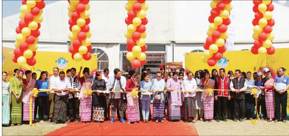
ပြည်ထောင်စုဝန်ကြီး နိုင်သက်လွင်၊ တိုင်းဒေသကြီးဝန်ကြီးများနှင့် တိုင်းရင်းသားလုပ်ငန်းရှင်များက တိုင်းရင်းသား ထုတ်ကုန်များ ပြပွဲကို ဖွင့်ပွဲအခမ်းအနားဖွင့်လှစ်ပေးစဉ်။