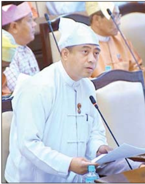
ဒုတိယဝန်ကြီး ဦးတင်လတ် မြေကြားစဉ်။

ရန်ကုန်တိုင်းဒေသကြီး မဲဆန္ဒနယ်အမှတ်(၉)မှ ဦးဖေချစ်၏ ရန်ကုန် တိုင်းဒေသကြီး၊ ထောက်ကြံ့မြို့ရောင် ကတ္တရာလမ်းအရှည်(၁)မိုင် (၇)မာလုံ ကို ပြုပြင်ပေးရန် အစီအစဉ် ရှိ/မရှိနှင့် လမ်းနယ်ကျူးကျော်အဆောက်အုံ များကို စနစ်တကျ ဖယ်ရှားပေးနိုင်ခြင်း ရှိ/မရှိ သိရှိလိုခြင်း မေးခွန်းနှင့်စပ်လျဉ်း၍ ဒုတိယဝန်ကြီး ဒေါက်တာကျော်လင်းက မက်(စ်)ဟိုင်းဝေးကုမ္ပဏီလီမိတက်မှ ထောက်ကြံ့မြို့ရောင်လမ်းကို ၂၄ ပေ အကျယ် ကတ္တရာထပ်ပိုးလွှာခင်း ခြင်းလုပ်ငန်းနှင့် နှစ်စဉ်ပြင်ဆင်ထိန်းသိမ်းခြင်းလုပ်ငန်းများကို ဆောင်ရွက်ရာ တွင် ၂၀၁၉ - ၂၀၂၀ ဘဏ္ဍာရေးနှစ်တွင် စတုရန်းပေ ၂၀၀၀ ကို ကတ္တရာ ကွန်ကရစ်ဖြင့် လမ်းပေါက်ဖာထေးခြင်းလုပ်ငန်းနှင့် ကျောက်ကတ္တရာဖြင့် စတုရန်းပေ ၃၁၆၈ ကို မျက်နှာပြင်ညှိလွှာခင်းခြင်းလုပ်ငန်းများ ဆက်လက် ဆောင်ရွက်သွားမည်ဖြစ်ပါကြောင်း၊ ယနေ့အချိန်အထိ စတုရန်းပေ ၄၀၀၀ နှင့်