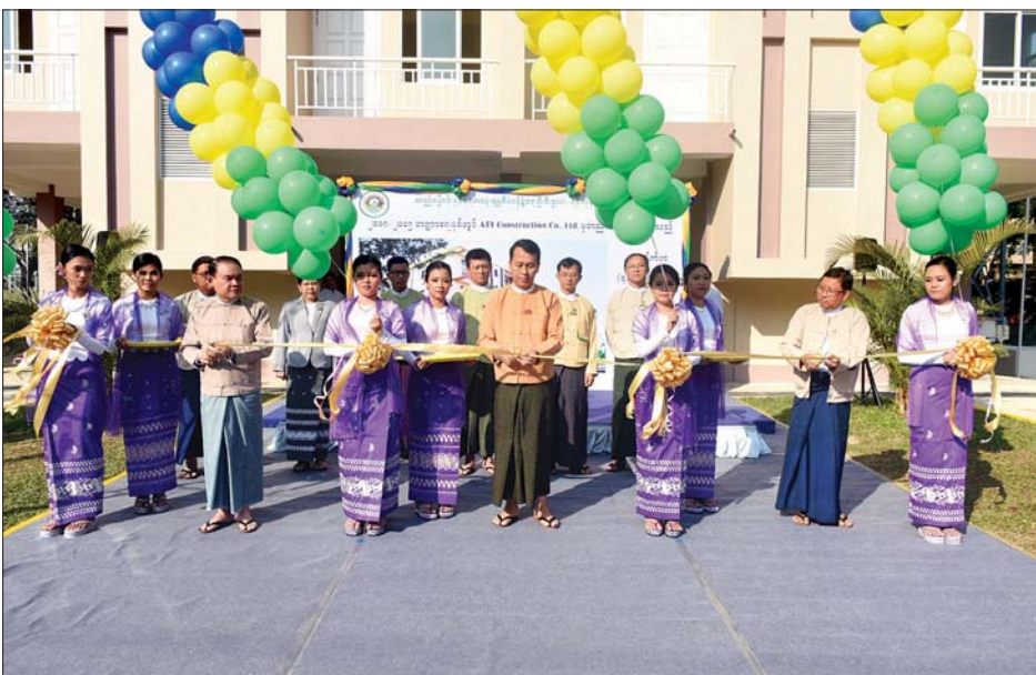
တိုင်းဒေသကြီးဝန်ကြီးချုပ် ဦးဖိုးမင်းသိန်းနှင့် တာဝန်ရှိသူများ ရွှေပေါက်ကံဝန်ထမ်းအိမ်ရာ အဆောက်အအုံသစ်အား ဖဲကြိုးဖြတ် ဖွင့်လှစ်ပေးစဉ်။