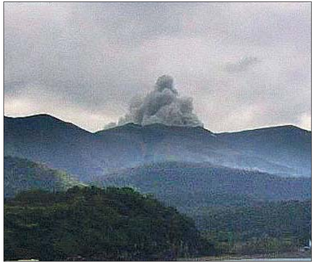
မီးတောင်ပေါက်ကွဲမှုမှ မီးခိုးများ ထွက်ပေါ်နေစဉ်။

တိုကျို ဖေဖော်ဝါရီ ၃ ဂျပန်နိုင်ငံ ကာဂိုရီးမားစီရင်စုတောင်ပိုင်းတွင် ဖေဖော်ဝါရီ ၃ ရက် အစောပိုင်းက မီးတောင်တစ်လုံး ပေါက်ကွဲမှုဖြစ်ပွားခဲ့ကြောင်း ဂျပန်မိုးလေဝသအေဂျင်စီက ပြောကြားခဲ့သည်။ လတ်တလောတွင် မီးတောင်ပေါက်ကွဲမှုကြောင့် ထိခိုက် ဒဏ်ရာရရှိသူ ရှိ မရှိ သတင်းမော်ပြခြင်း မရှိသေးပေ။