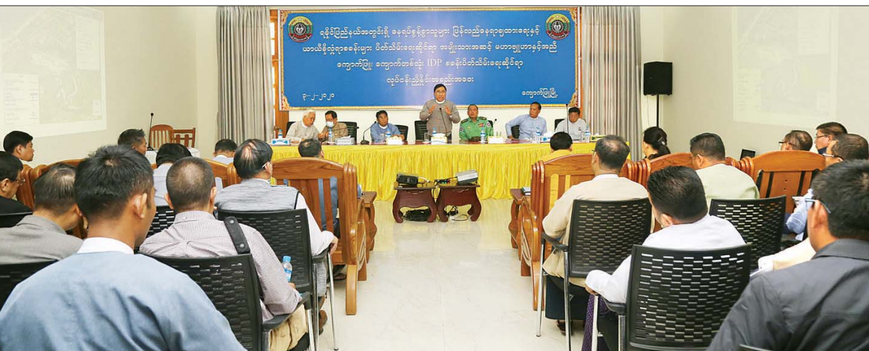
ပြည်ထောင်စုဝန်ကြီး ဒေါက်တာဝင်းမြတ်အေး ကျောက်ဖြူမြို့ရှိ ကျောက်တစ်လုံးယာယီခိုလှုံရာစခန်းရှိ ကော်မတီအဖွဲ့ဝင်များ၊ ပြည်တွင်းနေရပ်စွန့်ခွာသူများနှင့် တွေ့ဆုံဆွေးနွေးစဉ်။

ရှေးဦးစွာ ပြည်ထောင်စုဝန်ကြီး နှင့်အဖွဲ့အား ကျောက်ဖြူမြို့ အထွေထွေအုပ်ချုပ်ရေး ဦးစီးဌာန စည်ရိပ်သာခန်းမ၌ ကျောက်ဖြူခရိုင် အုပ်ချုပ်ရေးမှူးက ကျောက်ဖြူဒေသ ၏ အခြေအနေ၊ ကျောက်ဖြူ ကျောက်တစ်လုံး ယာယီခိုလှုံရာစခန်း ၏ လက်ရှိအခြေအနေ၊ ပြန်လည်နေရာ ချထားရန် လျာထားသည့်မြေနေရာ အနေအထားများနှင့် ပတ်သက်၍