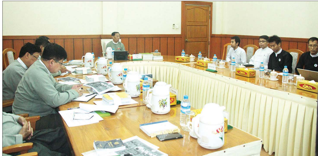
ပြည်ထောင်စုရွေးကောက်ပွဲကော်မရှင်ဥက္ကဋ္ဌ ဦးလှသိန်း Myanmar Network Organization for Free and Fair Elections (MYNFREL) အဖွဲ့အား လက်ခံတွေ့ဆုံစဉ်။ သတင်းစဉ်