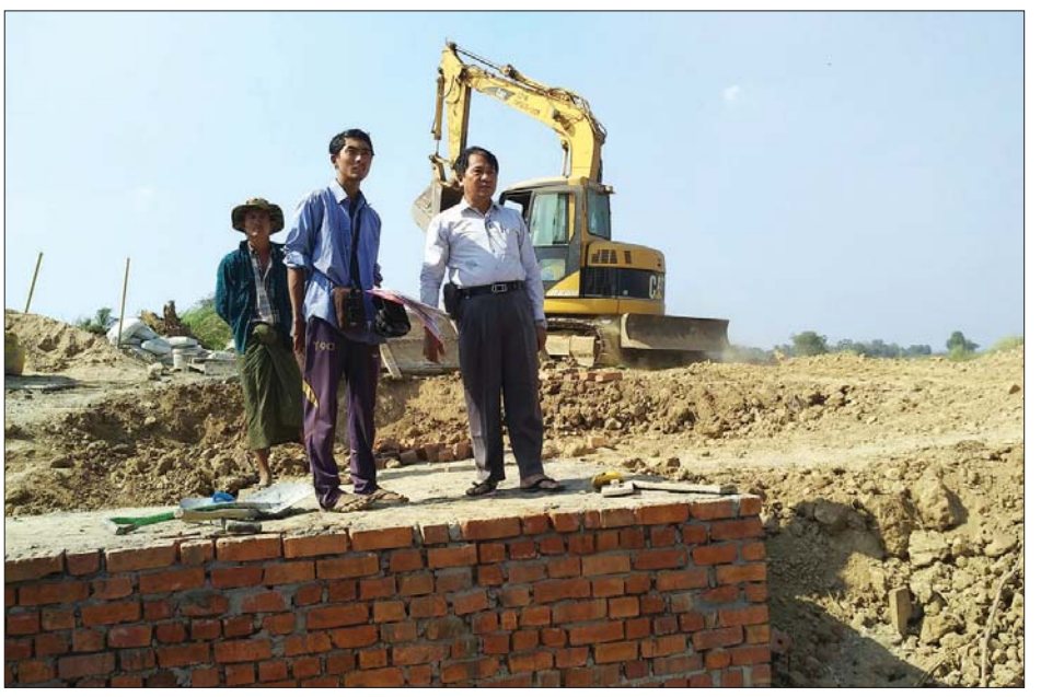
ကျွန်းပင်ဆိပ်ကျေးရွာ ကြောင်ပြာတံပေါ်၌ ရေထိန်းတံခါးတည်ဆောက်နေစဉ်။