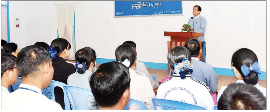
ဒုတိယဝန်ကြီး ဦးအောင်လှထွန်း ပြန်ကြားရေးနှင့် ပြည်သူ့ဆက်ဆံရေးဦးစီးဌာန၏ စွမ်းရည်မြှင့်သင်တန်းဖွင့်ပွဲတွင် အမှာစကား ပြောကြားစဉ်။

နေပြည်တော် ဖေဖော်ဝါရီ ၃ ပြန်ကြားရေးဝန်ကြီးဌာန ပြန်ကြားရေးနှင့် ပြည်သူ့ဆက်ဆံရေးဦးစီးဌာန၏ စွမ်းရည်မြှင့်သင်တန်း(၁/၂၀၂၀) ဖွင့်ပွဲအခမ်းအနားကို ယနေ့နံနက် ၉ နာရီတွင် နေပြည်တော်ရှိ ပြန်ကြားရေးနှင့် ပြည်သူ့ဆက်ဆံရေးဦးစီးဌာန ရုံးချုပ်သင်တန်းကျောင်း၌ ကျင်းပသည်။