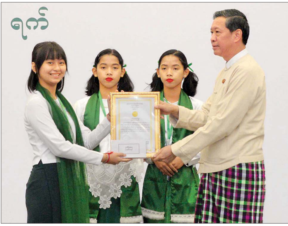
ပြည်ထောင်စုဝန်ကြီး ဒေါက်တာ မျိုးသိမ်းကြီး ဆုရရှိသူတစ်ဦးအား ဆုချီးမြှင့်ပေးအပ်စဉ်။ သတင်းစဉ်

နေပြည်တော် ဇန်နဝါရီ ၂၉ ၂၀၂၀ ပြည့်နှစ် ပညာရေးဖွံ့ဖြိုးတိုးတက်မှုအကောင်အထည်ဖော်ရေး နှီးနှောဖလှယ်ပွဲ (အခြေခံပညာကဏ္ဍ) ဒုတိယနေ့ အစီအစဉ်အား ယနေ့ နံနက် ၉ နာရီခွဲတွင် မြန်မာ အပြည်ပြည်ဆိုင်ရာ ကွန်ဗင်းရှင်း စင်တာ-၂ (MICC-2) ၌ ဆက်လက်ကျင်းပရာ ပညာရေးဝန်ကြီးဌာန ပြည်ထောင်စုဝန်ကြီး ဒေါက်တာမျိုးသိမ်းကြီး တက်ရောက်သည်။ ရှေးဦးစွာ အခြေခံပညာဦးစီးဌာန ဒုတိယညွှန်ကြားရေးမှူးချုပ် ဒေါက်တာ တင်မောင်ဝင်းက အခြေခံပညာကဏ္ဍ လွှမ်းမိုးမြို့မြို့သော လုပ်ငန်းများအပေါ် ပြန်လည်ဆန်းစစ်လေ့လာမှု စာတမ်း၊ အခြေခံပညာဦးစီးဌာန ညွှန်ကြားရေးမှူး ဦးတိုးဝင်းက အရည်အသွေးအာမခံမှု စံသတ်မှတ်ချက်များဖြင့် အခြေခံပညာကျောင်းအရည်အသွေးမြှင့်တင်ခြင်းစာတမ်း၊ အခြေခံပညာဦးစီးဌာန ဒုတိယညွှန်ကြားရေးမှူး (ကြီးကြပ်အကဲဖြတ်) ဒေါ်သင်းနုနုစိန်က ၂၁ ရာစု၏ ပြောင်းလဲလာသော အခြေခံပညာကဏ္ဍနှင့် ကြီးကြပ်အကဲဖြတ်ခြင်း အစီအစဉ်များ စာတမ်း၊ အခြေခံပညာဦးစီးဌာန ဒုတိယညွှန်ကြားရေးမှူး (စီမံကိန်း) စာရင်းအင်း) ဦးခင်အောင်ရီက အရေးပေါ်အခြေအနေများတွင် ဆက်လက်ပညာသင်ကြားနိုင်ရေး စာတမ်းတို့ကို ဖတ်ကြားကြသည်။