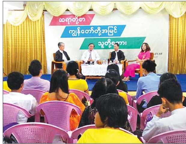
ဆရာတို့စာ ကျွန်တော်တို့အမြင် သူတို့စကား သုတရသစာပေစကားဝိုင်းဆွေးနွေးပွဲ ဒုတိယနေ့ကျင်းပစဉ်။