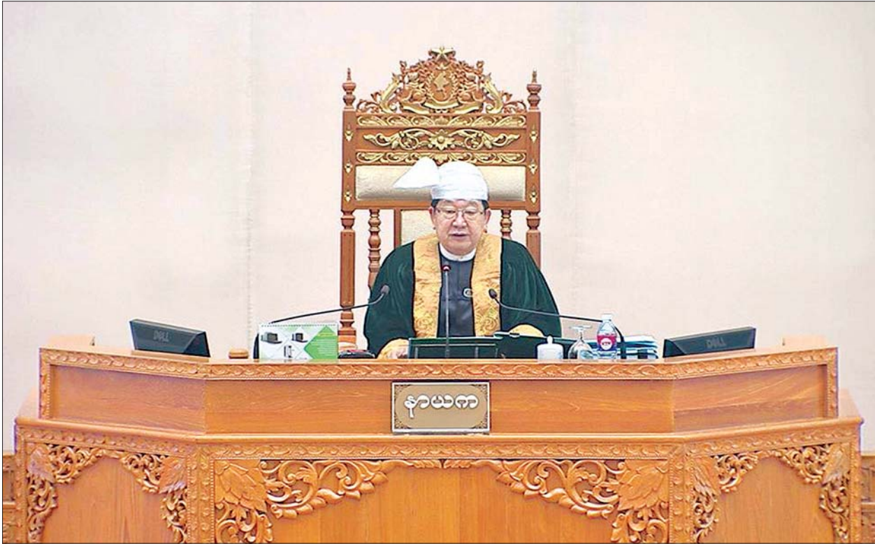
ပြည်ထောင်စုလွှတ်တော် နာယက ဦးတီခွန်မြတ်။

မိတ်ဆွေဟူသည် မိတ်ဆွေကောင်း၊ မိတ်ဆွေညံ့ဟူ၍ နှစ်မျိုးရှိရာ မိတ်ဆွေကောင်းတို့ကို ပေါင်းသင်းဆက်ဆံ ဆည်းကပ်ရာ၏။ ထိုမိတ်ဆွေကောင်းတို့အား ပေါင်းသင်း ဆက်ဆံ နှိပ်ဆည်းကပ်ခြင်းဖြင့် မိမိအတွက် အကျိုးများရာ၏။ မိတ်ဆွေကောင်းအပေါ် ယုတ်ညံ့သောစိတ်ဖြင့် မပြစ်မှားရာ။ ပဏ္ဍိတဝင် (ဓမ္မပဒ - ၇၈)