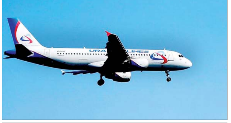
ယူရယ်လေကြောင်းလိုင်းမှ လေယာဉ်တစ်စင်းကို တွေ့ရစဉ်။

မော်စကို ဇန်နဝါရီ ၂၉ လူသေဆုံးနိုင်သည့် ကိုရိုနာဗိုင်းရပ်စ် ကူးစက်ပျံ့နှံ့မှုကြောင့် ရုရှားနိုင်ငံ ယူရယ်လေကြောင်းလိုင်းက ပါရီနှင့် ရောမအပါအဝင် ဥရောပသို့ ပြေးဆွဲနေသည့် လေကြောင်းဝန်ဆောင်မှုများအားလုံးကို ရပ်နားထားကြောင်း ဇန်နဝါရီ ၂၉ ရက်က ပြောကြားခဲ့သည်။ ရေကာတရင်ဘာဂျီတွင် အခြေစိုက်သည့် အဆိုပါ လေကြောင်းလိုင်းသည် မြူးနစ်၊ ပါရီနှင့် ပြင်သစ်နိုင်ငံသို့ ပြေးဆွဲနေသည့် လေကြောင်းခရီးစဉ်များနှင့်အတူ ဂျပန်နိုင်ငံ မြောက်ပိုင်း ဟော့ကိုင်းဒိုးကျွန်း၏ မြို့တော် ဆက်ပိုရိုသို့ ပြေးဆွဲနေသော လေကြောင်းခရီးစဉ်များကို ယခုနှစ် ဆောင်းရာသီအကုန်အထိ ရပ်နားထားမည်ဖြစ်ကြောင်း ကြေညာချက်တွင် ထုတ်ပြန်ဖော်ပြခဲ့သည်။ အဆိုပါလေကြောင်း ခရီးစဉ်များသည် တရုတ်ခရီးသွားများဖြင့် စည်ကားလျက်ရှိသောကြောင့် ဝူဟန်ဗိုင်းရပ်စ်ကူးစက်ခံရမှုမှ ကာကွယ်ရန် ထိုသို့ ရပ်နားလိုက်ခြင်းဖြစ်ကြောင်း ရုရှားနိုင်ငံ၏အကြီးဆုံး လူမှုကွန်ရက်ဖြစ်သည့် ဗီကွန်တက်တီတွင် ၎င်းလေကြောင်းလိုင်းက ဖော်ပြခဲ့သည်။ အဆိုပါလေကြောင်းလိုင်းသည် အစောပိုင်းက