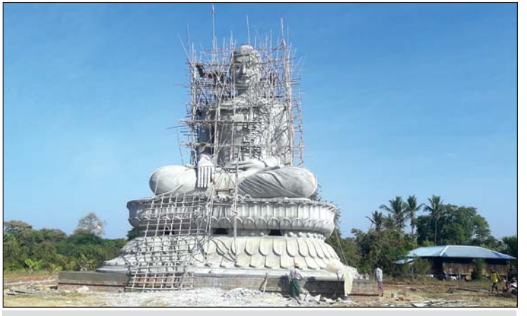
လေးကျွန်းစင်္ကြာ ထိုင်တော်မူရပ်ပွားတော်ကြီး

လေးကျွန်းစင်္ကြာ အေးချမ်းအောင်မြင် ဆုတောင်းပြည့်ဘုရား ထိုင်တော်မူ ရပ်ပွားတော်ကြီးသည် ခူးခွင်တော်အကျယ် ၃၅ ပေ၊ ဉာဏ်တော် ၄၁ ပေ ၆ လက်မ၊ ပလ္လင်တော်အမြင့် ၁၃ ပေ၊ စုစုပေါင်း ဉာဏ်တော်အမြင့် ၅၄ ပေ ၆ လက်မရှိပြီး ပလ္လင်တော်အတွင်းရှိ လိုဏ်ထဲတွင် ထိုင်တော်မူ ဆင်းတုတော် ကိုးဆူနှင့် ရပ်တော်မူရပ်ပွားတော် လေးဆူတို့အား ထားရှိပူဇော်သွားမည်ဖြစ်ကြောင်း၊ ရပ်ပွားတော်နှင့်အတူ အရှေ့အနောက် တစ်ဖက်လျှင် အရှည်ပေ ၁၅၀၊ တောင်နှင့်မြောက် တစ်ဖက်လျှင် အရှည်ပေ ၁၅၅ ပေရှိ ရင်ပြင်လည်း ပါရှိမည် ဖြစ်ကြောင်း သိရသည်။ လေးကျွန်းစင်္ကြာ အေးချမ်းအောင်မြင် ဆုတောင်းပြည့်ဘုရားကြီး တည်ထားကျမ်းကျေး