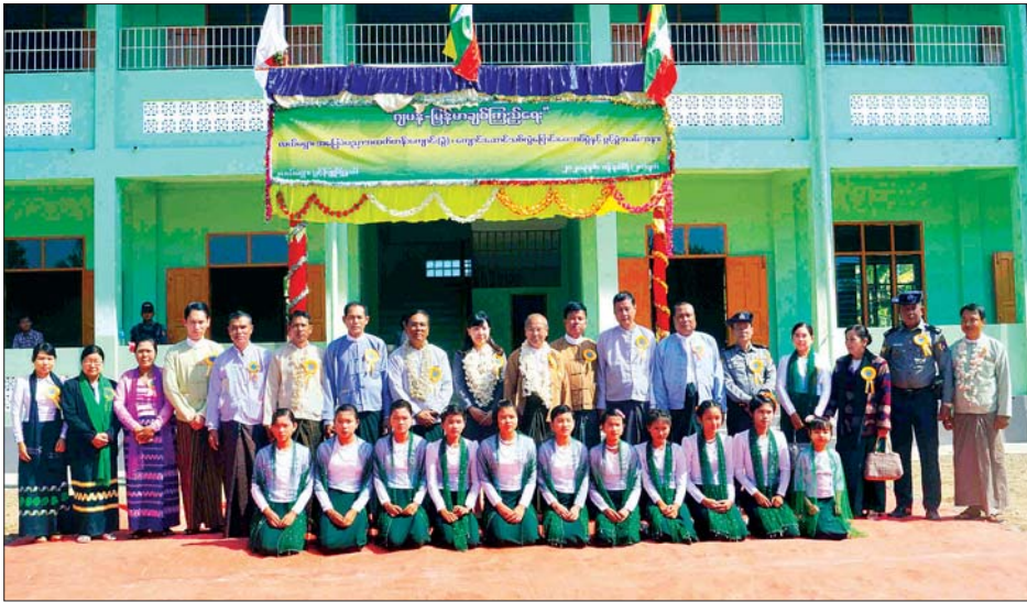
တိုင်းဒေသကြီး ဝန်ကြီးချုပ် ဒေါက်တာ အောင်စိုးညိုနှင့်တာဝန်ရှိသူများ ကျောင်းဆောင်သစ်ရှေ့၌ မှတ်တမ်းတင် ဓာတ်ပုံ ရိုက်ကြစဉ်။