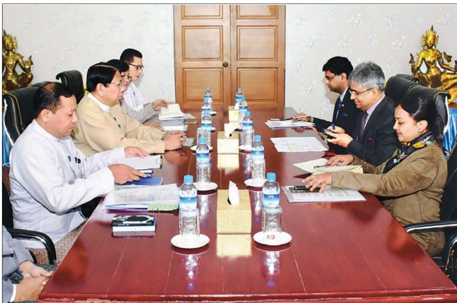
ပြည်ထောင်စုဝန်ကြီး ဒေါက်တာဖေမြင့် မြန်မာနိုင်ငံဆိုင်ရာ အိန္ဒိယနိုင်ငံ သံအမတ်ကြီး မစ္စတာ ဆော်ရက်(ဘိ) ကုမားနှင့်အဖွဲ့အား လက်ခံတွေ့ဆုံစဉ် သတင်းစဉ်

နေပြည်တော် ဇန်နဝါရီ ၂၉ ပြန်ကြားရေးဝန်ကြီးဌာန ပြည်ထောင်စုဝန်ကြီး ဒေါက်တာဖေမြင့်သည် မြန်မာနိုင်ငံဆိုင်ရာ အိန္ဒိယနိုင်ငံ သံအမတ်ကြီး မစ္စတာ ဆော်ရက်(ဘိ) ကုမားနှင့်အဖွဲ့အား ယနေ့ မွန်းလွဲ ၂ နာရီတွင် ပြန်ကြားရေးဝန်ကြီးဌာန ဧည့်ခန်းမ၌ လက်ခံတွေ့ဆုံသည်။ ပြန်ကြားရေးဝန်ကြီးဌာန ပြည်ထောင်စုဝန်ကြီး ဒေါက်တာဖေမြင့်သည် မြန်မာ-အိန္ဒိယ နှစ်နိုင်ငံအကြား သတင်းမီဒီယာ ကဏ္ဍတွင် ပူးပေါင်းဆောင်ရွက်ရန်၊ မြန်မာနိုင်ငံတွင် အိန္ဒိယရုပ်ရှင်ပြပွဲ ကျင်းပရန်နှင့် မြန်မာနိုင်ငံနှင့် အိန္ဒိယ နိုင်ငံတို့အကြား မီဒီယာဆိုင်ရာ နားလည်မှုစာချွန်လွှာ (MoU) လက်မှတ်ရေးထိုးနိုင်မည့် အခြေအနေများ၊ နှစ်နိုင်ငံ မီဒီယာအဖွဲ့ဝင်များ အပြန်အလှန် တွေ့ဆုံဆွေးနွေးနိုင်ရေးဆိုင်ရာ ကိစ္စရပ်များကို ရင်းနှီးပွင့်လင်းစွာ ဆွေးနွေးခဲ့ကြသည်။ သတင်းစဉ်