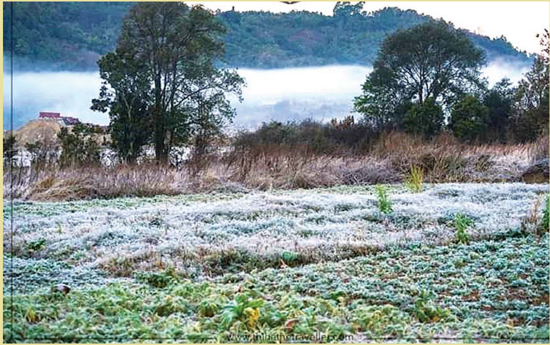
ရေခဲမှုနဲ့လှမ်းနေသည့် ဘားနဒ်ရွာမြင်ကွင်း။

သဘောကျကာ ကားရပ်ပြီး ဓာတ်ပုံဆင်းရိုက် တော့ ... အဲဒီနားက အိမ်ထဲက အမျိုးသမီး တစ်ဦးက တအံ့တဩနဲ့ “ဟယ် ဒီလောက် အေးနေတာ၊ မအေးတဲ့အတိုင်းပဲ” လို့ လှမ်းအော်မေးရတဲ့အထိ ရိုးသားအေးဆေး ကြတယ်။ ရေခဲတဲ့ ဆောင်းနံနက်ခင်းမှာ ဘားနဒ်ရွာဆီကို ရွာလေးဆီကိုသွားဖို့ မနက် ၅ နာရီ လောက် မိုးကုတ်မြို့ကနေ စတင်ရတယ်။ တောင်တက်လမ်းလေးတွေကို ဖိုးဖိုးကား တွေနဲ့ သွားရင် ပိုအဆင်ပြေတယ်။