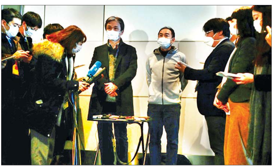
လေယာဉ်ဖြင့် ပြောင်းရွှေ့မှုပြုလုပ်မည့် ဂျပန်နိုင်ငံသားများက သတင်းထောက်များ မေးမြန်းနေသည်ကို ဖြေကြား နေစဉ်။

ပေကျင်း ဇန်နဝါရီ ၂၉ ကိုရိုနာဗိုင်းရပ်စ် စတင်ဖြစ်ပွားရာ ဂူဟန်မြို့တွင် ပိတ်မိနေသည့် အမေရိကန်နှင့် ဂျပန်နိုင်ငံသား ရာကျော်ကို လေယာဉ်ဖြင့် ရွှေ့ပြောင်းကယ်ဆယ်မှုများ ပြုလုပ် ခဲ့ကြောင်း နိုင်ငံတကာသတင်း တစ်ရပ်တွင် ဇန်နဝါရီ ၂၉ ရက်က ဖော်ပြလိုက်သည်။ တရုတ်နိုင်ငံတွင် ကူးစက်ဖြစ် ပွားနေသော ကိုရိုနာဗိုင်းရပ်စ်ပျံ့နှံ့မှု ပမာဏသည် ၂၀၀၂-၂၀၀၃ ခုနှစ်က ဖြစ်ပွားခဲ့သော ဆားစ်ရောဂါ ပျံ့နှံ့ ဖြစ်ပွားမှု ပမာဏထက် ပိုမိုများပြား လာကြောင်း သိရသည်။ ဆားစ်ရောဂါ သည်လည်း လူမှုလူသို့ ကူးစက်ပျံ့နှံ့ သော အဆုတ်ရောင်ရောဂါတစ်မျိုး ဖြစ်သည်။ ဆားစ်ရောဂါကြောင့် တစ်ကမ္ဘာလုံးတွင် သေဆုံးသူ ၈၀၀ နီးပါးရှိခဲ့ပြီး သေဆုံးသူအများစုမှာ တရုတ်ပြည်မကြီးနှင့် ဟောင်ကောင် တို့မှဖြစ်ကြောင်း သိရသည်။ သက်ဆိုင်ရာ အာဏာပိုင်များ