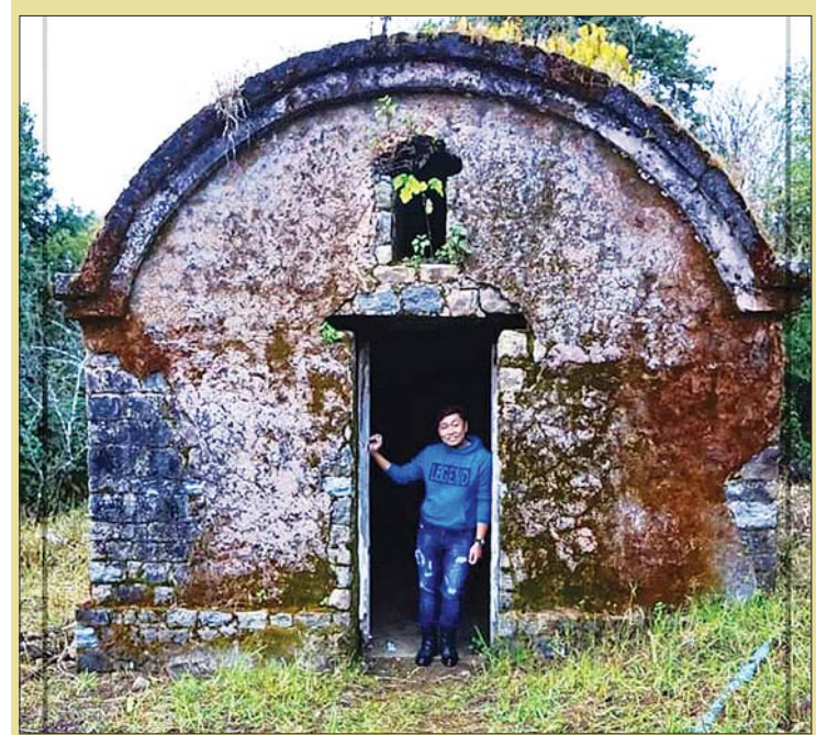
ဘားနဒ်ရွာအတွင်းမှ နှစ်၁၀၀ ကျော်သက်တမ်းရှိ ယမ်းတိုက်။

လာပြီးကြည့်ကြ။ မှတ်တမ်းတင်ကြရတယ် လေ။ ကျွန်တော်လည်း ဒီတစ်ခါ မိုးကုတ်မြို့ ကိုရောက်တော့ ရေခဲမှုနဲ့လေးတွေ လှမ်းနေမယ့် ဘားနဒ်ရွာလေးကိုမြင်ရဖို့ အပြေးလာခဲ့ရ ပြီပေါ့။