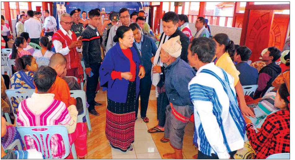
ပြည်နယ်ဝန်ကြီးချုပ် ဒေါ်နန်းခင်ထွေးမြင့် ဒေသခံပြည်သူများနှင့် ရင်းရင်းနှီးနှီး တွေ့ဆုံစဉ်။

တွေ့ဆုံခဲ့ရာ စုကလိမြို့နှင့် ဆုံဆည်း မြိုင်ကျေးရွာတို့ရှိ ပြည်သူများ၏ လိုအပ်ချက်များကို ဖြည့်ဆည်း ဆောင်ရွက်ပေးခဲ့ပြီး နိုင်ငံသားစိစစ် ရေးကတ်ပြား ၃၁၅ ကတ်နှင့် အိမ်ထောင်စုလူဦးရေစာရင်း ၆၆၅ ခုကို လည်းကောင်း၊ စုကလိမြို့ အတွင်း ကိုယ်ဝန်ဆောင်မိခင်နှင့် နှစ်နှစ် အောက်ကလေးငယ်များအား လူမှုဝန်ထမ်းဦးစီးဌာနမှ ထောက်ပံ့ သည့် တစ်ဦးလျှင် ငွေကျပ် ၄၅၀၀၀ စီကို လည်းကောင်း၊ အခြေခံပညာ ကျောင်းများ၊ ရစခန်းနှင့် ဆုံဆည်းမြိုင် ဆေးရုံတို့အတွက် ဆိုလာမီးများ၊ ကလေးငယ်များနှင့် ကိုယ်ဝန်ဆောင် များအတွက် အာဟာရရရှိအစားအစာ များကိုလည်းကောင်း ထောက်ပံ့ပေးခဲ့ ကြောင်း သိရသည်။ နေမျိုးလွင်(ပြန်/ဆက်)