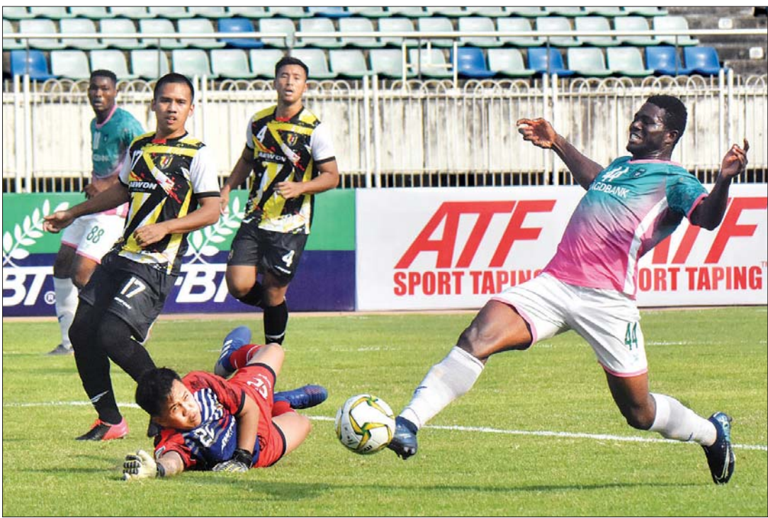
ရန်ကုန်အသင်းတိုက်စစ်မှူး ဘာဖို အင်ဒရာအသင်းဘက်သို့ ဂိုးသွင်းရန် ကြိုးပမ်းနေစဉ်။