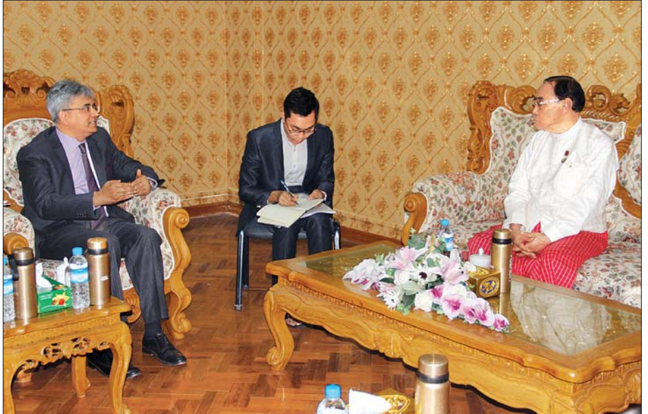
ပြည်ထောင်စုဝန်ကြီး နိုင်သက်လွင် မြန်မာနိုင်ငံဆိုင်ရာ အိန္ဒိယနိုင်ငံသံအမတ်ကြီး မစ္စတာ ဆော်ရက်(ဘ်)ကူမား အား လက်ခံတွေ့ဆုံစဉ်။

အိန္ဒိယနိုင်ငံ၏ ဖွံ့ဖြိုးတိုးတက်မှုအခြေခံပစ္စည်းနှင့် စပ်လျဉ်းသည့် နမူနာကောင်းများမျှဝေနိုင်ရေး၊ တိုင်းရင်းသားဘာသာစကားများ သင်ကြားနေမှု၊ နှစ်နိုင်ငံ တိုင်းရင်းသားလူမျိုးစုများ၏ ယဉ်ကျေးမှုဖလှယ်ရေး၊ အပြန်အလှန် ကူးလူးဆက်သွယ်သွားလာနိုင်ရေး အခွင့်အလမ်းကောင်းများကို ဖော်ဆောင်မည့်ကိစ္စ၊ အိမ်နီးချင်းနိုင်ငံအနေဖြင့် အပြုသဘောဆောင်သော ပူးပေါင်းဆောင်ရွက်မည့် ကိစ္စရပ်များနှင့် စပ်လျဉ်း၍ ဆွေးနွေးခဲ့ကြကြောင်း သိရသည်။ သတင်းစဉ်