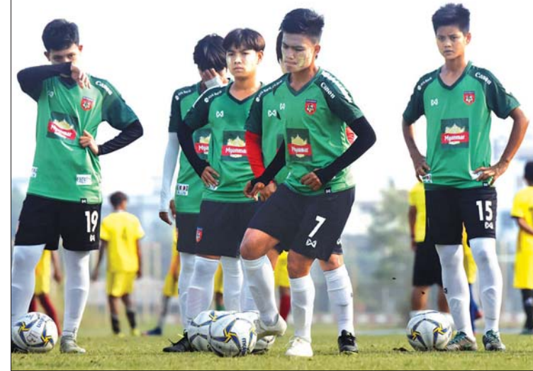
မြန်မာအမျိုးသမီးအသင်း လေ့ကျင့်နေစဉ်။