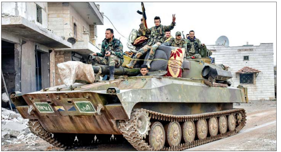
ဆီးရီးယားအစိုးရတပ်ဖွဲ့ဝင်များကို တွေ့ရစဉ်။

လှုပ်ရှားမှုများ ဆောင်ရွက်ခဲ့ကြောင်း ဆီးရီးယားအစိုးရတပ်ဖွဲ့ ပြောရေးဆိုခွင့်ရှိသူက ပြောကြားခဲ့သည်။ အစိုးရတပ်ဖွဲ့ဝင်များသည် ယခုအခါ ဆီးရီးယားနိုင်ငံ၏ ၇၀ ရာခိုင်နှုန်းကို ပြန်လည်ရရှိခဲ့ပြီဖြစ်ပြီး အီဒလစ်ပြည်နယ်အပါအဝင် တစ်နိုင်ငံလုံးကို ပြန်လည်ထိန်းချုပ်နိုင်ရေး အလေးပေးကြိုးပမ်းမည်ဖြစ်ကြောင်း ပြောကြားခဲ့သည်။ မာရက်အယ်လ်နူမန်မြို့ကို ပြန်လည်ရယူနိုင်ခဲ့ပြီးနောက် ဆီးရီးယား အစိုးရတပ်ဖွဲ့သည် ဆီးရီးယားမြေပေါ်တွင် အကြမ်းဖက်မှု ကင်းစင်ပျောက်သွားသည်အထိ အကြမ်းဖက် လက်နက်ကိုင်အုပ်စုများကို လိုက်လံချေမှုန်းလျက် ရှိကြောင်း ပြောရေးဆိုခွင့်ရှိသူက ပြောသည်။ လွန်ခဲ့သည့် ၂၀၁၁ ခုနှစ်က အီဒလစ်ပြည်နယ်အနှောက်မြောက်ပိုင်းရှိ မာရက်အယ်လ်နူမန်မြို့သည် ဆီးရီးယားအစိုးရကို ဆန့်ကျင်သည့် ပထမဆုံးမြို့တစ်မြို့ ဖြစ်လာခဲ့သည်။