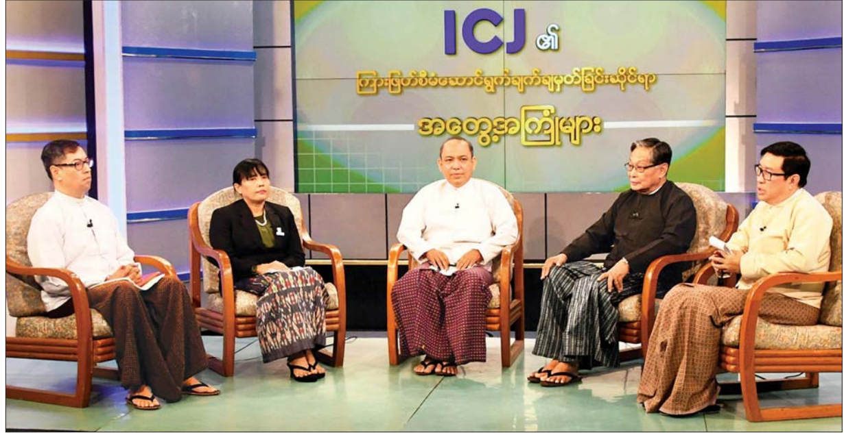
ICJ ၏ ကြားဖြတ်စီမံဆောင်ရွက်ချက် ချမှတ်ခြင်းဆိုင်ရာ အတွေ့အကြုံများ စကားဝိုင်း ကျင်းပစဉ်။

ICJ ၏ ကြားဖြတ်စီမံဆောင်ရွက်ချက် ချမှတ်ခြင်းဆိုင်ရာ အတွေ့အကြုံများ စကားဝိုင်းတွင် ပါဝင်ဆွေးနွေးခဲ့ကြသူများ၏ ဆွေးနွေးချက်များကို ဖော်ပြ လိုက်ပါသည်။ -