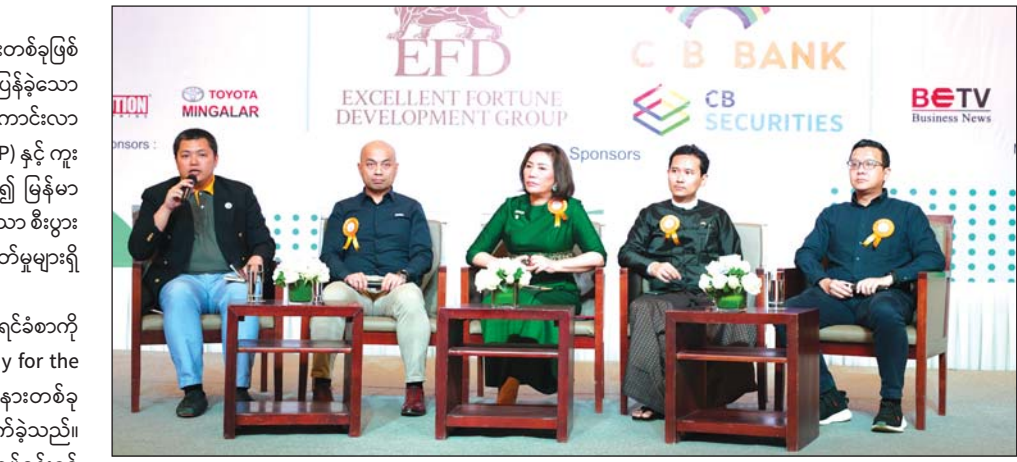
ရန်ကုန်မြို့ Melia Hotel ၌ အစီအရင်ခံစာ မိတ်ဆက်ပွဲ ဇန်နဝါရီ ၂၆ ရက်က ကျင်းပစဉ်