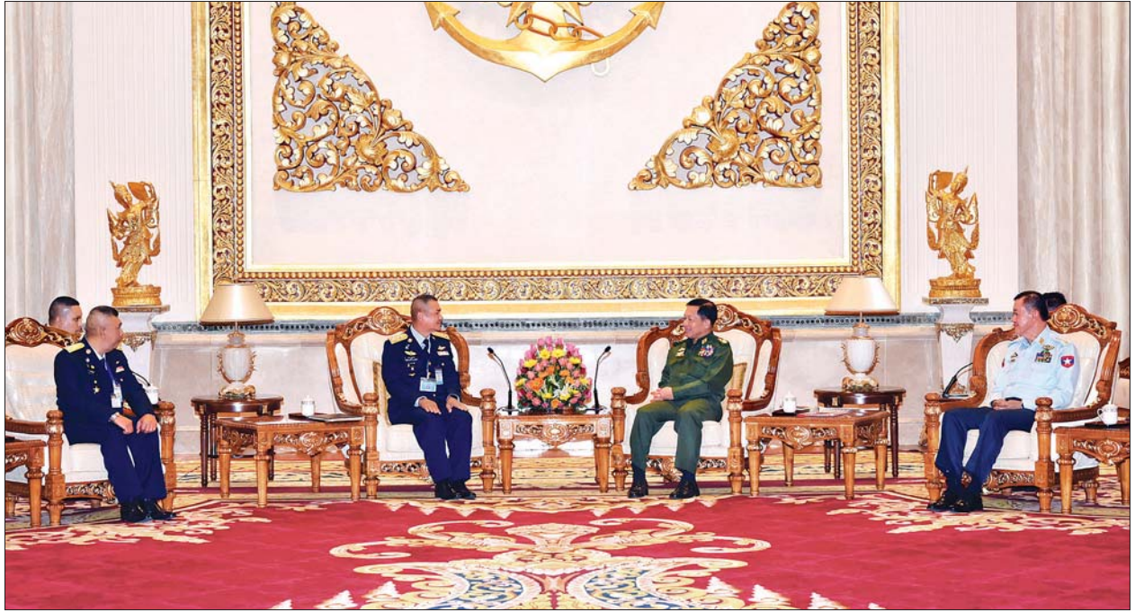
တပ်မတော်ကာကွယ်ရေးဦးစီးချုပ် ဗိုလ်ချုပ်မှူးကြီး မင်းအောင်လှိုင် ထိုင်းဘုရင့်လေတပ်ဦးစီးချုပ် Air Chief Marshal Maanat Wongwat အား လက်ခံတွေ့ဆုံစဉ်။

တွေ့ဆုံစဉ် လူသားချင်းစာနာမှုဆိုင်ရာအကူအညီပေးခြင်းနှင့် သဘာဝဘေးအန္တရာယ်အား တုံ့ပြန်ကာကွယ်ခြင်း HADR (Humanitarian Assistance and Disaster Response) လုပ်ငန်းစဉ်များတွင် နှစ်နိုင်ငံတပ်မတော်နှစ်ရပ်၊ အာဆီယံဒေသတွင်းနိုင်ငံများနှင့် ပိုမိုပူးပေါင်းဆောင်ရွက်ရန် လိုအပ်သည့် အခြေအနေ၊ မိုးလေဝသဆိုင်ရာ သတင်းအချက်အလက်ဖလှယ်ရေး၊ သင်တန်းသားများ စေလွှတ်ရေး၊ ချစ်ကြည်ရေးခရီးစဉ်များ လည်ပတ်ရေးဆိုင်ရာ ကိစ္စရပ်များအား အပြန်အလှန်ဆွေးနွေးခဲ့ကြကြောင်း တပ်မတော်ကာကွယ်ရေးဦးစီးချုပ်၏ သတင်းထုတ်ပြန်ချက်အရ သိရသည်။