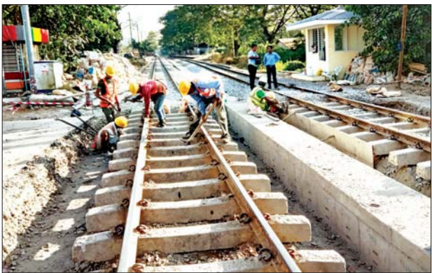
အဆင့်မြှင့်တင်လျက်ရှိသော ရန်ကုန်မြို့ပတ်ရထားလမ်းပိုင်းတစ်နေရာကို တွေ့ရစဉ်။