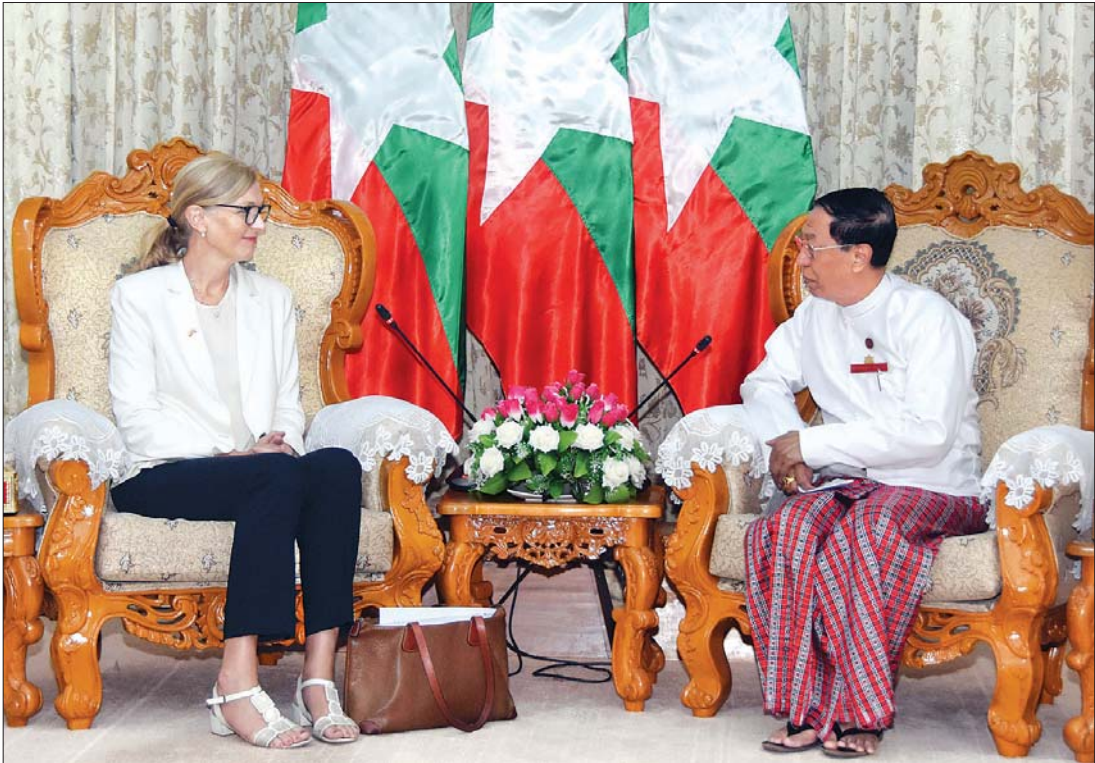
ပြည်ထောင်စုရွေးကော်မရှင်ဥက္ကဋ္ဌ ဦးလှသိန်း မြန်မာနိုင်ငံဆိုင်ရာ နော်ဝေနိုင်ငံ သံအမတ်ကြီး Ms. Tone Tinnes အား လက်ခံတွေ့ဆုံစဉ်။ သတင်းစဉ်

ရွေးကောက်ပွဲလုပ်ငန်းစဉ်များတွင် ပိုမိုပါဝင်လာ နိုင်စေရေး ဆောင်ရွက်နေမှု၊ လူမှုကွန်ရက် ပေါ်တွင် အမှန်းစကားများ၊ သတင်းအမှားများ ဖြန့်ဝေခြင်းတို့ကို ကာကွယ်တားဆီးရေးနှင့် သတင်းအမှန်ထုတ်ပြန်သည့် အစီအစဉ်များ ဆောင်ရွက်နေမှု၊ ရွေးကော်မရှင်အဖွဲ့ခွဲ အဆင့်ဆင့်တွင် ရွေးကော်မရှင်ရာစွမ်းရည် မြှင့်သင်တန်းများ ဆောင်ရွက်နေမှု၊ ၂၀၂၀ ပြည့်နှစ် အထွေထွေရွေးကော်မရှင်ပထမ အကြိမ် မဲပေးမည့် လူငယ်များအတွက် မဲဆန္ဒရှင် အသိပညာပေးလုပ်ငန်းများ ဆောင်ရွက်နေမှုနှင့် ရွေးကော်မရှင်စောင့်ကြည့်လေ့လာရေးအတွက် ဆောင်ရွက်သွားမည့် အခြေအနေများကို ရင်းနှီး ပွင့်လင်းစွာ ဆွေးနွေးခဲ့ကြသည်။