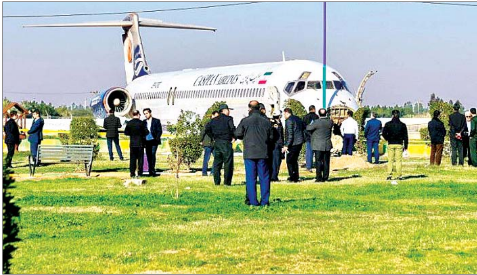
အဝေးပြေးလမ်းမပေါ်သို့ ရောက်ရှိသွားသည့်လေယာဉ်ကို တွေ့ရစဉ်။

လူအားလုံးဘေးကင်းလုံခြုံမှုရှိကြောင်း နိုင်ငံပိုင်ရုပ်သံတွင်ဖော်ပြထားသည်။ ယခုဖြစ်ရပ်ကို စုံစမ်းသွားမည်ဟုလည်း အီရန်လေကြောင်း အာဏာပိုင်အဖွဲ့က ပြောသည်။