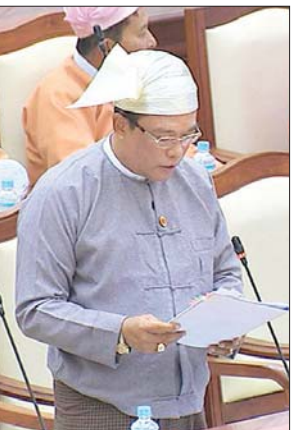
ဒုတိယဝန်ကြီး ဒေါက်တာကျော်လင်း