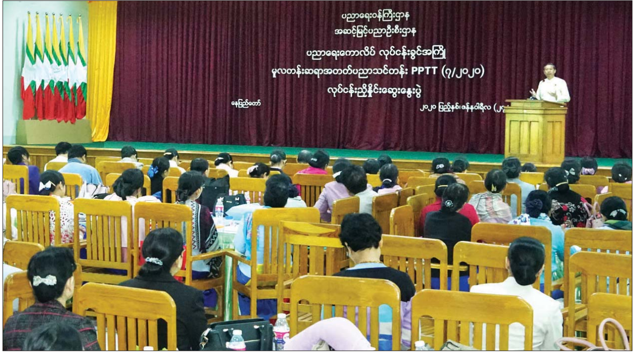
ပြည်ထောင်စုဝန်ကြီး ဒေါက်တာမျိုးသိမ်းကြီး လုပ်ငန်းခွင်အကြံပေးမှုလုပ်ငန်းဆရာအတတ်ပညာ(Pre - Service Primary Teacher Training - PPTT) တစ်နှစ်သင်တန်း သင်ရိုးရေးဆွဲမှု လုပ်ငန်းညှိနှိုင်းဆွေးနွေးပွဲတွင် အမှာစကား ပြောကြားစဉ်။ သတင်းစဉ်

ဆွေးနွေးပွဲတွင် ပညာရေးဝန်ကြီးဌာန ပြည်ထောင်စုဝန်ကြီး ဒေါက်တာမျိုးသိမ်းကြီးက ပညာရေးပြုပြင်ပြောင်းလဲရေးလုပ်ငန်းများ အောင်မြင်စွာ အကောင်အထည်ဖော် ဆောင်ရွက်ရာတွင် ဆရာဆရာမများသည် အဓိကပင်မအခန်းကဏ္ဍတွင် ပါဝင်ပါကြောင်း၊ ဆရာအတတ်ပညာများ လေ့ကျင့်မွေးထုတ်ပေးရာတွင် အခြေခံပညာကဏ္ဍရှိ ဆရာဆရာမများအတွက် လုပ်ငန်းခွင်အကြံပေးမှု ဆရာအတတ်ပညာ (Pre - Service Teacher Education) နှင့် လုပ်ငန်းခွင်ဆရာအတတ်ပညာ (In-Service Teacher Education) သင်တန်းများဖြင့် အရည်အသွေးမြှင့်တင်ရေးကို ဟန်ချက်ညီညီ ဆောင်ရွက်ပေးလျက်ရှိကြောင်း၊ အမျိုးသားပညာရေးမဟာဗျူဟာစီမံကိန်း အခြေခံပညာပြုပြင်ပြောင်းလဲမှုနှင့်အညီ ဆရာအတတ်ပညာသင်ရိုးညွှန်းတမ်းနှင့် သင်တန်းပုံစံများကို ကာလတိုအတွက် ပြန်လည်ပြင်ဆင်ခြင်းများ ဆောင်ရွက်ရမည်ဖြစ်ကြောင်း၊ ယနေ့ကျင်းပသည့် လုပ်ငန်းခွင်ဆွေးနွေးပွဲ၏ ရည်ရွယ်ချက်သည် လက်ရှိ ခြောက်လသင်ရိုးကို ပြန်လည်သုံးသပ်ပြီး သင်ကြားပို့ချမည့် ဘာသာရပ် အကြောင်းအရာများ၊ သင်တန်းကာလနှင့် သင်တန်းပုံစံများ၊ လက်တွေ့တန်းပြဆင်းခြင်း အစီအစဉ်များ၊ Assignment and Assessment များ၊ သုတေသနပြုအစီအစဉ်များကို အသေးစိတ်ဆွေးနွေးပြီး ရလဒ်ကောင်းများ ထွက်ပေါ်လာရန်ဖြစ်ကြောင်း၊ သို့မဟုတ် အရည်အသွေးရှိသော သင်ရိုးညွှန်းတမ်းများဖြင့် ၂၁ ရာခိုင်နှုန်းကျော်မျှ ပေါင်းသင်းဆက်ဆံရေး၊ ဉာဏ်ရည်ဉာဏ်သွေး၊ တစ်ကိုယ်ရေဖွံ့ဖြိုးမှုနှင့် အလုပ်အကိုင်ရရှိမှုဆိုင်ရာ ကျွမ်းကျင်မှုများဖြင့် အနာဂတ်မျိုးဆက်သစ်များကို ပြုစုပျိုးထောင်ပေးနိုင်မည့် အရည်အသွေးပြည့်ဝ