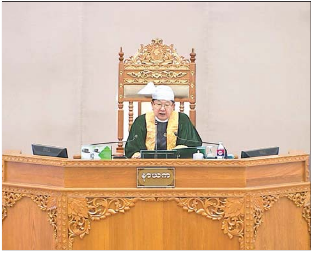
ပြည်ထောင်စုလွှတ်တော် နာယက ဦးတီခွန်မြတ်

ပြည်သူများ၏ဆန္ဒ၊ မျှော်လင့်ချက်များကို ဖြည့်ဆည်းပေးနိုင်ရန်အတွက် ကြံ့တော့လာရန် သည့် အခက်အခဲများကိုလည်း အမှန်တရားနှင့် ညီညွတ်မျှတမှုကို လက်ကိုင်ထားပြီး မှန်မှန်ကန်ကန် ဆွေးနွေးညှိနှိုင်းဖြေရှင်းနိုင်ကြရန် လိုအပ်ပါကြောင်း၊ တိုင်းရင်းသားပြည်သူအများ မျှော်လင့်တောင့်တလျက်ရှိသည့် ဒီမိုကရေစီဖက်ဒရယ်ပြည်ထောင်စုကြီး ပေါ်ထွန်းလာရေးနှင့် ငြိမ်းချမ်းရေး လုပ်ငန်းစဉ်များ အောင်မြင်စေရေးအတွက် ပြည်ထောင်စုလွှတ်တော်ကိုယ်စား