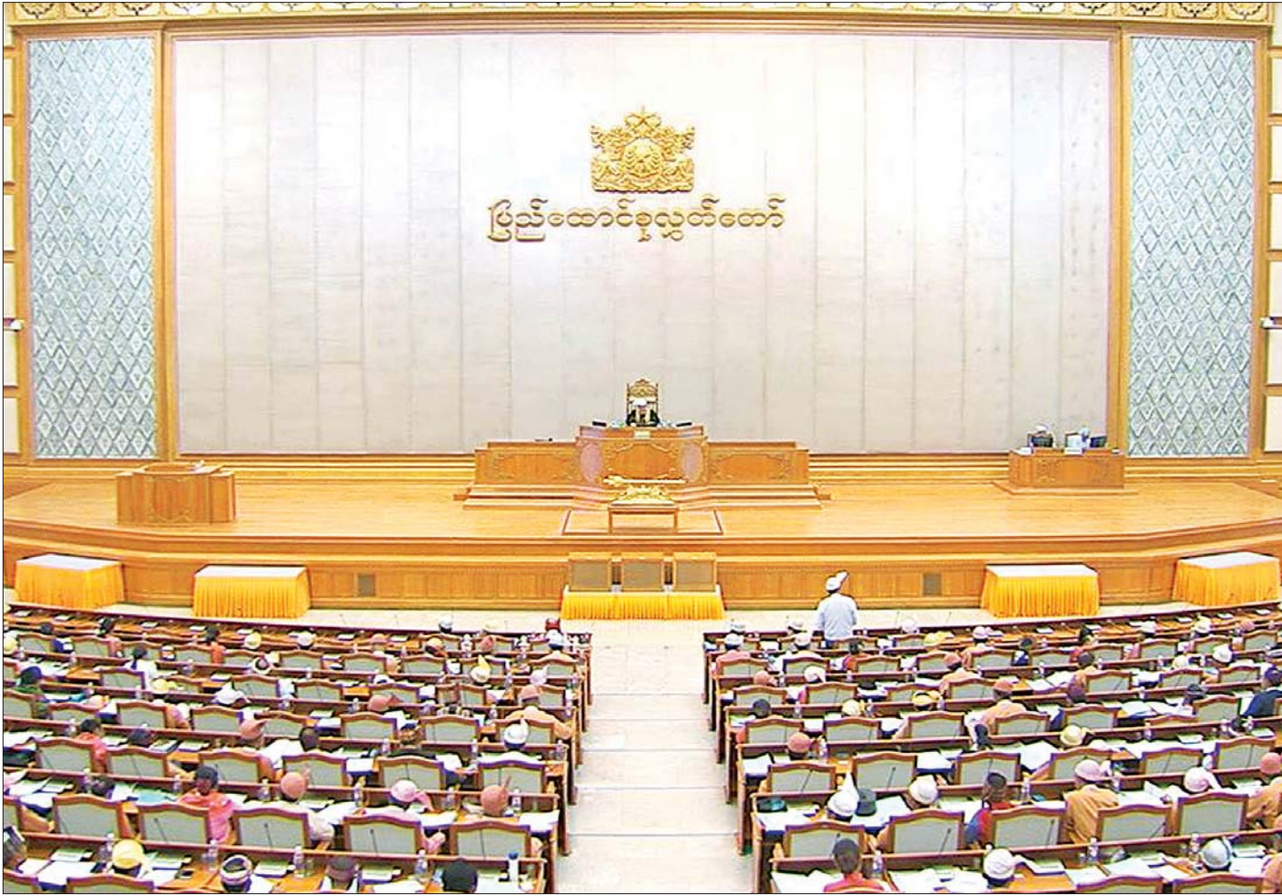
ဒုတိယအကြိမ် ပြည်ထောင်စုလွှတ်တော် (၁၅)ကြိမ်မြောက် ပုံမှန်အစည်းအဝေး ပထမနေ့ ကျင်းပစဉ်။ သတင်းစဉ်