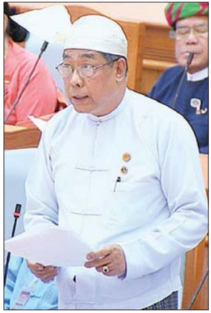
မြန်မာနိုင်ငံတော်ဗဟိုဘဏ် ဒုတိယဥက္ကဋ္ဌ ဦးစိုးမင်း

ထို့နောက် ပြည်ထောင်စုလွှတ်တော်နာယက က အဆိုပါအစီရင်ခံစာနှင့် စပ်လျဉ်း၍ ဆွေးနွေးလိုသည့် လွှတ်တော်ကိုယ်စားလှယ်များ အမည်စာရင်း