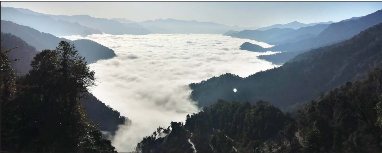
ဆန်းလွတ်ချက်တောင်ပေါ်မှ မြင်တွေ့ရသည့် ရေခဲတောင် ဒေသမြင်ကွင်း။

ပူတာအို ဇန်နဝါရီ ၂၇ ကချင်ပြည်နယ် ပူတာအိုခရိုင်အတွင်း ရေခဲတောင်များစွာရှိသည့်အနက် ယခု နှစ်ဆောင်းရာသီတွင် ပူတာအိုမြို့မှ ရေခဲဆီးနှင်းများ ဖုံးလွှမ်းလျက်ရှိသော ဆန်းလွတ်ချက်တောင်သို့ ကားလမ်း ပေါက်၍ ရေခဲတောင်နှင့် ဆီးနှင်း ကြည့်ရှုလိုသူများအတွက် သွားလာမှု အဆင်ပြေလျက်ရှိကြောင်း သိရသည်။