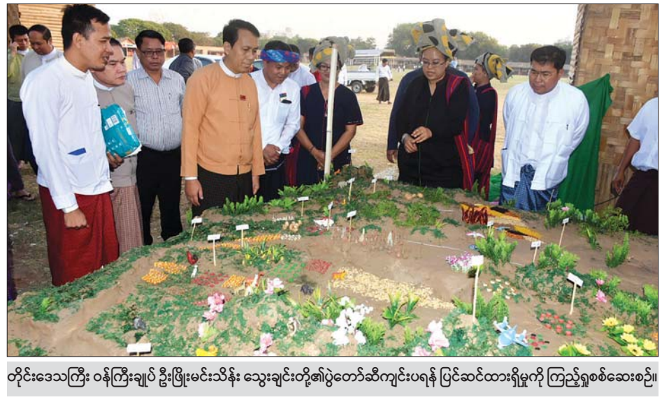
တိုင်းဒေသကြီး ဝန်ကြီးချုပ် ဦးဖိုးမင်းသိန်း သွေးချင်းတို့ရဲ့ပွဲတော်ဆီကျင်းပရန် ပြင်ဆင်ထားရှိမှုကို ကြည့်ရှုစစ်ဆေးစဉ်။

များက မိမိတို့တာဝန်ယူဆောင်ရွက်မည့်ကဏ္ဍများကို ရှင်းလင်းတင်ပြကြရာ တိုင်းဒေသကြီး ဝန်ကြီးချုပ်က ပွဲတော်ကြီး အောင်မြင်စွာ ကျင်းပနိုင်ရေးအတွက် သက်ဆိုင်ရာ ဆပ်ကော်မတီများမှ တာဝန်ရှိသူများ ပေါင်းစပ်ညှိနှိုင်း ပူးပေါင်းလုပ်ဆောင်ကြရန်နှင့် လိုအပ်ချက်များရှိပါက မိမိတို့တိုင်းဒေသကြီး အစိုးရအဖွဲ့မှ ကူညီဆောင်ရွက်ပေးမည်ဖြစ်ကြောင်း မှာကြားသည်။ ပြီးနောက် တိုင်းဒေသကြီး ဝန်ကြီးချုပ်နှင့်တာဝန်ရှိသူများသည် ပွဲတော်အတွက် ကြိုတင်ပြင်ဆင်ဆောင်ရွက်နေမှုများကို ကြည့်ရှုခဲ့ကြသည်။ ဆန်းကျော်ဦး (ပြန် / ဆက်)