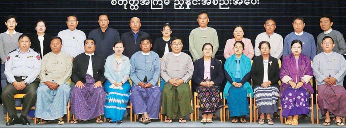
ပြည်ထောင်စုဝန်ကြီး ဒေါက်တာဝင်းမြတ်အေး မြန်မာနိုင်ငံ သက်ကြီးရွယ်အိုများဆိုင်ရာကော်မတီ ညွှန်ကြားမှုဦးစီးဌာန အစည်းအဝေးသို့ တက်ရောက်လာကြသူများနှင့် စုပေါင်းမှတ်တမ်းတင်စာတိုပုံရိုက်စဉ်။

အထောက်အပံ့ရယူခွင့်၊ စရိတ်ထောက်ပံ့မှု လိုအပ်သော မိဘဘိုးဘွားများက ၎င်းတို့၏ သားသမီးနှင့် မြေးများထံမှ စရိတ်ထောက်ပံ့မှု ရရှိခွင့် စသည်ဖြင့် သက်ကြီးရွယ်အိုများဆိုင်ရာ ဥပဒေတွင် ပါရှိသော အခွင့်အရေးများကို ရှင်းလင်းဆွေးနွေးပြီး တာဝန်ရှိသူများက သက်ကြီးရွယ်အိုများဆိုင်ရာ နည်းဥပဒေ (မူကြမ်း) အပေါ် ပြည်ထောင်စုရွေ့နေချုပ်ရုံး၏ အကြံပြုချက်များနှင့် ပြင်ဆင်ထားသော နည်းဥပဒေ (မူကြမ်း) ကို ရှင်းလင်းတင်ပြကြရာ တက်ရောက်လာကြသူများက အပြန်အလှန် ညှိနှိုင်းဆွေးနွေးခဲ့ကြသည်။ အဆိုပါ ဆွေးနွေးမှုများမှ ရရှိလာသော အချက်များကို ပြည်ထောင်စုရွေ့နေချုပ်ရုံးသို့ ပြန်လည်ညှိနှိုင်းကာ နည်းဥပဒေ (မူကြမ်း) ကို အတည်ပြုနိုင်ရေး အစိုးရအဖွဲ့ရုံးထံသို့ ဆက်လက်တင်ပြသွားမည် ဖြစ်ကြောင်း သိရသည်။ သတင်းစဉ်