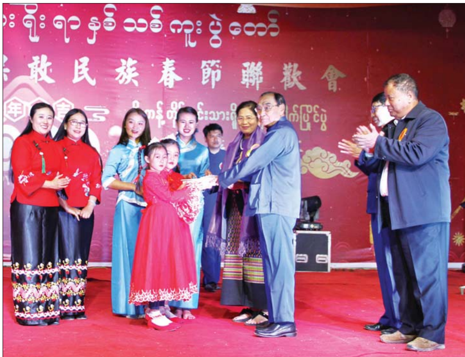
ပြည်ထောင်စုဝန်ကြီး နိုင်သက်လွင် ဖျော်ဖြေရေးအဖွဲ့အား ဂုဏ်ပြုဆုပေး အပ်စဉ်။ သတင်းစဉ်

ထို့နောက် ပြည်ထောင်စုဝန်ကြီး နိုင်သက်လွင်၊ ရှမ်းပြည်နယ် ဝန်ကြီးချုပ် ဒေါက်တာလင်းထွဋ်၊ ပြည်နယ်လွှတ်တော်ဥက္ကဋ္ဌနှင့် ရှမ်းပြည်နယ် လူမှုရေးဝန်ကြီး ဒေါက်တာမျိုးထွန်းတို့က ဖျော်ဖြေရေးအဖွဲ့များအား ဂုဏ်ပြုဆုများကို လည်းကောင်း၊ ပြည်ထောင်စုဝန်ကြီး၏ ဇနီးနှင့် ဝန်ကြီးချုပ်၏ ဇနီးတို့က ဂုဏ်ပြုပန်းခြင်းကို လည်းကောင်း ပေးအပ်ချီးမြှင့်ရာ တာဝန်ရှိသူများက လက်ခံရယူသည်။