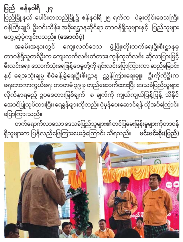
တိုင်းဒေသကြီး(ပြန်/ဆက်)

ပြည် ဇန်နဝါရီ ၂၇ ပြည်မြို့နယ် ပေါင်းတလည်မြို့၌ ဇန်နဝါရီ ၂၅ ရက်က ပဲခူးတိုင်းဒေသကြီး ဝန်ကြီးချုပ် ဦးဝင်းသိန်း၊ အစိုးရဌာနဆိုင်ရာ တာဝန်ရှိသူများနှင့် ပြည်သူများ တွေ့ဆုံပွဲကျင်းပသည်။ (အောက်ပုံ) အခမ်းအနားတွင် ကျေးလက်ဒေသ ဖွံ့ဖြိုးတိုးတက်ရေးဦးစီးဌာနမှ တာဝန်ရှိသူတစ်ဦးက ကျေးလက်လမ်းတံတား၊ ကုန်ထုတ်လမ်း၊ ဆိုလာပြားဖြင့် မီးလင်းရေး၊ သောက်သုံးရေဖြန့်ဝေမှုတို့ကို ရှင်းလင်းပြောကြားကာ ဆည်မြောင်းနှင့် ရေအသုံးချမှု စီမံခန့်ခွဲရေးဦးစီးဌာန ညွှန်ကြားရေးမှူး ဦးကိုကိုဦးက ရေဘေးကာကွယ်ရေး တာဝန် ၃၉ ခု တည်ဆောက်ထားပြီး ဒေသခံပြည်သူများ လိုက်နာရမည့် ဥပဒေတားမြစ်ချက် ၈ ချက်ကို ကျယ်ကျယ်ပြန့်ပြန့် သိနိုင်အောင်ပြုလုပ်ထားပြီး၊ ရေခွန်များကိုလည်း ပုံမှန်ပေးဆောင်ရန် လိုအပ်ကြောင်း ပြောကြားသည်။ တက်ရောက်လာသော ဒေသခံပြည်သူများ၏ တင်ပြမေးမြန်းမှုများကိုတာဝန်ရှိသူများက ပြန်လည်ဖြေကြားပေးခဲ့ကြောင်း သိရသည်။ မင်းမင်းစိုး(ပြည်)