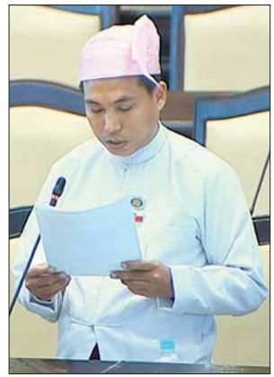
ရခိုင်ပြည်နယ် မဲဆန္ဒနယ် အမှတ်(၈)မှ ဦးကျော်ကျော်ဝင်း

ကျောင်းသူ (၁၂၇) ဦးသာရှိပါကြောင်း၊ ထို့ပြင် အနီးဆုံး အလယ်တန်းအဆင့်သင် ကျောင်းဖြစ်သည့် အမှတ်(၂) အခြေခံပညာအထက် တန်းကျောင်းနှင့် ၆ ဖာလုံ ခန့်အကွင်း၌သာရှိပါကြောင်း၊ ထို့ကြောင့် တင်ပြပါကျောင်းသည် ကျောင်းအဆင့် တိုးမြှင့်ခြင်းဆိုင်ရာ သတ်မှတ်ချက်နှင့် လိုအပ်မှုများရှိနေသောကြောင့် ယခုပညာ သင်နှစ်တွင် အဆင့်တိုးမြှင့်ခြင်းဆိုင်ရာဦးစားပေးအစီအစဉ်တွင် မပါရှိပါကြောင်း ပြောကြားသည်။