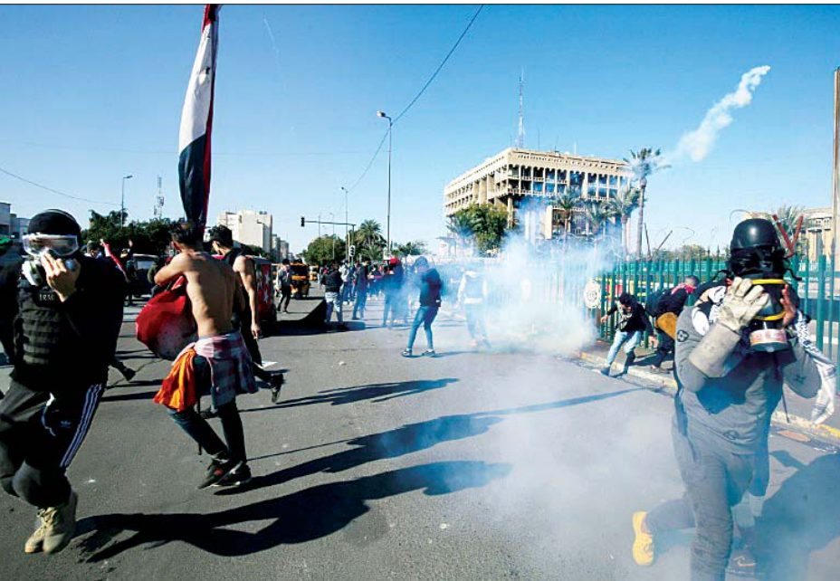
ဆန္ဒပြသူများကို လုံခြုံရေးတပ်ဖွဲ့ဝင်များက လူစုခွဲနေစဉ်။