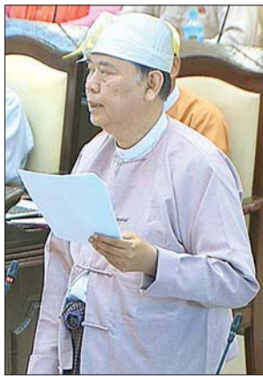
ဒုတိယဝန်ကြီး ဦးဝင်းမော်ထွန်း

ချင်းပြည်နယ် မဲဆန္ဒနယ်အမှတ်(၃)မှ ဦးဘွဲ့ခိုင်၏ ချင်းပြည်နယ်၊ ထန်တလန်မြို့နယ်၊ ထန်တလန်မြို့ အမှတ်(၁) အခြေခံပညာမူလတန်း (လွန်) ကျောင်းအား အခြေခံပညာအလယ်တန်းကျောင်း(ခွဲ)အဖြစ် အဆင့်တိုးမြှင့်ဖွင့်လှစ် ပေးရန် အစီအစဉ် ရှိ/မရှိ မေးခွန်းနှင့် စပ်လျဉ်း၍ ဒုတိယဝန်ကြီး ဦးဝင်းမော်ထွန်း က ထန်တလန်မြို့နယ်၊ အမှတ် (၁) အခြေခံပညာမူလတန်း(လွန်)ကျောင်း၏ လက်ရှိ ပညာသင်နှစ်တွင် စုစုပေါင်း အလယ်တန်းအဆင့်သင် ကျောင်းသား၊