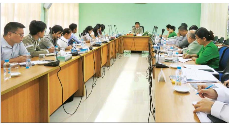
ရက်သတ္တပတ်အတွင်း ခွင့်ပြုပေးခဲ့သော ရင်းနှီးမြှုပ်နှံမှုများနှင့် စပ်လျဉ်းသည့် သတင်းမီဒီယာများနှင့် တွေ့ဆုံပွဲ ကျင်းပစဉ်။

ရန်ကုန် ဇန်နဝါရီ ၂၇ - မြန်မာနိုင်ငံရင်းနှီးမြှုပ်နှံမှုကော်မရှင်၏ အစည်းအဝေးအမှတ်စဉ် (၂/၂၀၂၀) အပါအဝင် တိုင်းဒေသကြီး၊ ပြည်နယ် ရင်းနှီးမြှုပ်နှံမှု ကော်မတီများမှ ရက်သတ္တပတ်အတွင်း ခွင့်ပြုပေးခဲ့သော ရင်းနှီးမြှုပ်နှံမှုများနှင့် စပ်လျဉ်းသည့် သတင်းမီဒီယာများနှင့် တွေ့ဆုံပွဲကို ယနေ့တွင် ရင်းနှီးမြှုပ်နှံမှုနှင့် ကုမ္ပဏီများ ညွှန်ကြားမှုဦးစီးဌာန၌ ကျင်းပသည်။ အဆိုပါ တွေ့ဆုံပွဲတွင် မြန်မာနိုင်ငံ ရင်းနှီးမြှုပ်နှံမှုကော်မရှင် သတင်းထုတ်ပြန်ချက်(၂/၂၀၂၀)အား ဖြန့်ဝေခဲ့ပြီး မြန်မာနိုင်ငံ ရင်းနှီးမြှုပ်နှံမှုကော်မရှင် အတွင်းရေးမှူး၊ ရင်းနှီးမြှုပ်နှံမှုနှင့် ကုမ္ပဏီများ ညွှန်ကြားမှုဦးစီးဌာန ညွှန်ကြားရေးမှူးချုပ် ဦးသန်းစင်လွင်က မြန်မာနိုင်ငံရင်းနှီးမြှုပ်နှံမှု ဥပဒေအရ ခွင့်ပြုမိန့်၊ အတည်ပြုမိန့်ထုတ်ပေးခဲ့သည့် ရင်းနှီးမြှုပ်နှံမှုလုပ်ငန်းများနှင့် စပ်လျဉ်းသည့် အချက်အလက်များအား ရှင်းလင်းပြောကြားခဲ့သည်။ မြန်မာနိုင်ငံ ရင်းနှီးမြှုပ်နှံမှုကော်မရှင် အတွင်းရေးမှူးက မြန်မာ