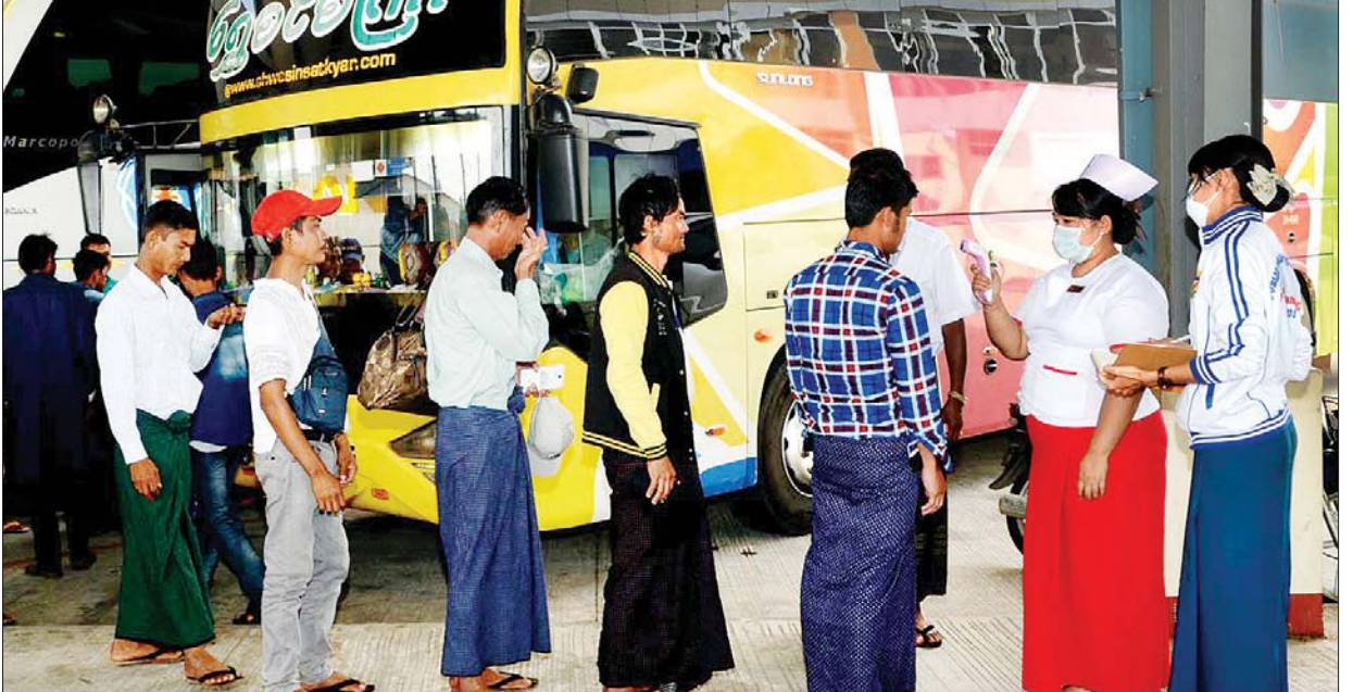
မြတ်မြို့ အဝေးပြေးကားဂိတ်၌ ခရီးသည်များအား နိဗ္ဗာန်ကိုရိနာဗိုင်းရပ်စ် ကူးစက်မှု ရှိ မရှိ စစ်ဆေးဆောင်ရွက်နေစဉ်။

ရန်ကုန် ဇန်နဝါရီ ၂၇ အိုလံပစ်တတိယအဆင့်ခြေစမ်းပွဲအတွက် လေ့ကျင့်ပြင်ဆင်နေသည့် မြန်မာ့ လက်ရွေးစင် အမျိုးသမီးအသင်းနှင့် ထိုင်းလက်ရွေးစင် အမျိုးသမီးအသင်း တို့၏ ဒုတိယခြေစမ်းပွဲကို ဇန်နဝါရီ ၂၈ ရက် (ယနေ့) ညနေ ၄ နာရီတွင် မန္တလေးမြို့ရှိ မန္တလေးသီရိကင်း၌ ကျင်းပမည်ဖြစ်သည်။ ယင်းနှစ်သင်းသည် လာမည့်ရက်ပိုင်းအတွင်းစတင်မည့် အိုလံပစ် တတိယအဆင့်ခြေစမ်းပွဲအတွက် အပြီးသတ်ပြင်ဆင်ရန် ခြေစမ်းပွဲများ ကစားခြင်းဖြစ်ပြီး လေးရက်အတွင်း ခြေစမ်းပွဲနှစ်ပွဲ ကစားခြင်းဖြစ်သည်။ မြန်မာအသင်းနှင့် ထိုင်းအသင်းသည် ပထမခြေစမ်းပွဲအဖြစ် ဇန်နဝါရီ ၂၇ ရက်က ယှဉ်ပြိုင်ကစားရာ ထိုင်းအသင်းက နှစ်ဂိုး-တစ်ဂိုးဖြင့် အနိုင်ရခဲ့သည်။ မြန်မာ အမျိုးသမီးအသင်းသည် ယင်းပွဲတွင် ပထမပိုင်း၌ ကစားပုံမကောင်းခဲ့သော်လည်း စာမျက်နှာ ၁၂ ကော်လံ ၁ ၀