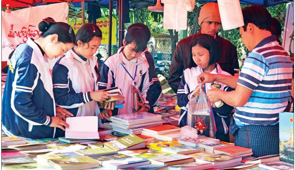
နန်းတော်ရှေ့ နယ်လုံးဆိုင်ရာ စာကြည့်သင်း နှစ် ၁၀၀ ပြည့် ပွဲတော်တွင် ရောင်းချလျက်ရှိသည့်စာအုပ်များအား လာရောက်ဝယ်ယူအားပေးနေကြသည်ကို တွေ့ရစဉ်။

အလှည့်အပြောင်းအများဆုံးနှစ် စာကြည့်အသင်းကြီးသည် ၁၉၂၂ ခုနှစ်မှ စတင် တည်ထောင်ခဲ့ပြီး ၁၉၂၀ ပြည့်နှစ်တွင် မှတ်ပုံတင်၍ နန်းတော်ရှေ့နယ်လုံးဆိုင်ရာ စာကြည့်သင်းအဖြစ် တည်ရှိ ကာ ယခုနှစ်တွင် ရာပြည့်အခမ်းအနား ကျင်းပခြင်း ဖြစ်သည်ကို တွေ့ရှိရပါကြောင်း၊ မြန်မာနိုင်ငံ၌ ယခုနှစ် အတွင်း ၁၉၂၀ ပြည့်နှစ်မှ စတင်ခဲ့သည့် ရာပြည့်အခမ်း အနားများ ကျင်းပရန် စီစဉ်နေပါကြောင်း၊ ၁၉၂၀ ပြည့် နှစ်တွင် စတင်တည်ထောင်ခဲ့သည့် ရန်ကုန်တက္ကသိုလ် ရာပြည့်အခမ်းအနားနှင့် ၁၉၂၀ ပြည့်နှစ်တွင် အကြောင်းပြု ဖြစ်ပေါ်ခဲ့သည့် အမျိုးသားနေ့ ရာပြည့်ပွဲတော်လည်း ကျင်းပရန် ရှိပါကြောင်း၊ ထို့ပြင် ၁၉၂၀ ပြည့်နှစ်တွင် ပေါ်ပေါက်ခဲ့သည့် မြန်မာ့ရုပ်ရှင် နှစ် ၁၀၀ ပြည့် ပွဲတော် ကိုလည်း ကျင်းပရန်ရှိပါကြောင်း၊ ၁၉၂၀ ပြည့်နှစ်သည် မြန်မာနိုင်ငံ၏ သမိုင်း၌ အလွန်အရေးပါသည့် အလှည့် အပြောင်းအများဆုံး နှစ်တစ်နှစ်ဟု စဉ်းစားနိုင်