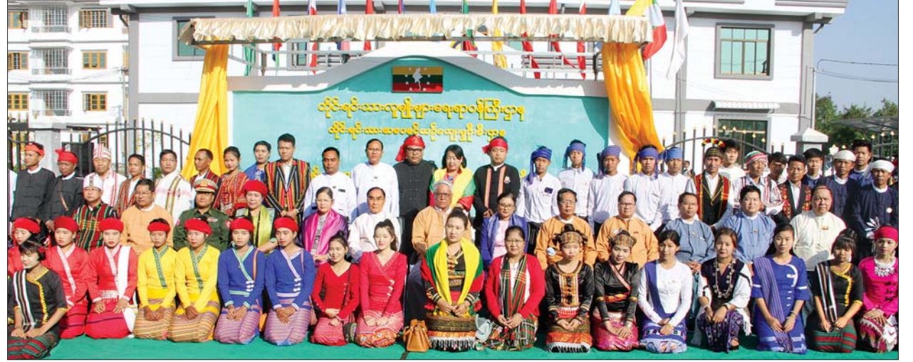
ပြည်ထောင်စုဝန်ကြီး နိုင်သက်လွင်၊ တိုင်းဒေသကြီး ဝန်ကြီးချုပ် ဒေါက်တာမြင့်နိုင်နှင့် တာဝန်ရှိသူများ တိုင်းရင်းသားလူမျိုးများရေးရာဝန်ကြီးဌာန စစ်ကိုင်း တိုင်းဒေသကြီး ဦးစီးဌာနရုံး အဆောက်အအုံသစ်ဖွင့်ပွဲ တက်ရောက်ကြသူများနှင့်အတူ စုပေါင်းမှတ်တမ်းတင် ဓာတ်ပုံရိုက်စဉ်။ သတင်းစဉ်

တိုင်းရင်းသားလူမျိုးများရေးရာဝန်ကြီးဌာန စစ်ကိုင်းတိုင်းဒေသကြီး ဦးစီးဌာနရုံး အဆောက်အအုံသစ်ဖွင့်ပွဲအခမ်းအနားကို ယနေ့ နံနက် ၉ နာရီတွင် ဗိုလ်မှူးကြီး ကျင်းပသည်။