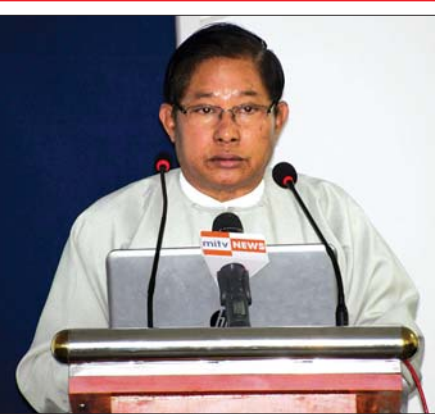
မြို့ရှိ တရုတ်ပြည်သူ့သမ္မတနိုင်ငံဆိုင်ရာ မြန်မာသံရုံးက ဇန်နဝါရီ ၂၄ ရက် ရက်စွဲဖြင့် အသိပေးထုတ်ပြန်ထားကြောင်း သိရသည်။

ထို့ပြင် တရုတ်ပြည်သူ့သမ္မတနိုင်ငံသို့ အကြောင်းအမျိုးမျိုးဖြင့် ရောက်ရှိ နေသော မြန်မာနိုင်ငံသားများအနေဖြင့် လတ်တလောဖြစ်ပွားလျက်ရှိသော နိုဗယ်ကိုရိုနာဗိုင်းရပ်စ် အဆုတ်ရောင်ရောဂါနှင့်စပ်လျဉ်း၍ တရုတ်ပြည်သူ့ သမ္မတနိုင်ငံက ထုတ်ပြန်လျက်ရှိသည့် ကျန်းမာရေးဆိုင်ရာ ကြိုတင်ကာကွယ် ရေးလမ်းညွှန်ချက်၊ လိုက်နာဆောင်ရွက်ရမည့် ညွှန်ကြားချက်များအား တိကျစွာလိုက်နာဆောင်ရွက်သွားရန်နှင့် အခက်အခဲတစ်စုံတစ်ရာရှိပါက မြန်မာသံရုံးသို့ လိုအပ်သည့်အကူအညီများ တောင်းခံနိုင်ကြောင်း ပေကျင်း