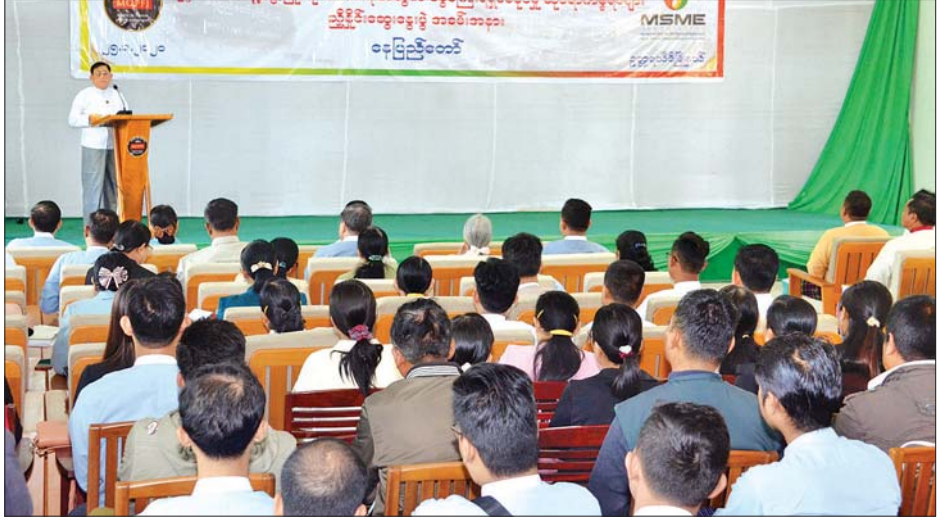
ဒုတိယဝန်ကြီး ဦးမောင်မောင်ဝင်း ပုဂ္ဂလိကကဏ္ဍ ဖွံ့ဖြိုးတိုးတက်ရေးအတွက် ကော်မတီမှ ဆောင်ရွက်ပေးနေမှုများ ကို ရှင်းလင်းပြောကြားစဉ်။

ရရှိစေနိုင်မှုဆိုင်ရာများ ဆောင်ရွက် ရေး လုပ်ငန်းကော်မတီဝင်များ က ပြန်လည်ရှင်းလင်းဆွေးနွေး ပြောကြားခဲ့ကြကာ ဒုတိယဝန်ကြီး က နိဂုံးချုပ်အမှာစကား ပြောကြား သည်။ လုပ်ငန်းရှင်များ တက်ရောက် အခမ်းအနားသို့ ဒုတိယဝန်ကြီး ဦးမောင်မောင်ဝင်း၊ နေပြည်တော် စည်ပင်သာယာရေးကော်မတီ ဒုတိယ မြို့တော်ဝန် ဦးရဲမင်းဦး၊ ဥက္ကဋ္ဌရသီရိ မြို့နယ် ပြည်သူ့လွှတ်တော်ကိုယ်စား လှယ် ဦးကျော်မင်းလှိုင်၊ ပြည်ထောင်စု နယ်မြေ (နေပြည်တော်) အသေးစား အငယ်စားနှင့် အလတ်စားစီးပွား