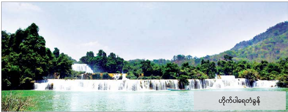
ဟိုက်ပါရေတံခွန်