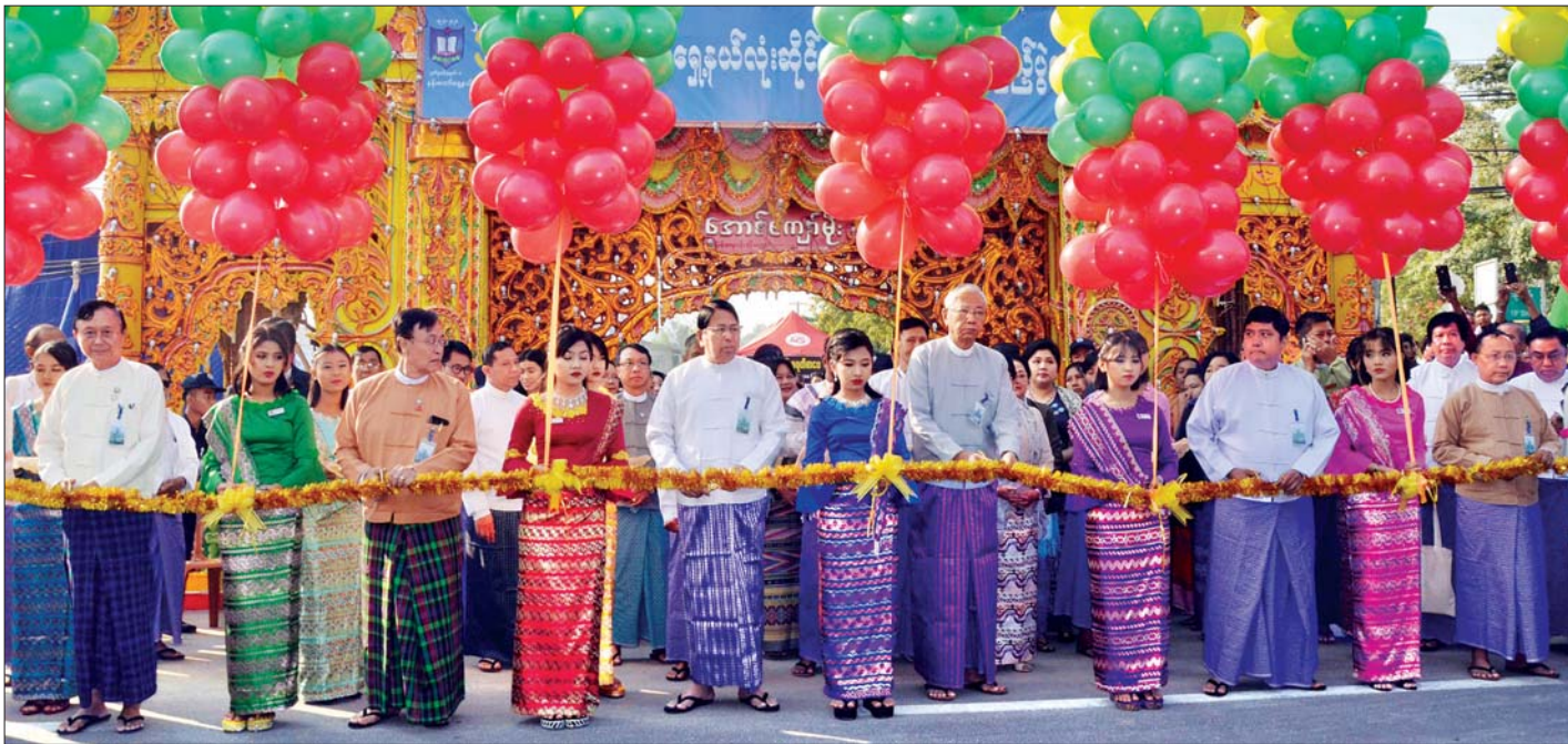
နိုင်ငံတော်သမ္မတဟောင်းဦးထင်ကျော်၊ ပြည်ထောင်စုဝန်ကြီး ဒေါက်တာဖေမြင့်၊ မန္တလေးတိုင်းဒေသကြီး စိုက်ပျိုးရေး၊ မွေးမြူရေးနှင့် ဆည်မြောင်းဝန်ကြီး ဒေါက်တာ စိုးသန်း၊ မန္တလေးမြို့တော်ဝန် ဒေါက်တာရဲလှ၊ ပြည်သူ့လွှတ်တော်ကိုယ်စားလှယ် ဒေါက်တာလှစိုးနှင့် ရာပြည့်ပွဲတော်ကျင်းပရေးကော်မတီဥက္ကဋ္ဌ ဦးကျော်သင်းတို့က နန်းတော်ရှေ့ နယ်လုံးဆိုင်ရာ စာကြည့်သင်း နှစ် ၁၀၀ ပြည့် ပွဲတော်အခမ်းအနားကို ဖဲကြိုးဖြတ်ဖွင့်လှစ်ပေးကြစဉ်။

ထို့နောက် ပြည်ထောင်စုဝန်ကြီး ဒေါက်တာဖေမြင့်က မုဒိတာစကားပြောကြားရာတွင် ယနေ့ကျင်းပသည့် နန်းတော်ရှေ့နယ်လုံးဆိုင်ရာ စာကြည့်သင်း၏ ရာပြည့် ပွဲတော်အခမ်းအနားသို့ စာကြည့်အသင်း ကော်မတီဝင် များမှ ဖိတ်ကြားခဲ့သလို ပြည်သူ့လွှတ်တော်ကိုယ်စားလှယ် ဒေါက်တာလှစိုးကလည်း ကိုယ်တိုင်ကိုယ်ကျ ဖိတ်ကြားခဲ့ ပါကြောင်း၊ မိမိအနေဖြင့်လည်း စာဖတ်အသင်း စာကြည့် အသင်းနှင့် စာကြည့်တိုက်များကို အင်မတန် နှစ်သက် ဝါသနာပါသည့်အပြင် ပြန်ကြားရေးဝန်ကြီးဌာနအနေဖြင့် လည်း တာဝန်ရှိသည့် အစိတ်အပိုင်းဖြစ်သည့်အတွက် ယခုလို ဝမ်းမြောက်ဂုဏ်ယူစွာဖြင့် တက်ရောက်လာ ခြင်းဖြစ်ပါကြောင်း၊ စာကြည့်အသင်းတစ်ခု သို့မဟုတ် စာကြည့်တိုက်တစ်ခု နှစ် ၁၀၀ အထိ တည်တံ့နေခြင်းသည်