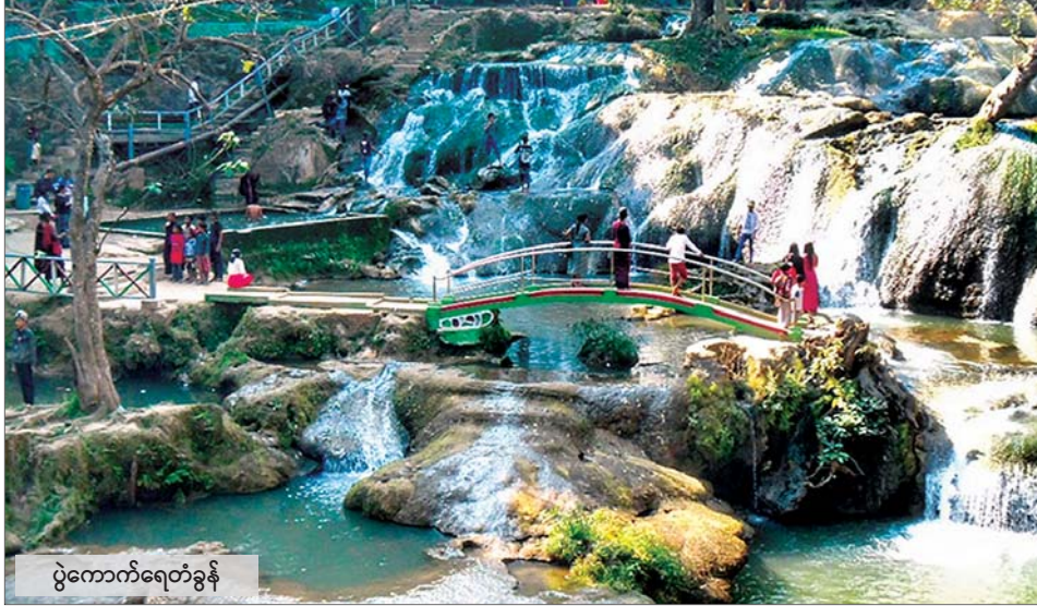
ပွဲကောက်ရေတံခွန်

တောတောင်ထူထပ်တဲ့ နိုင်ငံတွေမှာ အများဆုံး ရှိတာပေါ့ကွယ်။ ဒါပေမယ့်လည်း တစ်ခါတစ်ရံမှာတော့ မြစ်တွေ၊ ချောင်းတွေများတဲ့ ရေလွှမ်းလွင်ပြင်တွေမှာလည်း ရှိတတ်သတဲ့။ မြစ်ချောင်းတွေ အများကြီး စုပေါင်းပြီး ရေပြင်ကျယ်ကြီးကနေ ရေလွှမ်းလွင်ပြင်ကို စီးတဲ့အခါ ရေတံခွန်ပြင်ကျယ်ကြီး ဖြစ်တတ်တာပေါ့။ အတ္တလန္တိတ်သမုဒ္ဒရာအတွင်းကို စီးဝင်တဲ့ ချက်ဆာပိပင်လယ်အော်ရဲ့ တောင်ဘက်မှာ အဲဒီလို ရေတံခွန်ပြင်ကျယ်ကြီးတွေရှိပါတယ်။ ဒါကြောင့် အဲဒီအနီးအနားမှာ ရေအားလျှပ်စစ်ထုတ်ယူကြပြီး လျှပ်စစ်ဓာတ်အားရယူကြတာပေါ့။ ကလေးတို့ မမတို့နိုင်ငံမှာလည်း ကယားပြည်နယ် ဘီလူးချောင်းရေအားကနေ လျှပ်စစ်ဓာတ်အားရယူပြီး ထုတ်လုပ်ပေးနေတာပေါ့။ အမေရိကန်ပြည်ထောင်စုက ဗာဂျီးနီးယားပြည်နယ် ရစ်ချ်မြို့နဲ့ ကယ်ရိုလိုင်းနားပြည်နယ်မြောက်ပိုင်းက ရိုလီမြို့၊ ကျော်ဂျီယာပြည်နယ်က အိုဂတ်စတာမြို့နဲ့ ကိုလံဘတ်မြို့တွေဟာလည်း ရေတံခွန်