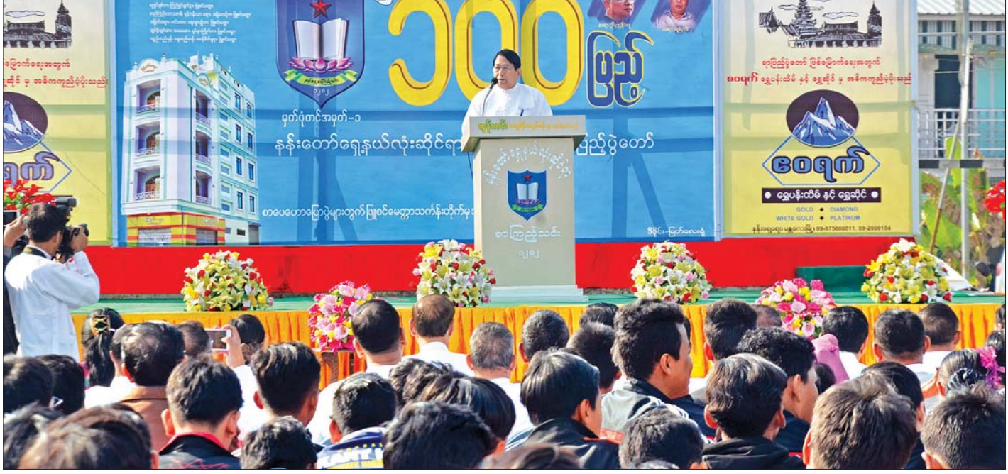
ပြည်ထောင်စုဝန်ကြီး ဒေါက်တာဖေမြင့် နန်းတော်ရှေ့ နယ်လုံးဆိုင်ရာ စာကြည့်သင်း နှစ် ၁၀၀ ပြည့် ပွဲတော်အခမ်းအနားတွင် မုဒိတာစကား ပြောကြားစဉ်။

စိတ်ဓာတ်နိုးကြားတက်ကြွသည့်ကာလ အသိပညာရှာဖွေ လိုသည့်စိတ်ဓာတ်၊ စုပေါင်းဆောင်ရွက်လိုသည့် စိတ်ဓာတ် များဖြင့် လှုပ်ရှားဆောင်ရွက်မှု အများဆုံး လုပ်ဆောင်ခဲ့ ကြသည့် အချိန်ကာလတစ်ခု ဖြစ်မည်ဟု ထင်မြင်ပါကြောင်း၊ မိမိတို့သည် ကမ္ဘာတွင် ဖြစ်ပျက်နေသည့် ကိစ္စများ၊ ကမ္ဘာ က လုပ်ဆောင်နေသည့် ကိစ္စများကို မသိရှိသည့်အတွက် သူ့ကျွန်ဘဝသို့ ရောက်ရှိခဲ့သည်ဟု ထင်မြင်ပါကြောင်း၊ ထိုအချိန်က အသိပညာရှိသော ပုဂ္ဂိုလ်ကြီးများ ပြောကြား ခဲ့ကြသည့် စကားသုံးခွန်းမှာ ကမ္ဘာကို မြန်မာက သိဖို့၊ မြန်မာကို ကမ္ဘာကသိဖို့နှင့် မြန်မာအကြောင်းကို မြန်မာ တွေ သိဖို့ဖြစ်ပါကြောင်း၊ မိမိအနေဖြင့် အလေးထား ပြောကြားလိုသည်မှာ ကမ္ဘာကို မြန်မာတွေ သိဖို့ဖြစ်ပါ ကြောင်း၊ နဂါးနီစာအုပ် အသင်းကြီးသည်လည်း ကမ္ဘာအသိ၊ နိုင်ငံရေးအသိအမြင်များ ရရှိစေရန် လုပ်ဆောင်ပေးခဲ့ ပါကြောင်း၊ ထိုအချိန်ကာလက ကမ္ဘာကိုသိရှိစေရန် စာပေ ဖတ်ရှုခြင်း၊ စာပေဆွေးနွေးခြင်း၊ စာကြည့်အသင်းများ ထူထောင်ကာ လွတ်လပ်သော နိုင်ငံဖြစ်စေရေးအတွက် ရုန်းကန်လှုပ်ရှားခြင်းများဖြင့် ကမ္ဘာနှင့် ရင်ပေါင်တန်းနိုင် ရန် ကြိုးစားခဲ့ကြပါကြောင်း။