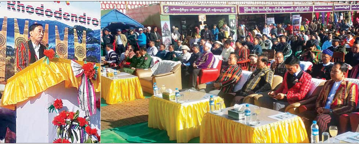
ချင်းပြည်နယ်ဝန်ကြီးချုပ် ဦးဆလှိုင်လျန်လွယ် လောကနူးမြေရိုးရာယဉ်ကျေးမှုနှင့် ခေါ်နူးစုစု တောင်လေပန်းပွဲတော်ဖွင့်ပွဲတွင် အမှာစကားပြောကြားစဉ်။

ဟားခါး ဇန်နဝါရီ ၂၅ ချင်းပြည်နယ်၏ ဒေသတွင်း ခရီးသွားလုပ်ငန်း ပိုမိုဖွံ့ဖြိုးတိုးတက်စေရေး၊ လောကနူးမြေ (ကန်ပက်လက်) ရိုးရာယဉ်ကျေးမှု ဓလေ့ထုံးစံများ၊ အမွေအနှစ်များ ဖော်ထုတ်ထိန်းသိမ်းနိုင်ရေးနှင့် ခေါ်နူးစုစုတောင်နှင့် သဘာဝပတ်ဝန်းကျင်ကို ထိန်းသိမ်း စောင့်ရှောက်နိုင်သည့် အလေ့အကျင့်ကောင်းများရရှိစေရေး ရည်ရွယ်ချက် ချင်းပြည်နယ်အစိုးရအဖွဲ့၏ ကြိုးကြပ်မှု နှင့်အတူ ချင်းပြည်နယ် ခရီးသွားလုပ်ငန်း ဖွံ့ဖြိုးတိုးတက်ရေးကော်မတီ၊ ပြည်နယ်ဟိုတယ်နှင့် ခရီးသွားညွှန်ကြားမှုဦးစီး ဌာန၊ လွှတ်တော်ကိုယ်စားလှယ်များနှင့် ဒေသခံပြည်သူများ၊ ခရိုင်/မြို့နယ် စီမံခန့်ခွဲမှုကော်မတီတို့ ပူးပေါင်း၍ ပထမ အကြိမ် လောကနူးမြေရိုးရာယဉ်ကျေးမှုနှင့် ခေါ်နူးစုစုတောင် လေပန်းပွဲတော်ဖွင့်ပွဲကို ယနေ့ နံနက် ၉ နာရီက ကန်ပက်လက်မြို့၊ အခြေခံပညာအထက်တန်းကျောင်း ဘောလုံးကင်းရှိ ချင်းရိုးရာမုခ်ဦးရှေ့၌ ကျင်းပရာ ပြည်နယ် ဝန်ကြီးချုပ် ဦးဆလှိုင်လျန်လွယ်၊ ချင်းပြည်နယ်လွှတ်တော်ဥက္ကဋ္ဌ ဦးစိုဘွဲ့နှင့် တာဝန်ရှိသူများက ဖဲကြိုးဖြတ်၍ ဖွင့်လှစ်ပေးသည်။