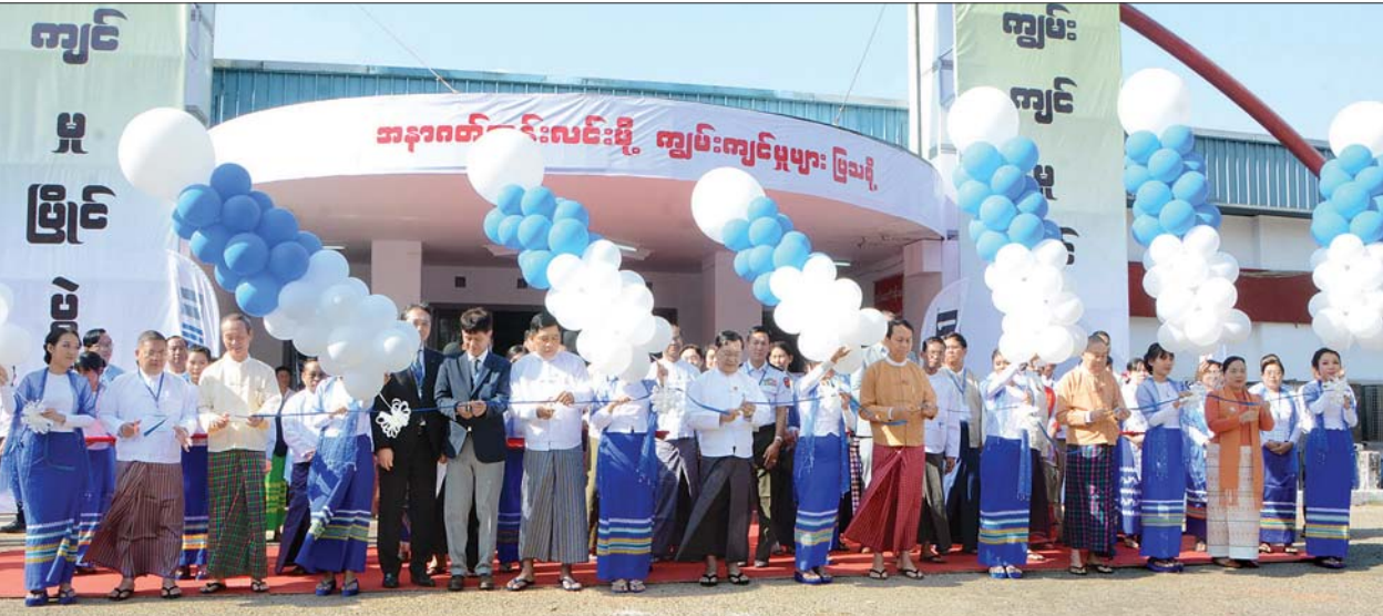
ပြည်ထောင်စုဝန်ကြီး ဦးသိန်းဆွေ တိုင်းဒေသကြီးဝန်ကြီးချုပ် ဦးဖြိုးမင်းသိန်းနှင့် တာဝန်ရှိသူများ မြန်မာကျွမ်းကျင်မှုပြိုင်ပွဲ (၂၀၂၀)ကို ဖွင့်ပွဲတက်ရောက် ဖွင့်လှစ်ပေးစဉ်။

ယနေ့ကမ္ဘာ၏ ဖြစ်ပေါ်ပြောင်းလဲမှုဖြစ်စဉ်များ အဆင့်မြင့်နည်းပညာကို အခြေခံသော စီးပွားရေး၊ လူမှုရေး၊ စက်မှု၊ ပညာရေး၊ ကျန်းမာရေး၊ သယ်ယူ ပို့ဆောင်ရေး၊ ကုန်သွယ်ရေး စသည့် ကဏ္ဍပေါင်းစုံတွင် တစ်ရှိန်ထိုးပြောင်းလဲ တိုးတက်နေပြီး နောက်ဆုံးပေါ် နည်းပညာအသုံးပြုသည့် Industrial 4.0 သို့ ရောက်ရှိနေသဖြင့် အချို့လုပ်ငန်းစဉ်များ၌ Industrial 4.0 ကို အခြေခံသော Education 4.0, HR 4.0, Economic 4.0, Marketing 4.0 နှင့် Banking 4.0 စသဖြင့် ခေတ်ကာလနှင့်အညီ ပြောင်းလဲအကောင်အထည်ဖော်လာကြသည် ကို တွေ့ရကြောင်း၊ အာဆီယံအဖွဲ့အနေဖြင့် အနာဂတ်နည်းပညာ၊ ဈေးကွက် လိုလားချက်နှင့် အလုပ်အကိုင်အခွင့်အလမ်း၊ လူ့စွမ်းအားအရင်းအမြစ် ဖွံ့ဖြိုးတိုးတက်ရေး၊ အငယ်စား၊ အသေးစား၊ အလတ်စားစီးပွားရေးဖွံ့ဖြိုး တိုးတက်ရေးကိုအခြေခံသည့် ASEAN Empowering 4.0 ကို အသွင်ပြောင်းလဲ အကောင်အထည်ဖော်နေသည့်အတွက် မြန်မာနိုင်ငံအနေဖြင့် အနာဂတ် ကာလတွင် အင်အားပြည့်သည့် "Myanmar 4.0" ကို ဖန်တီးနိုင်ရန် လုပ်သား အင်အားစုကို အရည်အချင်းမြှင့်တင်ပေးခြင်းဖြင့် အရည်အချင်းအသစ်များ သင်ကြားပေးနိုင်ရန် အားထည့်ဆောင်ရွက်နေသော အချိန်ကာလဖြစ်ကြောင်း၊ ထို့ကြောင့် လုပ်သားထုကျွမ်းကျင်မှု ဖွံ့ဖြိုးတိုးတက်ရေးအတွက် ကျွမ်းကျင်မှု