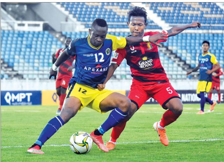
ချင်းယူနိုက်တက်အသင်းနှင့် ဟံသာဝတီအသင်း ယှဉ်ပြိုင်နေစဉ်။