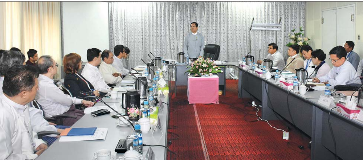
ဒုတိယဝန်ကြီး ဦးအောင်လှထွန်း ရုပ်မြင်သံကြားနှင့် အသံလွှင့်လုပ်ငန်းများ ကြီးကြပ်မှုအဖွဲ့ ၁/၂၀၂၀ အစည်းအဝေးတွင် အမှာစကားပြောကြားစဉ်။ သတင်းစဉ်

အစည်းအဝေးတွင် ရုပ်မြင် သံကြားနှင့် အသံလွှင့်လုပ်ငန်းများ ကြီးကြပ်မှုအဖွဲ့ဥက္ကဋ္ဌ ပြန်ကြားရေး ဝန်ကြီးဌာန ဒုတိယဝန်ကြီး ဦးအောင် လှထွန်းက ယခုအစည်းအဝေးသည် ၂၀၂၀ ပြည့်နှစ်တွင် ပထမဆုံးပြုလုပ် သည့် အစည်းအဝေးဖြစ်ကြောင်း၊ တချို့အကြောင်းအရာများသည် လူ ကိုယ်တိုင် မျက်နှာချင်းဆိုင်တွေ့မှ ပြောဆိုတိုင်ပင်ဆွေးနွေး ပူးပေါင်း ဆောင်ရွက်ရမည့်အရာများ ဖြစ်ပါ ကြောင်း၊ ဒီမိုကရေစီလူ့ဘောင်တွင် မီဒီယာကို တစ်ဦးတစ်ယောက်တည်း လုပ်ဆောင်ခြင်းမရှိကြောင်း၊ အားလုံး ရှင်သန်နိုင်မည့် အခင်းအကျင်းတစ်ခု ပေါ်ထွန်းလာအောင် ပူးပေါင်းဆောင်