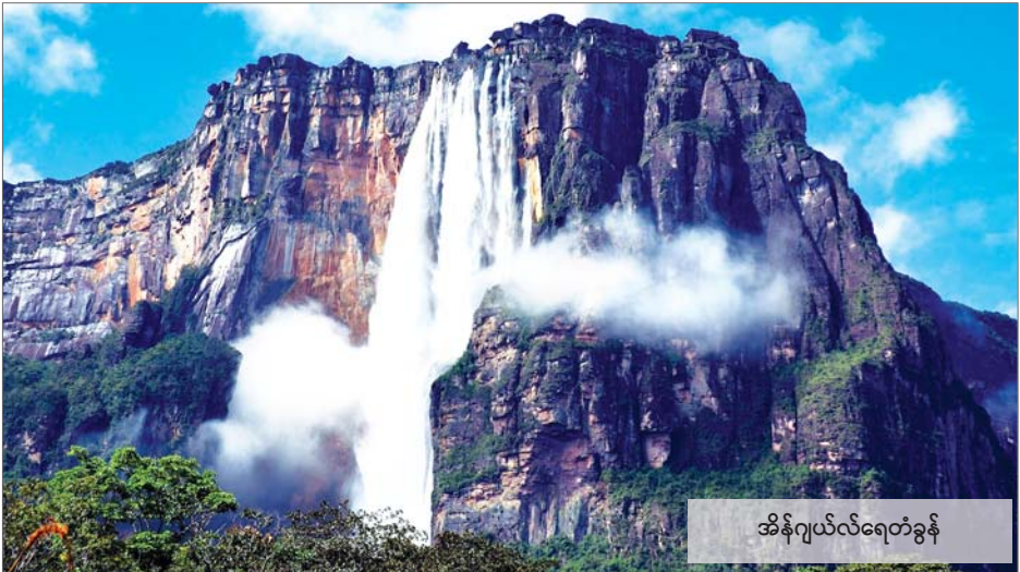
အိန်ဂျယ်ရေတံခွန်

မောင်လေးတို့ ညီမလေးတို့ ရေတံခွန်တွေကို မြင်ဖူးကြလား။ ရေတွေတုတ်တုတ်နဲ့ အပေါ်ကနေအောက်ကို စီးဆင်းနေလိုက်တာ သိပ်ကိုလှတာပေါ့။ ရေမြန်ရေမြော့တွေကလည်း အနီးအပါးမှာ လှည့်ပျံနေတာပဲ။ ရေတံခွန်ပေါ်ကနေ ကျလာတဲ့ ရေတွေက သိပ်အေးပြီး အောက်ကကျောက်တုံး ကျောက်ခဲတွေဟာဆိုရင်လည်း ရေတွေဖြတ်စီးနေတဲ့အတွက် ပြောင်ချောနေကြတယ်။ အချို့ကျောက်တုံးတွေဆိုရင် အစိမ်းရောင်ရေညှိတွေနဲ့ တောက်ပလို့ ရေနဲ့နီးတဲ့အတွက် ပတ်ဝန်းကျင်မှာလည်း စိမ်းစိုနေတဲ့ သစ်ပင်တွေကို အများအပြားမြင်ရတယ်။