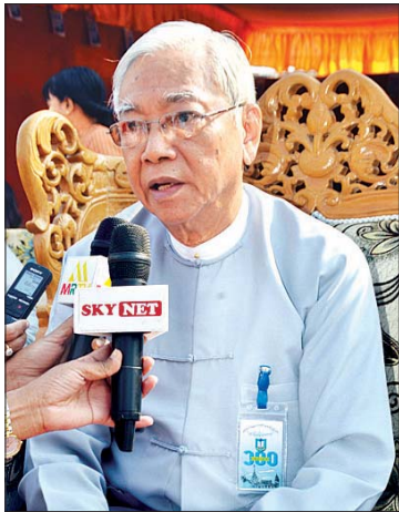
ဦးထင်ကျော် (နိုင်ငံတော်သမ္မတဟောင်း)

မန္တလေး ဇန်နဝါရီ ၂၅ မန္တလေးမြို့ အောင်မြေသာစံမြို့နယ် အနိပ်တော်ရပ်ကွက် ၁၉ လမ်းနှင့် လမ်း ၂၀ ကြားရှိ နန်းတော်ရှေ့နယ်လုံးဆိုင်ရာ စာကြည့်သင်း၏ ရာပြည့်အထိမ်းအမှတ် ပွဲတော်ကို ဇန်နဝါရီ ၂၃ ရက်မှ ၂၅ ရက်အထိ နန်းတော်ရှေ့ ဘောလုံးကွင်းအတွင်း စည်ကားသိုက်မြိုက်စွာ ကျင်းပ လျက်ရှိသည်။ အဆိုပါအသင်းကြီးကို ၁၉၂၀ ပြည့်နှစ်တွင် ဆရာကြီး ဦးရာဇော်၊ နန်းတော်ရှေ့ဆရာတင် တို့နှင့်အတူ နန်းတော်ရှေ့ ဒေသခံများ ဦးဆောင်ဖွဲ့စည်းတည်ထောင်ခဲ့ပြီး မန္တလေးမြို့ စာကြည့်သင်းများအနက် မှတ်တိုင် အမှတ်စဉ်(၁)အဖြစ် ဖွင့်လှစ်ခဲ့သည့်အပြင် စာပေ၊ ဂီတ၊ အနုပညာအသိုင်းအဝိုင်းများ၊