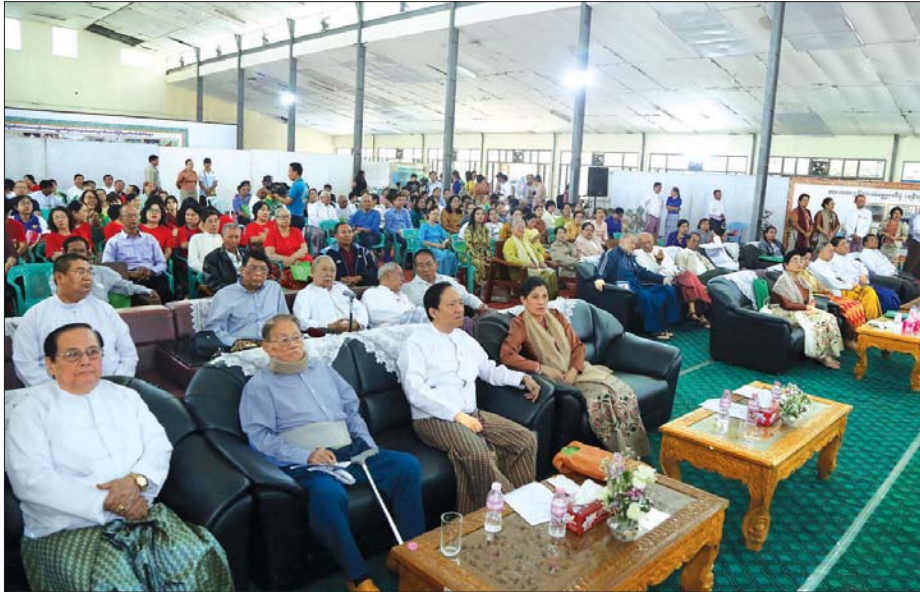
ပြည်ထောင်စုဝန်ကြီး ဒေါက်တာမြင့်ထွေး မြန်မာ့အားကစားလက်ရွေးစင်ဟောင်းများအသင်း ပဉ္စမအကြိမ် အသင်းဝင်များစုံညီတွေ့ဆုံပွဲတွင် အမှာစကား ပြောကြားစဉ်။ သတင်းစဉ်

ယင်းနောက် ဒုတိယဝန်ကြီး ဒေါက်တာမြလေးစိန်က မြန်မာ့အားကစားလက်ရွေးစင်ဟောင်းများ အသင်းကို