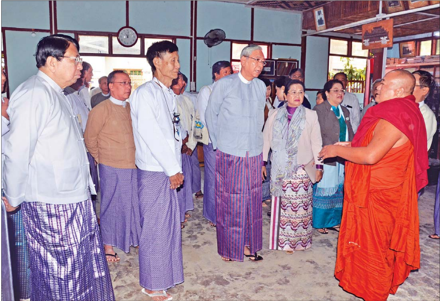
နိုင်ငံတော်သမ္မတဟောင်း ဦးထင်ကျော်နှင့် ဇနီး၊ ပြည်ထောင်စုဝန်ကြီး ဒေါက်တာဖေမြင့်တို့ နန်းတော်ရှေ့ နယ်လုံးဆိုင်ရာ စာကြည့်သင်းကို ကြည့်ရှုလေ့လာကြစဉ်။

နန်းတော်ရှေ့ နယ်လုံးဆိုင်ရာ စာကြည့်သင်းသည် ၁၉၂၀ ပြည့်နှစ်တွင် စတင်တည်ထောင်ခဲ့သည့် ပထမဆုံး မှတ်တမ်းထားသည့် စာကြည့်တိုက်၊ မန္တလေးမြို့၏ သက်တမ်းအရှည်ကြာဆုံး စာကြည့်သင်းကြီး ဖြစ်သည်။ နန်းတော်ရှေ့စာကြည့်သင်းကို ဆဋ္ဌသင်္ဂါယနာတင် ဝန်ဆောင်ပုဂ္ဂိုလ် ဦးဓမ္မာဘိဝံသကဲ့သို့ သာသနာ့ အာဇာနည်များ ပါဝင်သကဲ့သို့ ပညာရေးဝန်ကြီးဟောင်း အာဇာနည်ခေါင်းဆောင်ကြီး ဆရာကြီး ဦးရာဇော်၊ နန်းတော်ရှေ့ဆရာတင် စသည့် ထူးချွန်ထင်ရှားသည့် ပုဂ္ဂိုလ်ကြီးများက စတင်တည်ထောင်ခဲ့ခြင်း ဖြစ်သည်။ ပရိယတ္တိ စာကြည့်သင်းမှ မြို့ရှေ့စာကြည့်သင်း၊ ၎င်းမှ နန်းတော်ရှေ့စာကြည့်သင်း စသည်ဖြင့် ခေတ်အဆက်