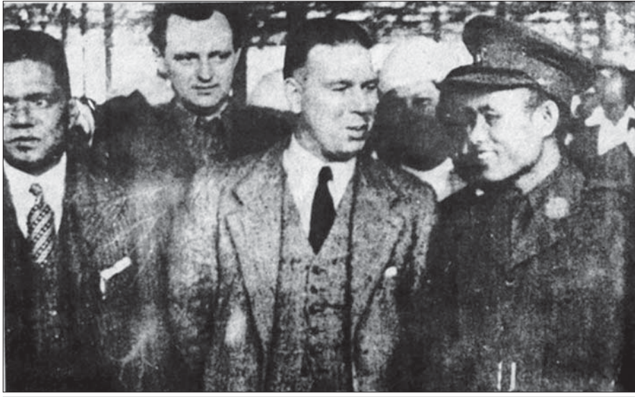
ဝဲမှယာ - ဦးဖေခင်၊ ဘားနတ်လက်ဒဝစ် (မြန်မာနိုင်ငံဆိုင်ရာ ဝန်ကြီးရုံးအရာရှိ)၊ မစ္စတာ ဘော်တွမ်လေ၊ ဗိုလ်ချုပ်အောင်ဆန်း။

ထို့ကြောင့် မြန်မာ့လွတ်လပ်ရေးအတွက် အာမခံ ချက်ပေးသော အောင်ဆန်း - အက်တလီ စာချုပ် (Aung San - Attlee Agreement) ကို ၁၉၄၇ ခုနှစ် ဇန်နဝါရီလ ၂၇ ရက်နေ့တွင် ဗိုလ်ချုပ်အောင်ဆန်းနှင့် အက်တလီတို့က