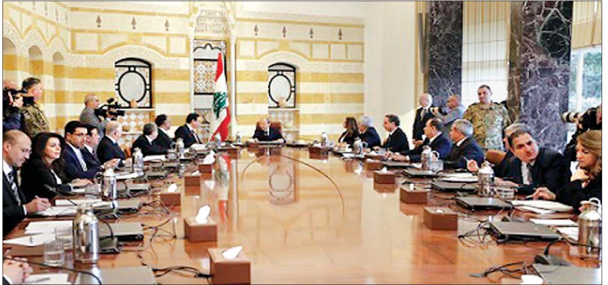
အသစ်ဖွဲ့စည်းလိုက်သည့် အစိုးရအဖွဲ့ကို သမ္မတနှင့်အတူ တွေ့ရစဉ်။

လက်ဘနွန်နိုင်ငံတစ်ဝန်း ပြုလုပ်ခဲ့တဲ့ဆန္ဒပြပွဲတွေမှာ ပါဝင်ခဲ့တဲ့ ဆန္ဒ