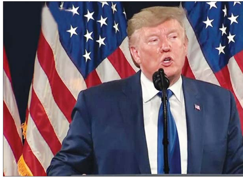
အမေရိကန်သမ္မတ ဒေါ်နယ်ထရမ်

ကောင်းမွန်သော အစီအစဉ်တစ်ခုပင် ဖြစ်သည်ဟု ထရမ်က ပြောသည်။ အမေရိကန်သမ္မတက သတင်း ထောက်များနှင့် မတွေ့ဆုံမီ အမေရိ ကန်အစိုးရက ကြေညာချက်တစ်ခု ထုတ်ပြန်ခဲ့သည်။ အဆိုပါ ကြေညာ ချက်မှာ သမ္မတထရမ်က အစွဲအမူဝန်ကြီး ချုပ် ဘန်ဂျမင်နေတန်ယာဟုနှင့် အစွ ရေး အတိုက်အခံပေါ်တီခေါင်းဆောင် ဘန်နီကန်တို့ကို အိမ်ဖြူတော်သို့ဖိတ်ခေါ် ခဲ့သည့် အကြောင်းပင်ဖြစ်သည်။ ဇန်နဝါရီ ၂၈ ရက်တွင် အိမ်ဖြူ တော်သို့လာရောက်ရန် ဖိတ်ခေါ်ခဲ့ခြင်း ဖြစ်သည်။ အစွရေးခေါင်းဆောင်များ နှင့် မတွေ့ဆုံမီ ၎င်း၏ငြိမ်းချမ်းရေး အစီအစဉ်ကို အသေးစိတ်ဖော်ပြသွား မည်ဟု ထရမ်ကပြောကြားခဲ့သည်။ ၂၀၁၇ ခုနှစ်တွင် ဂျေရုဆလင်မြို့ကို ထရမ်အစိုးရအဖွဲ့က အစွရေးနိုင်ငံ၏ မြို့တော်အဖြစ် သတ်မှတ်ခဲ့သည်။ ပြီးခဲ့သည့် နိုဝင်ဘာလတွင် အနောက်ဘက်ကမ်းတွင် အစွရေး ဘက်မှ အခြေချနေထိုင်မှုမှာ အပြည် ပြည်ဆိုင်ရာ ဥပဒေနှင့် မညီညွတ်ဟု ပြောဆိုခဲ့သည်။ ဆင်ဟွာ