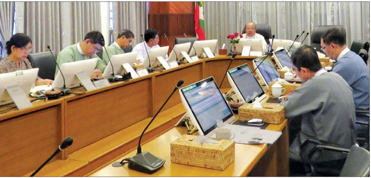
ဖြင့်လည်းကောင်း၊ ကုန်ထုတ်လုပ်မှုကဏ္ဍတွင် စုစုပေါင်း ရင်းနှီးမြှုပ်နှံမှု၏ ၁၄ ဒသမ ၀၇ ရာခိုင်နှုန်းဖြင့်လည်းကောင်း ရင်းနှီးမြှုပ်နှံထားကြောင်း သိရသည်။ သတင်းစဉ်

လုပ်ငန်းများ၏ ရင်းနှီးမြှုပ်နှံမှုပမာဏမှာ အမေရိကန်ဒေါ်လာ ၃၉၄ ဒသမ ၀၉၅ သန်းနှင့် ငွေကျပ် သန်း ၁၅၂၀ ရှိပြီး ပြည်တွင်းလုပ်ငန်းများအတွက် အလုပ်အကိုင်အခွင့်အလမ်းပေါင်း ၁၅၀၇ နေရာကို ဖန်တီးပေးနိုင်မည်ဖြစ်သည်။ ရင်းနှီးမြှုပ်နှံထား ၂၀၁၉ ခုနှစ် ဒီဇင်ဘာလကုန်အထိ ရင်းနှီးမြှုပ်နှံမှုအများဆုံး ပြုလုပ်သော နိုင်ငံများမှာ စင်ကာပူနိုင်ငံ၊ တရုတ်ပြည်သူ့သမ္မတနိုင်ငံနှင့် ထိုင်းနိုင်ငံတို့ဖြစ်သည်။ နိုင်ငံပေါင်း ၅၀ မှ စီးပွားရေးကဏ္ဍ ၁၂ ခုတွင် အများဆုံး ရင်းနှီးမြှုပ်နှံထားရှိမှုမှာ ရေနံနှင့် သဘာဝဓာတ်ငွေ့ကဏ္ဍတွင် စုစုပေါင်း ရင်းနှီးမြှုပ်နှံမှု၏ ၂၇ ဒသမ ၀၀ ရာခိုင်နှုန်းဖြင့် လည်းကောင်း၊ လျှပ်စစ်ကဏ္ဍတွင် စုစုပေါင်း ရင်းနှီးမြှုပ်နှံမှု၏ ၂၆ ဒသမ ၁၅ ရာခိုင်နှုန်းဖြင့်