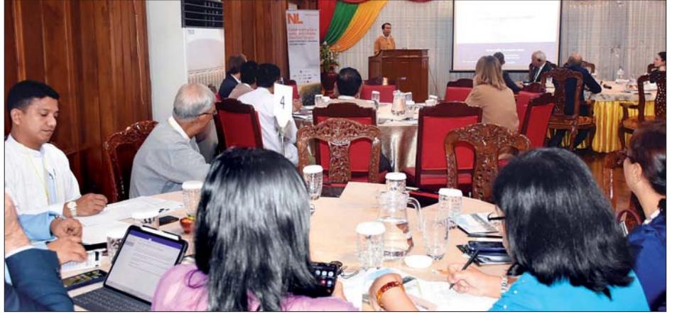
ရန်ကုန်မြစ်အတွင်း ရေလမ်းကြောင်းကောင်းမွန်ရေးနှင့် ရေအရင်းအမြစ်အသုံးချရေး အလုပ်ရုံဆွေးနွေးပွဲပြုလုပ်ကျင်းပစဉ်။