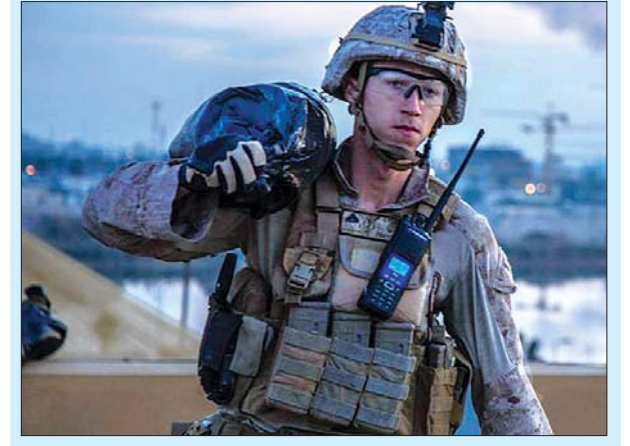
ဘဂ္ဂဒ်မြို့ အမေရိကန်သံရုံးအတွင်းမှ အမေရိကန်တပ်ဖွဲ့ဝင်တစ်ဦးကို တွေ့ရစဉ်။

ခရီးသွားလာခွင့်မရဘဲပေးမှု ယာယီရပ်ဆိုင်းမည်ဟု ဇန်နဝါရီ ၂၃ ရက်တွင် ထရမ်အစိုးရအဖွဲ့က ကြေညာခဲ့သည်။ လျှောက်လွှာရှင်များကို အမေရိကန်သို့ရုံးတွင် မေးမြန်းခြင်းများပြုလုပ်ကာ အခြားသောအကြောင်းအရာများကို ထည့်သွင်းစဉ်းစားပြီးမှသာ ဗီဇာထုတ်ပေး ရန် သင့် မသင့်ကို ဆုံးဖြတ်သွားမည်ဟု ပြောသည်။ ဇန်နဝါရီ ၂၄ ရက်မှစတင် ကာ ယင်းစည်းမျဉ်းအတိုင်း လုပ်ဆောင်မည်ဖြစ်သည်။ ဆင်ဟွာ