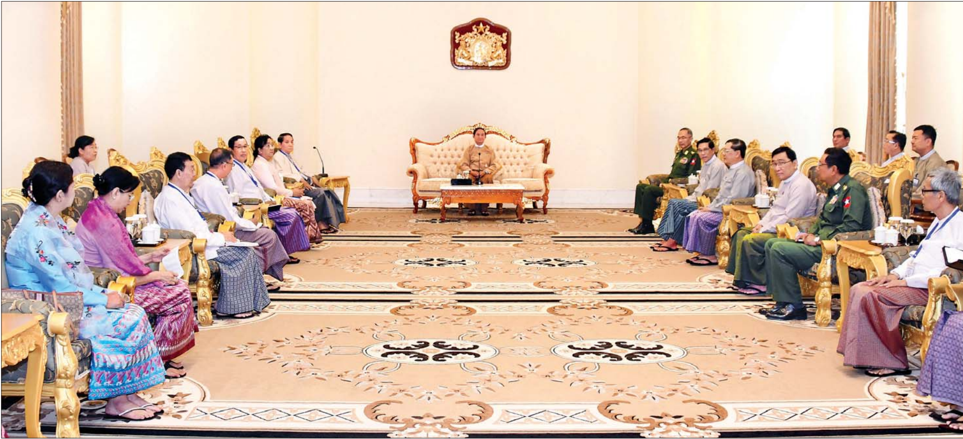
နိုင်ငံတော်သမ္မတ ဦးဝင်းမြင့် မြန်မာနိုင်ငံအမျိုးသားလူ့အခွင့်အရေးကော်မရှင်ဥက္ကဋ္ဌ ဦးလှမြင့်နှင့် အဖွဲ့ဝင်များအား တွေ့ဆုံလမ်းညွှန်မှာကြားစဉ်။ သတင်းစဉ်

၁၃၈၁ ခုနှစ်၊ တပို့တွဲလဆန်း ၁ ရက် ၂၀၂၀ ပြည့်နှစ်၊ ဇန်နဝါရီ ၂၅ ရက်၊ စနေနေ့ အတွဲ (၅၉)၊ အမှတ် (၁၁၇)