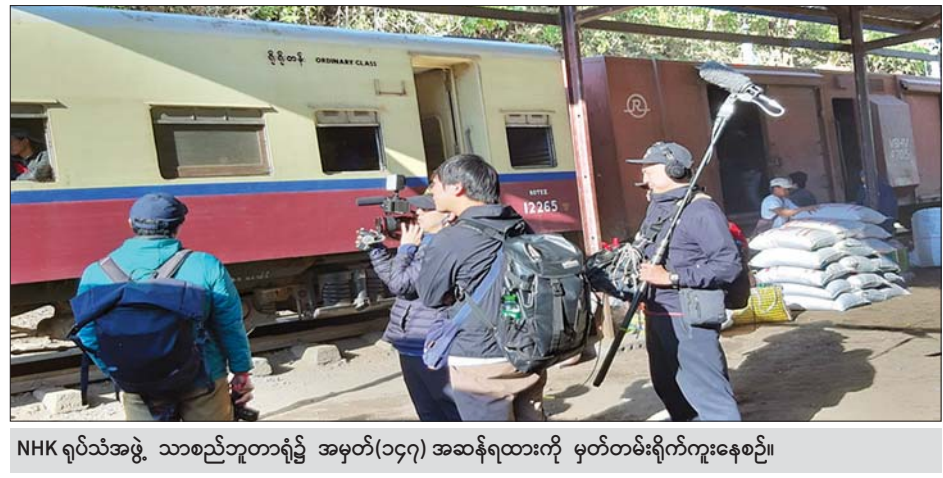
NHK ရုပ်သံအဖွဲ့ သာစည်ဘူတာရုံ၌ အမှတ်(၁၄၇) အဆန်ရထားကို မှတ်တမ်းရိုက်ကူးနေစဉ်။

ရန်ကုန် ဇန်နဝါရီ ၂၄ ဂျပန်နိုင်ငံ NHK ရုပ်သံလိုင်းမှ ရိုက်ကူးရေးအဖွဲ့သည် ယမန်နေ့က သာစည်ဘူတာမှ အမှတ်(၁၄၇) အဆန်ရထားဖြင့် ပထမလွန်းထိုးဘူတာအထိ ရထားစီးနင်းလိုက်ပါပုံ၊ ရုပ်ပိုင်အား လွန်းထိုးရထားလမ်း အကြောင်း မေးမြန်းပုံနှင့် ၎င်းဘူတာအနီး ထမင်းလှည့်လည်ရောင်းချနေပုံ၊ ပထမလွန်းထိုးဘူတာမှ ဆင်တောင်ဘူတာသို့ အမှတ်(၁၄၇) အဆန်ရထားဖြင့် စီးနင်းလိုက်ပါပုံ၊ ခရီးသည်များအား ခရီးစဉ်နှင့် အလုပ်အကိုင်များအကြောင်းမေးမြန်းပုံတို့ကို ရိုက်ကူးခဲ့သည်။ အဆိုပါအဖွဲ့သည် မန္တလေးတိုင်းဒေသကြီး သာစည်မြို့နယ်နှင့် ရှမ်းပြည်နယ်ရှိ ကလေး၊ ညောင်ရွှေတောင်ကြီးနှင့် ဆီဆိုင်မြို့နယ်များရှိ ဘူတာရုံများနှင့် မီးရထားလမ်းတစ်လျှောက် အခြေအနေများကို “မစူးစမ်းရသေးသည့် မီးရထားလမ်း” အမည်ဖြင့် ခရီးသွားမှတ်တမ်းတင်ရုပ်သံအစီအစဉ် ရိုက်ကူးနေခြင်းဖြစ်သည်။ အဆိုပါ ရုပ်/သံအစီအစဉ်တွင် ဂျပန်သရုပ်ဆောင် Mr. Otoo Taku- ma က မီးရထားဖြင့် ခရီးသွားလာပြီး မီးရထားလမ်းတစ်လျှောက်ရှိ လူမျိုးစုများ၏ သမိုင်း၊ ယဉ်ကျေးမှုနှင့် နေထိုင်မှုဘဝများကိုလေ့လာပြီး ခရီးလမ်းတစ်လျှောက်ရှိ သဘာဝရှုခင်းများကို Documentary ရိုက်ကူးလျက်ရှိရာ ၎င်းအစီအစဉ်အား ဂျပန်နိုင်ငံ NHK BS Premium, International Broadcasting On-demand (Online Distribution) ဖြင့် ဧပြီလတွင် ပြသနိုင်ရန် ဆောင်ရွက်နေခြင်းဖြစ်ကြောင်း သိရသည်။ မျိုးမြင့်အောင် (FDC)