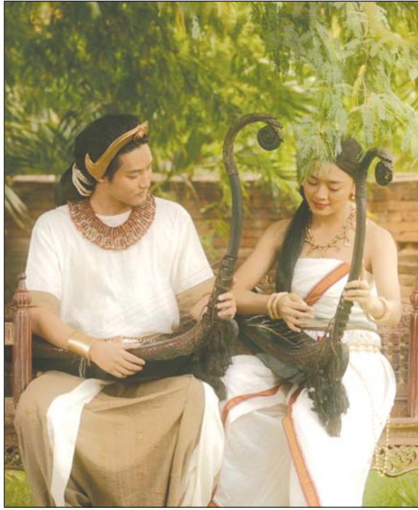
ဂန္ဓဗ္ဗရုပ်ရှင်ကားမှ ဇာတ်ဝင်ခန်းတစ်ခန်း