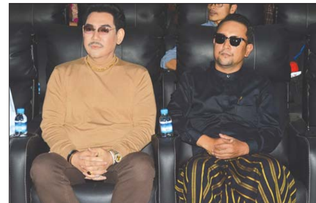
ရွှေကြိုမောင်မယ်ရွေးချယ်ရေးကော်မတီဝင် ရန်အောင်နှင့် ခန့်စည်သူ