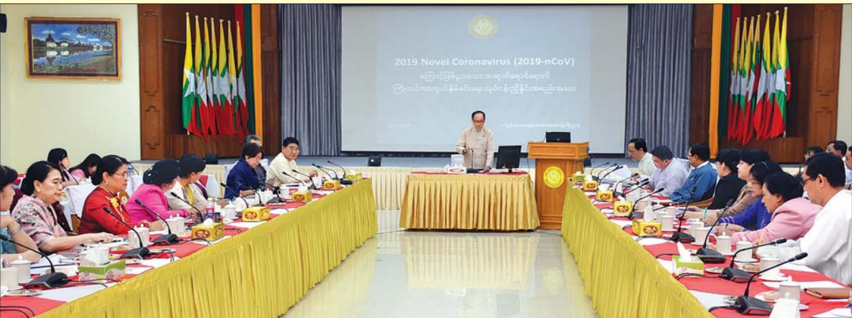
ပြည်ထောင်စုဝန်ကြီး ဒေါက်တာမြင့်ထွေး 2019 Novel Coronavirus (2019-nCoV) ကြောင့် ဖြစ်ပွားသော အဆုတ်ရောင်ရောဂါ ကြိုတင်ကာကွယ်နှိမ်နင်းရေး လုပ်ငန်းညှိနှိုင်းအစည်းအဝေးတွင် အမှာစကားပြောကြားစဉ်။

ကုသရေးဦးစီးဌာနမှ ဒုတိယညွှန်ကြားရေးမှူး ဒေါက်တာဇင်မာစိုးက ရောဂါကာကွယ်ကုသရေးနှင့်ပတ်သက်၍ ရောဂါကုထုံးလမ်းညွှန် (Clinical Management Guideline) များ ရေးဆွဲဖြန့်ဝေထားရှိမှု၊ သံသယလူနာများနှင့် ရောဂါအတည်ပြုလူနာများအတွက် သီးခြားလူနာခန်းများကို ဝေဘာဂီအထူးကုဆေးရုံကြီး၊ မန္တလေးပြည်သူ့ဆေးရုံကြီးနှင့် နေပြည်တော်(ခုတင်-၁၀၀၀)ဆုံပြည်သူ့ဆေးရုံကြီးတို့တွင် ပြင်ဆင်ထားရှိမှု၊ ယခင်ကူးစက်ရောဂါပြန့်ပွားကူးစက်မှုဖြစ်စဉ်များမှ အတွေ့အကြုံများကိုအခြေခံ၍ ကြိုတင်ဓာတ်တိုက်လေ့ကျင့်မှုများ ပြုလုပ်ထားရှိမှု၊ ကျန်းမာရေးလူ့စွမ်းအားအရင်းအမြစ်နှင့် ဆေးနှင့် ဆေးပစ္စည်းကိရိယာများ ကြိုတင်ဖြည့်ဆည်းထားရှိမှုများကို လည်းကောင်း။