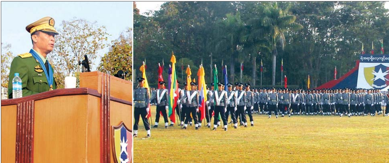
ပြည်ထောင်စုဝန်ကြီး ဒုတိယဗိုလ်ချုပ်ကြီး ကျော်ဆွေ မြန်မာနိုင်ငံရဲတပ်ဖွဲ့၊ ဒုတိယရဲအုပ်လောင်း သင်တန်းအမှတ်စဉ် (၉၇) ရဲသူရဲတပ်ခွဲသင်တန်းဆင်းပွဲအခမ်းအနားတွင် မိန့်ခွန်းပြောကြားစဉ်။

နေပြည်တော် ဇန်နဝါရီ ၂၄ မြန်မာနိုင်ငံရဲတပ်ဖွဲ့၊ ဒုတိယရဲအုပ်လောင်း သင်တန်းအမှတ်စဉ် (၉၇) ရဲသူရဲတပ်ခွဲသင်တန်း ဆင်းပွဲအခမ်းအနားကို ဇန်နဝါရီ ၂၄ ရက် နံနက် ၇ နာရီခွဲတွင် မန္တလေးတိုင်းဒေသကြီး ပြင်ဦးလွင်မြို့နယ် ရဲအရာရှိလေ့ကျင့်ရေးကျောင်း စစ်ရေးပြကွင်း၌ ကျင်းပရာ ပြည်ထောင်စုဝန်ကြီး ဒုတိယဗိုလ်ချုပ်ကြီး ကျော်ဆွေ တက်ရောက် မိန့်ခွန်း ပြောကြားသည်။