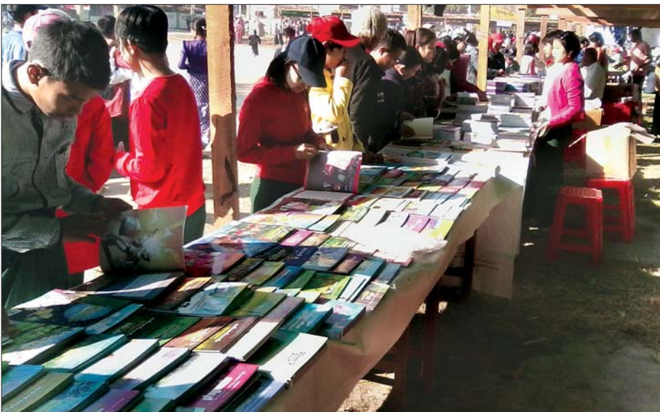
ဗန်းမောက်မြို့ ကလေးစာပေပွဲတော်ရှိ စာအုပ်အရောင်းဆိုင်များတွင် ကျောင်းသား ကျောင်းသူလေးများ ဝယ်ယူဖတ်ရှုနေစဉ်။

ဗန်းမောက် ဇန်နဝါရီ ၂၄ စစ်ကိုင်းတိုင်းဒေသကြီး ဗန်းမောက်မြို့တွင် ကလေးစာပေပွဲတော်ပွဲကို ယမန်နေ့က ဗန်းမောက်မြို့အုပ်ချုပ်ရေးမှူးရုံးရှေ့ရှိ ကျောက်တိုင်ကွင်း၌ ကျင်းပသည်။ အခမ်းအနားတွင် တိုင်းဒေသကြီး လွှတ်တော်ကိုယ်စားလှယ် ဦးဝင်းရွှေနှင့် တာဝန်ရှိသူတို့က ဖဲကြိုးဖြတ် ဖွင့်လှစ်ပေးသည်။ အဆိုပါပွဲတော်တွင် ကျောင်းသားကျောင်းသူများ၏ လက်မှုပြခန်းများ၊ အားကစားပြိုင်ပွဲများ၊ ဆေးရောင်ခြယ်ပြိုင်ပွဲများ၊ ကျောင်းသားကျောင်းသူများ၏ အက၊ အလှများ၊ နေ့စဉ်စတုဒိသာကျေးဇူးပွဲများနှင့် ရန်ကုန်မြို့မှ လာရောက်သော စာအုပ်အရောင်းဆိုင် ခုနစ်ဆိုင်မှလည်း ကျောင်းသား ကျောင်းသူများအတွက် ပညာရေးအထောက်အကူပြု စာအုပ်များကို ဈေးနှုန်းချိုသာစွာဖြင့် အရောင်းပြခန်းများ ဖွင့်လှစ်ပေးထား