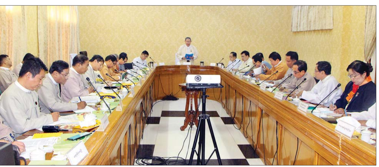
ပြည်ထောင်စုဝန်ကြီး ဦးစိုးဝင်း ပြည်ထောင်စု၏ အခွန်ဘဏ္ဍာငွေ တိုးတက်ရရှိရေး အထောက်အကူပြုဦးစီးကော်မတီ၏ ဒုတိယအကြိမ် လုပ်ငန်းညှိနှိုင်းအစည်းအဝေးတွင် အမှာစကားပြောကြားစဉ်။

အကောင်အထည်ဖော်ဆောင်ရွက်ပေးနိုင်မည် ဖြစ်ပါကြောင်း။ စီမံကိန်း၊ ဘဏ္ဍာရေးနှင့် စက်မှုဝန်ကြီးဌာန၊ ပြည်တွင်းအခွန်များ ဦးစီးဌာနအနေဖြင့် အခွန်ဆိုင်ရာ ပြုပြင်ပြောင်းလဲရေး လုပ်ငန်းစဉ်များကို စဉ်ဆက်မပြတ် လုပ်ဆောင်နေကြောင်း၊ ယနေ့ ခေတ်ကာလသည် နည်းပညာမြင့်မားလာသည်နှင့်အညီ အခွန်ပေးဆောင်ရာတွင် လွယ်ကူလျင်မြန်စေရန် online စနစ်ဖြင့် အခွန်ပေးဆောင်နိုင်ရေးကို အကောင်အထည်ဖော်ဆောင်ရွက်လျက် ရှိပါကြောင်း၊ အခွန်ကောက်ခံနေသည့် ဝန်ထမ်းများအနေဖြင့် ပြဋ္ဌာန်းထားသော အခွန်ဥပဒေများနှင့်အညီ ရသင့်ရထိုက်သော အခွန်ငွေများ ပြည့်ပြည့်ဝဝ ကောက်ခံရရှိရေးအတွက် ကြိုးပမ်းဆောင်ရွက်ကြရန် လိုအပ်ပါကြောင်း၊ ပြောင်းလဲနေသော စီးပွားရေး အခြေအနေများနှင့်အညီ အခွန်ဆိုင်ရာ ဥပဒေများကိုလည်း ပြင်ဆင်ရေးဆွဲချက်ရှိပြီး စွမ်းရည်ပြည့်ဝသည့် အခွန်စီမံခန့်ခွဲမှုစနစ် တစ်ရပ် ပေါ်ထွန်းလာရေးကို အစဉ်တစိုက် ဆောင်ရွက်နေပါကြောင်း၊ အခွန်ရငွေများ အပြည့်အဝ ကောက်ခံရရှိရေးတွင် ကြံ့ကြံ့ရသည့် အခက်အခဲများကို အကြံပြုဆွေးနွေးပေးစေ