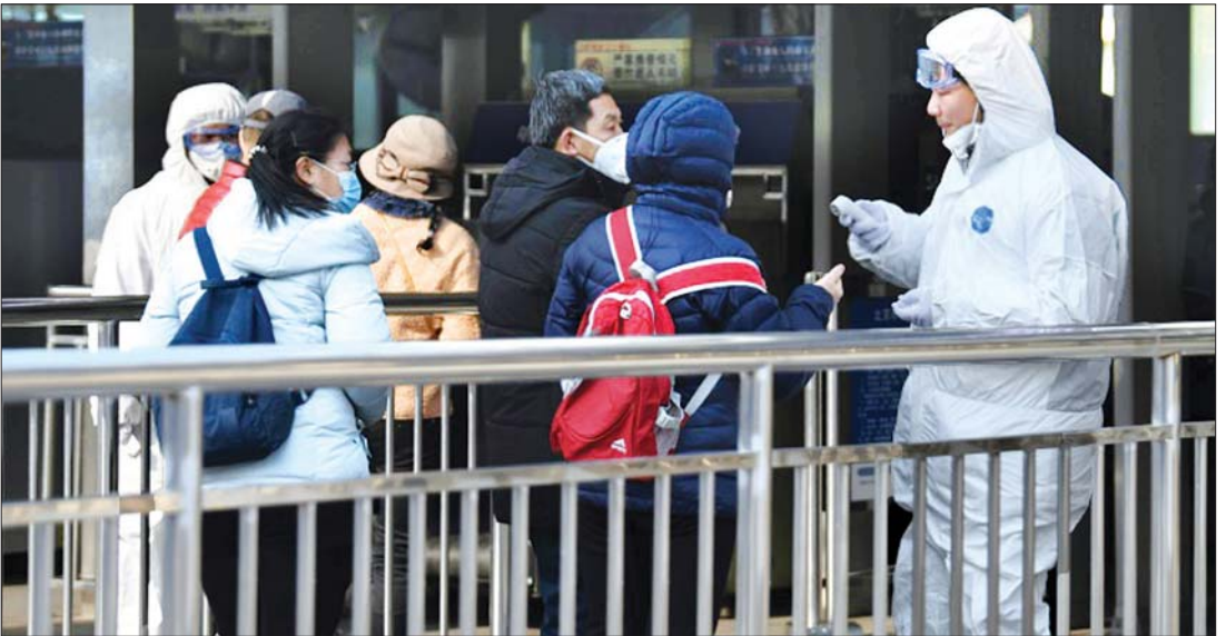
ကိုရိုနာဗိုင်းရပ်စ်ကို စစ်ဆေးမှုများ ပြုလုပ်ပေးစဉ်။ တစ်မျိုးဖြစ်သည့် ကိုရိုနာ ဗိုင်းရပ်စ်ကို အတွင်း စတင်တွေ့ရှိရပြီး ယခုအခါ အဆိုပါ ပျံ့နှံ့ရောက်ရှိနေကြောင်း သိရသည်။ ပင်လယ်စာများရောင်းချသော ဝူဟန်ဈေး ဗိုင်းရပ်စ်ပိုးမှာ အမေရိကန်ပြည်ထောင်စုအထိ အောက်ဖီ

တရုတ်နိုင်ငံသည် ဝူဟန်တစ်ဝန်းရှိ လူပေါင်း သန်း ၂၀ ခန့်ကို သီးသန့်ခွဲခြားထားကာ အနီး နားမြို့များလည်း ဗိုင်းရပ်စ်ကူးစက်ယုံနဲ့အပေါ် တုံ့ပြန်ဆောင်ရွက်မှုများ ပြုလုပ်နေကြောင်း သိရသည်။ တရုတ်နှစ်သစ်ကူး အားလပ်ရက် ခရီးများသွားကြမည့် ရက်သတ္တပတ်အလို အချိန်မျိုးတွင် ရောဂါမြေပွားရေး ဆောင်ရွက် ချက်များကိုလည်း လုပ်ဆောင်နေကြောင်း သိရ သည်။ ဝူဟန်မြို့ဒေသခံများကိုလည်း မြို့မှ ထွက် ခွာခြင်းမပြုရန် တားမြစ်ထားကြောင်း သိရသည်။ ဝူဟန်ရှိ လမ်းများနှင့် ဈေးဆိုင်များလည်း တိတ် ဆိတ်လျက်ရှိပြီး တချို့မီဒီယာများတွင် ဝူဟန် မြို့ကို ထိတ်လန့်ကြောက်ရွံ့စရာကောင်းသော မြို့တော်အဖြစ် သတင်းများတွင် ဖော်ပြထား ကြောင်း သိရသည်။ ရောဂါကူးစက်ခံရသူများတွင် ၁၇၇ ဦးမှာ ပြင်းထန်သောအခြေအနေရှိပြီး ၃၄ ဦးမှာဆေးရုံမှ ဆင်းသွားပြီဖြစ်ကြောင်း အမျိုးသားကျန်းမာ ရေးကော်မရှင်က ပြောသည်။ အသက်ရှူလမ်းကြောင်းဆိုင်ရာ ဗိုင်းရပ်စ်