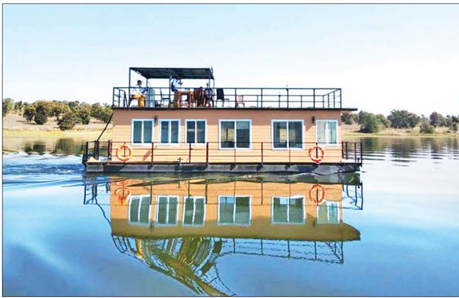
ဖယ်ခုံအင်းအတွင်း ပြေးဆွဲနေသည့် အပျော်စီးရေယာဉ်တစ်စင်းကို တွေ့ရစဉ်။