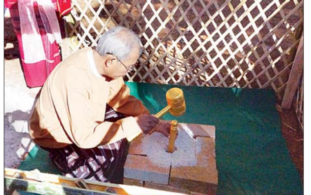
ပြည်နယ်စီမံကိန်းနှင့်ဘဏ္ဍာရေးဝန်ကြီး ဦးမော်မော် ကန္တရဝတီအထိမ်းအမှတ်ဥယျာဉ် ပန္နက်တော်တင်စဉ်။

ကယားပြည်နယ် လွိုင်ကော်မြို့ ဦးနီလမ်းနောင်ယား(ခ) ရပ်ကွက် ကွင်းအမှတ် (၃၂) ကန္တရဝတီအထိမ်းအမှတ်ဥယျာဉ်၏ ရတနာပန္နက်တော်တင်မင်္ဂလာအခမ်းအနားကို ယမန်နေ့က ကျင်းပသည်။ ပြည်နယ် စီမံကိန်းနှင့်ဘဏ္ဍာရေးဝန်ကြီး ဦးမော်မော်က အမှာစကားပြောကြားပြီး ပြည်နယ်စည်ပင်သာယာရေးနှင့် လူမှုရေးဝန်ကြီး ဒေါက်တာအောင်ကျော်ဌေးက လုပ်ငန်းဆောင်ရွက်မည့်အခြေအနေများကို ရှင်းလင်းပြောကြားသည်။ ထို့နောက် ရတနာပန္နက်တော်တင်မည်နေရာကို တက်ရောက်လာကြသူများက နေရာယူကြပြီး ရတနာပန္နက်တော်တင်ပေးခြင်းနှင့် အမွှေးနံ့သာရည်များ ပတ်ဖျန်းပေးခြင်း ၊ နဂါးစာကျေးမွေးလှူဒါန်းပူဇော်ခြင်း ၊ တွင်းတော်ဝန်းခြင်းများကို ဆောင်ရွက်ပေးခဲ့ကြကြောင်း သိရသည်။ အဆိုပါ အထိမ်းအမှတ်ဥယျာဉ်တော်၌ ဆေးရုံ ၊ ရုပ်ရှင်ရုံ ၊ စုပါမားကက်၊ ရိုးရာစားသောက်ဆိုင်ခန်းများ၊ ရိုးရာလက်မှုပစ္စည်းအရောင်းဆိုင်များ၊ တိုင်းရင်းသားရိုးရာပြခန်းများကို ထည့်သွင်းတည်ဆောက်သွားမည်ဖြစ်ကြောင်း သိရသည်။ ထွန်းလေး