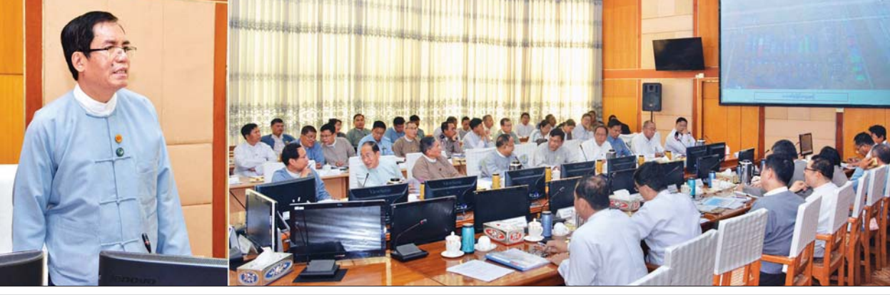
ဒုတိယဝန်ကြီး ဦးအောင်လှထွန်း ဒုတိယအကြိမ်ဝန်ကြီးဌာနပေါင်းစုံ မြန်မာ့ရိုးရာထမနဲထိုးပြိုင်ပွဲနှင့် ပျော်ပွဲရွှင်ပွဲပြုလုပ်နိုင်ရေး ညှိနှိုင်းအစည်းအဝေးတွင် အမှာစကားပြောကြားစဉ်။

ထို့နောက် ဒုတိယဝန်ကြီး ဦးအောင်လှထွန်းက ဆွေးနွေးအကြံပြုချက်များအပေါ် ပေါင်းစပ်ညှိနှိုင်းပေးပြီး နိဂုံးချုပ်အမှာစကားပြောကြားကာ အခမ်းအနားကို ရုပ်သိမ်းလိုက်သည်။