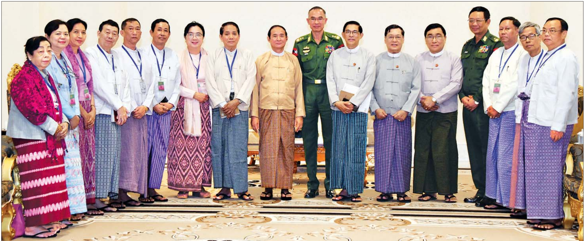
နိုင်ငံတော်သမ္မတ ဦးဝင်းမြင့်နှင့် မြန်မာနိုင်ငံအမျိုးသားလူ့အခွင့်အရေးကော်မရှင်ဥက္ကဋ္ဌ ဦးလှမြင့်တို့ အဖွဲ့ဝင်များနှင့်အတူ စုပေါင်းမှတ်တမ်းတင်ဓာတ်ပုံရိုက်စဉ်။ သတင်းစဉ်