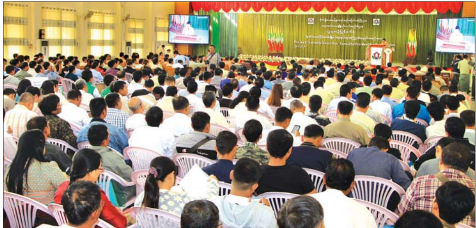
ပဲခူးတိုင်းဒေသကြီးအတွင်း လူထုပဟိုပြုစီမံကိန်းတိုးချဲ့ရွေးချယ်ခြင်းနှင့် အကြံဉာဏ်ရယူခြင်းအခမ်းအနားကျင်းပစဉ်။