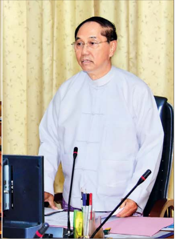
ဒုတိယသမ္မတ ဦးမြင့်ဆွေ (၇၃)နှစ်မြောက် ပြည်ထောင်စုနေ့ကျင်းပရေးဗဟိုကော်မတီ ဒုတိယအကြိမ် ညှိနှိုင်းအစည်းအဝေးတွင် အမှာစကားပြောကြားစဉ်။ သတင်းစဉ်

နေပြည်တော် ဇန်နဝါရီ ၂၄ ၂၀၂၀ ပြည့်နှစ်၊ (၇၃)နှစ်မြောက် ပြည်ထောင်စုနေ့ ကျင်းပရေးဗဟိုကော်မတီ ဒုတိယအကြိမ် ညှိနှိုင်းအစည်းအဝေးကို ယနေ့နံနက် ၉ နာရီခွဲတွင် နေပြည်တော်ရှိ နိုင်ငံတော်သမ္မတရုံး အစည်းအဝေးခန်းမ၌ ကျင်းပရာ ၂၀၂၀ ပြည့်နှစ်၊ (၇၃)နှစ်မြောက် ပြည်ထောင်စုနေ့ကျင်းပ