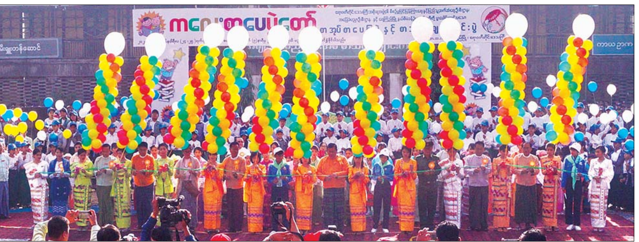
တိုင်းဒေသကြီးဝန်ကြီးချုပ် ဦးလှမိုးအောင်နှင့် အစိုးရအဖွဲ့ဝင် ဝန်ကြီးများ၊ လူရည်ချွန်မောင်မယ်များက ကလေးစာပေပွဲတော်ကို ဖဲကြိုးဖြတ်ဖွင့်လှစ်ပေးကြစဉ်။

အသီးတစ်ရာ အညှာတစ်ခု ဒို့ညီနောင်ထု ဒို့တည်ထောင်မှု ဒို့ပြည်ထောင်စု။