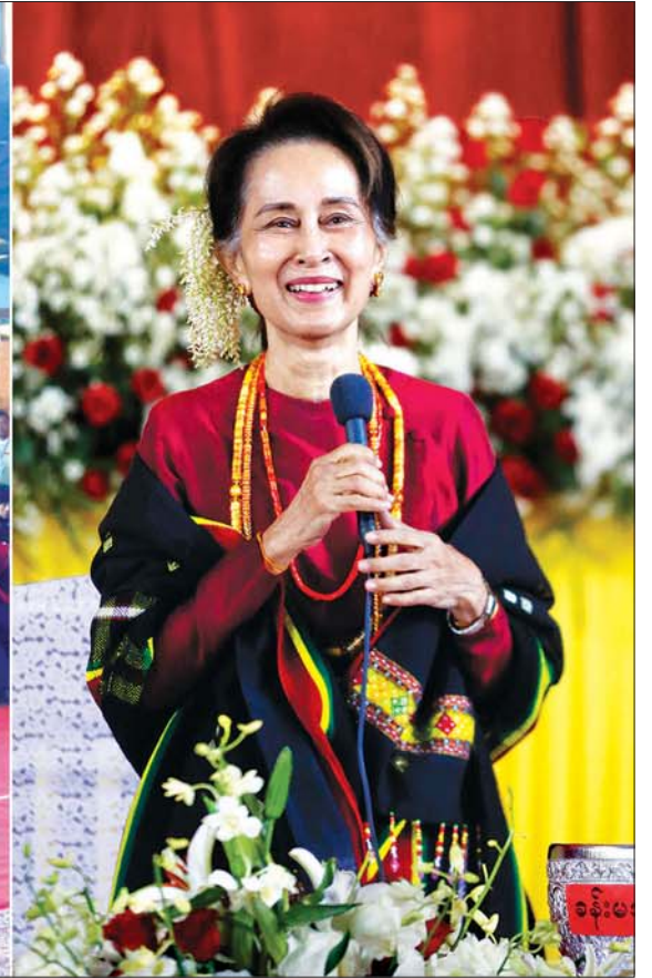
နယ်စပ်ဒေသနှင့် တိုင်းရင်းသားလူမျိုးများ ဖွံ့ဖြိုးတိုးတက်ရေးဗဟိုကော်မတီဥက္ကဋ္ဌ နိုင်ငံတော်၏အတိုင်ပင်ခံပုဂ္ဂိုလ် ဒေါ်အောင်ဆန်းစုကြည် တမူးမြို့ ဒေသခံပြည်သူများအား တွေ့ဆုံအမှာစကား ပြောကြားစဉ်။ သတင်းစဉ်