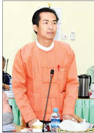
ကယားပြည်နယ်ဝန်ကြီးချုပ် ဦးအယ်လ်ဖောင်းရှိ

တိုင်းရင်းသားဒေသ ဖွံ့ဖြိုးတိုးတက်ရေးကို များစွာအထောက်အကူဖြစ်စေနိုင်မည်ဖြစ်ပါကြောင်း။ တိုင်းရင်းသားများ၏ ရိုးရာယဉ်ကျေးမှုနှင့် ခရီးသွားလုပ်ငန်းများကို ပြည်တွင်းနှင့် နိုင်ငံတကာမှ သိရှိနိုင်စေရန် မီဒီယာများ၏ အခန်းကဏ္ဍသည် အရေးပါသည့် အတွက် မီဒီယာများအနေဖြင့် ပူးပေါင်းဆောင်ရွက်ပေးကြပါဟု တိုက်တွန်းလိုပါကြောင်း။