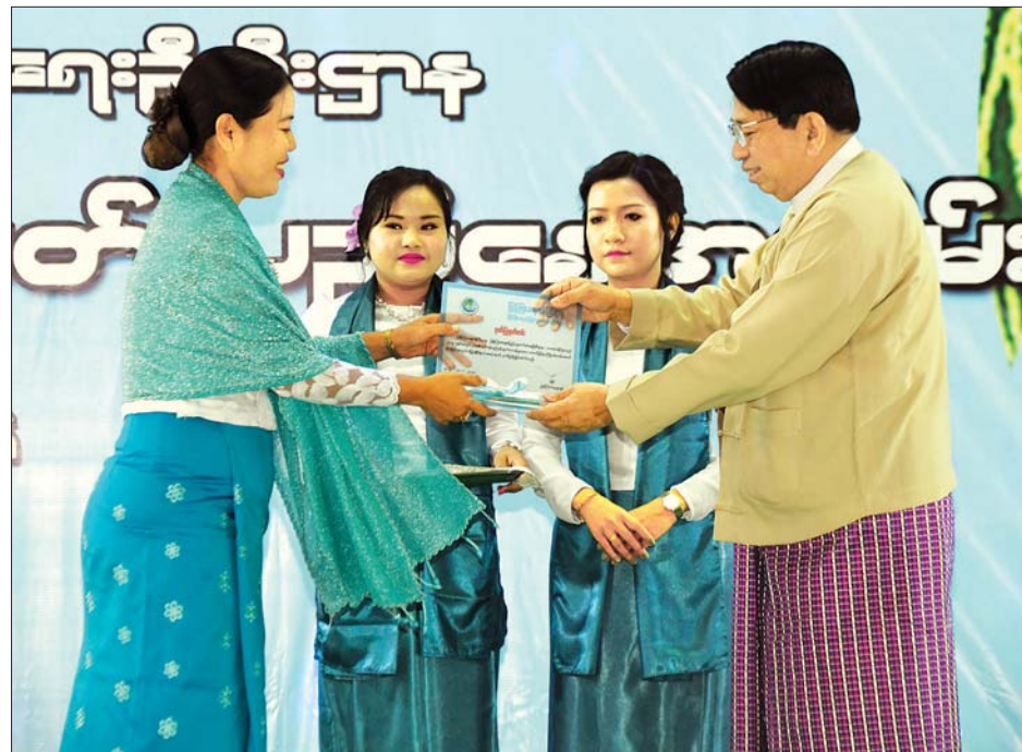
ပြည်ထောင်စုဝန်ကြီး ဒေါက်တာဖေမြင့် ခရိုင်အဆင့်လုပ်ငန်းဆောင်ရွက်နိုင်မှု အကောင်းဆုံး ပထမဆုရဘားအံခရိုင်ရုံးမှ တာဝန်ရှိသူတစ်ဦးအား ဆုပေးအပ်ချီးမြှင့်စဉ်။

ဌာန၏ လုပ်ငန်းများလှုပ်ရှားသက်ဝင် လာအောင်၊ ဌာနကို ပိုမိုဖွံ့ဖြိုးရှင်သန် လာအောင် အားလုံးပိုင်းဝန်း ဆောင်ရွက်နေကြသည်ကို မြင်ရသည့် အတွက် အင်မတန်ဝမ်းမြောက်ပါ