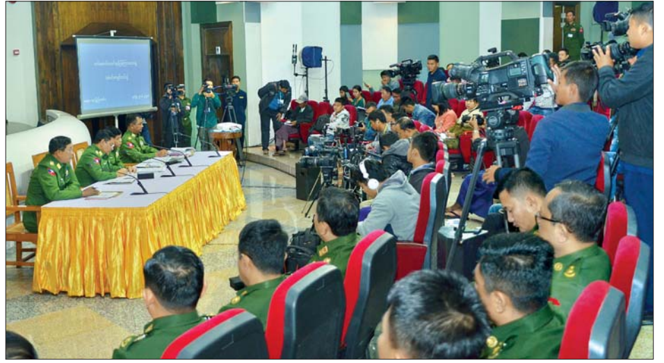
တပ်မတော်စစ်သမိုင်းပြတိုက်၌ တပ်မတော်သတင်းစာရှင်းလင်းပွဲ ပြုလုပ်စဉ်။

ယင်းနောက် တက်ရောက်လာကြသည့် သတင်းဌာနအသီးသီးတို့က သိရှိလိုသည်များကို မေးမြန်းရာ တပ်မတော် သတင်းမှန်ပြန်ကြားရေးအဖွဲ့မှ တာဝန်ရှိသူများက လည်းကောင်း၊ ICC နှင့် ICJ ဆိုင်ရာ ကိစ္စရပ်များ၊ ICOE အစီရင်ခံစာနှင့် ပတ်သက်သည့် ကိစ္စရပ်များ၊ စစ်တရားရုံးစစ်ဆေးစီရင်မှုဆိုင်ရာ ကိစ္စရပ်များအား ကာကွယ်ရေးဦးစီးချုပ်ရုံး (ကြည်း) စစ်ဥပဒေချုပ်ရုံးမှ