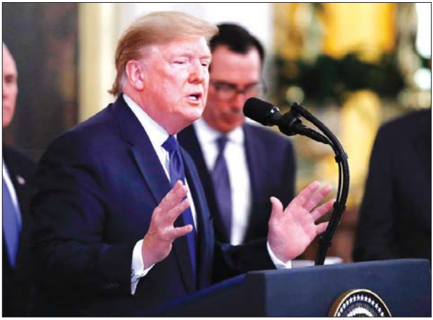
အမေရိကန်သမ္မတ ဒေါ်နယ်ထရမ်။