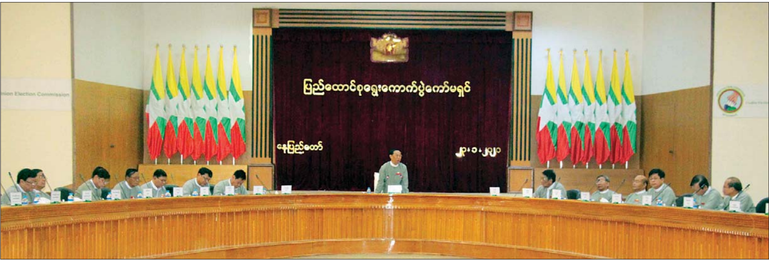
ပြည်ထောင်စုရွေးကောက်ပွဲကော်မရှင် ဥက္ကဋ္ဌ ဦးလှသိန်း ၂၀၂၀ ပြည့်နှစ် အထွေထွေရွေးကောက်ပွဲ အောင်မြင်စွာကျင်းပနိုင်ရေးအတွက် ပြည်ထောင်စုရွေးကောက်ပွဲကော်မရှင်နှင့် တိုင်းဒေသကြီး၊ ပြည်နယ်နှင့် ပြည်ထောင်စုနယ်မြေ ရွေးကောက်ပွဲကော်မရှင်အဖွဲ့ခွဲများ ညှိနှိုင်းအစည်းအဝေးတွင် အမှာစကားပြောကြားစဉ်။ သတင်းစဉ်

နေပြည်တော် ဇန်နဝါရီ ၂၃ ၂၀၂၀ ပြည့်နှစ် အထွေထွေရွေးကောက်ပွဲ အောင်မြင်စွာ ကျင်းပနိုင်ရေးအတွက် ပြည်ထောင်စုရွေးကောက်ပွဲကော်မရှင်နှင့် တိုင်းဒေသကြီး၊ ပြည်နယ်နှင့် ပြည်ထောင်စုနယ်မြေ ရွေးကောက်ပွဲကော်မရှင်အဖွဲ့ခွဲများ ညှိနှိုင်းအစည်းအဝေးကို ယနေ့မနက် ၁ နာရီတွင် နေပြည်တော်ရှိ ပြည်ထောင်စုရွေးကောက်ပွဲကော်မရှင်ရုံးအစည်းအဝေးခန်းမ၌ ကျင်းပသည်။