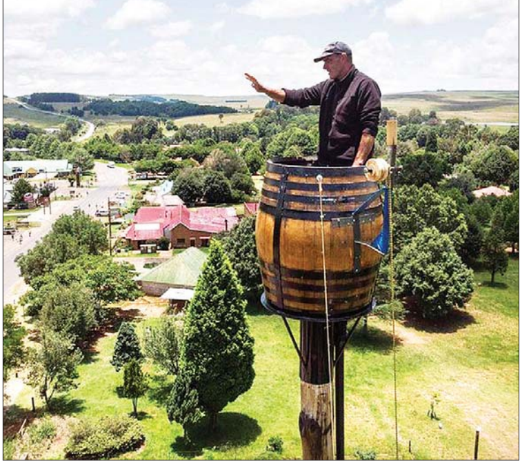
တိုင်ထိပ်စည်ပိုင်းထဲမှာ ခဲရာခဲဆစ်နေပြီး ဂင်းနက်စ်မှတ်တမ်းဝင်ဖို့ ကြိုးစားခဲ့တဲ့ တောင်အာဖရိက နိုင်ငံသား ဗာနွန်ကရဂါ။

သို့သော်လည်း တိုင်ထိပ်ကို မိုးကြိုးပစ်ခံရမှာ သူ့အကြောက်ဆုံးပါပဲလို့ ပြောပါတယ်။ သူ့အကြောက်ရွံ့ခဲ့တဲ့အတိုင်း မိုးကြိုးပစ်ခံရမှုက သီသီလေး လွဲခဲ့ရတယ်လို့လည်း သူကပြောပြပါတယ်။ ယူပီဆိုင်