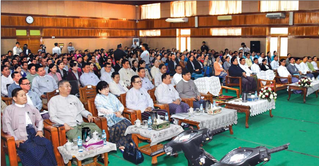
ပြည်ထောင်စုဝန်ကြီး ဒေါက်တာဖေမြင့် ပြန်ကြားရေးနှင့် ပြည်သူ့ဆက်ဆံရေးဦးစီးဌာန (၂၉)နှစ်မြောက် နှစ်ပတ်လည်နေ့အခမ်းအနားတွင် အမှာစကားပြောကြားစဉ်။

စိတ်အားထက်သန်မှုများရှိနေ အခမ်းအနားတွင် ပြည်ထောင်စု ဝန်ကြီး ဒေါက်တာ ဖေမြင့်က ပြန်ကြားရေးနှင့်ပြည်သူ့ဆက်ဆံရေး ဦးစီးဌာနမှ ဝန်ထမ်းများအနေဖြင့်