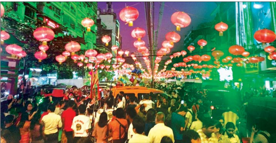
တရုတ်ရိုးရာ နှစ်သစ်ကူးပွဲတော်ကျင်းပရန် ပြင်ဆင်ထားမှုကို ဇန်နဝါရီ ၂၃ ရက်တွင် တွေ့ရစဉ်။