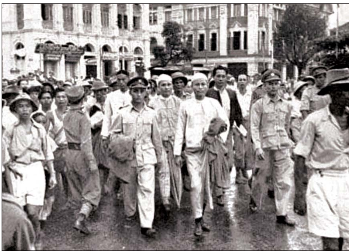
၉ - ၆ - ၁၉၄၇ ရက်က တိုင်းပြုပြည်ပြုလွှတ်တော်သို့ တက်ရောက်လာသည့် ဗိုလ်ချုပ်အောင်ဆန်းနှင့် ဖဆပလအဖွဲ့ဝင်များ။

ထိုစဉ်က ဗိုလ်ချုပ်ကိုယ်တိုင်ရေးသား သော စာမူတွင် မြန်မာ့လွတ်လပ်ရေး အစဉ် ထာဝရတည်တံ့ခိုင်မြဲရေးအတွက် နိုင်ငံ တကာနှင့် ရင်းနှီးချစ်ကြည်ငြိမ်းချမ်းစွာ ပူးပေါင်း ဆောင်ရွက်မည်ဟု လွတ်လပ်ရေး အဓိဋ္ဌာန်ပြုချက်ကိုလည်း အောက်ပါအတိုင်း ဖော်ပြခဲ့ပါသည် - “ ကျွန်ုပ်တို့ ချစ်မြတ်နိုးသော လွတ်လပ် သည့် နိုင်ငံတော်သည် ကမ္ဘာပေါ်တွင် တရားသဖြင့် ရသင့်ရထိုက်သည်လည်းဖြစ် ၍၊ ဂုဏ်ကျက်သရေနှင့်လည်း ပြည့်စုံသော အဆင့်အတန်းကိုရရှိ၍ လူ့သတ္တဝါခပ်သိမ်း တို့၏ အကျိုးစီးပွားကို တိုးတက်စေရန်၊ မိမိ၌ တာဝန်ရှိသည့်အလျောက် အစွမ်းကုန် အားထုတ်ဆောင်ရွက်ပြီးလျှင်၊ ပြည်ထောင် အချင်းချင်း တရားမျှတမှုနှင့် လောကဝတ် တရားတို့ကို ထောက်ကာ၊ အိမ်နီးချင်းနိုင်ငံ တို့နှင့် ရင်းနှီးချစ်ကြည်စွာ ပူးပေါင်းဆောင် ရွက်မည်ဟု ခိုင်မြဲသောအဓိဋ္ဌာန်ကို ပြုပါ သည်။ ”