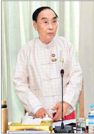
ပြည်ထောင်စုဝန်ကြီး နိုင်သက်လွင်

မြန်မာနိုင်ငံသည် သဘာဝအလှအပများနှင့် ပြည့်စုံကြွယ်ဝသည့် နိုင်ငံတစ်ခုဖြစ်သည့်အတွက် သဘာဝအခြေပြု ခရီးသွားလုပ်ငန်းများကို မြှင့်တင်နိုင်ခြင်းဖြင့်