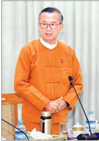
ပြည်ထောင်စုဝန်ကြီး ဦးအုန်းမောင်