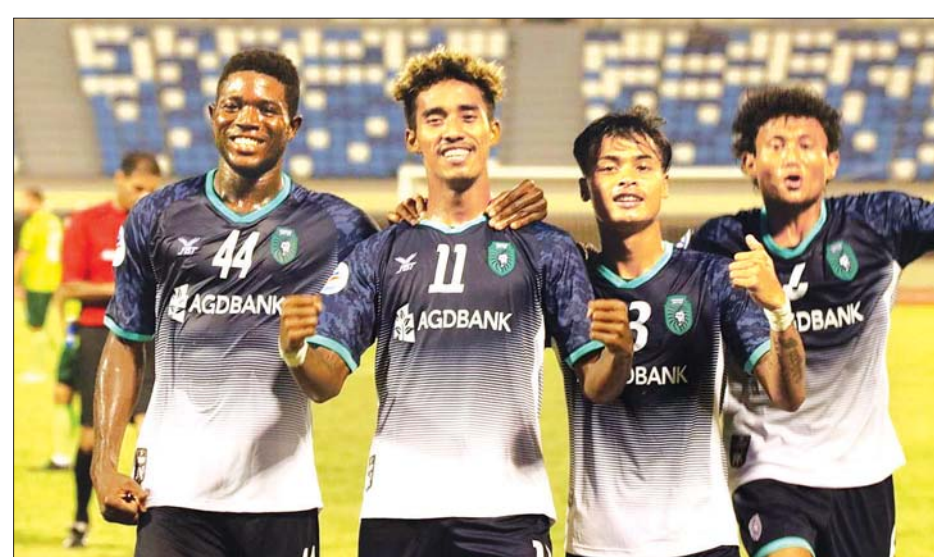
ဇန်နဝါရီ ၂၂ ရက်က ကစားသည့် ပထမအကျော့တွင် ရန်ကုန်အသင်းသားများ ရိုးသွင်းအပြီး အောင်ပွဲခံနေစဉ်။

ရန်ကုန် ဇန်နဝါရီ ၂၃ အာရှဘောလုံးအဖွဲ့ချုပ်က ကြီးမှူးကျင်းပသည့် ၂၀၂၀ AFC Cup ဖြိုင်ပွဲ အာဆီယံဇန်နဝါရီပွဲ ပထမအကျော့ပွဲစဉ်များ ကို ဇန်နဝါရီ ၂၂ ရက်က ကျင်းပရာ မြန်မာကလပ် ရန်ကုန် ယူနိုက်တက်အသင်းသည် ဘရူနိုင်းကလပ် အင်ဒရာအသင်း ကို အဝေးကွင်း၌ ရိုးပြတ်အနိုင်ရခဲ့သောကြောင့် ခြေစမ်းပွဲ အောင်မြင်ရန် သေချာသလောက်ရှိသွားခဲ့ပြီ ဖြစ်သည်။ အာဆီယံဇန်န နောက်ဆုံးအဆင့်ခြေစမ်းပွဲတွင် သုံးပွဲ ပါဝင်ပြီး ရန်ကုန်(မြန်မာ)က အင်ဒရာ(ဘရူနိုင်း)ကို အဝေး ကွင်း၌ ခြောက်ဂိုး-တစ်ဂိုး၊ မာကာဆာ(အင်ဒိုနီးရှား)က လာလီနေယူနိုက်တက်(တီမော)ကို အဝေးကွင်း၌ လေးဂိုး-တစ်ဂိုး၊ ဆာဗေ(ကမ္ဘောဒီးယား)က မာစတာ-၇ (လာအို)ကို အိမ်ကွင်း၌ လေးဂိုး-တစ်ဂိုးဖြင့် အနိုင်ရခဲ့ သည်။ ယင်းသုံးပွဲစလုံး ရိုးပြတ်ရလဒ်များ ထွက်ပေါ်ခဲ့သော ကြောင့် အနိုင်ရရှိသည့်အသင်းများမှာ ခြေစမ်းပွဲအောင်ရန် အခြေအနေကောင်းသွားပြီဖြစ်သည်။ ခြေစမ်းပွဲဒုတိယ အကျော့ကို စာမျက်နှာ ၁၂ ကော်လံ ၁ ❖