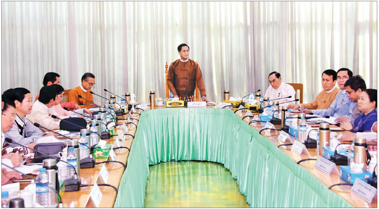
ဒုတိယသမ္မတ ဦးဟင်နရီဗန်ထီးယူ “သွေးချင်းတို့ရဲ့ ပွဲတော်ဆီ ၂၀၂၀” ပွဲတော်နှင့် တိုင်းရင်းသားလူမျိုးများ စဉ်ဆက်မပြတ်ဖွံ့ဖြိုးတိုးတက်ရေးဖိုရမ်တို့နှင့် စပ်လျဉ်းသည့် ညှိနှိုင်းအစည်းအဝေးတွင် အမှာစကားပြောကြားစဉ်။

နေပြည်တော် ဇန်နဝါရီ ၂၃ “သွေးချင်းတို့ရဲ့ ပွဲတော်ဆီ ၂၀၂၀” ပွဲတော်နှင့် တိုင်းရင်းသားလူမျိုးများ စဉ်ဆက်မပြတ် ဖွံ့ဖြိုးတိုးတက်ရေး ဖိုရမ်တို့နှင့် စပ်လျဉ်းသည့် ညှိနှိုင်း အစည်းအဝေးကို ယနေ့နံနက် ၉ နာရီ တွင် နေပြည်တော်ရှိ တိုင်းရင်းသား လူမျိုးရေးရာဝန်ကြီးဌာန အစည်း အဝေးခန်းမ၌ ကျင်းပရာ တိုင်းရင်း သားရေးရာ၊ ပြည်သူ့ရေးရာစီမံခန့်ခွဲ မှုနှင့် ဝန်ဆောင်မှုရေးရာ ကော်မတီ ဥက္ကဋ္ဌ ဒုတိယသမ္မတ ဦးဟင်နရီ ဗန်ထီးယူ တက်ရောက်အမှာစကား ပြောကြားသည်။