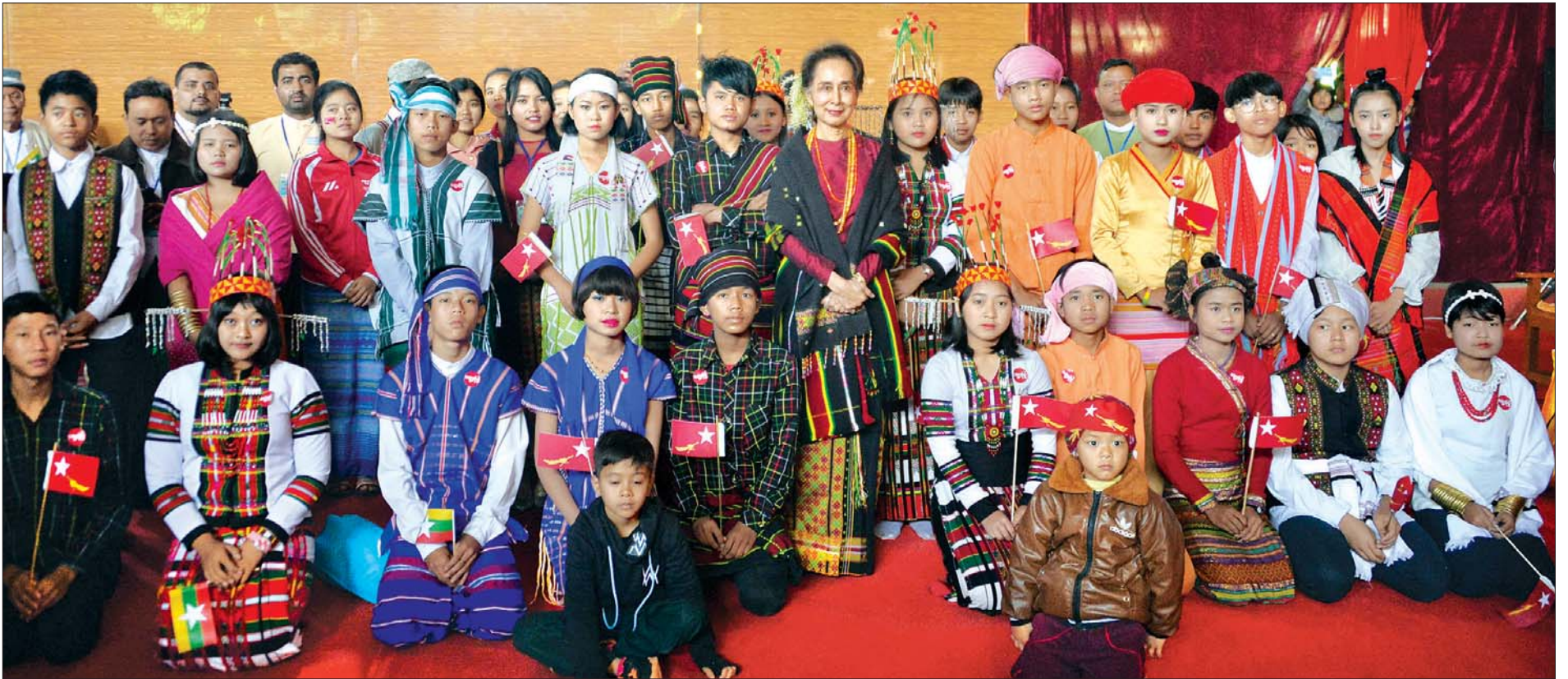
နယ်စပ်ဒေသနှင့် တိုင်းရင်းသားလူမျိုးများ ဖွံ့ဖြိုးတိုးတက်ရေးဗဟိုကော်မတီဥက္ကဋ္ဌ နိုင်ငံတော်၏အတိုင်ပင်ခံပုဂ္ဂိုလ် ဒေါ်အောင်ဆန်းစုကြည် တမူးမြို့ ဒေသခံတိုင်းရင်းသား တိုင်းရင်းသူ၊ ပြည်သူများနှင့် စုပေါင်းမှတ်တမ်းတင်ဓာတ်ပုံ ရိုက်စဉ်။