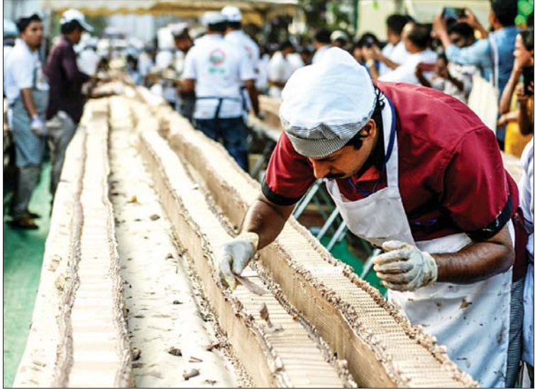
ကမ္ဘာ့အရှည်ဆုံး ကိတ်မုန့်ပြုလုပ်နေသည်ကို တွေ့ရစဉ်။

ဒီကိတ်မုန့်ဟာ ဗင်နီလာကိတ်မုန့်ကြီးဖြစ်ပြီး အကျယ်နဲ့ အထူဟာ ၁၀ စင်တီမီတာ (လေး လက်မ) ရှိပါတယ်။ ဒီကိတ်မုန့်ကြီးရဲ့ စုစုပေါင်းအလေးချိန်ဟာ ၂၇၀၀၀ ကီလိုဂရမ် (၅၉၅၀၀ ပေါင်) ရှိပါတယ်။ ရိုးရာဦးထုပ်ကို ဆောင်းထားတဲ့ မုန့်ဖုတ်သမားနဲ့ စားဖိုမှူးပေါင်း ၁၅၀၀ တို့ဟာ သကြားနဲ့ ဂျုံ ၂၂၀၀၀ ကီလိုဂရမ်ကို လေးနာရီကြာနယ်ပြီးတော့မှ အခုလို ကမ္ဘာ့အရှည်ဆုံး ကိတ်မုန့်ကြီးကို လုပ်ခဲ့တာ ဖြစ်ပါတယ်။ ဒီကိတ်မုန့်ကြီးကို ဖြန့်ခင်းဖို့အတွက် စားပွဲခုံပေါင်း ထောင်ချီ သုံးခဲ့ရပါတယ်။ ကီရာလာမုန့်လုပ်ငန်းရှင်များအဖွဲ့က ဦးစီးကျင်းပတဲ့ မုန့်လုပ်ပွဲတော်မှာ အခုလို ကမ္ဘာ့အရှည်ဆုံးကိတ်မုန့်ကြီးကို လုပ်နိုင်ခဲ့တာဖြစ်ပါတယ်လို့ အဲဒီအဖွဲ့ရဲ့ အတွင်းရေးမှူး ချုပ် နေ့ရှုတ်က ပြောပါတယ်။ ယခုပြုလုပ်ခဲ့တဲ့ကိတ်မုန့်ဟာ ၂၀၁၈ ခုနှစ်က တရုတ်နိုင်ငံသား မုန့်ဖုတ်သမားတွေ ရှိစီစီရင်စုမှာ ပြုလုပ်ခဲ့ပြီး ဂင်းနက်စ်မှတ်တမ်း ဝင်သွားတဲ့ ၃ ဒသမ ၂ ကီလိုမီတာ ရှည်တဲ့ သစ်သီးကိတ်မုန့်ထက် ပိုပြီးရှည်ပါတယ်။ ယခု အိန္ဒိယသားများ ပြုလုပ်လိုက်တဲ့ ကမ္ဘာ့အရှည်ဆုံး ကိတ်မုန့်ရဲ့ အရသာနဲ့ သန့်ရှင်းမှုမှာ ဆိုဖွယ်မရှိ အထူးကောင်းမွန်ကြောင်းလည်း သိရပါတယ်။ အေအက်ပီ