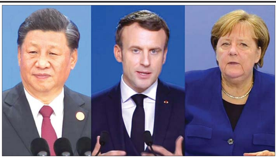
တရုတ်သမ္မတ ရှီကျင့်ဖျင်၊ ပြင်သစ်သမ္မတမက်ခရူန်၊ ဂျာမနီဝန်ကြီးချုပ် အိန်ဂျလာမာကယ်