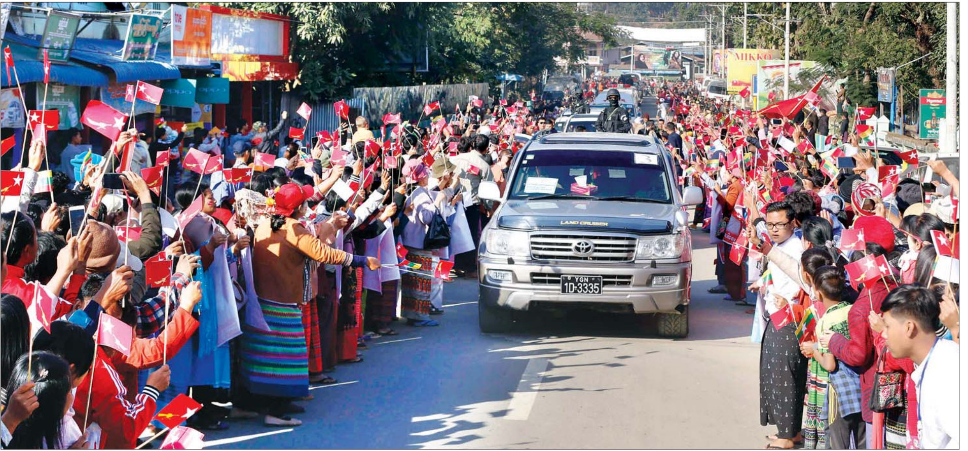
နယ်စပ်ဒေသနှင့် တိုင်းရင်းသားလူမျိုးများ ဖွံ့ဖြိုးတိုးတက်ရေးဗဟိုကော်မတီဥက္ကဋ္ဌ နိုင်ငံတော်၏အတိုင်ပင်ခံပုဂ္ဂိုလ် ဒေါ်အောင်ဆန်းစုကြည်အား တမူးမြို့တွင်း လမ်းမတစ်လျှောက်၌ ဒေသခံပြည်သူများက သောင်းသောင်းဖြဖြ ကြိုဆိုနှုတ်ဆက်ကြစဉ်။