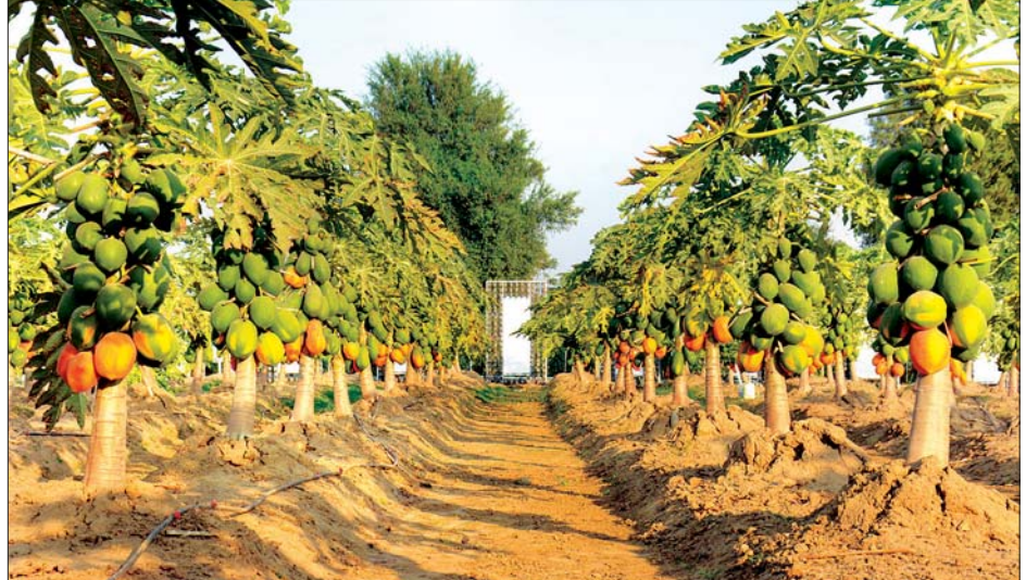
မေမိုးသဲ

အရည်အသွေးကောင်းမျိုးစေ့များ သုံးစွဲမှုမြှင့်တင်ရေး၊ မျိုးစေ့ထုတ်လုပ်သူသုံးစွဲသူများ ချိတ်ဆက်ဆောင်ရွက်မှု ကောင်းမွန်စေရေး၊ တောင်သူများ ပုဂ္ဂလိကလုပ်ငန်းရှင်များနှင့် မျိုးစေ့ကဏ္ဍတွင် ပါဝင်ပတ်သက်သူများ ပူးပေါင်းဆောင်ရွက်မှုမြှင့်တင်နိုင်ရေးတို့ကို ရည်ရွယ်၍ ယင်းပြပွဲကို ကျင်းပခြင်းဖြစ်ကြောင်း သိရသည်။ ပြပွဲတွင် ဌာနဆိုင်ရာ ပြခန်းများ၊ ပုဂ္ဂလိကပြခန်းများ၊ အရောင်းဆိုင်များ၊ သီးနှံအလိုက် မျိုးစေ့ပျိုးပင်များ၊ စိုက်ခင်းများ၊ နည်းပညာပေး ပြကွက်ပြခန်းများ ခင်းကျင်းပြသမည် ဖြစ်သည်။ ပြပွဲသို့ မည်သူမဆို အခမဲ့ လာရောက်လေ့လာနိုင်ကြမည်ဖြစ်ပြီး သိရှိလိုသည်များကို သက်ဆိုင်ရာ ပညာရှင်များက ဖြေကြားရှင်းလင်းပေးနိုင်ရန် စီစဉ်ဆောင်ရွက်ထားရှိကြောင်း သိရသည်။