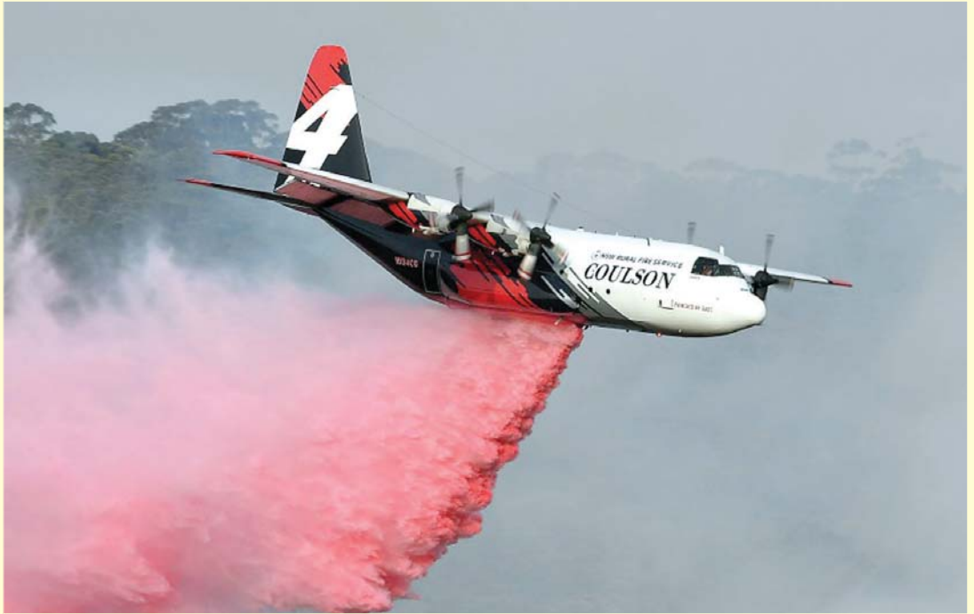
တောမီးငြိမ်းသတ်နေသည့် စီ ၁၃၀ ဟာကျူလီ မီးသတ်လေယာဉ်ကို တွေ့ရစဉ်။