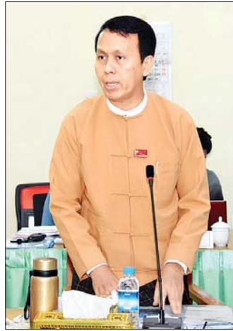
ရန်ကုန်တိုင်းဒေသကြီးဝန်ကြီးချုပ် ဦးဖြိုးမင်းသိန်း