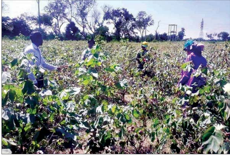
ဝါတစ်ပိဿာကို ငွေကျပ် ၁၄၀၀၀ကျော် ၁၅၀၀၀ ကျော်လောက်ပေါက်ဈေးရှိတော့ ဝါစိုက်တောင်သူတွေ အဆင်ပြေမယ်ထင်ပါတယ်” ဟု ဝါစိုက်တောင်သူ တစ်ဦးက ပြောသည်။ မကွေးတိုင်းဒေသကြီးအတွင်း ပခုက္ကူခရိုင် မေသူလွင်(မကွေး) တွင် ၃၁၂၅ ဧက၊ ဂန့်ဂေါခရိုင်တွင် ၄၀၃၄ ဧက၊ မကွေးခရိုင်တွင် ၆၃၅၂၈ ဧက၊ မင်းဘူးခရိုင်တွင် ၈၉၁၆ ဧက၊ သရက်ခရိုင်တွင် ၄၃၃၂၅ ဧက စိုက်ပျိုးနိုင်ခဲ့ကြောင်း သိရသည်။