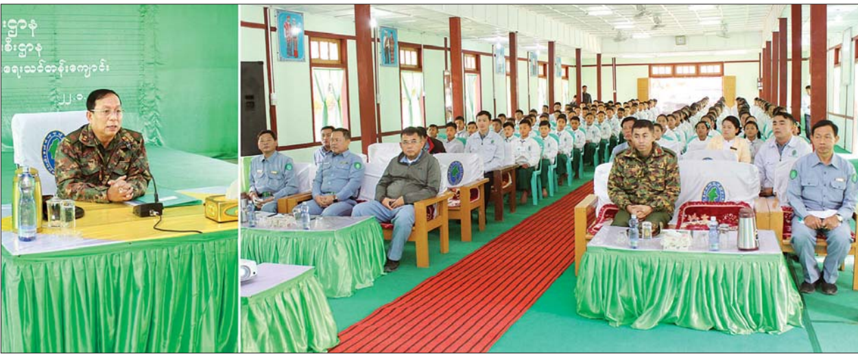
ပြည်ထောင်စုဝန်ကြီး ဒုတိယဗိုလ်ချုပ်ကြီး ရဲအောင် နယ်စပ်ဒေသတိုင်းရင်းသားလူငယ်များ ဖွံ့ဖြိုးရေးသင်တန်းကျောင်း (ပူတာအို) ၌ ကျောင်းသား ကျောင်းသူများနှင့် တွေ့ဆုံစဉ်။ သတင်းစဉ်

တိုင်းရင်းသားလူငယ်များ ဖွံ့ဖြိုးရေး သင်တန်းကျောင်း (ပူတာအို) သို့ ရောက်ရှိပြီး ကျောင်းသား ကျောင်းသူများနှင့် တွေ့ဆုံစဉ် ပြည်ထောင်စုဝန်ကြီး