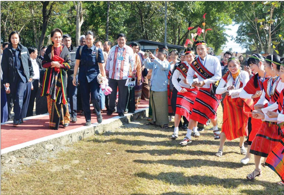
နိုင်ငံတော်၏အတိုင်ပင်ခံပုဂ္ဂိုလ် ဒေါ်အောင်ဆန်းစုကြည်အား ကလေးမြို့၌ ဒေသခံတိုင်းရင်းသား တိုင်းရင်းသူ အကအဖွဲ့က ရိုးရာအကဖြင့် ကြိုဆိုကြစဉ်။

လျှပ်စစ်ဓာတ်အားရရှိရေး ယင်းနောက် တွေ့ဆုံပွဲသို့ ကြိုတင်တင်ပြ