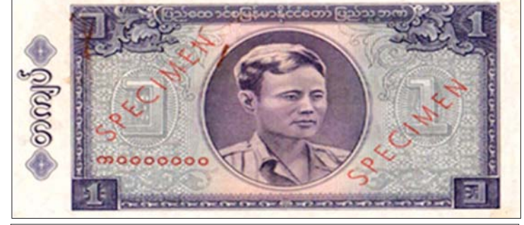
၁၉၆၂ ခုနှစ်မှ ၁၉၇၂ ခုနှစ်အထိ ထုတ်ဝေခဲ့သော ငွေစက္ကူများ

ဖြေ။ ။ မူလအဟောင်း တစ်ထောင် ကျပ်တန် ငွေစက္ကူရဲ့ လုံခြုံရေးကြိုး ငွေရောင် အမျှင်သေးနေရာမှာ ကြိုးအကြိုး ရွှေရောင်ရောင်ပြေးနဲ့၊ ပြီးတော့ စာမျက်နှာ ၇ သို့