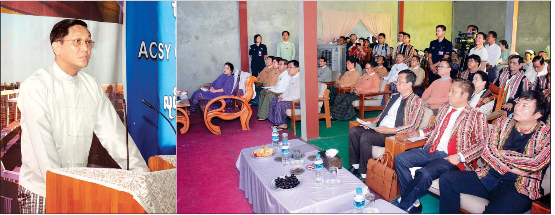
ဒုတိယသမ္မတ ဦးဟင်နရီဗန်ထီးယူ ချင်းလူမှုရေးအသင်း - ရန်ကုန် (All Chin Society - Yangon) ၏ ACSY Community Hall ပန္နက်တော်တင် ဆုတောင်းဆက်ကပ်ခြင်းအခမ်းအနားတွင် အမှာစကားပြောကြားစဉ်။