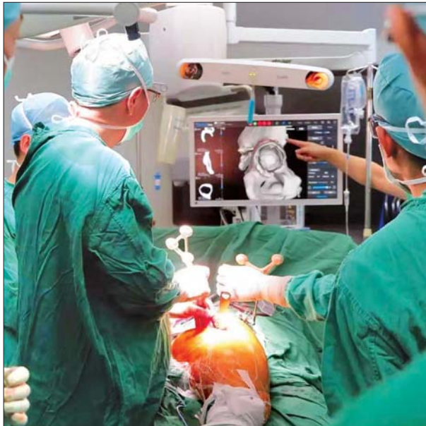
စက်ရုပ်အကူအညီဖြင့် တင်ပါးအစားထိုးကုသမှု ပြုလုပ်နေစဉ်။

ပထမဆုံးဖော်ပြလိုတဲ့အကြောင်းအရာကတော့ ဂျပန်ဘီလျံနာတစ်ဦး ဟာ အာကာသအတွင်းကို သူ့နဲ့အတူသွားဖို့ လက်တွဲဖော်ရွာနေတယ်ဆိုတဲ့ အကြောင်းအရာပါ။ ဒီအကြောင်းအရာကတော့စိတ်ကူးယဉ် သိပ္ပံဇာတ်ကား တွေထဲကအတိုင်းပါ။ ဂျပန်ဘီလျံနာတစ်ဦးဖြစ်တဲ့ ယူဆာကူ မဲဇာဝါက တော့ အာကာသခရီးရှည်မှာသူနဲ့အတူ လိုက်ပါမယ့် အထူးပုဂ္ဂိုလ်တစ်ယောက် ကို ရှာဖွေနေပါတယ်။ သူဟာမကြာသေးခင်ကမှ သူ့ရဲ့ချစ်သူနဲ့လမ်းခွဲထား တာလည်းဖြစ်ပါတယ်။ အာကာသကိုသူနဲ့အတူ သွားဖို့အမျိုးသမီး လက်တွဲ ဖော်ကို ရှာနေကြောင်းအွန်လိုင်းကနေတစ်ဆင့် အသိပေးခဲ့ပါတယ်။ အာကာသ အတွင်း သွားမယ့်ခရီးစဉ်ကိုတော့ ၂၀၂၃ ခုနှစ်မှာ အစီအစဉ်ဆွဲထားပါတယ်။ အထီးကျန်ဆန်ပြီး ဘာမျှမရှိသလို ခံစားနေရတဲ့ခံစားချက်ကနေ သက်သာရာ ရဖို့အတွက် အမျိုးသမီးလက်တွဲဖော်ရွာဖို့ကြိုးစားနေတာပါ။ ဘဝတစ်သက်တာ လက်တွဲဖော်ကို ရှာနေတာလည်းဖြစ်တယ်လို့ အသက် ၄၄ နှစ်အရွယ် ယူဆာ ကူမဲဇာဝါက ပြောပါတယ်။ သူဟာ Zozuowin ဆိုတဲ့ အွန်လိုင်းရှေ့ပင်း ထောင်ထားပြီး ဂျပန်မှာတော့နာမည်ကြီးပါ။ သူ့ရဲ့ကြွယ်ဝချမ်းသာမှုကတော့ နှစ်ဘီလီယံရှိတယ်လို့ ဖော့ဘ်မဂ္ဂဇင်းရဲ့ဖော်ပြချက်အရ သိရပါတယ်။ သူ့ရဲ့ဘဝ လက်တွဲဖော်အဖြစ် လျှောက်ထားမယ့်အမျိုးသမီးကတော့ အသက် ၂၀ အရွယ် လူလွတ်အမျိုးသမီး ဖြစ်ရပါမယ်။ နောက်ပြီး ကိုယ်ရည်ကိုယ်သွေး ကောင်းမွန်ရမှာဖြစ်ပြီး အာကာသအကြောင်းကို စိတ်ဝင်စားသူလည်း ဖြစ်ရပါမယ်။ လျှောက်လွှာနောက်ဆုံးရက်ကတော့ ဇန်နဝါရီ ၁၇ ရက်ဖြစ်ပြီး မတ်လအတွင်းမှာ အပြီးသတ်ရွေးချယ်သွားမယ်လို့ သိရပါတယ်။