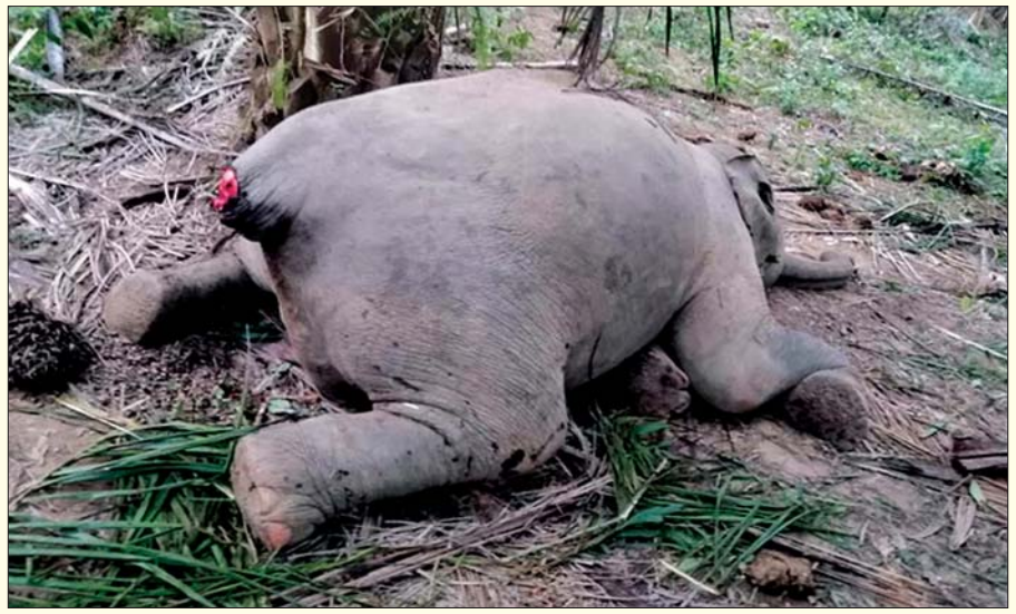
အဆိပ်လူးမြား ဒဏ်ရာများဖြင့် သေဆုံးနေသည့် တောဆင်ရိုင်းကို တွေ့ရစဉ်။

နေပြည်တော် ဇန်နဝါရီ ၁၆ - ဘုတ်ပြင်းမြို့နယ် ဝါးချောင်းကျေးရွာအနီး မြိတ်-ဘုတ်ပြင်းကားလမ်း မိုင်တိုင် (၁၂၆/၂-၃) အကြား၌ ဇန်နဝါရီ ၁၅ ရက် ညနေ ၅ နာရီ ၅ မိနစ်က အလျား ၁၀ ပေ၊ လုံးပတ် ၁၃ ပေ၊ နှာမောင်း ၅ ပေခန့်ရှိ အသက် တစ်နှစ်ခန့် ဟိုင်းဆင်အမျိုးအစား တောဆင်ရိုင်းအထီး