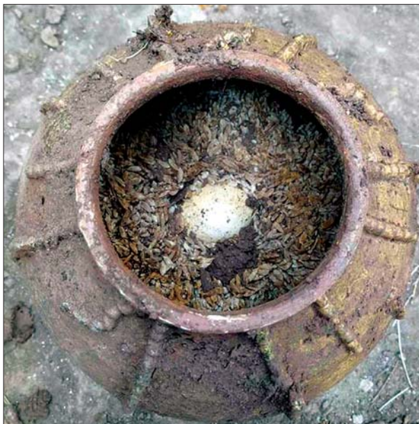
ဆန်အိုးထဲထည့်ထားသည့် ကြက်ဥကို မပျက်မစီးဘဲ တွေ့ရစဉ်။

နောက်ထပ်ဖော်ပြပေးမယ့် အကြောင်းအရာကတော့ နှစ်ပေါင်း ၅၀၀ သက်တမ်းရှိ ကြက်ဥတွေအကြောင်းပဲ ဖြစ်ပါတယ်။ ကြက်ဥဆိုတာ အင်မတန်မှ ကွဲလွယ်တဲ့အရာပါ။ ဒါတောင်မှ နှစ်ပေါင်း ၅၀၀ တိုင်တိုင်မကွဲဘဲ ရှိနေခဲ့တယ် ဆိုရင်တော့ ထူးဆန်းတဲ့အကြောင်းအရာတစ်ခုဖြစ်လာပါပြီ။ တရုတ်နိုင်ငံ စီချွမ် ပြည်နယ်မှာ ၂၀၁၉ ခုနှစ် နိုဝင်ဘာ ၁၂ ရက်မှာတော့ ရှေးဟောင်းသုတေသန ပညာရှင်တွေဟာ လွန်ခဲ့တဲ့နှစ်ပေါင်း ၅၀၀ ခန့်က ဆန်တစ်အိုးနဲ့ကြက်ဥတွေကို