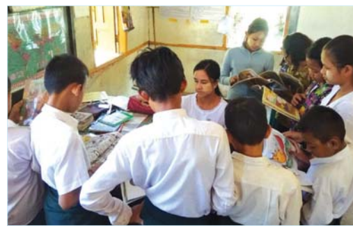
ပြန်လည်အပ်နှံစေပြီး အသစ်တစ်ဖန် စနစ်တကျ ပြန်လည် ငှားရမ်းပေးခဲ့ကြောင်း သိရသည်။ (အပေါ်ပုံ)

ကြာအင်းဆိပ်ကြီး ဇန်နဝါရီ ၁၆ ကရင်ပြည်နယ် ကြာအင်းဆိပ်ကြီးမြို့နယ် ပြန်ကြားရေးနှင့် ပြည်သူ့ဆက်ဆံရေးဦးစီးဌာနမှ အများပြည်သူများ စာဖတ်သော အလေ့အကျင့်ကောင်းများ ဖြစ်ပေါ်လာစေရေး၊ စာအုပ်စာစောင်များကို ဖတ်ရှုလေ့လာခြင်းဖြင့် နိုင်ငံရေး၊ စီးပွားရေး၊ ကျန်းမာရေးနှင့် လူမှုရေးကဏ္ဍများတွင် အတွေးသစ်၊ အမြင်သစ်၊ ဗဟုသုတများရရှိလာစေရေး အတွက် ဝန်ထမ်းများက အပတ်စဉ် ရုံးဖွင့် ရက်နေ့များတွင် စာသင်ကျောင်းများ၊ မြို့ပေါ် ရပ်ကွက်များနှင့် မြို့အနီးကျေးရွာများသို့ သွားရောက်ပြီး စုရပ်များနှင့် အိမ်တိုင်ရာ ရောက် စာအုပ်စာစောင်များကို မိုဘိုင်း စာငှားစနစ်ဖြင့် ဆောင်ရွက်ပေးလျက်ရှိသည်။ ထိုသို့ဆောင်ရွက်ပေးရာတွင် အမှတ်(၅) အခြေခံပညာ မူလတန်းလွန်ကျောင်းသို့ ယမန်နေ့ကသွားရောက်ပြီး ရုပ်ပြ ပုံပြင် သုတ ရသ စာအုပ်စာစောင်များကို ယူဆောင်ကာ ယခင်ငှားရမ်းထားရှိသော စာအုပ်များအား