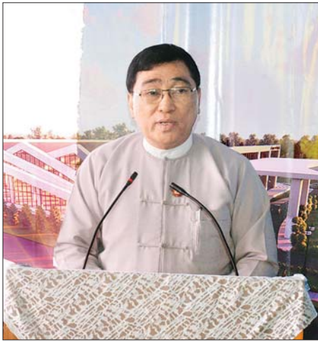
ပြည်ထောင်စုဝန်ကြီး ခေါက်တာ ဝင်းမြတ်အေး အမှာစကားပြောကြားစဉ်။ သတင်းစဉ်

ထို့နောက် ပန္နက်တော်တင် ဆုတောင်းဆက်ကပ်ခြင်း အခမ်းအနားကို ဆက်လက်ကျင်းပရာ ဒုတိယသမ္မတ ဦးဟင်နရီဗန်ထီးယူ၊ ပြည်ထောင်စုဝန်ကြီး ခေါက်တာဝင်းမြတ်အေး၊ ဒုတိယဝန်ကြီး ဦးတင်မြင့်၊ လူမှုရေးဝန်ကြီး ဦးနိုင်လင်း၊ ဒုတိယမြို့တော်ဝန်၊ ACSY အသင်းဥက္ကဋ္ဌနှင့် ဘဏ္ဍာရေးမှူးတို့က အဆောက်အအုံဆောက်လုပ်မည့် မြေနေရာတွင် ပန္နက်တင်ပေးကာ အမွှေးနံ့သာရည်များ ပန်းဖျန်းပေးကြပြီး Bishop ခေါက်တာ အန်ဒရူး မန်လုံးက ဆုတောင်းခြင်း ပြုလုပ်သည်။