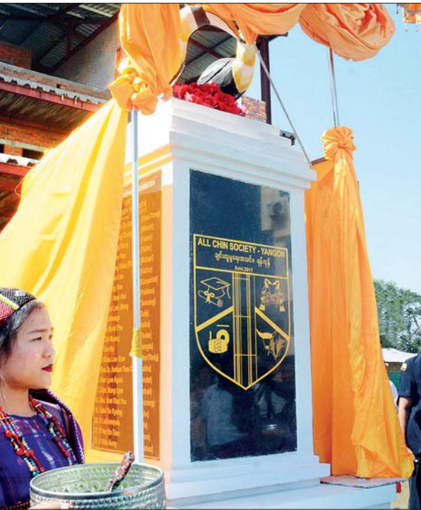
ဒုတိယသမ္မတ ဦးဟင်နရီဗန်ထီးယူ ချင်းလူမှုရေးအသင်း - ရန်ကုန် (ACSY) Logo နှင့် Founding Member ကျောက်တိုင်ကို စက်ခလုတ်နှိပ် ဖွင့်လှစ်ပေးစဉ်။ သတင်းစဉ်