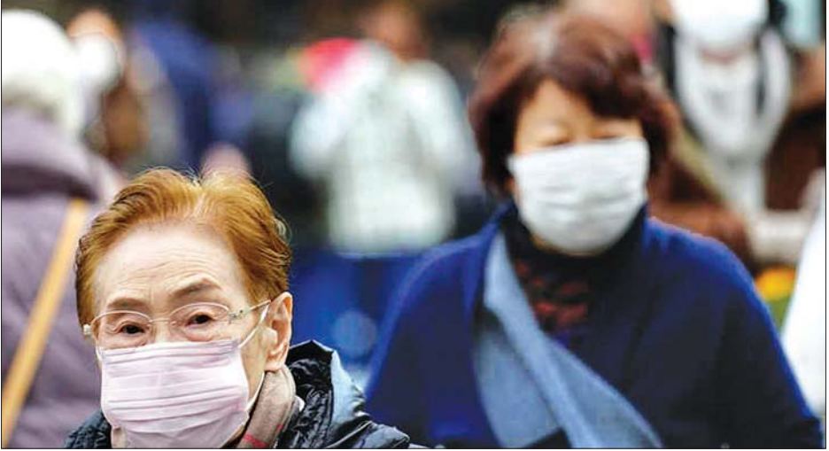
တိုကျိုမြို့ ဈေးရောင်းဈေးဝယ်နေရာတစ်ခုတွင် လမ်းသွားလမ်းလာများ နှာခေါင်းစည်းများ တပ်ထားသည်ကို ဇန်နဝါရီ ၁၆ ရက်က တွေ့ရစဉ်။

ကိုရိုနာဗိုင်းရပ်စ်၏ မျိုးရိုးဗီဇအသစ်တစ်ခုကို တရုတ်နိုင်ငံ ဝူဟန်သို့ သွားရောက်လည်ပတ်ခဲ့သည့် အမျိုးသားတစ်ဦးတွင် တွေ့ရှိခဲ့ကြောင်း ဇန်နဝါရီ ၁၆ ရက်က ဂျပန်ကျန်းမာရေးဝန်ကြီးဌာနမှ ပြောကြားလိုက်သည်။