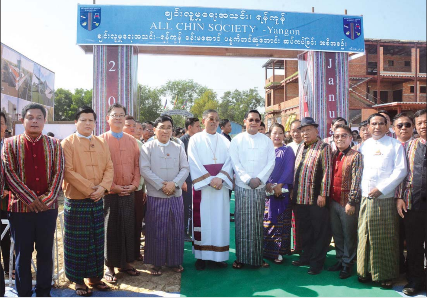
ဒုတိယသမ္မတ ဦးဟင်နရီဗန်ထီးယူနှင့် ဇနီး ဒေါက်တာ ရွှေလွမ်း၊ ပြည်ထောင်စုဝန်ကြီး ဒေါက်တာဝင်းမြတ်အေးနှင့် တာဝန်ရှိသူများ အခမ်းအနားသို့ တက်ရောက်လာကြသူများနှင့် စုပေါင်းမှတ်တမ်းတင် ဓာတ်ပုံရိုက်စဉ်။