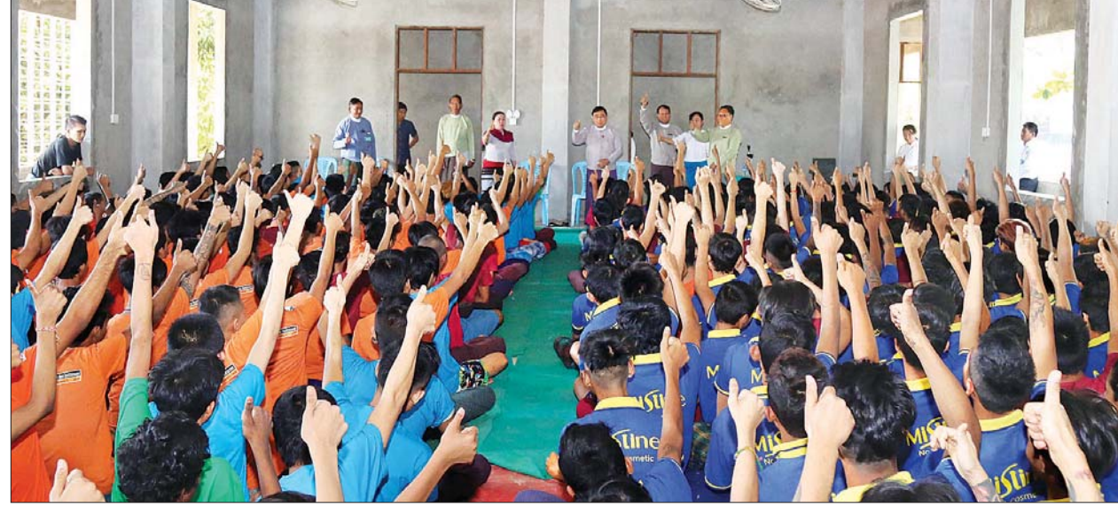
ပြည်ထောင်စုဝန်ကြီး ဒေါက်တာဝင်းမြတ်အေး သန်လျင်မြို့ လူငယ်သင်တန်းကျောင်းရှိ ကလေးသူငယ်နှင့်လူငယ်များအား တွေ့ဆုံပြီး အားပေးစကားပြောကြားစဉ်။

ဖြစ်ကြောင်း၊ အစိုးရက အနာဂတ်၏မျိုးဆက်သစ် ကလေးသူငယ်များနှင့် လူငယ်များကို ကောင်းမွန်သော လက်ဆင့်ကမ်းအမွေများပေးနိုင်ရန် ဆောင်ရွက်လျက်ရှိကြောင်း အားပေးစကားပြောကြားသည်။