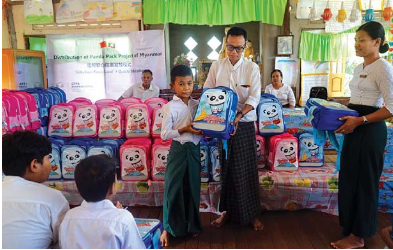
တရုတ်နိုင်ငံ ဆင်းရဲမှုလျှော့ချရေး ဖောင်ဒေးရှင်းမှ ကျောင်းသုံးပစ္စည်းများ လာရောက်လှူဒါန်းစဉ်။

အဆိုပါ လှူဒါန်းခြင်းသည် မြန်မာနိုင်ငံရှိ မူလတန်း ကျောင်းများမှ ကျောင်းသူ ကျောင်းသားများ လွယ်အိတ်နှင့် ကျောင်းသုံးစာရေးကိရိယာပစ္စည်းများ အသုံးပြု နိုင်စေရန်၊ တရုတ်နိုင်ငံနှင့် မြန်မာနိုင်ငံအကြား ချစ်ကြည်ရင်းနှီးမှု အခွန်ရှည် တည်တံ့ခိုင်ခံ့စေရန်အတွက် ရည်ရွယ်၍ လှူဒါန်းခြင်းဖြစ်ပြီး လွယ်အိတ်နှင့် ကျောင်းသုံးစာရေး