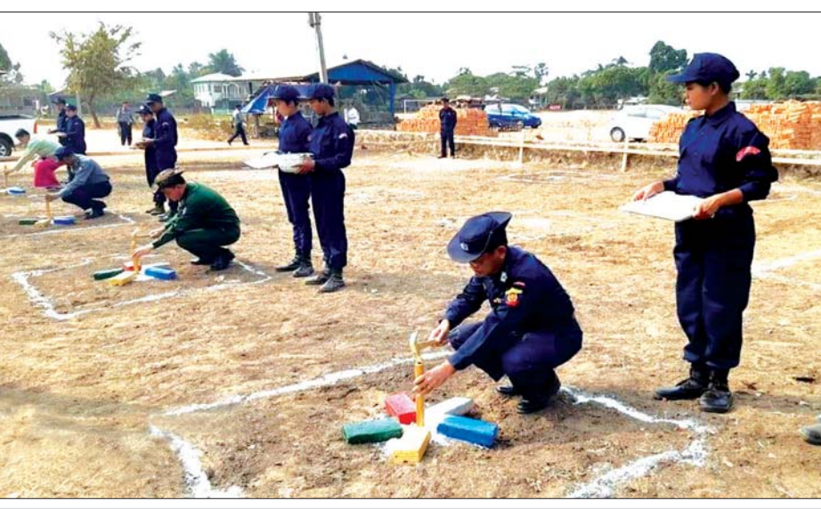
မီးသတ်စခန်းနှင့် ဝန်ထမ်းနေအိမ်များ ဆောက်လုပ်ရန် ပန္နက်တင်နေစဉ်။

မီးဖြူသောင် ဇန်နဝါရီ ၁၆ ၂၀၁၉ - ၂၀၂၀ ဘဏ္ဍာနှစ်အတွင်း မွန်ပြည်နယ် ၁၀ မြို့နယ်တွင် မီးဘေး လုံခြုံရေးကိစ္စရပ်များ ထိရောက်စွာ ဆောင်ရွက်နိုင်ရေးအတွက် လိုအပ် သော မီးသတ်စခန်းများနှင့် ဝန်ထမ်း နေအိမ်များကို မွန်ပြည်နယ် အစိုးရ ရန်ပုံငွေဖြင့် ပြည်နယ်လုံခြုံရေးနှင့် နယ်စပ်ရေးရာဝန်ကြီး ဗိုလ်မှူးကြီး နေထွဋ်ဦးနှင့် ပြည်နယ်မီးသတ်ဦးစီး မှူးညွှန်ကြားရေးမှူး ဦးတင်မောင်နီ တို့က မီးသတ်စခန်းများနှင့် ဝန်ထမ်း နေအိမ်များကို ပန္နက်တင်မင်္ဂလာ အခမ်းအနားများ ပြုလုပ်ဆောင်ရွက် လျက်ရှိရာ ယမန်နေ့က မော်လမြိုင် ခရိုင် ရေးမြို့နယ် မီးဖြူသောင် ကျေးရွာရှိ မီးဖြူသောင်နယ်မြေ မီးသတ်စခန်းဆောက်လုပ်မည့်နေရာ ၌ ကျင်းပသည်။ မွန်ပြည်နယ်အတွင်း မီးသတ် လုပ်ငန်းများ ကျယ်ကျယ်ပြန့်ပြန့် ဆောင်ရွက်နိုင်ရန်အတွက် မုဒုံမြို့နယ်၊ ကျိုက်မရောမြို့နယ်များတွင် မြို့နယ်