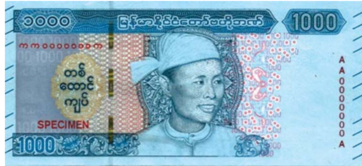
၁၉၀၀ ပြည့်နှစ်မှ ယနေ့အထိ ထုတ်ဝေခဲ့သောငွေစက္ကူများ

ဖြေ။ ။ ပြည်သူတွေအနေနဲ့ သစ်လွင်ကောင်းမွန်တဲ့ ငွေစက္ကူတွေကို ကိုင်တွယ်သုံးစွဲနိုင်ဖို့ မြန်မာနိုင်ငံတော်ဗဟိုဘဏ်အနေနဲ့ ဆောင်ရွက်ပေးလျက်