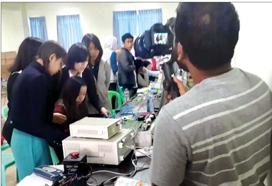
အိန္ဒိယနိုင်ငံနှင့် ကမ္ဘောဒီးယား၊ လာအို၊ မြန်မာ၊ ထိုင်း၊ ဗီယက်နမ်တို့ ပူးပေါင်းဆောင်ရွက်သည့် Mekong-Ganga Cooperation (MGC) ၏ နှစ်(၂၀)ပြည့် အထိမ်းအမှတ်အဖြစ် အိန္ဒိယပြည်ပရေးရာဝန်ကြီးဌာန Website တွင် လွှင့်တင်ပြသမည်ဖြစ်ကြောင်း သိရသည်။ အောင်နိုင်ဦး(FDC)

ရန်ကုန် ဇန်နဝါရီ ၁၆ အိန္ဒိယနိုင်ငံ Animaginer ရုပ်ရှင်ထုတ်လုပ်ရေးမှ မှတ်တမ်းရုပ်ရှင်ရိုက်ကူးရေးအဖွဲ့သည် ယနေ့တွင် မန္တလေးမြို့ ချမ်းမြသာစည်မြို့နယ်ရှိ မြန်မာသတင်းအချက်အလက်နည်းပညာတက္ကသိုလ် (Myanmar Institute of Information Technology) ၌ ရိုက်ကူးမှုပြုလုပ်သည်။ (ယာပုံ)