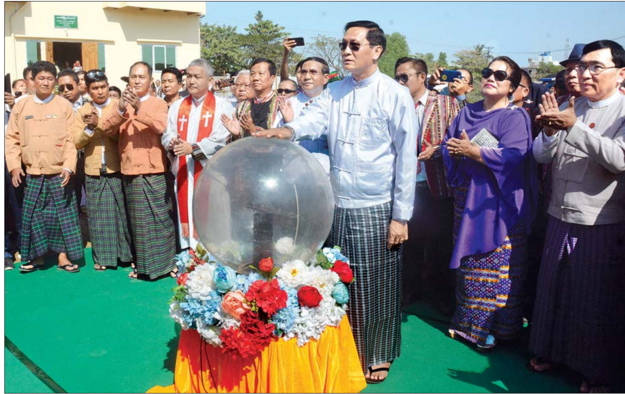
ရန်ကုန် ဇန်နဝါရီ ၁၆ ချင်းလူမှုရေးအသင်း - ရန်ကုန် (All Chin Society - Yangon) ၏ ACSY Community Hall ပန္နက်တော်တင် ဆုတောင်းဆက်ကပ်ခြင်းအခမ်းအနားကို ယနေ့ နံနက် ၁၀ နာရီက ရန်ကုန်မြို့၊ ဒဂုံမြို့သစ်အရှေ့ပိုင်းမြို့နယ် (၁၅) ရပ်ကွက် အမှတ်-၁၈၃ ရှိ ချင်းလူမှုရေးအသင်း - ရန်ကုန် (ACSY) ဝင်းအတွင်း ကျင်းပသည်။ စာမျက်နှာ ၄ ကော်လံ ၁ ❖