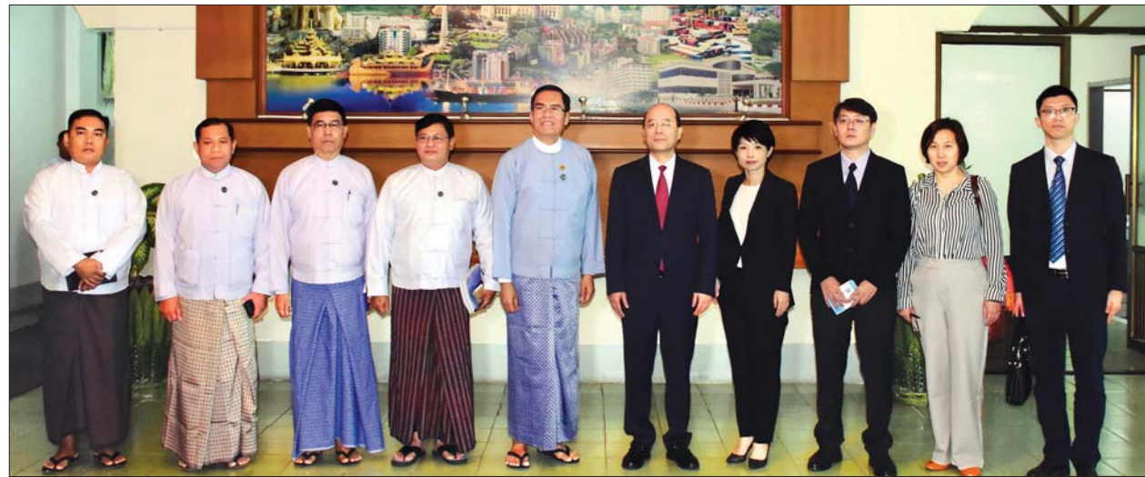
ဒုတိယဝန်ကြီး ဦးအောင်လှထွန်းနှင့် Xinhua သတင်းဌာနချုပ်မှ ဒုတိယဥက္ကဋ္ဌ Mr.Liu Siyang တို့အဖွဲ့ဝင်များနှင့်အတူ စုပေါင်းမှတ်တမ်းတင် ဓာတ်ပုံရိုက်စဉ်။ သတင်းစဉ်