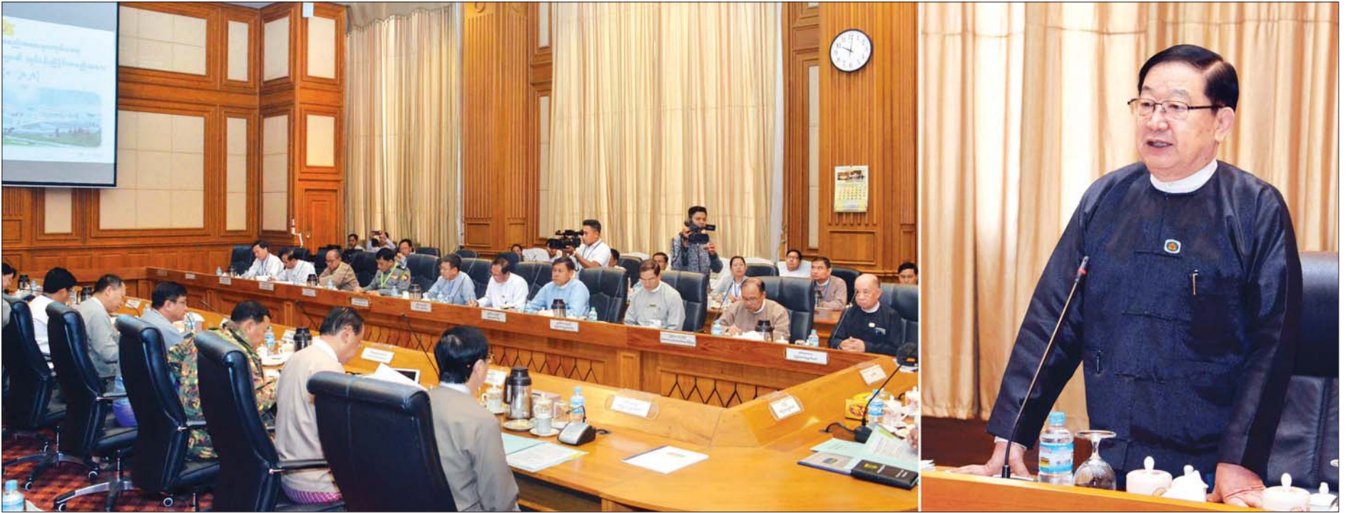
ပြည်သူ့လွှတ်တော်ဥက္ကဋ္ဌ ဦးတီခွန်မြတ် ဒုတိယအကြိမ် လွှတ်တော်အစည်းအဝေးများကျင်းပရေး ဗဟိုကော်မတီနှင့် လုပ်ငန်းကော်မတီများ၏ လုပ်ငန်းညှိနှိုင်းအစည်းအဝေးအမှတ်စဉ်(၁/၂၀၂၀)တွင် အမှာစကားပြောကြားစဉ်။ သတင်းစဉ်