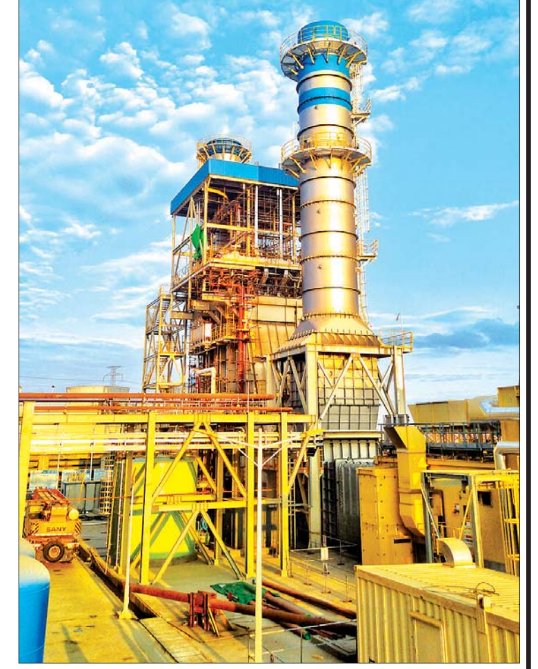
ရန်ကုန်မြို့ သာကေတ ၁၀၆ မဂ္ဂါဝပ် သဘာဝဓာတ်ငွေ့သုံး ဓာတ်အားပေးစက်ရုံ။

မြန်မာနိုင်ငံ၏ လျှပ်စစ်ကဏ္ဍ၌ ရင်းနှီးမြှုပ်နှံမှုကို ကြည့်မည်ဆိုပါက တစ်နိုင်ငံလုံး အနေဖြင့် နိုင်ငံခြားရင်းနှီးမြှုပ်နှံမှုပမာဏ အမေရိကန်ဒေါ်လာသန်း ၂၀၆၈၁ ဒသမ ၆၇၈ သန်း၊ မြန်မာနိုင်ငံသား ရင်းနှီးမြှုပ်နှံမှုပမာဏ အမေရိကန်ဒေါ်လာသန်း ၄၈၃ ဒသမ ၄၃၅ သန်းရှိပြီး ရန်ကုန်တိုင်းဒေသကြီးအတွင်း လျှပ်စစ်ကဏ္ဍ၌ နိုင်ငံခြားရင်းနှီးမြှုပ်နှံမှုပမာဏ အမေရိကန်ဒေါ်လာသန်း ၇၄၆ ဒသမ ၆၂၀ သန်း၊ မြန်မာနိုင်ငံသား ရင်းနှီးမြှုပ်နှံမှုပမာဏ မြန်မာကျပ်ငွေ သန်း ၅၅၉၀၆၀ ဒသမ ၅၅၄ ရှိကြောင်း မြန်မာနိုင်ငံရင်းနှီးမြှုပ်နှံမှုကော်မရှင်မှ သိရသည်။