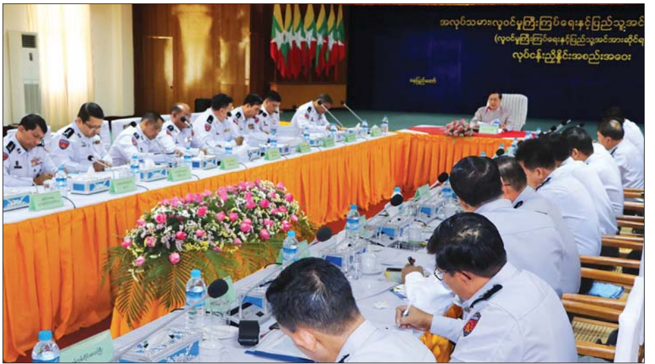
လှုပ်ရှားမှုကြီးကြပ်ရေးနှင့် ပြည်သူ့ အင်အားဆိုင်ရာ လုပ်ငန်းညှိနှိုင်းအစည်းအဝေး ကျင်းပစဉ်။ သတင်းစဉ်

ထို့ပြင် ၂၀၂၀ ပြည့်နှစ်အထွေထွေရွေးကောက်ပွဲအတွက် မဲဆန္ဒရှင်စာရင်း ပြုစုဆောင်ရွက်လျက်ရှိရာ ရွှေ့ပြောင်းလုပ်သားများအပါအဝင် မဲပေးပိုင်ခွင့်ရှိသူများ မဲပေးပိုင်ခွင့်မဆုံးရှုံးရအောင် ဆက်စပ်ဌာနများနှင့်ပူးပေါင်း၍ လိုအပ်သည့် စာရင်းဇယားများ ပြုစုပေးကြရန်လိုအပ်ကြောင်း၊ ယခု ပြည်ဝင်ဗီဇာ၊ လှုပ်ရှားမှုဆေးရေးနှင့် နိုင်ငံခြားသားထိန်းသိမ်းရေး စသည့်လုပ်ငန်းများကို နိုင်ငံတကာနှင့် ရင်ပေါင်တန်းဆောင်ရွက်နိုင်ရန် အဆင့်မြှင့်တင်ဆောင်ရွက်လျက်ရှိရာ နိုင်ငံဖွံ့ဖြိုးတိုးတက်ရေးနှင့် ခရီးသွားလုပ်ငန်းများ ဖွံ့ဖြိုးတိုးတက်ရေးအတွက် ဆိုက်ရောက်ဗီဇာနှင့် e - Visa ခွင့်ပြုမှုများကို တိုးမြှင့်ခွင့်ပြုပေးလျက်ရှိကြောင်း၊ အပြည်ပြည်ဆိုင်ရာလေဆိပ်များ၊ ဆိပ်ကမ်းများနှင့် နယ်စပ် ဝင်/ထွက်ဂိတ်များကို ဒစ်ဂျစ်တယ် စနစ်ဖြင့် ဝင်/ထွက်သွားလာနိုင်ရေး၊ e - Gate စနစ်များ အသုံးပြုနိုင်ရေးအတွက် ခေတ်မီစက်ကိရိယာများ တပ်ဆင်ဆောင်ရွက်ခြင်းလုပ်ငန်းများကို လုပ်ငန်းအဆင့်အလိုက် ဆောင်ရွက်လျက်ရှိပြီး လုပ်ငန်းစဉ်များ အဆင်ပြေမှုကိစ္စအသုံးပြုဆောင်ရွက်နိုင်ရေးအတွက် ဝန်ထမ်းများအနေဖြင့် ကြိုတင်လေ့ကျင့်ထားကြရန် လိုအပ်ကြောင်း၊ အကြောင်းအမျိုးမျိုးကြောင့် နိုင်ငံအတွင်း ဝင်ရောက်လာသည့် နိုင်ငံခြားသားများကို ကန့်သတ်နယ်မြေများနှင့် သွားလာခွင့်မရှိသည့် နယ်မြေများသို့ နယ်မြေကျော်လွန် ဝင်/ထွက်မှု မရှိအောင် စစ်ဆေး