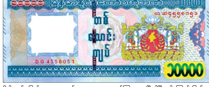
၁၉၇၂ ခုနှစ်မှ ၁၉၀၀ ပြည့်နှစ်အထိ ထုတ်ဝေခဲ့သောငွေစက္ကူများ