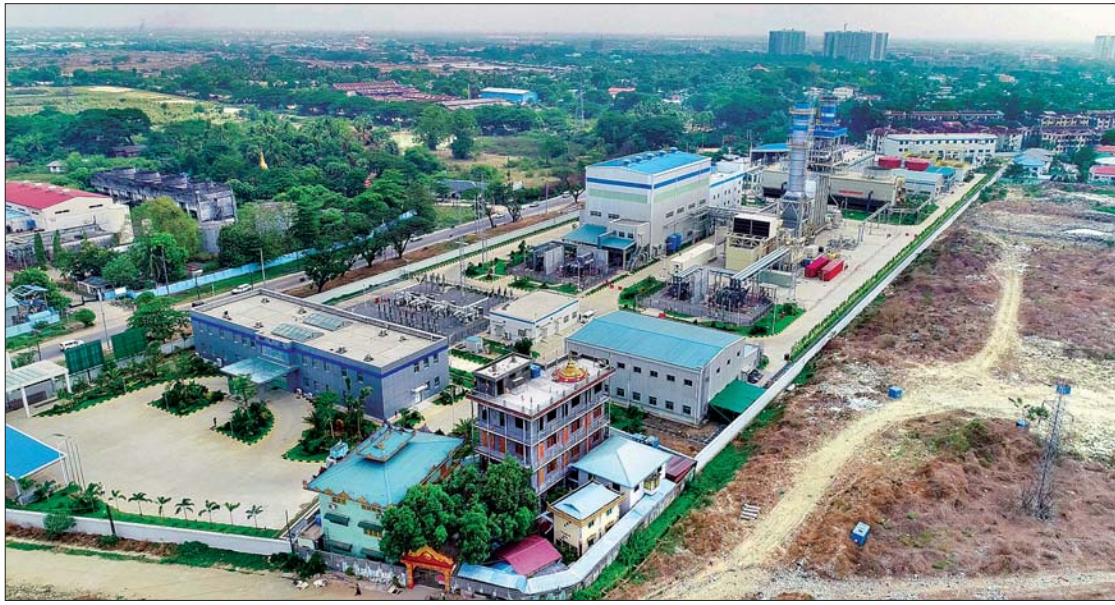
ရန်ကုန်မြို့ သာကေတ ၁၀၆ မဂ္ဂါဝပ် သဘာဝဓာတ်ငွေ့သုံး ဓာတ်အားပေးစက်ရုံ။

မြန်မာနိုင်ငံ၏ စီးပွားရေးလုပ်ငန်းများ ဖွံ့ဖြိုးတိုးတက်ရန်နှင့် ပြည်ပမှရင်းနှီးမြှုပ်နှံမှုများ ပိုမိုဝင်ရောက်လာစေရန် လိုအပ်နေသည့်အကြောင်း ရင်းများထဲတွင် လျှပ်စစ်ဓာတ်အားပြည့်ဝစွာရရှိရေးသည် အဓိကအခန်းကဏ္ဍမှ ပါဝင်နေသည်ဖြစ်ရာ နိုင်ငံတော်အစိုးရအနေဖြင့် လျှပ်စစ်ကဏ္ဍလိုအပ်ချက်ကို ဖြည့်ဆည်းပေးနိုင်ရန် ပြည်သူများ လျှပ်စစ်ဓာတ်အားသုံးစွဲမှု ဖူလုံမှုရှိစေမည့် နည်းလမ်းများကို အကောင်အထည်ဖော် ကြိုးပမ်းဆောင်ရွက်လျက်ရှိသည်။