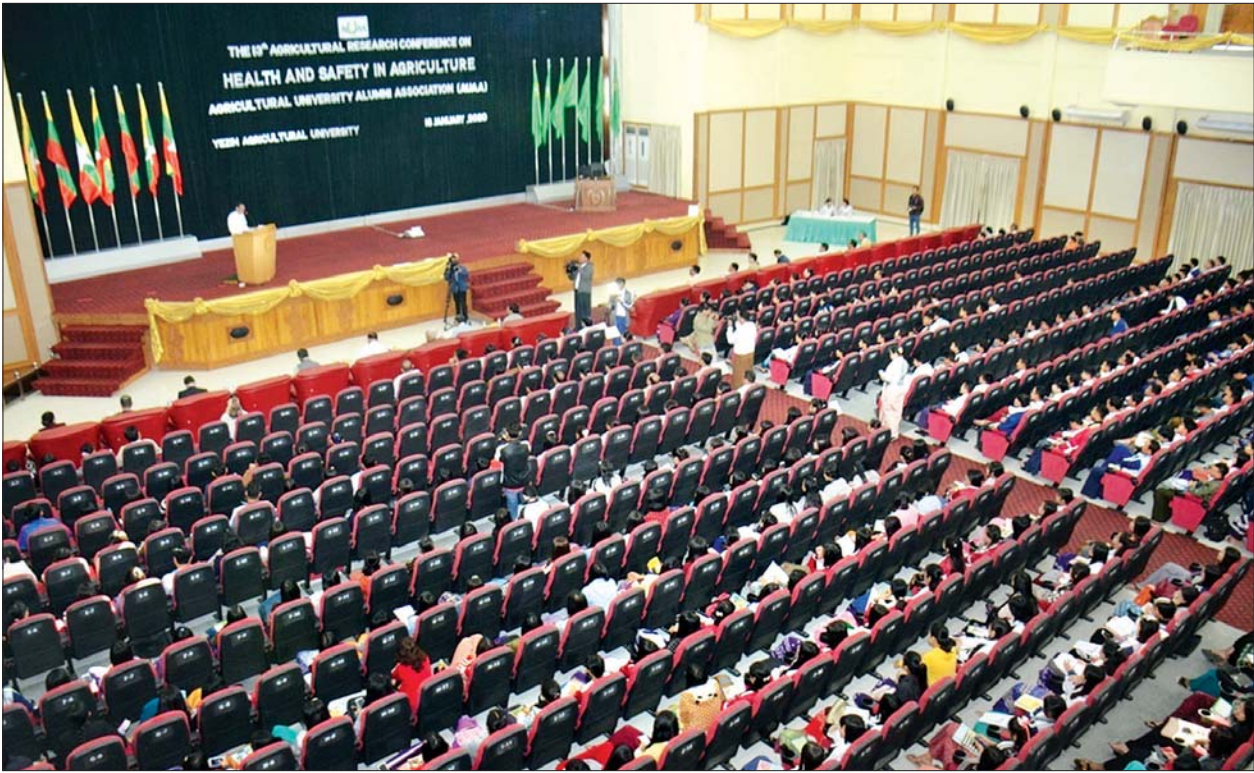
ရေဆင်းစိုက်ပျိုးရေးတက္ကသိုလ် (၁၃) ကြိမ်မြောက် သုတေသနစာတမ်းဖတ်ပွဲကျင်းပစဉ်။ သတင်းစဉ်

ထို့နောက် သုတေသနစာတမ်းဖတ်ပွဲကို ကျင်းပရာ ဂျပန်နိုင်ငံနှင့် မြန်မာနိုင်ငံတွင် ကျင့်သုံးနေသော လယ်ယာစိုက်ပျိုးရေးအခြေအနေများ စာတမ်း၊ မွားပင့်ကူစား သားရဲ လိပ်ခုံးကျင်းအပေါ် အပူချိန်အမျိုးမျိုးနှင့် သားကောင်အရေအတွက် အနည်းအများအလိုက် အကျိုးသက်ရောက်မှုကို လေ့လာခြင်းစာတမ်း၊ ထိန်းချုပ်ထားသော ပတ်ဝန်းကျင်၌ ပဲရိုးထဲတွင် ပါဝင်သည့် အာဟာရဓာတ်များ၏ ကစော်ဖောက်နိုင်ခြင်းအပေါ် အကျိုးသက်ရောက်မှုကို လေ့လာခြင်း စာတမ်း၊ ချင်းပြည်နယ် ဟားခါးမြို့နယ်အတွင်းရှိ ပေါင်းစည်းလယ်ယာစနစ်၏ ကျေးလက်လူနေမှုနှင့် အာဟာရဖူလုံမှုအပေါ် သက်ရောက်မှုကို လေ့လာခြင်းစာတမ်း၊ ပဲပုပ်သီးနှံ၏ မျိုးစေ့ဆောင် ရောဂါများအား Incubation နည်းလမ်းအမျိုးမျိုးအသုံးပြု၍ စမ်းသပ်လေ့လာခြင်းစာတမ်း၊ ရောစပ်ထားသည့် ပိုးသတ်ဆေးများ၏ ပေါင်းစပ်မှုအာနိသင်နှင့် ရွေးချယ်ပိုးသတ်ဆေးများ၏ ဖြုတ်ညှိပိုးအပေါ် ထိရောက်သည့် အချိုးများကို လေ့လာခြင်း စာတမ်းများကို ဖတ်ကြားတင်ပြကြသည်။ ထို့နောက် ဒုတိယဝန်ကြီး ဦးလှကျော်နှင့် တက်ရောက်လာကြသူများ၏ ဆွေးနွေးမေးမြန်းမှုများကို ပြန်လည်ရှင်းလင်းဆွေးနွေး ဖြေကြားခဲ့ကြကြောင်း သိရသည်။ သတင်းစဉ်