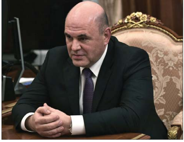
ရုရှားဝန်ကြီးချုပ်သစ်အဖြစ် အဆိုပြုရွေးချယ်ထားသူ မီခေးလ်မီရှူစတင်။ နှင့် စီးပွားရေးလုပ်ငန်းရှင်များအကြား ယုံကြည်မှုထိန်းသိမ်းရန် လိုကြောင်း မီခေးလ်မီရှူစတင်က ဆက်လက်ပြောကြားသည်။ အစိုးရတွင် လုပ်စရာတွေအများကြီးရှိကြောင်းနှင့် အပြုသဘောဆောင်သည့် ဝေဖန်မှုများကိုလည်း လမ်းဖွင့်ပေးဖို့လိုကြောင်း၊ ထို့အပြင် သာမန်လူထုနှင့်လည်း ပိုမိုထိတွေ့ဖို့လိုကြောင်း၊ ဘာတွေဖြစ်ပျက်နေသလဲဆိုသည့် ပြည်သူ့အသံများကိုလည်း နားထောင်ဖို့လိုကြောင်း ၎င်းက ဆက်လက်ပြောကြားလိုက်သည်။

ရုရှားပြည်သူများ၏ဘဝ တကယ့်တိုးတက်မှုကို ခံစားရရှိစေရန် ရုရှားအစိုးရ အနေဖြင့် ပိုမိုကြိုးစားလုပ်ကိုင်ကြရန်လိုကြောင်း သမ္မတ ဗလာဒီမာပူတင် အဆိုပြုထားသော ဝန်ကြီးချုပ်လောင်း မီခေးလ်မီရှူစတင်က မူဝါဒရေးရာ အကောင်အထည်ဖော်သူများကို ဇန်နဝါရီ ၁၆ ရက်က ပြောကြားလိုက်သည်။ သမ္မတ ဗလာဒီမာပူတင်က ပြည်သူများပိုမိုကောင်းမွန်သည့်ပြောင်းလဲမှုများကို သိမြင်ခံစားရတော့မည်ဆိုသည့် စကားကို မကြာခဏ အလေးအနက်ထား ပြောကြားလေ့ရှိကြောင်းကို သမ္မတအဆိုပြု ဝန်ကြီးချုပ် မီခေးလ်မီရှူစတင်က မူဝါဒရေးရာပြဋ္ဌာန်းသူများကို ပြောကြားလိုက်သည်။ မီခေးလ်မီရှူစတင်သည် စီးပွားရေးနှင့် နိုင်ငံရေးသမားတစ်ဦးဖြစ်ပြီး စွန့်ခွာထိထွက်သူတစ်ဦးလည်းဖြစ်ကာ လတ်တလောတွင် ရုရှားနိုင်ငံ အခွန်ဌာန၏ အကြီးအကဲတစ်ဦးဖြစ်သည်။ ၎င်းကို ရုရှားနိုင်ငံ၏ ဝန်ကြီးချုပ်အဖြစ် သမ္မတ ဗလာဒီမာပူတင်က ရွေးချယ်ခဲ့ခြင်းဖြစ်သည်။ ဇန်နဝါရီ ၁၅ ရက်က ရုရှားသမ္မတပူတင်သည် အခြေခံဥပဒေဆိုင်ရာ ပြုပြင်ပြောင်းလဲမှုများ လုပ်ဆောင်မည်ဟု ပြောကြားပြီးနောက် ၎င်း၏ အားထား ယုံကြည်ရသည့် ဒီမိုကရေစီမက်ဒီဘင်သည် နိုင်ငံ၏ ဝန်ကြီးချုပ်ရာထူးမှ နုတ်ထွက်ခဲ့သည်။ အသက် ၅၃ နှစ်ရှိပြီး ဝန်ကြီးချုပ်အဖြစ် ရွေးချယ်ခံရသည့် မီခေးလ်မီရှူစတင်က အာဏာပိုင်များသည် စီးပွားရေးအသိုင်းအဝိုင်း၏ ယုံကြည်မှုကို ထိန်းသိမ်းရန်လိုကြောင်း ပြောကြားသည်။ ယခုထက်ပိုမိုတိုးတက်ရန်နှင့် နိုင်ငံ၏ အသားတင်ထုတ်လုပ်မှုတန်ဖိုး (ဂျီဒီပီ) တိုးတက်ရန် ရင်းနှီးမြှုပ်နှံမှုတိုးတက်ရန်လိုကြောင်း၊ အာဏာပိုင်များ