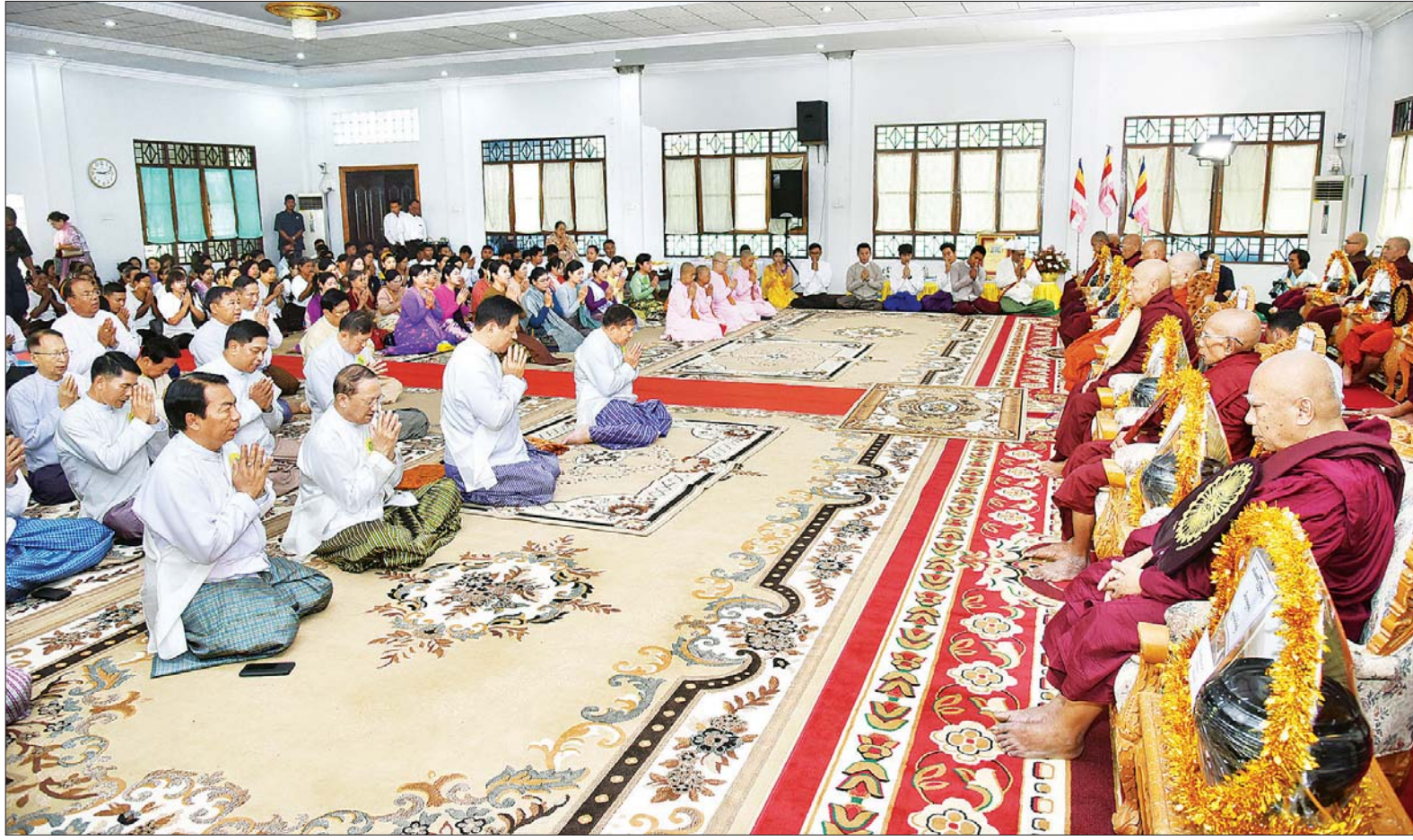
တပ်မတော်ကာကွယ်ရေးဦးစီးချုပ် ဗိုလ်ချုပ်မှူးကြီး မင်းအောင်လှိုင်နှင့် ဧည့်ပရိသတ်များက မင်္ဂလာဒုံမြို့နယ်၊ ကံသုံးဆင့် ပရိယတ္တိစာသင်တိုက်၊ ဦးစီးပဓာနနာယက ဆရာတော် အဂ္ဂမဟာပဏ္ဍိတ၊ ဘဒ္ဒန္တဂုဏိကာဘိဝံသထံမှ အနုမောဒနာတရားနာယူကြစဉ်။

တက်ရောက်လာကြသည့် အရာရှိကြီး များ၊ စေတနာရှင်အလှူရှင်များက ဆရာတော်၊ သံဃာတော်များအား လှူဖွယ်ပစ္စည်းများ ဆက်ကပ် လှူဒါန်းကြသည်။