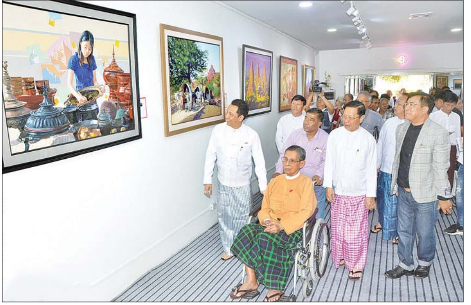
အမျိုးသားဒီမိုကရေစီအဖွဲ့ချုပ် နာယက သူရဦးအောင်ကိုနှင့် တာဝန်ရှိသူများက နှလုံးသားအမွေခံ မဟာပုဂံ ပန်းချီပြခန်းအတွင်း ကြည့်ရှုလေ့လာကြစဉ်။

အမှာစကားများပြောကြား ထိုနေ့က သာသနာရေးနှင့် ယဉ် ကျေးမှုဝန်ကြီးဌာန ပြည်ထောင်စု ဝန်ကြီး သူရဦးအောင်ကိုက အမှာ စကားပြောကြားသည်။ ဆက်လက်၍ ရန်ကုန်တိုင်းဒေသ ကြီး ရခိုင်တိုင်းရင်းသားလူမျိုးရေးရာ ဝန်ကြီး ဦးဇော်အေးမောင်၊ ပန်းချီဆရာ ကြီး ဦးလွန်းကြွယ်၊ အလင်္ကာကျော်စွာ ဒါရိုက်တာ ပန်းချီဦးစိုးမိုး၊ အနော်ရထာ