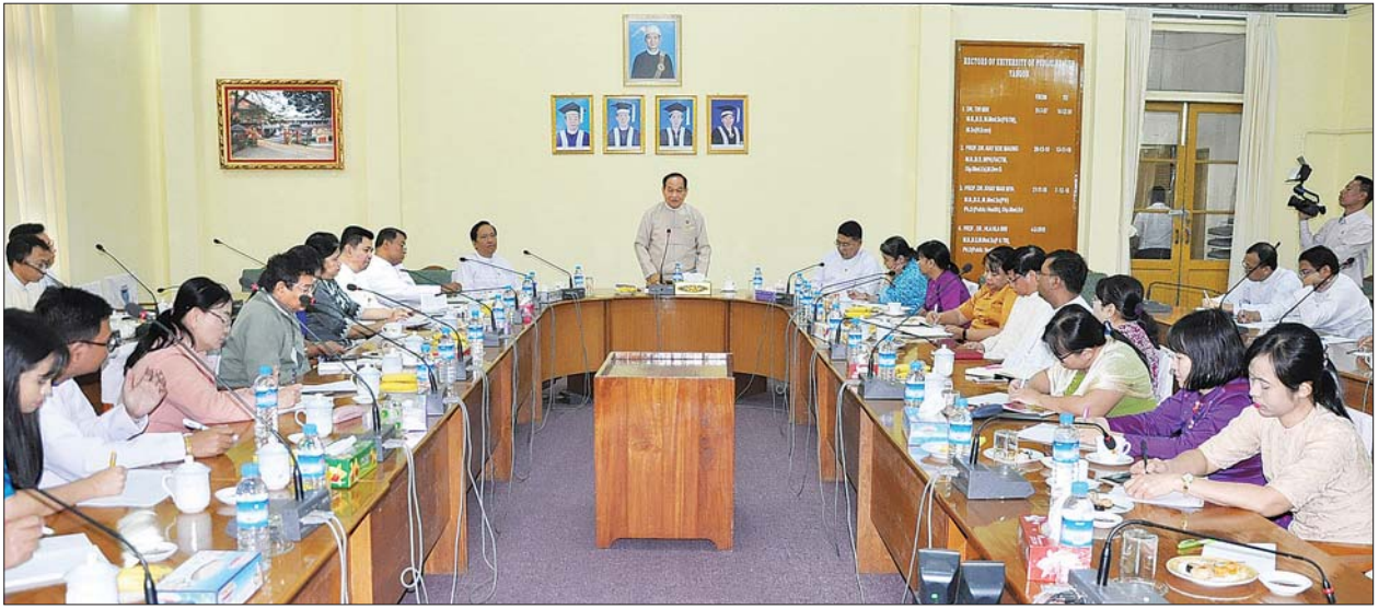
ပြည်ထောင်စုဝန်ကြီး ဒေါက်တာမြင့်ထွေး မြန်မာ-ဩစတြေးလျ ကျန်းမာရေးသုတေသနပူးပေါင်းဆောင်ရွက်မှု စာတမ်းဖတ်ပွဲ၌ အမှာစကား ပြောကြားစဉ်။ သတင်းစဉ်

မျိုးဆက်သစ်ဆေးပညာရှင်များကိုလည်း သုတေသနစွမ်းဆောင်ရည်များ မြင့်မားရေး အားပေးမြှင့်တင်ဆောင်ရွက်ကြရမည် ဖြစ်ပါကြောင်း၊ ဝန်ကြီးဌာနအနေဖြင့် တက္ကသိုလ်များတွင် သုတေသနကို ပိုမိုစိတ်ဝင်စားသိရှိစေရန်နှင့်