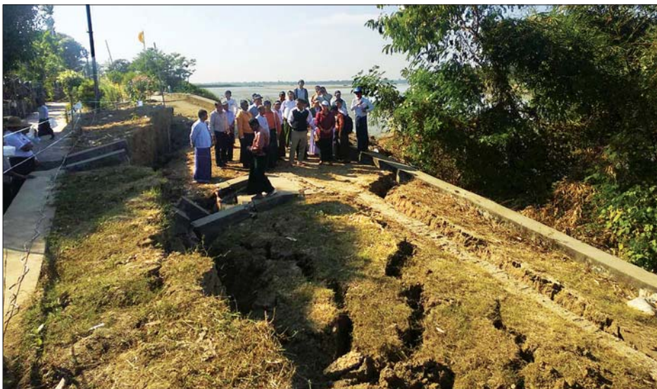
ညောင်တုန်းမြို့ မြစ်ကမ်းတာပေါင် နိမ့်ကျမှုကို တာဝန်ရှိသူများ ကွင်းဆင်းစစ်ဆေးစဉ်။

ညောင်တုန်း ဇန်နဝါရီ ၁၂ ဧရာဝတီတိုင်းဒေသကြီး မအူပင်ခရိုင် ညောင်တုန်းမြို့တွင် ဇန်နဝါရီ ၇ ရက်မှ စတင်ဖြစ်ပွားခဲ့သည့် မြစ်ကမ်းကာကွယ်ရေးတာပေါင်နှင့် အုတ်ရိုးကျိုးပြတ်နိမ့်ကျမှု၊ မြေကျဆိပ်ဆင်းနေမှုတို့ကို ဇန်နဝါရီ ၁၁ ရက်က ဧရာဝတီတိုင်းဒေသကြီး လျှပ်စစ်၊ စွမ်းအင်၊ စက်မှုလက်မှုနှင့် လမ်းပန်းဆက်သွယ်ရေးဝန်ကြီး ဦးဝင်းဌေးနှင့် တာဝန်ရှိသူများက ကြည့်ရှု စစ်ဆေးရာ တိုင်းဒေသကြီး ရေအရင်းအမြစ်နှင့် မြစ်ချောင်းများ ဖွံ့ဖြိုးတိုးတက်ရေးဦးစီးဌာန ညွှန်ကြားရေးမှူးက မြေပြင်အခြေအနေများနှင့် ဆောင်ရွက်ထားရှိမှု အခြေအနေများကို ရှင်းလင်းတင်ပြသည်။