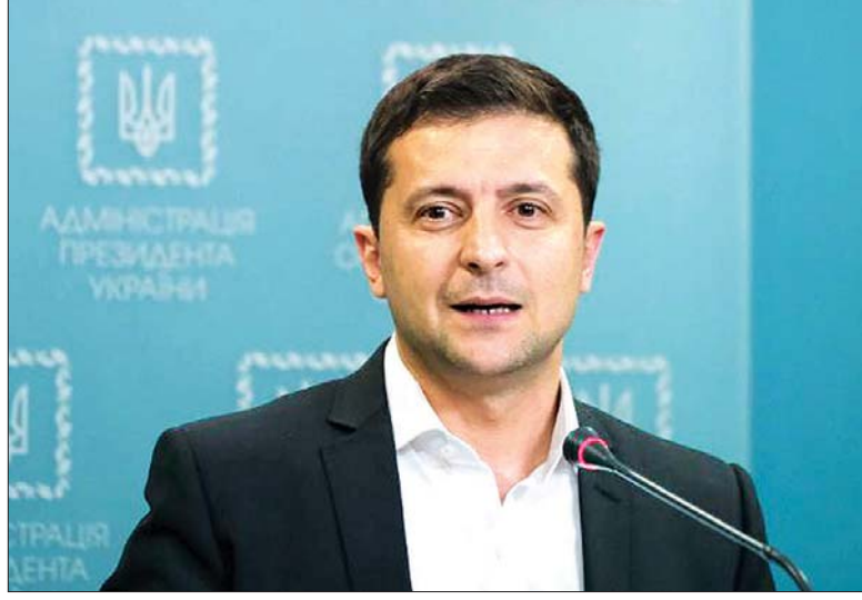
ယူကရိန်းသမ္မတ ဇေးနိုဝ်က