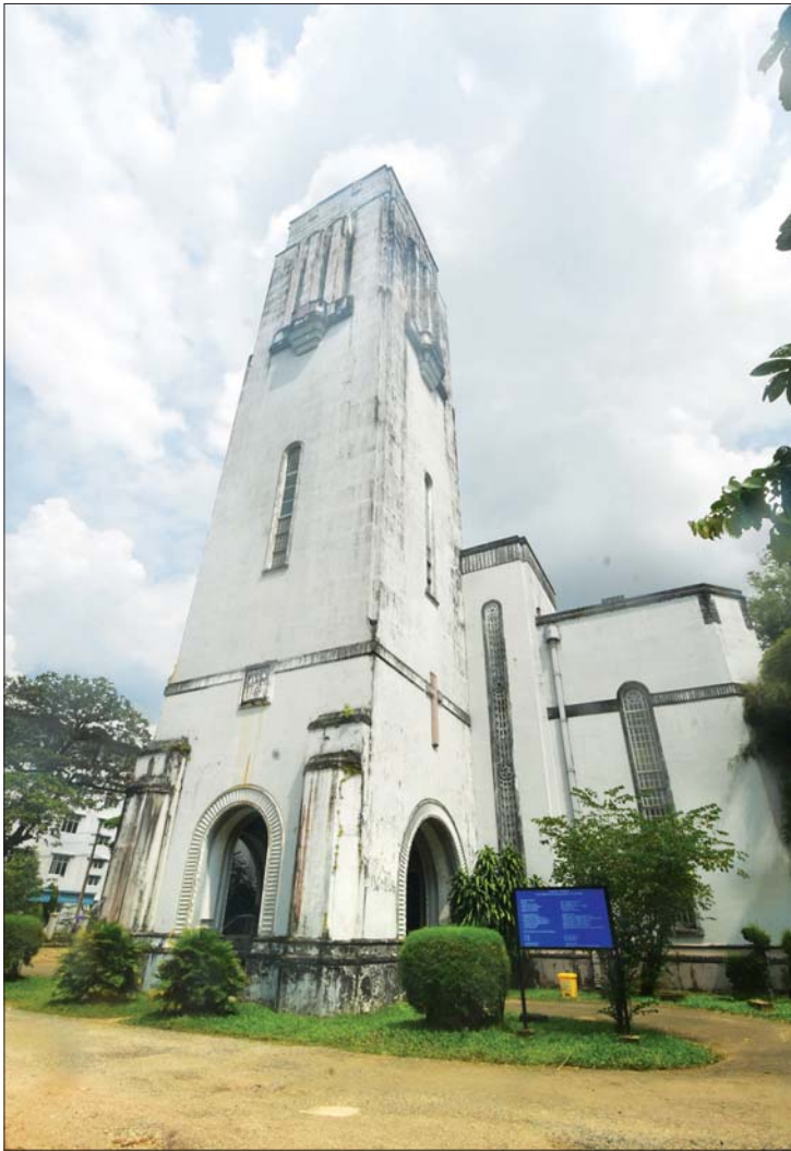
ရန်ကုန်တက္ကသိုလ်ဝင်းရဲ့ ဂျပ်ဆင်ဘုရားရှိခိုးကျောင်း။

ပြီးခဲ့တဲ့ ဒီဇင်ဘာလမှာ ကျောင်းထဲကို ရောက်သေးတယ်။ အပြောင်းအလဲမရှိ ပေမယ့် သစ်ပင်ခတ်တယ်ကြားလို့ သစ်ပုတ် ပင်ကြီး ကျန်သေးသလားဆိုပြီး သူငယ်ချင်း အချင်းချင်း နောက်ပြောင်ရင်း ရောက်ခဲ့သေး တယ်။ ကျောင်းကြီးက စိမ်းလန်းစိုပြည်တုန်း ပါပဲ။ အဲကို ကင်တင်နန်းကိုသွားတဲ့ စင်္ကြံလမ်း ကတော့ ကျွန်တော်တို့ခေတ်လို ဟာလာ ဟင်းလင်းကြီး မဟုတ်တော့ဘူး။ တစ်ခုတော့ ရှိမယ်။ ရန်ကုန်တက္ကသိုလ်ဝင်းထဲမှာ တံတိုင်း တွေ ခတ်တာတော့ ခံစားလို့မရဘူး။ တက္ကသိုလ်အပန်းဖြေရိပ်သာ နောက်မှာ ဝင်း တံတိုင်းတွေ ခတ်တာကိုတော့ သဘောမကျ ကြဘူး။ ရန်ကုန်တက္ကသိုလ်ကြီးအတွင်းမှာ လွတ်လွတ်လပ်လပ် သွားလာလို့ရအောင် ယခင်ထဲက ဝင်းခတ်တာမရှိခဲ့ဘူး။ ကြုံလို့ ပြောပြတာပါ။ လူမှုကွန်ရက်တွေမှာလည်း တွေ့ရမှာပါ။ ရန်ကုန်တက္ကသိုလ်ကြီး နှစ်ရာပြည့်ပွဲဟာ တစ်ကြိမ်ပဲကြုံဆုံရတဲ့ ပွဲဖြစ်တဲ့အပြင် အစဉ်အလာကြီးမားတဲ့ ကျောင်းတော်ကြီးဖြစ်တာကြောင့် အားလုံး ဝိုင်းဝန်းပြီး ကဏ္ဍနယ်ပယ်အသီးသီးကနေ ပူးပေါင်းမှုနဲ့ သမိုင်းမှတ်တိုင် စိုက်ထူစေလို့