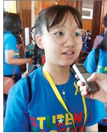
မနန်းရွှေရည်ဝင်း

အားလုံးပေါင်း ဇန် ငါးခု ကလေးများ စိတ်ဝင်စားအောင် လုပ်ပေးထားပါတယ်။ စိန်ရတနာသင်တန်းတော် နေရာသိပ်မကျယ်ဘူး။ နောက်နှစ်တွေဆို သုဝဏ္ဏကွင်းတို့ အောင်ဆန်း ကွင်းတို့မှာ လုပ်စေချင်တယ်။ ပထမဦးဆုံး အကြိမ်ဖြစ်ပြီး စီစဉ်တာလည်း နောက်ကျ သွားတာ ဖြစ်လို့ပါ။ ဇန်နဝါရီလမှာ လုပ်ရတဲ့ အတွက် ကလေးတွေ စာမေးပွဲနဲ့ နီးနေတာ ကြောင့် ကလေးတွေကို ခုနစ်တန်း၊ ရှစ်တန်းကိုးတန်းပဲ ဖိတ်ပါတယ်။ နောက်နှစ် တွေဆို နိုင်ငံတော်လောက ကျင်းပဖို့အစီအစဉ် ရှိပါတယ်။ အာဆီယံ ၁၀ နိုင်ငံစလုံး ကျန်တဲ့ ကိုးနိုင်ငံက ကျောင်းသူ ကျောင်းသားတွေကို ဖိတ်ဖို့လည်း စီစဉ်ထားပါတယ်။ သင်ယူမှု လုပ်ငန်းတွေကို ဇန် ငါးခု သတ်မှတ်ပြီး နံပါတ်(၁)က အာဆီယံဇန်နဝါရီ ဖတ်စာအုပ် ထဲမှာက အာဆီယံ ၁၀ နိုင်ငံစလုံး သင်ရတဲ့