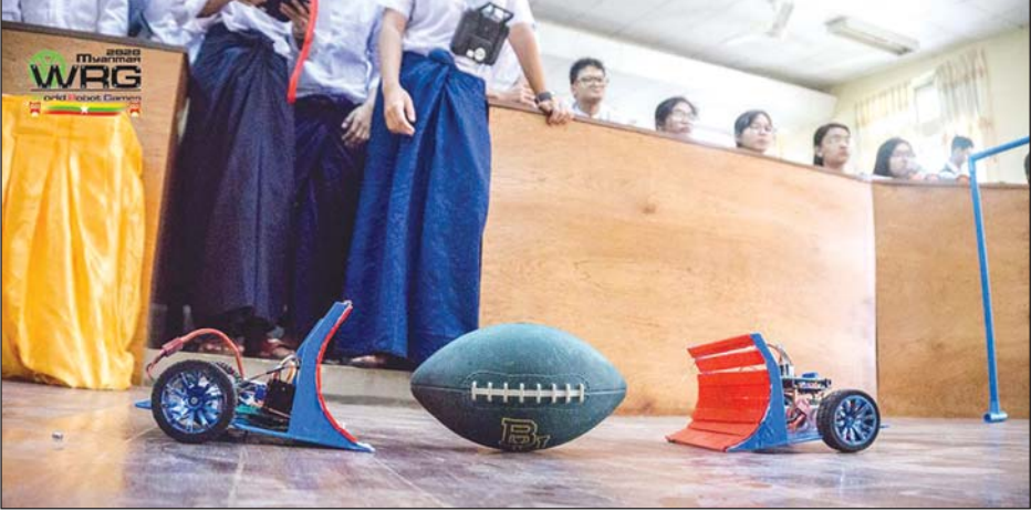
Rugby Robot ပြိုင်ပွဲအတွက် စက်ရုပ်များကို Steet show တစ်ခုတွင် ပြသနေစဉ်။

မြန်မာနိုင်ငံ ကွန်ပျူတာပညာရှင်အသင်းနှင့် Clash of Robots Team (COR) တို့ ပူးပေါင်း၍ "World Robot Games (Myanmar) 2020" ပြိုင်ပွဲကို ရန်ကုန် မြို့၊ လှိုင်မြို့နယ်ရှိ MICT Park ပင်မဆောင်၌ ဇန်နဝါရီ ၂၄ ရက်မှ ၂၆ ရက်အထိ ကျင်းပသွားမည်ဖြစ်ရာ အဆိုပါ ပြိုင်ပွဲတွင် ပါဝင်ယှဉ်ပြိုင်မည့် ဂျူနီယာ အဆင့်ပြိုင်ပွဲနှင့် စီနီယာအဆင့် ပြိုင်ပွဲအတွက် အသင်းများ၏ စာရင်းကို ဇန်နဝါရီ ၅ ရက်က ထုတ်ပြန်ကြေညာခဲ့သည်။