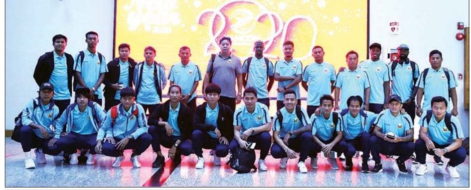
၂၀၂၀ အာရှချန်ပီယံလိဂ် အကြိုခြေစစ်ပွဲပထမအဆင့်ယှဉ်ပြိုင်မည့် ရှမ်းယူနိုက်တက်အသင်း။ ဓာတ်ပုံ-ရှမ်းယူနိုက်တက်

◆ ကျောစွဲမှ ဒဏ်ရာပြသနာကြောင့် ပါဝင်နိုင်ခြင်း မရှိခဲ့ပေ။ ရှမ်းယူနိုက်တက်အသင်းသည် အာရှချန်ပီယံလိဂ် အကြို ခြေစစ်ပွဲပထမအဆင့်တွင် ဖိလစ်ပိုင်ကလပ် ဆီရက်စ် အသင်းနှင့် အဝေးကွင်းကစားရမည်ဖြစ်ပြီး ဇန်နဝါရီ ၁၄ ရက် မြန်မာစံတော်ချိန် ညနေ ၆ နာရီတွင် ယှဉ်ပြိုင် ကစားရမည်ဖြစ်သည်။ ရှမ်းယူနိုက်တက်အသင်းသည် ၂၀၁၉ ရာသီတွင် MNL အမှတ်ပေး ချန်ပီယံဆုကို ရရှိခဲ့သောကြောင့် အာရှချန်ပီယံ လိဂ်တွင် အကြိုခြေစစ်ပွဲအဆင့်မှ စတင်ကစားရခြင်းဖြစ်ပြီး ယခုအဆင့်ကို ကျော်ဖြတ်နိုင်ပါက ဒုတိယအဆင့်တွင် ထိုင်းကလပ် Port အသင်းနှင့် ဆက်လက်ကစားရမည် ဖြစ်သည်။ ရှမ်းယူနိုက်တက်အသင်းသည် ယခုရာသီတွင် ပြည်တွင်းပြိုင်ပွဲများအပြင် နိုင်ငံတကာပြိုင်ပွဲများလည်း ယှဉ်ပြိုင်ရမည်ဖြစ်သောကြောင့် ပြင်ဆင်မှုများစွာ ပြုလုပ်ထားသည်။ ညိုမြတ်သော်တာ