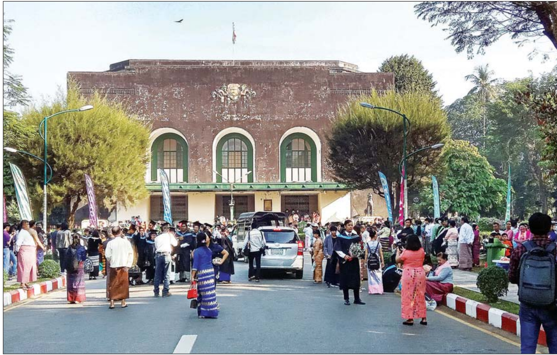
ရန်ကုန်တက္ကသိုလ် သွဲ့နှင်းသဘင်ခန်းမ။

ကိုပါ သင်ကြားပေးတဲ့နေရာလို့ ဖွင့်ဆိုခဲ့ ပါတယ်။ ရန်ကုန်ယူနီဗာစီတီ(သို့မဟုတ်) ရန်ကုန် တက္ကသိုလ်ကြီးဟာ ၂၀၂၀ ပြည့်နှစ် ဒီဇင်ဘာလမှာ နှစ်ပေါင်းတစ်ရာ ပြည့်ပါ တော့မယ်။ ၁၉၈၂-၁၉၈၃ ခုနှစ် စာကြည့် တိုက်ပညာ ဒီပလိုမာကျောင်းသူတစ်ဦး အနေနဲ့ ပညာရင်ဆိုင်သောကိစ္စဖူးခဲ့တဲ့ အမိ တက္ကသိုလ်ရဲ့ ရာပြည့်ပွဲကို ရန်ကုန်တက္ကသိုလ် နှစ်(၅၀) ပြည့် ရွှေရတုအခါမှာ ဆရာ အောင်ပြည့်ရဲ့ ဆုတောင်းလေးအတိုင်း ဆုတောင်းပေးလိုပါတယ်။ ဟိုသစ္စ အမှန် ဆိုခြင်းသည် စကားများကြောင့် နောင်အနှစ် ငါးဆယ်ကြာ မြသီတာအရင်၏ “ရာပြည့်ပွဲ” သည် ယခုထက်၊ ထက်က ခြိမ်းခြိမ်းသံသ ပါစေသတည်းလို့ ဆုမွန်ကောင်းမြေလို ပါတယ်။