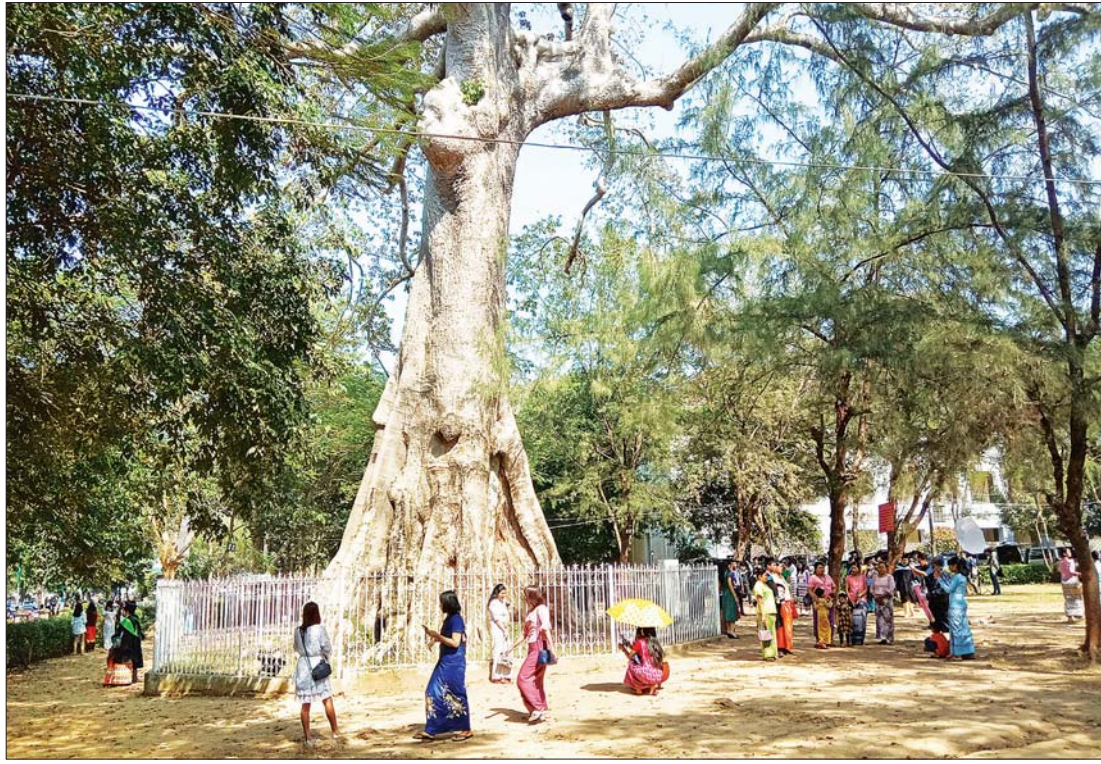
အပြာရောင်ကမည်းပြားမှတ်တမ်းဝင် ရန်ကုန်တက္ကသိုလ်ဝင်းအတွင်းရှိ သစ်ပင်ပင်။

တက္ကသိုလ်ရာပြည့်မှာ ကျွန်တော်တို့ တတ်နိုင်တဲ့ဘက်က စာပေဖြစ်စေ၊ အနုပညာဖြစ်စေ၊ မိမိတတ်ကျွမ်းရာ တစ်ခုခုနဲ့ဖြစ်စေ တိုင်းပြည်နဲ့ လူမျိုး အတွက် အကောင်းဆုံးဖြစ်အောင်၊ တက္ကသိုလ်ရဲ့ ပုံရိပ်ကြီး အကောင်းဆုံး လှပအောင် ထမ်းဆောင်ကြဖို့ အရေးကြီးပါတယ် ဆရာချစ်ဦးညို (စာရေးဆရာ)