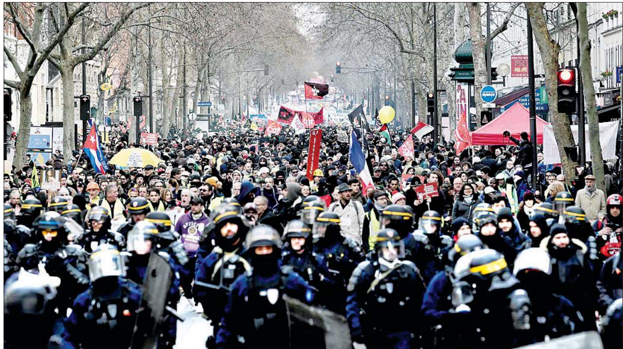
ဇန်နဝါရီ ၁၁ ရက်က ပါရီမြို့၌ ဆန္ဒပြနေကြသူများကို တွေ့ရစဉ်။

ပြည်တွင်းမှဆန္ဒပြမှုတွေကြောင့် အကျပ်ရိုက်နေတဲ့ ပြင်သစ်နိုင်ငံအတွက် အစိုးရဟာ ဆန္ဒပြသူတွေနဲ့ညှိနှိုင်းနိုင်ဖို့အရေး ကြိုးပမ်းမှုတစ်ရပ်ပြုလုပ်ခဲ့ပါတယ်။ ထောင်နဲ့ချီတဲ့ ပြင်သစ်ပြည်သူတွေဟာ ပါရီမြို့တော်အပါအဝင် တခြားသော မြို့ကြီးတွေမှာ လမ်းမပေါ်ထွက်ဆန္ဒပြမှုတွေ ပြုလုပ်လာတဲ့အခါမှာတော့ အစိုးရ အနေနဲ့ လိုက်လျောမှုတစ်ခု ပြုလုပ်ပေးခဲ့ရပါတယ်။