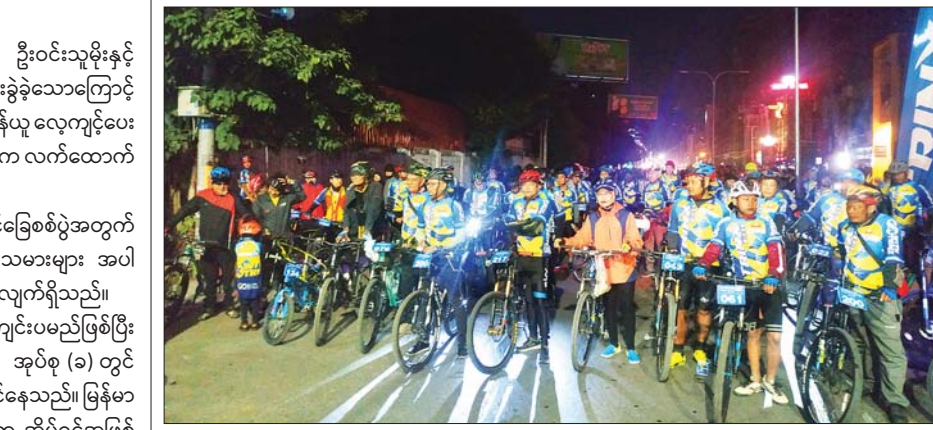
ဇန်နဝါရီ ၁၂ ရက်က TRINX Mingun fun ride Tour (မန္တလေး-မင်းကွန်း) စုပေါင်းစက်ဘီးစီးနင်းပွဲ ပါဝင်ဆင်နွှဲကြမည့် စက်ဘီးစီးကစားသမားများကို မန္တလေးမြို့ ချမ်းအေးသာစံမြို့နယ် ၇၈ လမ်း အိုး-စတိုးရှေ့ တာလွတ်စုရပ်နေရာ၌ တွေ့ရစဉ်။ (စုပေါင်းစက်ဘီးစီးနင်းပွဲသို့ မန္တလေးမြို့၊ အမရပူရ စစ်ကိုင်၊ တံတားဦးနှင့် အနီးဝန်းကျင်မြို့တို့မှ စက်ဘီးစီးဝါသနာရှင် စုစုပေါင်း ၂၀၀ ကျော် ပါဝင်ဆင်နွှဲခဲ့ကြောင်း သိရသည်။) တင်မောင် - မန်းကိုယ်ပွား

○ ကျောစွဲမှ မြန်မာအမျိုးသမီးအသင်းသည် ယခင်နည်းပြချုပ်ဟောင်း ဦးဝင်းသုမိုးနှင့် စာချုပ်သက်တမ်းပြည့်သွားချိန်တွင် သက်တမ်းမတိုးဘဲ လမ်းခွဲခဲ့သောကြောင့် အိုလံပစ်ခြေစစ်ပွဲအတွက် လက်ထောက်နည်းပြအဖွဲ့က တာဝန်ယူ လေ့ကျင့်ပေး လျက်ရှိပြီး ခြေစစ်ပွဲမတိုင်မီ နည်းပြသစ် ခန့်အပ်နိုင်ခြင်းမရှိပါက လက်ထောက် နည်းပြအဖွဲ့ကပင် တာဝန်ယူကိုင်တွယ်သွားမည်ဖြစ်သည်။ မြန်မာအမျိုးသမီးအသင်းသည် အိုလံပစ်တတိယဆင့်ခြေစစ်ပွဲအတွက် ဒီဇင်ဘာ ၂၁ ရက်တွင် စခန်းဝင်လေ့ကျင့်ခဲ့ပြီး စီနီယာကစားသမားများ အပါအဝင် အမာခံကစားသမားအစုံအလင်ဖြင့် လေ့ကျင့်ပြင်ဆင်လျက်ရှိသည်။ အိုလံပစ် တတိယဆင့်ခြေစစ်ပွဲကို အုပ်စုနှစ်ခုခွဲ၍ ကျင်းပမည်ဖြစ်ပြီး အုပ်စု (က) တွင် တောင်ကိုရီးယား၊ ဗီယက်နမ်၊ မြန်မာ၊ အုပ်စု (ခ) တွင် ဩစတြေးလျ၊ တရုတ်၊ ထိုင်း၊ တရုတ်(တိုင်ပေ)အသင်းတို့ ပါဝင်နေသည်။ မြန်မာအသင်းပါဝင်သည့် အုပ်စု (က) ကို တောင်ကိုရီးယားနိုင်ငံက အိမ်ရှင်အဖြစ် လက်ခံကျင်းပမည်ဖြစ်ပြီး မြန်မာအသင်းသည် ဖေဖော်ဝါရီ ၃ ရက်တွင် တောင်ကိုရီးယားအသင်း၊ ဖေဖော်ဝါရီ ၆ ရက်တွင် ဗီယက်နမ်အသင်းတို့နှင့် ကစားရမည်ဖြစ်သည်။ အုပ်စု တစ်ခုစီမှ ထိပ်ဆုံးနှစ်သင်းစီမှာ နောက်ဆုံး အဆင့် ခြေစစ်ပွဲသို့ တက်ရောက်ခွင့်ရမည်ဖြစ်သောကြောင့် မြန်မာအသင်း အနေဖြင့် မျှော်လင့်ချက်ရှိနေပြီး အာဆီယံဒေသတွင်းပြိုင်ဘက် ဗီယက်နမ် အသင်းကို ကျော်ဖြတ်ရမည်ဖြစ်သည်။ ညိုမြတ်သော်တာ