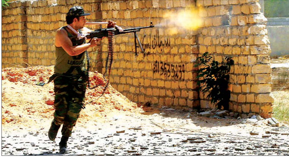
လစ်ဗျား၌ ဖြစ်ပွားနေသည့် တိုက်ပွဲအတွင်း အမျိုးသားညီညွတ်ရေးအစိုးရအဖွဲ့မှ တပ်ဖွဲ့ဝင်တစ်ဦးကို တွေ့ရစဉ်။

၂၀၁၁ ခုနှစ်က နေတိုးအဖွဲ့ကျောထောက်နောက်ခံ ပေးထားသည့် ပုန်ကန်ထကြွမှုကြောင့် အာဏာရှင် မွမ်မာ ကဒါဖီ သေဆုံးခဲ့ပြီးနောက် မြောက်အာဖရိကနိုင်ငံဖြစ်သည့် လစ်ဗျား၌ နိုင်ငံရေးဆိုင်ရာ ကသောင်းကနင်းဖြစ်မှုများ ပေါ်ပေါက်လာခဲ့ကာ စစ်အာဏာသိမ်းခေါင်းဆောင် ကာလီ ဖာဟက်ဖ်တာက ကုလသမဂ္ဂအသိအမှတ်ပြုထားသည့် လစ်ဗျားအစိုးရလက်ထဲမှ ထရီပိုလီမြို့ကို ပြန်လည် သိမ်းယူနိုင်ရန် ကြိုးပမ်းလျက်ရှိသည်။