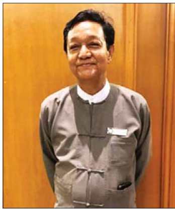
ဒါရိုက်တာညီညီထွန်းလွင် (မြန်မာနိုင်ငံရုပ်ရှင်အစည်းအရုံးဥက္ကဋ္ဌ)