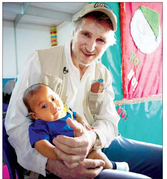
ယူနိုက်တက်သံတမန် လီယန်နီဆင် ရွှေ့ပြောင်းနေထိုင်သူများ မှတ်ပုံတင်သည့် စခန်းမှ ကလေးတစ်ဦးနှင့်အတူ တွေ့ရစဉ်။

ပင်နီစွဲလားနိုင်ငံမှ ထွက်ပြေး လာသူ မိသားစုအရေအတွက်မှာ တဖြည်းဖြည်း မြင့်တက်လာပြီး