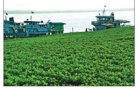
ရောဂါတိမြစ်ကမ်းဘေးမှ သီးနှံစိုက်ခင်းများ။

ပခုက္ကူ ဇန်နဝါရီ ၁၂ ပခုက္ကူမြို့နယ် ကုက္ကိုလှကျေးရွာအနီး ရောဂါတိမြစ်ကမ်း နံ့ဘေးရှိ စိုက်ပျိုးမြေလယ်ကွက်များတွင် မဲစနစ်ဖြင့် စားသောက်ကုန်သီးနှံများကို တစ်နှစ်စီအလှည့်ကျ စိုက်ပျိုး ကြကြောင်း ဒေသခံတောင်သူများထံမှ သိရသည်။ ရောဂါတိမြစ်မှ မြစ်ရေကိုအသုံးပြုပြီး မြစ်ကမ်း နံ့ဘေးတွင် စိုက်ပျိုးလယ်ယာမြေ ခုနစ် ဧကနီးပါးကို ပခုက္ကူမြို့နယ် ကုက္ကိုလှကျေးရွာ တောင်သူများက စားသုံးကုန်သီးနှံများ စိုက်ပျိုးကြကြောင်း တောင်သူ ဦးအေးမြင့်က ပြောသည်။ လယ်ကွက်များတွင် ကြက်သွန်နီ၊ ပဲအမျိုးမျိုး၊ ပြောင်းနှင့် မေမြို့ပန်းများ အဓိကစိုက်ပျိုးကြကြောင်း သိရသည်။ မဲစနစ်ဖြင့် စိုက်ပျိုးခွင့်သတ်မှတ်ကြပြီး သုံးနှစ်တစ်ကြိမ် မဲနှိုက် ခွင့်ရရှိကြောင်း တောင်သူများထံမှ သိရသည်။ ဆလင်းကိုကိုး