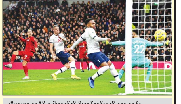
လီဗာပူးမှ ဖာမီနို စပါးဘက်သို့ ရိုးကန်သွင်းမှုကို တွေ့ရစဉ်။

◆ ကျောစွဲမှ ယင်းပွဲတွင် လီဗာပူးသည် ဘောလုံးပိုင်ဆိုင်မှု အသာစီးဖြင့် ယှဉ်ပြိုင်ခဲ့ပြီး ရိုးကန်သွင်းခွင့်မှာ အိမ်ရှင်စပါးအသင်းသည် ၁၄ ကြိမ် အထိရရှိခဲ့ကာ လေးကြိမ်သာ ရိုးပေါက် ခြိမ်းခြောက်နိုင်ခဲ့သည်။ လီဗာပူးသည် ၁၃ ကြိမ် ကန်သွင်းခွင့် ရခဲ့ပြီး ခုနစ်ကြိမ် ရိုးပေါက် ခြိမ်းခြောက်နိုင်ခဲ့သည်။ ပွဲစဉ် (၂) ယှဉ်ပြိုင်အပြီး တွင် လီဗာပူးသည် ရမှတ် ၆၁ မှတ်ဖြင့် အဆင့် ၂ မှ လက်စတာ ကို တစ်ပွဲလျှော့ဖြင့် ၁၆ မှတ် ဖြတ်ထားနိုင်ခဲ့ပြီး ယခုနှစ်ရာသီတွင် ပရီမီယာလိဂ်ဖလားကို ပိုင်ဆိုင်ဖို့ ရာ ချန်ပီယံလမ်းကြောင်းပေါ်တွင် ရောက်ရှိနေပြီဖြစ်သည်။ လီဗာပူး၏ ယခုလိုရလဒ်မျိုး သည် လက်ရှိ ဥရောပထိပ်သီး လိဂ်ကြီးများတွင် ယခုနှစ်ရာသီ ရှုံးပွဲမရှိဘဲ တစ်ပွဲသာ သရေကျထား မှုကို မည်သည့်အသင်းကမျှ မစွမ်း ဆောင်နိုင်သေးကြောင်း မှတ်တမ်း ဝင်ခဲ့သည်။ လီဗာပူးသည် ယခင်ရာသီမှ လက်ရှိရာသီ ပွဲစဉ်အထိ ၃၈ ပွဲဆက် ရှုံးပွဲမရှိဘဲ ၃၃ ပွဲနိုင်၊ ငါးပွဲသရေဖြင့် မန်စီးတီးနှင့် ချယ်လီဆီးတို့၏ စံချိန်ကိုကျော်လွန်သည့် မှတ်တမ်း ဝင်ခဲ့သည်။ ဇန်နဝါရီ ၁၃ ရက်က ယှဉ်ပြိုင် ကစားသည့် ဘုန်းမောက်နှင့် ဝက်ဖိုး တို့ပွဲတွင် ဝက်ဖိုးက သုံးဂိုး - ဂိုးမရှိ ဖြင့် အနိုင်ရရှိခဲ့သည်။ အက်စ်တွန် ဗီလာနှင့် မန်စီးတီးပွဲတွင် မန်စီးတီးက ခြောက်ဂိုး-တစ်ဂိုးဖြင့် ရိုးပြတ် အနိုင်ရရှိခဲ့သည်။ သီဟ