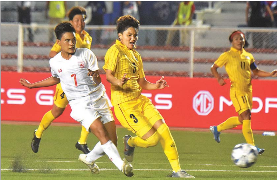
မြန်မာနှင့် ထိုင်းအသင်းတို့ ၂၀၁၉ ဆီးဂိမ်းပြိုင်ပွဲတွင် တွေ့ဆုံခဲ့စဉ်။

ကစားခြင်းဖြစ်ပြီး အာဆီယံထိပ်သီးအသင်း တစ်သင်းနှင့် ယှဉ်ပြိုင်ခွင့်ရမည်ဖြစ်သော ကြောင့် အကျိုးရှိမည့်ပွဲလည်းဖြစ်သည်။ မြန်မာနှင့် ထိုင်းအသင်းသည် ဒီဇင်ဘာလ ပထမပတ်က ကျင်းပသည့် ၂၀၁၉ ဆီးဂိမ်း ပြိုင်ပွဲ ဆီမီးဖိုင်နယ်ပွဲတွင် တွေ့ဆုံထားပြီး ထိုင်းအသင်းက တစ်ဂိုး-ဂိုးမရှိဖြင့် အနိုင်ရခဲ့ သည်။ စာမျက်နှာ ၁၂ ကော်လံ ၁၀