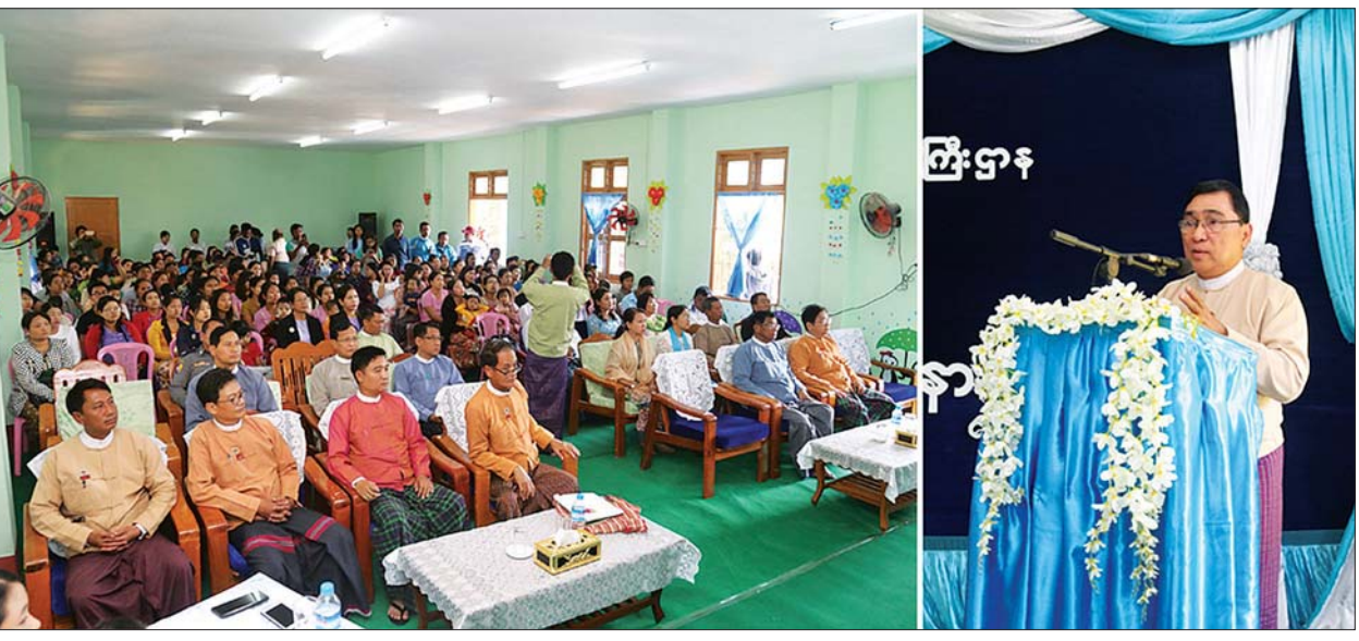
ပြည်ထောင်စုဝန်ကြီး ဒေါက်တာဝင်းမြတ်အေး တောင်တွင်းကြီးမြို့ တောင်ပြင် (၂) မူလတန်းကြိုကျောင်းဖွင့်ပွဲအခမ်းအနားတွင် အမှာစကားပြောကြားစဉ်။

ထို့နောက် အခမ်းအနားအစီအစဉ်ကို ဆက်လက်ကျင်းပရာ ပြည်ထောင်စုဝန်ကြီးက မိမိတို့နိုင်ငံ၏ ပညာရေး၊ ကျန်းမာရေး၊ သောက်သုံးရေရရှိရေး၊ လျှပ်စစ်၊ လမ်း၊ တံတား၊ အဆောက်အအုံ စသည့် အခြေခံလိုအပ်ချက်များကို ကဏ္ဍ