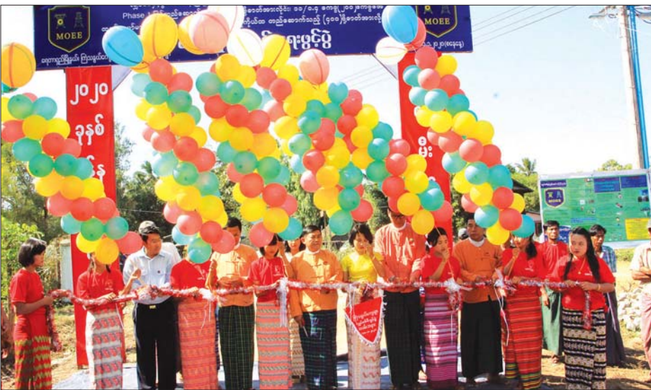
တိုင်းဒေသကြီး ဝန်ကြီးချုပ် ဦးဝင်းသိန်းနှင့် တာဝန်ရှိသူများ ကျေးရွာလျှပ်စစ်မီးလင်းရေး ဖဲကြိုးဖြတ်ဖွင့်လှစ်ပေးစဉ်။

ပဲခူး ဇန်နဝါရီ ၁၂ ရေတာရှည်မြို့နယ် ကြံသနွယ် ကျေးရွာတွင် ယမန်နေ့က ကျေးရွာ လျှပ်စစ်မီးလင်းရေးဖွင့်ပွဲ ကျင်းပသည်။ အခမ်းအနားတွင် တိုင်းဒေသ ကြီးဝန်ကြီးချုပ် ဦးဝင်းသိန်း၊ စိုက်ပျိုးရေးနှင့် မွေးမြူရေး ဝန်ကြီး ဦးအောင်ဇော်နိုင်၊ တိုင်းဒေသကြီး လွှတ်တော်ကိုယ်စား လှယ် ဒေါက်တာ ကျော်ကျော်နှင့် တိုင်းဒေသကြီး လျှပ်စစ်အင်ဂျင်နီယာ ဦးရဲဝဏ္ဏတို့က ဖဲကြိုးဖြတ်ဖွင့်လှစ်ပေး ကြသည်။ ရေတာရှည်မြို့နယ် ကြံသနွယ် ကျေးရွာ လျှပ်စစ်မီးလင်းရေးအတွက် လျှပ်စစ်နှင့် စွမ်းအင်ဝန်ကြီးဌာနမှ အမျိုးသားလျှပ်စစ်ဓာတ်အားရရှိရေး စီမံကိန်းထောက်ပံ့ငွေကျပ် ၄ ဒသမ ၅ သန်းဖြင့် ၃ ဒသမ ၅ မိုင်ရှိသော ကေစီ ဓာတ်အားလိုင်းနှင့် ၁၁ /၀.၄ ကေစီ