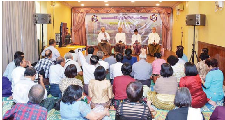
ရန်ကုန် အမှတ်(၂)ဒေသကောလိပ် (လှိုင်နယ်မြေ) ၁၉၇၈- ၁၉၈၀ ရုပ်ရှင်လုပ်ငန်းအတတ်ပညာဒီပလိုမာ ကျောင်း သား ကျောင်းသူဟောင်းများ၏ (၁၃) ကြိမ်မြောက် ဆရာ ကန်တော့ပွဲကို ဇန်နဝါရီ ၁၂ ရက်က ရန်ကုန်မြို့ ဗဟန်း မြို့နယ်ရှိ M3 စားသောက်ခန်းမတွင် ကျင်းပစဉ်။ (အဆိုပါ ရုပ်ရှင်လုပ်ငန်းအတတ်ပညာ ကျောင်းသား ကျောင်းသူ ဟောင်းများထံမှ နိုင်ငံပိုင်နှင့် ပုဂ္ဂလိကဒီပလိုမာများတွင် တာဝန်ထမ်းဆောင်သူများ၊ ရုပ်ရှင်ဒါရိုက်တာကြီးများ နှင့် အခြားသောနယ်ပယ်အသီးသီးတွင် အောင်မြင်သူ များ ပေါ်ထွက်ခဲ့ကြောင်း သိရှိရသည်။)