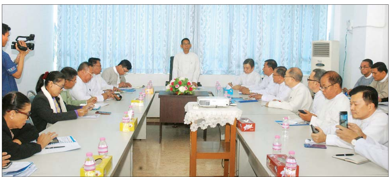
ပြည်ထောင်စုဝန်ကြီး ဒေါက်တာ အောင်သူ မြန်မာနိုင်ငံမွေးမြူရေးလုပ်ငန်းအဖွဲ့ချုပ် ဥက္ကဋ္ဌ ဒေါက်တာမြဟန်နှင့် ညီနောင်အသင်းများမှ တာဝန်ရှိသူများနှင့် တွေ့ဆုံဆွေးနွေးစဉ်။

ထို့နောက် မြန်မာနိုင်ငံ မွေးမြူရေးလုပ်ငန်းအဖွဲ့ချုပ် ဥက္ကဋ္ဌ ဒေါက်တာ မြဟန်က မွေးမြူရေးလုပ်ငန်းဆိုင်ရာ ကဏ္ဍများနှင့်ပတ်သက်၍လည်းကောင်း၊ ဒုတိယဥက္ကဋ္ဌ (၁) က ကြက် - ငါး တွဲဖက်မွေးမြူခြင်းဆိုင်ရာ ကိစ္စရပ်နှင့် ပတ်သက်၍ လည်းကောင်း၊ ဒုတိယဥက္ကဋ္ဌ (၂) က မွေးမြူရေးဆိုင်ရာ နိုင်ငံခြား ရင်းနှီးမြုပ်နှံမှုကိစ္စရပ်နှင့် ပတ်သက်၍လည်းကောင်း၊ မြန်မာနိုင်ငံမွေးမြူရေး အစာထုတ်လုပ်ဖြန့်ဖြူးရေးရောင်းချသူများအသင်း ဒုတိယဥက္ကဋ္ဌက မွေးမြူရေး