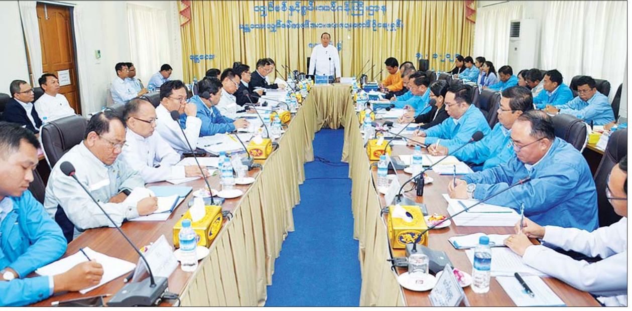
ပြည်ထောင်စုဝန်ကြီး ဦးဝင်းခိုင် နေရာသီကာလတွင် လျှပ်စစ်ဓာတ်အား စဉ်ဆက်မပြတ်ဖြန့်ဖြူးပေးနိုင်ရေး ဆောင်ရွက်မည့်အစီအမံများနှင့် ပတ်သက်သည့် လုပ်ငန်းညှိနှိုင်းစဉ်းစားအစည်းအဝေး၌ အမှာစကားပြောကြားစဉ်။

ဓာတ်အားပြတ်တောက်မှု၊ ဓာတ်အားပျောက်ဆုံးမှု လျော့နည်းစေရေးနှင့် ဓာတ်အားစနစ် တည်ငြိမ်တိုးတက်ကောင်းမွန်စေရေးတို့အတွက် လိုင်းသန့်ရှင်းရေးပြုလုပ်ခြင်းအပါအဝင် ထိန်းသိမ်းပြုပြင်ခြင်း၊ အဆင့်မြှင့်တင်ခြင်း၊ လုပ်ငန်းများကို ကြိုတင်ဆောင်ရွက်ထားရန် လိုအပ်ကြောင်း၊ ဓာတ်အားလိုင်းများအနေဖြင့်လည်း လိုင်းတစ်လိုင်း အပြစ်ဖြစ်ပွားချိန်၌ အခြားလိုင်းတစ်လိုင်းမှ