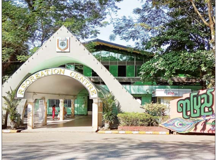
ရန်ကုန်တက္ကသိုလ် အပန်းဖြေရိပ်သာ။

နိုင်ငံအသီးသီးတွင် ထိုနိုင်ငံကိုယ်စားပြု တက္ကသိုလ်ကြီးများရှိကြပြီး ထိုကျောင်းများ သည် မိခင်နိုင်ငံကိုသာမက ကမ္ဘာကို ကျော်စေသည့်အထိ ဂုဏ်ရှိန်ကြီးသော တက္ကသိုလ်များလည်းရှိကြပါသည်။ ရန်ကုန် တက္ကသိုလ်သည် တစ်ချိန်က ကမ္ဘာကျော်ခဲ့ သော ကျောင်းတော်ကြီးဖြစ်ခဲ့သည်။ ယနေ့ အခါတွင် ထိုကျောင်းတော်ကြီးမှာ သက်တမ်း နှစ်တစ်ရာပြည့်နှင့် ကြိုကြိုက်ခွင့်ရရှိမှုသည် ဂုဏ်ယူဖွယ်ပင်ဖြစ်သည်။ ထိုတက္ကသိုလ်ကြီးတွင် ပညာသင်ကြား ပြီး ဘဝဖြတ်သန်းခဲ့ကြသော ကျောင်းသား ဟောင်းကြီးများမှာ တိုင်းပြည်တာဝန်ကို ထမ်းဆောင်ခဲ့၊ ထမ်းဆောင်နေသူများ ရှိသလို ပြည်ပတွင်ရောက်ရှိနေသူများလည်း ရှိသည်။ မျိုးဆက်သစ်များကိုလည်း ကျောင်းတော် ကြီးမှ ဆက်လက်မွေးထုတ်ပေးလျက် ရှိသည်။ သို့ဖြစ်၍ ရန်ကုန်တက္ကသိုလ်နှစ် ရာပြည့်မှသည် နှစ်ရာပေါင်းများစွာ အမွန် ရှည်တည်တံ့လျက် ဂုဏ်သတင်း သင်းပျံ ပါစေကြောင်း။ ။