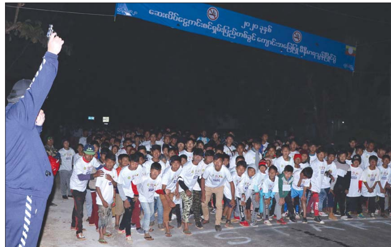
ပြည်နယ်ဝန်ကြီးချုပ် ဒေါက်တာ လင်းထွဋ် ပြိုင်ပွဲဝင်များအား သေနတ်ပစ်ဖောက်၍ တာလွတ် စေစဉ်။

လွိုင်လင် ဇန်နဝါရီ ၁၂ ရှမ်းပြည်နယ်(တောင်ပိုင်း) လွိုင်လင်မြို့၌ ၂၀၂၀ ပြည့်နှစ် ဆေးလိပ်ငွေကင်းစင် ရှမ်းပြည်နယ်တစ်ခွင် အစီအစဉ်အရ ကျောင်းအခြေပြု မိနီမာရသွန် ယှဉ်ပြိုင်ပွဲကို ယမန်နေ့က ကျင်းပရာ ပြည်နယ်ဝန်ကြီးချုပ် ဒေါက်တာ လင်းထွဋ် တက်ရောက်ခဲ့ပြီး သေနတ်ပစ်ဖောက်၍ တာလွတ်ပေးသည်။ အဆိုပါပြိုင်ပွဲတွင် ကျောင်းသား ကျောင်းသူ စုစုပေါင်း ၅၈၈ ဦး ဝင်ရောက် ယှဉ်ပြိုင်ကြပြီး ပြိုင်ပွဲဝင် ကျောင်းသား ကျောင်းသူ များသည် လွိုင်လင်ခရိုင် အားကစားကွင်းရှေ့မှ ပင်လုံမြို့ဘက်အထွက် သစ်တော ပျိုးဥယျာဉ်အထိ ထိုမှ တစ်ဆင့် ခရိုင်အားကစားကွင်းအတွင်းသို့ ပြန်လည်ပန်းဝင် ခဲ့သည်။ ပြိုင်ပွဲအပြီးတွင် ဆုရရှိသည့် ကျောင်းသား ကျောင်းသူများအား လွိုင်လင် မြို့နယ် ပြည်သူ့လွှတ်တော် ကိုယ်စားလှယ် ဦးခင်မောင်သီ၊ ခရိုင်ပညာရေးမှူး၊ ဒုတိယ မြို့နယ်အုပ်ချုပ်ရေးမှူးနှင့် တာဝန်ရှိသူများက ဆုများ ချီးမြှင့်ပေးခဲ့ကြောင်း သိရသည်။