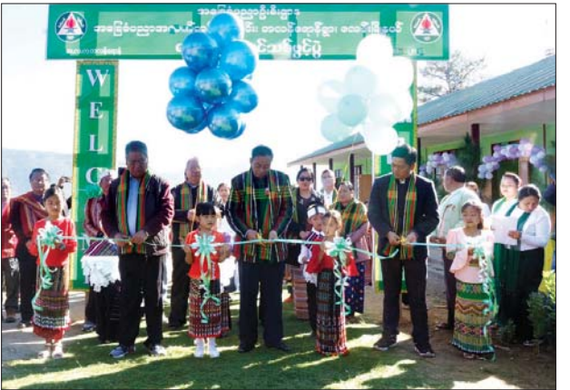
ပြည်နယ်ဝန်ကြီးချုပ် ဦးဆလင်းလျန်လွယ်နှင့် ပြည်နယ်ဝန်ကြီးများ ကျောင်းဆောင်သစ်ကို ဖဲကြိုးဖြတ်ဖွင့်လှစ်ပေးစဉ်။