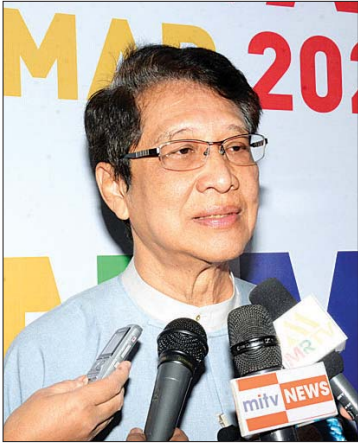
ဦးနေအုပ်

ကျွန်တော်တို့ ဒီလိုပွဲကျင်းပရတဲ့ ရည်ရွယ်ချက်ကတော့ ကျွန်တော်တို့နိုင်ငံမှာ ကျောင်းသားက လေးမျိုး လေးစား ဖြစ်နေပါတယ်။ အစိုးရကျောင်းတက်တဲ့ ကျောင်းသား ကျောင်းသူတွေ ရှိပါတယ်။ ပြီးတော့ ပုဂ္ဂလိက လိုခေါ်တဲ့ ကိုယ်ပိုင်ကျောင်းတက်တဲ့ ကျောင်း သား ကျောင်းသူတွေရှိပါတယ်။ International School လိုခေါ်တဲ့ အပြည်ပြည်ဆိုင်ရာ သင်ရိုးသင်ကျောင်းတက်တဲ့ ကျောင်းသူ ကျောင်းသားတွေလည်း ရှိပါတယ်။ ပြီးတော့ ဘုန်းတော်ကြီးသင်ကျောင်းတက်တဲ့ ကျောင်း သားတွေရှိပါတယ်။ အဲဒါတွေအားလုံးကို စုပေါင်း ပြီးတော့ ပျော်ရွှင်ရအောင် ပွဲတော်လုပ်ပေးခြင်း ဖြစ်ပါတယ်။ ကျောင်းနေပျော်၍ စာတော်ရမည် ဆိုတဲ့ဆောင်ပုဒ်အတိုင်း ကျောင်းသား ကျောင်းသူတွေ ပျော်စေချင်လို့ပါ။ ဒီကျောင်း လေးကျောင်းမှာ တက်နေကြတဲ့ ကျောင်းသူ ကျောင်းသားတွေ တပျော်တပါး တန်းတူညီမျှ စွာ ပျော်ဖို့အတွက် ကျင်းပပေးတဲ့ ပွဲတော် ဖြစ်ပါတယ်။ ဒါကြောင့် ကျောင်းတွေရဲ့ တူညီဝတ်စုံ ဝတ်ခွင့်မပြုပါဘူး။ ကလေးတွေကို ပွဲတော်ရဲ့ လိုဂိုတံဆိပ်ပါတဲ့ အင်္ကျီတွေအားလုံး ဝတ်ကြပါတယ်။