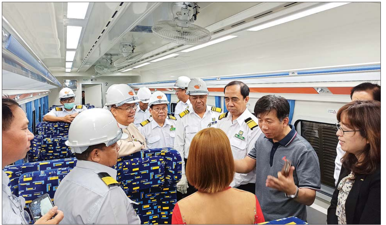
ပြည်ထောင်စုဝန်ကြီး ဦးသန့်စင်မောင် လူစီးတွဲနှင့် ကုန်တွဲစက်ရုံ (မြစ်ငယ်)၌ ကိုရီးယားနိုင်ငံ EDCF ချေးငွေဖြင့် ဝယ်ယူထားသည့် လေအေးပေးစက်ပါ လေအိတ်အထက်တန်းတွဲအား ကြည့်ရှုစစ်ဆေးစဉ်။

စက်ရုံ(မြစ်ငယ်)မှ နိုင်ငံတော်ဘဏ္ဍာ ငွေဖြင့် တည်ဆောက်ထုတ်လုပ်နေ သည့် လေအိတ်ဘူဂီလူစီးတွဲ ၁၅ တွဲ တည်ဆောက်နေမှု၊ တွဲများ တည် ဆောက်ရာတွင်အသုံးပြုသည့် ဂဟေ ဆော်သည့် စက်ရုပ် Robot အား ကြည့်ရှုစစ်ဆေးပြီး ဆောင်ရွက်နေ သည့်လုပ်ငန်းများ အရည်အသွေး ပြည့်မီရန် သက်မှတ်ကာလအတွင်း ပြီးစီးရေး၊ လုပ်ငန်းခွင်အန္တရာယ် ကင်းရှင်းရေးတို့ကို တာဝန်ရှိသူများ အား မှာကြားသည်။