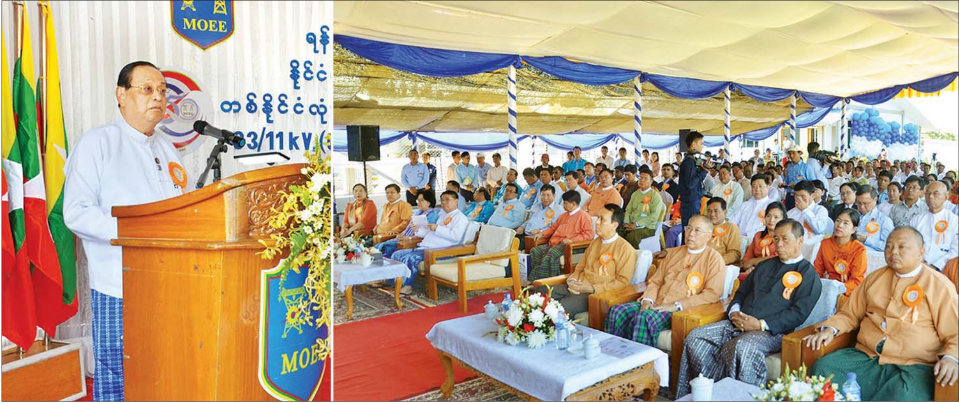
ပြည်ထောင်စုဝန်ကြီး ဦးဝင်းခိုင် ရန်ကုန်တိုင်းဒေသကြီး ကျောက်တန်းမြို့နယ်ရှိ (၃၃/၁၁) ကေပီ၊ (၅)အမ်ပီအေ ကမာကလုတ်/ကရင်ချောင် ဓာတ်အားခွဲရုံ ဖွင့်ပွဲအခမ်းအနားတွင် အမှာစကားပြောကြားစဉ်။ သတင်းစဉ်

၁၃၈၁ ခုနှစ်၊ ပြာသိုလဆန်း ၁၃ ရက် ၂၀၂၀ ပြည့်နှစ်၊ ဇန်နဝါရီ ၇ ရက်၊ အင်္ဂါနေ့ အတွဲ (၅၉)၊ အမှတ် (၀၉၉)