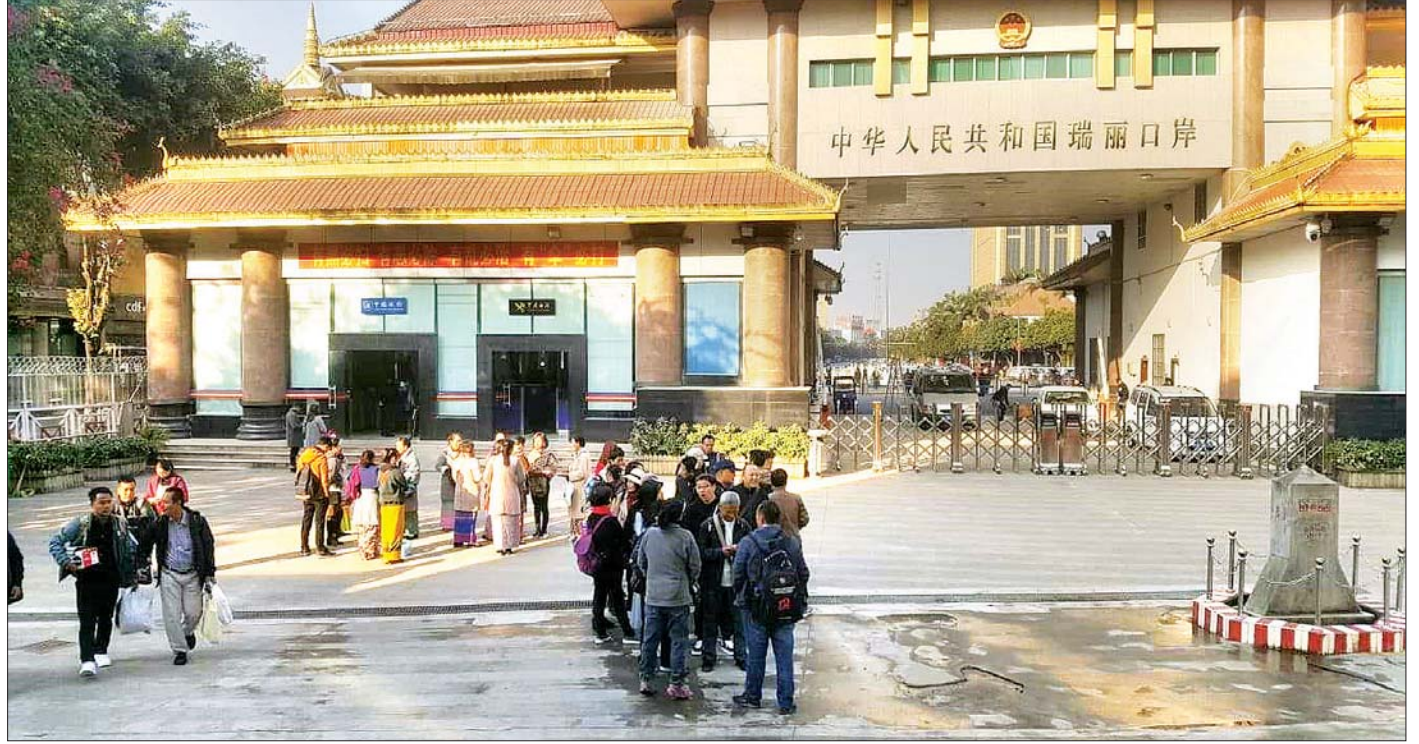
မြန်မာ-တရုတ် နှစ်နိုင်ငံ အဝင်/အထွက်ဂိတ် (နန်းတော်ဂိတ်)ကို တွေ့ရစဉ်။

“တစ်ရက်တည်းနဲ့ နှစ်မြို့လည်ပေါ့။ ဒါပေမယ့် ခုချိန်မှာ လမ်းပန်းဆက်သွယ်ရေးနဲ့ လုံခြုံရေး အရလည်း အဆင်မပြေသေးတော့ နမ့်ခမ်းမြို့ ကိုတော့ သွားရောက်လည်ပတ်ခွင့် မပေးရသေးဘူး။ တကယ်လို့ နှစ်မြို့လုံးကို သွားရောက်လည်ပတ် နိုင်မယ်ဆိုရင်တော့ ခရီးသွားဧည့်သည်တွေ ပိုပြီးသဘောကျ ကြိုက်နှစ်သက်ကြတယ်” ဟု မူဆယ်မြို့ ဟိုတယ်နှင့် ခရီးသွား ညွှန်ကြားမှုဦးစီးဌာန စာမျက်နှာ ၁၀ ကော်လံ ၃