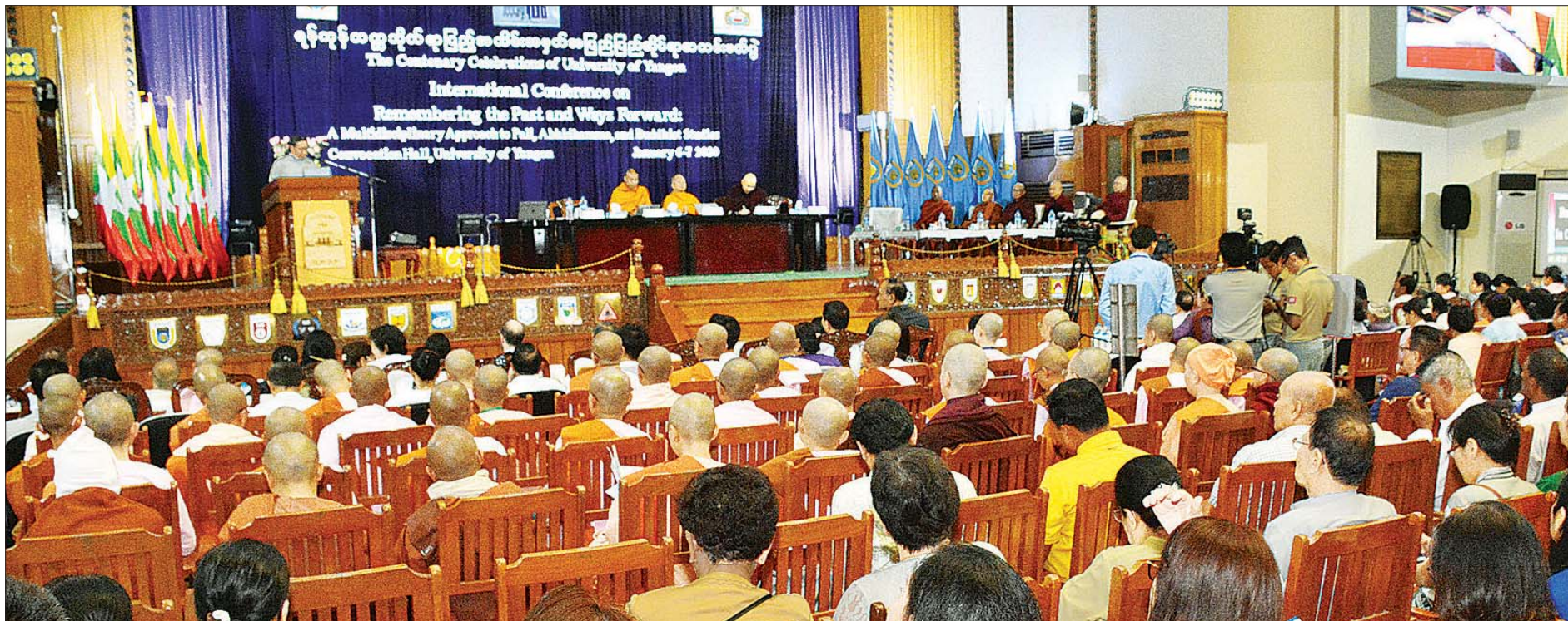
ပြည်ထောင်စုဝန်ကြီး ဒေါက်တာမျိုးသိမ်းကြီး ရန်ကုန်တက္ကသိုလ် ရာပြည့်အထိမ်းအမှတ် အပြည်ပြည်ဆိုင်ရာ စာတမ်းဖတ်ပွဲတွင် အမှာစကားပြောကြားစဉ်။ သတင်းစဉ်