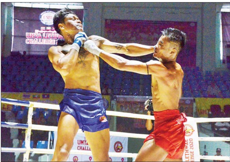
သွေးသစ်မောင်(မြန်မာ)နှင့် ဆူဝစ်(ထိုင်း)တို့ ယှဉ်ပြိုင်ထိုးသတ်နေစဉ်။