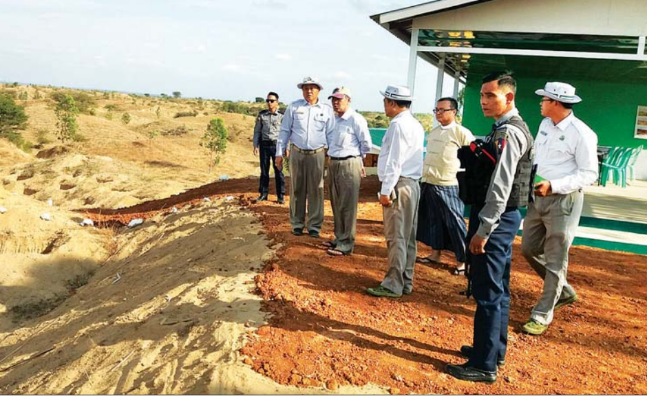
ရေနံချောင်းမြို့နယ် အထူးစိမ်းလန်းစိုပြည်ရေးဇုန်စီမံကိန်း ငါးနှစ်တာကာလ ဆောင်ရွက်မည့် လုပ်ငန်းစဉ်များနှင့် နှစ်အလိုက် ဖြည့်စွက်အထူးစိမ်းအပင်စိုက်ပျိုးမည့် မြေနေရာများအား မြေပုံနှင့်တကွ ရှင်းလင်းတင်ပြရာ တိုင်းဒေသကြီးဝန်ကြီးချုပ် ဒေါက်တာအောင်မိုးညိုက တင်ပြချက်များအပေါ် လိုအပ်သည်များကို မှာကြားသည်။

ထို့နောက် တိုင်းဒေသကြီးဝန်ကြီးချုပ်နှင့် အဖွဲ့သည် ရေနံချောင်းမြို့နယ် အပူပိုင်းဒေသ စိမ်းလန်းစိုပြည်ရေးဦးစီးဌာနက ပျိုးထောင်ထားသော ဖန်ခါးစမ်းပျိုးဥယျာဉ်အတွင်းမှ ပျိုးပင်ကြီးများအား ကြည့်ရှုပြီး ၂၀၁၉ ခုနှစ် မိုးရာသီက စမ်းသပ်စိုက်ပျိုးခဲ့သည့် မြို့ရှောင်လမ်း မိုင်တိုင်အမှတ် (၆/၄)အနီးရှိ အပင်ပျိုးစုံ ၂၀၀၀ စိုက်ပျိုးထားသည့် စိုက်ကွက် သုံးကွက်အား သွားရောက်ကြည့်ရှုစစ်ဆေးခဲ့ကြောင်း သိရသည်။ (ယာဝု) ကိုစိုးကြီး