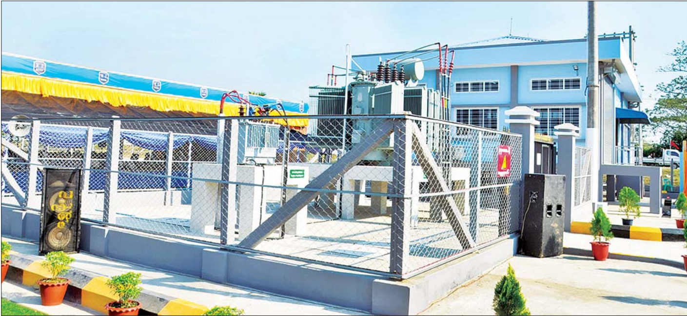
ကျောက်တန်းမြို့နယ်ရှိ (၃၃/၁၁) ကေပီ၊ (၅)အမ်ပီအေ ကမာကလုတ်/ကရင်ချောင် ဓာတ်အားခွဲရုံအား တွေ့ရစဉ်။ သတင်းစဉ်

အခမ်းအနားတွင် ပြည်ထောင်စုဝန်ကြီး ဦးဝင်းခိုင်က နိုင်ငံတော်အစိုးရအနေဖြင့် နိုင်ငံတော်ဖွံ့ဖြိုးတိုးတက်ရေး အတွက် အဘက်ဘက်က အားသွန်ခွန်စိုက်ကြိုးပမ်းဆောင်ရွက်လျက်ရှိရာ လမ်းပန်းဆက်သွယ်ရေး လုံခြုံချောမွေ့စေ ရေးနှင့် လျှပ်စစ်ဓာတ်အား တည်ငြိမ်ပြည့်ဝစွာရရှိစေရေးတို့ကို အဓိကအခန်းကဏ္ဍမှ ဦးစားပေးဆောင်ရွက်လျက် ရှိကြောင်း၊ ဝန်ကြီးဌာန၏ ရည်မှန်းချက်ဖြစ်သည့် စာမျက်နှာ ၃ ကော်လံ ၁ ။