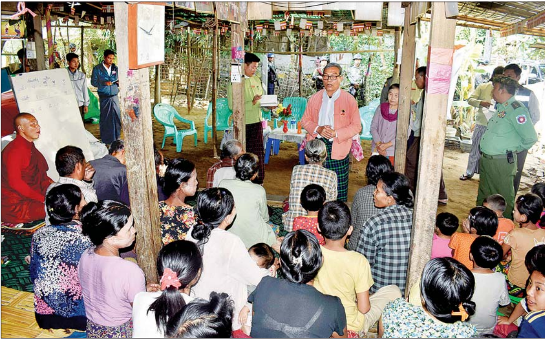
ပြည်နယ်ဝန်ကြီးချုပ် ဦးညီပု မင်းဂံရပ်ကွက်ရှိ ဝိဘူဝါဒီ (ပရဟိတ) ဘုန်းကြီးကျောင်း၌ ခိုလှုံ့ရောက်ရှိနေသည့် ပြည်တွင်းနေရပ်စွန့်ခွာသူများအား အားပေးစကားပြောကြားစဉ်။

ရခိုင်ပြည်နယ်ဝန်ကြီးချုပ် ဦးညီပုနှင့် ဇနီးတို့သည် ပြည်နယ်လုံခြုံရေးနှင့် နယ်စပ်ရေးရာဝန်ကြီး ဗိုလ်မှူးကြီး မင်းသန်း၊ ပြည်နယ်လူမှုရေးဝန်ကြီး ဒေါက်တာ ချမ်းသာတို့နှင့်အတူ ယနေ့ မွန်းလွဲ ၁ နာရီတွင် စစ်တွေမြို့ ဧည့်ဝတီ (က) ရပ်ကွက်ရှိ မွှာရာမပရိယတ္တိစာသင်တိုက် ဘုန်းကြီးကျောင်း၊ မင်းဂံရပ်ကွက်ရှိ ဝိဘူဝါဒီ (ပရဟိတ) ဘုန်းကြီးကျောင်းနှင့် ပြည်တော်သာရပ်ကွက်ရှိ ဗုဒ္ဓေါမော်ဘုန်းကြီးကျောင်းတိုက်တို့၌ ရောက်ရှိနေကြသည့် ပြည်တွင်းနေရပ်စွန့်ခွာသူများအား သွားရောက်တွေ့ဆုံ အားပေးစကားပြောကြားပြီး ဆန်နှင့် ထောက်ပံ့ပစ္စည်းများ ပေးအပ်ကြသည်။