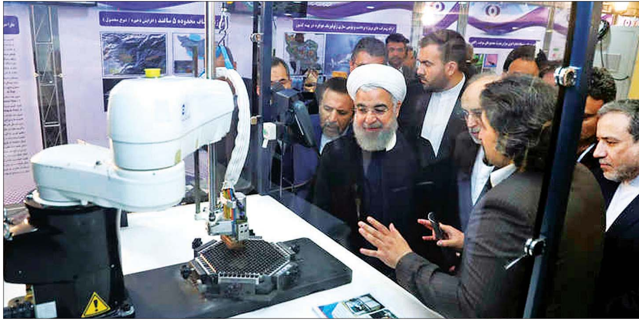
အီရန်သမ္မတ ဟက်ဆန်ရိုဟာနီကို နျူကလီးယားတိုးတက်မှုအခြေအနေ ရှင်းပြနေစဉ်။

တီဟီရန် ဇန်နဝါရီ ၆ အီရန်နိုင်ငံသည် ၂၀၁၅ ခုနှစ် နျူကလီးယားစာချုပ်ပါ ကတိကဝတ်များကို အဆုံးသတ်နိုင်ရေး နောက်ဆုံးအဆင့် ဆောင်ရွက်မှုများကို ပြုလုပ်နေပြီဟု ဇန်နဝါရီ ၅ ရက်တွင် ကြေညာခဲ့သည်။ နျူကလီးယားစာချုပ်ပါ ကတိကဝတ်များမှ နုတ်ထွက်ရန် နောက်ဆုံးအဆင့်ဖြစ်သည့် နျူကလီးယားစာချုပ်ပါ အဓိကကန့်သတ်ချက်ကို