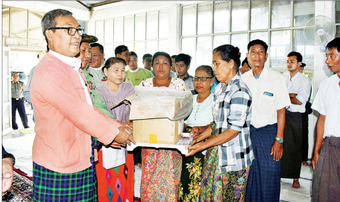
ပြည်နယ်ဝန်ကြီးချုပ် ဦးညီပု ဧည့်ဝတီ(က) ရပ်ကွက်ရှိ မွှာရာမပရိယတ္တိစာသင်တိုက် ဘုန်းကြီးကျောင်း၌ ခိုလှုံ့ရောက်ရှိနေသည့် ပြည်တွင်းနေရပ်စွန့်ခွာသူများအား ဆန်နှင့် ထောက်ပံ့ပစ္စည်းများ ပေးအပ်စဉ်။

လိုအပ်ချက်များ တင်ပြ ထို့နောက် ကျောင်းတိုက်မွှာရာတွင်