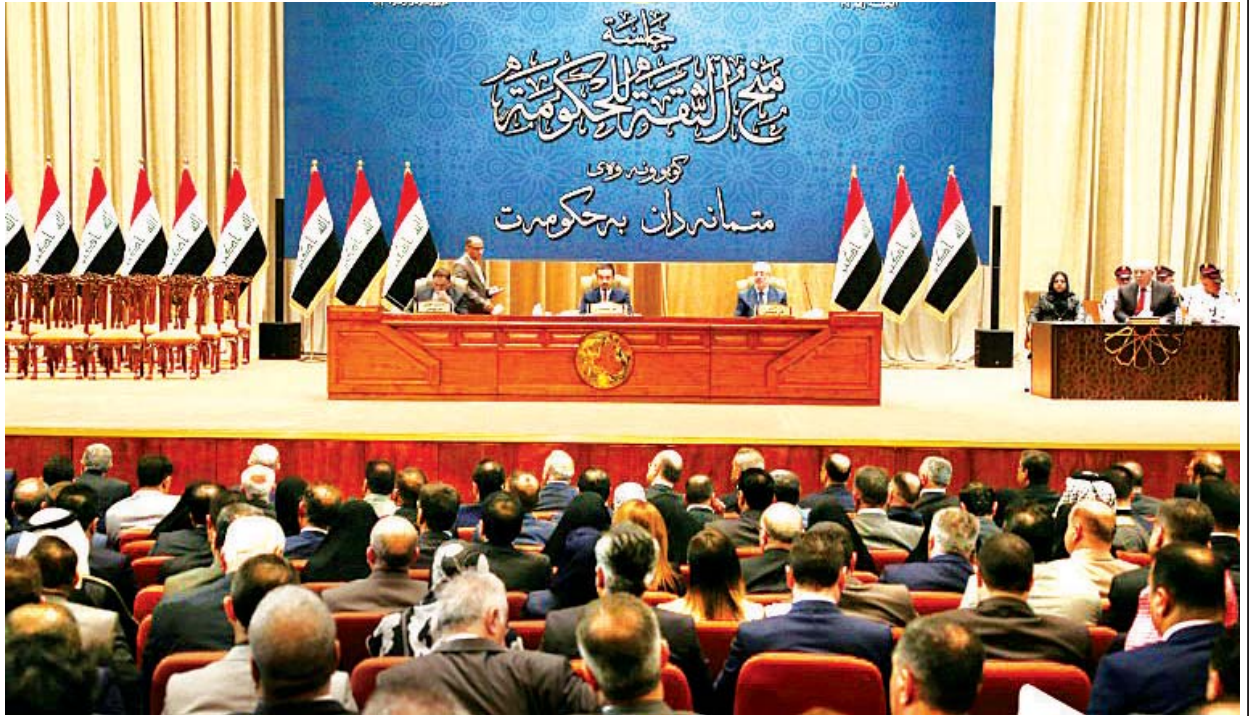
အီရတ်လွှတ်တော်အစည်းအဝေးကျင်းပနေစဉ်။

အမေရိကန်သံရုံးကို တိုက်ခိုက်ဖို့လောဘ် လူတွေကိုသံရုံးအတွင်းမှာရှိတဲ့ လုံခြုံရေးတပ်ဖွဲ့ဝင်တွေက ညှဉ်းပေါက်ဆိုသလို ခုခံခဲ့ကြပါတယ်။ အီရတ် ဝန်ကြီးချုပ်အနေနဲ့ သံရုံးကိုလားရောက်တိုက်ခိုက်သူတွေကို ထွက်သွားအောင် လုပ်ဖို့ မစွမ်းဘူးဆိုတာကိုလည်း တွေ့မြင်ခဲ့ရပါတယ်။ ဒါပေမယ့် ၂၄ နာရီအတွင်းမှာတော့ သူဟာ စစ်သွေးကြွခေါင်းဆောင်တွေနဲ့တွေ့ဆုံပြီး အရေးပေါ်အစည်းအဝေးထိုင်ခဲ့ပါတယ်။ အဲဒီနောက် သံရုံးကို တိုက်ခိုက်နေသူတွေ