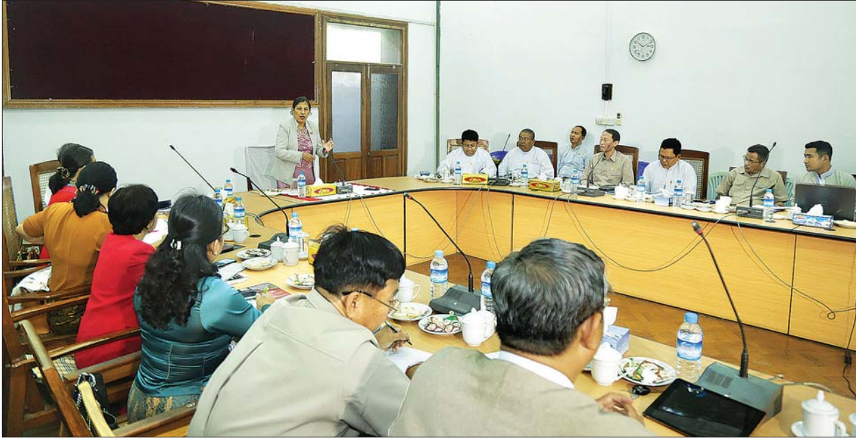
ဒုတိယဝန်ကြီး ဒေါက်တာမြလေးစိန် အားကစားသိပ္ပံပညာနှင့် အားကစားဆေးပညာဆိုင်ရာညီလာခံ အောင်မြင်စွာကျင်းပနိုင်ရေးအတွက် ပေါင်းစပ်ညှိနှိုင်း အစည်းအဝေးတွင် အမှာစကားပြောကြားစဉ်။

နေပြည်တော် ဇန်နဝါရီ ၆ အားကစားသိပ္ပံပညာနှင့် အားကစားဆေးပညာဆိုင်ရာ ညီလာခံအောင်မြင်စွာ ကျင်းပနိုင်ရေးအတွက် ပေါင်းစပ်ညှိနှိုင်း အစည်းအဝေးကို ယနေ့နံနက် ၁၀ နာရီတွင် ရန်ကုန်မြို့ ကျိုက္ကဆံကွင်းရှိ အားကစားနှင့်ကာယပညာဦးစီးဌာန အစည်းအဝေးခန်းမ၌ ကျင်းပသည်။ အစည်းအဝေးတွင် ဒုတိယ ဝန်ကြီး ဒေါက်တာမြလေးစိန်က အားကစားသိပ္ပံပညာနှင့် အားကစား ဆေးပညာရပ်သည် အားကစားတွင် အရေးကြီးပါကြောင်း၊ အဆိုပါပညာ ရပ်ကို တိုးတက်မြှင့်တင်ပေးရန်နှင့် လေ့လာရန် အများကြီး လိုအပ်ပါ ကြောင်း ပြောကြားသည်။ ဝိုင်းဝန်းဆွေးနွေး ထိုနောက် အားကစားနှင့် ကာယပညာဦးစီးဌာန ဒုတိယ ညွှန်ကြားရေးမှူးချုပ် ဦးကျော်ဆန်း နှင့် ဦးကျော်ဦးတို့က ကြိုဆိုပြန်လည် နေရာချထားရေး၊ သယ်ယူပို့ဆောင် ရေး၊ လုံခြုံရေးဆပ်ကော်မတီကိစ္စ ရပ်များ၊ အားကစားဆေးဘက်ဌာန ခွဲမှ ဒုတိယညွှန်ကြားရေးမှူး ဒေါက်တာထက်ဝေက အားကစား သိပ္ပံပညာနှင့် အားကစားဆေးပညာ ဆိုင်ရာညီလာခံ အောင်မြင်စွာကျင်းပ နိုင်ရေးအတွက် စီစဉ်ဆောင်ရွက် ထားရှိမှုများကို ရှင်းလင်းတင်ပြ ကြရာ တက်ရောက်လာသူများက ဝိုင်းဝန်းဆွေးနွေးကြပြီး လိုအပ်ချက် များကို တင်ပြကြသည်။ ပေါင်းစပ်ညှိနှိုင်း တင်ပြချက်များအပေါ် ဒုတိယ ဝန်ကြီး ဒေါက်တာမြလေးစိန်က ပေါင်းစပ်ညှိနှိုင်းပေးသည်။ သတင်းစဉ်