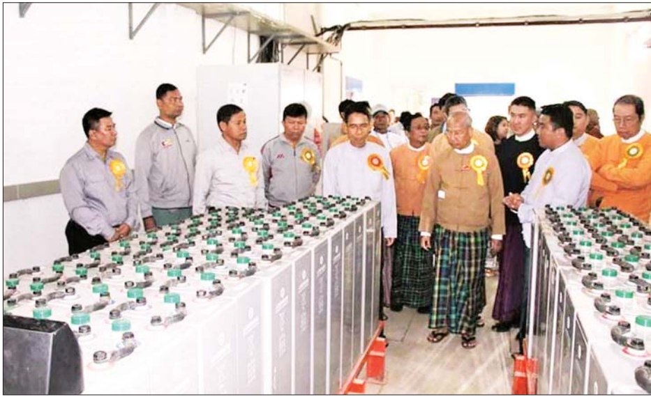
လုပ်ငန်း အောင်မြင်စွာဆောင်ရွက်ပြီးစီးနိုင်ရေး လိုအပ်သည့် နည်းပညာပံ့ပိုးမှုဆောင်ရွက်ခဲ့မှုများကို လည်းကောင်း ရှင်းလင်းဆွေးနွေးပြောကြားသည်။

ဖွင့်ပွဲအခမ်းအနားတွင် စိုက်ပျိုးရေး၊ မွေးမြူရေးနှင့် ဆည်မြောင်းဝန်ကြီးဌာန ပြည်ထောင်စုဝန်ကြီး ဒေါက်တာအောင်သူနှင့် မကွေးတိုင်းဒေသကြီး ဝန်ကြီးချုပ် ဒေါက်တာအောင်မိုးညိုတို့က အမှာစကားများပြောကြားပြီး ကျေးလက်ဒေသဖွံ့ဖြိုးတိုးတက်ရေးဦးစီးဌာန ညွှန်ကြားရေးမှူးချုပ် ဦးခန့်ဇော်က ကျေးလက်နေပြည်သူများ လူနေမှုဘဝ မြှင့်တင်ရေးနှင့် စီးပွားရေးအလုပ်အကိုင်အခွင့်အလမ်းများ ဖွံ့ဖြိုးတိုးတက်လာစေရန် အကောင်အထည်ဖော် ဆောင်ရွက်လျက်ရှိသည့် အမျိုးသားလျှပ်စစ်ဓာတ်အားရရှိရေးစီမံကိန်းလုပ်ငန်းများနှင့် ကျေးလက်ဒေသဖွံ့ဖြိုးရေးလုပ်ငန်း ဆောင်ရွက်နေမှုများကို လည်းကောင်း၊ ကမ္ဘာ့ဘဏ်၊ နယူးဇီလန်သံရုံးနှင့် ဂျာမနီသံရုံးတို့မှ တာဝန်ရှိသူများက ဆိုလာအသေးစား လျှပ်စစ်မီးလင်းရေး