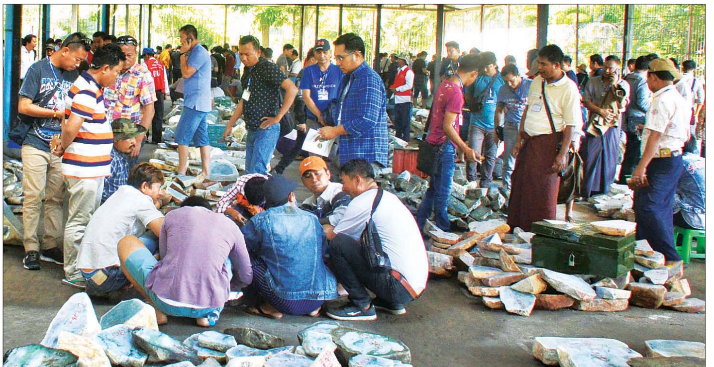
ပြည်တွင်းရတနာကုန်သည်များ ခင်းကျင်းပြသထားသည့် ကျောက်စိမ်းအတွဲများကို ဝယ်ယူရန်ကြည့်ရှုလေ့လာကြစဉ်။

နေပြည်တော် ဇန်နဝါရီ ၆ ကျောက်မျက်ရတနာများ မြန်မာကျပ်ငွေဖြင့် ရောင်းချပွဲ ပဉ္စမနေ့ကို ယနေ့နံနက် ၈ နာရီတွင် နေပြည်တော်ရှိ မဏိရတနာကျောက်စိမ်းခန်းမ၌ ဆက်လက်ကျင်းပရာ ကျောက်စိမ်းအတွဲများကို အိတ်ဖွင့်တင်ဒါစနစ်ဖြင့် တင်ပြ ရောင်းချခဲ့ပြီး ကျောက်စိမ်းအတွဲပေါင်း ၁၁၅၈ တွဲကို ငွေကျပ် ၂၃၅၆၁ ဒသမ ၄၀၃ သန်းဖြင့် ရောင်းချနိုင် သည်။ ယနေ့ရောင်းချပွဲတွင် နံနက်ပိုင်းမှစတင်၍ ပြည်တွင်း ရတနာကုန်သည်များသည် မဏိရတနာကျောက်စိမ်း ခန်းမနှင့် သတ်မှတ်နေရာများ၌ ခင်းကျင်းပြသထားသည့် ကျောက်စိမ်းအတွဲများကို မိမိတို့စိတ်ကြိုက် လွတ်လပ်စွာ လှည့်လည်ကြည့်ရှုကြပြီး ဈေးနှုန်းအဆိုပြုလွှာများ ရေးသား ၍ သက်ဆိုင်ရာတင်ဒါပုံးများအတွင်းသို့ ထည့်သွင်းကြ သည်။ အိတ်ဖွင့်တင်ဒါစနစ် ယနေ့ရောင်းချပွဲတွင် ကျောက်စိမ်းအတွဲ အမှတ် (၁၂၅၁)မှ အတွဲအမှတ် (၂၅၀၀)အထိ ကျောက်စိမ်း အတွဲပေါင်း ၁၂၅၀ တွဲကို အိတ်ဖွင့်တင်ဒါစနစ်ဖြင့် ရောင်းချခဲ့ရာ ၁၁၅၈ တွဲကို ငွေကျပ် ၂၃၅၆၁ ဒသမ ၄၀၃ သန်းဖြင့် ပြည်တွင်းရတနာကုန်သည်များထံ ရောင်းချ နိုင်သည်။ ကျောက်မျက်ရတနာများ မြန်မာကျပ်ငွေဖြင့် ရောင်းချပွဲကို ဇန်နဝါရီ ၇ ရက်အထိ ဆက်လက်ကျင်းပ မည်ဖြစ်ပြီး ကျောက်စိမ်းအတွဲ အမှတ်(၂၅၀၁)မှ အတွဲ အမှတ် (၃၆၉၅)ထိ ကျောက်စိမ်းအတွဲပေါင်း ၁၁၉၅ တွဲ