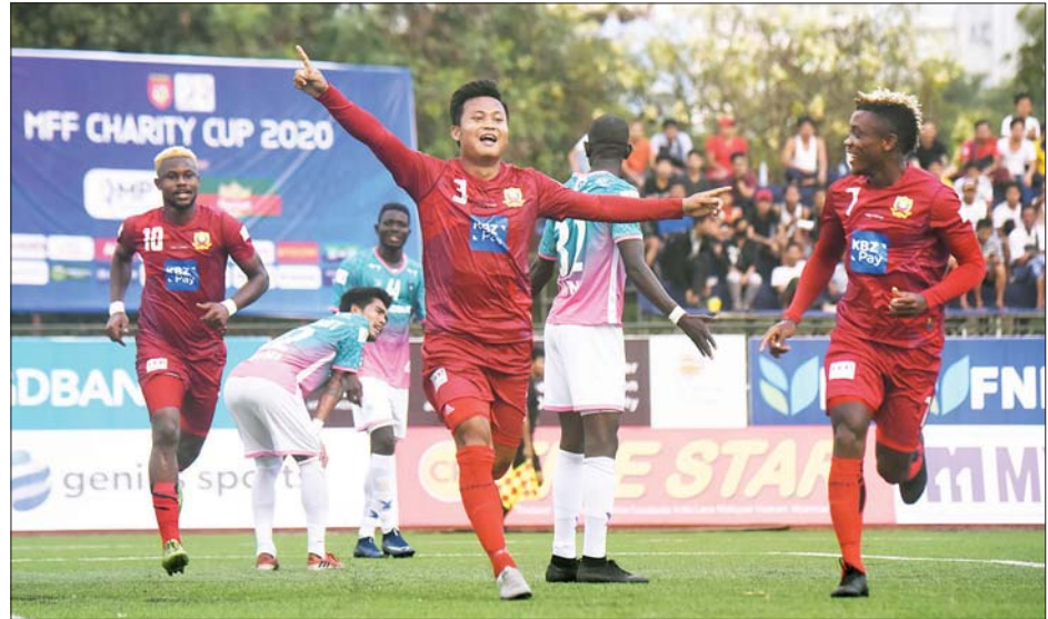
၂၀၂၀ ချာရတီဖလားပြိုင်ပွဲတွင် ဗိုလ်ဆုရသည့် ရှမ်းယူနိုက်တက်အသင်း။

နှစ်ဂိုး-တစ်ဂိုးဖြင့် အနိုင်ရပြီး အသင်းသမိုင်းတစ်လျှောက် ပထမဆုံးအကြိမ် နှစ်ကြိမ်ဆက်တိုက်ရခဲ့သည်။ ချာရတီဖလားပြိုင်ပွဲတစ်လျှောက် ၂၀၂၁ ခုနှစ်တွင် ဧရာဝတီအသင်း၊ ၂၀၂၀ ခုနှစ်တွင် ရန်ကုန်အသင်း၊ ၂၀၁၄ ခုနှစ်တွင် ရှမ်းယူနိုက်တက်အသင်း (ယခင် ကမ္ဘောဇ)၊ ၂၀၁၅ ခုနှစ်တွင် ဧရာဝတီအသင်း၊ ၂၀၁၆ ခုနှစ်တွင် ရန်ကုန်အသင်း၊ ၂၀၁၇ ခုနှစ်တွင် မကွေးအသင်း၊ ၂၀၁၈ ခုနှစ်တွင် ရန်ကုန်အသင်း၊ ၂၀၁၉ ခုနှစ်တွင် ရှမ်းယူနိုက်တက်အသင်း၊ ၂၀၂၀ ပြည့်နှစ်တွင် ရှမ်းယူနိုက်တက်အသင်းတို့ ဖြစ်ခဲ့သည်။ ညီမြတ်သော်တာ