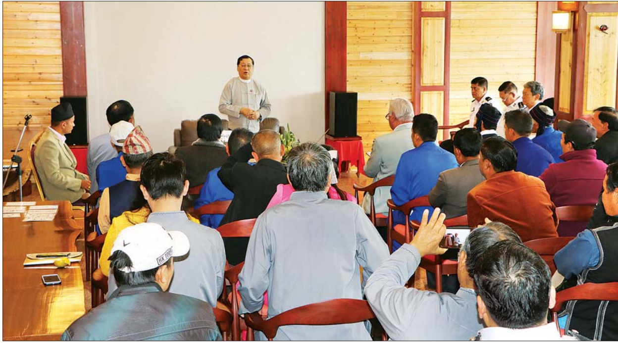
ပြည်ထောင်စုဝန်ကြီး ဦးသိန်းဆွေ မိုးကုတ်မြို့၌ လီဆူစာပေနှင့်ယဉ်ကျေးမှုအဖွဲ့ဝင်များ၊ နီပေါလ်(ဂေါ်ရခါး)၊ ခိုလုံလီရှော၊ ကိုးကန့်နှင့် မုန်းဝန်းယဉ်ကျေးမှု အဖွဲ့ဝင်များနှင့် တွေ့ဆုံဆွေးနွေးစဉ်။

ရေးကတ်ပြား ထုတ်ပေးနိုင်ရေး အတွက် ကာလတစ်ခု သတ်မှတ်ကာ စီမံချက်ရေးဆွဲဆောင်ရွက်သွားမည် ဖြစ်သဖြင့် သက်ဆိုင်ရာအဖွဲ့ ခေါင်းဆောင်များက ပူးပေါင်းကူညီ ဆောင်ရွက်ပေးကြရန် တိုက်တွန်းပါ ကြောင်း ပြောကြားသည်။ ထို့နောက် ရှမ်းပြည်နယ် လီဆူ