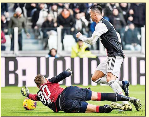
စီရော်နယ်ဒို ကက်ဂလီယာရီ ဂိုးသမားကို ကျော်ဖြတ်၍ အဖွင့်ဂိုးသွင်းယူစဉ်။ သီဟ

စီးရီးအေ ပွဲစဉ်(၁၈) အခြားပွဲစဉ်ရလဒ်များမှာ တိုရီနိုက ရိုးမားကို နှစ်ဂိုး-ဂိုးမရှိဖြင့် အနိုင်ရရှိခဲ့ပြီး ဘိုလော့ဂ်နာနှင့် ဖီအိုရင်တီးနားမှာ တစ်ဂိုးစီ သရေကျခဲ့သည်။ အတ္တလန္တာက ပါးမားကို ငါးဂိုး-ဂိုးမရှိဖြင့် ဂိုးပြတ်အနိုင်ရရှိခဲ့ပြီး အေစီမီလန်နှင့် ဆမ်ပီးရီးယားမှာ ဂိုးမရှိ သရေကျခဲ့သည်။