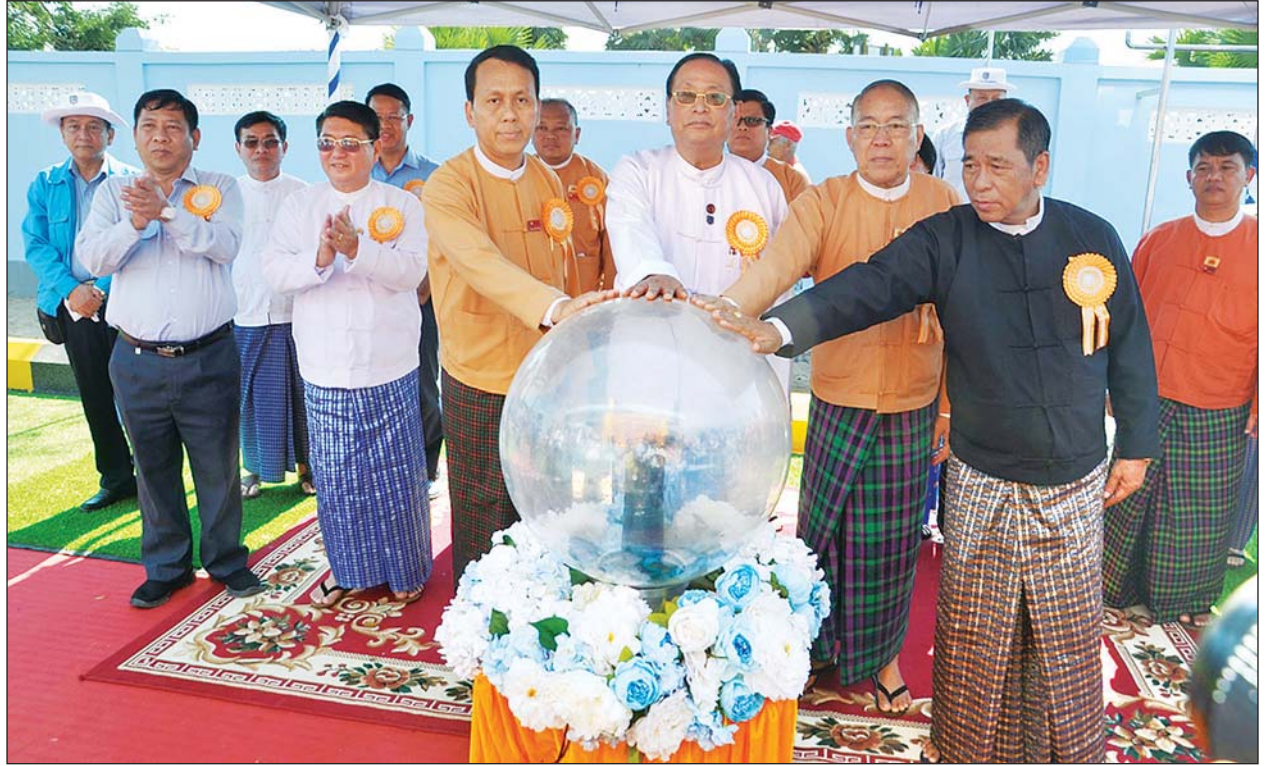
ပြည်ထောင်စုဝန်ကြီး ဦးဝင်းခိုင်၊ တိုင်းဒေသကြီးဝန်ကြီးချုပ် ဦးမြိုးမင်းသိန်းနှင့် တိုင်းဒေသကြီး လွှတ်တော်ဥက္ကဋ္ဌ ဦးတင်မောင်ထွန်း၊ တိုင်းဒေသကြီး တရားသူကြီးချုပ် ဦးလှအေးတို့က ကမာကလုတ်/ကရင်ချောင် ဓာတ်အားခွဲရုံ မော်ကွန်းကမ္ဘာ့ကျောက်စာအား စက်ခလုတ်နှိပ် ဖွင့်လှစ်ပေးစဉ်။

* ရှေ့မှူး ပြည်သူများနှင့် စက်မှုလက်မှုလုပ်ငန်းများတွင် လျှပ်စစ်ဓာတ်အား ပြည့်ဝစွာ သုံးစွဲနိုင်ရေးအတွက် ဓာတ်အားပေးစက်ရုံများ၊ ဓာတ်အားလိုင်းများ၊ ဓာတ်အားခွဲရုံများ တည်ဆောက်၍ ဓာတ်အားဖြန့်ဖြူးနိုင်ရေးအတွက် တိုးမြှင့်ဆောင်ရွက်လျက်ရှိရာ ၂၀၁၉ ခုနှစ် ဒီဇင်ဘာလတွင် တစ်နိုင်ငံလုံး၏ ၅၀ ရာခိုင်နှုန်းအထိ နိုင်ငံတော် ဓာတ်အားစနစ်မှ ဓာတ်အားဖြန့်ဖြူးပေးနိုင်ခဲ့ပြီဖြစ်ပါကြောင်း၊ ဆက်လက်၍ ၂၀၂၁ ခုနှစ်တွင် တစ်နိုင်ငံလုံး၏ ၅၅ ရာခိုင်နှုန်း၊ ၂၀၂၅-၂၀၂၆ ဘဏ္ဍာနှစ်တွင် တစ်နိုင်ငံလုံး၏ ၇၅ ရာခိုင်နှုန်း အထက်နှင့် ၂၀၃၀ ပြည့်နှစ်တွင် တစ်နိုင်ငံလုံး ၁၀၀ ရာခိုင်နှုန်းအပြည့်အဝ လျှပ်စစ်ဓာတ်အားရရှိရေး ကြိုးပမ်းဆောင်ရွက်လျက်ရှိပါကြောင်း။