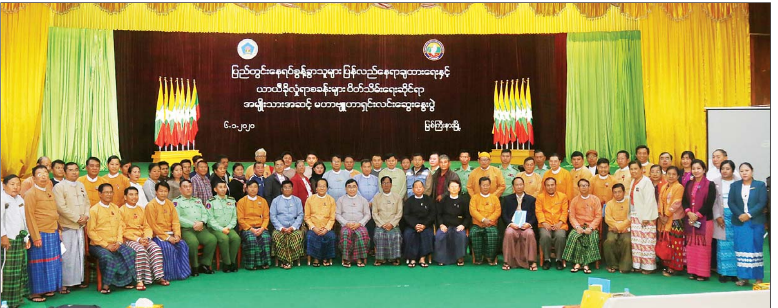
ပြည်ထောင်စုဝန်ကြီး ဒေါက်တာ ဝင်းမြတ်အေး၊ ပြည်နယ်ဝန်ကြီးချုပ် ဒေါက်တာ ခက်အောင်နှင့် တာဝန်ရှိသူများ ပြည်တွင်းနေရပ်စွန့်ခွာသူများ ပြန်လည်နေရာချထားရေးနှင့် ယာယီခိုလှုံရာစခန်းများ ပိတ်သိမ်းရေးဆိုင်ရာ အမျိုးသားအဆင့်မဟာဗျူဟာ ရှင်းလင်းဆွေးနွေးပွဲသို့ တက်ရောက်လာကြသူများနှင့် စုပေါင်းမှတ်တမ်းတင်ဓာတ်ပုံရိုက်ကြစဉ်။ သတင်းစဉ်

တွေ့ဆုံစဉ် ပြည်ထောင်စုဝန်ကြီးက အစိုးရ၏ ချမှတ်ထားသော မူဝါဒများ၊ ဦးတည်ချက်များကို အကောင်အထည်ဖော်ရာတွင် မိမိတို့ ဝန်ကြီးဌာနက တာဝန်ယူရသည့် လူမှုကာကွယ်စောင့်ရှောက်ရေးလုပ်ငန်း၊ သဘာဝဘေးနှင့် လူ့ကြောင့်ဖြစ်သော ဘေးအန္တရာယ်ဆိုင်ရာ လုပ်ငန်းနှင့် ပြန်လည်ထူထောင်ရေးလုပ်ငန်းများကို ကချင်ပြည်နယ်အစိုးရအဖွဲ့၊ ကချင်ပြည်နယ်ရှိ လူမှုအဖွဲ့အစည်းများ၊ ဒေသခံပြည်သူများနှင့် ပူးပေါင်းဆောင်ရွက်နေမှု အခြေအနေများကို အပြန်အလှန် ညှိနှိုင်းဆွေးနွေးရန် ဖြစ်ကြောင်း၊ အထူးသဖြင့် တိုင်းရင်းသား ပြည်သူများ၏ အကျိုးစီးပွားအတွက် လိုအပ်သော ပံ့ပိုးကူညီမှုများကို ဖြည့်ဆည်း ဆောင်ရွက်ပေးနိုင်ရန်ဖြစ်ကြောင်း စသည်ဖြင့် ပြောကြားသည်။ ထို့နောက် ကချင်ပြည်နယ် ဝန်ကြီးချုပ်၊ ပြည်နယ်အစိုးရအဖွဲ့ ဝန်ကြီးများ၊ ပြည်နယ် ဥပဒေချုပ်နှင့် ပြည်နယ် စာရင်းစစ်ချုပ်တို့က ပြည်တွင်းနေရပ် စွန့်ခွာသူများ ပြန်လည်နေရာချထားရေးလုပ်ငန်း၊ မူလနေရာများသို့ ပြန်လည်အခြေချနေထိုင်လျက်ရှိသည့် ဒေသခံပြည်သူများ၏ လက်ရှိအခြေအနေများ၊ မူးယစ်ဆေးဖြတ်ပြီးသူများ ပြန်လည်ထူထောင်ရေး လုပ်ငန်းများနှင့်