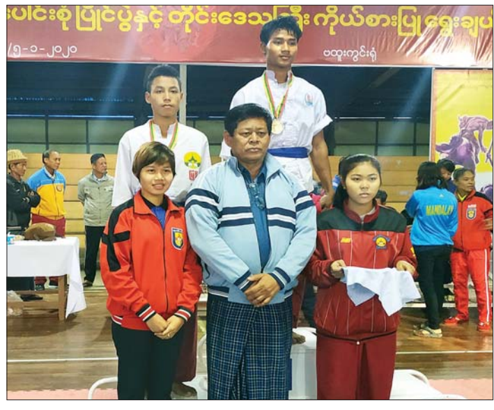
ပေါင်းစုပြိုင်ပွဲနှင့် တိုင်းဒေသကြီးကိုယ်စားပြုရွေးချယ်ပွဲ (၅-၁-၂၀၂၀) ဝတ္ထုကွင်းရုံ

ကို အိတ်ဖွင့်တင်ဒါစနစ်ဖြင့် ရောင်းချပေးသွားမည့် ၂၀၀၀ ကျော်လာရောက်ခဲ့ပြီး ယနေ့အထိ ကျောက်မျက် အတွဲပေါင်း ၂၈၆ တွဲနှင့် ကျောက်စိမ်းအတွဲပေါင်း ၂၅၀၀ တွဲကို အိတ်ဖွင့်တင်ဒါစနစ်ဖြင့် တင်ပြရောင်းချပေးခဲ့ရာ ကျောက်မျက်အတွဲ ကိုးတွဲကို ငွေကျပ် ၃၆ ဒသမ ၉၁၈ သန်းဖြင့်လည်းကောင်း၊ ကျောက်စိမ်းအတွဲ ၂၃၅၀ တွဲကို ငွေကျပ် ၄၂၃၆၆ ဒသမ ၁၂ သန်းဖြင့်လည်းကောင်း ရောင်းချ နိုင်ခဲ့ကြောင်း သိရသည်။ မျိုးသူဟိန်း(သတင်းစဉ်)