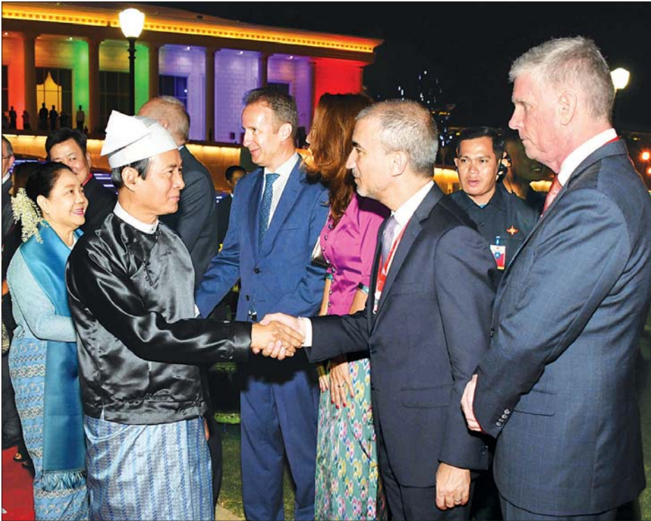
နိုင်ငံတော်သမ္မတ ဦးဝင်းမြင့်နှင့် ဇနီး ဒေါ်ချိုချိုတို့ (၇၂)နှစ်မြောက် လွတ်လပ်ရေးနေ့ ဂုဏ်ပြုညစာစားပွဲ အခမ်းအနားသို့ တက်ရောက်လာကြသည့် သံအမတ်ကြီးများ၊ နိုင်ငံတကာသံတမန်များ၊ ကုလသမဂ္ဂအဖွဲ့အစည်း များမှ ဌာနေကိုယ်စားလှယ်များ၊ ဂုဏ်ထူးဆောင်ကောင်စစ်ဝန်များနှင့် ၎င်းတို့၏ ဇနီးများအား ရင်းရင်းနှီးနှီး နှုတ်ဆက်စဉ်။

နေပြည်တော် ဇန်နဝါရီ ၄ ပြည်ထောင်စုသမ္မတမြန်မာနိုင်ငံတော် နိုင်ငံတော်သမ္မတ ဦးဝင်းမြင့်နှင့် ဇနီး ဒေါ်ချိုချိုတို့က တည်ခင်းဆွဲဆောင် သည့် (၇၂)နှစ်မြောက် လွတ်လပ်ရေးနေ့ ဂုဏ်ပြုညစာစားပွဲအခမ်းအနားကို ယနေ့ညပိုင်းတွင် နေပြည်တော်ရှိ