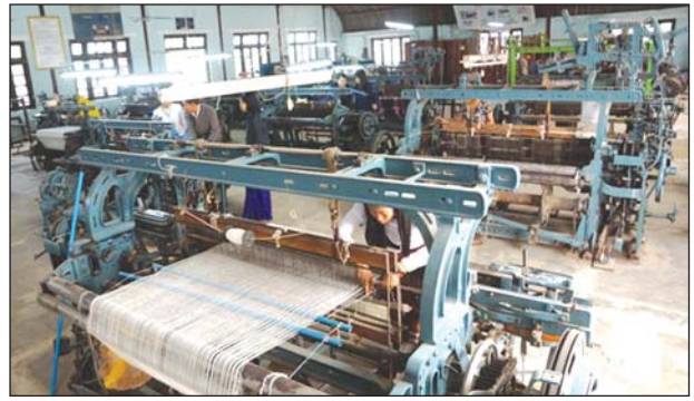
သင်တန်းကျောင်း၌ စက်ရက်ကန်းရက်နေသော သင်တန်းသူတစ်ဦး

ယခုလအတွင်း စတင်သင်ကြားသွားမည်ဖြစ်ကြောင်း၊ ပုံမှန်သင်တန်းများတွင် သင်တန်းတက်ပြီးပါက နိုင်ငံပိုင်/ပုဂ္ဂလိကပိုင် ချည်မျှင်နှင့် အထည်စက်ရုံများတွင် ဝင်ရောက်လုပ်ကိုင်နိုင်ပြီး အသေးစားစက်မှုလက်မှုလုပ်ငန်းဦးစီးဌာနအောက်ရှိ ရုံးခွဲများ၊ ရက်ကန်းကျောင်းများတွင်လည်း ဝန်ထမ်းအဖြစ် ဝင်ရောက်လုပ်ကိုင် နိုင်ကြောင်း၊ ကိုယ်ပိုင်ထုတ်လုပ်မှု လုပ်ငန်းများလည်း လုပ်ကိုင်နိုင်ကြောင်း သိရသည်။ အခြား အသက်မွေးဝမ်းကျောင်း သင်တန်းများအတွက်မူ အမျိုးအစား အလိုက် ခန့်ခွဲရက်မှ ရက် ၆၀ အထိ ကြာမြင့်မည်ဖြစ်ကြောင်း သိရသည်။ ဆောင်းဒါး ရက်ကန်းနှင့် အသက်မွေးပညာသိပ္ပံကို ခေတ်စီ ချည်မျှင်နှင့် အထည်အလိပ် အတတ်ပညာများ လေ့ကျင့်သင်ကြားပေးရန်နှင့် ကျွမ်းကျင်သူများ မွေးထုတ်ပေးရန် ရိုးရာရက်ကန်း အတတ်ပညာများကို ထိန်းသိမ်းရန်နှင့် ဖွံ့ဖြိုး တိုးတက်စေရန် ဒေသတွင်းလိုအပ်ချက်နှင့် ကိုက်ညီသော အသက်မွေးဝမ်းကျောင်း အတတ်ပညာ သင်တန်းများ ပို့ချပေးရန်နှင့် ရက်ကန်းလုပ်ငန်းရှင်များ၊ အသင်း အဖွဲ့များနှင့် အသေးစား စက်မှုလက်မှုလုပ်ငန်းများ ဖွံ့ဖြိုးတိုးတက်ရေး ပူးပေါင်း ဆောင်ရွက်ရန် အစရှိသော ရည်ရွယ်ချက်များဖြင့် ဖွင့်လှစ်သင်ကြားပေးလျက်ရှိ ကြောင်းသိရသည်။ သန်းဇော်မင်း(ပြန်/ဆက်)