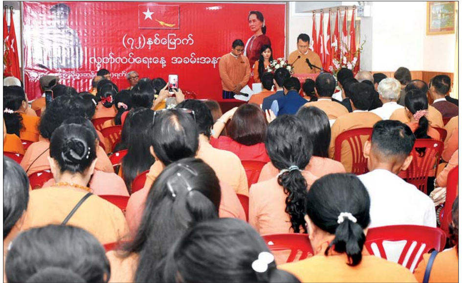
ရန်ကုန်တိုင်းဒေသကြီးဝန်ကြီးချုပ် ဦးမြိုးမင်းသိန်း အမှာစကားပြောကြားစဉ်။