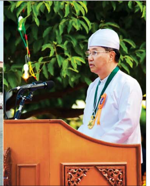
နိုင်ငံတော်သမ္မတ ဦးဝင်းမြင့်ထံမှ (၇၂)နှစ်မြောက် လွတ်လပ်ရေးနေ့အခမ်းအနားသို့ ပေးပို့သည့်သဝဏ်လွှာကို ဒုတိယသမ္မတ ဦးမြင့်ဆွေ ဖတ်ကြားစဉ်။