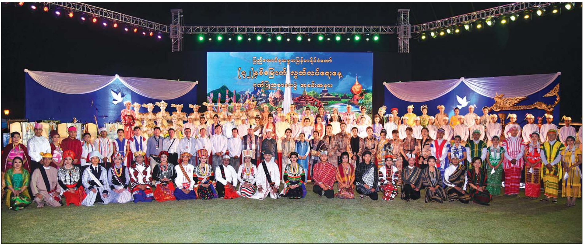
နိုင်ငံတော်သမ္မတ ဦးဝင်းမြင့်နှင့် ဇနီး ဒေါ်ချိုချို၊ နိုင်ငံတော်၏အတိုင်ပင်ခံပုဂ္ဂိုလ် ဒေါ်အောင်ဆန်းစုကြည်၊ ဒုတိယသမ္မတ ဦးဟင်နရီဗန်ထီးယူနှင့် ဇနီး ဒေါက်တာရွှေလွမ်း (၇၂)နှစ်မြောက် လွတ်လပ်ရေးနေ့ ဂုဏ်ပြုညစာစားပွဲ အခမ်းအနားတွင် ဖျော်ဖြေတင်ဆက်သည့် အနုပညာဦးစီးဌာနမှ အနုပညာရှင်များနှင့်အတူ စုပေါင်းမှတ်တမ်းတင်ဓာတ်ပုံရိုက်စဉ်။ သတင်းစဉ်

နိုင်ငံတော်သမ္မတ ဦးဝင်းမြင့်နှင့် ဇနီး ဒေါ်ချိုချို၊ နိုင်ငံတော်၏ အတိုင်ပင်ခံပုဂ္ဂိုလ် ဒေါ်အောင်ဆန်းစုကြည်နှင့် ဧည့်သည်တော်များ မြန်မာ့အသံ ခေတ်ပေါ်တေးဂီတ အဖွဲ့နှင့် တွဲဖက်၍ သာသနာရေးနှင့် ယဉ်ကျေးမှုဝန်ကြီးဌာန အနုပညာဦးစီးဌာနမှ အနုပညာရှင်များ၏ ဖျော်ဖြေတင်ဆက်မှုများကို ကြည့်ရှုအားပေးစဉ်။ သတင်းစဉ်