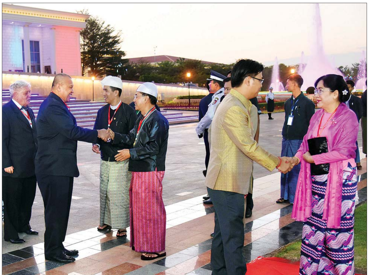
ဒုတိယသမ္မတ ဦးမြင့်ဆွေနှင့် ဇနီး ဒေါ်ခင်သက်ဌေး (၇၂)နှစ်မြောက် လွတ်လပ်ရေးနေ့ ဂုဏ်ပြုညစာစားပွဲ အခမ်းအနားသို့ တက်ရောက်လာကြသူများအား ကြိုဆိုနှုတ်ဆက်စဉ်။ သတင်းစဉ်

နေပြည်တော်တိုင်း စစ်ဌာနချုပ် တိုင်းမှူး၊ ဒုတိယဝန်ကြီးများ၊ ဒုတိယရှေ့နေချုပ်၊ လွှတ်တော်ကိုယ်စားလှယ်များ၊ နိုင်ငံရေးပါတီများမှ ဥက္ကဋ္ဌများနှင့် ကိုယ်စားလှယ်များ၊ အမြဲတမ်းအတွင်းဝန်များ၊ ဌာနဆိုင်ရာ တာဝန်ရှိသူများ၊ သံအမတ်ကြီးများ၊ နိုင်ငံတကာသံတမန်များ၊ ကုလသမဂ္ဂအဖွဲ့အစည်းများမှ ဌာနကိုယ်စားလှယ်များ၊ ဂုဏ်ထူးဆောင်ကောင်စစ်ဝန်များနှင့် ၎င်းတို့၏ ဇနီးများ၊ ဂုဏ်ထူးဆောင်ဘွဲ့ရရှိသူများနှင့် ၎င်းတို့၏ မိသားစုများ၊ အထူးဖိတ်ကြားထားသူများ တက်ရောက်ကြသည်။ မီးရှူးမီးပန်း ပစ်ဖောက်ဂုဏ်ပြု (၇၂)နှစ်မြောက် လွတ်လပ်ရေးနေ့ ဂုဏ်ပြုညစာစားပွဲ အခမ်းအနားတွင် မီးရှူးမီးပန်းများ ပစ်ဖောက်ဂုဏ်ပြုကြပြီး ညစာမသုံးဆောင်မီနှင့် သုံးဆောင်နေစဉ်အတွင်း တေးသံရှင်များက မြန်မာ့အသံ ခေတ်ပေါ်တေးဂီတအဖွဲ့နှင့် တွဲဖက်၍ တေးသံသံများဖြင့် ဧည့်ခံဖျော်ဖြေတင်ဆက်ကြသည်။ ဖျော်ဖြေတင်ဆက် ညစာစားပွဲအပြီးတွင် နိုင်ငံတော်သမ္မတနှင့် ဇနီး၊ နိုင်ငံတော်၏ အတိုင်ပင်ခံပုဂ္ဂိုလ်နှင့် ဧည့်သည်တော်များသည် မြန်မာ့အသံ ခေတ်ပေါ်