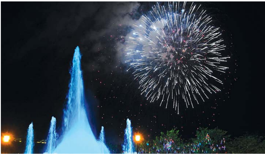
(၇၂)နှစ်မြောက် လွတ်လပ်ရေးနေ့ ဂုဏ်ပြုညစာစားပွဲအခမ်းအနားတွင် မီးရှူးမီးပန်းများ ပစ်ဖောက်ဂုဏ်ပြုစဉ်။

နိုင်ငံတော်သမ္မတအိမ်တော် ဥပစာမြက်ခင်းပြင်၌ ကျင်းပသည်။ ရှေးဦးစွာ ဒုတိယသမ္မတ ဦးမြင့်ဆွေနှင့် ဇနီး ဒေါ်ခင်သက်ဌေး၊ ပြည်ထောင်စုဝန်ကြီးများဖြစ်ကြသည့် ဒုတိယ ဗိုလ်ချုပ်ကြီး စိန်ဝင်း၊ ဦးကျော်တင့်ဆွေ၊ ဒေါက်တာဖေမြင့်၊ စာမျက်နှာ ၃ ကော်လံ ၅ ❖