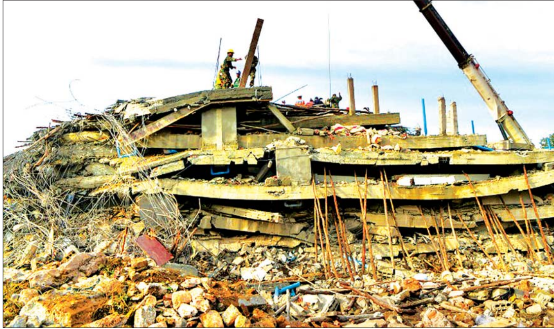
ပြိုကျနေသော အဆောက်အအုံကို တူးဖော်မှုများ ပြုလုပ်နေစဉ်။

အဆိုပါ မတော်တဆမှုသည် ယမန်နေ့ ဒေသစံတော်ချိန် ညနေ ၄ နာရီခွဲတွင်ဖြစ်ပွား ခဲ့ခြင်းဖြစ်သည်။ အလုပ်သမားများသည်