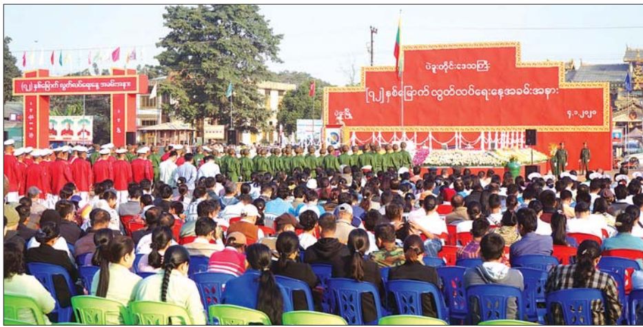
အဖွဲ့ရုံးရှေ့ မြက်ခင်းပြင်၌ ကျင်းပသည်။

(၇၂)နှစ်မြောက်လွတ်လပ်ရေးနေ့အထိမ်းအမှတ် နိုင်ငံတော်အလံတင်အခမ်းအနားနှင့် သဝဏ်လွှာဖတ်ပွဲအခမ်းအနားကို ဇန်နဝါရီ ၄ ရက်က မြစ်ကြီးနားမြို့ ပြည်နယ်အစိုးရ