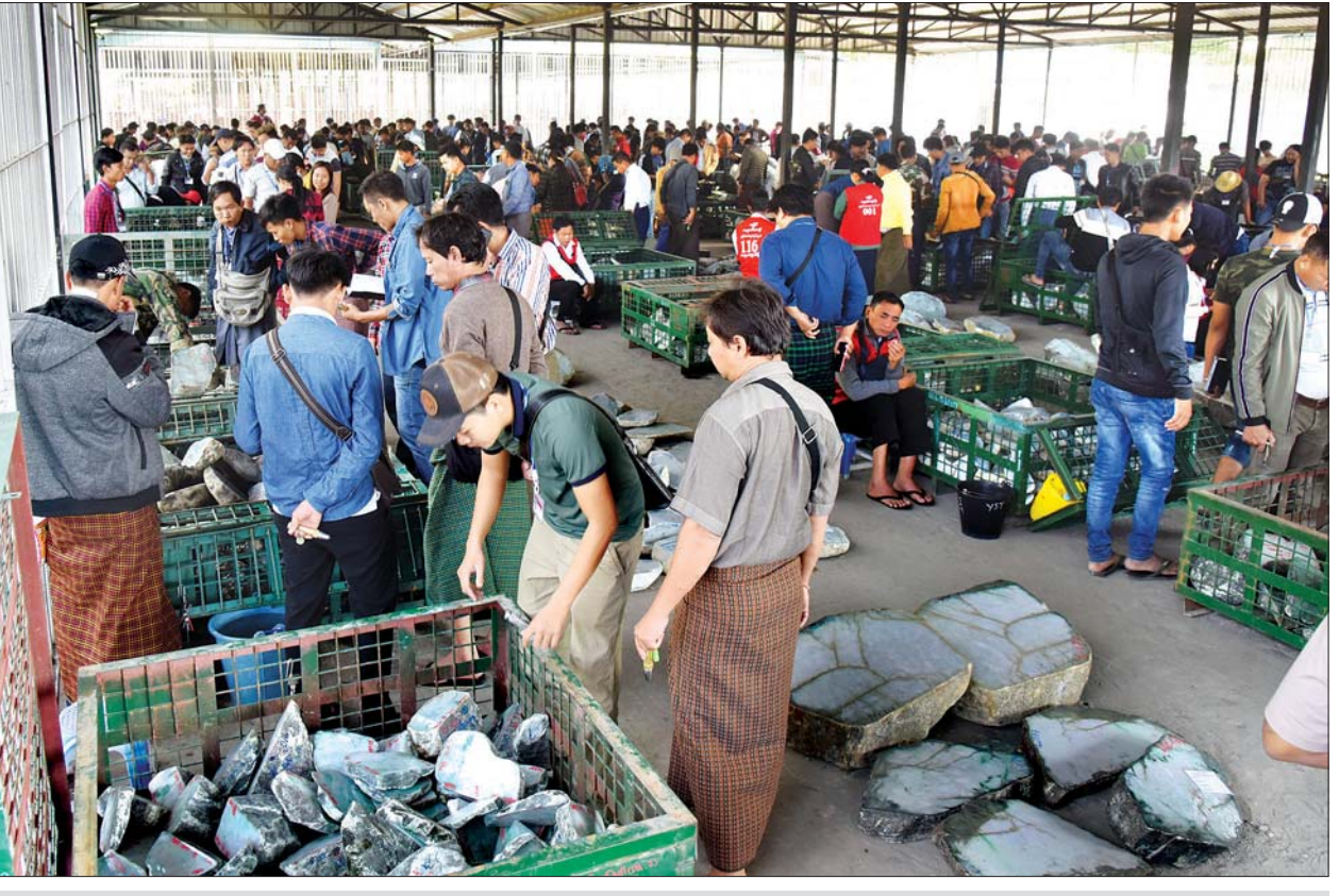
ရတနာကုန်သည်များ ပြပွဲခန်းမအပြင်ဘက်ရှိ ခင်းကျင်းပြသထားသည့် ကျောက်စိမ်းအတွဲများကို လေ့လာကြည့်ရှုကြစဉ်။

လိုက်နာဆောင်ရွက်ရန် ပျက်ကွက်ပါက ပြပွဲတက်ရောက်ခွင့်၊ ဝယ်ယူခွင့်၊ ပြပွဲဗဟိုကော်မတီက အရေးယူဆောင်ရွက်သွားမည်ဖြစ်ကြောင်း သိရသည်။ တင်ပြရောင်းချခွင့် ပိတ်ပင်ခြင်းအပါအဝင် သတ်မှတ်စည်းကမ်းများနှင့်အညီ သတင်း-အောင်ရဲသွင်