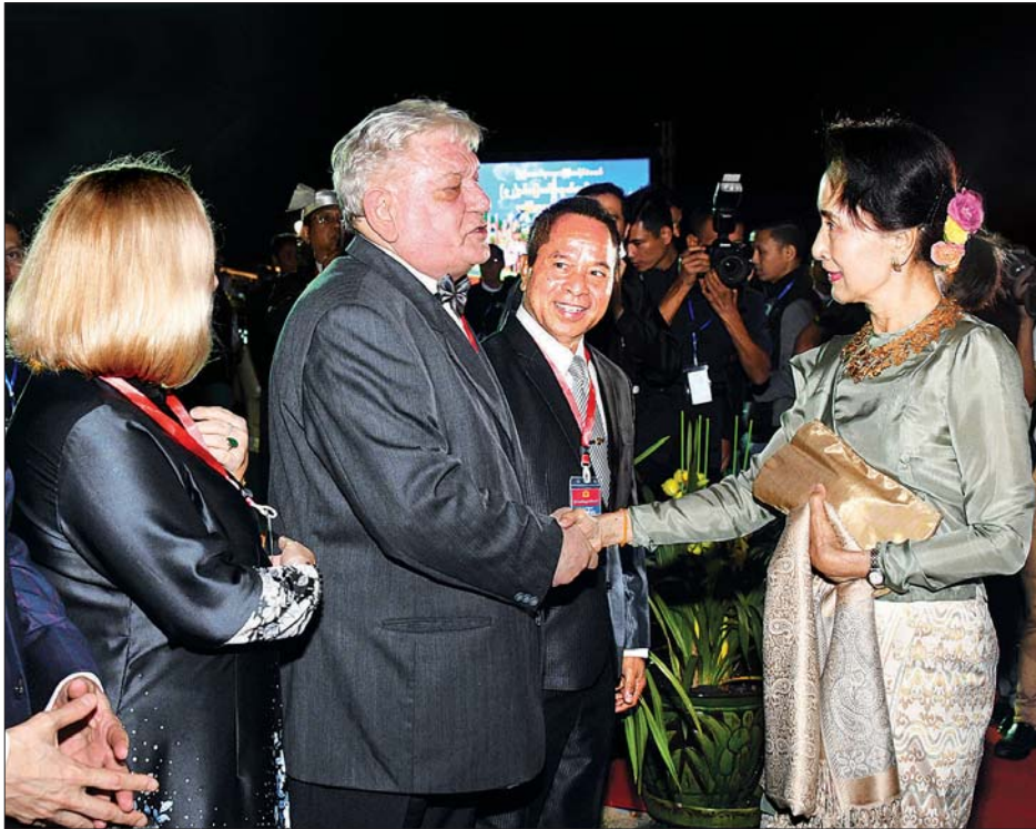
နိုင်ငံတော်၏အတိုင်ပင်ခံပုဂ္ဂိုလ် ဒေါ်အောင်ဆန်းစုကြည် (၇၂)နှစ်မြောက် လွတ်လပ်ရေးနေ့ ဂုဏ်ပြုညစာစားပွဲ အခမ်းအနားသို့ တက်ရောက်လာကြသည့် သံအမတ်ကြီးများ၊ နိုင်ငံတကာသံတမန်များ၊ ကုလသမဂ္ဂအဖွဲ့အစည်း များမှ ဌာနေကိုယ်စားလှယ်များ၊ ဂုဏ်ထူးဆောင်ကောင်စစ်ဝန်များနှင့် ၎င်းတို့၏ ဇနီးများအား ရင်းရင်းနှီးနှီး နှုတ်ဆက်စဉ်။

နေပြည်တော် ဇန်နဝါရီ ၄ ပြည်ထောင်စုသမ္မတမြန်မာနိုင်ငံတော် နိုင်ငံတော်သမ္မတ ဦးဝင်းမြင့်နှင့် ဇနီး ဒေါ်ချိုချိုတို့က တည်ခင်းဆွဲဆောင် သည့် (၇၂)နှစ်မြောက် လွတ်လပ်ရေးနေ့ ဂုဏ်ပြုညစာစားပွဲအခမ်းအနားကို ယနေ့ညပိုင်းတွင် နေပြည်တော်ရှိ