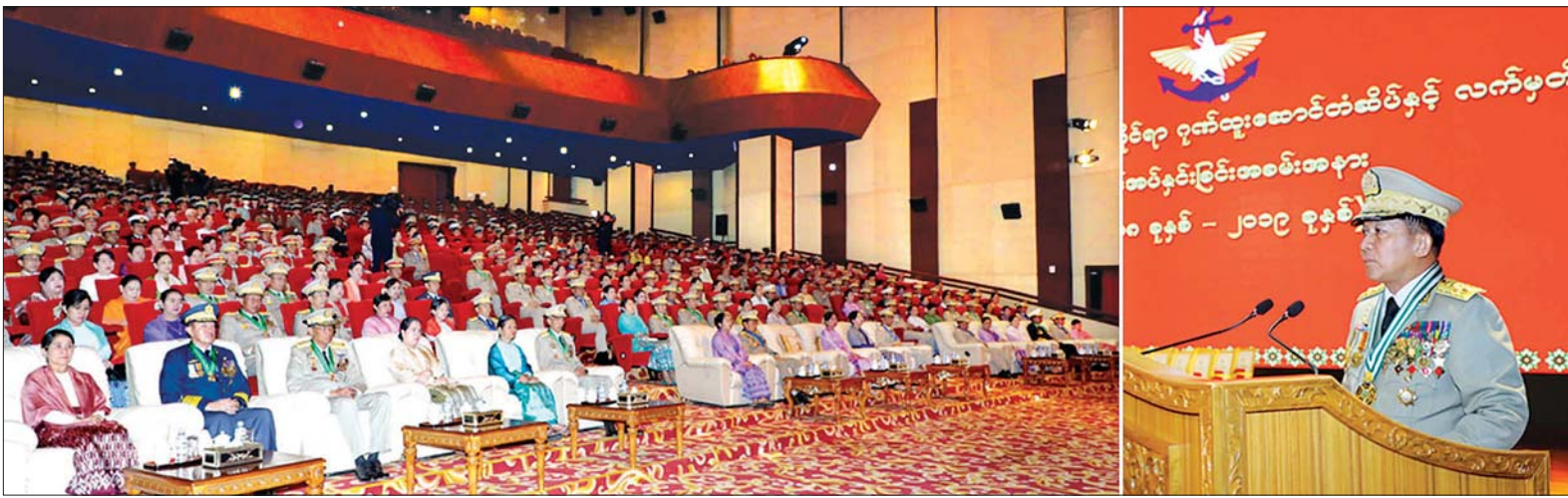
တပ်မတော်ကာကွယ်ရေးဦးစီးချုပ် ဗိုလ်ချုပ်မှူးကြီး မဟာသရေစည်သူ မင်းအောင်လှိုင် တပ်မတော်စွမ်းရည်သတ္တိဆိုင်ရာ ဂုဏ်ထူးဆောင်တံဆိပ်နှင့် လက်မှတ်များ ချီးမြှင့်အပ်နှင်းခြင်း အခမ်းအနား၌ ဂုဏ်ပြုအမှာစကား ပြောကြားစဉ်။

နေပြည်တော် ဇန်နဝါရီ ၄ ၂၀၁၈ ခုနှစ်နှင့် ၂၀၁၉ ခုနှစ်တို့တွင် နိုင်ငံနှင့် ပြည်သူအတွက် အသက်ကို ပမာနမထား၊ စွန့်လွှတ်စွန့်စားစွာ တာဝန် ထမ်းဆောင်ကြသူများအား တပ်မတော်စွမ်းရည်သတ္တိဆိုင်ရာ ဂုဏ် ထူးဆောင်တံဆိပ်နှင့် လက်မှတ်များ ချီးမြှင့်အပ်နှင်းခြင်း အခမ်းအနားကို ယနေ့ မွန်လုံပိုင်းတွင် နေပြည်တော် ရှိ ဇေယျာသီရိဗိမာန်၌ ကျင်းပရာ တပ်မတော်ကာကွယ်ရေးဦးစီးချုပ် ဗိုလ်ချုပ်မှူးကြီး မဟာသရေစည်သူ မင်းအောင်လှိုင် တက်ရောက်၍ ဂုဏ်ပြုအမှာစကား ပြောကြားပြီး ဂုဏ်ထူးဆောင်တံဆိပ်နှင့် လက်မှတ် များ ချီးမြှင့်အပ်နှင်းသည်။