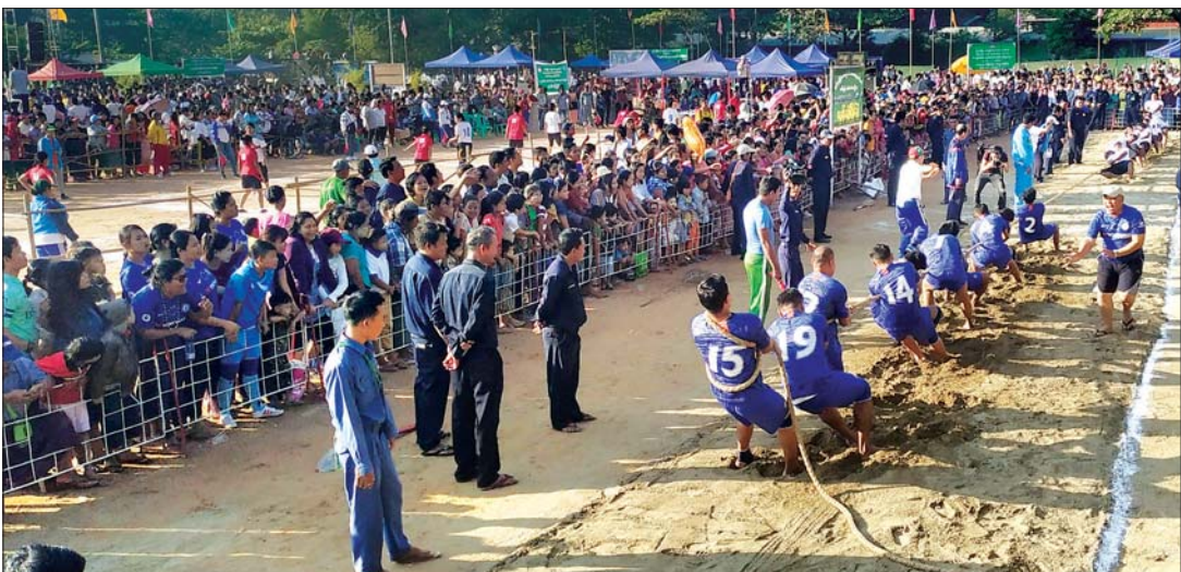
ရန်ကုန်မြို့တော် စည်ပင်သာယာရေးကော်မတီ အားကစားစခန်း၌ ကျင်းပသည့် (၇၂)နှစ်မြောက် လွတ်လပ်ရေးနေ့အထိမ်းအမှတ် အားကစားပြိုင်ပွဲများကို ပြည်သူများပျော်ရွှင်စွာ ပါဝင်ဆင်နွှဲကြစဉ်။

နေပြည်တော် ဇန်နဝါရီ ၄ ။ အခမ်းအနားကို ပြည်ထောင်စု မပြိုကွဲရေး၊ တိုင်းရင်းသားစည်းလုံး ညီညွတ်မှုမပြိုကွဲရေးနှင့် အချုပ် အခြာအာဏာ တည်တံ့ခိုင်မြဲရေး တို့အတွက် တိုင်းရင်းသားအားလုံး “စုပေါင်းအင်အား” ဖြင့် ကာကွယ် စောင့်ရှောက်ရေး၊ နိုင်ငံတော်တည်ငြိမ် အေးချမ်းရေးနှင့် ဖွံ့ဖြိုးတိုးတက် ရေးအတွက် အရေးပါသော လုပ်ငန်း စဉ်ဖြစ်သည့် တရားဥပဒေစိုးမိုးရေးနှင့် တရားမျှတမှုကဏ္ဍပြုပြင် ပြောင်းလဲ ရေးတို့ကို ဦးစားပေးလုပ်ဆောင်ရေး၊ ဒီမိုကရေစီဖက်ဒရယ်ပြည်ထောင်စု ကြီး တည်ဆောက်ရေးအတွက် အခြေခံအုတ်မြစ်ဖြစ်သည့် ဖွဲ့စည်းပုံ အခြေခံဥပဒေပြင်ဆင်ရေးကို ဦးတည် ကြိုးပမ်းဆောင်ရွက်ရေး၊ ဒီမိုကရေစီ ဖက်ဒရယ်ပြည်ထောင်စု တည် ဆောက်ရာတွင် နိုင်ငံသူ၊ နိုင်ငံသား များ၏ တာဝန်သိစိတ်နှင့် အရည်သွေး မြင့်မားလာစေမည့် ပတ်ဝန်းကျင် ကောင်းမွန် ဖန်တီးတည်ဆောက် ရေးနှင့် မြန်မာနိုင်ငံ၏ ရေရှည် တည်တံ့ခိုင်မြဲပြီး ဟန်ချက်ညီသော ဖွံ့ဖြိုးတိုးတက်မှု စီမံကိန်းဖြင့် ငြိမ်းချမ်း၍ သာယာဝပြောသော ဒီမိုကရေစီဖက်ဒရယ် ပြည်ထောင်စု ဖြစ်ပေါ်လာရေးဟူသည့် အမျိုး သားရေး ဦးတည်ချက်များနှင့်အညီ အနုစိတ်သရပြည့်ဝစွာ ကျင်းပခြင်း ဖြစ်သည်။ ရှေးဦးစွာ နံနက် ၄ နာရီ မိနစ် ၂၀ တွင် ၂၀၂၀ ပြည့်နှစ် (၇၂)နှစ်မြောက် လွတ်လပ်ရေးနေ့ အလံတင် စာမျက်နှာ ၅ ကော်လံ ၁ ။