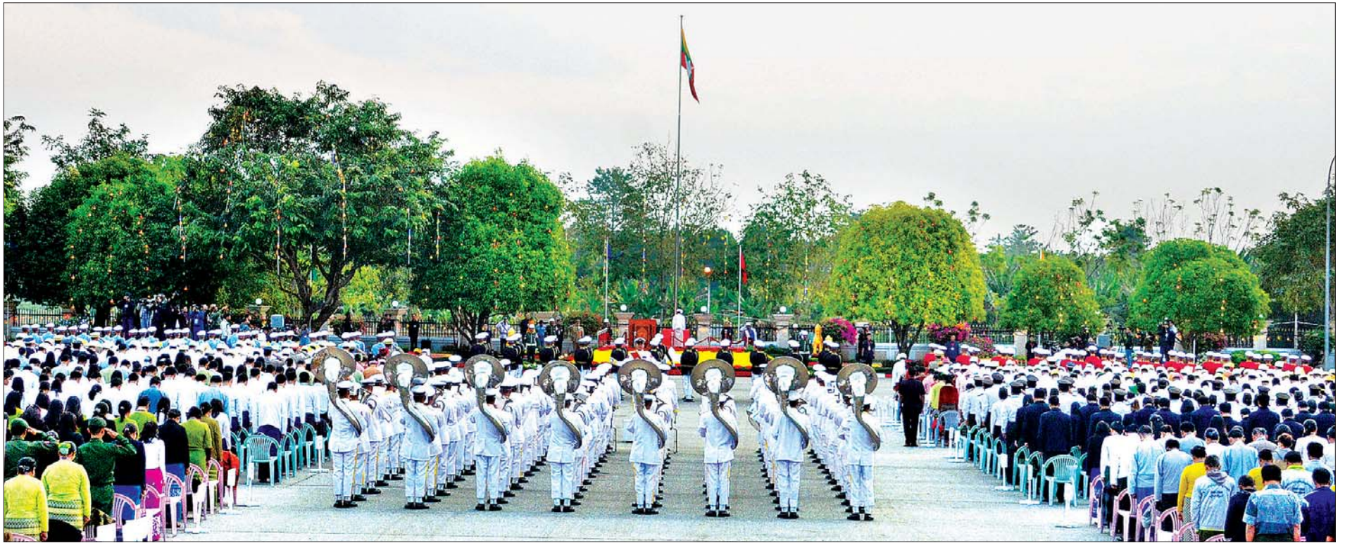
(၇၂)နှစ်မြောက် လွတ်လပ်ရေးနေ့ နိုင်ငံတော်အလံအလေးပြုပွဲ အခမ်းအနား ကျင်းပစဉ်။