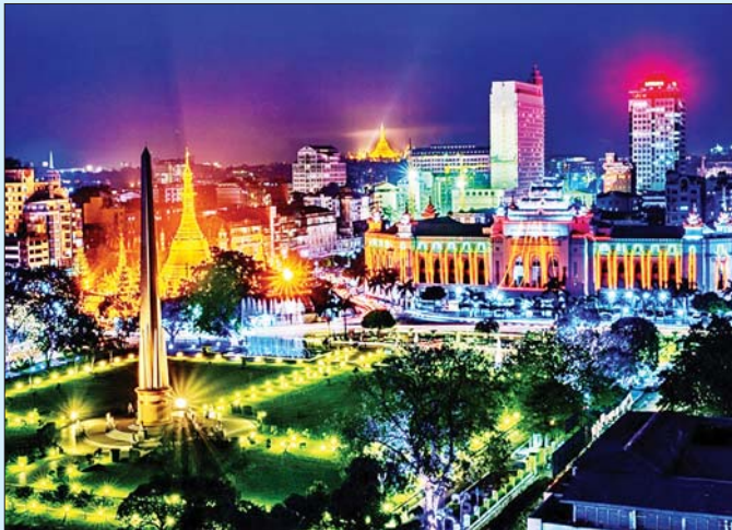
ရန်ကုန်မြို့ ညရွာခင်းပုံ

(ဗိုလ်ချုပ်အောင်ဆန်း၏ ၁၉၄၇ ခုနှစ်၊ မေလ ၁၉ ရက်နေ့တွင် ဂျူဗလီဟောပဏာမပြင်ဆင်မှု ညီလာခံတွင် မိန့်ကြားခဲ့သည့် မိန့်ခွန်းမှ ကောက်နုတ်ချက်)