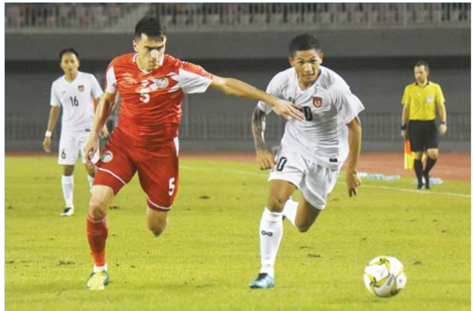
၂၀၂၂ ကမ္ဘာ့ဖလားခြေစမ်းပွဲ ယှဉ်ပြိုင်နေသည့် မြန်မာ့လက်ရွေးစင်အသင်း။

မြန်မာနိုင်ငံ ဘောလုံးအဖွဲ့ချုပ်သည် ယင်းခြေစမ်းပွဲများအတွက် အသင်း များ စတင်ဖိတ်ကြားနေပြီဖြစ်ပြီး ခြေစမ်းပွဲနှစ်ပွဲတွင် အိမ်ကွင်း၌ စာမျက်နှာ ၁၂ ကော်လံ ၅ ●