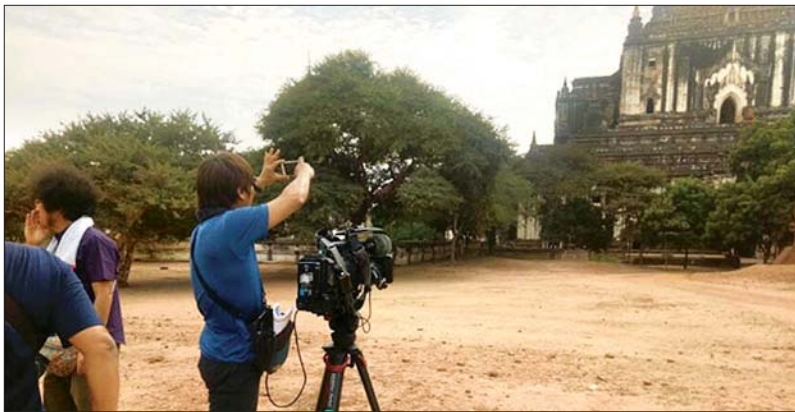
သဗ္ဗညုဘုရားတွင် ဂျပန်နိုင်ငံ TBS ရုပ်သံရိုက်ကူးရေးအဖွဲ့ မှတ်တမ်းတင်ရိုက်ကူးနေစဉ်။

ထို့အပြင် ဇန်နဝါရီ ၃ ရက်နှင့် ၄ ရက်တို့တွင် ပုပ္ပားတောင်၌ နတ်ကန္တာကျင်းပပုံနှင့် ပုဂံမြို့ရှိ ဘုရားများအား ဆက်လက်ရိုက်ကူးသွားမည်ဖြစ်ကြောင်း၊ ထိုသို့ရိုက်ကူးထားမှုများကို ဂျပန်နိုင်ငံ TBS ရုပ်သံလိုင်းတွင် “လှပသော ယဉ်ကျေးမှုနယ်မြေ” ခေါင်းစဉ်ဖြင့် ယခုနှစ် ဖေဖော်ဝါရီလတွင် ထုတ်လွှင့်ပြသရန် စီစဉ်ဆောင်ရွက်လျက်ရှိကြောင်း သိရသည်။