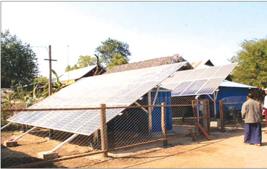
စစ်ကိုင်းတိုင်းဒေသကြီး ဘုတလင်မြို့နယ်မှ ကျေးရွာတစ်ရွာ၌ ဆီလစနစ်ဖြင့် မီးလင်းရေးဆောင်ရွက်ထားစဉ်

လျှပ်စစ်ဓာတ်အား ပိုမိုရရှိစေရေးနှင့် အမျိုးသားလျှပ်စစ်ဓာတ်အားရရှိရေးစီမံကိန်းကို အထောက်အပံ့ရစေရန် ရှမ်းပြည်နယ်တောင်ပိုင်းတွင် ဂျာမနီနိုင်ငံ၏ (KfW) မှ Rural Electrification Programme II on Grid Electrification စီမံကိန်းအတွက် ချေးငွေ ယူရို ၂၃ ဒသမ ၈၀၃ သန်းနှင့် အထောက်အပံ့ယူရို ၆ ဒသမ ၅၃၇ သန်း စုစုပေါင်း ယူရို ၃၀ ဒသမ ၄၀၈ သန်းဖြင့် ရှမ်းပြည်နယ်တောင်ပိုင်းရှိ တောင်ကြီးခရိုင်၊ လျှင်လင်ခရိုင်နှင့် လင်းခေးခရိုင်အတွင်းရှိ ကျေးရွာပေါင်း ၄၁၆ ရွာ ခန့်မှန်းအိမ်ထောင်စုဦးရေ ၃၂၆၅၄ စုအား ဓာတ်အားရရှိရေးအတွက် ၂၀၁၈ ခုနှစ်မှစတင်၍ ၂၀၂၂ အထိ ငါးနှစ်တာကာလအတွင်း ဆောင် ရွက်သွားမည်အပြင် လျှပ်စစ်နှင့် စွမ်းအင်ဝန်ကြီးဌာနကလည်း