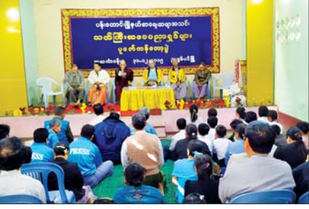
ပန်းတောင်းမြို့နယ် စာရေးဆရာအသင်း သက်ကြီးစာပေပညာရှင်များအား ပူဇော်ကန်တော့ပွဲကျင်းပစဉ်။