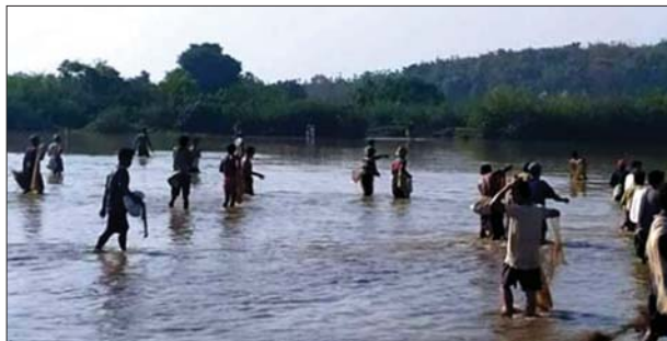
တောင်ကလေးအင်း၌ ကွန်ပစ်ပွဲ ပြုလုပ်စဉ်။

ကျေးရွာ အင်းတွင် ယမန်နေ့ နံနက် ၉ နာရီမှစ၍ ကွန်ပစ်ပွဲကို စည်ကားသိုက်မြိုက်စွာ ကျင်းပရာ