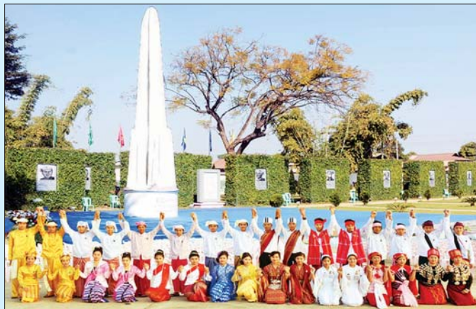
လွတ်လပ်ရေးကျောက်တိုင်နှင့် တိုင်းရင်းသားများ ဓာတ်ပုံ - ပြန်/ဆက်

(နိုင်ငံတော်သမ္မတ ဦးဝင်းမြင့်၏ ၄-၁၂-၂၀၁၉ ရက်နေ့တွင် (၇၁)နှစ်မြောက် လွတ်လပ်ရေးနေ့ အထိမ်းအမှတ် အခမ်းအနားသို့ ပေးပို့သည့်သဝဏ်လွှာမှ ကောက်နုတ်ချက်)