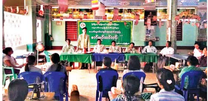
အခြေခံစက်ချုပ်သင်တန်း ဖွင့်လှစ်သင်ကြားနေစဉ်။

လက်တွေ့အသုံးချဆောင်ရွက်လုပ်ကိုင်ကြစေလိုကြောင်း ဆွေးနွေးပြောကြားသည်။ ထို့နောက် သင်တန်းနည်းပြများအဖွဲ့က တက်ရောက်လာသည့် သင်တန်းသား သင်တန်းသူများကို အိမ်တွင်းမူလုပ်ငန်းဖြင့် မိသားစုဝင်ငွေတိုးပွားရေး အမျိုးသားဝတ်တီရှပ် လက်တိုလက်ရှည်ချုပ်နည်းများ၊ အမျိုးသမီးဝတ်ရင်ဖုံး အင်္ကျီ ရင်စိအင်္ကျီချုပ်နည်းများနှင့် ဘောင်းဘီတို၊ ဘောင်းဘီရှည် ချုပ်နည်းများကို စာတွေ့လက်တွေ့ ဖွင့်လှစ်သင်ကြားပေးခဲ့သည်။ အဆိုပါ သင်တန်းသို့ ရွှေဘိုရွာမကျေးရွာနှင့် အနီးဝန်းကျင်ကျေးရွာများမှ စက်ချုပ်ပညာရပ် စိတ်ဝင်စားသည့် သင်တန်းသားများ တက်ရောက်သင်ကြားသွားမည်ဖြစ်ကြောင်း၊ သင်တန်းအား ဒီဇင်ဘာ ၁ ရက်မှ ၃၀ ရက်အထိ သင်ကြားပေးသွားမည်ဖြစ်ကြောင်း သိရသည်။ ရဝင်းနိုင် (ညောင်ဦး)