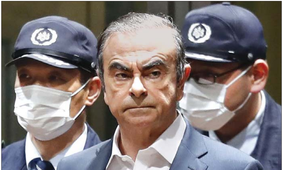
နှစ်ဆန်းမော်တာကုမ္ပဏီ၏ အမှုဆောင်ချုပ်ဟောင်း မစ္စတာ ကားလို့စိစစ်ပုံစံ။

ဝေါထေရီဂျာနယ်ကတော့ သူဟာတူရိယာကနေတစ်ဆင့် လက်ဘနွန်