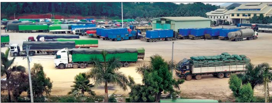
မူဆယ် (၁၀၅) မိုင် ကုန်သွယ်ရေးစနစ်အတွင်း ဝင်ရောက်လာသည့် ကုန်တင်ယာဉ်များကို တွေ့ရစဉ်။

မူဆယ်နယ်စပ်တွင် တရုတ်- မြန်မာ နှစ်နိုင်ငံအကျိုးတူပေါင်း ဆောင်ရွက်လျက်ရှိသော မူဆယ်ခရိုင် မူဆယ်မြို့နယ် မိုင်းယု (၁၀၅) မိုင် ကုန်သွယ်ရေးစနစ်ကုန်ပစ္စည်း စစ်ဆေး ရေးကွင်းအတွင်းသို့ ယခင် ရက်ပိုင်း၊ လပိုင်း တရုတ်နှစ်သစ်ကူးမတိုင်ခင် တရုတ်နိုင်ငံမှ ကုန်သွယ်ပို့ပေးထား သည့် မြန်မာဘက်မှ ကုန်ပစ္စည်း တချို့ကလွဲ၍ ဆန်း၊ ပဲအမျိုးမျိုး၊ ရော်ဘာ၊ ကြက်သွန်နီ၊ နှမ်းအမျိုးမျိုး၊ လယ်ယာထွက်ကုန် ပစ္စည်းများ၊ နှုတ်ငါးတက်၊ ဂရုတ်သီးခြောက်၊ ငါးရှဉ့်၊ ကအန်း၊ ဖရုံ သခွား၊ သရက်၊ ကျောက်မျက်ခေါ့၊ ကျွဲ၊ နွားအရှင်၊ ဆိတ်အရှင်၊ သဘာဝထွင်းထွက် ပစ္စည်းအမျိုးမျိုး စသည့်ကုန်ပစ္စည်း များ တရုတ်နိုင်ငံဘက်သို့ နေ့စဉ် တင်ပို့လျက်ရှိပြီး တရုတ်နိုင်ငံဘက်မှ သွင်းကုန်အဖြစ် အိမ်ဆောက်ပစ္စည်း၊ သံထည်ပစ္စည်းများ၊ ကော်ပိုက်လုံး များနှင့် ကော်နှင့်ပတ်သက်သည့် ပစ္စည်းအမျိုးမျိုး၊ လှည်းကုန်ပစ္စည်း များ၊ စက်ပစ္စည်းအမျိုးမျိုး၊ ကလေး ကစားရောအုပ်အမျိုးမျိုး၊ လယ်ယာ သုံး ပစ္စည်းများ၊ ယာဉ်ယန္တရားများ၊ မော်တော်ဆိုင်ကယ်များနှင့် စက်ဘီး များ၊ Skynet ပစ္စည်းများ၊ တရုတ်နိုင်ငံ ဒေသထွက် အသီးအမျိုးမျိုး၊