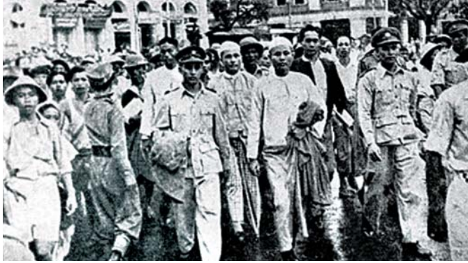
တသိတတန်းကြီး သင်္ဘောဆိပ်သို့ လိုက်ပါပို့ဆောင်ပေးခဲ့သည်။ သမ္မတနှင့် ဘုရင်ခံတို့စီးသောကားကို မြို့မရာဇဝတ်အဖွဲ့မှ မော်တော်ဆိုင်ကယ် ၁၀ စီးဖြင့် ဖြန့်ဖြူး လိုက်ပါလာ၏။

အိမ်တော်ရှေ့မြောက်ခင်းပြင်ပေါ်ဝယ် ရောင်စုံကုလား ထိုင်လေးတန်းခင်းကျင်းထား၍ စည်ညည်တော်များ ထိုင်နေကြသည်။ စည်ညည်တော်များနှင့် တူရုရုကန်နာမူလျက် လက်ဝဲဘက်အစွန်ဆုံးတွင် ဗမာ့ရေတပ်သားများ၊ ဗမာ့ တပ်မတော်၊ လေတပ်၊ တပ်ဖွဲ့ပေါင်းစုံ စီတန်းရပ်နေကြသည်။ နောက်ဘက်ခပ်ကျနေရာ၌မူကား ဗြိတိသျှ တီးရိုင်းတော်သားများ ရှိကြသည်။