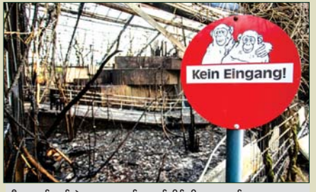
မီးလောင်ကျွမ်းခဲ့သော မျောက်လှောင်အိမ်ကို တွေ့ရစဉ်။