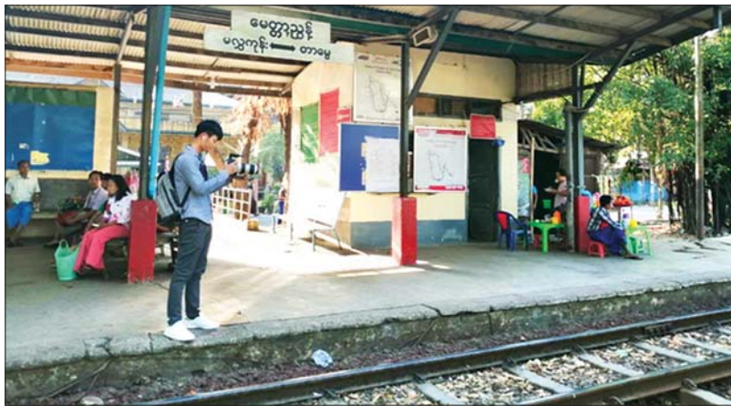
မေတ္တာညွန့်ဘူတာအနီးတစ်ဝိုက်တွင် တရုတ်နိုင်ငံ ဟိုင်နန်တီဗီမှ ရိုက်ကူးရေးအဖွဲ့ မှတ်တမ်းတင်ရိုက်ကူးနေစဉ်။