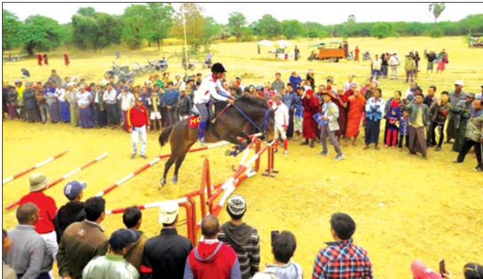
မိတ္ထီလာမြို့၌ မြန်မာ့ရိုးရာ မြင်းစီးပြိုင်ပွဲ ကျင်းပစဉ်။

မြန်မာနိုင်ငံ မြင်းစီးအားကစားအဖွဲ့ချုပ်မှ ဦးဆောင်မှုဖြင့် ခရိုင်မြင်းစီးအားကစားအသင်းကြီးမှူး၍ မြို့နယ်(၁၁) မြို့နယ်ရှိ မြင်းစီးကလပ် ၂၆ ခုမှ မြင်းစီးအားကစားသမားများက (၇၂)နှစ်မြောက် လွတ်လပ်ရေးနေ့အထိမ်းအမှတ် မြန်မာ့ရိုးရာမြင်းစီးအားကစားပြိုင်ပွဲကို မိတ္ထီလာမြို့နယ် မကျီးချောက်ကျေးရွာတွင် ဇန်နဝါရီ ၂ ရက် နံနက်က ကျင်းပခဲ့ကြောင်း သိရသည်။