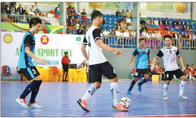
ဝန်ကြီးဌာနအသင်းက ပညာရေး ဝန်ကြီးဌာနအသင်းကို လည်းကောင်း အနိုင်ရရှိခဲ့သည်။ ဖူဆယ်အားကစားရုံတွင် ဆီမီးဖိုင်နယ်ပွဲစဉ်များအဖြစ် ယနေ့နံနက် ၉ နာရီမှစတင်၍ ယှဉ်ပြိုင်ကြရာ ပညာရေးဝန်ကြီးဌာန အသင်းက လှည့်ဝန်ထမ်း၊ ကာကွယ်ရေးနှင့် ပြန်လည်နေရာချထားရေးဝန်ကြီးဌာန အသင်းကိုလည်းကောင်း၊ လျှပ်စစ်နှင့် စွမ်းအင်ဝန်ကြီးဌာန အသင်းက နေပြည်တော်စည်ပင်အသင်းကို လည်းကောင်း အနိုင်ရရှိခဲ့သည်။ TC-1 တွင် ယှဉ်ပြိုင်ကစားစားပွဲကို ကျော်ဖြင့် (အမျိုးသား) ပြိုင်ပွဲ

နေပြည်တော် ဇန်နဝါရီ ၂ - (၇၂)နှစ်မြောက် လွတ်လပ်ရေးနေ့အထိမ်းအမှတ် ဝန်ကြီးဌာနပေါင်းစုံ အားကစားပြိုင်ပွဲများကို ယနေ့နံနက် ၈ နာရီခွဲမှစတင်၍ ယှဉ်ပြိုင်ကစားကြရာ ဝဏ္ဏသိဒ္ဓိအားကစားလေ့ကျင့်ရေးကွင်း(၁)နှင့် (၂)ကြားတွင် လွန်ခဲ့တဲ့ အားကစား (အမျိုးသား) ပြိုင်ပွဲ ကွာတားဖိုင်နယ် ပွဲစဉ်များအဖြစ် ကျန်းမာရေးနှင့် အားကစားဝန်ကြီးဌာနအသင်းက ပို့ဆောင်ရေးနှင့် ဆက်သွယ်ရေးဝန်ကြီးဌာနအသင်းကို လည်းကောင်း၊ ကာကွယ်ရေးဝန်ကြီးဌာနအသင်းက ပြည်ထောင်စုရုံးဝန်ကြီးဌာနအသင်းကို လည်းကောင်း၊ ဝဏ္ဏသိဒ္ဓိအားကစားလေ့ကျင့်ရေးကွင်း(၁)နှင့် (၂)ကြားတွင် ထပ်ဆီးတိုးပြည်သူ့လွှတ်တော်အသင်းကို လည်းကောင်း၊ လျှပ်စစ်နှင့်စွမ်းအင်ဝန်ကြီးဌာနအသင်းက တိုင်းရင်းသားလူမျိုးများရေးရာဝန်ကြီးဌာန အသင်းကို လည်းကောင်း အနိုင်ရရှိခဲ့သည်။