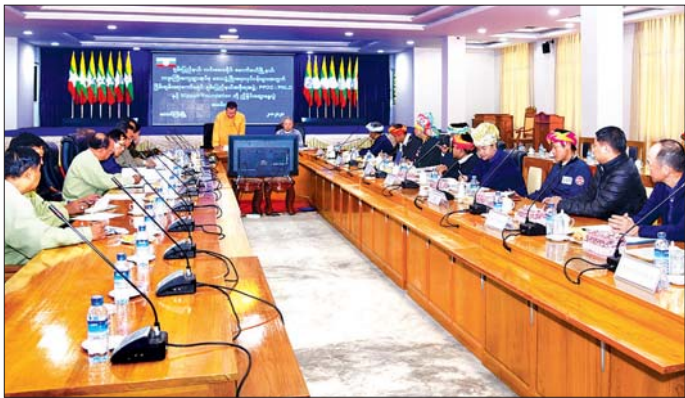
လင်းခေးခရိုင် မောက်မယ်မြို့နယ် ကနူးကြီးကျေးရွာအုပ်စု ဒေသဖွံ့ဖြိုးရေးလုပ်ငန်းများဆွေးနွေးပွဲ ကျင်းပစဉ်။