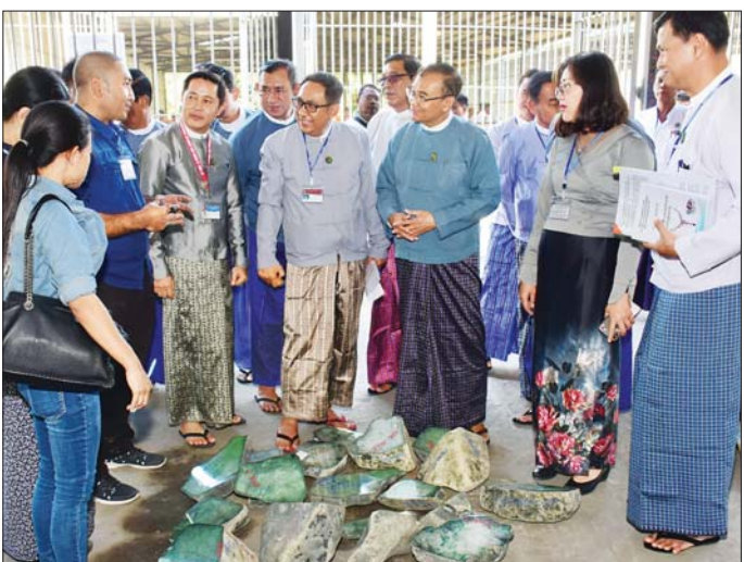
အတွဲများနှင့် ကျောက်စိမ်းအတွဲများကို မိမိတို့စိတ်ကြိုက် လွတ်လပ်စွာ လှည့်လည်ကြည့်ရှုချမ်းသာစွာ ဖြစ်စေရန်အတွက် အဆိုပြုလှူများကို သက်ဆိုင်ရာ တင်ဒါပေးအတွင်းသို့ ထည့်သွင်းကြသည်။

နေပြည်တော် ဇန်နဝါရီ ၂ ၂၀၂၀ ပြည့်နှစ် ဇန်နဝါရီလ ကျောက်မျက်ရတနာများ မြန်မာကျပ်ငွေဖြင့် ရောင်းချပွဲ ယနေ့နံနက် ၈ နာရီတွင် နေပြည်တော်ရှိ မဏိရတနာကျောက်စိမ်းခန်းမ၌ စတင်ကျင်းပရာ ပြည်ထောင်စုဝန်ကြီးဌာနအဖွဲ့ဝင် တက်ရောက်၍ လှည့်လည်ကြည့်ရှုအားပေးသည်။ (ယာဝုံ)