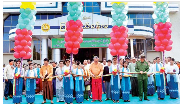
ပြည်နယ်ဝန်ကြီးချုပ် ဒေါက်တာအေးစံနှင့် တာဝန်ရှိသူများ လွတ်လပ်ရေးနေ့အထိမ်းအမှတ်ပြခန်းကို ဖဲကြိုးဖြတ်ဖွင့်လှစ်ပေးစဉ်။

မော်လမြိုင် ဇန်နဝါရီ ၂ (၇)နှစ်မြောက် လွတ်လပ်ရေးနေ့ အထိမ်းအမှတ် ပြခန်း ဖွင့်ပွဲအခမ်းအနားကို ယနေ့ နံနက်ပိုင်းက မော်လမြိုင်မြို့ ပြည်နယ်ခန်းမ၌ ကျင်းပရာ ပြည်နယ်ဝန်ကြီးချုပ် ဒေါက်တာအေးစံနှင့် တာဝန်ရှိသူများ တက်ရောက်ကြသည်။ ထိုနောက် လွတ်လပ်ရေးနေ့ အထိမ်းအမှတ်ပြခန်းကို ပြည်နယ်ဝန်ကြီးချုပ်နှင့်ပြည်နယ်ဝန်ကြီးတို့က ဖဲကြိုးဖြတ်ဖွင့်လှစ်ပေးပြီး ပြခန်းအတွင်းသို့ လှည့်လည်ကြည့်ရှုကြသည်။ အဆိုပါ ပြခန်းတွင် လွတ်လပ်ရေး ကြိုးပမ်းဆောင်ရွက်ခဲ့မှု သမိုင်းမှတ်တမ်းဓာတ်ပုံများ၊ နိုင်ငံတော်အကြီးအကဲများ မွန်ပြည်နယ်အတွင်း ရောက်ရှိမှု မှတ်တမ်းဓာတ်ပုံများ၊ မွန်ပြည်နယ်အစိုးရအဖွဲ့၏ ဒေသဖွံ့ဖြိုးရေးဆောင်ရွက်မှု မှတ်တမ်း