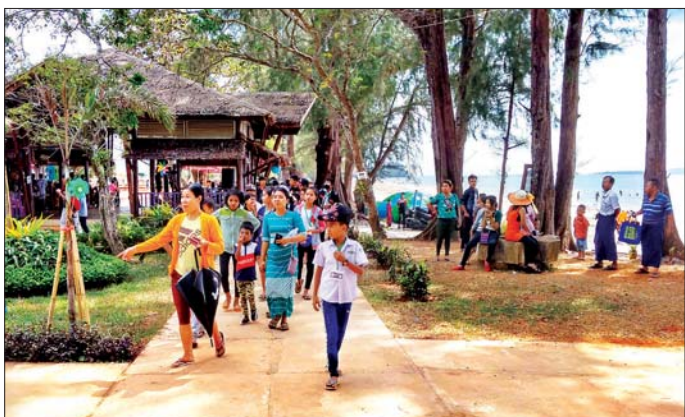
ခမောက်ကြီးမြို့အနီးရှိ ဂျပန်ကမ်းခြေတွင် ခရီးသွားများလာရောက်လည်ပတ်စဉ်။

ခမောက်ကြီး ဇန်နဝါရီ ၂ ကျောင်းသားခရီးစဉ် ခမောက်ကြီးမြို့နှင့် ၂၅ မိုင်ခန့် ကွာဝေးသည့် ဂျပန်ကမ်းခြေတွင် နိုင်ငံတကာနှစ်သစ်ကူးပိတ်ရက်များအတွင်း ခရီးသွားများ၊ လာရောက်အပန်းဖြေသူများ၊ လေ့လာရေးခရီးသွားများနှင့် စည်ကားလျက်ရှိသည်။ ကမ်းခြေများ ဖောက်ယူလေး ဒီဇင်ဘာ ၂၅ ရက်မှ ဇန်နဝါရီ ၁ ရက်အထိလာရောက်သောစဉ်သည် များအား ငွေကျပ်တစ်သောင်းဖိုးနှင့် အထက် ဝယ်ယူအားပေးသူများ၊ စုငယ်လာလှိုင်း ဂျပန်ကမ်းခြေ ဖေ့စ်ဘွတ်ပေ့ချ်ကို Like & Share ပြုလုပ်ပါက ဗလာမပါကမ်းခြေများ ဖောက်ယူလေးခြေကြောင်းနှင့် ထိုကမ်းခြေတွင် စားသောက်ဖွယ်မျိုးစုံ၊ လူသုံးကုန်မျိုးစုံနှင့် ရေပေါ်တွင်စီးရသည့် ဖော့မျိုးစုံအပြင် ရေဆိုင်ကယ်စီးနင်းခွင့်များလည်းပါရှိကြောင်း၊ ဂျပန်ကမ်းခြေမှ စုပိုက်စာ ဦးစေလင်း ထိုက်ထံမှ သိရသည်။