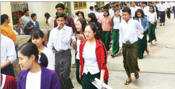
ယမန်နှစ်က တက္ကသိုလ်ဝင်စာမေးပွဲတွင် လာရောက်ဖြေဆိုသည့် ကျောင်းသား ကျောင်းသူများကို တွေ့ရစဉ်။

၂၀၁၈-၂၀၁၉ ပညာသင်နှစ်အတွက် တက္ကသိုလ်ဝင်စာမေးပွဲတွင် မန္တလေးတိုင်းဒေသကြီးမှ ဖြေဆိုသူဦးရေ