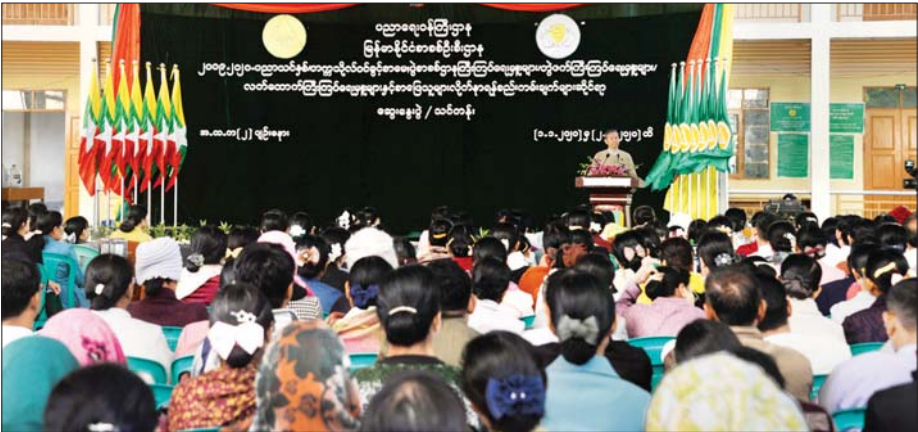
ပြည်ထောင်စုဝန်ကြီး ဒေါက်တာမျိုးသိမ်းကြီး ၂၀၂၀ ပြည့်နှစ် တက္ကသိုလ်ဝင်ခွင့်စာမေးပွဲ ကြီးကြပ်ရေးမှူးများ၊ တွဲဖက်ကြီးကြပ်ရေးမှူးများ၊ လက်ထောက်ကြီးကြပ်ရေးမှူးများနှင့် စာဖြေသူများ လိုက်နာရန် စည်းကမ်းချက်များဆိုင်ရာဆွေးနွေးပွဲတွင် အမှာစကားပြောကြားစဉ်။ သတင်းစဉ်

ဆွေးနွေးပွဲတွင် ပြည်ထောင်စုဝန်ကြီး ဒေါက်တာမျိုးသိမ်းကြီးက နိုင်ငံကောင်းရန်အတွက် ပညာရေးစနစ်ကောင်းရန် အရေးကြီးပါကြောင်း၊ ပညာရေးစနစ် ကောင်းမွန်ရေးအတွက် အရည်အသွေးရှိသော ပညာရေးစနစ်သို့ ပြုပြင်ပြောင်းလဲအကောင်အထည်ဖော် ဆောင်ရွက်ရာတွင် ညီညွတ်ညွတ် ပူးပေါင်းပါဝင်ဆောင်ရွက်ကြရန် လိုအပ်ကြောင်း၊ ပြုပြင်ပြောင်းလဲမှုကာလအတွင်း အားသာချက်များကို ပိုမိုအားကောင်းစေရန်၊ အားနည်းချက်များကို ပြန်လည်သုံးသပ်၍ အားကောင်းစေရန် ဆောင်ရွက်ကြရမည်ဖြစ်ကြောင်း၊ ၂၀၂၀ ပြည့်နှစ် တက္ကသိုလ်ဝင်ခွင့်စာမေးပွဲကို မတ် ၁ ရက်မှ ၂၀ ရက်အထိ ကျင်းပသွားမည်ဖြစ်ရာ စာမေးပွဲမေးခွန်း၊ အဖြေလွှာ၊ စာစစ်လုပ်ငန်း၊ အောင်စာရင်းလုပ်ငန်းများ လုံခြုံဖြန့်ဖြူးစေရန်၊