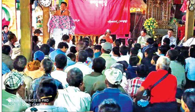
မင်းလှ၌ ပန်းတော(၂)ကျေးရွာနှင့် ဒီလှိုင်းကျေးရွာတွင် လူထုတွေ့ဆုံပွဲ ပြုလုပ်စဉ်။

ယခုလရောက် တွေ့ဆုံမှုသည် ဝန်ကြီးအနေဖြင့်သာမက ကိုယ်စားလှယ်အနေဖြင့်ပါလာရောက်တွေ့ဆုံခြင်းဖြစ်ကြောင်း၊ အများဆုံးအား ဦးစားပေး၍ တင်ပြမှုများဆောင်ရွက်ပေးကြရန် လိုအပ်ကြောင်း ပြောကြားခဲ့သည်။ မြို့နယ်အုပ်ချုပ်ရေးမှူး ဦးမျိုးညွန့်က ကြိုဆိုနှုတ်ဆက် စကားပြောကြားပြီး မြို့နယ်စည်ပင်သာယာရေးကော်မတီဥက္ကဋ္ဌ ဦးခင်ထွန်းက ဒေသဖွံ့ဖြိုးရေးလုပ်ငန်းဆိုင်ရာများကို ရှင်းလင်းပြောကြားသည်။ ထို့နောက် ဒေသပြည်သူများက ဒေသဖွံ့ဖြိုးရေးလိုအပ်ချက်များကို တင်ပြရာ တိုင်းဒေသကြီးဝန်ကြီး ဦးအောင်စောနိုင်က ပြည့်စွက်ရှင်းလင်းပြောကြားကာ သက်ဆိုင်ရာဌာနများနှင့် ညှိနှိုင်းဆွေးနွေးဆောင်ရွက်ပေးခဲ့သည်။ ဆက်လက်၍ ရွှေလောင်းအုပ်စု ဒီလှိုင်းကျေးရွာဘုန်းတော်ကြီးကျောင်း၌ လူထုတွေ့ဆုံပွဲကျင်းပခဲ့ပြီး ဒေသဖွံ့ဖြိုးရေးလုပ်ငန်းများကို ညှိနှိုင်းဆွေးနွေးခဲ့သည်။