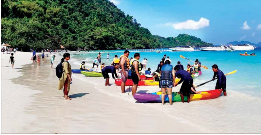
အက်ဒမန်ပင်လယ်အတွင်းရှိ အပန်းဖြေကျွန်းများသို့ လာရောက်လည်ပတ်သည့် ပြည်တွင်း ပြည်ပ ခရီးသွားဧည့်သည်များအား တွေ့ရစဉ်။

တနင်္သာရီတိုင်း ဒေသကြီးအတွင်း ခရီးသွားလုပ်ငန်း ဖွံ့ဖြိုးတိုးတက် လာနေမှုနှင့်အတူ နိုင်ငံတကာ နှစ်သစ်ကူး အားလပ်ရက်များအတွင်း ကော့သောင်းမြို့နယ် အက်ဒမန် ပင်လယ်အတွင်းရှိ အပန်းဖြေကျွန်း များသို့ အနယ်နယ်အရပ်ရပ်မှ ပြည်တွင်းဧည့်သည်များအပြင် ထိုင်း နိုင်ငံမှတစ်ဆင့် ပြည်ပခရီးသွား ဧည့်သည်များ လာရောက်လည်ပတ် လျက်ရှိသည်ကို ဇန်နဝါရီ ၂ ရက် က မြို့မဆိပ်ကမ်းတံတားတွင် တွေ့မြင်ရသည်။