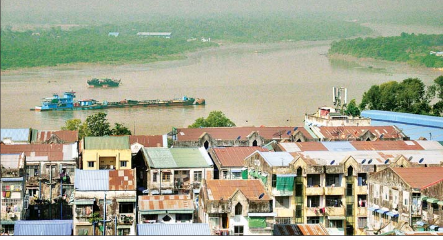
ရန်ကုန်မြစ်ကမ်းတစ်လျှောက် တွေ့ရစဉ်။

ရန်ကုန်တိုင်းဒေသကြီးတွင် ခရီးသွားလုပ်ငန်းများမြှင့်တင်နိုင်ရန် တိုင်းဒေသကြီးအစိုးရက ကြိုးပမ်းဆောင်ရွက်လျက်ရှိရာ ဆိပ်ကမ်းများကို ပိုင်ဆိုင်ထားသော ရန်ကုန်မြို့တွင် ပြည်တွင်း၊ ပြည်ပခရီးသွားများကို ဆွဲဆောင်နိုင်စေမည့် ရန်ကုန်မြစ်ကမ်းတစ်လျှောက် အပန်းဖြေဥယျာဉ်များနှင့် ဆည်းဆာအလှူကြည့်ရှုရန် နေရာများတည်ဆောက်ရန် မျှော်မှန်းထားသော်လည်း နိုင်ငံပိုင်မြေနေရာရှားပါးလျက် ပုဂ္ဂလိကပိုင်နေရာများသာ နေရာယူထားကြောင်း သိရသည်။