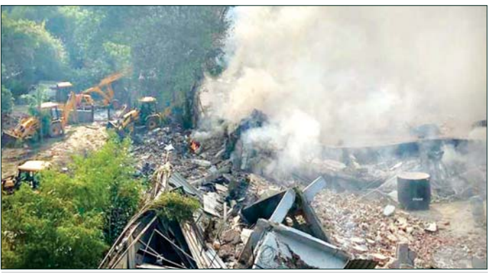
စက်ရုံမီးလောင်မှုဖြစ်ပွားခဲ့သည့်နေရာမှ မီးခိုးများ ထွက်ပေါ်နေစဉ်။

နယူးဒေလီမြို့တော်ဝန် အာမင်ကက်ဂျီဝယ်လ်က အခြေအနေများကို အနီးကပ် စစ်ဆေးဆောင်ရွက်နေကြောင်း ပြောကြားခဲ့သည်။ မီးလောင်မှုဖြစ်ပွားရသည့် အကြောင်းရင်းကို မသိရှိရသေးပေ။ ပြီးခဲ့သည့် လအတွင်းကလည်း မြို့တော်နယူးဒေလီရှိ အဆောက်အအုံဟောင်းတစ်ခု မီးလောင်မှုဖြစ်ပွားခဲ့ပြီး လူ ၄၃ ဦး သေဆုံးခဲ့သည်။ ဆင်ဟွာ