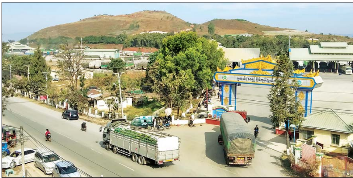
မူဆယ် (၁၀၅) မိုင် ကုန်သွယ်ရေးဇုန်အတွင်းသို့ ကုန်တင်ယာဉ်များ ဝင်ရောက်နေမှုအေးအေးကို တွေ့ရစဉ်။

တရုတ်နှစ်သစ်ကူး ပွဲတော်သည် ဇန်နဝါရီ ၂၅ ရက်တွင် ကျရောက်မည် ဖြစ်သောကြောင့် တရုတ်ကုန်သည် တချို့နှင့် စီးပွားရေးလုပ်ငန်းရှင်များ ကုန်သည်များအနေဖြင့် ကုန်ရောင်း ကုန်ဝယ်လုပ်ငန်းများကို ခေတ္တ ရပ်တန့် ပိတ်သိမ်း၍ မိဘဆွေမျိုး ညီအစ်ကို မောင်နှမများနှင့် မိသားစု များရှိရာ နေရာဒေသအသီးသီးသို့ ပြန်ကြွပြီဖြစ်သဖြင့် ရှမ်းပြည်နယ် မြောက်ပိုင်း မူဆယ်နယ်စပ်စီးပွားရေး ဇုန် မိုင်းယု (၁၀၅) မိုင် ကုန်သွယ်ရေး ဇုန်အတွင်းသို့ နှစ်နိုင်ငံဘက်မှ ကုန်တင်ယာဉ်များ ဝင်ရောက် သွားလာမှု သိသိသာသာလျော့နည်း သွားခဲ့သည်။