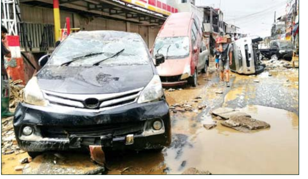
ဂျကာတာမြို့တွင် ရေကြီးမှုကြောင့် မြစ်ပေါ်ခဲ့သည့် အပျက်အစီးများကို တွေ့ရစဉ်။

အဆိုပါဒေသအတွင်း ရရှိသမျှသော သတင်းဓာတ်ပုံများသည်လည်း အိမ်များ၊ ကားများကို ရှိရေလွှမ်းမိုးနေသည့် ပုံများဖြစ်ကြသလို တချို့လည်း ရော်ဘာလှေများကို စီးကာ လိုရာခရီးသွားနေကြသည့် ပုံများဖြစ်သည်။