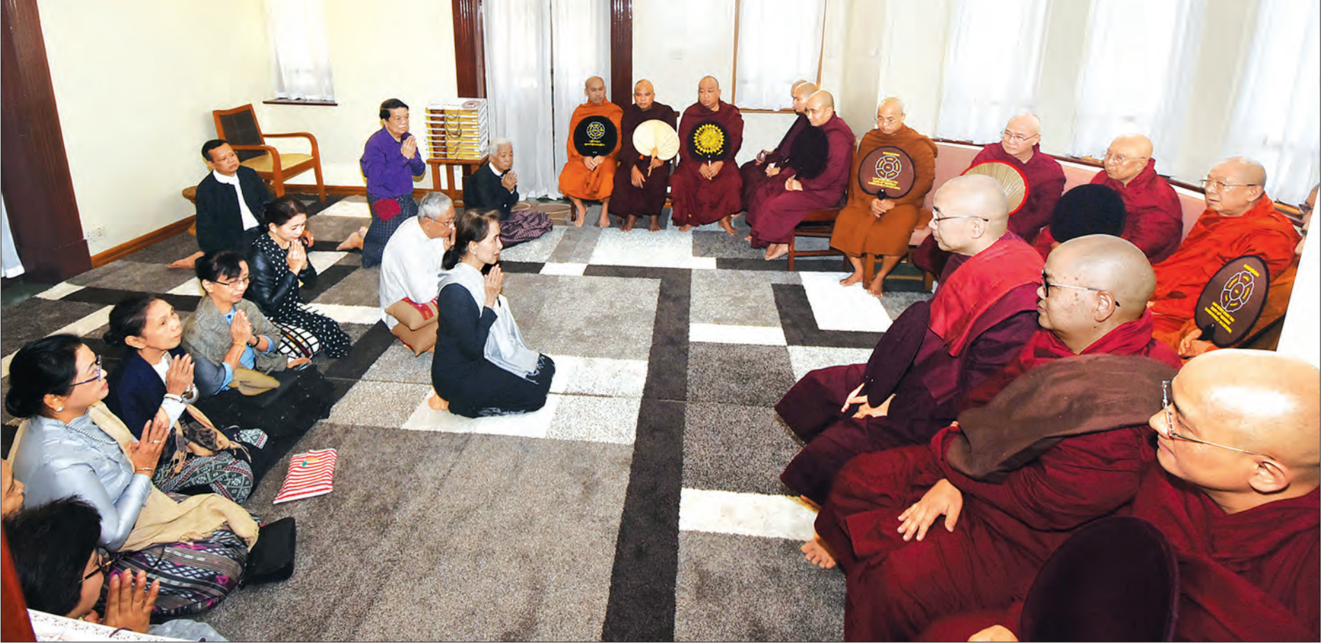
နိုင်ငံတော်၏အတိုင်ပင်ခံပုဂ္ဂိုလ် ဒေါ်အောင်ဆန်းစုကြည် မိခင်ကြီး ဒေါ်ခင်ကြည်အား ရည်စူး၍ ချမ်းမြေ့ရိပ်သာ ဆရာတော် အရှင်ဇနကာဘိဝံသ ထံမှ အနုမောဒနာတရားနာယူစဉ်။ သတင်းစဉ်

ရန်ကုန် ဒီဇင်ဘာ ၂၇ အမျိုးသားခေါင်းဆောင်ကြီး ဗိုလ်ချုပ်အောင်ဆန်း၏ဇနီး ဒေါ်ခင်ကြည် ကွယ်လွန်ခြင်း နှစ် ၃၀ ပြည့် နှစ်ပတ်လည် ဆွမ်းကျွေးအလှူကို ယနေ့ နံနက် ၁၀ နာရီက ရန်ကုန်မြို့ တက္ကသိုလ်ရိပ်သာလမ်း အမှတ် ၅၄ ရှိ သမီးဖြစ်သူ နိုင်ငံတော်၏ အတိုင်ပင်ခံပုဂ္ဂိုလ် ဒေါ်အောင်ဆန်းစုကြည်၏နေအိမ်၌ ပြုလုပ်သည်။ စာမျက်နှာ ၃ ကော်လံ ၁