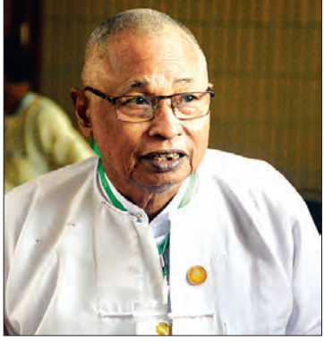
ဒေါက်တာဖြေ