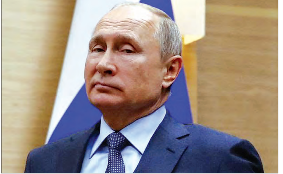
ရုရှားသမ္မတ ဗလာဒီမာပူတင်