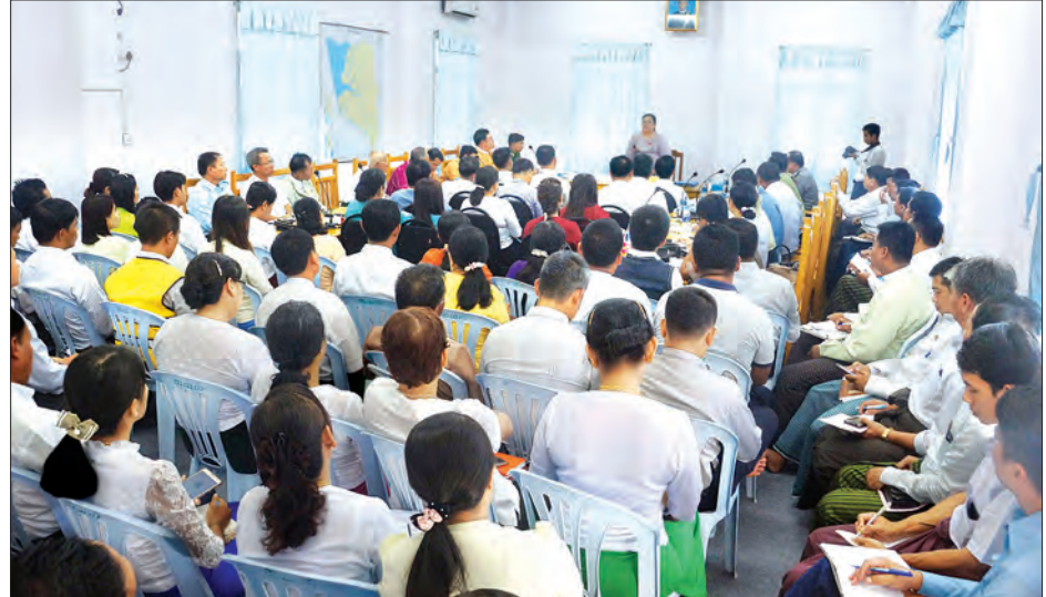
ဇော်မျိုးနိုင်