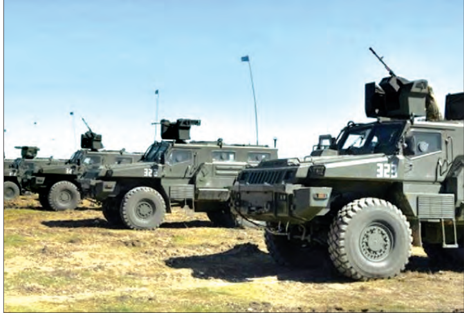
ကာတာနိုင်ငံက မာလီနိုင်ငံသို့ ပေးပို့မည့် သံချပ်ကာ ကားများကို တွေ့ရစဉ်။