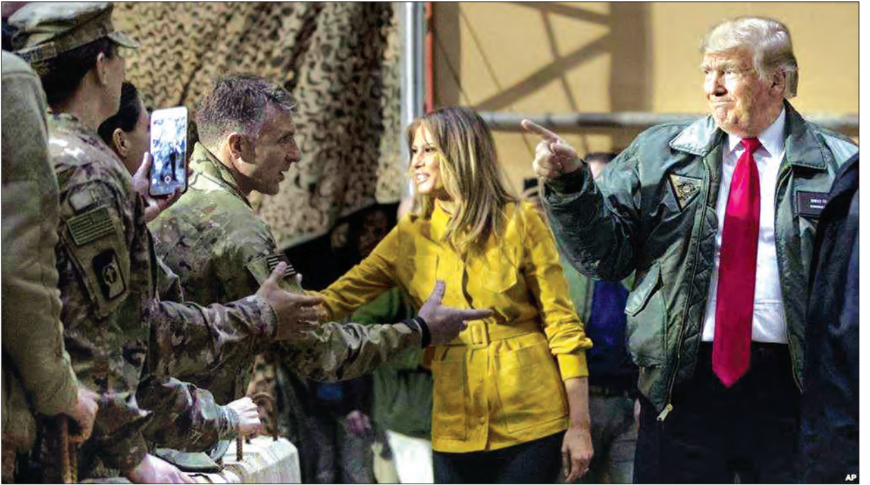
အမေရိကန်သမ္မတ ဒေါ်နယ်ထရမ်နှင့် သမ္မတကတော်တို့ အီရတ်ရှိ တပ်ဖွဲ့ဝင်များနှင့် တွေ့ဆုံစဉ်။

ဒေသတွင်း လက်ကျန်အိုင်အက်စ်စစ်သွေးကြွမှုနှင့်သမ္မတ ဒေါ်နယ်ထရမ်အတွက် လည်း တူရကီဘက်က သဘောတူခဲ့ကြောင်း အမေရိကန်သမ္မတ ဒေါ်နယ်ထရမ်က ပြောခဲ့သည်။