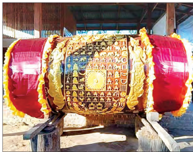
လက္ခဏာကို နတ်သားများ ပူဇော်နေသည့်ပုံကို ထည့်သွင်း၍ ကြည့်ညိဖြယ် ရာဖြစ်အောင် ပြုလုပ်ဆောင်ရွက်ထားကြောင်း သိရသည်။