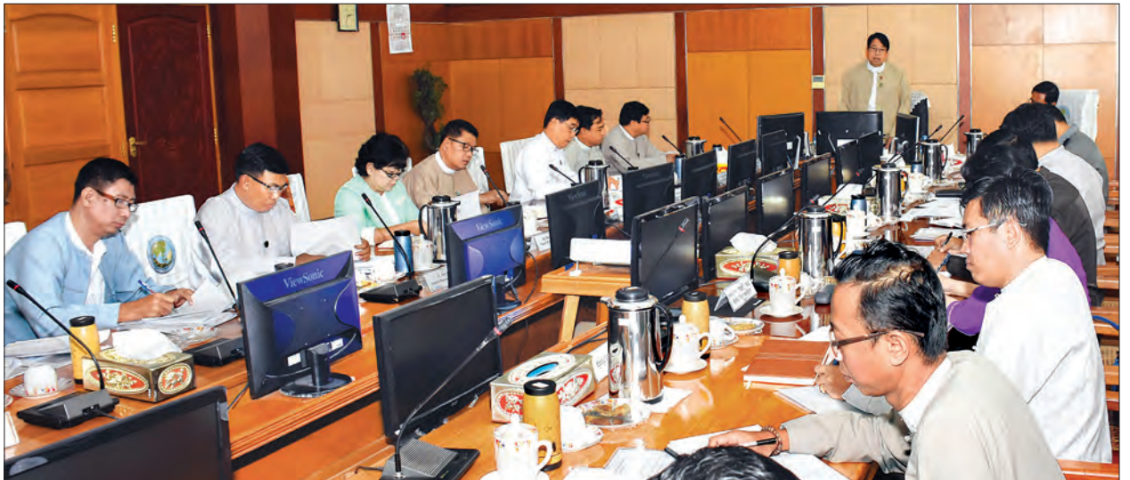
ပြည်ထောင်စုဝန်ကြီး ဒေါက်တာဇေမြိုင် ပြည်ပမှ ရုပ်ရှင်နှင့် မှတ်တမ်းရုပ်ရှင်ရိုက်ကူးရေးအဖွဲ့များ မြန်မာနိုင်ငံသို့ ပိုမိုလာရောက်ရိုက်ကူးနိုင်ရေးအတွက် ရိုက်ကွင်းကြေးနှင့် ဝန်ဆောင်ခများ ဖြေလျှော့နိုင်ရေး ညှိနှိုင်းအစည်းအဝေးတွင် ဆွေးနွေးပြောကြားစဉ်။

ယင်းနောက် ပြန်ကြားရေးနှင့် ပြည်သူ့ဆက်ဆံရေးဦးစီးဌာန ဒုတိယညွှန်ကြားရေး မှူးချုပ် ဒေါ်သီတာတင်က နိုင်ငံတကာမှ မြန်မာနိုင်ငံသို့ ရုပ်ရှင်၊ ဗီဒီယို၊ မှတ်တမ်းတင် ရုပ်မြင်သံကြားလာရောက်ရိုက်ကူးခြင်း အစီအစဉ်များ ဆောင်ရွက်လျက်ရှိသည့် အခြေအနေနှင့်စပ်လျဉ်း၍ ရှင်းလင်းတင်ပြပြီး ပြည်ထဲရေးဝန်ကြီးဌာန၊ သာသနာရေး