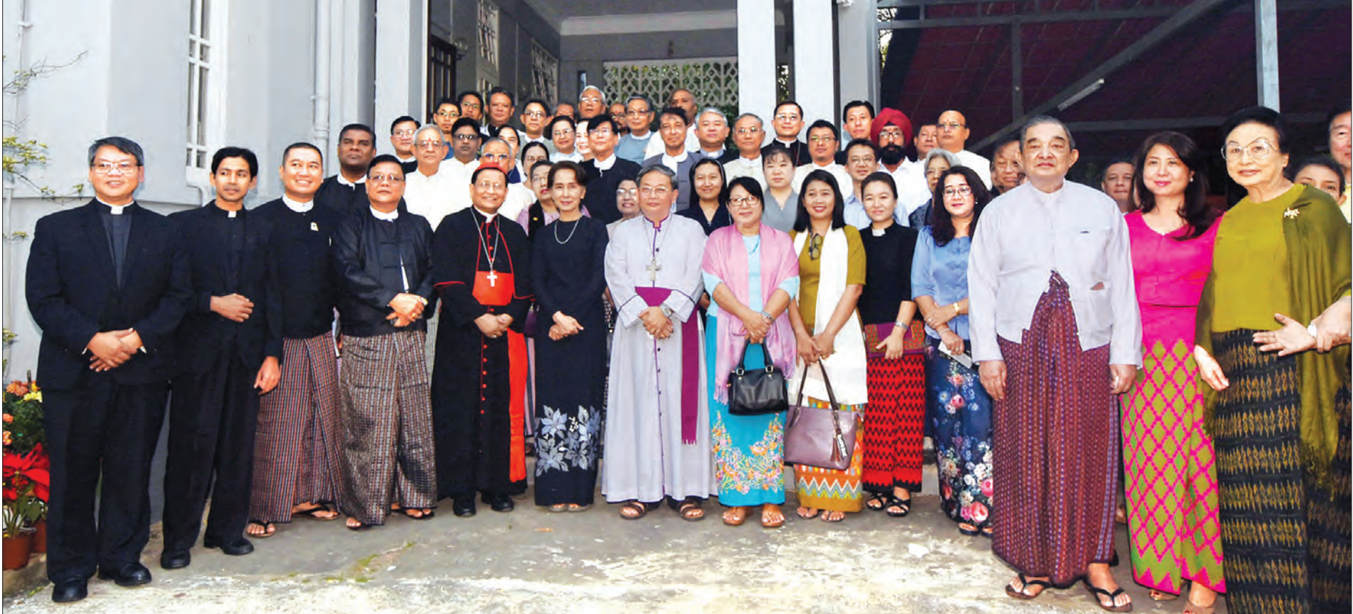
နိုင်ငံတော်၏အတိုင်ပင်ခံပုဂ္ဂိုလ် ဒေါ်အောင်ဆန်းစုကြည် မိခင်ကြီး ဒေါ်ခင်ကြည်အတွက် ဘာသာပေါင်းစုံ ဆုတောင်းခြင်းအခမ်းအနားသို့ တက်ရောက်လာကြသူများနှင့်အတူ စုပေါင်းမှတ်တမ်းတင်ဓာတ်ပုံရိုက်စဉ်။