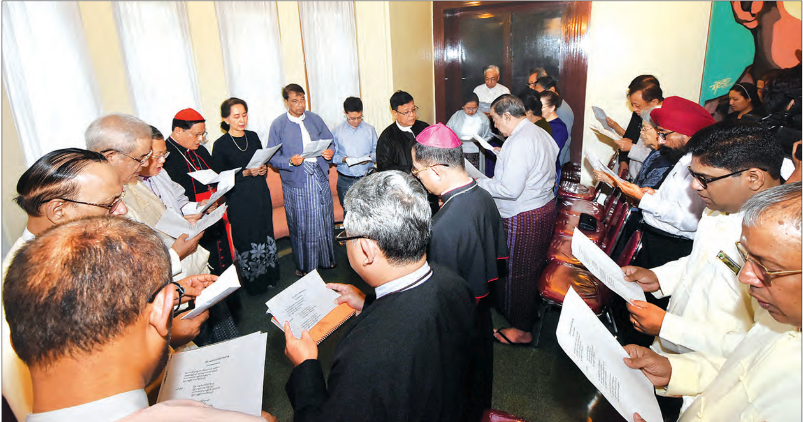
မိခင်ကြီး ဒေါ်ခင်ကြည်အတွက် ဘာသာပေါင်းစုံ ဆုတောင်းခြင်းအခမ်းအနားတွင် နိုင်ငံတော်၏အတိုင်ပင်ခံပုဂ္ဂိုလ် ဒေါ်အောင်ဆန်းစုကြည်နှင့် ဘာသာပေါင်းစုံ ဘာသာရေးခေါင်းဆောင်များက ဆုတောင်းမေတ္တာပို့သစဉ်။

နှစ်ပတ်လည်ဆွမ်းကျွေးအလှူတွင် နိုင်ငံတော်၏ အတိုင်ပင်ခံပုဂ္ဂိုလ်က မိခင်ကြီး ဒေါ်ခင်ကြည်အား ရည်စူး၍ ချမ်းမြေ့ရိပ်သာဆရာတော် အရှင်ဇနကာဘိဝံသ အမျိုးပြုသော သံဃာတော် ၁၆ ပါးတို့အား ပင့်ဖိတ်ကာ ဆွမ်းနှင့် သင်္ကန်းများ ဆက်ကပ်လှူဒါန်းပြီး အနုမောဒနာတရားနာယူကာ ရေစက်သွန်းလောင်း အမျှပေးဝေသည်။ မွန်းလွဲပိုင်းတွင် ဘာသာပေါင်းစုံမှ ဘာသာရေး ခေါင်းဆောင်များက နိုင်ငံတော်၏ အတိုင်ပင်ခံပုဂ္ဂိုလ် ဒေါ်အောင်ဆန်းစုကြည်၏ မိခင်ကြီး ဒေါ်ခင်ကြည်အတွက် ဘာသာအလိုက် အောက်မေ့ဖွယ်ရာ ဆုတောင်းမေတ္တာများ ပို့သကြသည်။ ဘာသာပေါင်းစုံ ဆုတောင်းခြင်းအခမ်းအနားတွင် ဟိန္ဒူဘာသာ၊ ခရစ်ယာန်ဘာသာ၊ အစ္စလာမ်ဘာသာ၊ ဂျူးဘာသာနှင့် ဘဟာအီတာသာတို့မှ ဘာသာရေးခေါင်းဆောင်များက မေတ္တာစကားပြောကြားခြင်းနှင့် ဆုတောင်းမေတ္တာပို့သခြင်းများကို ပြုလုပ်ခဲ့ကြသည်။