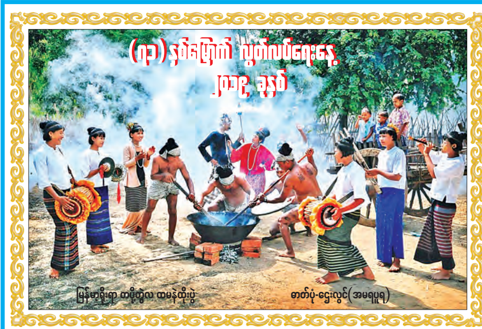
(၇၃) နှစ်မြောက် ပွဲတော်ပွဲများ ၂၀၁၉ ခုနှစ်