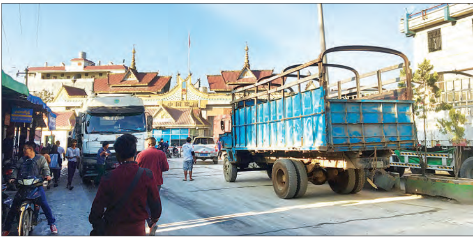
လမ်းပိတ်ဆို့မှုဖြစ်ပေါ်ခဲ့သည့်ယာဉ်များ ဝမ်းတိန်ဂိတ်ဖွင့်လှစ်ပေးမှုကြောင့် ပြန်လည်ဖြတ်သန်းသွားလာသည့်ယာဉ်များကို တွေ့ရစဉ်။

တရုတ်နိုင်ငံအတွင်းသို့ ကုန်စည်တင်ပို့ရန်အတွက် သွားရောက် လျက်ရှိသည့် ကုန်တင်ယာဉ်ကြီးများသည် နယ်စပ်ဝင်ပေါက်ဂိတ် များတွင် လုံခြုံရေးတင်းကြပ်မှုကြောင့် ယာဉ်စီးရေ ၂၀၀၀ ကျော် မှာ လမ်းကြောင်းတွင် ၇ နာရီခန့် ပိတ်ဆို့ခဲ့သော်လည်း ဒေသ အာဏာပိုင်များ၏ ညှိနှိုင်းမှုဖြင့် ဝမ်းတိန်ဂိတ်ကို ဖွင့်လှစ်ပေးခဲ့မှု ကြောင့် ဒီဇင်ဘာ ၂၇ ရက် ညပိုင်းတွင် အဆင်ပြေစွာ ဖြတ်သန်း သွားလာနိုင်ခဲ့ကြောင်း သိရသည်။