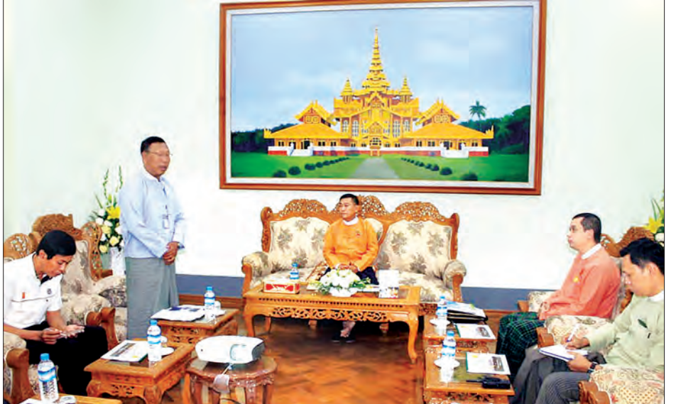
ဟိန်းထက် (ပဲခူး)

အတွင်း လျှပ်စစ်နှင့်စွမ်းအင်ဝန်ကြီးဌာနနှင့် Pacific Hunt Energy Co., Ltd တို့ ပူးပေါင်း၍ ရေနံစမ်းသပ်ရှာဖွေခြင်း လုပ်ငန်းများ ပြည်သူ့အကျိုးပြုလုပ်ငန်းများ ဆောင်ရွက်ခဲ့မှု အပေါ် ကြိုဆိုကြောင်း၊ CSR လုပ်ငန်းများနှင့် ပတ်သက်၍ မိမိတို့တိုင်းဒေသကြီးတွင်လည်း ကော်မတီတစ်ရပ်ဖွဲ့စည်းထား ပြီးဖြစ်၍ နောက်ပိုင်း CSR လုပ်ငန်းများနှင့် ပတ်သက်၍ လုပ်ငန်းစီမံချက် တင်ပြပေးရန်လိုအပ်ကြောင်းနှင့် ဥပဒေနှင့် အညီ ဒေသခံပြည်သူများ နှစ်နာမှစ၍စေရေး ဦးစားပေးဆောင် ရွက်ရန်လိုအပ်ကြောင်း ပြန်လည်ပြောကြားခဲ့သည်။ (ယာပုံ) တွေ့ဆုံပွဲသို့ တိုင်းဒေသကြီးဝန်ကြီးချုပ်၊ ဝန်ကြီးဒေါက်တာ စောညိုဝင်း၊ အစိုးရအဖွဲ့ ညွှန်ကြားရေးမှူး၊ သက်ဆိုင်ရာ တိုင်းဒေသကြီးအဆင့် ဌာနဆိုင်ရာများ၊ Pacific Hunt Energy Co., Ltd မှ တာဝန်ရှိသူများ တက်ရောက်ခဲ့ကြောင်း သိရသည်။