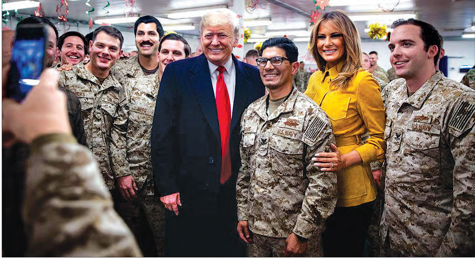
အမေရိကန်သမ္မတ ဒေါ်နယ်ထရမ် အီရတ်ရှိ အမေရိကန်တပ်ဖွဲ့ဝင်များနှင့် မှတ်တမ်းတင်ဓာတ်ပုံရိုက်နေစဉ်။

အမေရိကန်သမ္မတ ဒေါ်နယ်ထရမ်ဟာ ၎င်းရဲ့အကြံပေးပုဂ္ဂိုလ်က ကန့်ကွက်ပေးမယ်လည်း ဆီးရီးယားနဲ့အာဖဂန်မှာချထားတဲ့ အမေရိကန်တပ်ဖွဲ့ဝင်တွေကို ရုပ်သိမ်းတော့မယ့်အကြောင်း ကြေညာလိုက်ပြီးတဲ့နောက် ရက်ပိုင်းလောက်အကြာမှာပဲ အီရတ်မှာရှိနေတဲ့ အမေရိကန်တပ်ဖွဲ့ဝင်တွေဆီကို မမျှော်လင့်ဘဲ အလည်အပတ်ရောက်ရှိလို့ လာခဲ့ပါတယ်။ တိုက်ပွဲတွေဖြစ်ပွားရာနေရာအတွင်းမှာ တပ်ဖွဲ့ထားကြတဲ့ တပ်ဖွဲ့ဝင်တွေဆီကို ပထမ ဆုံးအကြိမ် အလည်အပတ်ခရီးစဉ်အဖြစ် ရောက်လာခဲ့တာ ဖြစ်ပါတယ်။