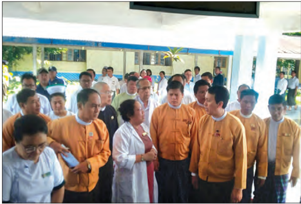
လှလှထွေး(ပြန်/ဆက်)

ရန်ကုန် ဒီဇင်ဘာ ၂၇ ရန်ကုန်တိုင်းဒေသကြီး ဒဂုံမြို့သစ် အရှေ့ပိုင်းမြို့နယ် ထောင်တလတ်ရပ်ကွက် မြို့ရောင် လမ်းရှိ စိတ်ကျန်းမာရေးဆေးရုံသို့ တိုင်းဒေသကြီး ဝန်ကြီးချုပ် ဦးမြိုးမင်းသိန်း၊ တိုင်းဒေသကြီးလွှတ်တော်ဥက္ကဋ္ဌ ဦးတင်မောင်ထွန်း၊ လူမှုရေးဝန်ကြီး ဦးနိုင်ငံလင်း၊ ဒဂုံမြို့သစ်အရှေ့ပိုင်းမြို့နယ် ပြည်သူ့လွှတ်တော် ကိုယ်စားလှယ် ဦးနေကျော်၊ တိုင်းဒေသကြီး လွှတ်တော်ကိုယ်စားလှယ်(၁) ဦးကျော်ကျော်မောင်၊ ဒဂုံတောင်မြို့နယ် တိုင်းဒေသကြီး လွှတ်တော်ကိုယ်စားလှယ်(၁) ဦးညီညီနှင့်အဖွဲ့ ယမန်နေ့နံနက်က ရောက်ရှိလာပြီး ဆေးရုံအုပ်ကြီး ဒေါက်တာ ဒေါ်တင်တင်ဝင်းနှင့် တွေ့ဆုံကာ ဆေးရုံဝင်း အတွင်း မီးလောင်ခဲ့သည့်နေရာနှင့် လူနာဆောင်များကို လှည့်လည်ကြည့်ရှုခဲ့ပြီး ဝန်ကြီးချုပ်က ပျက်စီးခဲ့သည့်နေရာများကို အမြန်ပြန်လည် ပြုပြင်သွားရန်နှင့် လိုအပ်သည်များ မှာကြားခဲ့ကြောင်း သိရသည်။ (ယာပုံ)