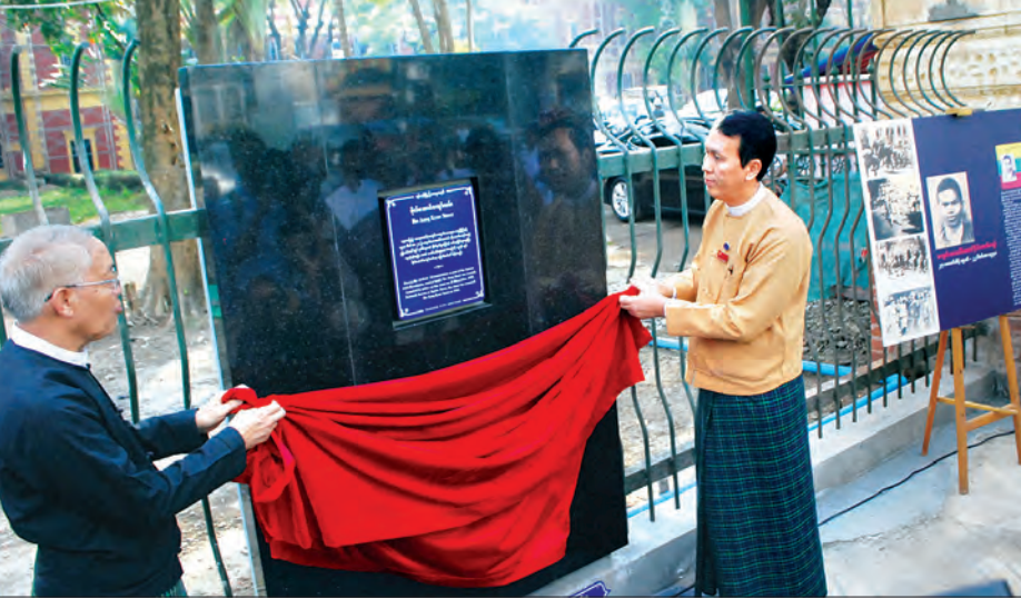
ပိုလ်အောင်ကျော်လမ်းရှိ ပိုလ်အောင်ကျော်လမ်းမ၌တပ်ဆင်သော ရန်ကုန်မြို့ပြအမွေအနှစ်ထိန်းသိမ်းစောင့်ရှောက်ရေးအဖွဲ့၏ အပြာရောင်ကမ္ဘည်းပြားအား ရန်ကုန်တိုင်းဒေသကြီးဝန်ကြီးချုပ် ဦးဖြိုးမင်းသိန်းနှင့် တာဝန်ရှိသူတစ်ဦးက ဖွင့်လှစ်ပေးစဉ်။

နေရာကျကျ မိုးထစ်ချွန်းရွာမည် နေပြည်တော် ဒီဇင်ဘာ ၂၀ စစ်ကိုင်းတိုင်းဒေသကြီးအထက်ပိုင်း၊ ရှမ်းပြည်နယ်မြောက်ပိုင်းနှင့် ချင်းပြည်နယ်တို့တွင် တိမ်အသင့်အတင့် ဖြစ်ထွန်းမည်။ စစ်ကိုင်းတိုင်းဒေသကြီးအောက်ပိုင်း၊ မန္တလေးတိုင်းဒေသကြီး၊ ကချင်ပြည်နယ်၊ ကရင်ပြည်နယ်နှင့် မွန်ပြည်နယ်တို့တွင် နေရာကွက်ကျားနှင့် ကျန်တိုင်းဒေသကြီးနှင့် ပြည်နယ်တို့တွင် နေရာကျကျမိုးထစ်ချွန်းရွာမည်။ ရွာရန်ရာနှုန်း ၈၀ ဖြစ်သည်။ မိုး/ဇလ