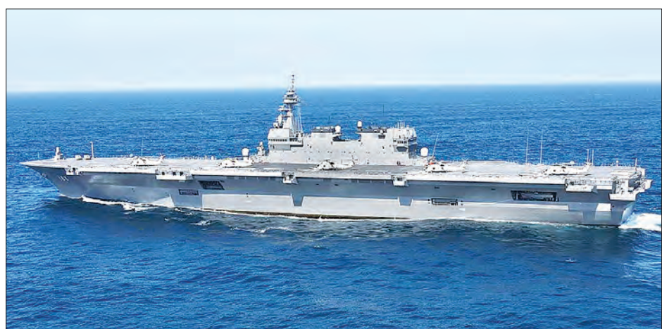
ဂျပန်ရေကြောင်းကာကွယ်ရေးတပ်ဖွဲ့၏ အကြီးဆုံးဗျက်သင်္ဘော အီဇူမို

အဆိုပါလေ့ကျင့်မှုတွင် ဂျပန်ရေကြောင်းကာကွယ်ရေး တပ်ဖွဲ့၏ အကြီးဆုံးဗျက်သင်္ဘောဖြစ်သည့် အီဇူမို၊ ဗြိတိန်၏ HMS Argyll သင်္ဘောနှင့် အမေရိကန်ရေတပ်သင်္ဘော တစ်စင်းတို့ ပါဝင်စစ်ရေးလေ့ကျင့်သွားမည်ဖြစ်ကြောင်း ဂျပန် ရေကြောင်းကာကွယ်ရေးတပ်ဖွဲ့က ပြောကြားခဲ့သည်။