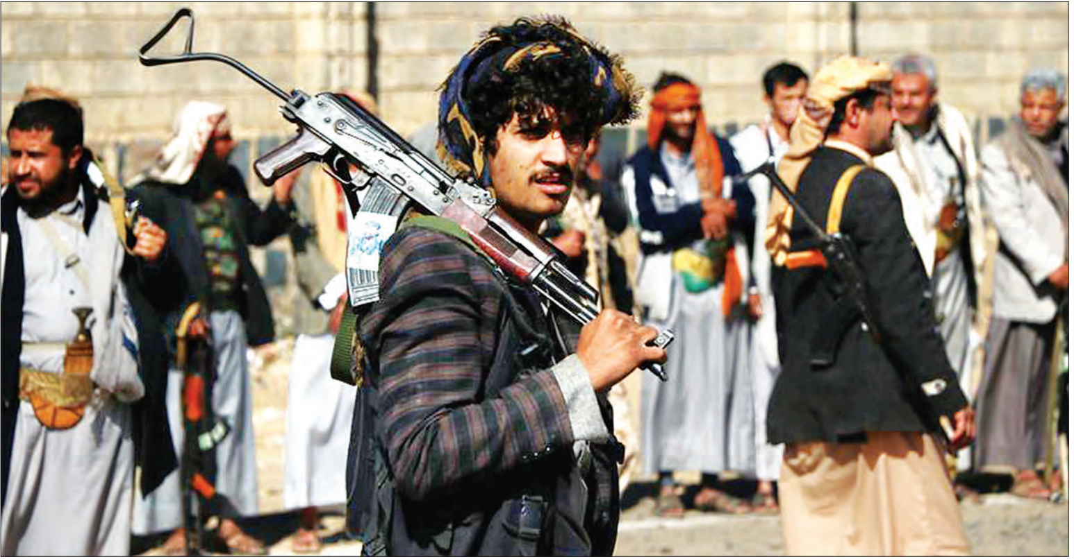
အပစ်အခတ်ရပ်စဲရေးကို ထောက်ခံသည့် လူထုဝေးပွဲတွင် ပါဝင်ခဲ့ကြသည့် ဟူသီသုပုန်အဖွဲ့သားများကို တွေ့ရစဉ်။

ယီမင်ရဲ့ အချက်အချာဖြစ်တဲ့ ဟိုဒေးဒါဆိပ်ကမ်းမြို့မှာ ကုလသမဂ္ဂက ကြားဝင်စေ့စပ်ညှိနှိုင်းမှု ပြုလုပ်ထားတဲ့ အပစ်အခတ်ရပ်စဲရေး သဘောတူညီမှု စတင်သက်ရောက်တဲ့ ပထမနေ့ကို စစ်မက်ဖြစ်ပွားနေတဲ့ နှစ်ဖက် အဖွဲ့အစည်းတွေက လေ့လာစောင့်ကြည့်နေကြပါတယ်။