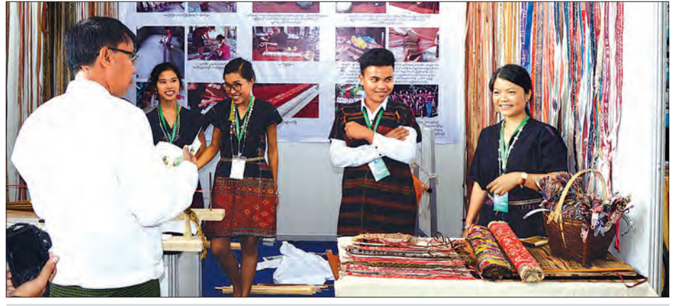
ဓာတ်ပုံမြင်ကွင်း ၂၀၁၈ ခုနှစ် အခမ်းအနားတွင် ခင်းကျင်းပြသထားသည့် ဓာတ်ပုံမြင်ကွင်းများကို တွေ့ရစဉ်။ သတင်းစဉ်