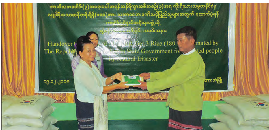
အာဆီယံအပေါင်း(၃) အရေးပေါ် အရန် ဆန်ရိက္ခာအစီအစဉ်အရ ပထမအကြိမ်အဖြစ် ဂျပန်နိုင်ငံမှ ဆန်တန် ၈၀ ကို ပြည်နယ်အတွင်း ပြီးခဲ့သည့်မိုးကာလ က ရေကြီးနစ်မြုပ်ခဲ့သည့် ယာယီရေးဘေးကယ်ဆယ်ရေး စခန်းများသို့ လက်လှမ်းမီသော သဘာဝဘေးဒဏ်သင့်ပြည်သူများအတွက် ဆက်လက်ဖြန့်ဝေသွားမည်ဖြစ်ကြောင်း သိရသည်။ နေမျိုးလွင်(ပြန်/ဆက်)

ဘားအံ ဒီဇင်ဘာ ၂၀ ကရင်ပြည်နယ်အတွင်းသဘာဝဘေးဒဏ်သင့်ပြည်သူများအတွက် အာဆီယံအပေါင်း(၃) အရေးပေါ် အရန်ဆန်ရိက္ခာအစီအစဉ်(၃)အရ ကိုရီးယားသမ္မတနိုင်ငံမှ လှူဒါန်းသော ဆန်တန်ချိန် ၁၈၀ အား ကရင်ပြည်နယ် အစိုးရအဖွဲ့ထံသို့ လွှဲပြောင်းပေးအပ်ပွဲကို ယမန်နေ့က ကရင်ပြည်နယ်အစိုးရအဖွဲ့ရုံး အစည်းအဝေးခန်းမ၌ ပြုလုပ်သည်။