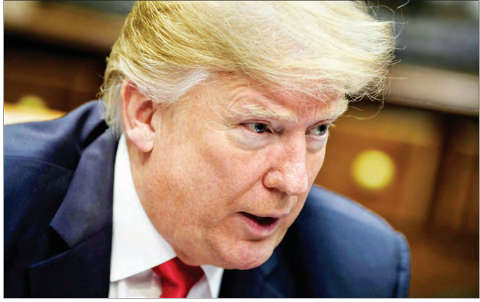
အမေရိကန်သမ္မတ ဒေါ်နယ်ထရမ်