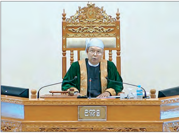
အမျိုးသားလွှတ်တော်ဥက္ကဋ္ဌ မန်းဝင်းခိုင်သန်း

အစည်းအဝေးတွင် မွန်ပြည်နယ် မဲဆန္ဒနယ် အမှတ်(၆)မှ ဦးဖေတင်၏ မြန်မာ့မီးရထားကဏ္ဍ အောင်မြင်စွာအောင်မြင်စေရေးအတွက် လက်ရှိရင်ဆိုင်နေရသော အခက်အခဲများနှင့် ကျဆင်းနေရမှုတို့ကို ရပ်တန့်ကျော်လွှားပြီး ရှေးယခင်အစဉ်အလာကောင်းများ ရရှိခဲ့သည့် မြန်မာ့မီးရထားကို ပြည်သူများ နှစ်ခြိုက်ချမ်းမြေ့စွာ ပြန်လည်အားပေးလာကြစေရေးအတွက် အစီအစဉ်ကောင်းများ ပြုလုပ်ဆောင်ရွက်ပေးရန် စီမံကိန်းများ ရှိ၊ မရှိ သိရှိလိုခြင်းမေးခွန်းနှင့် စပ်လျဉ်း၍ ပို့ဆောင်ရေးနှင့် ဆက်သွယ်ရေးဝန်ကြီးဌာန ပြည်ထောင်စုဝန်ကြီး ဦးသန်းစင်မောင်က Transport Policy ၁၂ ချက်တွင် အရေးကြီးသည့်အချက်မှာ ထိရောက်စေဖို့ပေးပြီး စရိတ်သက်သာသည့် သယ်ယူပို့ဆောင်ရေး စနစ် တည်ထောင်ရန်ဟူ၍ ချမှတ်ထားပါကြောင်း၊ ထို့ပြင် လွှတ်လပ်သည့် ယှဉ်ပြိုင်မှု ဈေးကွက်ဖြစ်ရန် လိုအပ်ပါကြောင်း၊ မော်တော်ကား၊ ရထား၊ ရေကြောင်းနှင့် လေကြောင်းတို့ကို ပြည်သူလူထုမှ ရွေးချယ်နိုင်လောက်သည့် အခွင့်အလမ်းများအား အစိုးရက ဖန်တီးပေးရမည်ဖြစ်ပါကြောင်း၊ အဆိုပါကိစ္စရပ်များကို အချိန်ယူဆောင်ရွက်သွားရမည်ဖြစ်ပြီး အကောင်းဆုံး၊ အချောတန်ဆုံးနှင့် အကျိုးရှိထိရောက်သော ရင်းနှီးမြှုပ်နှံမှုဖြစ်စေရန် ဆောင်ရွက်နေပါကြောင်း ပြောကြားသည်။