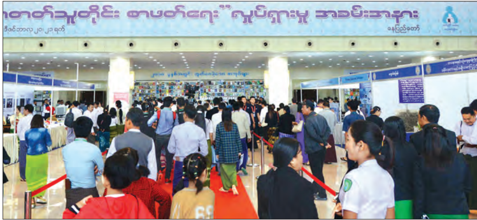
ဓာတ်ပုံမြင်ကွင်း ၂၀၁၈ ခုနှစ် အခမ်းအနား တက်ရောက်လာကြသူများကို တွေ့ရစဉ်။ သတင်းစဉ်