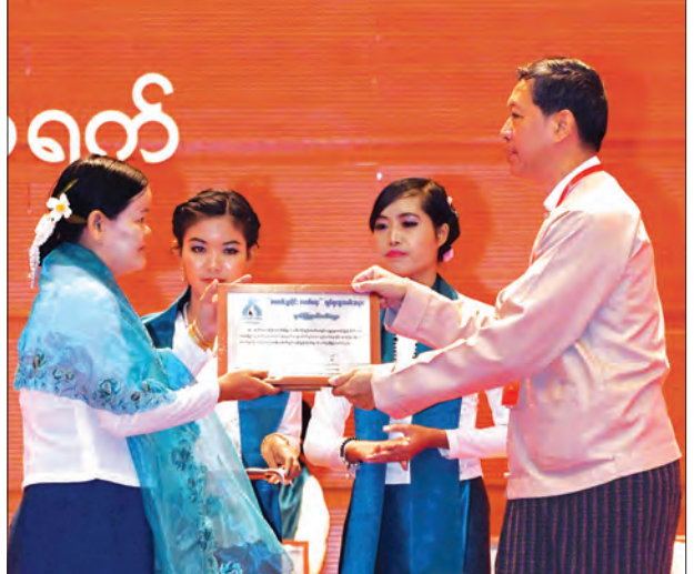
ပြည်ထောင်စုဝန်ကြီး ဒေါက်တာမျိုးသိမ်းကြီး ဆန်းသစ်တီထွင် စာကြည့်တိုက်ဆုများ ပေးအပ်ချီးမြှင့်စဉ်။

အရွယ်နှင့် လက်တွေ့ဘဝ သဘာဝကိုလိုက်၍ အမျိုးအစားခွဲခြားကြည့်ပါကြောင်း၊ ထိုသို့ခွဲခြားရာတွင် စာသင်သားအရွယ်၊ အလုပ်လုပ်သည့်အရွယ်နှင့် အလုပ်နားသည့်အရွယ်ဟူ၍ သုံးမျိုးတွေရပါကြောင်း၊ စာသင်သားအရွယ်ဆိုသည်မှာ ကလေးသူငယ်များနှင့် လူငယ်များ ပါဝင်ပါကြောင်း၊ အလုပ်လုပ်သည့် အရွယ်ဆိုသည်မှာ အလုပ်လုပ်နိုင်သည့် လူငယ်လူရွယ်၊ လူလတ်များနှင့် အလုပ်လုပ်နေနိုင်သည့် လူကြီးများ ပါဝင်ပါကြောင်း၊ အလုပ်မလုပ်တော့သည့် အရွယ်ဆိုသည်မှာ လူ့ဘဝ၌ ပြည့်စုံ၍ဖြစ်စေ၊ ဝန်ထမ်းဆိုလျှင် ပင်စင်ယူသွား၍ဖြစ်စေ အလုပ်မလုပ်တော့ဘဲ အချိန်ပို၊ အချိန်အားကျန်းမာနေဆဲအရွယ်ဖြစ်ပါကြောင်း။