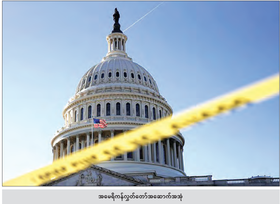
အမေရိကန်လွှတ်တော်အဆောက်အအုံ