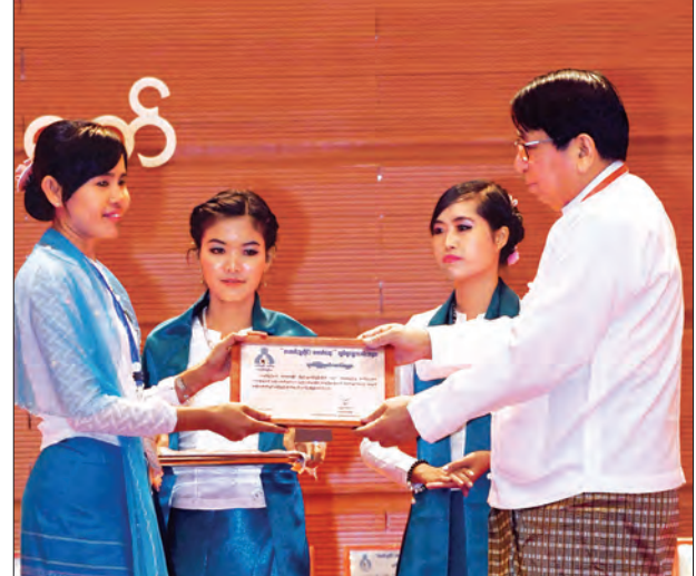
ပြည်ထောင်စုဝန်ကြီး ဒေါက်တာဖေမြင့် ဆန်းသစ်တီထွင် စာကြည့်တိုက်ဆုများ ပေးအပ်ချီးမြှင့်စဉ်။