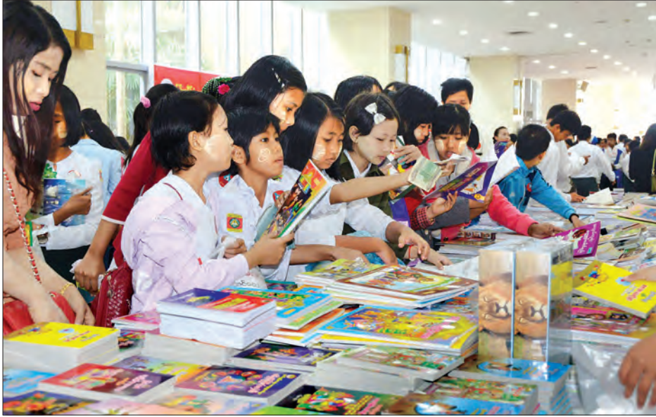
ဓာတ်ပုံမြင်ကွင်း ၂၀၁၈ ခုနှစ် အခမ်းအနားတွင် ကျောင်းသား ကျောင်းသူများ စာအုပ်များ ဝယ်ယူအားပေးနေကြစဉ်။ သတင်းစဉ်