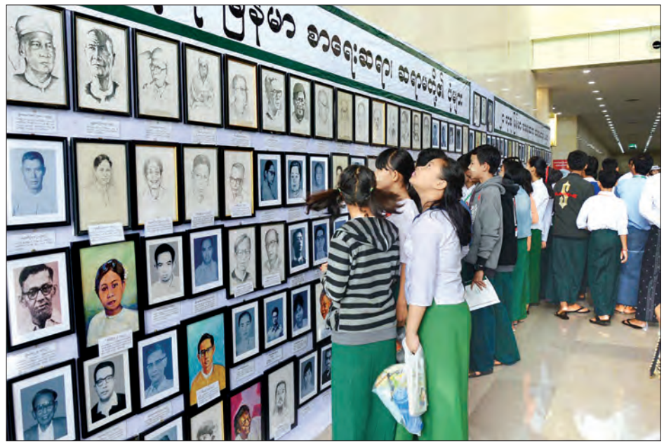
ဓာတ်ပုံမြင်ကွင်း ၂၀၁၈ ခုနှစ် အခမ်းအနားတွင် ပြသထားသောပြခန်းများအား ကျောင်းသား ကျောင်းသူများ စိတ်ပါဝင်စားစွာ ကြည့်ရှုနေကြစဉ်။ သတင်းစဉ်