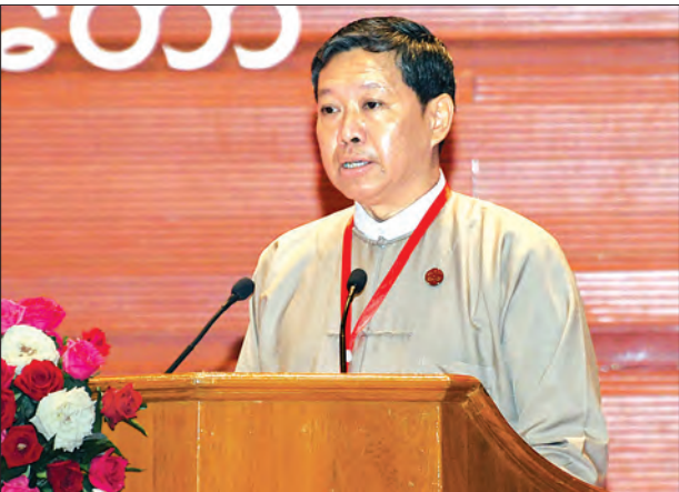
ပြည်ထောင်စုဝန်ကြီး ဒေါက်တာမျိုးသိမ်းကြီး စာတတ်သူတိုင်း စာဖတ်ရေး လှုပ်ရှားမှုအခမ်းအနားတွင် နှုတ်ခွန်းဆက်စကားပြောကြားစဉ်။

စာတတ်သူတိုင်း စာဖတ်ရေး လှုပ်ရှားမှုအခမ်းအနား ဒုတိယနေ့ ဒီဇင်ဘာ ၂၁ ရက်တွင် အခြေခံပညာကဏ္ဍ၌ ကျောင်းစာကြည့်တိုက်များဖွံ့ဖြိုးရေးနှင့် စာဖတ်ရရှိ နိုင်ရေး ဆောင်ရွက်ချက်များစာတမ်း၊ လူငယ်နှင့် စာကြည့်တိုက်ယဉ်ကျေးမှုစာတမ်း၊ ပြည်သူများ စာဖတ်ရရှိနိုင်ရေးအတွက် ဆောင်ရွက်သင့်သည့် လုပ်ငန်းများ