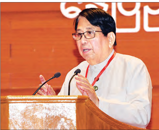
စာတတ်သူတိုင်း စာဖတ်ရေးလှုပ်ရှားမှုအခမ်းအနားတွင် ပြည်ထောင်စုဝန်ကြီး ဒေါက်တာဖေမြင့် နှုတ်ခွန်းဆက်စကားပြောကြားစဉ်။

အထူးသဖြင့် မူလတန်းအရွယ် ကျောင်းသား ကျောင်းသူများ စာဖတ်တတ်သည့် အလေ့အထကောင်းများ အားပေးရန် အရေးကြီးသည့်အတွက် မူလတန်းကျောင်းများတွင် စာကြည့်တိုက်များ ဖွင့်လှစ်နိုင်ရေးအတွက် တိုးချဲ့စီစဉ်နေပါကြောင်း၊ အထူးသဖြင့် ဒေါ်ခင်ကြည်ဖောင်ဒေးရှင်းနှင့် ပူးပေါင်းပြီး စာကြည့်တိုက်များ တိုးချဲ့ပြီး ဆောင်ရွက်သွားမည်ဖြစ်ပါကြောင်း။