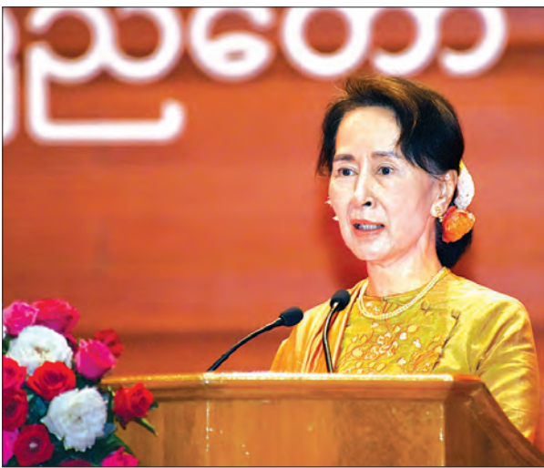
နိုင်ငံတော်၏အတိုင်ပင်ခံပုဂ္ဂိုလ် ဒေါ်အောင်ဆန်းစုကြည်

တချို့က ဖတ်လိုက်၊ ဟိုကြည့်လိုက် ဒီကြည့်လိုက် ဘယ်တော့များ ဖတ်လို့ ပြီးပါ့မလား။ ဖတ်ချိန်မကုန်သေးဘူးလား။ အဲဒီလိုဟာတွေလည်း မြင်ရတယ်။ ဒါကတော့ ဝီပဲ။ ဝီပဲကတော့ ကျွန်မတို့ လုံးဝပြောင်းလဲလို့ မရဘူး။ သို့သော်လည်း သိပ္ပံပညာရှင်တွေပြောတယ်။ DNA တောင်မှ တစ်ဘဝအတွင်းမှာ ပြောင်းသွားနိုင်တယ်