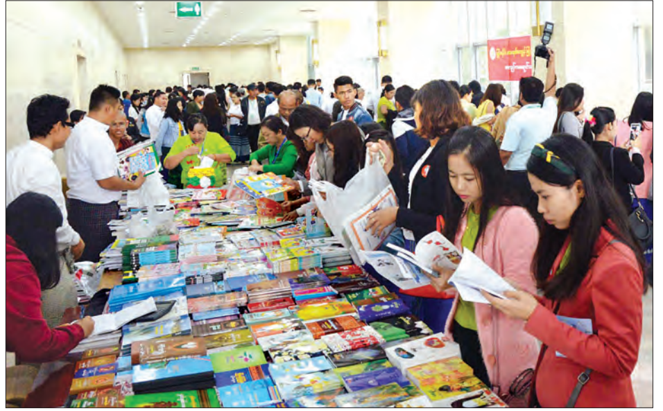
ဓာတ်ပုံမြင်ကွင်း ၂၀၁၈ ခုနှစ် အခမ်းအနားတွင် ကျောင်းသား ကျောင်းသူများ စာအုပ်များ ဝယ်ယူအားပေးနေကြစဉ်။ သတင်းစဉ်

ဓာတ်ပုံမြင်ကွင်း ၂၀၁၈ ခုနှစ် အခမ်းအနားရှိ ကလေးမိတ်ဆွေ ဓာတ်ပုံမြင်ကွင်း ပြခန်း၌ ကျောင်းသား ကျောင်းသူလေးများ ပုံပြောနေသည် ကို တွေ့ရစဉ်။ သတင်းစဉ်