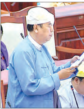
ဒုတိယဝန်ကြီး ဦးဝင်းမော်ထွန်း

အစည်းအဝေးတွင် မိုင်းတုံ မဲဆန္ဒနယ်မှ ဦးအောင်ကျော်မိုး(ခ) ဦးကျော်ဦး၏ တိုင်းရင်းသားလူမျိုးများရေးရာဝန်ကြီးဌာန၏ ပြည်နယ်၊ တိုင်းများတွင် ရုံးခွဲများ ဖွင့်လှစ်မှုအခြေအနေ၊ ရာထူးအလိုက်၊ လူမျိုးအလိုက်ဝန်ထမ်းများခန့်ထားမှုအခြေအနေနှင့် ဝန်ထမ်းအင်အားအခြေအနေ၊ ဝန်ထမ်းများ ဆောင်ရွက်လျက်ရှိသော လုပ်ငန်းတာဝန်များ၊ ရုံးခွဲများ မဖွင့်နိုင်သေးသည့် ပြည်နယ်၊ တိုင်းများအတွက် ဆက်လက်ဆောင်ရွက်သွားမည့် အစီအစဉ်ကို သိလိုခြင်းနှင့် စပ်လျဉ်း၍ တိုင်းရင်းသားလူမျိုးများရေးရာ ဝန်ကြီးဌာန ဒုတိယဝန်ကြီး ဦးလှမော်ဦးက တိုင်းရင်းသားလူမျိုးများရေးရာဝန်ကြီးဌာနကို ၂၀၁၆ ခုနှစ် မတ် ၃၀ ရက်တွင် စတင် ဖွဲ့စည်းဆောင်ရွက်ခဲ့ပါကြောင်း၊ တိုင်းရင်းသားလူမျိုးများရေးရာဝန်ကြီးဌာနကို ပြည်ထောင်စုဝန်ကြီးရုံး၊ တိုင်းရင်းသားစာပေနှင့် ယဉ်ကျေးမှုဦးစီးဌာနနှင့် တိုင်းရင်းသားအခွင့်အရေးများ ကာကွယ်စောင့်ရှောက်ရေး ဦးစီးဌာနတို့ဖြင့် ၂၀၁၆ ခုနှစ် ဇူလိုင် ၂၀ ရက်တွင် အရာထမ်း ၃၇၀၊ အမှုထမ်း ၇၆၁ ဦး စုစုပေါင်း ၁၁၃၁ ဦးတို့ဖြင့် ဖွဲ့စည်းခဲ့ခြင်းဖြစ်ပါကြောင်း။