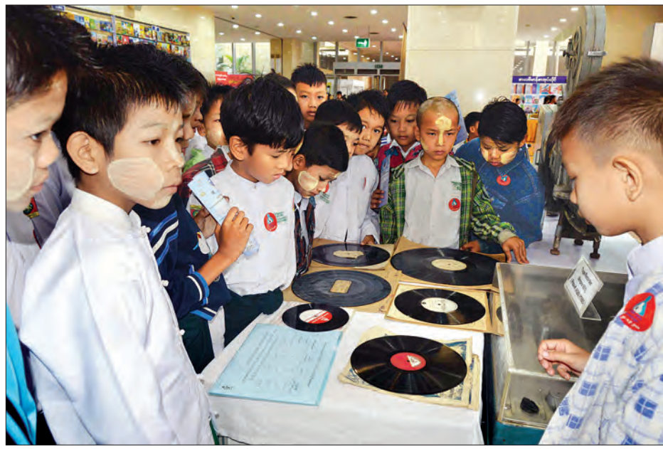
ဓာတ်ပုံမြင်ကွင်း ၂၀၁၈ ခုနှစ် အခမ်းအနားတွင် ပြသထားသောပြခန်းများအား ကျောင်းသား ကျောင်းသူများ စိတ်ပါဝင်စားစွာ ကြည့်ရှုနေကြစဉ်။ သတင်းစဉ်