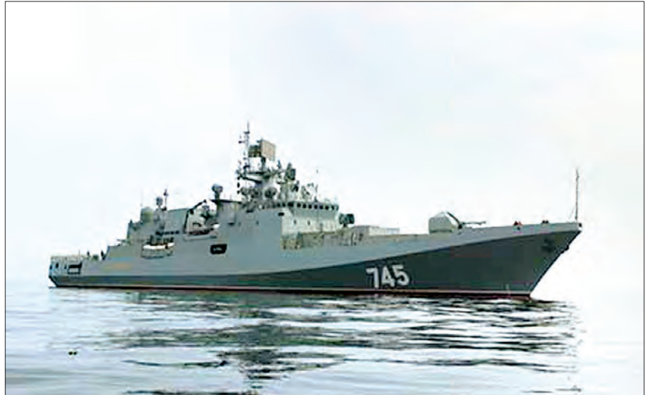
ဖရီးဂိတ်စစ်သင်္ဘောတစ်စင်းကို တွေ့ရစဉ်။