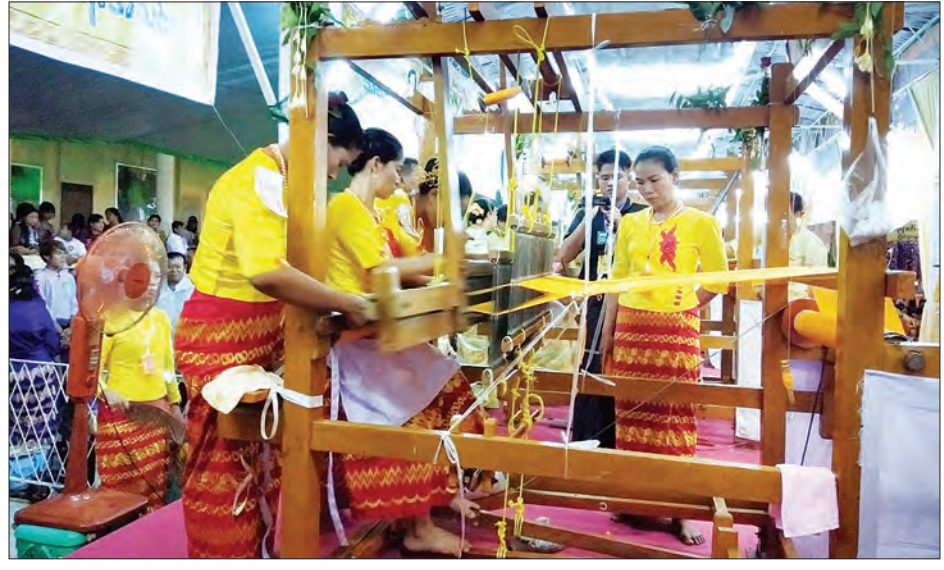
ရွှေတိဂုံစေတီတော်မြတ်ကြီး၏ (၃၄) ကြိမ်မြောက် မသိုးသင်္ကန်းရက်ပြိုင်ပွဲ တွင် ဝင်ရောက် ယှဉ်ပြိုင်နေကြသူများ ကို တွေ့ရစဉ်။

သတင်း- ကိုကိုဇော်