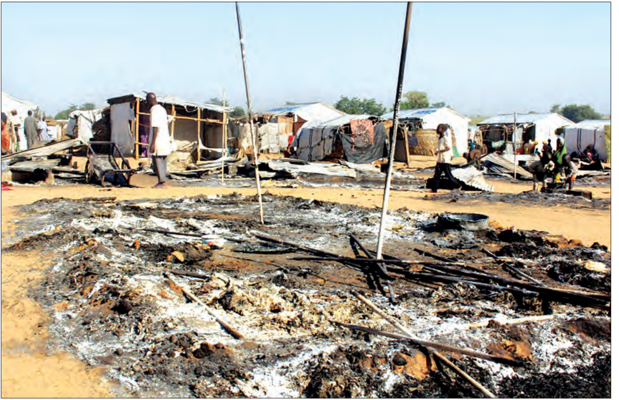
အကြမ်းဖက်သမားများ ဝင်ရောက်တိုက်ခိုက်ပြီးနောက် အပျက်အစီးများကို တွေ့ရစဉ်။

၂၀၀၉ခုနှစ် ဘိုကိုဟာရမ်စစ်သွေးကြွများ ထကြွသောင်းကျန်းချိန်မှစ၍ လူပေါင်း ၂၇၀၀၀ ခန့်မှာ သတ်ဖြတ်ခြင်းခံရပြီး လူပေါင်း ၁ ဒသမ ဓသန်းမှာ အိုးမဲ့အိမ်မဲ့ဖြစ်ခဲ့ရသည်။