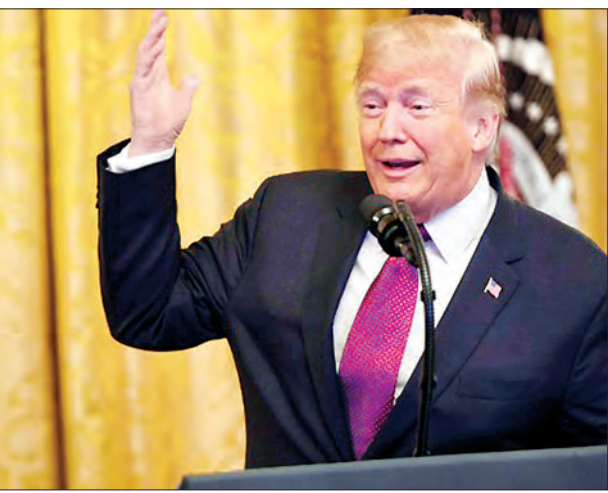
အမေရိကန်သမ္မတ ဒေါ်နယ်ထရမ်။