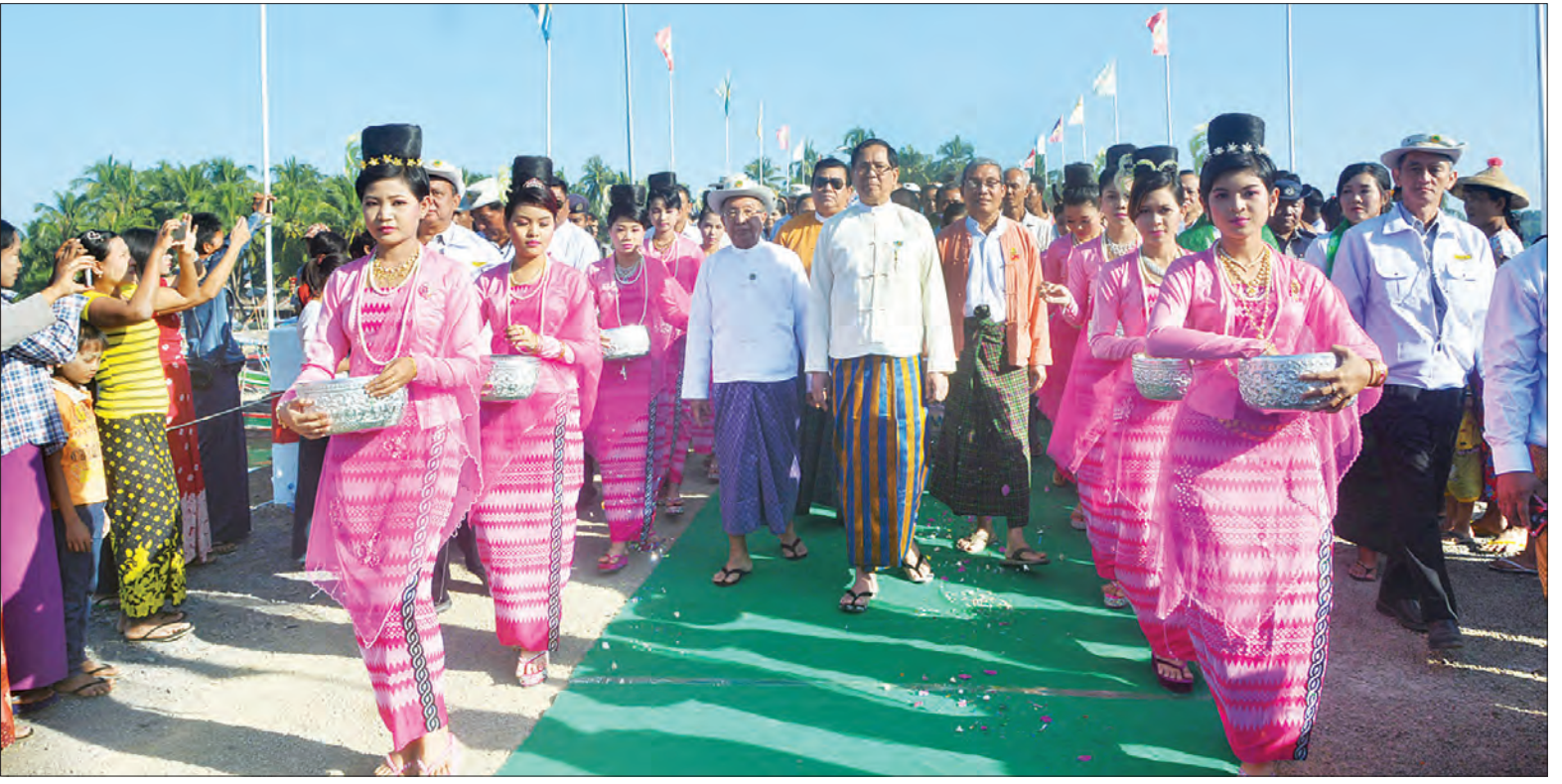
အမျိုးသားလွှတ်တော် ဒုတိယဥက္ကဋ္ဌ ဦးအေးသာအောင်၊ ပြည်ထောင်စုဝန်ကြီး ဦးဟန်ဇော်၊ ရခိုင်ပြည်နယ်ဝန်ကြီးချုပ် ဦးညီပု၊ ဧရာဝတီတိုင်းဒေသကြီးဝန်ကြီးချုပ် ဦးလှမိုးအောင်နှင့် တာဝန်ရှိသူများ ကျောက်ချွန်တံတားဖွင့်ပွဲတွင် တံတားပေါ်မှ ဖြတ်သန်းကြည့်ရှုကြစဉ်။

ဧရာဝတီတိုင်းဒေသကြီးနှင့် ရခိုင်ပြည်နယ်ကို ဆက်သွယ်ပေးသည့် ဝှံ့မြို့နယ်အတွင်းရှိ ကျောက်ချွန်တံတား ဖွင့်ပွဲကို ယနေ့ နံနက် ၈ နာရီက တံတားအနီး စုရပ်၍ ကျင်းပရာ အမျိုးသားလွှတ်တော် ဒုတိယဥက္ကဋ္ဌ ဦးအေးသာအောင်၊ ဆောက်လုပ်ရေးဝန်ကြီးဌာန ပြည်ထောင်စုဝန်ကြီး ဦးဟန်ဇော်၊ ရခိုင်ပြည်နယ်ဝန်ကြီးချုပ် ဦးညီပု၊ ဧရာဝတီတိုင်းဒေသကြီးဝန်ကြီးချုပ် ဦးလှမိုးအောင်၊ တိုင်းဒေသကြီး/ ပြည်နယ်ဝန်ကြီးများနှင့် တာဝန်ရှိသူများ တက်ရောက်ကြသည်။