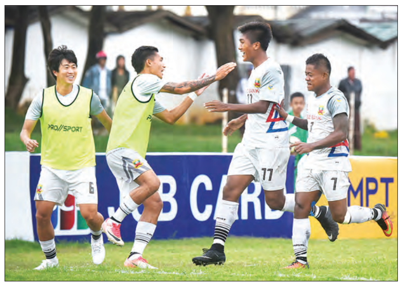
AFC Cup ပြိုင်ပွဲ ယှဉ်ပြိုင်ခွင့်ရထားသည့် ရှမ်းယူနိုက်တက်အသင်း။

ရန်ကုန် နိုဝင်ဘာ ၂၀ မြန်မာကလပ်အသင်းများ ဝင်ရောက်ယှဉ်ပြိုင်မည့် 2019 AFC Cup ပြိုင်ပွဲ ကျင်းပမည့်ပုံစံ ပြောင်းလဲခဲ့ပြီး ဇန်နဝါရီလအထိ ဆီမီးဖိုင်နယ်နှင့် နောက်ဆုံးအဆင့် ဝိုက်လှည့်ကျင်းပမည့်ပုံစံအား ပြောင်းလဲခဲ့သည်။ အုပ်စုအဆင့်ပွဲစဉ်များကို မူလအတိုင်း ကျင်းပမည်ဖြစ်ပြီး အာဆီယံဇုန်၊ အရှေ့အာရှဇုန်၊ တောင်အာရှဇုန်၊ အလယ်ပိုင်းဇုန်နှင့် အနောက်အာရှဇုန်ဟူ၍ ခွဲခြားကျင်းပမည်ဖြစ်သည်။ အောင်မြင်မှုများစွာရထားသည့် အနောက်အာရှဇုန်မှာမူ အခွင့်အရေးပိုရထားပြီး ဇုန်ချန်ပီယံအသင်းမှာ နောက်ဆုံးအဆင့် ဝိုက်လှည့်သို့ တိုက်ရိုက်ယှဉ်ပြိုင်ခွင့်ရမည် ဖြစ်သည်။ ကျန်ဇုန်များတွင် ဝိုက်လှည့်သည့် အသင်းများမှာ ဆီမီးဖိုင်နယ်ပြန်လည်ကစားရမည်ဖြစ်ပြီး အနိုင်ရသည့် ဝိုက်လှည့်အသင်းမှာ အနောက်အာရှဇုန် ချန်ပီယံအသင်း နှင့် နောက်ဆုံးအဆင့် ဝိုက်လှည့် ယှဉ်ပြိုင်ရမည် ဖြစ်သည်။ 2019 AFC Cup ပြိုင်ပွဲတွင် မြန်မာကလပ်အသင်းများဖြစ်သည့်