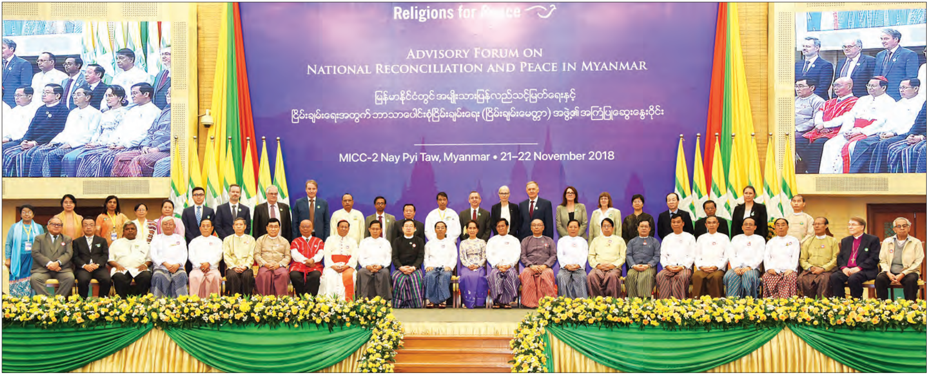
နိုင်ငံတော်၏အတိုင်ပင်ခံပုဂ္ဂိုလ် ဒေါ်အောင်ဆန်းစုကြည် ဘာသာပေါင်းစုံငြိမ်းချမ်းရေး (ငြိမ်းချမ်းမေတ္တာ) အဖွဲ့၏ အကြံပြုဆွေးနွေးပွဲတွင် တက်ရောက်လာကြသူများနှင့်အတူ မှတ်တမ်းတင်ဓာတ်ပုံရိုက်စဉ်။ သတင်းစဉ်

◆ ရှေ့မှ ဤဆွေးနွေးပွဲကို အချိန်အခါသင့် ကျင်းပခြင်းဖြစ်ပြီး ဘာသာတရားများ အချင်းချင်း အပြန်အလှန်နားလည်မှု အပေါ် အလေးအနက် ထားရှိမှုကို ဖော်ကျူးနေပါကြောင်း၊ ငြိမ်းချမ်းသာယာ ဝပြောသော ကမ္ဘာကြီးအဖြစ်ပုံဖော်ရာ တွင် ဘာသာရေးခေါင်းဆောင်ကြီးများ ၏ အခန်းကဏ္ဍမှာ အတူယှဉ်တွဲ ခွန်တွဲ နေပြီး ဘာသာပေါင်းစုံ ဆွေးနွေးကြခြင်း ဖြင့် ငြိမ်းချမ်းသာယာ ဝပြောသောလမ်း ကြောင်းဆီသို့ ဦးတည်လျှောက်လှမ်းနိုင် ကြမည် ဖြစ်ပါကြောင်း။