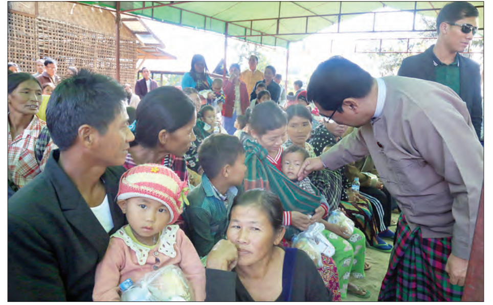
ဆိုင်းရာ လိုအပ်ချက်များကို တစ်ဦးချင်းစီ အတွက် လည်းကောင်း၊ မိသားစုအလိုက် လိုအပ်ချက်များကို လည်းကောင်း ဖြည့်ဆည်းပေးနိုင်ရေး ညှိနှိုင်းပေးခြင်း၊ အတွက် ထောက်ပံ့မှုများ ပြုလုပ်ခဲ့ လူငယ်ပရဟိတတွင် ကလေးငယ်များ၏ ကြောင်း သတင်းရရှိသည်။ ပညာရေး၊ ကျန်းမာရေးအခြေအနေများ သတင်းစဉ်

ပေးအပ်ခဲ့သည်။ ဆက်လက်ပြီး ပြည်ထောင်စုဝန်ကြီးသည် မြစ်ကြီးနားမြို့ရှိ ပြန်လည်ထူထောင်ရေးစခန်းတွင် စခန်းအခြေပြု ပြန်လည်ထူထောင်ရေးသင်တန်းဖွင့်လှစ်နေမှုအား သွားရောက်ကြည့်ရှုခဲ့ပြီး သင်တန်းသားတစ်ဦးချင်း၏ အခြေအနေ၊ လိုအပ်ချက်၊ မိသားစုအခြေအနေ၊ မူလအလုပ်အကိုင်နှင့် ဆက်လက်လုပ်ဆောင်မည့် အသက်မွေးဝမ်းကျောင်းလုပ်ငန်းများကို ဆွေးနွေးခဲ့သည်။