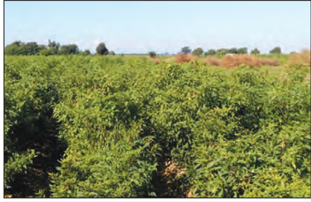
ပွင့်ဖြူမြို့နယ်ရှိ ငရုတ်စိုက်ခင်းတစ်ခု

သေလို့ အလုပ်သမားတွေပါ ဆုံးရှုံးခဲ့တော့ နည်းနည်းအဆင်မပြေဖြစ်ခဲ့ရတယ်။ အခု ငရုတ်ပေါ်တာက အောက်တိုဘာလက ပထမတစ်ရစ်နဲ့ ဒုတိယတစ်ရစ် နှစ်ခါချး ရပါပြီ။ ပထမတစ်ရစ်ချးက ဈေးက တစ်ပိဿာ ၄၀၀ ကျော်ရတယ်။ ခုတစ်ခေါက်ရောင်းတော့ ၄၀၀ ပဲရတော့ သိပ်ပြီး တွက်ခြေမကိုင်တော့ဘူး။ ဆေးဖိုးနဲ့ အလုပ်သမားခတောင် မကားမိတော့ဘူး။ ဒါကြောင့် တချို့ဆို ခူးနေရင်း ဈေးထိုးကျ သွားတော့ ရပ်ထားတာတွေရှိတယ်။ ဒီထက် ဈေးလေးနည်းနည်းတက်လာ ရင်တော့ တောင်သူတွေအတွက် ပိုအဆင်ပြေတာပေါ့” ဟု ပွင့်ဖြူမြို့နယ်မှ ငရုတ်စိုက် တောင်သူတစ်ဦးက ပြောသည်။