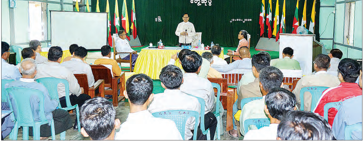
ဒေါက်တာချမ်းသာက ရခိုင်ပြည်နယ် ဦးစားပေးအစီအစဉ်များနှင့် စပ်လျဉ်း၍ တောင်ပိုင်းအတွင်း ဒေသဖွံ့ဖြိုးရေး လုပ်ငန်းဆောင်ရွက်မည့်အခြေအနေများ၊ တောင်ပိုင်းအတွင်း ဒေသဖွံ့ဖြိုးရေး အဆင့်မြှင့်တင်ရေးများက သံတွဲခရိုင် အတွင်း ကမ်းခြေဖွံ့ဖြိုးရေးဆိုင်ရာများ၊ ကြကြောင်း သိရသည်။ ဇင်ဦး(မြန်မာ့အလင်း) ဓာတ်ပုံ - ခရိုင်(ပြန်/ဆက်)

-သစ်ကောက်ဒေသတွင်းကျေးလက်လမ်း ဖွံ့ဖြိုးရေးဆောင်ရွက်မည့်အစီအစဉ်၊ ခရီး သွားလာမှု ဖွံ့ဖြိုးတိုးတက်လာစေရန် သံတွဲ-ဂွကမ်းခြေပတ်လမ်း ဆောင်ရွက် ပေးနိုင်ရေးအစီအစဉ်များ၊ ဝှလေယာဉ် ကွင်းအား အဆင့်မြှင့်တင်၍ ပြန်လည် အသုံးချနိုင်ရေးဆောင်ရွက်မည့် အစီအစဉ်များနှင့် ရင်းနှီးမြှုပ်နှံမှုများ ဖိတ်ခေါ် နိုင်ရေးအခြေအနေများကို ရှင်းလင်း ပြောကြားသည်။ ထို့နောက် ပြည်နယ်လူမှုရေးဝန်ကြီး