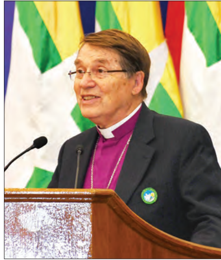
အပြည်ပြည်ဆိုင်ရာ ငြိမ်းချမ်းမေတ္တာအဖွဲ့မှ ဂုဏ်ထူးဆောင် ဥက္ကဋ္ဌ ဘုန်းတော်ကြီး ဝန်နာစတောလ်ဆက် ကြိုဆိုနှုတ်ခွန်းဆက် စကား ပြောကြားစဉ်။ သတင်းစဉ်