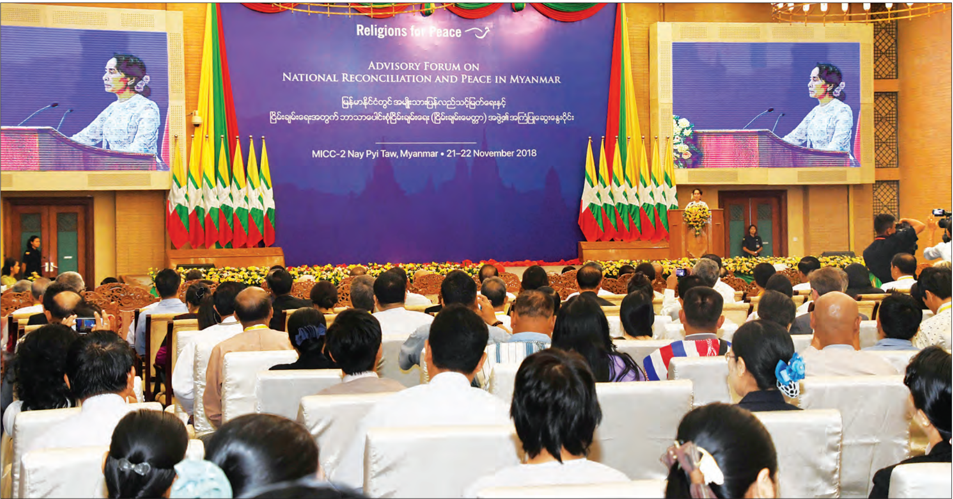
နိုင်ငံတော်၏အတိုင်ပင်ခံပုဂ္ဂိုလ် ဒေါ်အောင်ဆန်းစုကြည် အမျိုးသားပြန်လည်သင့်မြတ်ရေးနှင့် ငြိမ်းချမ်းရေးအတွက် ဘာသာပေါင်းစုံငြိမ်းချမ်းရေး (ငြိမ်းချမ်းမေတ္တာ)အဖွဲ့၏ အကြံပြုဆွေးနွေးပိုင်းတွင် မိန့်ခွန်းပြောကြားစဉ်။ သတင်းစဉ်