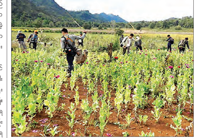
နေပြည်တော် နိုဝင်ဘာ ၂၁

မိုးရွာသွန်းမှုများခဲ့၍ နှစ်ကြိမ် ပြန်လည် စိုက်ပျိုးမှုကြောင့် ပျိုးနောက်ကျသော အခင်းများ အသီးလိုက်ချိန်၌ ရေပြတ်ခဲ့သည့်အတွက် အသီးမအောင်သော ကုန်းပိုင်းစပါးခင်းများလည်း ရှိကြောင်း သိရသည်။ “လူနဲ့ဆင် ပဋိပက္ခဖြစ်အောင် အသိပညာပေးတာတွေ၊ ရွာနဲ့စပါး စိုက်ခင်းတွေကို လျှပ်စစ်ခြံစည်းချိး ကာတာတွေ လုပ်ဆောင်တာကြာပါပြီ။ တစ်နှစ်ထက်တစ်နှစ် ဆင်ကောင်ရေ လျော့လာတာကို နိုင်ငံတော်ကလည်း သိပါတယ်။ သိထားတဲ့စာရင်းအရ တစ်နိုင်လုံးမှာ ဆင်ကောင်ရေ တစ်ထောင်ကျော်ပဲရှိမယ်။ ဧရာဝတီ တိုင်းဒေသကြီးမှာ အများဆုံး အသတ်ခံရ သလို ပဲခူးရိုးမနဲ့နီးတဲ့ ဒေသတွေမှာလည်း အသတ်ခံနေရတယ်။ ဆင်မဆုံးသတင်း ပေးရင် ဖုန်းနဲ့နေပြည်တော်ကို တိုက်ရိုက် ပေးဖို့ ကျေးရွာတွေရောက်တိုင်း အသိ ပေးထားပါတယ်”ဟု တောရိုင်းတိရစ္ဆာန် အကာအကွယ်ပေးရေးအဖွဲ့မှ အဖွဲ့ဝင် တစ်ဦးက ပြောသည်။