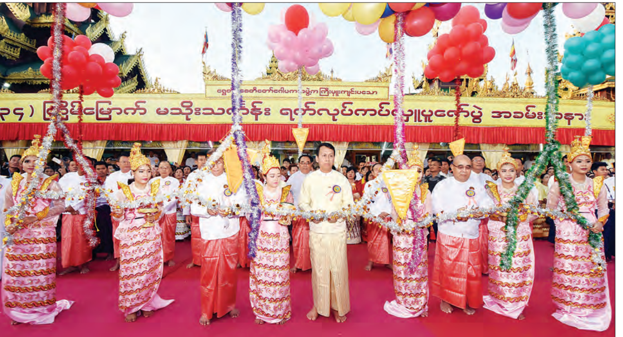
နှင့် ဂေါပကအဖွဲ့ဝင်များက ပြိုင်ပွဲကို ဖဲကြိုးဖြတ်ဖွင့်လှစ်ပေးကြပြီး ပြိုင်ပွဲဝင်

ထို့အတူ ဗိုလ်တထောင်ကျိက်ဒေး အပ်ဆံတော်ဦးစေတီတော်၏ (၃၆) ကြိမ် မြောက် မသိုးသင်္ကန်းရက်ပြိုင်ပွဲအခမ်း အနားကို ယနေ့ ညနေ ၅ နာရီတွင် ဗိုလ်တထောင်စေတီတော် ရင်ပြင်တော်၌ ကျင်းပရာ ရန်ကုန်တိုင်းဒေသကြီး စီမံကိန်း နှင့် ဘဏ္ဍာရေးဝန်ကြီး ဦးမြင့်သောင်း၊ တိုင်းဒေသကြီး ရခိုင်တိုင်းရင်းသားလူမျိုး ရေးရာဝန်ကြီး ဦးဇော်အေးမောင်၊ တိုင်း ဒေသကြီးလွှတ်တော်ကိုယ်စားလှယ်များ