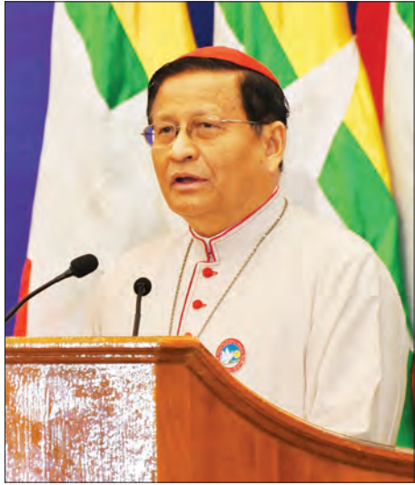
ငြိမ်းချမ်းမေတ္တာအဖွဲ့၊ မြန်မာနိုင်ငံ၏ ဦးစီးနာယက ရန်ကုန် ကက်သလစ်ရိုက်ဆရာတော်ကြီး ကာဒီနယ်ချားလစ်ဘို ကြိုဆိုနှုတ်ခွန်းဆက်စကား ပြောကြားစဉ်။ သတင်းစဉ်

မြန်မာနိုင်ငံတွင် အမျိုးသားပြန်လည်သင့်မြတ်ရေးနှင့် ငြိမ်းချမ်းရေးအတွက် ဘာသာပေါင်းစုံငြိမ်းချမ်းရေး (ငြိမ်းချမ်းမေတ္တာ) အဖွဲ့၏ အကြံပြုဆွေးနွေးပွဲကို ယနေ့ နံနက်ပိုင်းတွင် နေပြည်တော်ရှိ မြန်မာအပြည်ပြည်ဆိုင်ရာ ကွန်ပဏီဗဟိုဌာန ၂၅ ကျင်းပသည်။