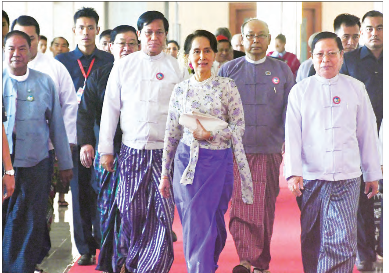
ကောင်စီဥက္ကဋ္ဌ၊ ဒုတိယဝန်ကြီးများ၊ ကရင်အမျိုးသားအစည်းအရုံး (KNU) ဥက္ကဋ္ဌ စောမူတူးစေးဖိုးနှင့် တိုင်းရင်းသားလက်နက်ကိုင်ငြိမ်းချမ်းရေး အဖွဲ့အစည်းများမှ အဖွဲ့ဝင်များ၊ သံအမတ်ကြီးများ၊ ကုလသမဂ္ဂလက်အောက်ခံ အဖွဲ့အစည်းများမှ ကိုယ်စားလှယ်များ၊ ငြိမ်းချမ်းမေတ္တာအဖွဲ့ဝင်များနှင့် ဖိတ်ကြားထားသူများ တက်ရောက်ကြသည်။

မြင့်တင်ပေးမည့် ဆွေးနွေးပွဲအဖြစ် မိမိယုံကြည်ပါကြောင်း၊ ယင်းမှာ ကမ္ဘာတစ်ဝန်းတွင် ငြိမ်းချမ်းရေးအခွန်ရှည် တည်ရှိနိုင်ရေးအတွက် ဘာသာတရားများက ဦးတည်နေသည်ကို မိမိသိရှိခြင်းကြောင့် ဖြစ်ပါကြောင်း၊ လူကြီးမင်းတို့က မိမိတို့နိုင်ငံအပေါ် အလေးမှု အာရုံစိုက်ခြင်း၊ ကောင်းမြတ်သည့် သန္နိဋ္ဌာန်ထားရှိခြင်း၊ အများအကျိုးဆောင် ပရဟိတစိတ်ထားရှိခြင်းတို့အတွက် မိမိအနေဖြင့် အထူးပင် ကျေးဇူးတင်ရှိပါကြောင်း၊ အများအကျိုးဆောင် စိတ်ဓာတ်ဟူသည် မေတ္တာတရားထားရှိမှုပင် ဖြစ်ပြီး မေတ္တာတရားကို လူကြီးမင်းတို့က ဤနေရာသို့ ဆောင်ကြဉ်း ယူဆောင်လာခဲ့ကြပြီ ဖြစ်ပါကြောင်း ပြောကြားသည်။ မှတ်တမ်းတင်ဓာတ်ပုံရိုက် ထိုနေ့က နိုင်ငံတော်၏ အတိုင်ပင်ခံ ပုဂ္ဂိုလ် ဒေါ်အောင်ဆန်းစုကြည်သည် တက်ရောက်လာကြသူများနှင့် အတူ မှတ်တမ်းတင်ဓာတ်ပုံရိုက်သည်။ တက်ရောက် အကြံပြုဆွေးနွေးပွဲသို့ ဒုတိယသမ္မတများဖြစ်ကြသည့် ဦးမြင့်ဆွေနှင့် ဦးဟင်နရီဗန်ထီးယူ၊ ပြည်သူ့လွှတ်တော်ဥက္ကဋ္ဌ ဦးတီခွန်မြတ်၊ အမျိုးသားလွှတ်တော်ဥက္ကဋ္ဌ မန်းဝင်းခိုင်သန်း၊ ဒုတိယတပ်မတော်ကာကွယ်ရေးဦးစီးချုပ် ဒုတိယဗိုလ်ချုပ်မှူးကြီး စိုးဝင်း၊ ပြည်ထောင်စုဝန်ကြီးများ၊ နေပြည်တော်