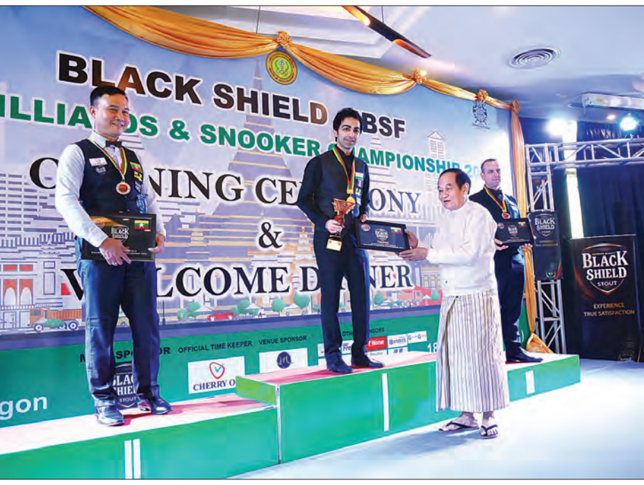
အားကစားသမားအဖြစ် မှတ်တမ်းဝင်ခဲ့သည်။ 150 up ဗိုလ်လုပြိုင်ပွဲတွင် Pankaj Advani (အိန္ဒိယ) က နေသွေးဦး (မြန်မာ) ကို ခြောက်ပွဲ၊ နှစ်ပွဲဖြင့် အနိုင်ရရှိပြီး ကမ္ဘာ့ချန်ပီယံ Pankaj Advani (အိန္ဒိယ) က ပထမ၊ ဒုတိယ

ယင်း 150 up ဘိလိယက်ပြိုင်ပွဲတွင် မြန်မာဘိလိယက် အားကစားသမားရှစ်ဦးအပါအဝင် ပွဲစဉ်ပေါင်း ၉၁ ပွဲ ကျင်းပကာ ပြိုင်ပွဲဝင် အားကစားသမား ၃၇ ဦးယှဉ်ပြိုင်ပြီး ကွာတား ဖိုင်နယ်အဆင့်သို့ နှစ်ဦးတက်ရောက်နိုင်ခဲ့ရာ အဆိုပါနှစ်ဦးထဲမှ ချစ်ကိုကို ကွာတားဖိုင်နယ်အဆင့်တွင် နေသွေးဦး (မြန်မာ) ကို ရှုံးနိမ့်ပြီး နေသွေးဦး (မြန်မာ) က ကမ္ဘာ့အဆင့် ဗိုလ်လုပြိုင်ပွဲ သို့ ပထမဆုံး တက်ရောက်၍ ပထမဦးဆုံးယှဉ်ပြိုင်ခွင့်ရရှိသော