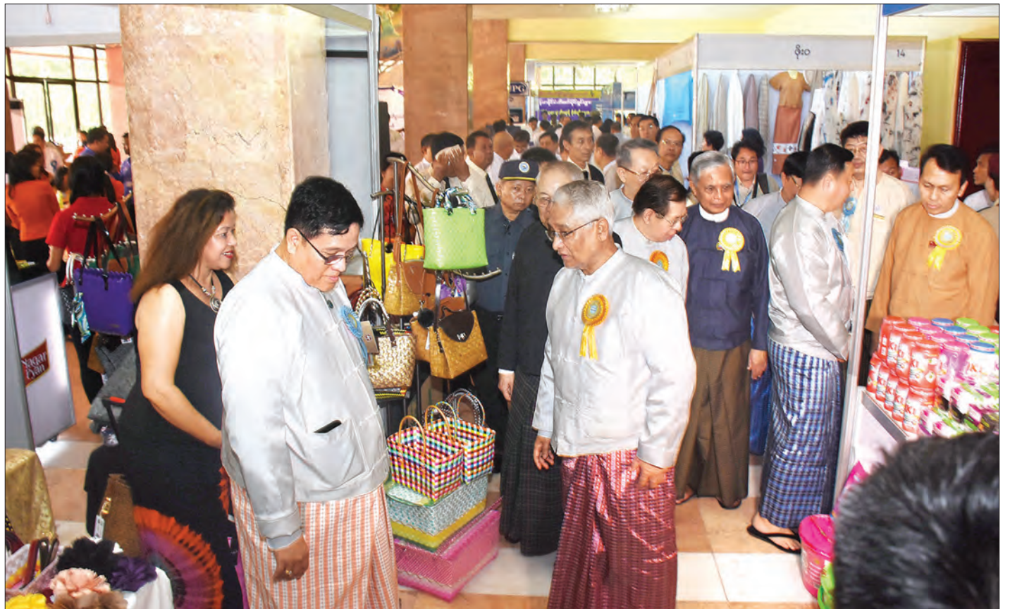
ပြည်ထောင်စုဝန်ကြီး ဒေါက်တာသန်းမြင့်၊ အဂတိလိုက်စားမှုတိုက်ဖျက်ရေး ကော်မရှင်ဥက္ကဋ္ဌ ဦးအောင်ကြည်၊ ရန်ကုန်တိုင်းဒေသကြီး ဝန်ကြီးချုပ် ဦးမြိုးမင်းသိန်းနှင့် တာဝန်ရှိသူများ မြန်မာနိုင်ငံ ကုန်သည်များနှင့် စက်မှုလက်မှုလုပ်ငန်းရှင်များအသင်းချုပ်၏ ပြခန်းများကို လှည့်လည်ကြည့်ရှုစဉ်။