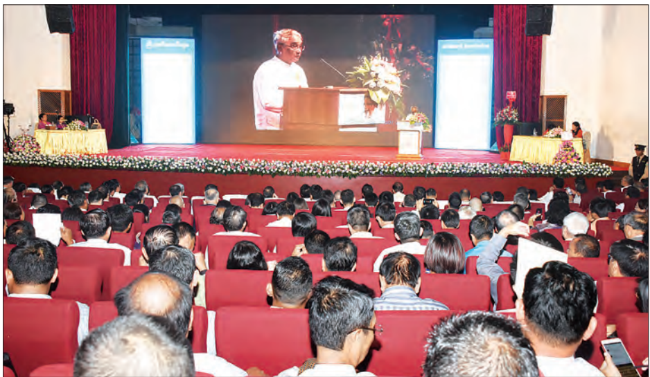
ပြည်ထောင်စုဝန်ကြီး ဒေါက်တာသန်းမြင့် မြန်မာနိုင်ငံ ကုန်သည်များနှင့် စက်မှုလက်မှုလုပ်ငန်းရှင်များ အသင်းချုပ်၏ (၂၇)ကြိမ်မြောက် နှစ်ပတ်လည်အသင်းသားစုံညီအစည်းအဝေးတွင် အမှာစကားပြောကြားစဉ်။

ဝန်ကြီးချုပ် ဦးဖိုးမင်းသိန်းက အမှာစကားပြောကြားသည်။ ထို့နောက် နှစ်ပတ်လည်အသင်းသားစုံညီအစည်းအဝေးသို့ တက်ရောက်လာကြသူများ စုပေါင်း၍ မှတ်တမ်းတင်