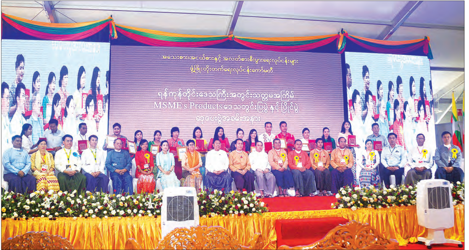
သတ္တမအကြိမ်မြောက် အသေးစား၊ အငယ်စားနှင့် အလတ်စား စီးပွားရေးလုပ်ငန်းများ၏ ဒေသတွင်း ထုတ်ကုန်ပစ္စည်းများ ပြပွဲနှင့် ပြိုင်ပွဲ (ရန်ကုန်)၏ ဆုပေးပွဲတွင် ရန်ကုန်တိုင်းဒေသကြီးဝန်ကြီးချုပ် ဦးမြိုးမင်းသိန်း နှင့် ဆုရရှိသူများ စုပေါင်းမှတ်တမ်းတင်ဓာတ်ပုံရိုက်စဉ်။ သတင်းစဉ်