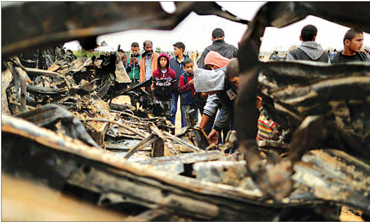
အစွရေးလေကြောင်းတိုက်ခိုက်မှုကြောင့် တောင်ပိုင်း ဂါဇာကမ်းမြောင်ဒေသ ခန့်ယွန်နစ်၌ ပျက်စီးသွားသောယာဉ်အနီးတွင် ဝိုင်းအုံနေသော ပါလက်စတိုင်းများကို နိုဝင်ဘာ ၁၂ ရက်က တွေ့ရစဉ်။

ဂါဇာကမ်းမြောင်ဒေသမှာ အစွရေး အထူးတပ်ဖွဲ့ရဲ့ စစ်ဆင်ရေးအတွင်း လူရှစ်ဦးသေဆုံးခဲ့ခြင်းက ဆူပူအုံကြွ နေတဲ့ဒေသမှာ ပြန်လည်ငြိမ်းချမ်းရေး ရရှိအောင်ကြိုးစား ဆောင်ရွက်နေတဲ့ အပေါ် လမ်းကြောင်းလွှဲမှားပြီလား ဆိုတာ စိုးတထိတ်ထိတ်ဖြစ်နေရပါတယ်။ တိုက်ခိုက်မှုတွေဖြစ် အစွရေးအထူးတပ်ဖွဲ့ဝင်တွေနဲ့ ဟားမားစ်တို့နဲ့ လွန်ခဲ့တဲ့ တနင်္လာနေ့က ထိပ်တိုက်တွေ့ဆုံခဲ့ပြီး အခုလို ဖြစ်ပွားခဲ့တာဖြစ်ပါတယ်။ အဲဒီအရေး စိတ်မအေးရဘဲ ဝန်ကြီးချုပ် ဘင်ဂျမင် နေတန်ယာဟုလည်းပဲ ပါရီကိုသွား မယ့် ခရီးစဉ်ကိုဗျက်သိမ်းပြီး အိမ်ပြန် လာခဲ့ရပါတယ်။ နှစ်ဖက်အဖွဲ့တွေ ထိပ်တိုက် တွေ့ဆုံပြီးနောက် လွန်ခဲ့တဲ့ တနင်္လာ နေ့က အစွရေးတောင်ပိုင်းမှာ အချက် ပေးသံတွေ ထွက်ပေါ်ခဲ့ပါတယ်။ ဒါကတော့ ဂါဇာကမ်းမြောင်ဒေသမှ ချီးကျည် ပစ်ခတ်လိုက်တဲ့အသံတွေပဲ ဖြစ်ပါတယ်။ ဂါဇာကမ်းမြောင်ဒေသမှ အစွရေးပိုင်နက်ထဲကို ချီးကျည် ၁၇ ကြိမ်ထက်မနည်း ပစ်ခတ်ခဲ့တယ် လို့ အစွရေးတို့က ဆိုပါတယ်။ ၁၇ ကြိမ် လောက်မှာ သုံးကြိမ်လောက်ကို ချီးကျည်ခွဲ၊ ကာကွယ်နိုင်ခဲ့ပြီး ဒဏ်ရာ ရရှိမှု တစ်စုံတစ်ရာ မရှိခဲ့ဘူးလို့လည်း သူတို့က ပြောပါတယ်။