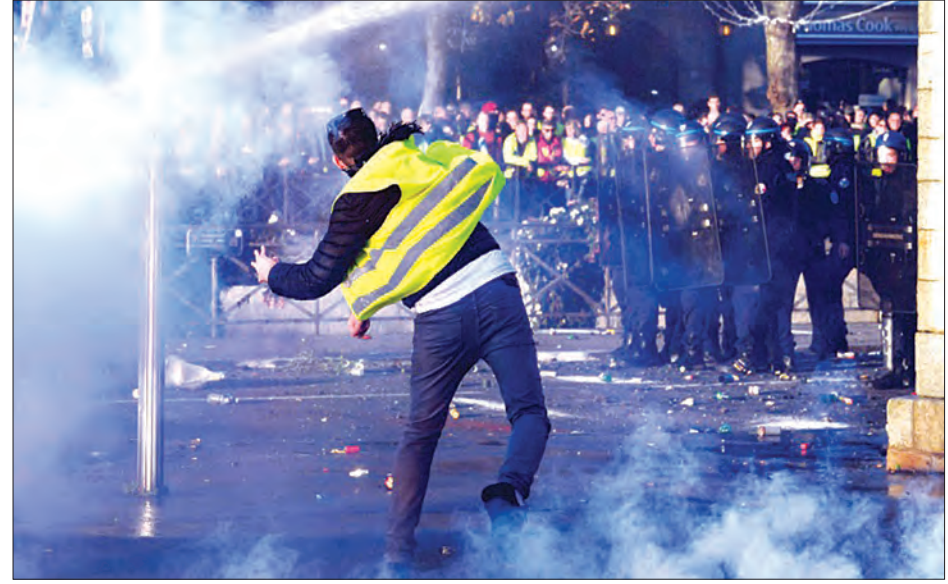
ဆန္ဒပြသူတစ်ဦးက ရဲများအား ရန်မူနေသည်ကိုတွေ့ရစဉ်။

လွန်ခဲ့သောလကတည်းက ဆိုရယ်မီဒီယာများတွင် မြင်သာသော ဂျာကင်ဆင်တူအင်္ကျီများကို ဝတ်ဆင်ထားရင်း လမ်းများ၊ အဝေးပြေးလမ်းများကို ပိတ်ဆို့ကာ ဆန္ဒပြကြရန် စုစည်းခဲ့ကြသည်။ လောင်စာအခွန်ငွေ တိုးလာသည်ကို နှစ်ပေါင်းများစွာ ခံစားရကြောင်း၊ လောင်စာဈေးနှုန်းမှာ ၂၀၀၀ ပြည့်နှစ်များတွင် မကြုံဖူးလောက်သည့် ဈေးနှုန်းသို့ မြင့်တက်ခဲ့ကြောင်း ဆန္ဒပြသူများက ပြောသည်။