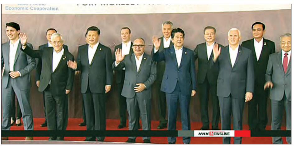
အာရှ-ပစိတ် ထိပ်သီးအစည်းအဝေးကို တက်ရောက်လာကြသည့် နိုင်ငံခေါင်းဆောင်များကို တွေ့ရစဉ်။

ပွင့်လင်းမှုရှိပြီး ဘဏ္ဍာရေးအရ ခိုင်မာမှုရှိမည့် အချက်များကိုလည်း ထည့်သွင်းစဉ်းစားရန်လိုကြောင်း၊ ထို့ကြောင့် အခြေခံအဆောက်အအုံ စီမံကိန်းများမှာ ရင်းနှီးမြှုပ်နှံမှုနှင့် ရင်းနှီးမြှုပ်နှံမှုလက်ခံမည့်အတွက်ပါ အကျိုးများစေမည်ဖြစ်ကြောင်း ပြောကြားခဲ့သည်။ အင်န်အိတ်ချ်ကေ