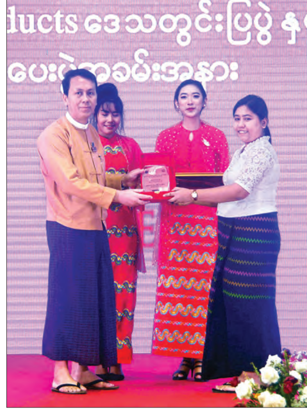
ရန်ကုန်တိုင်းဒေသကြီးဝန်ကြီးချုပ် ဦးမြိုးမင်းသိန်း ပထမဆုရရှိသော အသေးစား၊ အငယ်စားနှင့် အလတ်စားစီးပွားရေးလုပ်ငန်းရှင်တစ်ဦးအား ဆုချီးမြှင့်စဉ်။