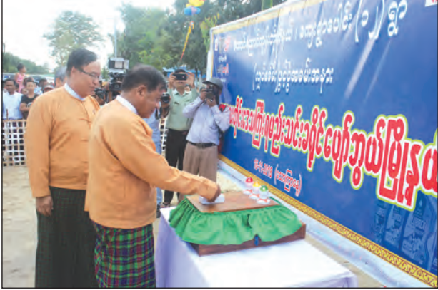
ရောက်ခဲ့ကြပြီး အဆိုပါ တောင်ညောင်ကုန်းကျေးရွာအုပ်စုအတွင်းရှိ ကျေးရွာ ၁၂ ရွာ မီးလင်းရေးအတွက် တိုင်းဒေသကြီးအစိုးရ၏ရန်ပုံငွေ ကျပ်သန်းပေါင်း ၆၀၀ အကုန်အကျခံ ဆောင်ရွက်ခဲ့ကြောင်း သိရသည်။ တင်ဦး (ရမည်းသင်း)

ဖွင့်ပွဲသို့ တိုင်းဒေသကြီးအစိုးရအဖွဲ့ဝင်များ၊ တိုင်းဒေသကြီး လွှတ်တော်ကိုယ်စားလှယ်များ၊ ဌာနဆိုင်ရာတာဝန်ရှိသူများ၊ ရပ်မိရပ်ဖများ၊ ဒေသခံပြည်သူများ တက်