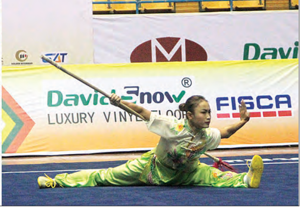
ပြည်ထောင်စုဝန်ကြီး ဒေါက်တာ မြင့်ထွေး၊ ဒုတိယဝန်ကြီး ဒေါက်တာ မြလေးစိန်နှင့် တာဝန်ရှိသူများ ဂူဂျာနယ်ပြိုင်ပွဲ ကြည့်ရှုအားပေးစဉ်။