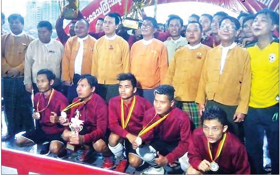
နိုဝင်ဘာ ၁၅ ရက်အထိ ယှဉ်ပြိုင်ကစားခဲ့ကြသည့် ဘောလုံးပွဲအပြီးတွင် ဆုများ ချီးမြှင့်ပေးခဲ့ရာ ပထမဆုရရှိသည့် သုံးခွဲ

ကို ရွှေပြည်သာနဂရတ်ကွင်းနှင့် အင်းစိန်မီးရထားကွင်းတို့၌ လည်းကောင်း၊ တောင်ပိုင်းခရိုင်စုကို သန်လျင်ကွင်းနှင့် တွံတေးကွင်းတို့ လည်းကောင်း အောက်တိုဘာ ၆ ရက်မှ စတင်ယှဉ်ပြိုင်ကစားခဲ့ကြသည်။ ဒုတိယအဆင့် အုပ်စုပွဲစဉ်ကို အောက်တိုဘာ ၂၆ ရက်ကစ၍ ကြည့်မြင်တိုင်မြို့နယ် စလင်းကွင်းနှင့် လှိုင်မြို့နယ် ရန်ကုန် F.C ကွင်းတို့တွင် ရှုံးထွက်ပွဲအကြိုပိုင်လုပ်ပွဲ၊ တတိယနေရာလုပ်ပွဲကို