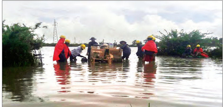
၆၆ ကေပီ ရသေ့တောင်- ဘူးသီးတောင် ဓာတ်အားလိုင်းဆွဲနိုင်ရန် ခက်ခဲစွာ ဆောင်ရွက်ခဲ့မှုကို တွေ့ရစဉ်။

“စီမံကိန်းက မောင်တောအထိ ဖြစ်ပါတယ်။ ဘူးသီးတောင်အထိက ပြီးသွားပါပြီ။ မောင်တောတစ်မြို့ပေါ် ကျန်ပါ တော့တယ်။ တပ်ဆင်အင်အားကတော့ ရသေ့တောင်မှာ ၅ အမိဗီအေ၊ ပုဏ္ဏား ကျွန်းမှာ ၂၀ အမိဗီအေ၊ ဘူးသီးတောင်မှာ ၅ အမိဗီအေ ရှိပါတယ်။ ဘူးသီးတောင်