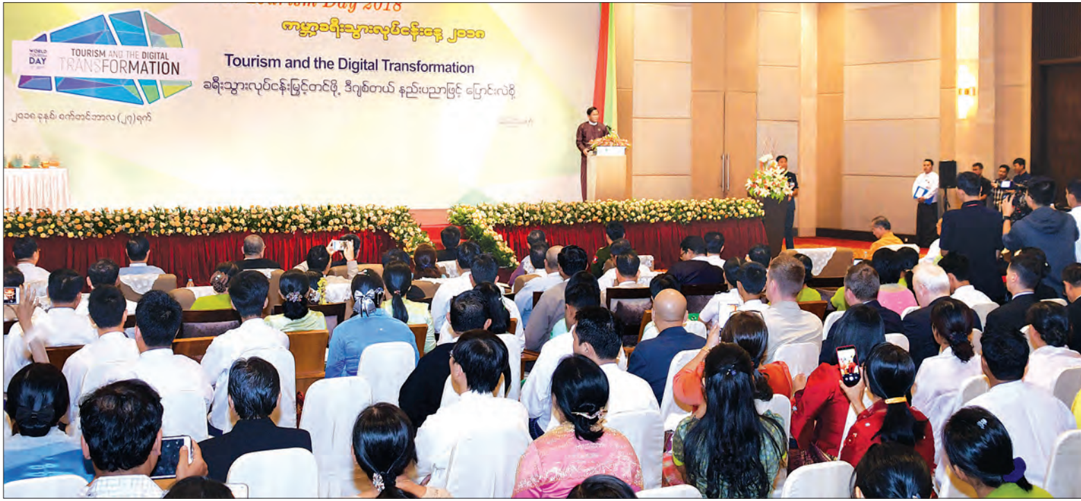
ဒုတိယသမ္မတ ဦးဟင်နရီစန်ထီးယူ ကမ္ဘာ့ခရီးသွားလုပ်ငန်းနေ့ - ၂၀၁၈ အထိမ်းအမှတ် အခမ်းအနားတွင် အမှာစကားပြောကြားစဉ်။