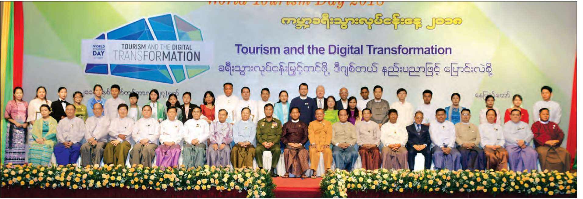
ဒုတိယသမ္မတ ဦးဟင်နရီပန်တီးယို၊ ပြည်ထောင်စုဝန်ကြီးများ အခမ်းအနားသို့ တက်ရောက်လာကြသူများနှင့်အတူ စုပေါင်းမှတ်တမ်းတင်ဓာတ်ပုံရိုက်စဉ်။