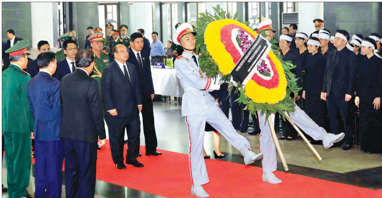
နေပြည်တော် စက်တင်ဘာ ၂၇

ပြည်ထောင်စုအစိုးရအဖွဲ့ဝန်ကြီးဌာန၊ ပြည်ထောင်စုဝန်ကြီး ဦးသောင်းထွန်းသည် ပြည်ထောင်စုသမ္မတမြန်မာနိုင်ငံတော် အစိုးရ၏ ကိုယ်စားလှယ်အဖြစ် စက်တင်ဘာ ၂၆ ရက် ဒေသစံတော်ချိန် မွန်းလွဲ ၂ နာရီ ၀၀ မိနစ်တွင် ဟန့်ရှင်းမြို့ရှိ အမျိုးသားဈာပနခန်းမ၌ ကျင်းပပြုလုပ်သည့် ကွယ်လွန်သူ ဗီယက်နမ်ဆိုရှယ်လစ်သမ္မတနိုင်ငံ၊ သမ္မတ မစ္စတာ ကျန်ခိုင်ကွမ်အား ဂါရဝပြုအခမ်းအနားသို့ တက်ရောက်ခဲ့ပြီး ဝမ်းနည်းကြောင်းမှတ်တမ်းစာအုပ်တွင် လက်မှတ်ရေးထိုးခဲ့သည်။