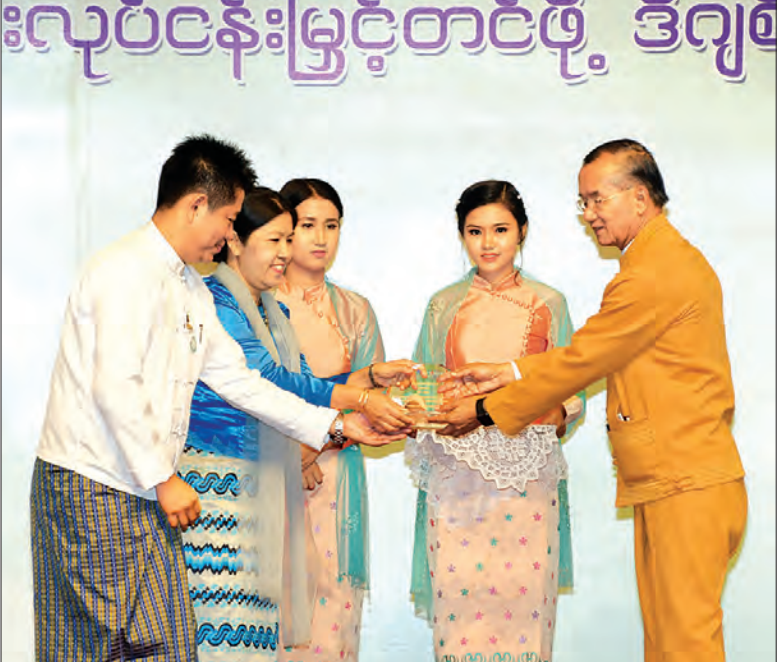
ပြည်ထောင်စု ဝန်ကြီး ဦးအုန်းမောင်ထံ တာဝန်ရှိသူ များက 33rd Korea World Travel Fair-2018 တွင် The Best Booth Operation Award ရရှိခဲ့ သည့် မြန်မာနိုင်ငံ ကိုယ်စားပြု ခရီးသွားပြခန်း ဂုဏ်ပြုဆုကို လွှဲပြောင်းပေး အပ်ကြစဉ်။ သတင်းစဉ်

ထိုမှိုက်နိုင်သည့် အခြေအနေတစ်ရပ်ရပ် ဖြစ်ပေါ်လာသည့် အခါ ချက်ချင်းတုံ့ပြန်ဆောင်ရွက်နိုင်မည့် အစီအမံများကို စနစ်တကျဆောင်ရွက်ထားရန် လိုပါကြောင်း၊ ထိုသို့ ဆောင်ရွက် ရာတွင် အစိုးရနှင့် ပုဂ္ဂလိကကဏ္ဍလက်တွဲပြီး နည်းဗျူဟာများ ချမှတ် ဆောင်ရွက်ရန် အထူးလိုအပ်ပါကြောင်း။ ခရီးသွားလုပ်ငန်းမြှင့်တင်ရေးအတွက် ဆောင်ရွက်ရာတွင် တည်ငြိမ်အေးချမ်းမှုရှိပြီး ဘေးအန္တရာယ်ကင်းရှင်းစွာ လာရောက် လည်ပတ်နိုင်ကြောင်းကို ကမ္ဘာ့လှည့်ခရီးသွားဧည့်သည်များ သိရှိနိုင်ရေးအတွက် သတင်းမီဒီယာများ၊ Travel Writer များကို ဖိတ်ခေါ်ခြင်း၊ လက်ကမ်းစာစောင်များ အသုံးပြုပြီး မြှင့်တင်ကြော်ငြာခြင်း၊ လေ့လာရေးခရီးစဉ်များ ဖိတ်ခေါ်ပြသ ခြင်း၊ ခရီးသွားပြပွဲများပြုလုပ်ခြင်း၊ နိုင်ငံတကာ ခရီးသွားပြပွဲ များတွင် ပါဝင်ပြသခြင်းများနှင့် အချိန်တိုအတွင်း ကုန်ကျ စရိတ်သက်သာသောသောနှင့် ထိရောက်မှုရှိသည့် Digital Promotion စနစ်ကို အရှိန်မြှင့်ဆောင်ရွက်ရန် လိုအပ်ပါ ကြောင်း။