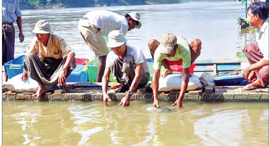
မြန်မာ့တိုက်လိပ်အထီးများကို ချင်းတွင်းမြစ်အတွင်း ပြန်လွှတ်ပေးစဉ်။

စနစ်ကို အသုံးပြု၍ လွှတ်ခြင်းဖြစ်ကြောင်း သိရသည်။ ဤသို့ လွှတ်သော တိုက်လိပ်အကောင် ၂၀ မှာ လောကနန္ဒာ တောရိုင်းတိရစ္ဆာန်ဘေးမဲ့တောနှင့် ထမံသီတောရိုင်းတိရစ္ဆာန် ဘေးမဲ့တောတို့က မွေးမြူရေးကန်များမှ အရွယ်ရောက် တိုက်လိပ် အထီး ၁၀ ကောင်စီကို ရွေးချယ်၍ အဆိုပါ မျိုးမအောင်သောဒေသများကို လွှတ်ပေးခြင်းဖြစ်သည်။ ထိုသို့ မတူညီသော မွေးမြူရေးကန် နှစ်ကန်မှ တိုက်လိပ်များကို ပြန်လွှတ်ပေးခြင်းဖြင့် မျိုးရိုးဗီဇအရ ကျန်းမာသန်စွမ်းသော သားပေါက်ကလေးများ ရရှိစေရန်ဖြစ်ကြောင်း သိရသည်။