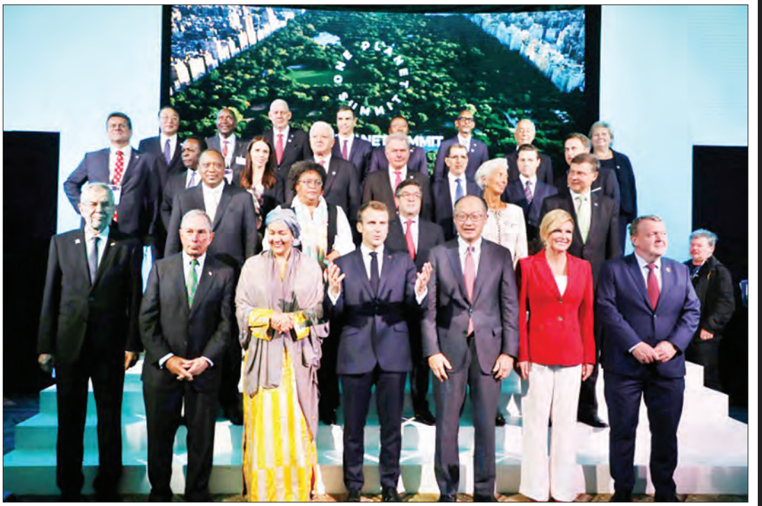
အေအက်စ်ပီ

ယခုလအတွင်း ဗန်ကောက်နှင့် ဆန်ဖရန်စစ္စကိုတို့တွင် ရာသီဥတုပြောင်းလဲမှုနှင့် ပတ်သက်၍ ထိပ်သီးအစည်းအဝေးပွဲများကျင်းပခဲ့သော်လည်း အောင်မြင်မှုနည်းနေသေးကြောင်း ရာသီဥတုပြောင်းလဲမှုဆိုင်ရာ ပါရီသဘောတူညီမှု၏ မျှော်လင့်ချက်များနေရာတွင် အဆိုးများကသာဝင်၍ နေရာယူလာကြောင်း ၎င်းကဆက်ပြောသည်။ အမေရိကန်သမ္မတ ထရမ်သည် ၂၀၁၇ ခုနှစ် ဇွန်လတွင် အမေရိကန်သည် ပါရီသဘောတူညီမှုမှ နုတ်ထွက်မည်ဖြစ်ကြောင်းကြေညာခဲ့သည်။ အမေရိကန်၏နုတ်ထွက်မှုသည် ၂၀၂၀ ပြည့်နှစ်တွင် စတင်သက်ရောက်မှုရှိမည်ဖြစ်သည်။ ပါရီသဘောတူညီမှုသည် အပူဒဏ်ကိုခံစားနေရသည့် ဇွဲဖြိုးဆဲနိုင်ငံများကို နှစ်စဉ် ဒေါ်လာ ၁၀၀ ဘီလီယံကို ချမ်းသာကြွယ်ဝသည့်နိုင်ငံများမှ ထောက်ပံ့ပေးရန် ပြဋ္ဌာန်းထားသည်။ သို့သော် ယခုအချိန်အထိ ၁၀ ဘီလီယံသာစုဆောင်းရရှိသေးသည်။ အမေရိကန်သည် သမ္မတအိုဘားမားလက်ထက်က သုံးဘီလီယံပေးမည်ဟု ကတိထားခဲ့သော်လည်း တစ်ဘီလီယံသာ ပေးခဲ့သည်။