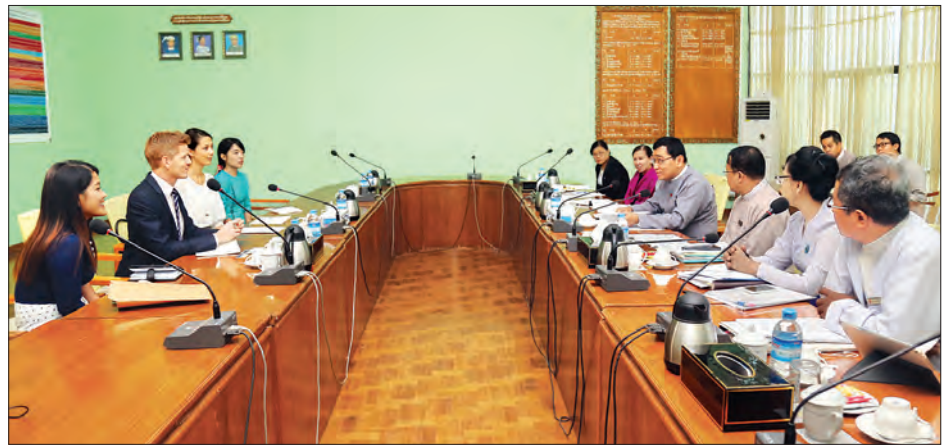
အစည်းအတွင်း အပြည်အဝင်ဆောင်ရွက်နိုင်ရေးအတွက် ပွင့်လင်းစွာ ဆွေးနွေးခဲ့ကြကြောင်း သတင်းရရှိသည်။ ဆောင်ရွက်လျက်ရှိသော ကိစ္စရပ်များနှင့်စပ်လျဉ်း၍ ရင်းနှီး

ဖင်လန်နိုင်ငံသံအမတ်ကြီးနှင့်တွေ့ဆုံစဉ် ဥရောပသမဂ္ဂကိုယ်စား ဖင်လန်နိုင်ငံ၏ ပူးပေါင်းပါဝင်မှုဖြင့် ဒီဇင်ဘာ ၃ ရက်တွင် ကျရောက်မည့် အပြည်ပြည်ဆိုင်ရာ မသန်စွမ်းသူများနေ့ကျင်းပရေးတွင် လူမှုဝန်ထမ်း၊ ကယ်ဆယ်ရေးနှင့် ပြန်လည်နေရာချထားရေးဝန်ကြီးဌာနနှင့် ပူးပေါင်းဆောင်ရွက်မည့် အခြေအနေများ၊ အခမ်းအနားကျင်းပရာတွင် ပါဝင်မည့် ပြခန်းများ၊ နိုင်ငံတကာမှ မသန်စွမ်းထင်ရှားကျော်ကြားသူများ ပါဝင်ဆင်နွှဲနိုင်ရေး ကိစ္စရပ်များနှင့် ကျင်းပရေးအစီအစဉ်များ၊ မသန်စွမ်းသူများ ဖွံ့ဖြိုးတိုးတက်ရေးအတွက် ဒုတိယသမ္မတ(၂) ဦးဆောင်သော မသန်စွမ်းသူများ၏ အခွင့်အရေးများဆိုင်ရာ အမျိုးသားကော်မတီကို ဖွဲ့စည်း၍ ဆောင်ရွက်နေမှုများ၊ မသန်စွမ်းသူများ လူမှုရေး၊ စီးပွားရေး၊ ကျန်းမာရေး၊ ပညာရေး အခွင့်အလမ်းများ အပြည့်အဝရရှိခံစားနိုင်ရေးနှင့် လူ့အဖွဲ့