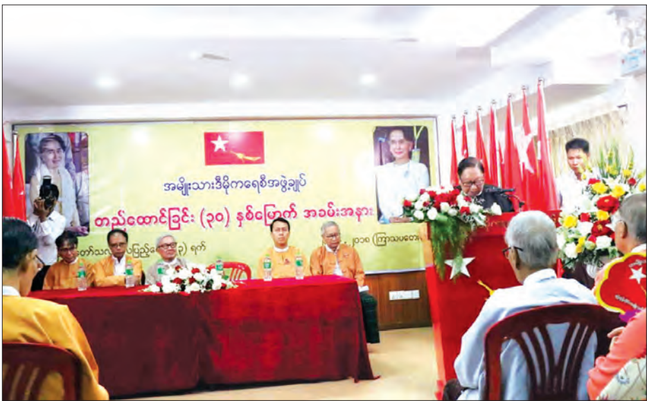
ယနေ့ကျင်းပသည့် အခမ်းအနားတွင် အမျိုးသားဒီမိုကရေစီ တစ်စောင်ကို ထုတ်ပြန်ခဲ့ကြောင်း သိရှိရသည်။ အဖွဲ့ချုပ်အနေဖြင့် အချက်အချာချက်ပါ ကြေညာချက်

အခမ်းအနားသို့ အမျိုးသားဒီမိုကရေစီအဖွဲ့ချုပ် နာယက ဦးတင်ဦး၊ သဘာပတိအဖွဲ့ဝင် ဦးအုန်းကြိုင်၊ ဗဟိုအလုပ်အမှု ဆောင်အဖွဲ့ဝင်များ၊ ရန်ကုန်တိုင်းဒေသကြီး ဝန်ကြီးချုပ် ဦးမြိုး မင်းသိန်း၊ ရန်ကုန်တိုင်းဒေသကြီးလွှတ်တော် ဥက္ကဋ္ဌ ဦးတင်မောင် ထွန်းနှင့် ဒုတိယဥက္ကဋ္ဌ ဦးလင်းနိုင်မြင့် ၊ တိုင်းဒေသကြီး ဝန်ကြီး များ၊ လွှတ်တော်ကိုယ်စားလှယ်များ၊ ဝါရင့် နိုင်ငံရေးသမားများ၊ သံတမန်များ၊ နိုင်ငံရေးပါတီများမှ တာဝန်ရှိသူများ၊ အမျိုးသား ဒီမိုကရေစီအဖွဲ့ချုပ် အဖွဲ့ဝင်များနှင့် ဖိတ်ကြားထားသူများ တက်ရောက်ကြသည်။