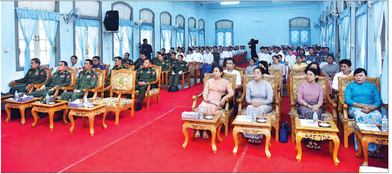
တပ်မတော်ကာကွယ်ရေးဦးစီးချုပ် ဝိုင်းချုပ်မှူးကြီး မင်းအောင်လှိုင် ရန်ကုန်ပြည်သူ့ဆေးရုံကြီးသို့ တပ်မတော်(ကြည်း၊ ရေ၊ လေ) မိသားစုများနှင့် အလှူရှင်များစုပေါင်း၍ ဆေးရုံသုံးပစ္စည်းများ လှူဒါန်းခြင်းနှင့်ပတ်သက်၍ ရှင်းလင်းပြောကြားစဉ်။