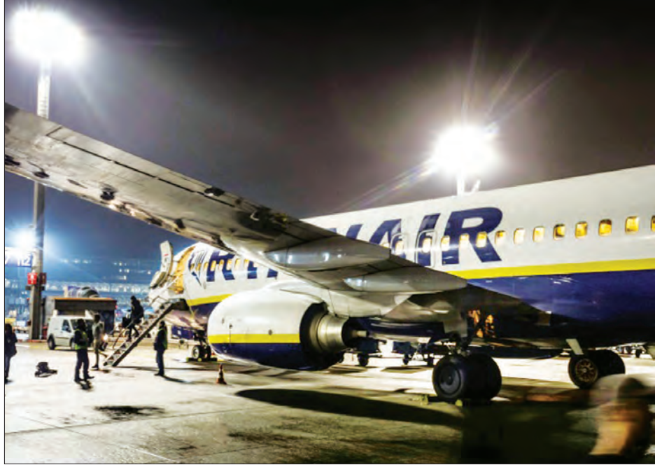
အေအက်စ်ပီ

ရှိုင်ယန်အဲလေကြောင်းလိုင်းမှ ဝန်ထမ်းများသည် လစာတိုးမြှင့်ပေးရေး၊ ဝန်ထမ်းများအတွက် အကျိုးဖြစ်ထွန်းမှုမရှိသော အလုပ်စာချုပ်များကို အဆုံးသတ်ပေးရေး တောင်းဆိုခဲ့ကြသည်။ လေကြောင်းလိုင်းဘက်ကမူ ဝန်ထမ်းများ သပိတ်မှောက်မှုကြောင့် ခရီးစဉ်ဖျက်သိမ်းခဲ့ရသည့် ခရီးသည်များကို တောင်းပန်ကြောင်း ပြောကြားခဲ့သည်။