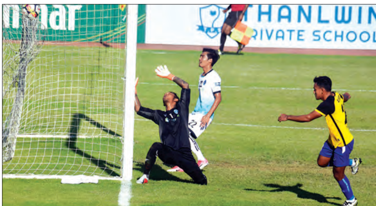
မကွေးအသင်းအတွက် ပထမဂိုးကို အောင်မြင်ထွန်းသွင်းယူနေစဉ်။

မူးယစ်ဆေးဝါး တားဆီးနှိမ်နင်းရေး လုပ်ငန်းများ အရှိန်မြှင့်ဆောင်ရွက်