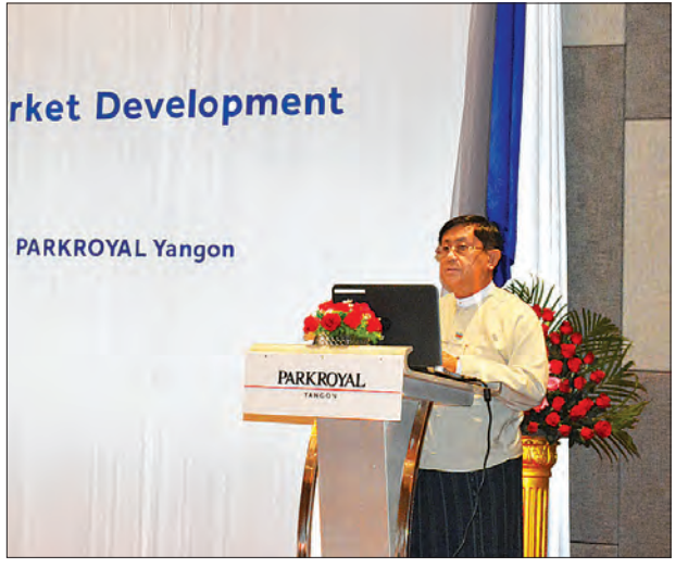
ဒုတိယဝန်ကြီး ဦးမောင်မောင်ဝင်း ငွေချေးသက်သေခံလက်မှတ်ဈေးကွက် ဖွံ့ဖြိုးတိုးတက်ရေးအတွက် ဖွဲ့စည်းထားသော မြန်မာ-ဂျပန် ပူးတွဲကော်မတီ၏ စတုတ္ထအကြိမ် အစည်းအဝေးတွင် အမှာစကားပြောကြားစဉ်။

အစည်းအဝေးသို့ ငွေချေးသက်သေခံလက်မှတ် လုပ်ငန်းကြီးကြပ်ရေးကော်မရှင် ဥက္ကဋ္ဌ၊ စီမံကိန်းနှင့်ဘဏ္ဍာရေးဝန်ကြီးဌာန ဒုတိယဝန်ကြီး ဦးမောင်မောင်ဝင်းနှင့် ကော်မရှင်အဖွဲ့ဝင်များ၊ ရန်ကုန်စတော့အိတ်ချိန်းမှ မန်နေဂျင်း ဒါရိုက်တာနှင့် တာဝန်ရှိသူများ၊ ဂျပန်သံရုံးမှ တာဝန်ရှိသူများ၊ ဂျပန်နိုင်ငံ JICA Expert၊ ဂျပန်နိုင်ငံမှ CBM၊ DICA နှင့် IRD တို့တွင် ခန့်အပ်ထားသည့် အကြံပေးပုဂ္ဂိုလ်များ၊ ဂျပန်နိုင်ငံ ဘဏ္ဍာရေးဝန်ကြီးဌာန၊ ဂျပန်အိတ်ချိန်းဂရု(ပီ)ဘဏ္ဍာရေးဝန်ဆောင်မှုကြီးကြပ်ရေးဌာန၊ ဒိုင်ဝါသုတေသနအဖွဲ့တို့မှ တာဝန်ရှိသူများ စုံညီစွာတက်ရောက်ကြသည်။ အစည်းအဝေးတွင် ရန်ကုန်စတော့အိတ်ချိန်း၌ စာရင်းဝင်ကုမ္ပဏီများ တိုးတက်လာစေရေးအတွက် ကျင်းပပြုလုပ်လျက်ရှိသည့် ရင်းနှီးမြှုပ်နှံမှုနှင့် ကမ်းလှမ်းရောင်းချခြင်းနှင့် သက်ဆိုင်သော ဆွေးနွေးပွဲများ သုံးလ တစ်ကြိမ်ကျင်းပပြုလုပ်လျက်ရှိသည့် ကိစ္စ၊ စက်တင်ဘာလတွင် ကျင်းပပြုလုပ်မည့်