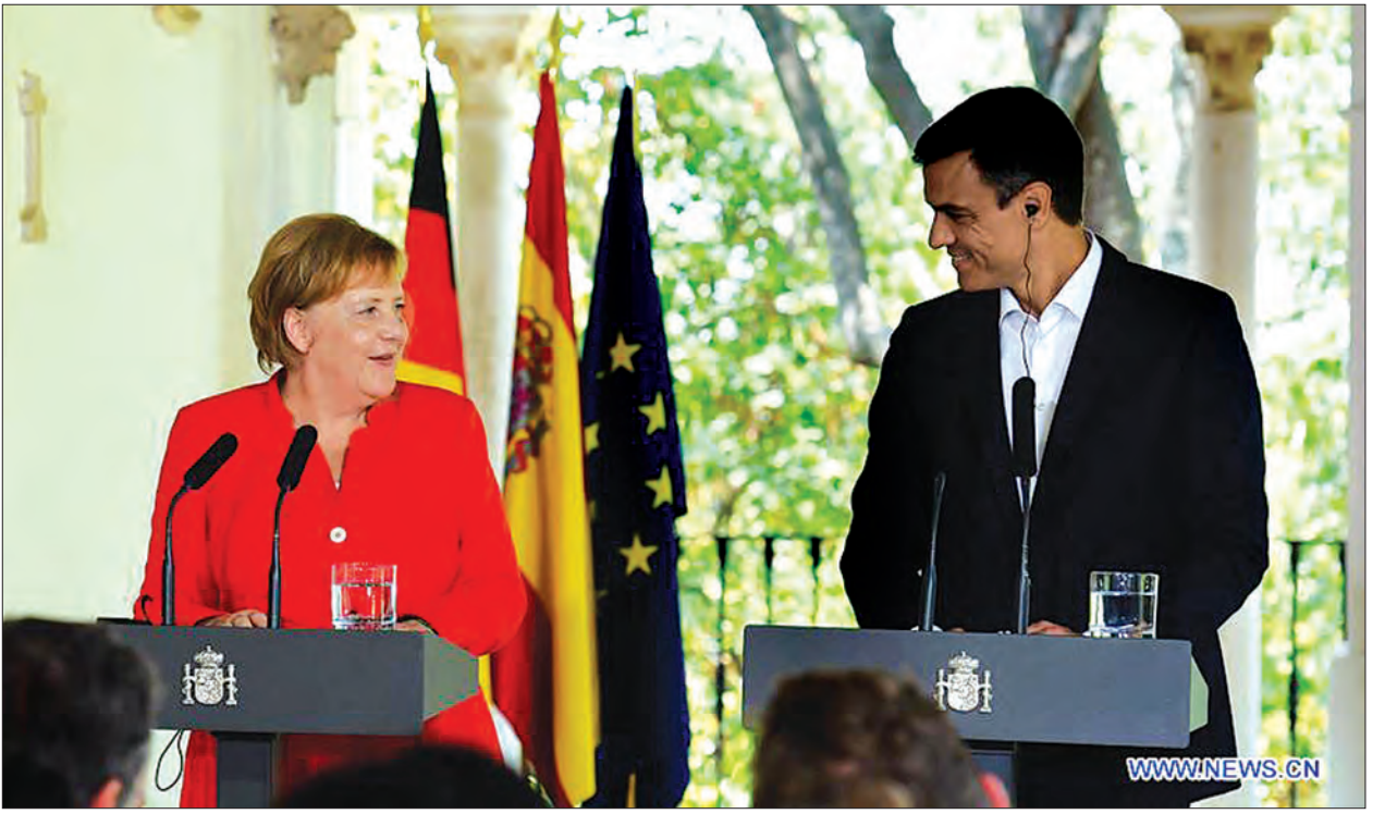
ရကြောင်း စပိန်ဝန်ကြီးချုပ်က ပြောသည်။ ဥရောပနယ်စပ်နှင့် ကမ်းရိုးတန်းများကို လုံခြုံအောင် ထိန်းသိမ်းထားရန် ဒုက္ခသည်အရေးကို မဖြေရှင်းနိုင်ကြောင်း၊ အာဖရိက

စပိန်နိုင်ငံသည်လည်း ဒုက္ခသည်များ လက်ခံရမှုအတွက် ဖိအားများနှင့်ရင်ဆိုင်နေ