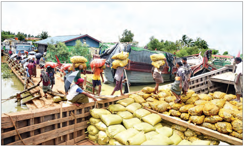
မောင်တောနယ်စပ်ကုန်သွယ်ရေးစခန်း၌ ကုန်စည်များတင်ပို့နေမှုကို တွေ့ရစဉ်။