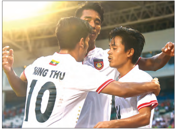
မြန်မာ ယူ-၂၃ အသင်း အားကစားသမားများ။

မူလက ကစားသမားသုံးဦးစလုံး လျှော့ချ ရန် စီစဉ်ထားသော်လည်း ဂိုးသမား သုံးဦးစလုံးကို ပြိုင်ပွဲကာလအတွင်း ခေါ်ဆောင်ထားမည်ဖြစ်သောကြောင့် ဂိုးသမားတစ်ဦးကို နောက်ဆုံးမှတ်ပုံတင် ခါနီးမှ လျှော့ချမည်ဖြစ်သည်။