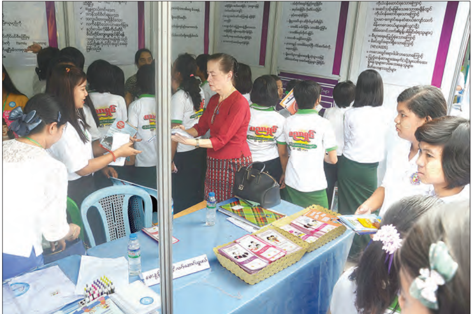
လူငယ်ဘက်စုံဖွံ့ဖြိုးရေးပွဲတော်(မန္တလေး)၌ ခင်းကျင်းပြသသည့် ရင်းနှီးမြှုပ်နှံမှုကလေးငယ်များ လျှော့ချရေးနှင့် ကာကွယ်စောင့်ရှောက်ရေးအသင်းပြခန်း၌ ကြည့်ရှုလေ့လာနေသည့် ကျောင်းသူလေးများကို တွေ့ရစဉ်။