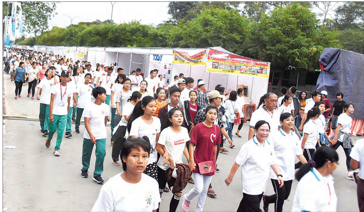
လူငယ်ဘက်စုံဖွံ့ဖြိုးရေးပွဲတော် (မန္တလေး)အထိမ်းအမှတ်အဖြစ် လူထုစုပေါင်းလမ်းလျှောက်ပွဲ၌ တက္ကသိုလ်၊ ကောလိပ်တို့မှ ကျောင်းသား ကျောင်းသူများ ပါဝင်ဆင်နွှဲနေမှုကို တွေ့ရစဉ်။

ယခုအဆောက်အအုံများသည် ပုသိမ်မြို့ ပန်းဆက်(၁၄) ရပ်ကွက်တွင်တည်ရှိပြီး အဆောက်အအုံအမျိုးအစားများမှာ ရှစ်ခန်းတွဲ ခြောက်ထပ်တိုက် ခုနစ်လုံး၊ ခြောက်ခန်းတွဲ ငါးထပ် တိုက် ၁၀ လုံး၊ နှစ်ခန်းတွဲ လေးထပ်တိုက် (Shop House) ငါးလုံး စုစုပေါင်း ၂၂ လုံး တည်ဆောက်ပြီးစီးလျက်ရှိကြောင်း သိရှိရသည်။ သတင်းစဉ်