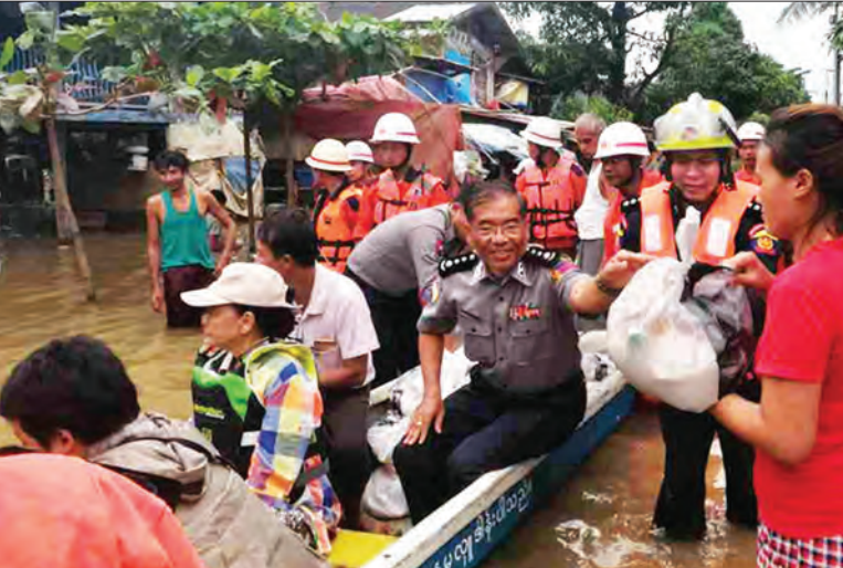
ရဲမှူးကြီးကြည့်လင်း ဦးစီးသည့် ရဲတပ်ဖွဲ့ဝင်များပါဝင်သည့် ပူးပေါင်းအဖွဲ့က ကူညီဆောင်ရွက်ပေးခဲ့ကြောင်း သိရသည်။

နေပြည်တော် ဩဂုတ် ၁၂ - ကရင်ပြည်နယ် ပြည်နယ်အစိုးရအဖွဲ့နှင့် ပြည်နယ်ရဲတပ်ဖွဲ့မှူးရဲမှူးကြီးကြည့်လင်း ဦးစီးသည့် တပ်ဖွဲ့ဝင်များပါဝင်သော ပူးပေါင်းအဖွဲ့က ဩဂုတ် ၁၁ ရက် နံနက် ၁၀ နာရီခွဲတွင် ဘားအံမြို့အမှတ်(၂) ရပ်ကွက်အတွင်း ရေကြီးနစ်မြုပ်သည့် လမ်းများတွင် နေထိုင်သော ရေဘေးသင့် အိမ်ထောင်စု ၄၃၀ အတွက် အိမ်ထောင်စုတစ်စုလျှင် ဆီတစ်လီတာဘူး တစ်ဘူး၊ ဆား ၅၀ သား၊ ကြက်သွန်နီ ၅၀ သား၊ ရေသန့်ဘူးတစ်ဘူးတို့အား လည်းကောင်း၊ အမှတ်(၁) ရပ်ကွက်နှင့် အမှတ်(၅) ရပ်ကွက်အတွင်းရှိ ရေနစ်မြုပ်နေသော ရေဘေးသင့်အိမ်ထောင်စု ၅၇၀ အတွက် အိမ်ထောင်စုတစ်စုလျှင် ဆန်သုံးပြည်၊ ဆီတစ်လီတာဘူး တစ်ဘူး၊ ဆား ၅၀ သား၊ ကြက်သွန်နီ ၅၀ သားတို့အား စက်လှေများဖြင့် လိုက်လံဝေငှပေးခဲ့ကာ ကူညီဆောင်ရွက်ပေးခဲ့ကြောင်း သိရသည်။