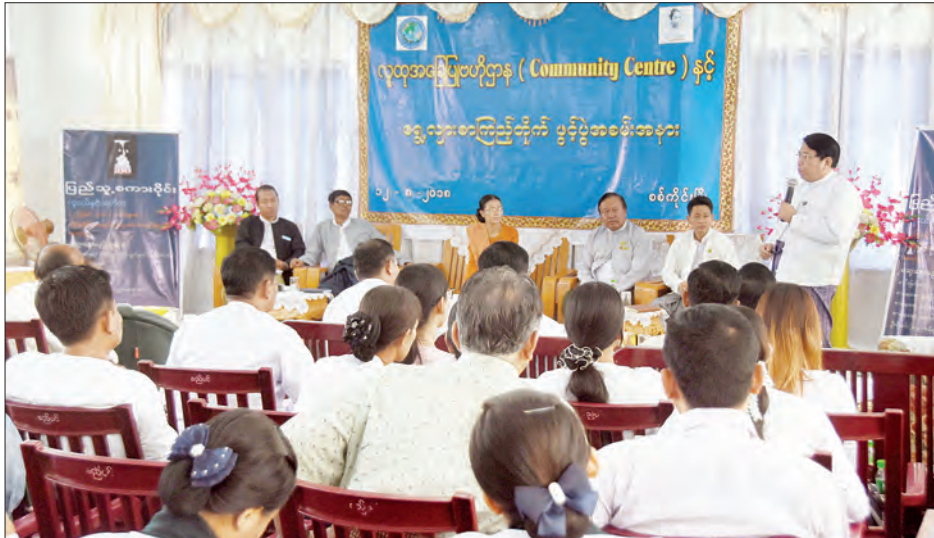
တစ်ယောက်နှင့် အဖွဲ့အစည်းကို ထိခိုက် ပြောဆိုခြင်းများအား ရှောင်ရှားပြီး ယခု စကားဝိုင်းမှ အစ ယဉ်ကျေးစွာဖြင့် ဆွေးနွေးပွဲ အောင်မြင်

များ တိုးပွားလာမှုနှင့် လူမှုရေးလုပ်ငန်း များ ဆောင်ရွက်နိုင်မှု အခြေအနေတို့ကို ဆွေးနွေးသည်။ ပြန်လည်ဆွေးနွေး ထို့နောက် တက်ရောက်လာကြသူ များ၏ မေးမြန်းဆွေးနွေးမှုများအပေါ် သက်ဆိုင်ရာဏှာအလိုက် ပြန်လည် ဆွေးနွေးဖြေကြားကြသည်။ ထိခိုက်ပြောဆိုခြင်းရှောင်ရှား ယင်းနောက် ပြည်ထောင်စုဝန်ကြီး ဒေါက်တာဖေမြင့်က ပြည်သူ့စကားဝိုင်း များတွင် ဒီမိုကရေစီအင်္ဂါရပ်များနှင့် အညီ ပွင့်ပွင့်လင်းလင်းနှင့် လွတ်လွတ် လပ်လပ် ဆွေးနွေးကြရမည်ဖြစ်ပါ ကြောင်း၊ ထိုသို့ ဆွေးနွေးရာတွင် တစ်ဦး