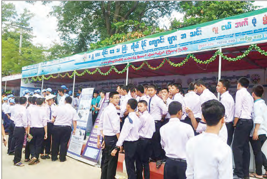
မန္တလေးတိုင်းဒေသကြီး ကိုယ်ပိုင်ကျောင်းများအသင်းပြခန်း၌ လာရောက်လေ့လာသည့် ကျောင်းသားများဖြင့် စည်ကားနေစဉ်။