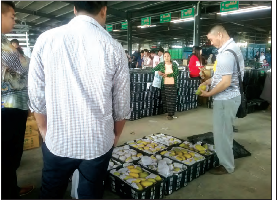
(၁၀၅) မိုင် ကုန်သွယ်ရေးဇုန်ရှိ မြန်မာ့သရက်သီးများကိုဝယ်ယူနေသော တရုတ်ကုန်သည်များ

မြန်မာနိုင်ငံသည် အခြားသောနိုင်ငံတို့ထက် တရုတ်နိုင်ငံ၏ သရက်သီးဈေးကွက်နှင့် နီးကပ်စွာရှိနေသည့်အတွက် ကောင်း မွန်သောအခွင့်အရေးကို ရရှိထားပြီဖြစ်ရာ သရက်သီး အရည် အသွေးပို၍ကောင်းမွန်လာစေရန်နှင့် ထုပ်ပိုးမှုပိုင်းတွင် အခြား နိုင်ငံများကဲ့သို့ ကောင်းမွန်သောထုပ်ပိုးမှုနည်းပညာများ