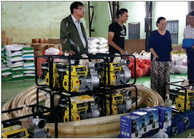
ကရင်ပြည်နယ်အတွင်း ဖြစ်ပွားလျက်ရှိသော ရေကြီး ရေလျှံမှုများကြောင့် ရေနစ်မြုပ်သွားသော ရေတွင်းရေ ကန်နှင့် အဝီစိတွင်းများမှ ရေဆိုးများကို စုပ်ထုတ်ရန် ရေစုပ်စက် ၁၀ စုံကို ဝေဠုကျော်စောင်ဒေသခံက ကရင် ပြည်နယ်ဝန်ကြီးချုပ် ဒေါ်နန်းခင်ထွေးမြင့်ထံသို့ ဩဂုတ် ၁၁ ရက်က ရေဘေးကယ်ဆယ်ရေး ပဟိကွပ်ကဲရေး စခန်း၌ ပေးအပ်လှူဒါန်းစဉ်။