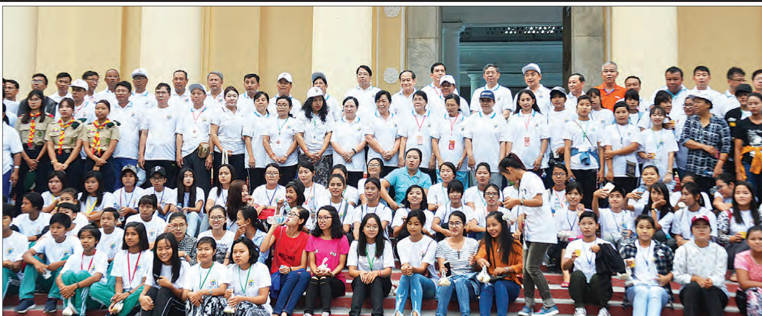
လူငယ်ဘက်စုံဖွံ့ဖြိုးရေးပွဲတော်(မန္တလေး) အထိမ်းအမှတ်အဖြစ် လူထုစုပေါင်းလမ်းလျှောက်ပွဲ၌ ပါဝင်ကြသူများ စုပေါင်းမှတ်တမ်းတင်ဓာတ်ပုံရိုက်စဉ်။