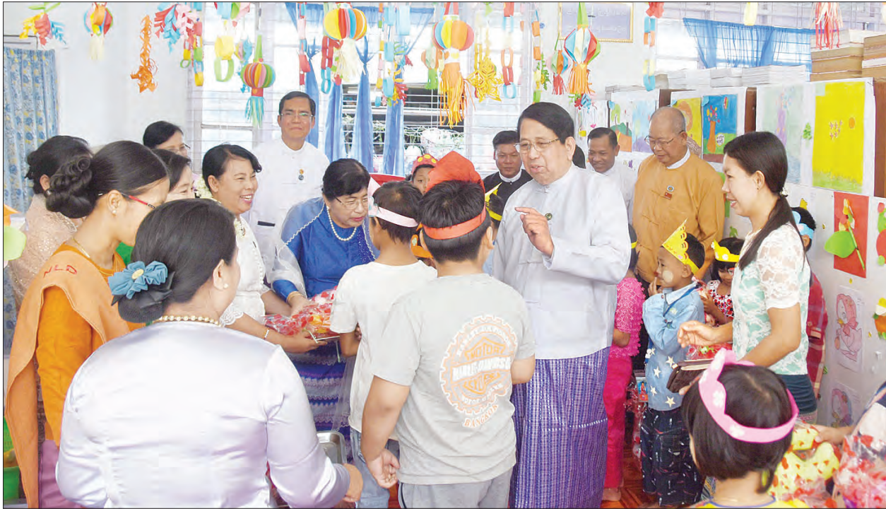
လှည့်လည်ကြည့်ရှုကြသည်။ အသိပညာပဟိုဠာပွဲအခမ်းအနား လူထုအခြေပြုပဟိုဠာနှင့် ရွှေလျား

တိုင်းဒေသကြီး လွှတ်တော်ဥက္ကဋ္ဌနှင့် တာဝန်ရှိသူများက လူထုအခြေပြုပဟို ဌာနဆိုင်ရာတို့နှင့် ရွှေလျားစာကြည့် တိုက်ယာဉ်တို့ကို အမွှေးနံ့သာရည်ဖြင့် ပက်ဖျန်းပေးကြသည်။ ထို့နောက် လူထုအခြေပြုပဟိုဠာရုံ ပြတိုက်ငယ်နှင့် ကလေးစာကြည့်တိုက် တို့ကို လှည့်လည်ကြည့်ရှုကြပြီး (ယာပုံ) စာကြည့်တိုက်သို့ ရောက်ရှိနေကြသည့် ကလေးငယ်များအား ပြည်ထောင်စု ဝန်ကြီးနှင့် ဦးစီးဌာနကြီးလွှတ်တော် ဥက္ကဋ္ဌ ဒုတိယဝန်ကြီးနှင့် တာဝန်ရှိသူများ က ကစားစရာ အရုပ်လက်ဆောင်ပစ္စည်း များ ပေးအပ်ကြသည်။ (အောက်ပုံ)