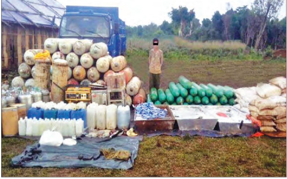
တောင့်၊ အိမ်-၂၂ ကျည်အိမ်(အရှည်) နှစ်ခု၊ အိမ်-၂၂ ကျည်အိမ်(အတို)တစ်ခု၊ လက်ပစ်ဗုံးတစ်လုံး၊ အိမ်ကွေးမင့်တစ်စုံနှင့် (အပေါ်ပုံ) ဥပဒေအရ အရေးယူထား ဆက်စပ်ပစ္စည်းများ သိမ်းဆည်းရမိသဖြင့် ကြောင်း သတင်းရရှိသည်။ သတင်းစဉ်

လားရှိုးမြို့နယ် မန်ဆာပန်ဝကျေးရွာအနီး မေ ၂၅ ရက် မွန်းတည့် ၁၂ နာရီတွင် တပ်မတော်မှ နယ်မြေရှင်းလင်းစဉ် တဲနစ်လုံးအားတွေ့ရှိပြီး အရပ်ဝတ်ဖြင့် လူခြောက်ဦးမှာ တဲအတွင်းမှ ထွက်ပြေးသွား၍ ဆက်လက်ရှာဖွေရာ တဲအနီးရှိ ဒေါင်ဖန်းဖောယာဉ်အတွင်းမှ အောင်မြတ်(ခ) အားတိုကို လည်းကောင်း၊ တဲအတွင်းမှ အိုက်စစ်တစ်ကီလို၊ ဆူဒိုအက်ဖီဒရင်းအမူနီ ၇ ဒဿမ ၅ ကီလို၊ ဟိုက်ဒြိုကလိုရစ်အက်စစ် ၅၅ လီတာ၊ ဆိုဒီယမ်ဟိုက်ဒြိုဆိုက် ၁၅၀၀ ကီလို၊ အက်စစ်တစ်အင်ဟိုက်ဒြိုဆိုက် ၄၀၀ ကီလို၊ သိုင်အိုနိုင်းကလိုရိုင်း အရည် ၁၆ လီတာ၊ တာတာရစ်အက်စစ်အမူနီကီလို ၂၀၊ အရောင်ဆိုးဆေးအမူနီ လေးကီလို၊ ဆား ၄၀၀ ကီလို၊ ပလတ်စတစ်ကပ်ခွာ အိတ် ၄၀၀ လီ၊ ၂၅၀ အိတ်၊ အမြင့် လေးပေခန့်ရှိ ဂက်(စ်)အိုး(အကြီး)အလုံး ၄၀၊ ဂက်(စ်)အိုး(အလတ်)၃၂ လုံး၊ အမြင့် သုံးပေခန့်ရှိ ဂက်(စ်)အိုး(အသေး) ၁၉ လုံး၊ မီးစက်တစ်လုံး၊ မော်တာတပ်ဆင်ထားသည့် မွေစက်တစ်လုံး၊ ပလတ်စတစ်အိတ် ပိတ်စက်တစ်လုံး၊ ဓာတ်ခွဲခန်းသုံး ခေါင်းစွပ်လေးခု၊ အခြောက်ခံသံဗလား သုံးခု၊ ပွိုင့် ၂၂ မောင်းပြန်ရိုင်ဖယ် တစ်လက်၊ ကျည်အိမ်တစ်ခု၊ ပွိုင့် ၂၂ ကျည်ရစ်တောင့်၊ အိမ်-၂၂ ကျည် ၄၃