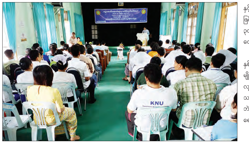
မင်းရာဇာ

အမျိုးသားတွေအနက် ၄၉ ဒသမ ရာခိုင်နှုန်းနဲ့ အရွယ်ရောက်ပြီး အမျိုးသမီး ၈ ဒသမ ၄ ရာခိုင်နှုန်းဟာ လတ်တလော ဆေးလိပ်သောက်သုံးနေကြသူများ ဖြစ်ကြပါတယ်။ အမျိုးသား ၆၂ ဒသမ ၂ ရာခိုင်နှုန်း၊ အမျိုးသမီး ၂၄ ဒသမ ၈ ရာခိုင်နှုန်းဟာ ကွမ်းယာနှင့် ဆေးရွက်ကြီးထွက် ပစ္စည်းတွေကို လတ်တလော တွဲဖက်သုံးစွဲနေကြတာတွေရှိပြီး အရှေ့တောင်အာရှနိုင်ငံတွေမှာ သုံးစွဲမှုအများဆုံးဖြစ်တယ်” ဟု ပြည်နယ်လူမှုရေးဝန်ကြီး ဒေါက်တာ တင်ဝင်းကျော်က ပြောသည်။