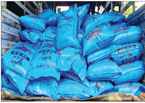
ယာဉ်ပေါ်တွင် တရားဝင်စာရွက်စာတမ်းအထောက်အထားတင်ပြနိုင်ခြင်း မရှိသည့် အမိန့်ယမ်းနိက်ထရိုက် (၉၉ ဒဿမ ၃၉ ရာခိုင်နှုန်း) (၃၃၇ အိတ်) (၁၆၇၀၀ ကီလိုဂရမ်ခန့်) နှင့် ပစ္စည်းသယ်ဆောင်သည့်ယာဉ်တစ်စီး စုစုပေါင်းခန့်မှန်း တန်ဖိုးငွေကျပ် ၃၂ ဒဿမ ၅၇၂ သန်းခန့်အား တွေ့ရှိ၍ ဖမ်းဆီးခဲ့ကြောင်း သတင်းရရှိသည်။ သတင်းစဉ်

နေပြည်တော် မေ ၃၁ တရားမဝင်ကုန်စည်များ တားဆီးထိန်းချုပ်ရေးအတွက် ရေပူနှင့်မရမ်းချောင်း အမြဲတမ်းစစ်ဆေးရေးစခန်းတို့ အားဌာနဆိုင်ရာ ပူးပေါင်းအဖွဲ့များဖြင့် ၂၀၁၇ ခုနှစ် မတ် ၁ ရက်က စတင်ဖွင့်လှစ်ဆောင်ရွက်ခဲ့ပြီး မေ ၃၀ ရက်တွင် မန္တလေး- မုဆယ်ပြည်ထောင်စုလမ်းမကြီးတစ်လျှောက် ကုန်သွယ်မှုယာဉ်ပို့ကုန် ၁၂၈၄ စီး၊ သွင်းကုန် ၉၄၇ စီး၊ ရန်ကုန်-မြဝတီလမ်းမကြီးတစ်လျှောက် ကုန်သွယ်မှုယာဉ်ပို့ကုန် ၅၇ စီး၊ သွင်းကုန် ၁၆၂ စီးကုန်စည်များ သယ်ယူပို့ဆောင်လျက်ရှိသည်။ အဆိုပါ စစ်ဆေးရေးစခန်းများက တင်သွင်း၊ တင်ပို့သော ကုန်ပစ္စည်းများ