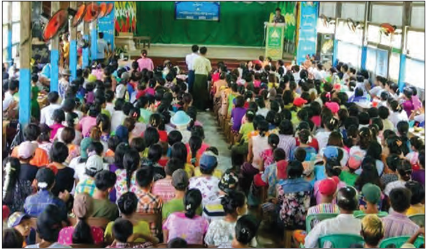
မြို့နယ်(ပြန်/ဆက်)

အမှတ်တံဆိပ်ပါသည့် တီရှပ်များနှင့် ကျောပိုးအိတ်များ လက်ဆောင်အဖြစ် ပြန်လည်ပေးအပ်ခဲ့ကြောင်း သိရသည်။