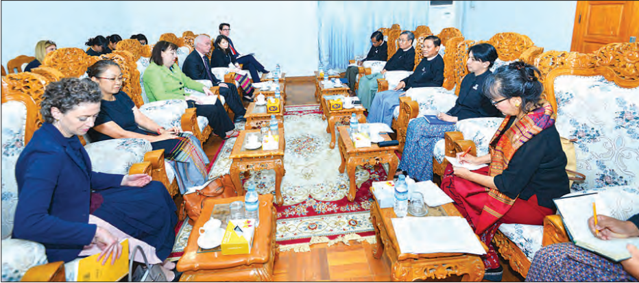
ကို ကာကွယ်စောင့်ရှောက်ရေးကိစ္စ၊ ရောက်စွာ အရေးယူဆောင်ရွက်နိုင် ကိုအတည်ပြုနိုင်ရေးကိစ္စများကို တွေ့ဆုံ ဆွေးနွေးခဲ့ကြသည်။

(ယာဝုံ) တွေ့ဆုံဆွေးနွေးရာတွင် ကလေးသူငယ်အခွင့်အရေးများဆိုင်ရာ ဥပဒေကြမ်း ပြဋ္ဌာန်းနိုင်ရေးကိစ္စ၊ လက်နက်ကိုင်ပဋိပက္ခကြောင့် ထိခိုက်နစ်နာသော ကလေးသူငယ်များ၏ အခွင့်အရေးများ