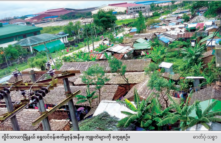
လိုင်သာယာမြို့နယ် ရွှေလင်းဝန်းစက်မှုဇုန်အနီးမှ ကျူးကျော်မှုများကို တွေ့ရစဉ်။

ထိုပြင် တိုင်းဒေသကြီးဝန်ကြီးက ဆက်လက်ဖြေကြားရာတွင် ကျူးကျော်များ ရှင်းလင်းရေးနှင့် စက်မှုဇုန်များ အဆင့်မြှင့်တင် ရေးတို့သည် အရေးကြီးပြီး တစ်ပြိုင်နက်တည်းဆောင်ရွက်ရမည့် လုပ်ငန်းများဖြစ်သည့်အတွက် အချိန်အတီအကျမပြောနိုင် သော်လည်း တစ်ချိန်တည်းတစ်ပြိုင်တည်း အရှိန်အဟုန်ဖြင့် လုပ် ဆောင်နေပါကြောင်း ဖြေကြားခဲ့သည်။ ထင်ပေါင်း(ကမာရွတ်)