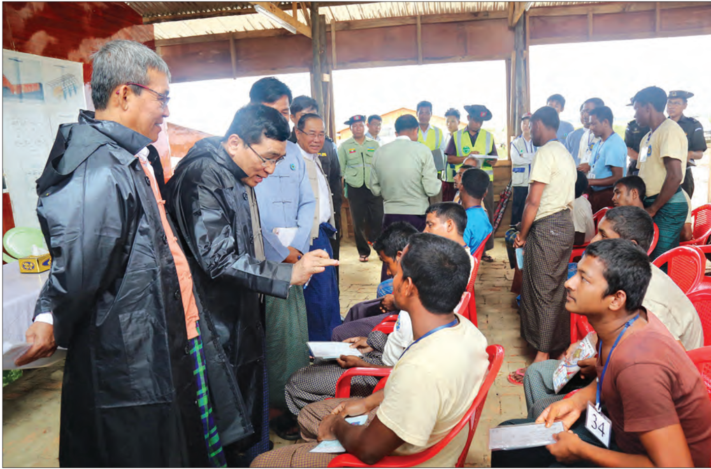
စစ်တွေ မေ ၃၀

လူမှုဝန်ထမ်း၊ ကယ်ဆယ်ရေးနှင့် ပြန်လည်နေရာချထားရေး ဝန်ကြီးဌာန ပြည်ထောင်စုဝန်ကြီး ဒေါက်တာဝင်းမြတ်အေးသည် ရခိုင်ပြည်နယ်ဝန်ကြီးချုပ် ဦးညီပု၊ ပြည်နယ်ဝန်ကြီး ဦးအောင်ကျော်စံနှင့်အတူ ယနေ့ နံနက်ပိုင်းတွင် စစ်တွေမြို့မှ မောင်တောမြို့နယ်ရှိ လှဖိုးခေါင်ကြားစခန်းသို့ ရောက်ရှိပြီး မိမိသဘောဆန္ဒအလျောက် ပြန်လည်ဝင်ရောက်လာသူများအား ၎င်းတို့၏ မူလနေထိုင်ရာနေရာများ (သို့မဟုတ်) အနီးစပ်ဆုံးနေရာများသို့ နေရာချထားရန် ဆောင်ရွက်နေမှုများကို သွားရောက်ကြီးကြပ် ဆောင်ရွက်သည်။ (စပုံ) ပြည်ထောင်စုဝန်ကြီးနှင့် အဖွဲ့သည် မိမိသဘောဆန္ဒအလျောက် ပြန်လည်ဝင်ရောက်လာသူများအား အလုပ်သမား၊ လူဝင်မှုကြီးကြပ်ရေးနှင့် ပြည်သူ့အင်အားဝန်ကြီးဌာနက ဆောင်ရွက်ပေးလျက်ရှိသော နိုင်ငံသားလျှောက်ထားသည့် အစီအစဉ်တွင် ပထမအဆင့် NV Card ကိုင်ဆောင်ခြင်း၊ တစ်ပြိုင်တည်းမှာပင် နိုင်ငံသားစိစစ်မှုကို ဥပဒေနှင့်အညီ ခံယူရန်လိုအပ်သော လျှောက်လွှာများဖြည့်ခြင်း၊ လူမှုဝန်ထမ်းဦးစီးဌာန တာဝန်ရှိသူများက ဘင်္ဂလားဒေ့ရှ်တွင် ကျန်ရှိသော ၎င်းတို့၏မိသားစုဝင်များအား သံတမန်နည်းလမ်းဖြင့် ဆက်သွယ်ခေါ်ယူပေးနိုင်ရေး စီစဉ်ဆောင်ရွက်ပေးရန် ဘင်္ဂလားဒေ့ရှ်ဒုတိယဝန်ကြီးချုပ်နှင့် မိသားစုစာရင်းများ ရယူခြင်းနှင့် လူမှုဝန်ထမ်း၊ ကယ်ဆယ်ရေးနှင့် ပြန်လည်နေရာချထားရေးဝန်ကြီးဌာန၊ ဘေးအန္တရာယ်ဆိုင်ရာ စီမံခန့်ခွဲမှုဦးစီးဌာနမှ ဆန်း၊ ဆီ၊ ဆား၊ ပဲရိက္ခာအစရှိရာ ထောက်ပံ့နေမှုနှင့် စာမျက်နှာ ၁၀ ကော်လံ ၅ ❖