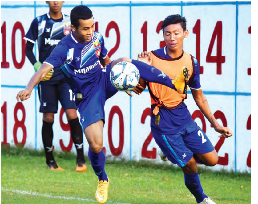
မြန်မာ ယူ-၁၉ အသင်း လေ့ကျင့်မှုပြုလုပ်နေစဉ်။

၂၀၁၈ အာဆီယံ ယူ-၁၉ ပြိုင်ပွဲကို ဇူလိုင် ၁ ရက်မှ ၁၄ ရက်အထိ အင်ဒိုနီးရှားနိုင်ငံ၌ ကျင်းပမည်ဖြစ်ပြီး မြန်မာအသင်းသည် အဖွင့်ပွဲအဖြစ် တီမောအသင်းနှင့် စတင်ယှဉ်ပြိုင်ကစားရမည်ဖြစ်သည်။ ယင်းပြိုင်ပွဲကို မူလက ဇူလိုင် ၂ ရက်မှ ၁၄ ရက်အထိ ကျင်းပရန် စီစဉ်ထားသော်လည်း တစ်ရက်ရှေ့တိုးကာ ဇူလိုင် ၁ ရက်တွင် စတင်မည်ဖြစ်သည်။ ပြိုင်ပွဲတွင် အရှေ့တောင် အာရှနိုင်ငံ ၁၁ နိုင်ငံစလုံး ဝင်ရောက်ယှဉ်ပြိုင်မည်ဖြစ်ပြီး အုပ်စု (က) တွင် ထိုင်း၊ အင်ဒိုနီးရှား၊ ဗီယက်နမ်၊ စင်ကာပူ၊ လာအို၊ ဖိလစ်ပိုင်၊ အုပ်စု (ခ) တွင် မလေးရှား၊ မြန်မာ၊ တီမော၊ ကမ္ဘောဒီးယားနှင့် ဘရူနိုင်းအသင်းတို့ပါဝင်နေသည်။ အုပ်စုပွဲများကို ဇူလိုင် ၁ ရက်မှ ၁၀ ရက်အထိ ကျင်းပမည်ဖြစ်ပြီး ဆီမီးဖိုင်နယ်ပွဲများကို ဇူလိုင် ၁၂ ရက်၊ တတိယလှည့်နှင့် ဗိုလ်လှည့်ကို ဇူလိုင် ၁၄ ရက်တွင် ကျင်းပမည်ဖြစ်သည်။ မြန်မာအသင်းသည် အုပ်စုပွဲများအဖြစ် ဇူလိုင် ၁ ရက်တွင် တီမောအသင်း၊ ဇူလိုင် ၅ ရက်တွင် ကမ္ဘောဒီးယား၊ ဇူလိုင် ၇ ရက်တွင် ဘရူနိုင်းအသင်း၊ စာမျက်နှာ ၁၂ ကော်လံ ၅ ●