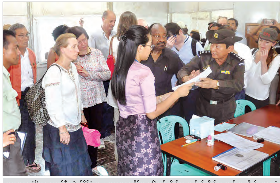
ကုလသမဂ္ဂလုံခြုံရေးကောင်စီအဖွဲ့ဝင်နိုင်ငံများမှ ကုလသမဂ္ဂဆိုင်ရာ အမြဲတမ်းကိုယ်စားလှယ်နှင့် ကိုယ်စားလှယ်များ ပါဝင်သောအဖွဲ့အား တောင်ပြိုလက်ဝဲ ပြန်လည်လက်ခံရေး စခန်း၌ NVC ကတ် ထုတ်ပေးသွားမည့် အစီအစဉ်များကို တာဝန်ရှိသူများက ရှင်းလင်းပြောကြားစဉ်။