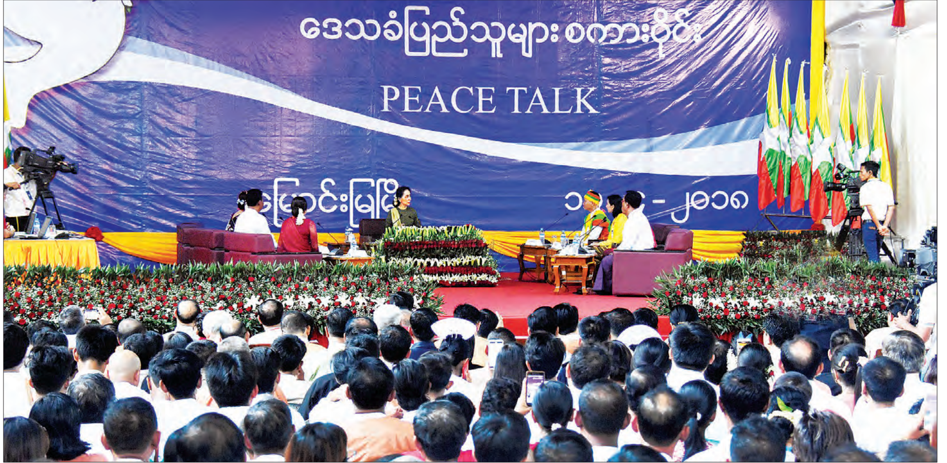
၁၀-၄-၂၀၁၈ ရက်က နိုင်ငံတော်၏ အတိုင်ပင်ခံပုဂ္ဂိုလ် ဒေါ်အောင်ဆန်းစုကြည်နှင့် ဒေသခံပြည်သူများ စကားစိုင်း (PEACE TALK) ကို မြောင်းမြမြို့၌ ကျင်းပစဉ်။

ပြည်သူက တစ်ခဲနက်ရွေးချယ်တင်မြှောက်ခဲ့သော ပြည်သူ့အစိုးရ၏ သက်တမ်းမှာ နှစ်နှစ်ပြည့်မြောက်ခဲ့ပြီဖြစ်သည်။ နှစ်နှစ်တာကာလအတွင်း နိုင်ငံ၏ နိုင်ငံရေး၊ စီးပွားရေး၊ လူမှုရေးနယ်ပယ်အသီးသီးတွင် ဖွံ့ဖြိုးတိုးတက်မှုရရှိစေရန် ပြုပြင်ပြောင်းလဲမှုများပြုလုပ်ကာ နိုင်ငံတည်ဆောက်ရေးလုပ်ငန်းများကို အားကြီးမာန်တက် ဆောင်ရွက်ခဲ့သည့် ပြည်သူ့အစိုးရ၏ ပြည်သူ့အတွက် ကြိုးပမ်းဆောင်ရွက်မှုများမှာ အားလုံးကောင်းမွန်အောင်မြင်ပါသည်ဟူ၍ မဆိုနိုင်သေးသည့်တိုင် သိသာထင်ရှားစွာ မြင်တွေ့နိုင်သည့် အောင်မြင်မှုများ၊ မမြင်တွေ့နိုင်သည့် အောင်မြင်မှုများ၊ စိန်ခေါ်မှုများနှင့် ရုန်းကန်နေရဆဲလုပ်ငန်းစဉ်များဟူ၍ တွေ့ရမည်ဖြစ်သည်။ နိုင်ငံတော်အစိုးရ၏ ဒုတိယ (၁)နှစ်တာကာလအတွင်း ပြည်သူများအတွက် ကြိုးပမ်းဆောင်ရွက်မှုများကို ဝန်ကြီးဌာနများ၊ ပြည်ထောင်စုအဆင့်အဖွဲ့အစည်းများ၊ တိုင်းဒေသကြီးနှင့် ပြည်နယ်များအလိုက် မှတ်တမ်းပြုတင်ပြအပ်ကြောင်း။