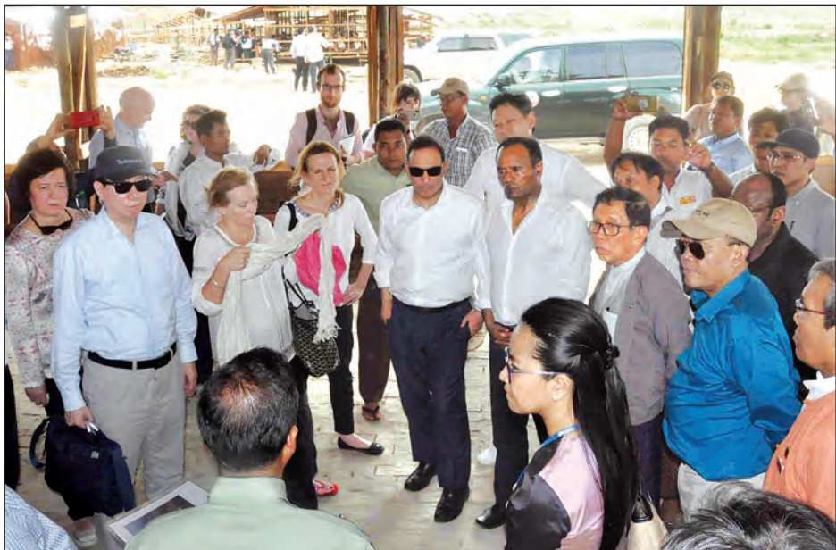
ကုလသမဂ္ဂလုံခြုံရေးကောင်စီအဖွဲ့ဝင်နိုင်ငံများမှ ကုလသမဂ္ဂဆိုင်ရာ အမြဲတမ်းကိုယ်စားလှယ်နှင့် ကိုယ်စားလှယ်များ ပါဝင်သောအဖွဲ့အား လူဖိုးခေါင်ကြားစခန်း၌ အဆောက်အအုံ များ တည်ဆောက်ပြီးစီးမှုအခြေအနေကို တာဝန်ရှိသူများက ရှင်းလင်းပြောကြားစဉ်။