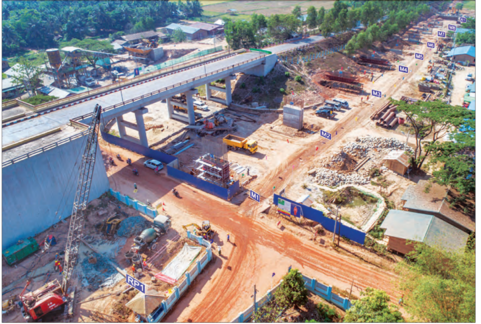
၁၂-၄-၂၀၁၈ ရက်က မြောင်းမြဘက်ကမ်း မြောင်းမြတံတားတည်ဆောက်ရေးလုပ်ငန်းများ လုပ်ဆောင်နေမှုကို တွေ့ရစဉ်။

ဖြင့် စိုက်ပျိုးရေးကဏ္ဍ ဖွံ့ဖြိုးတိုးတက်ရေး အလေးပေးဆောင်ရွက်မှုနှင့်အတူ စီးပွားရေး၊ ပညာရေး၊ ကျန်းမာရေး၊ လူမှုရေး စသည်ဖြင့် ကဏ္ဍ ပေါင်းစုံ တိုးတက်ရေးအတွက် ကြိုပမ်းဆောင်ရွက် လျက်ရှိပြီး ကျန်ရှိနေသေးသည့် အစိုးရသက်တမ်း သုံးနှစ်တာကာလအတွင်းမှာလည်း တိုင်းဒေသကြီး ဖွံ့ဖြိုးတိုးတက်ရေးအတွက် ဆက်လက်ကြိုးပမ်း ဆောင်ရွက်သွားမည်ဖြစ်ပါကြောင်း တင်ပြအပ် ပါသည်။ ။