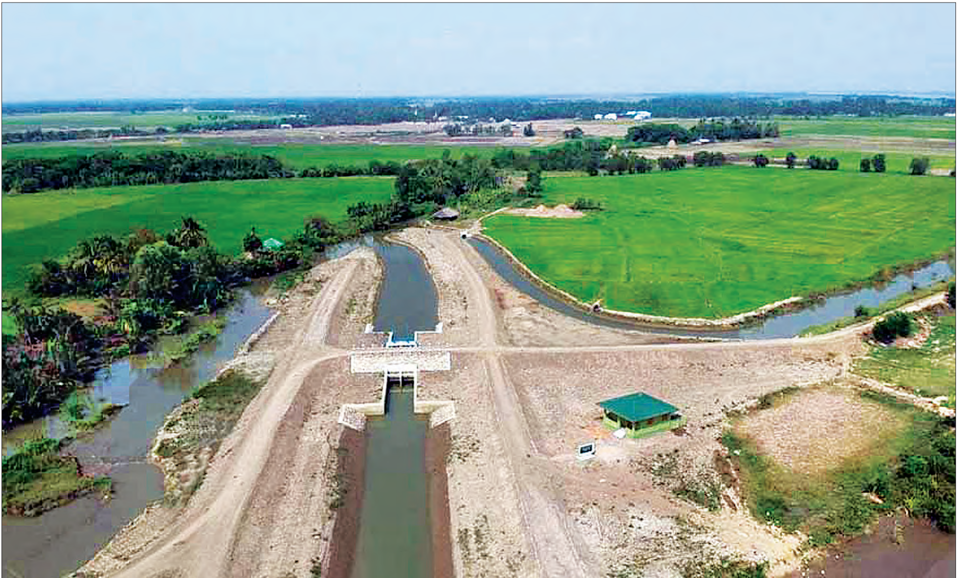
ရာဇဝတီတိုင်းဒေသကြီး လပွတ္တာခရိုင် ရွေးမြစ်နှင့် ပြာမလောမြစ်အကြားရှိ ကျွန်းများအား ရေငန်ဝင်ရောက်မှုမှ ကာကွယ်ပေးနိုင်ရန် ရေငန်တားတာများနှင့် ရေတံခါးများ တည်ဆောက်ထားမှုကို တွေ့ရစဉ်။