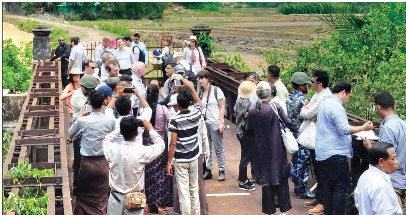
ကုလသမဂ္ဂလုံခြုံရေးကောင်စီအဖွဲ့ဝင်နိုင်ငံများမှ ကုလသမဂ္ဂဆိုင်ရာ အမြဲတမ်းကိုယ်စားလှယ်နှင့် ကိုယ်စားလှယ်များ ပါဝင်သောအဖွဲ့ မြန်မာ-ဘင်္ဂလားဒေ့ရှ် နှစ်နိုင်ငံချစ်ကြည်ရေးတံတားအား ကြည့်ရှုစဉ်။

ဆက်လက်၍ အမြဲတမ်းကိုယ်စားလှယ်နှင့် ကိုယ်စားလှယ်များပါဝင်သောအဖွဲ့သည် လူဖိုးခေါင်ကြားစခန်းသို့ ရောက်ရှိ