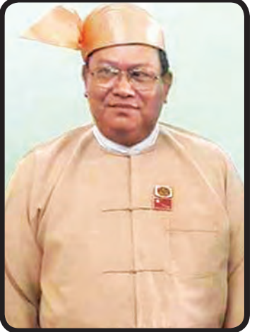
ရော့တီတိုင်းဒေသကြီး ဝန်ကြီးချုပ် ဦးလှမိုးအောင်