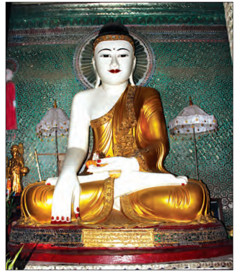
သိမ်ကြီးအတွင်းမှ ရှေးဟောင်းရုပ်ပွားတော်တစ်ဆူ

ဗားကရာကျောင်းတိုက်ကြီးအတွင်း တည်ရှိသော “အတု