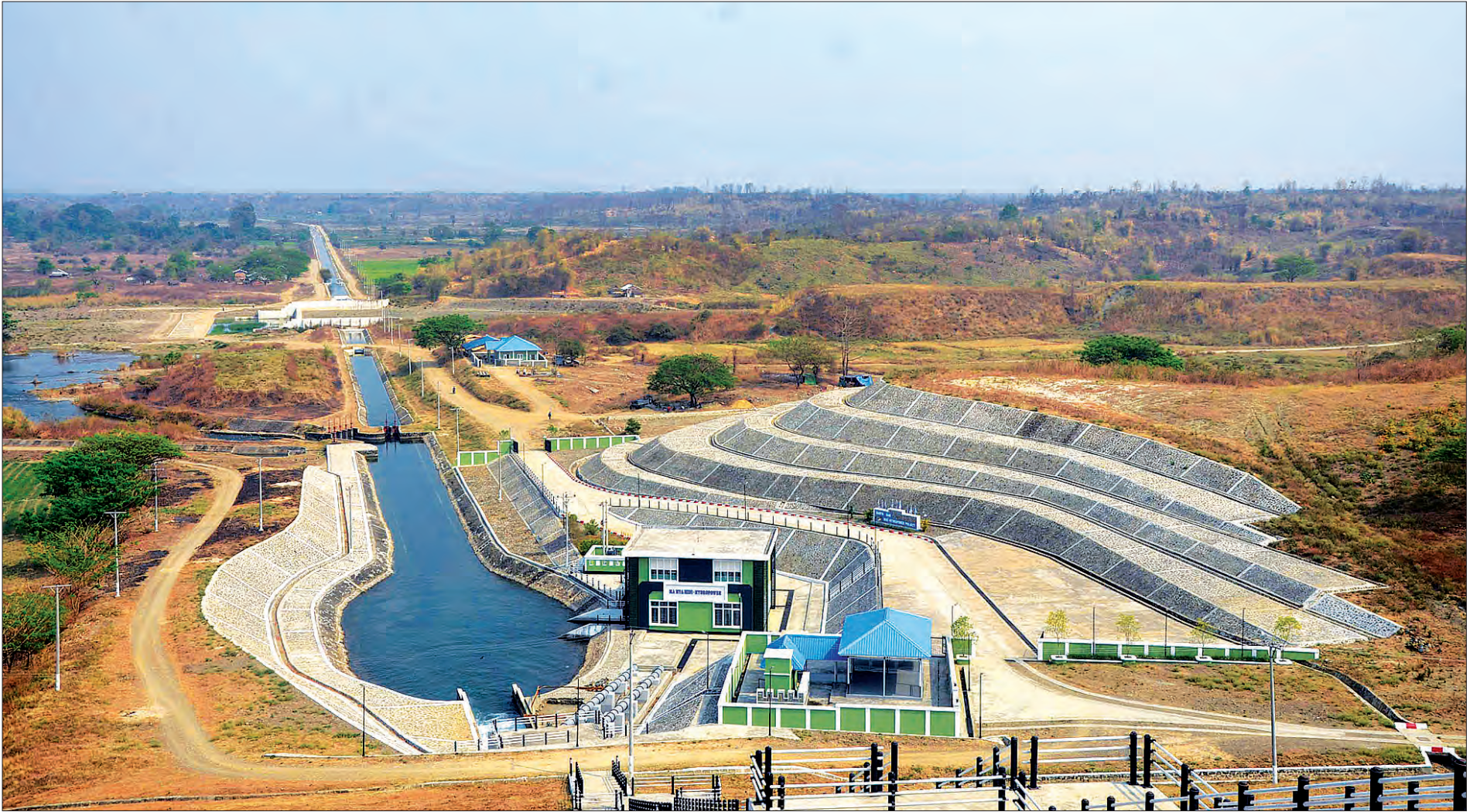
ဧရာဝတီတိုင်းဒေသကြီး မြန်အောင်မြို့နယ်တွင် တည်ဆောက်ထားသည့် မမြရေလှောင်တံစီမံကိန်းမှ အသေးစားရေအားလျှပ်စစ်စက်ရုံကို တွေ့ရစဉ်။