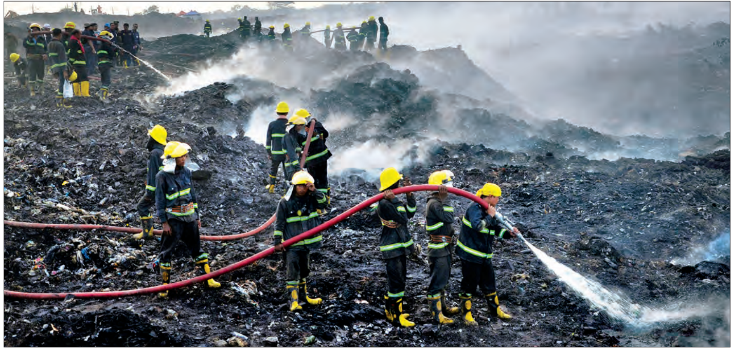
ထိန်းပင်အမှိုက်ပုံစီးလောင်မှု အမြန်ဆုံးငြိမ်းနိုင်ရေးအတွက် မီးသတ်တပ်ဖွဲ့ဝင်များ ကြိုးစားငြိမ်းသတ်နေကြစဉ်။