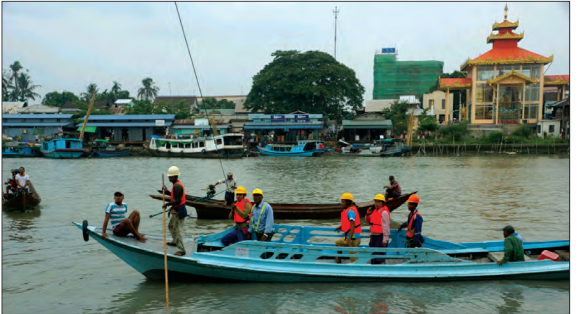
မြောင်းမြမြို့နဲ့ မြစ်ကူး စိုက်ဘာကြီးတပ်ဆင်ရန် ဆောင်ရွက်နေသော ဆက်သွယ်ရေးဝန်ထမ်းများကို တွေ့ရစဉ်။

“လျှပ်စစ်ကဏ္ဍမှာဆိုရင် ပုသိမ်မရမ်း ချောင်းမှာ 10MVA ဓာတ်အားခွဲရုံနဲ့ မြက်တိုမှာ ၃၃ ကေစီဓာတ်အားလိုင်း ခြောက်မိုင် တိုးချဲ့ တည်ဆောက်နိုင်ခဲ့ပါတယ်။ ဓာတ်အားပေး စနစ်အနေနဲ့ ကျေးရွာ ၁၁၇ ရွာ မီးလင်းရေး ဆောင်ရွက်နိုင်ပြီးတော့ ဓာတ်အားသုံးစွဲသူ ၂၄၁၁၈၃ ဦး ပိုမိုအသုံးပြုလာနိုင်ခဲ့ပါတယ်။ ဓာတ်အားလိုင်း ၂၃၉ ဒဿ ၅၇၅ မိုင်၊ ဓာတ်တိုင် ၉၁၅၇ တိုင် အစားထိုးလဲလှယ်ခြင်း၊ အသစ် တပ်ဆင်ခြင်းတွေအပါအဝင် Solar စနစ်နဲ့ ကျေးရွာ ၈၃၃ ရွာမှာ လမ်းမီးတိုင်တွေ ဆောင်ရွက်ပေးခဲ့ပါတယ်” ဟု တိုင်းဒေသကြီး