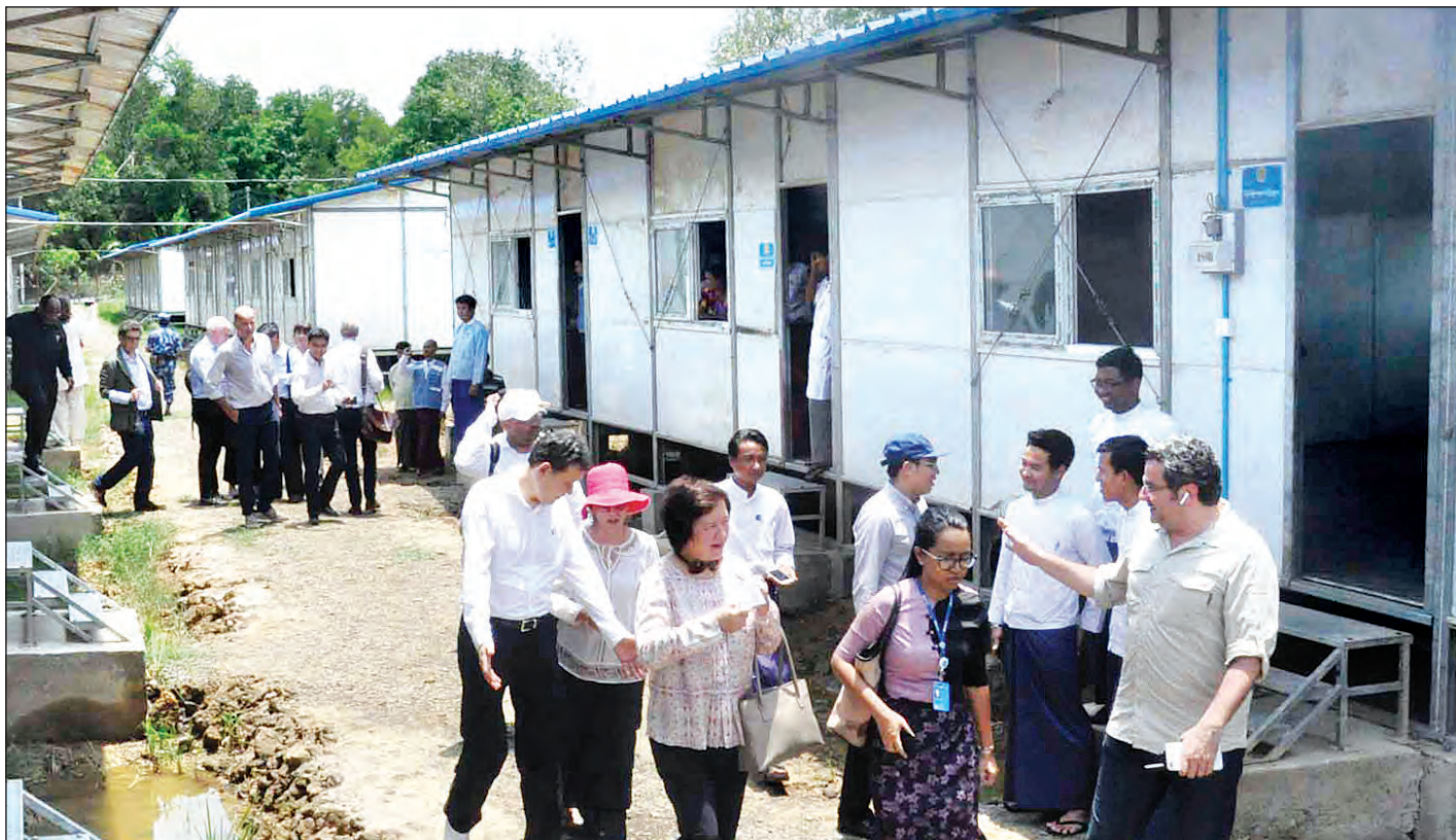
ကုလသမဂ္ဂလုံခြုံရေးကောင်စီအဖွဲ့ဝင်နိုင်ငံများမှ ကုလသမဂ္ဂဆိုင်ရာ အမြဲတမ်းကိုယ်စားလှယ်နှင့် ကိုယ်စားလှယ်များ ပါဝင်သောအဖွဲ့ တောင်ပြိုလက်ဝဲပြန်လည်လက်ခံရေးစခန်း၌ လိုက်လံကြည့်ရှုစဉ်။

ရှေ့မှ လူသားချင်းစာနာထောက်ထားမှု အကူအညီအထောက်အပံ့ပေးရေး၊ ပြန်လည်နေရာချထားရေး၊ ဖွံ့ဖြိုးရေးစီမံကိန်း (UEHRD) ဖြစ်ပေါ်လာပုံ၊ UEHRD ၏ လက်ရှိဆောင်ရွက်နေသည့် လုပ်ငန်းစဉ်များ၊ ရေရှည်တည်ငြိမ်အေးချမ်းရေးနှင့် ဖွံ့ဖြိုးတိုးတက်ရေးအတွက် ဆောင်ရွက်သွားမည့် အစီအမံများနှင့် စပ်လျဉ်း၍ ရှင်းလင်းပြောကြားသည်။