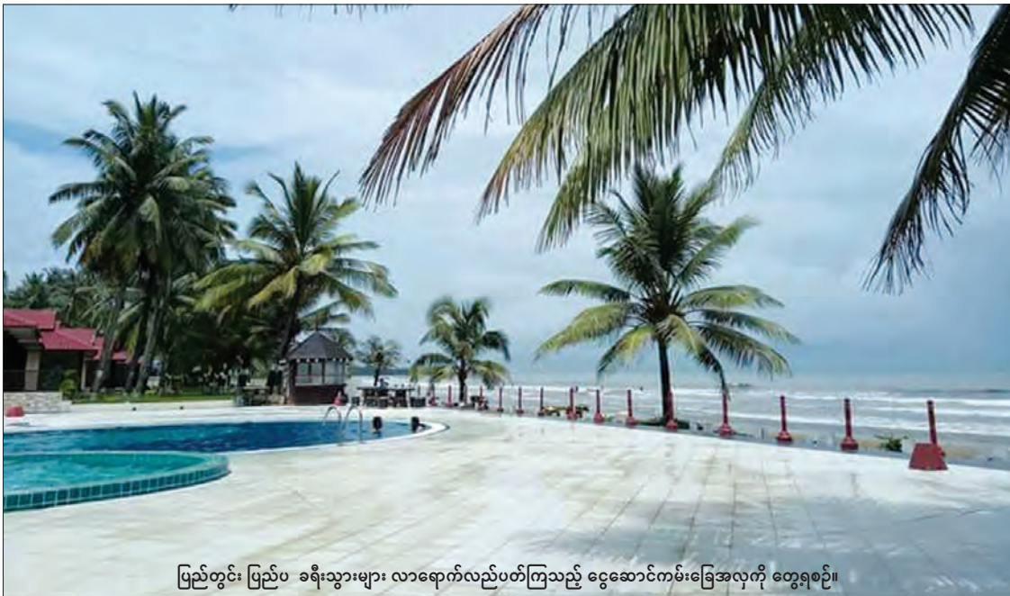
ပြည်တွင်း ပြည်ပ ခရီးသွားများ လာရောက်လည်ပတ်ကြသည့် ငွေဆောင်ကမ်းခြေအလှကို တွေ့ရစဉ်။

“ဆက်သွယ်ရေးကဏ္ဍ ဖွံ့ဖြိုးတိုးတက်မှု အနေနဲ့ ဧရာဝတီတိုင်းဒေသကြီးအတွင်းမှာ မိုဘိုင်းဖုန်းစခန်း ၅၇၉ ခု၊ အော်တိုအိတ်ချိန်း ၃၉ ရုံးအထိ တည်ဆောက်ပြီး လူဦးရေ ၁၀၀ မှာ ၈၁ ဦးအထိ အသုံးပြုနိုင်ပြီဖြစ်ပါတယ်။ နိုင်ငံ တကာဆက်သွယ်ရေးဆက်ကြောင်း တည်ဆောက် မှုအနေနဲ့ ရေအောက်ကေဘယ်စနစ်ကို ပုသိမ်မြို့နယ် ငွေဆောင်မြို့မှာ တည်ဆောက် ပြီးစီးပြီးတော့ ဝန်ဆောင်မှုပေးနေပြီဖြစ်ပါတယ်။ MPT Own Branded Shop ၁၀ ဆိုင် ဖွင့်လှစ်ပြီးတော့ ဝန်ဆောင်မှုပေးလျက်ရှိပါတယ်။ ဧရာဝတီတိုင်းဒေသကြီးအတွင်း ဒေသအားလုံး နီးပါးမှာ မိုဘိုင်းဖုန်းအသုံးပြုနိုင်ပြီဖြစ်ပါတယ်” ဟု ဝန်ကြီးချုပ်က ပြောသည်။ အချုပ်ပို (ဃ) သို့