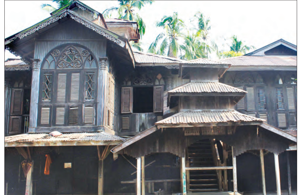
ပရိယတ္တိကျောင်းဟောင်း