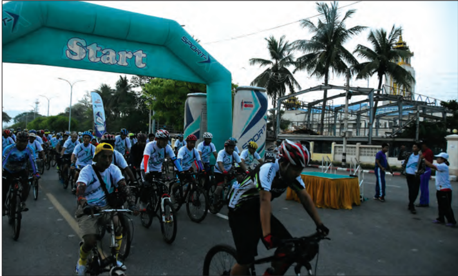
အားကစားသမားများ၊ စက်ဘီးစီး အားကစားဝါသနာရှင်ပြည်သူများ စုပေါင်း လူဦးရေ ၃၀၀ ကျော်က စုပေါင်းစုပေါင်း (၂၆) လမ်းအတိုင်း လမ်း(၈၀) သို့ လမ်း(၈၀)မှ (၃၇) လမ်းအထိ ထိုမှ (၇၃) လမ်းအတိုင်း (၃၅) လမ်းအထိ ထိုမှ

မန္တလေး မေ ၁ စက်ဘီးစီးအားကစားနည်းကို ပြည်သူ လူထုတစ်ရပ်လုံး စိတ်ပါဝင်စားလာစေရန်နှင့် စက်ဘီးစီးခြင်းဖြင့် ပြည်သူများ ကျန်းမာကြံ့ခိုင်လာစေရန် ရည်ရွယ်၍ ကျန်းမာရေးနှင့် အားကစားဝန်ကြီးဌာန ၏ လမ်းညွှန်မှုဖြင့် မြန်မာနိုင်ငံ စက်ဘီး အဖွဲ့ချုပ်နှင့် မန္တလေးတိုင်းဒေသကြီး အားကစားနှင့် ကာယပညာဦးစီးဌာန တို့က ကြီးမှူးကာ မန္တလေးမြို့၌ လူထု စုပေါင်းစက်ဘီးစီးပွဲကို လစဉ် နောက်ဆုံးပတ် တနင်္ဂနွေနေ့တွင် ကျင်းပလျက်ရှိရာ (၂၃) ကြိမ်မြောက် စက်ဘီးစီးပွဲကို ဧပြီ ၂၉ ရက်က ကျင်းပခဲ့သည်။