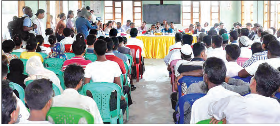
ကုလသမဂ္ဂလုံခြုံရေးကောင်စီအဖွဲ့ဝင်နိုင်ငံများမှ ကုလသမဂ္ဂဆိုင်ရာ အမြဲတမ်းကိတ်စားလှယ်နှင့် ကိတ်စားလှယ်များပါဝင်သောအဖွဲ့ ရွေးကောက်ပွဲအဖွဲ့ ခန့်အပ်ပေးပေးခဲ့ပြီး ဟိန္ဒူ၊ အစ္စလာမ် ဘာသာဝင်များအား တွေ့ဆုံစဉ်။