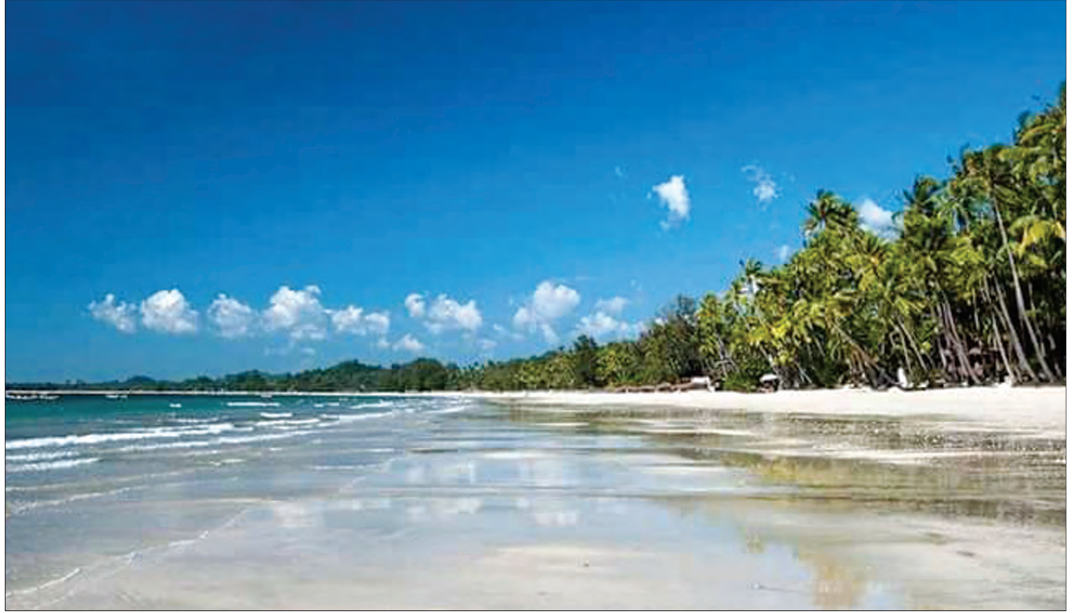
အပန်းဖြေခရီးသွားလုပ်ငန်းမှ ဝင်ငွေရှာပေးနိုင်သည့် ရာဇဝတီတိုင်းဒေသကြီးရှိ ချောင်းသာကမ်းခြေအလှ။

၂၀၁၈ ခုနှစ် ဧပြီ ၁ ရက်က မြောင်းမြ ကြိုးတံတားပြတ်ကျခဲ့သဖြင့် တံတားသစ် တည်ဆောက်မှုကို ပြည်ထောင်စုအစိုးရအဖွဲ့ ဦးဆောင်မှုဖြင့် (၁)နှစ်အတွင်း ပြီးစီးရန် စီမံ ဆောင်ရွက်လျက်ရှိသည်။