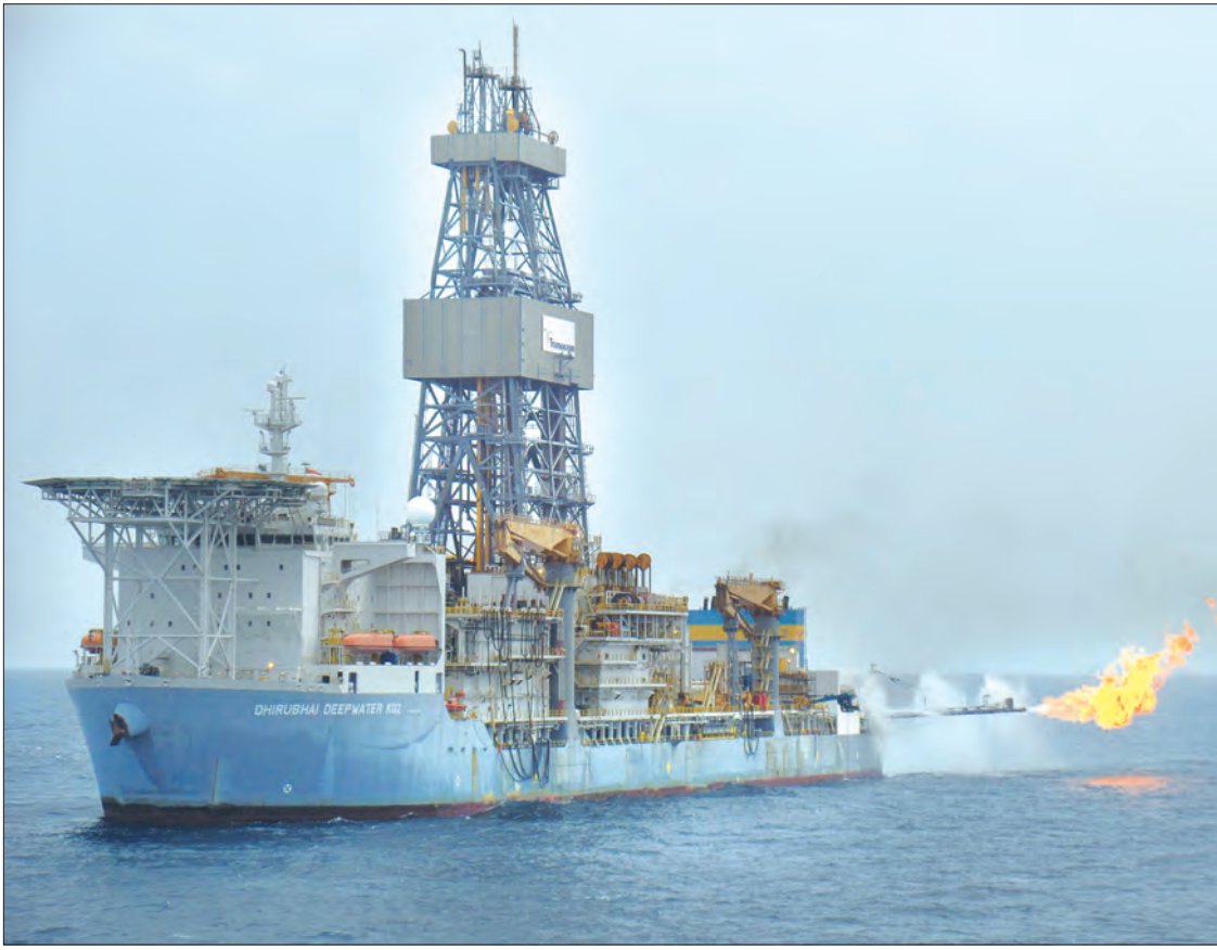
မြန်မာ့ကမ်းလွန်လုပ်ကွက်အမှတ် A(6) ၏ သဘာဝဓာတ်ငွေ့ထုတ်လုပ်နေမှုကို တွေ့ရစဉ်။

❁ ဆက်သွယ်ရေးကဏ္ဍ ဖွံ့ဖြိုးတိုးတက်မှုအနေနှင့် ရောဂတ်တိုင်းဒေသကြီးအတွင်းမှာ မိုဘိုင်းဖုန်း စခန်း ၅၇၉ ခု၊ အော်တိုအိတ်ချိန်း ၃၉ ရုံးအထိ တည်ဆောက်ပြီး လူဦးရေ ၁၀၀ မှာ ၈၁ ဦးအထိ အသုံးပြုနိုင်ပြီဖြစ်