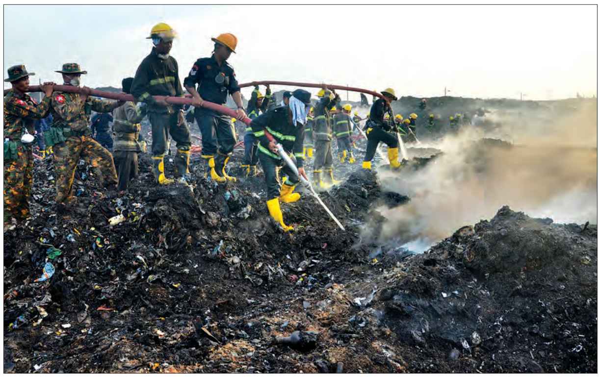
ထိန်ပင်အမှိုက်ပုံမီးလောင်မှုကို တပ်မတော်သားများနှင့် မီးသတ်တပ်ဖွဲ့ဝင်များ ပူးပေါင်း၍ မီးငြိမ်းသတ်နေစဉ်။

“မနေ့ကတော့ အားလုံးထဲမှာ ထုထည်အကြီးမားဆုံးဖြစ်တဲ့ (B) ဇုန်ကို ငြိမ်းသတ်ခဲ့ပြီးဖြစ်ပါတယ်။ Bio Foam ကို အဓိကအသုံးပြုပြီး ငြိမ်းသတ်ခဲ့တာပါ။ တပ်မတော်သားတွေကလည်း အနီးကပ်လိုက်ပါပြီး ပူးပေါင်းဆောင်ရွက်ပေးတဲ့အတွက် ပိုပြီးထိရောက်မှုရှိခဲ့ပါတယ်။ ဒီနေ့မှာတော့ (C) ဇုန်ကို မူလသတ်မှတ်ထားတဲ့အတိုင်း စာမျက်နှာ ၅ ကော်လံ ၁”