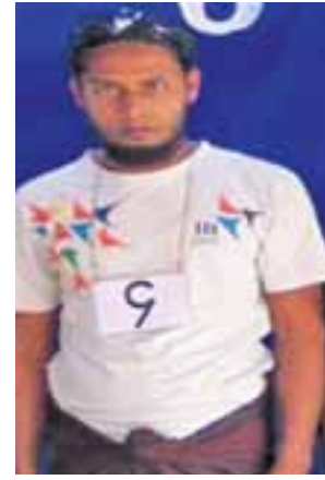
တရားခံ (၁၅) မာမောက်အာရစ်၏ ထွက်ဆိုချက်အရ အီတာလျံ (အလယ်) ရွာနေ အကြမ်းဖက်အဖွဲ့ခေါင်းဆောင် မော်လဝီ အဘူတား (ဘ) ဇာဟောရာမောက်၏ မှတ်တမ်းဓာတ်ပုံ။