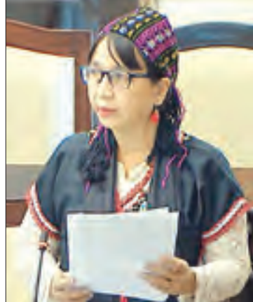
ကရင်ပြည်နယ် မဲဆန္ဒနယ် အမှတ်(၇)မှ နော်ခရစ္စထွန်း(ခ) ဒေါက်တာအားကာမိုး

ရန်ပုံငွေရရှိမှုအပေါ်မူတည် မန္တလေး-လားရှိုး-ပန်းမော်-မြစ်ကြီးနားလမ်း ကချင်ပြည်နယ်အပိုင်းတွင် နယ်မြေလုံခြုံရေး အခြေအနေအရ သွားလာ၍ရသော မိုင် (၂၄၉/၆) မအိန်ယန်ရွာမှ (၃၆၆/၂) ပန်းမော်မြို့အထိ ၁၈ မိုင် ၄ ဇာလုံ အပိုင်းသာလမ်းဦးစီးဌာနမှ တာဝန်ယူ ကြီးကြပ်ဆောင်ရွက်လျက်ရှိပြီး ရာသီမရွေး သွားလာနိုင်ပါကြောင်း၊ နယ်မြေလုံခြုံရေးအခြေအနေအရ သွားလာ၍မရသော မနိစိနန်းကြီးကျေးရွာမှ မအိန်ယန်ရွာအထိ နယ်မြေလုံခြုံရေးအခြေအနေ ကောင်းမွန်လာပါက ဆောင်ရွက်ရန် လိုအပ်သည့် လုပ်ငန်းများကို အမြန်ဆုံး အကောင်အထည်ဖော် ဆောင်ရွက်နိုင်ရန် ဘဏ္ဍာနှစ်အလိုက် ရန်ပုံငွေ တင်ပြတောင်းခံပြီး ရန်ပုံငွေရရှိမှုအပေါ် မူတည်၍ ဆောင်ရွက်သွားမည်ဖြစ်ပါကြောင်း ရှင်းလင်း ဖြေကြားသည်။