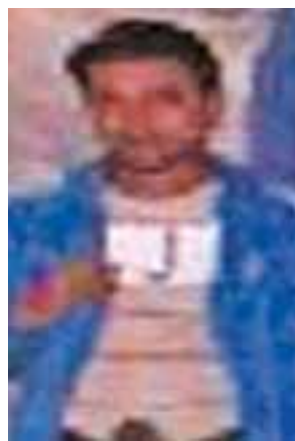
ငါးရန့်ချောင်းကျေးရွာအုပ်စု၊ ပေါက်တောပြင်ရပ်ကွက်နေ INGO အဖွဲ့အစည်းမှ တရားခံ ဟာမိန်း (၃၆)နှစ်၊ (ဘ) အာမက်ချောသီ၏ မှတ်တမ်းဓာတ်ပုံ။