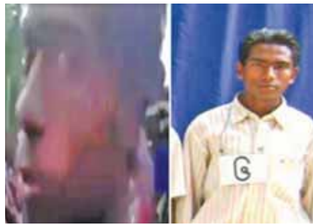
မင်းကြီးကျေးရွာအုပ်စု၊ တူလာတူလီကျေးရွာ၊ အထစအမှတ်(၇၅)နေ တရားခံ မာမုတ်အာရီ (၂၁) နှစ်၊ (ဘ) မာမောတာလီ၏ မှတ်တမ်းဓာတ်ပုံ။