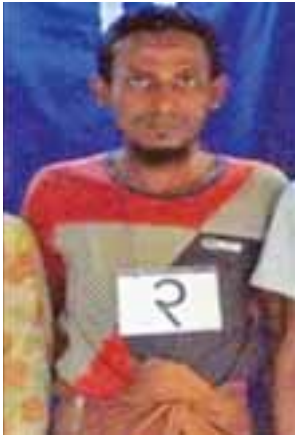
တရားခံ (၁၅) မာမောက်အာရစ်၏ ထွက်ဆိုချက်အရ အီတာလျံ (အနောက်)ရွာနေ အကြမ်းဖက်အဖွဲ့ခေါင်းဆောင် မော်လဝီ မာမတ်စီဒီး (ဘ) နှစ်ဆူဆောင်း၏ မှတ်တမ်းဓာတ်ပုံ။