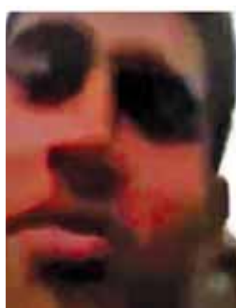
ပဒကားဒေဝါလီအုပ်စု၊ တူလာတူလီကျေးရွာ၊ အထစအမှတ်(၁၇)နေ တရားခံ အဒူဆလင် (၃၀)နှစ်၊ (ဘ) ဘူတန်အာမောက်၏ မှတ်တမ်းဓာတ်ပုံ။