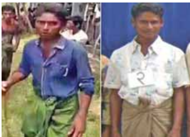
မင်းကြီးကျေးရွာအုပ်စု၊ တူလာတူလီကျေးရွာ၊ အထစအမှတ် (၇)နေ တရားခံ အဒူလာကိမ် (၃၀) နှစ်၊ (ဘ)နော်ဒီရာမောက်၏ မှတ်တမ်းဓာတ်ပုံ။