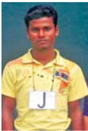
တရားခံ(၂၂) မာမတ်ဆာဘဲရ်၏ ထွက်ဆိုချက်အရ အကြမ်းဖက် တိုက်ခိုက်ရာတွင် ပါဝင်သူ မင်္ဂလာကြီး (၂) ကျေးရွာနေ အထစ(၄၆) မာမတ်ဂျူဟတ်(၁၇) နှစ်၊ (ဘ) ဇာဖေ့များ၏ မှတ်တမ်းဓာတ်ပုံ။