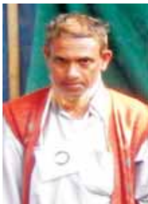
တရားခံ(၃၇) မာမောက်အက္ကဝါ၏ ထွက်ဆိုချက်အရ အကြမ်းဖက် တိုက်ခိုက်ရာတွင် ပါဝင်သူ ဇိုးတန်းကျေးရွာနေ အထစ (၉၉) လယ်တူ(ဘ) ဆွေယောတာမောက်၏ မှတ်တမ်းဓာတ်ပုံ။