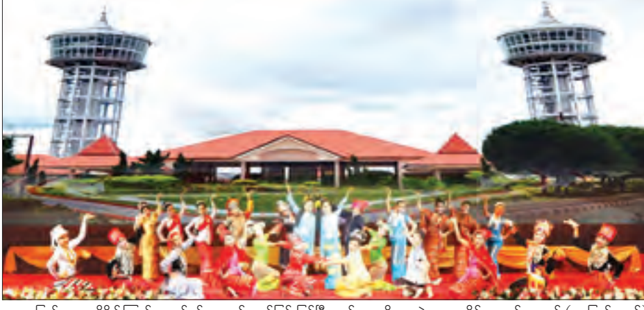
အမျိုးသားအထိမ်းအမှတ်ဥယျာဉ် (နေပြည်တော်) တွင် ဖျော်ဖြေပွဲများ ကျင်းပသွားမည်ဖြစ်ပြီး ကြည့်ရှုလိုသည့် ပြည်သူများနှင့် ဝန်ထမ်းများ သွားလာရေးအဆင်ပြေစေရန် သီးသန့်ယာဉ်လိုင်းများ စီစဉ်ပေးသွားမည်

နေပြည်တော် ဇန်နဝါရီ ၁၇ အမျိုးသားအထိမ်းအမှတ် ဥယျာဉ် (နေပြည်တော်)တွင် သာသနာရေးနှင့် ယဉ်ကျေးမှုဝန်ကြီးဌာန အနုပညာ ဦးစီးဌာနမှ အနုပညာရှင်များက အထူးအစီအစဉ်အဖြစ် ဇန်နဝါရီ ၂၀ ရက် နံနက် ၁၀ နာရီမှ မွန်းလွဲ ၃ နာရီ အထိ တိုင်းရင်းသားရိုးရာယဉ်ကျေးမှု ယိမ်းအကများ၊ တေးသံသာများ၊ ပဒေသာယိမ်းအကများ၊ ဟာသတစ်ခန်း ရပ်များဖြင့် ဖျော်ဖြေတင်ဆက်သွားမည် ဖြစ်သည်။ အမျိုးသားအထိမ်းအမှတ်ဥယျာဉ် (နေပြည်တော်) ဖျော်ဖြေပွဲကို လာရောက်ကြည့်ရှု လေ့လာကြမည့်