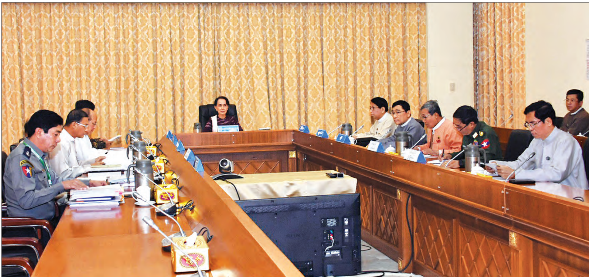
နိုင်ငံတော်၏အတိုင်ပင်ခံပုဂ္ဂိုလ် ဒေါ်အောင်ဆန်းစုကြည် ရခိုင်ပြည်နယ်ဆိုင်ရာ ညှိနှိုင်းအစည်းအဝေးတွင် အမှာစကားပြောကြားစဉ်။ သတင်းစဉ်

နေပြည်တော် ဇန်နဝါရီ ၁၇ ရခိုင်ပြည်နယ်ဆိုင်ရာ ညှိနှိုင်းအစည်းအဝေးကို ယနေ့ နံနက် ၁၁ နာရီ ၁၅ မိနစ်တွင် နေပြည်တော်ရှိ နိုင်ငံတော်သမ္မတအိမ်တော် အစည်းအဝေးခန်း၌ ကျင်းပရာ နိုင်ငံတော်၏အတိုင်ပင်ခံပုဂ္ဂိုလ် ဒေါ်အောင်ဆန်းစုကြည် တက်ရောက် အမှာစကားပြောကြားသည်။ အစည်းအဝေးသို့ ပြည်ထဲရေးဝန်ကြီးဌာန ပြည်ထောင်စုဝန်ကြီး ဒုတိယဗိုလ်ချုပ်ကြီး ကျော်ဆွေ၊ ပြန်ကြားရေးဝန်ကြီးဌာန ပြည်ထောင်စုဝန်ကြီး ဒေါက်တာဖေမြင့်၊ ပြည်ထောင်စုအစိုးရအဖွဲ့ရုံးဝန်ကြီးဌာန ပြည်ထောင်စုဝန်ကြီး ဦးသောင်းထွန်း၊ လူမှု ဝန်ထမ်း၊ ကယ်ဆယ်ရေးနှင့် ပြန်လည်နေရာချထားရေးဝန်ကြီးဌာန ပြည်ထောင်စုဝန်ကြီး ဒေါက်တာဝင်းမြတ်အေး၊ ပြည်ထောင်စု ရှေ့နေချုပ် ဦးထွန်းထွန်းဦး၊ ရခိုင်ပြည်နယ်ဝန်ကြီးချုပ် ဦးညိုပု၊ သမ္မတရုံးဝန်ကြီးဌာန ဒုတိယဝန်ကြီး ဦးမင်းသူ၊ နယ်စပ် ရေးရာဝန်ကြီးဌာန ဒုတိယဝန်ကြီး ဗိုလ်ချုပ်သန်းထွဋ်၊ နိုင်ငံတော်အတိုင်ပင်ခံရုံးဝန်ကြီးဌာန ဒုတိယဝန်ကြီး ဦးခင်မောင်တင်၊ ပြန်ကြားရေးဝန်ကြီးဌာန ဒုတိယဝန်ကြီး ဦးအောင်လှထွန်း၊ မြန်မာနိုင်ငံရတပ်ဖွဲ့ရဲချုပ် ရဲချုပ် အောင်ဝင်းဦးနှင့် တာဝန်ရှိသူများ တက်ရောက်ကြသည်။ စာမျက်နှာ ၄ ကော်လံ ၁