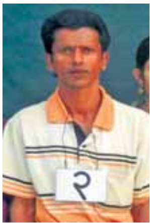
တရားခံ(၁၈) ရော်ဖီးအတ္တဝါ၏ ထွက်ဆိုချက်အရ အကြမ်းဖက် တိုက်ခိုက်ရာတွင် ပါဝင်သူ မင်္ဂလာကြီး (၁) ကျေးရွာနေ အထစ(၁၈၀) နှစ်မိုဟာမတ် (၄၀) နှစ်၊ (ဘ) အဘူရ်ကာလောင်၏ မှတ်တမ်းဓာတ်ပုံ။