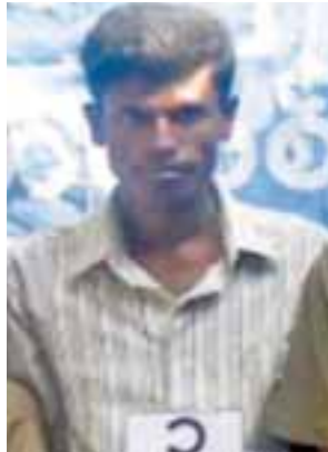
တရားခံ(၄၅) အင်နာဒူလ္လာ၏ ထွက်ဆိုချက်အရ အကြမ်းဖက် တိုက်ခိုက်ရာတွင် ပါဝင်သူ အင်းဒင် (အလယ်)ရွာနေ အထစ (၈) အဒူလ္လာ (၂၀)နှစ်၊ (ဘ) ဘိုလီးဘာလိန်(ခ) မာမာတ်ဆာလေ၏ မှတ်တမ်းဓာတ်ပုံ။