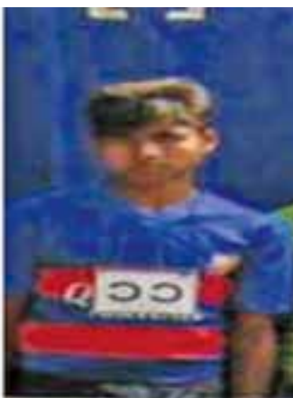
မင်းကြီးကျေးရွာအုပ်စု၊ တူလာတူလီကျေးရွာ၊ အထစအမှတ်(၉၇)နေ တရားခံ မာမုတ်ရူရှား (၂၃) နှစ်၊ (ဘ) နော်ဘီဟူဆောင်း၏ မှတ်တမ်းဓာတ်ပုံ။