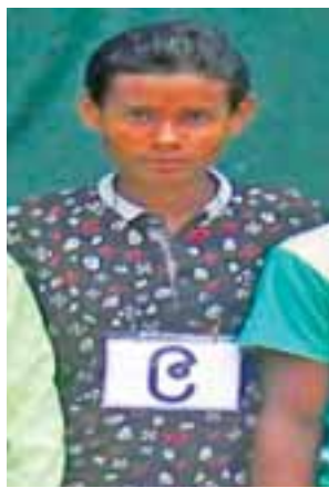
တရားခံ(၂၂) မာမတ်ဆာဘဲရ်၏ ထွက်ဆိုချက်အရ အကြမ်းဖက် တိုက်ခိုက်ရာတွင် ပါဝင်သူ မင်္ဂလာကြီး (၂) ကျေးရွာနေ အထစ(၄၃) အစွမိုင် (၁၈)နှစ်၊ (ဘ) နှစ်ရူအာမောင်၏ မှတ်တမ်းဓာတ်ပုံ။