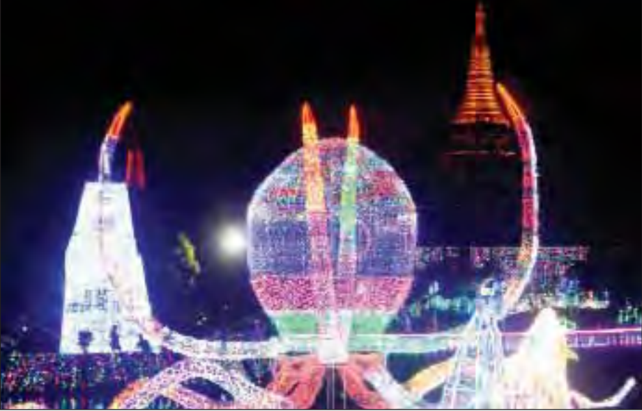
ရန်ကုန်မြို့၊ ပြည်သူ့ရင်ပြင်အတွင်း ပြသလျက်ရှိသော မီးပွဲတော်မှ ပြကွက်တစ်ခု။

ယနေ့ကမ္ဘာ့နိုင်ငံကြီးများနှင့် ခေတ်မီအိမ်နီးချင်းနိုင်ငံများတွင် ကျင်းပလျက်ရှိသော မီးပွဲတော်များကို သို့မဟုတ် ပြည်သူများ စိတ်နှလုံးနှင့်ပြုံးနေအေးချမ်းစေရန် အပန်းဖြေမှုပေးသော ရန်ကုန် မီးပွဲတော်၊ မြန်မာ့ယဉ်ကျေးမှုနယ်ပယ်တွင် ရှေးဦးအနုပညာဖြစ်သော စပ်ပန်းချီပညာရပ်ကို အခြေခံကာ မြန်မာမှု၊ မြန်မာ့ဟန်ဖြင့် သရုပ်ဖော်ထားခြင်းဖြစ်သည်။ စပ်ပန်းချီသည် ရှေးဘုရင်မင်းများခေတ်ကတည်းက တည်ရှိခဲ့သော မြန်မာတို့၏ အနုပညာအမွေအနှစ်တစ်ခုပင် ဖြစ်သည်။ ခေတ်အဆက်ဆက် လက်ဆင့်ကမ်းသယ်ဆောင် မည့်သူ နည်းပါးခဲ့သော်လည်း ယခု တိမ်ကောလုနီးပါးဖြစ်နေသော မြန်မာတို့၏ ရိုးရာအမွေပညာရပ်များထဲတွင် စပ်ပန်းချီသည်လည်း တစ်ခုအပါအဝင်ဖြစ်နေသည်။ သို့သော် ပြည်သူများ စိတ်ဝင်စားမှု မြင့်တက်နေဆဲဖြစ်သည်ကို ယနေ့ ရန်ကုန် မီးပွဲတော်ကြီးက မီးမောင်းထိုးသက်သေပြနေသည်။