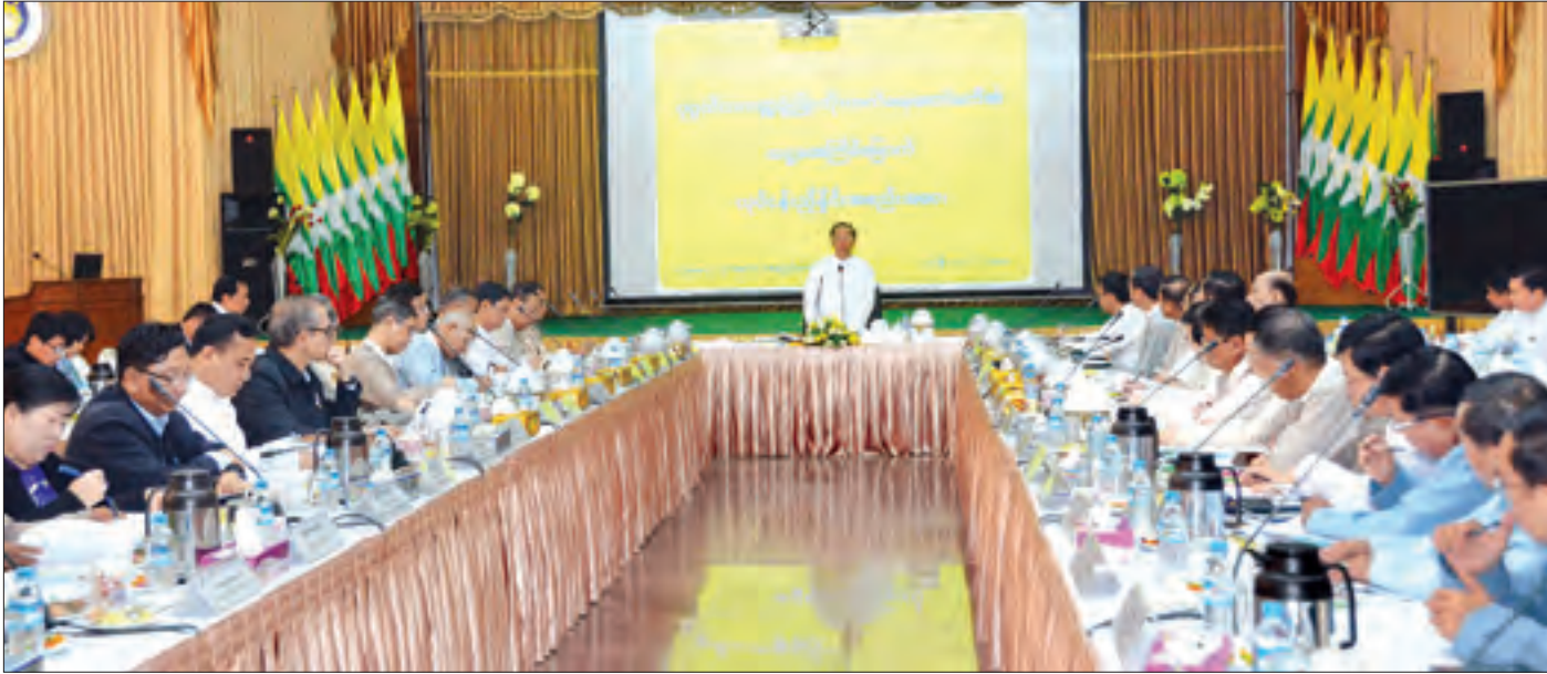
ဒုတိယသမ္မတ ဦးမြင့်ဆွေ ပုဂ္ဂလိကကဏ္ဍ ဖွံ့ဖြိုးတိုးတက်ရေးကော်မတီ၏ ဆဋ္ဌမအကြိမ်မြောက် လုပ်ငန်းညှိနှိုင်းအစည်းအဝေးတွင် အမှာစကားပြောကြားစဉ်။ သတင်းစဉ်

နေပြည်တော် ဇန်နဝါရီ ၁၇ ပုဂ္ဂလိကကဏ္ဍ ဖွံ့ဖြိုးတိုးတက်ရေးကော်မတီ၏ ဆဋ္ဌမအကြိမ်မြောက် လုပ်ငန်းညှိနှိုင်းအစည်းအဝေးကို ယနေ့ နံနက် ၉ နာရီခွဲတွင် နေပြည်တော်ရှိ စီးပွားရေးနှင့် ကူးသန်းရောင်းဝယ်ရေး ဝန်ကြီးဌာန အစည်းအဝေးခန်းမ၌ ကျင်းပရာ ပုဂ္ဂလိကကဏ္ဍ ဖွံ့ဖြိုးတိုးတက်ရေးကော်မတီ ဥက္ကဋ္ဌ ဒုတိယသမ္မတ ဦးမြင့်ဆွေ တက်ရောက်အမှာစကား ပြောကြားသည်။ အစည်းအဝေးသို့ ကော်မတီ ဒုတိယဥက္ကဋ္ဌ ပြည်ထောင်စုဝန်ကြီး ဒေါက်တာသန်းမြင့်၊ ကော်မတီဝင် ပြည်ထောင်စုဝန်ကြီးများ ဖြစ်ကြသည့် ဒေါက်တာအောင်သူ၊ ဦးဝင်းခိုင်၊