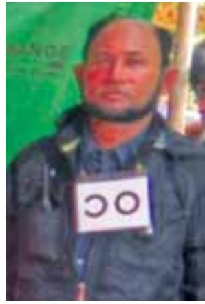
တရားခံ(၁၇) ဟာမိဒူလ္လာ၏ ထွက်ဆိုချက်အရ အကြမ်းဖက် တိုက်ခိုက်ရာတွင် ပါဝင်သူ မင်္ဂလာကြီး (၂) ကျေးရွာနေ အထစ(၅၉) ခိုလာမိန်(၄၀)နှစ်၊ (ဘ)ဆူလ်တန်၏ မှတ်တမ်းဓာတ်ပုံ။