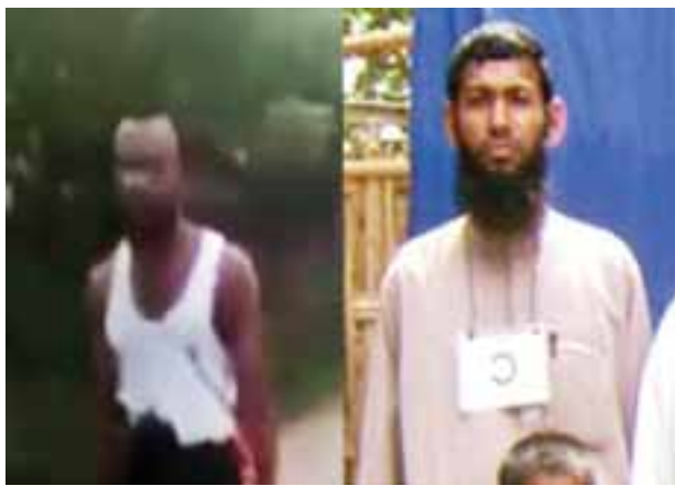
ပဒကားဒေဝါလီအုပ်စု၊ ဇော်နဒိန်ကျေးရွာ၊ အထစအမှတ် (၄)နေ တရားခံ အာမတ်တူဟာရ (၄၈) နှစ်၊ (ဘ) မာမောက်ဟူဆောင်း၏ မှတ်တမ်းဓာတ်ပုံ။