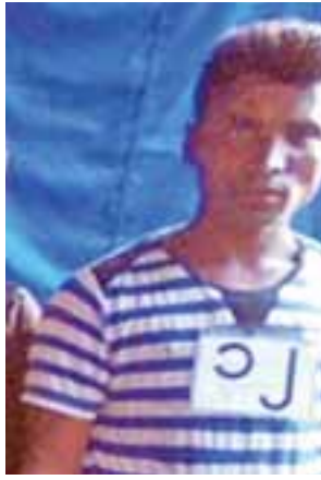
တရားခံ (၁၅) မာမောက်အာရစ်၏ ထွက်ဆိုချက်အရ အီတာလျံ (အလယ်)ရွာနေ အကြမ်းဖက်အဖွဲ့တွင် ပါဝင်သူ နှစ်ဆူဆောင်း၏ မှတ်တမ်းဓာတ်ပုံ။