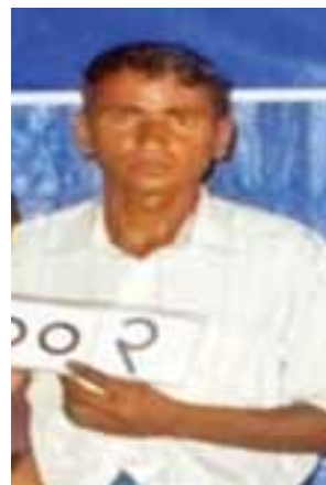
ငါးရန့်ချောင်းကျေးရွာအုပ်စု၊ ပေါက်တောပြင်ရပ်ကွက်နေ INGO အဖွဲ့အစည်းမှ တရားခံ ဟူစွမ်းအားစွတ် (၃၄) နှစ်၊ (ဘ) အာလီဂိုအာ၏ မှတ်တမ်းဓာတ်ပုံ။