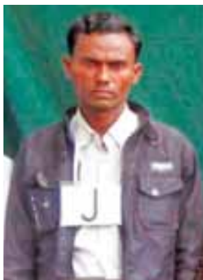
တရားခံ(၃၇) မာမောက်အက္ကဝါ၏ ထွက်ဆိုချက်အရ အကြမ်းဖက် တိုက်ခိုက်ရာတွင် ပါဝင်သူ ဇိုးတန်းကျေးရွာနေ အထစ(၄)၊ နှစ်အာလောင် (၃၀)နှစ်၏ မှတ်တမ်းဓာတ်ပုံ။