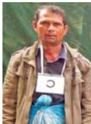
တရားခံ(၃၇) မာမောက်အက္ကဝါ၏ ထွက်ဆိုချက်အရ အကြမ်းဖက် တိုက်ခိုက်ရာတွင် ပါဝင်သူ ဇိုးတန်းကျေးရွာနေ အထစ (၅၈) အဘူကာလောင်(၄၀)နှစ်၊ (ဘ) အာရူးမီးယား၏ မှတ်တမ်းဓာတ်ပုံ။