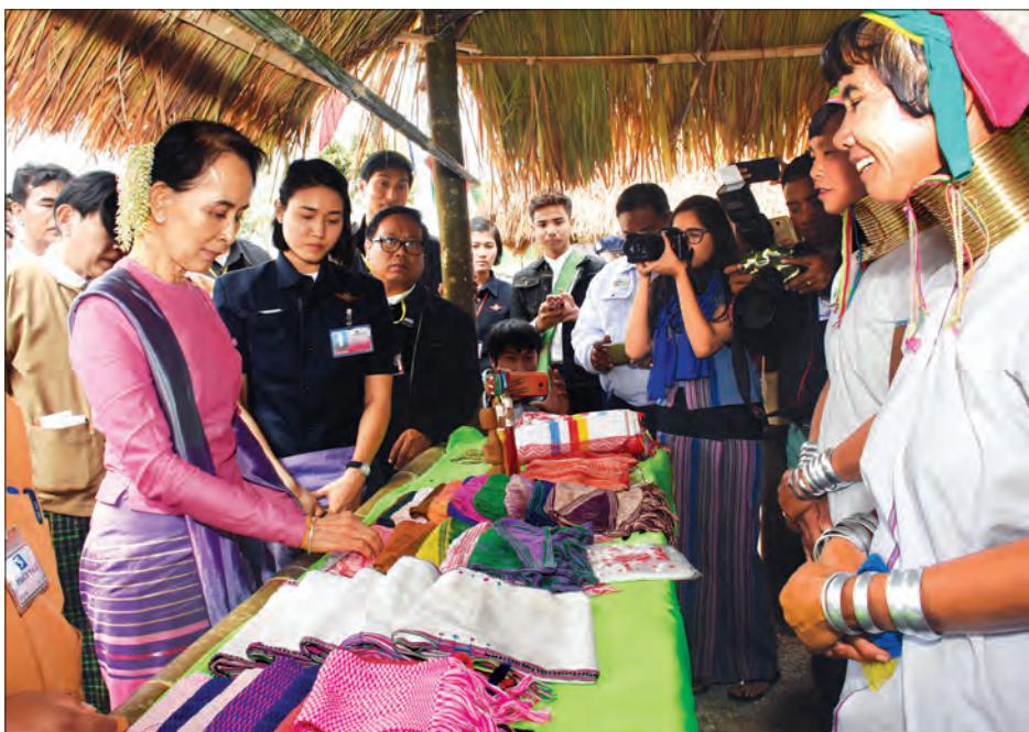
နိုင်ငံတော်၏ အတိုင်ပင်ခံပုဂ္ဂိုလ် ဒေါ်အောင်ဆန်းစုကြည် ဒေါ်ဆန်းဘွန်းကျေးရွာ၌ ဖွင့်လှစ်ရောင်းချလျက်ရှိသည့် ကယန်းရိုးရာ အသုံးအဆောင်ပစ္စည်းများနှင့် အဝတ်အထည်အရောင်းဆိုင်များကို ကြည့်ရှုလေ့လာစဉ်။