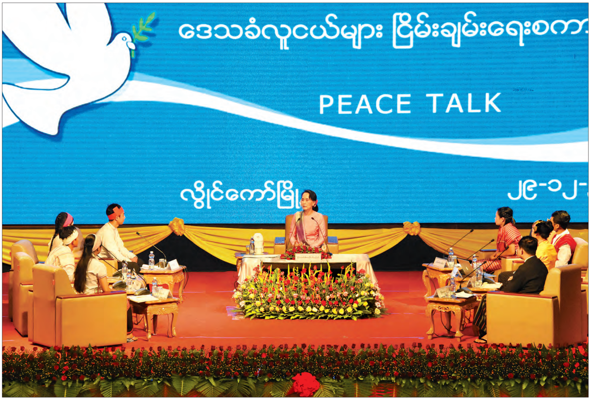
နိုင်ငံတော်၏ အတိုင်ပင်ခံပုဂ္ဂိုလ် ဒေါ်အောင်ဆန်းစုကြည်နှင့် ကယားပြည်နယ် ဒေသခံလူငယ်များ ငြိမ်းချမ်းရေးစကားဝိုင်း ကျင်းပစဉ်။ သတင်းစဉ်

လွိုင်ကော် ဒီဇင်ဘာ ၂၉ နိုင်ငံတော်၏ အတိုင်ပင်ခံပုဂ္ဂိုလ်နှင့် ကယားပြည်နယ် ဒေသခံလူငယ်များ ငြိမ်းချမ်းရေးစကားဝိုင်းကို ယနေ့နံနက် ၁၀ နာရီတွင် ကယားပြည်နယ် လွိုင်ကော်မြို့ရှိ ပြည်နယ်ခန်းမ၌ ကျင်းပသည်။ ငြိမ်းချမ်းရေးစကားဝိုင်းတွင် နိုင်ငံတော်၏ အတိုင်ပင်ခံပုဂ္ဂိုလ် ဒေါ်အောင်ဆန်းစုကြည်က “ငြိမ်းချမ်းရေးစကားဝိုင်းကို လူငယ်တွေနဲ့ ကျင်းပခဲ့တာ ၄၊ ၅၊ ၆ ခါလောက် ရှိပါပြီ။ နေရာအသီးသီးမှာ လူငယ်တွေနဲ့ ဒီလိုငြိမ်းချမ်းရေးနဲ့ ပတ်သက်လို့ ကျင်းပတဲ့နေရာမှာ