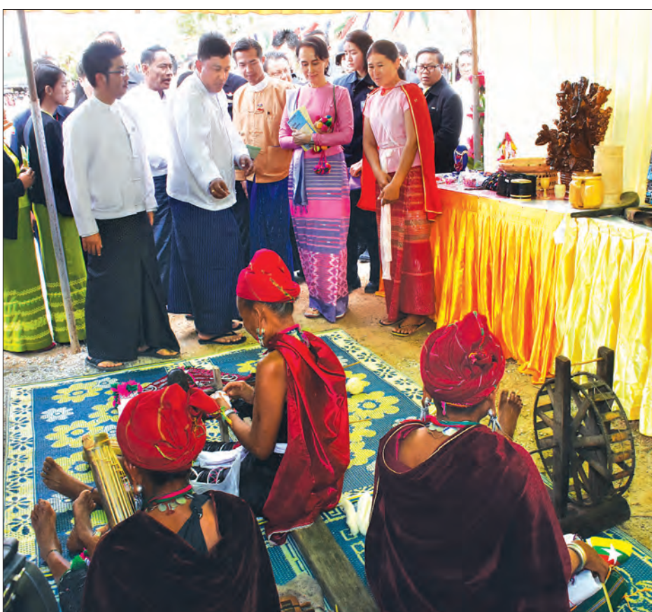
နိုင်ငံတော်၏ အတိုင်ပင်ခံပုဂ္ဂိုလ် ဒေါ်အောင်ဆန်းစုကြည် ဒေါ်ဆန်းဘွန်းကျေးရွာ၌ ရိုးရာအဝတ်အထည်များ ရက်လုပ်နေမှုကို ကြည့်ရှုလေ့လာစဉ်။

ဒေါ်ဆန်းဘွန်းကျေးရွာသည် လမ်းပန်းဆက်သွယ်ရေး ကောင်းမွန်လျက်ရှိပြီး ပြည်တွင်း ပြည်ပမှ ခရီးသွားဧည့်သည် များ လာရောက်ကာ ကယန်းရိုးရာယဉ်ကျေးမှုနှင့် လူနေမှုတဝဝံ့ များ၊ ရိုးရာအဝတ်အထည်များနှင့် အသုံးအဆောင်ပစ္စည်းများ ကို လေ့လာလျက်ရှိသည့်အပြင် ကယန်းရိုးရာ ယဉ်ကျေးမှု ဓလေ့အနေဖြင့် လူသိများသော ကြေးကွင်းပတ်ခြင်း ဓလေ့ကို လေ့လာခြင်း၊ ရိုးရာအဝတ်အထည်များ ရက်လုပ်နေမှုကို လေ့လာ