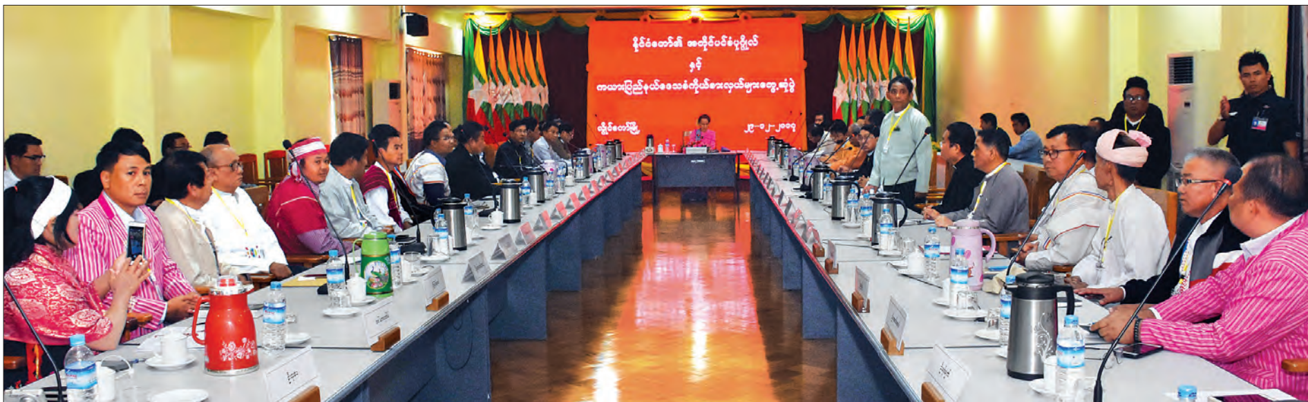
နိုင်ငံတော်၏ အတိုင်ပင်ခံပုဂ္ဂိုလ် ဒေါ်အောင်ဆန်းစုကြည် ကယားပြည်နယ် ဒေသခံကိုယ်စားလှယ်များနှင့် တွေ့ဆုံဆွေးနွေးစဉ်။