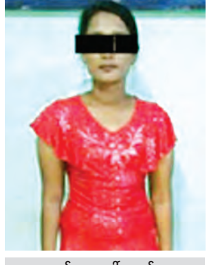
ကလေးငယ်အား ခေါ်ဆောင်လာသူ မမီမီဌေး