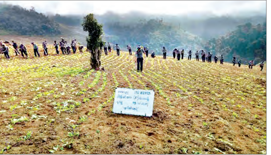
ဝိုင်းမော်မြို့နယ် ကန်ပိုက်တီဒေသအတွင်း စိုက်ပျိုးထားသော ဘိန်းခင်းများအား လိုက်လံဖျက်ဆီးစဉ်။ မြို့နယ် (ပြန်/ဆက်)