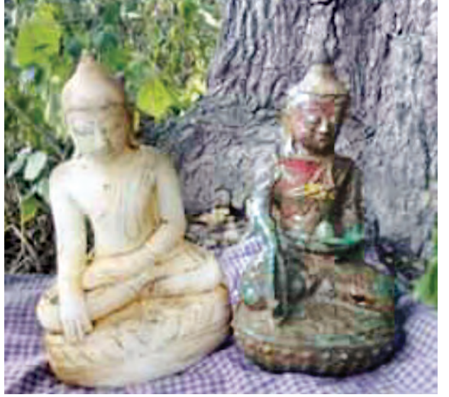
ရှေးဟောင်းဘုရားဆင်းတုတော်များကို သို့ ပင့်ဆောင်ပူဇော် ထားကြောင်း ပသေးကျေးရွာရှိ ဘုန်းတော်ကြီးကျောင်း အဆိုပါ တူးဖော်ရရှိသည့် သိရသည်။