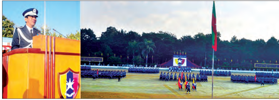
အခမ်းအနားတွင် မြန်မာနိုင်ငံရဲတပ်ဖွဲ့ ရဲချုပ်၊ ရဲချုပ် ကိုခံယူပြီး သင်တန်းဆင်းတပ်ဖွဲ့များကို စစ်ဆေးသည်။ ထို့နောက် အောင်ဝင်းဦးက ဒုတိယ ရဲအုပ်လောင်းများ၏ အလေးပြုခြင်း ဒုတိယရဲအုပ်လောင်းများက အနှေးလျှောက်၊ အမြန်လျှောက်

မြန်မာနိုင်ငံရဲတပ်ဖွဲ့ ဒုတိယရဲအုပ်လောင်းသင်တန်း အမှတ်စဉ်(၈၉) သင်တန်းဆင်းစစ်ရေးပြအခမ်းအနားကို ယနေ့ နံနက် ၇ နာရီခွဲတွင် ရဲအရာရှိလေ့ကျင့်ရေးကျောင်း စစ်ရေးပြတွင်း၌ကျင်းပသည်။ (အောက်ပုံ)