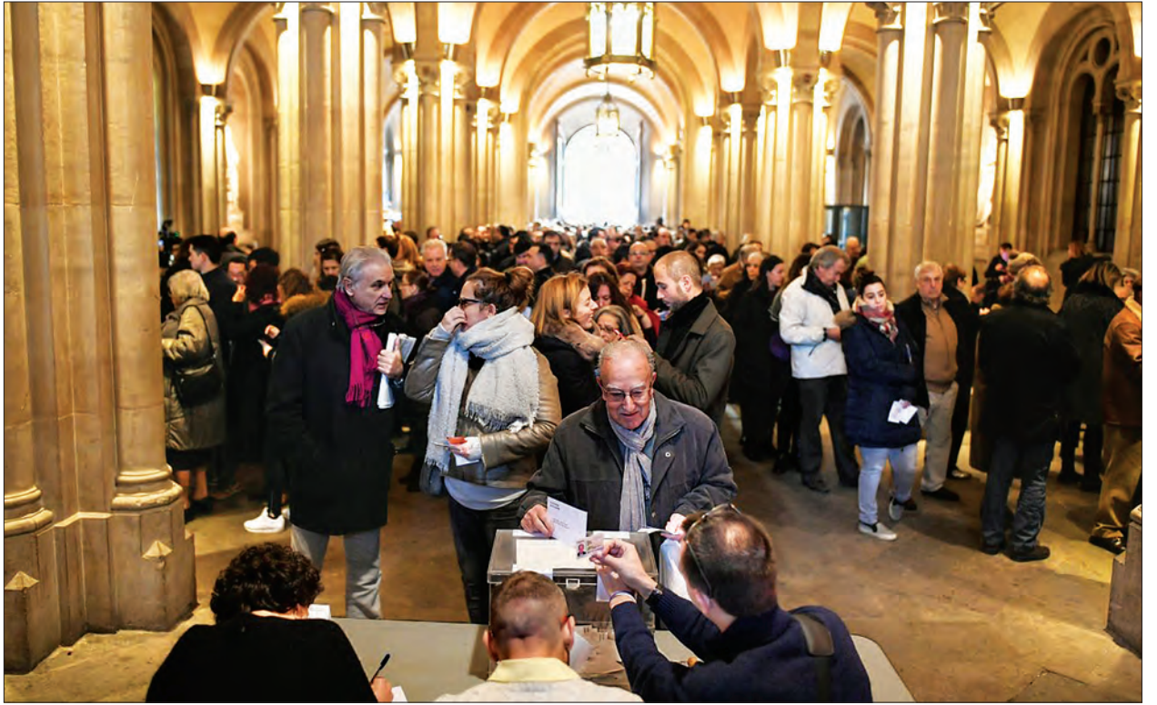
ကတ်တလို့နိုးယားပြည်သူများ မဲပေးနေကြသည်ကို တွေ့ရစဉ်။