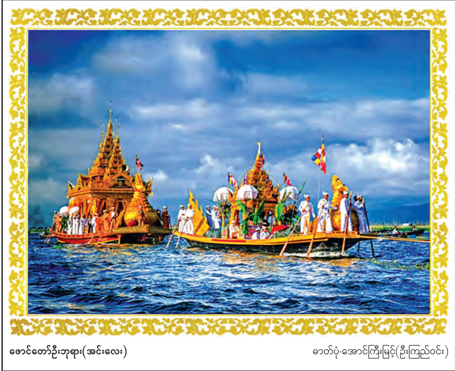
ဇာတ်တော်ဦးဘုရား(အင်းလေး)