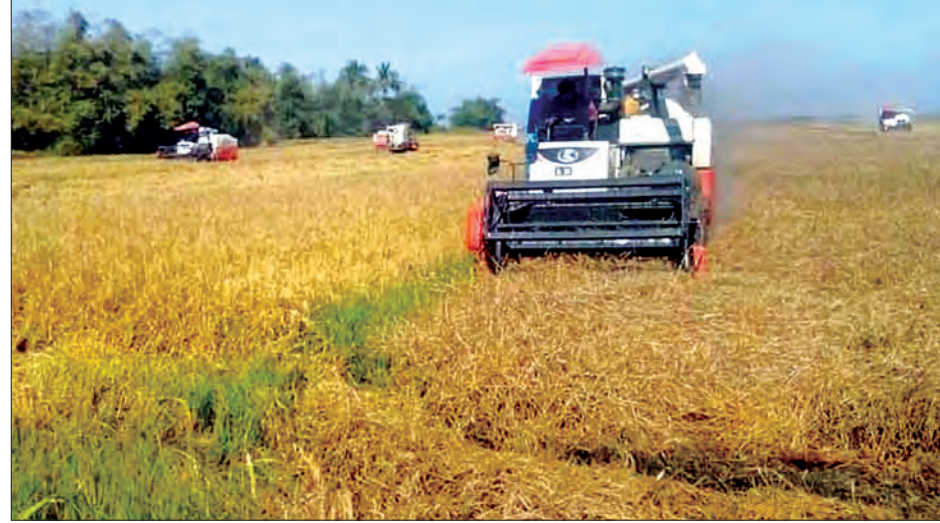
မောင်တောမြို့နယ် ပညောင်ပင်ကြီးကျေးရွာတွင် ရိတ်သိမ်းခြွေလှေ့စက်များဖြင့် ရိတ်သိမ်းဆောင်ရွက်ပေးစဉ်။

ရိတ်သိမ်းပြီးဖြစ်သည်။ ဘူးသီးတောင်မြို့နယ် ဘူးသီးတောင်မြို့နယ် အတွင်းရှိ သပြေချောင်းကျေးရွာတွင် စက်မှုလယ်ယာဦးစီးဌာနမှ ရိတ်သိမ်းခြွေလှေ့စက်ကြီးများဖြင့် မိုးစပါးရိတ်သိမ်းလျက်ရှိရာ နိုဝင်ဘာ ၁၀ ရက်မှ ဒီဇင်ဘာ ၂၀ ရက်အထိ စုစုပေါင်း ၉၆ ဧက ရိတ်သိမ်းပြီးဖြစ်ကြောင်း သိရသည်။ ပုဏ္ဏားကျွန်းမြို့နယ်အတွင်းရှိ င/ပြောက်ဆည်ကျေးရွာတွင် စက်မှုလယ်ယာဦးစီးဌာနမှ ရိတ်သိမ်းခြွေလှေ့စက်ကြီးများဖြင့် မိုးစပါးရိတ်သိမ်းလျက်ရှိရာ ဒီဇင်ဘာ ၁၇ ရက်မှ ၂၀ ရက်အထိ စုစုပေါင်း ၈၈၂ ဧက ရိတ်သိမ်းပြီးဖြစ်ကြောင်း သိရသည်။ ကျောက်ဖြူမြို့နယ် အတွင်းရှိ လောင်းချောင်းကျေးရွာတွင် စက်မှုလယ်ယာဦးစီးဌာနမှ ရိတ်သိမ်းခြွေလှေ့စက်ကြီးများဖြင့် မိုးစပါးရိတ်သိမ်းလျက်ရှိရာ ဒီဇင်ဘာ ၁၉ ရက်မှ ၂၀ ရက်အထိ စုစုပေါင်း ရှစ်ဧက ရိတ်သိမ်းပြီးဖြစ်ကြောင်း သိရသည်။ သတင်းစဉ်