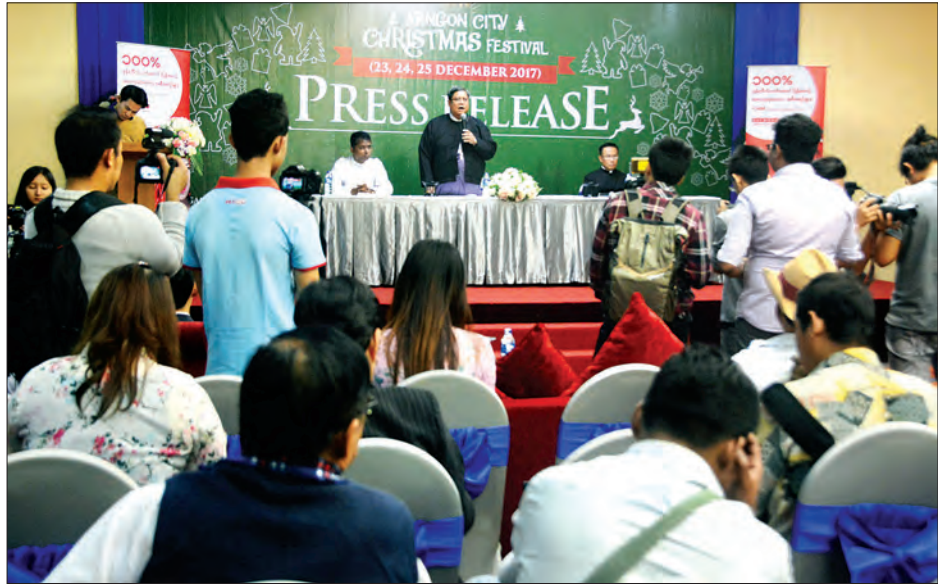
ရန်ကုန်မြို့၌ ပထမဆုံးအကြိမ်ကျင်းပမည့် ခရစ္စမတ်ပွဲတော်နှင့်ပတ်သက်၍ စာနယ်ဇင်းရှင်းလင်းစဉ်။

ဒီပွဲကို ခရစ်ယာန်ဘာသာဝင်မှ မဟုတ် ပါဘူး ဘယ်ဘာသာဝင်၊ ဘယ်လူမျိုးပဲ ဖြစ်ဖြစ် ပျော်ရွှင်စွာနဲ့ လက်ဆောင်လေး တွေယူ၊ မုန့်လေးတွေစားရင်း၊ တေး သီချင်းတွေကို နှာထောင်ပြီး ပါဝင်ကြဖို့ ဖိတ်ခေါ်ပါတယ်” ဟု ပြောကြားသည်။ သီဆိုဖျော်ဖြေ အဆိုပါ ခရစ္စမတ်ပွဲတော်၌ ပျော်ပွဲ ရွှင်ပွဲနှင့် ဖျော်ဖြေရေးအစီအစဉ်များ ပါဝင် ထည့်သွင်းသွားမည် ဖြစ်ရာ