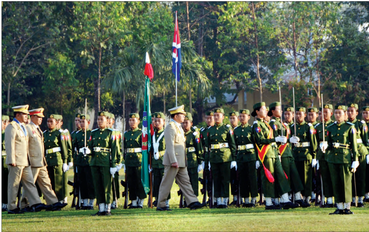
တပ်မတော်ကာကွယ်ရေးဦးစီးချုပ် ပိုလ်ချုပ်မှူးကြီး မဟာသရေစည်သူ မင်းအောင်လှိုင် ဘွဲ့ရ အမျိုးသမီးပိုလ်လောင်းသင်တန်း အမှတ်စဉ်(၄) သင်တန်းဆင်း ပိုလ်လောင်းတပ်ခွဲကို စစ်ဆေးစဉ်။