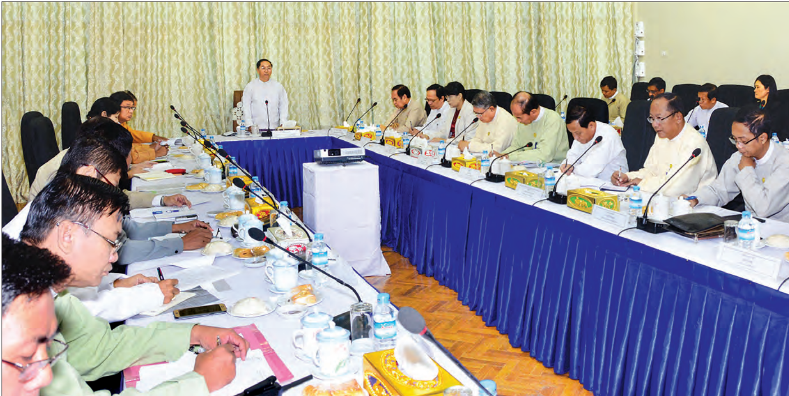
ဒုတိယသမ္မတ ဦးမြင့်ဆွေ ၁၈ ကြိမ်မြောက် မြန်မာ့တိုင်းရင်းဆေးသမားတော်များ ညီလာခံနှင့် နှီးနှောဖလှယ်ပွဲကျင်းပရေး ဦးစီးကော်မတီနှင့် လုပ်ငန်းကော်မတီ ညှိနှိုင်းအစည်းအဝေးတွင် အမှာစကားပြောကြားစဉ်။ သတင်းစဉ်

နေပြည်တော် ဒီဇင်ဘာ ၂၁ ၁၈ ကြိမ်မြောက် မြန်မာ့တိုင်းရင်းဆေးသမားတော်များ ညီလာခံနှင့် နှီးနှောဖလှယ်ပွဲ ကျင်းပရေး ဦးစီးကော်မတီနှင့် လုပ်ငန်းကော်မတီ ညှိနှိုင်းအစည်းအဝေးကို ယနေ့ နံနက် ၉ နာရီခွဲတွင် နေပြည်တော်ရှိ ကျန်းမာရေးနှင့် အားကစားဝန်ကြီးဌာန ရုံးအမှတ်-၄၇ အစည်းအဝေးခန်းမ၌ ကျင်းပရာ ဦးစီးကော်မတီနာယက ဒုတိယသမ္မတ ဦးမြင့်ဆွေ တက်ရောက်၍ အမှာစကားပြောကြားသည်။