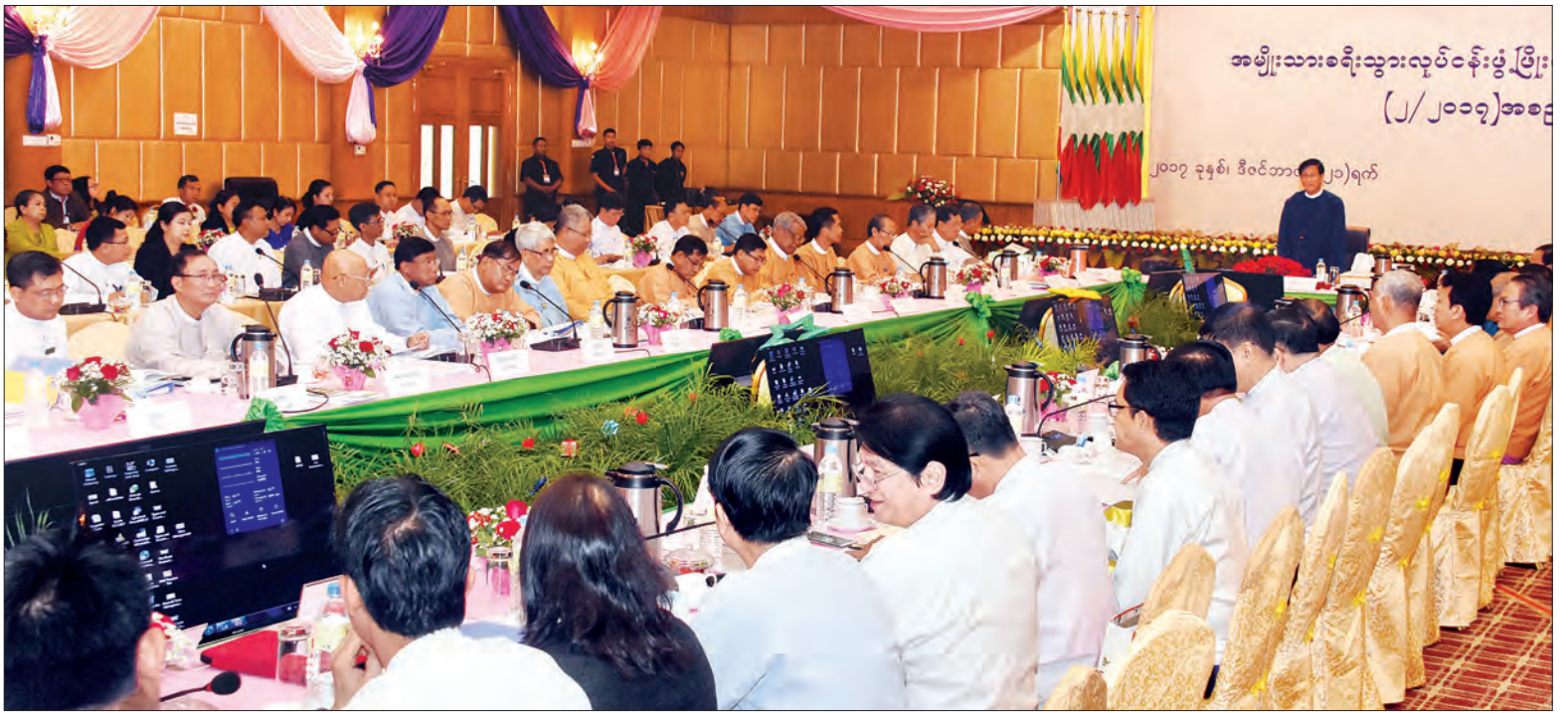
ဒုတိယသမ္မတ ဦးဟင်နရီဗန်ထီးယူ အမျိုးသားခရီးသွားလုပ်ငန်းဖွံ့ဖြိုးတိုးတက်ရေးဗဟိုကော်မတီ ၂/၂၀၁၇ ညှိနှိုင်းအစည်းအဝေးတွင် အမှာစကားပြောကြားစဉ်။ သတင်းစဉ်

အစည်းအဝေးတွင် ဗဟိုကော်မတီဥက္ကဋ္ဌ ဒုတိယသမ္မတ ဦးဟင်နရီဗန်ထီးယူက ခရီးသွားလုပ်ငန်းတစ်ခု စနစ်တကျ ဖွံ့ဖြိုးတိုးတက်ရန်နှင့် ဖွံ့ဖြိုးတိုးတက်မှု ရေရှည်တည်တံ့ ခိုင်မြဲရန်အတွက် စနစ်တကျ အစီအမံများ ချမှတ်ပြီး ဆောင်ရွက်ရန် လိုအပ်ပါကြောင်း၊ မြန်မာနိုင်ငံသည် အခြားသောအိမ်နီးချင်း နိုင်ငံများနှင့် နှိုင်းယှဉ်လျှင် ခရီးသွားအရင်းအမြစ်များ ပေါများကြွယ်ဝသည် စာမျက်နှာ ၄ ကော်လံ ၁ ❖