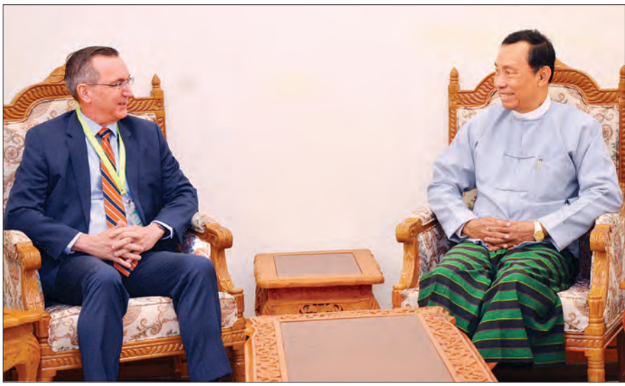
ပြည်ထောင်စုလွှတ်တော် ဥပဒေရေးရာနှင့် အထူးကိစ္စရပ်များ လေ့လာဆန်းစစ်သုံးသပ်ရေးကော်မရှင်ဥက္ကဋ္ဌ သူရဦးရွှေမန်း မြန်မာနိုင်ငံဆိုင်ရာ အမေရိကန်သံအမတ်ကြီး မစ္စတာ စကော့မာစီရယ်လ် အား လက်ခံတွေ့ဆုံစဉ်။

နေပြည်တော် ဒီဇင်ဘာ ၂၁ ပြည်ထောင်စုလွှတ်တော် ဥပဒေရေးရာနှင့် အထူးကိစ္စရပ်များ လေ့လာဆန်းစစ်သုံးသပ်ရေး ကော်မရှင်ဥက္ကဋ္ဌ သူရဦးရွှေမန်းသည် ပြည်ထောင်စုသမ္မတ မြန်မာနိုင်ငံဆိုင်ရာ အမေရိကန်သံအမတ်ကြီး မစ္စတာ စကော့ မာစီရယ်လ် အား ယနေ့ နံနက် ၉ နာရီ ၁၅ မိနစ် တွင် နေပြည်တော်ရှိ လွှတ်တော်ရေးရာဆောင် အမှတ်(I-11) ၌ လက်ခံတွေ့ဆုံသည်။ တွေ့ဆုံစဉ် ဒီမိုကရေစီ ပြုပြင်ပြောင်းလဲမှု အောင်မြင်ရှင်သန်ရေး၊ နိုင်ငံတည်ငြိမ် အေးချမ်း ရေးနှင့် ဖွံ့ဖြိုးတိုးတက်ရေး၊ နှစ်နိုင်ငံ ပူးပေါင်း ဆောင်ရွက်ရေးဆိုင်ရာ ကိစ္စရပ်များနှင့် စပ်လျဉ်း၍ ဆွေးနွေးကြသည်။ တွေ့ဆုံပွဲသို့ ကော်မရှင်အဖွဲ့ဝင် ဦးကိုကိုနိုင် နှင့် ကော်မရှင်ရုံးမှ တာဝန်ရှိသူများ တက်ရောက် ကြသည်။ သတင်းစဉ်