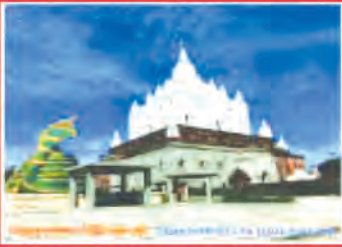
(ဆက်သွယ်နိုင်သော ဖုန်းနံပါတ်)

ရန်ကုန်တိုင်းဒေသကြီး၊ မရမ်းကုန်းမြို့နယ်၊ အမှတ်(၅)ရပ်ကွက် ကျောက်ရေတွင်းတောင်ပိုင်း သုခလမ်းနှင့် ဓမ္မပါလလမ်းပေါ်တွင် အဘားလေး ဒေါ်မေဇွယ် တည်ထားကိုးကွယ်တော်မူသော သဗ္ဗညုပုထိုးတော်ကြီး (ရန်ကုန်) အတွင်းပိုင်းတွင် ဘက်စုံပြုပြင်မွမ်းမံရန်အတွက် ဘုရားတည် ကုသိုလ်ဝေစု ဘိလပ်မြေ တစ်အိတ်လျှင် (၅၇၀၀)ကျပ်ဖြင့် ဘိလပ်မြေအိတ်များ ကုသိုလ်ပါဝင် လျှော့ဒါန်းနိုင် ကြပါသည်။