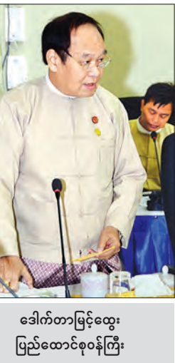
ဒေါက်တာမြင့်ထွေး ပြည်ထောင်စုဝန်ကြီး

◆ ရှေ့မှ လုပ်ငန်းကော်မတီ တစ်ခုနှင့် ဆက်ဆံပတ်သက် မတီ ကိုးခုကိုလည်း ဖွဲ့စည်းခဲ့ပါကြောင်း၊ မြန်မာ့တိုင်းရင်းဆေး သမားတော်များ ညီလာခံအား ၂၀၀၀ ပြည့်နှစ်မှစတင်၍ ရန်ကုန်မြို့၌ ၆ ကြိမ် နှင့် နေပြည်တော်၌ ၁၁ ကြိမ် နှစ်စဉ်ကျင်းပခဲ့ပြီး ယခုနှစ် တွင် ၁၈ ကြိမ်မြောက် ကျင်းပခြင်း ဖြစ် ပါကြောင်း၊ ယခုလို နှစ်စဉ်ကျင်းပခဲ့သည့် မြန်မာ့တိုင်းရင်းဆေး သမားတော်များ ညီလာခံနှင့် နီးနော့ဖလှယ်ပွဲအား ကျန်းမာရေးနှင့် အားကစားဝန်ကြီးဌာန တစ်ခုတည်းသာမက ဆက်စပ်လျက်ရှိ သည့် ဝန်ကြီးဌာနများကပါ ပိုင်းဝန်း ပူးပေါင်းဆောင်ရွက်မှုကြောင့် အောင်မြင် စွာ ကျင်းပနိုင်ခဲ့ခြင်း ဖြစ်ပါကြောင်း၊ ထို့ကြောင့် ယခု ၁၈ ကြိမ်မြောက် ညီလာခံ၌လည်း အစဉ်အလာမပျက် ပိုင်းဝန်းပူးပေါင်း ပါဝင်ဆောင်ရွက်သွား ကြရန် တိုက်တွန်းလိုပါကြောင်း၊ ရည်ရွယ်ချက် လေးချက် ချမှတ် ယခု ကျင်းပမည့် ၁၈ ကြိမ်မြောက် မြန်မာ့တိုင်းရင်းဆေး သမားတော်များ ညီလာခံနှင့် နီးနော့ဖလှယ်ပွဲကို ရည်ရွယ် ချက် လေးချက် ချမှတ်ကာ ကျင်းပသွား မည်ဖြစ်ပါကြောင်း၊ အဆိုပါ ရည်ရွယ်ချက် များမှာ မြန်မာ့တိုင်းရင်းဆေးလောက ဘက်စုံအဆင့်အတန်း မြင့်မားရေးနှင့် မြန်မာ့တိုင်းရင်းဆေးပညာ အရည် အသွေး တိုးတက်ရေး၊ မြန်မာ့ တိုင်းရင်းဆေးဆရာတို့၏ ကျင့်ဝတ်