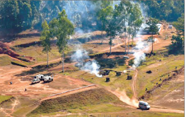
တပ်မတော်ကာကွယ်ရေးဦးစီးချုပ် ဗိုလ်ချုပ်မှူးကြီး မင်းအောင်လှိုင် နီပေါ ကြည်းတပ်မတော်၏ ငြိမ်းချမ်းရေးထိန်းသိမ်းမှုလေ့ကျင့်ခန်းများ သရုပ်ပြသမှု ကြည့်ရှုစဉ်။ သတင်းစဉ်