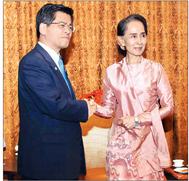
နိုင်ငံတော်၏ အတိုင်ပင်ခံပုဂ္ဂိုလ် ဒေါ်အောင်ဆန်းစုကြည် ဂျပန်နိုင်ငံမှ Minister of Land, Infrastructure, Transport and Tourism H.E. Mr. Keiichi Ishii အား ရင်းရင်းနှီးနှီးနှုတ်ဆက်စဉ်။ သတင်းစဉ်

နိုင်ငံတော်၏ အတိုင်ပင်ခံပုဂ္ဂိုလ် ဒေါ်အောင်ဆန်းစုကြည်သည် တတိယအကြိမ် အာရှ- ပစိဖိတ်ရေညီလာခံ ( The 3 rd Asia -Pacific Water Summit - 3 rd APWS) သို့ တက်ရောက်လာသည့် တီမောလက်စ်တေ ဒီမိုကရက်တစ်သမ္မတနိုင်ငံ၊ ဂျပန်နိုင်ငံ နှင့် အိန္ဒိယသမ္မတနိုင်ငံတို့မှ ဝန်ကြီးများအား ယနေ့နံနက်ပိုင်းတွင် ရန်ကုန်မြို့