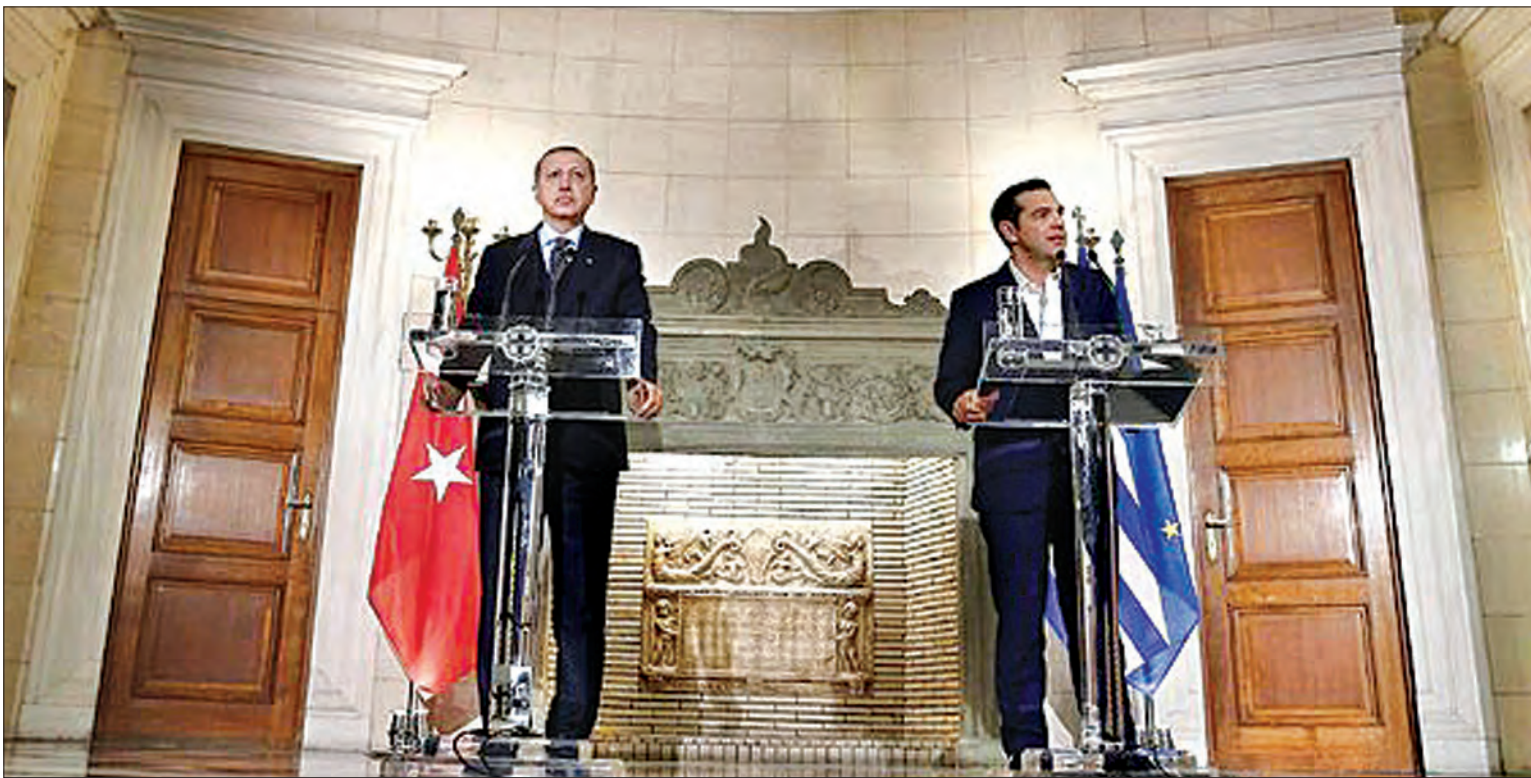
ဂရိဝန်ကြီးချုပ် Alexis Tsipras နှင့် တူရကီသမ္မတ အာဒိုဂန် တို့ကို အသင်မြို့ သတင်းစာရှင်းလင်းပွဲတွင် တွေ့ရစဉ်။

တူရကီနှင့် ဂရိနိုင်ငံတို့ဟာ ဆက်ဆံရေး မပြေပြစ်ခဲ့ကြတာ အချိန်အတော် ကြာပါပြီ။ ဒါပေမယ့် ယခုသီတင်းပတ် အတွင်းမှာတော့ တူရကီသမ္မတ အာဒိုဂန်ဟာ ဂရိနိုင်ငံကို သွားရောက် ခဲ့ပါတယ်။ ဒါဟာ နှစ်ပေါင်း ၆၅ နှစ် အတွင်းမှာ ဂရိနိုင်ငံကို သွားရောက်တဲ့ ပထမဦးဆုံးတူရကီသမ္မတ ဖြစ်လာ ခဲ့ပါတယ်။ အဲဒီခရီးစဉ်အတွင်းမှာ အာဒိုဂန်ဟာ ဂရိသမ္မတ ဝန်ကြီးချုပ် တို့နဲ့ပါ တွေ့ဆုံခဲ့ပါတယ်။