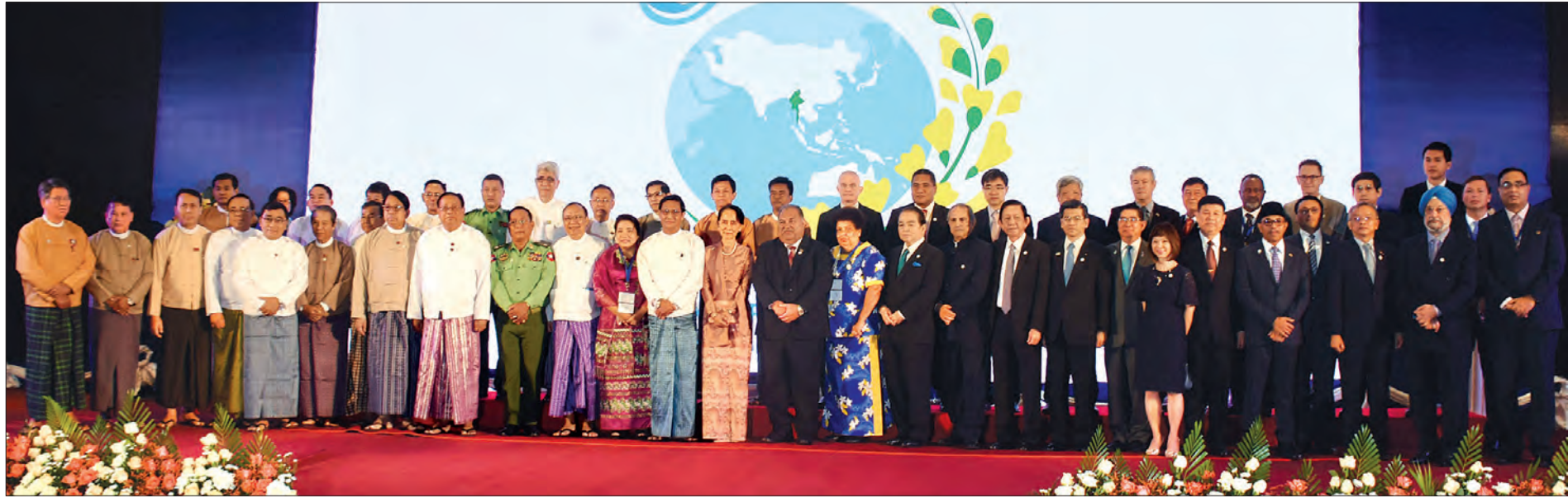
နိုင်ငံတော်၏ အတိုင်ပင်ခံပုဂ္ဂိုလ် ဒေါ်အောင်ဆန်းစုကြည် တတိယအကြိမ် အာရှ-ပစိဖိတ် ရေညီလာခံဖွင့်ပွဲအခမ်းအနားသို့ တက်ရောက်လာသည့် တာဝန်ရှိသူများနှင့်အတူ စုပေါင်းမှတ်တမ်းတင် ဓာတ်ပုံရိုက်စဉ်။