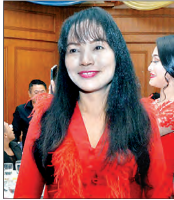
မကြာကြာခိုင် (ဒုတိယဆုရှင်)