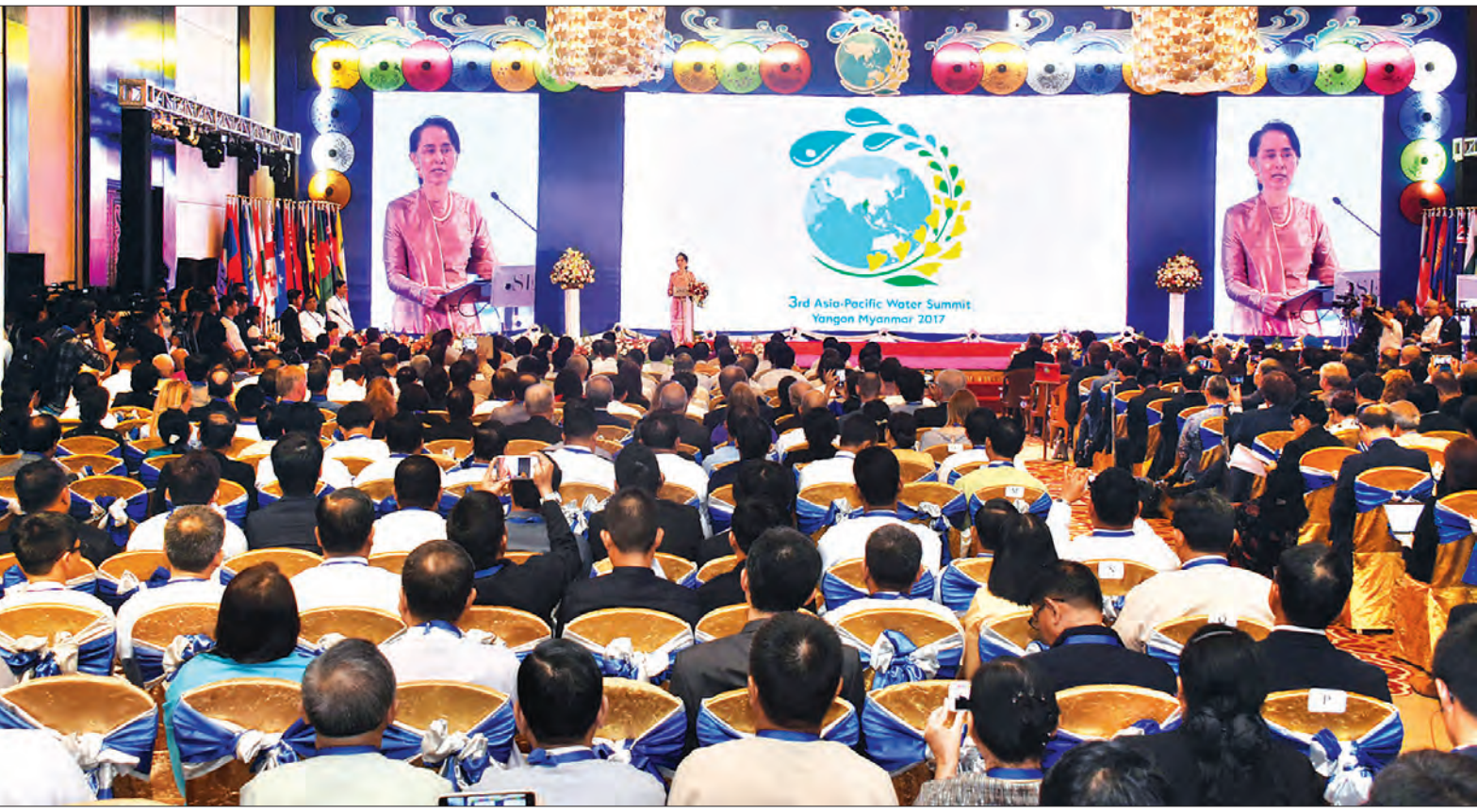
နိုင်ငံတော်၏ အတိုင်ပင်ခံပုဂ္ဂိုလ် ဒေါ်အောင်ဆန်းစုကြည် တတိယအကြိမ် အာရှ-ပစိဖိတ် ရေညီလာခံဖွင့်ပွဲအခမ်းအနား၌ အမှာစကားပြောကြားစဉ်။

များစွာစိုးရိမ်ဖွယ်ရာဖြစ် ကမ္ဘာပေါ်ရှိ လူဦးရေ ၁ ဒသမ ၇ ဘီလီယံသည် အခြေခံ တစ်ကိုယ်ရေ သန့်ရှင်းမှုရရှိနိုင်ခြင်း မရှိပါကြောင်း၊ ကမ္ဘာလူဦးရေသည် ၂၀၅၀ ပြည့်နှစ်တွင် ၅ ဒသမ ၂ ဘီလီယံခန့်အထိ တိုးမြှင့်လာ မည်ဟု သုံးသပ်ရသည့်အတွက် ရေအရင်း အမြစ် မလုံလောက်မှုအပေါ် များစွာ စိုးရိမ်ဖွယ်ရာ ဖြစ်ပါကြောင်း၊ ၂၀၅၀ ပြည့်နှစ်တွင် အာရှလူဦးရေ၏ ၃ ဒသမ ၄ ဘီလီယံခန့်သည် ရေနှင့်စပ်လျဉ်း၍ အခက်အခဲရှိသည့် နေရာများ၌ နေထိုင် ရလိမ့်မည်ဟု ခန့်မှန်းရပါကြောင်း။ အာရှ-ပစိဖိတ်ဒေသမှ လူဦးရေ သန်း ၃၃၀ ခန့်သည် တစ်ရက်လျှင် အမေရိကန်ဒေါ်လာ ၁ ဒသမ ၉ အောက် သာ ရရှိသော အလုပ်များကို လုပ်ကိုင် နေရပြီး လူဦးရေသန်း ၃၀၀ ခန့်မှာ သန့်ရှင်းသော သောက်ရေရရှိခြင်း မရှိ ပါကြောင်း၊ ထို့အပြင် ဖန်လုံအိမ် အာနိသင်ဖြစ်ပေါ်စေသော ဓာတ်ငွေ့ ထုတ်လွှတ်မှုသည် အခြားဒေသများ နှင့် နှိုင်းယှဉ်လျှင် ပိုမိုများပြားလာ ကြောင်း၊ အဆိုပါအချက်များသည် ဒေသ တစ်ခုလုံးအတွက် ပြုပြင်ရမည့် အချက် များ ဖြစ်ပါကြောင်း။