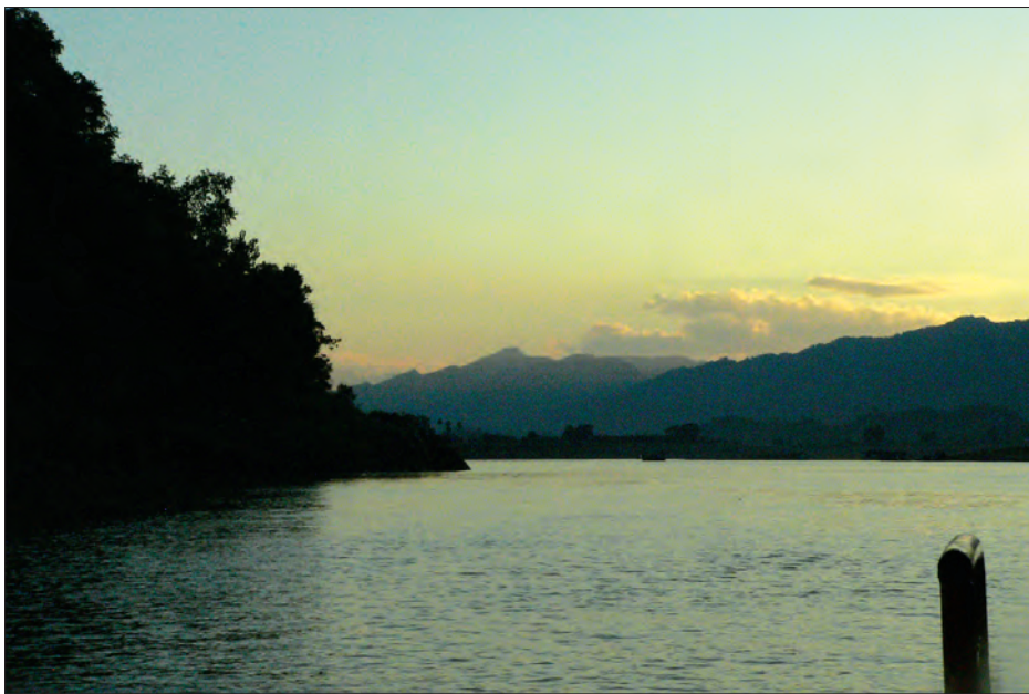
မုံရွာမြို့အနီးမှ ချင်းတွင်းမြစ်ကြောင်း တစ်နေရာ

ချင်းတွင်းမြစ်အထက်ပိုင်းတွင်ရှိသည့် ရွှေကျောက်စိမ်းနှင့် သတ္တုတူးဖော်ရေးလုပ်ငန်းများကြောင့် ရေထုညစ်ညမ်းမှုများဖြစ်ကာ မြစ်ရေတွင် ပြဒါ၊ ကြေးနီနှင့် အာဆင်းနစ်ကဲ့သို့သော သတ္တုများပါဝင်မှုများကြောင့် လူသားတို့၏ ကျန်းမာရေးကို ဆိုးရွားစွာထိခိုက်စေပြီး ချင်းတွင်းမြစ်ဝှမ်းဒေသ ဂေဟစနစ်ဝန်ဆောင်မှုများကို ထိခိုက်စေသလို အထူးသဖြင့် ချင်းတွင်းမြစ်၏ အကြီးဆုံး မြစ်လက်တက်ဖြစ်သော ဥရချောင်းကို ဆိုးရွားစွာ ထိခိုက်စေကြောင်း ဒီဇင်ဘာ ၇ ရက်က စစ်ကိုင်းတိုင်းဒေသကြီးလွှတ်တော်ရုံးတွင်ပြုလုပ်သော အစည်းအဝေး၌ SEI မှ တာဝန်ရှိသူ၏ ရှင်းပြချက်အရ သိရသည်။