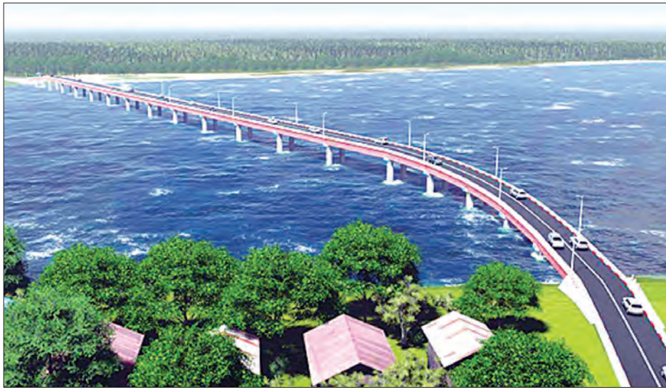
ရွှေကျင်ချောင်းကူးတံတားသစ် ဒီဇိုင်းပုံစံကို တွေ့ရစဉ်။

ရွှေကျင်ချောင်းကူးတံတားသစ်သည် ရေလမ်းကင်းလွတ်အကျယ် ၂၄ ဒဿမ ၉၉ မီတာ၊ ရေလမ်းကင်းလွတ်