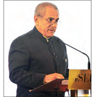
တီမောလက်စ်တေနိုင်ငံမှ Mr. Jose Ramos - Horta