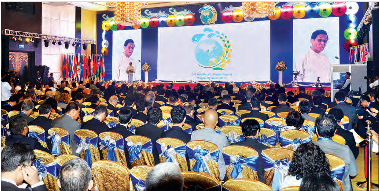
တတိယအကြိမ် အာရှ-ပစိဖိတ် ရေညီလာခံ ကျင်းပစဉ်။

ပြင်ဆင်ထားရှိ မြန်မာနိုင်ငံသည် ငလျင်ဒဏ်များ မကြာခဏခံစားရလေ့ရှိပြီး ရေနှင့် ဆက်သွယ်သော ပြင်းထန်သော ရာသီဥတု များဖြစ်သည့် ဆိုင်ကလုန်းမုန်တိုင်းများ၊ ကာလရှည်ကြာ ရေလွှမ်းမိုးခြင်း၊ မိုးခေါင် ရေရှားခြင်းတို့သည် ဆုံးရှုံးမှုများကို ဖြစ်ပေါ်စေသည့်အပြင် မြေပြိုခြင်းကို လည်း ဖြစ်ပေါ်စေပါကြောင်း၊ ရေအရည် အသွေးထိန်းသိမ်းမှုနှင့် ရေဆိုး ရေညစ် စီမံခန့်ခွဲမှုတို့ကို ခြိမ်းခြောက်လျက်ရှိပါ ကြောင်း၊ ရေနှင့်သက်ဆိုင်သော ပြဿနာ အများအပြားရှိပြီး စီမံခန့်ခွဲမှုများကိုလည်း