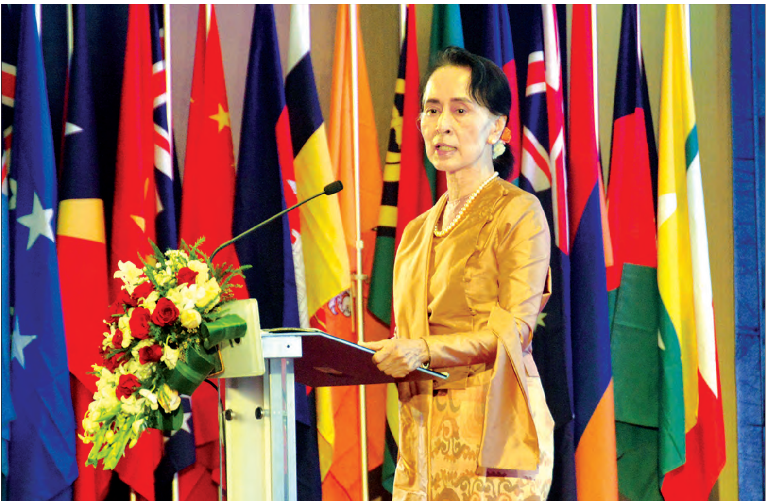
နိုင်ငံတော်၏ အတိုင်ပင်ခံပုဂ္ဂိုလ် ဒေါ်အောင်ဆန်းစုကြည် တတိယအကြိမ် အာရှ-ပစိဖိတ်ရေညီလာခံ ဖွင့်ပွဲအခမ်းအနား၌ အမှာစကားပြောကြားစဉ်။

ရှေးဦးစွာ နိုင်ငံတော်၏အတိုင်ပင်ခံ ပုဂ္ဂိုလ် ဒေါ်အောင်ဆန်းစုကြည်က အဖွင့်အမှာစကား ပြောကြားရာတွင် မကြာသေးမီက (၇၂) ကြိမ်မြောက် ကုလသမဂ္ဂ အထွေထွေညီလာခံတွင် စာမျက်နှာ ၄ ကော်လံ ၁ ❁