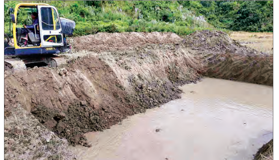
မောင်တောမြို့ ရေပေးဝေရေးအတွက် တူးဖော်နေသည့် ရေကန်ကို တွေ့ရစဉ်။

သတင်းနှင့်စာတိတ်ဖွဲ့-နေဝင်းထွန်း၊ ဟန်လင်းနိုင်(စစ်တွေကိုယ်ပွား)