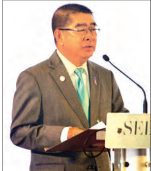
မလေးရှားနိုင်ငံမှ Dr. Maximus Johnity Ongkili

မြန်မာနိုင်ငံသည် ယေဘုယျအားဖြင့် လူဦးရေအရ လည်းကောင်း၊ စီးပွားရေး အရ လည်းကောင်း၊ သဘာဝပတ်ဝန်းကျင် ရေရှည်တည်တံ့ရန်အတွက် လည်း ကောင်း၊ လုံလောက်သော ရေအရင်း အမြစ်ရှိသည်ဟု ဆိုနိုင်ပါကြောင်း၊ လက်တွေ့၌မူ အာရှ-ပစိဖိတ်ဒေသရှိ မိတ်ဆွေနိုင်ငံများကဲ့သို့ ရေနှင့်ဆက်သွယ် သည့် ပြဿနာများကို ခံစားနေရပါ ကြောင်း၊ ရေအများအပြားရှိခြင်း၊ ရေရရှိ နိုင်မှုနည်းပါးခြင်း၊ မသန့်ရှင်းသော ရေများရှိနေခြင်း စသည့်ပြဿနာများ ပင်ဖြစ်ပါကြောင်း၊ ထို့ကြောင့် မိမိတို့ နိုင်ငံ၏ ရေအရင်းအမြစ်များကို ထိရောက် စွာစီမံခန့်ခွဲနိုင်ရန် လိုအပ်သကဲ့သို့ ရေနှင့်ဆက်သွယ်သည့် ဝန်ကြီးဌာနများမှ စုပေါင်းဆုံးဖြတ်သည့် မူဘောင်တစ်ခုဖြင့်