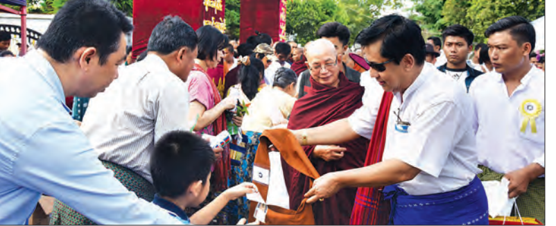
မြစ်ပြီး အောင်ပွဲအထိမ်းအမှတ် စတုဒိသာကျေးခြင်းနှင့် မြန်မာ့ရိုးရာခြင်းအလှူခတ် ဖျော်ဖြေပွဲကို ဒီဇင်ဘာ ၁၅ ရက် ညနေ ၄ နာရီတွင် ဓမ္မာရုံ၌ကျင်းပမည်ဖြစ်ကာ ဒီဇင်ဘာ ၁၆ ရက် ည ၇ နာရီတွင် အောင်ပွဲအထိမ်းအမှတ်အဖြစ် ဘောက်ထော်ဈေးရှေ့၌ သီးလေးသီးအငြိမ်းဖြင့် ပြည်သူများအား စည်းခံဖျော်ဖြေသွားမည် ဖြစ်ကြောင်း သိရသည်။ မြန်မာ့အလင်း

ရန်ကင်း ဒီဇင်ဘာ ၁၁ ရန်ကင်းတိုင်းဒေသကြီး ရန်ကင်းမြို့နယ် (၁၆) ရပ်ကွက်လုံးဆိုင်ရာ ပြည်သာယာဓမ္မာရုံ နှစ် ၅၀ ပြည့် ရွှေရတု အထိမ်းအမှတ် ဆွမ်းဆန်စိမ်းလောင်းလှူပွဲနှင့် နဝကမ္မစာရေးတံမဲ ကပ်လှူပူဇော်ပွဲကို ဒီဇင်ဘာ ၁၀ ရက်က ရန်ကင်းမြို့နယ် (၁၆) ရပ်ကွက် မာလာမြိုင်လမ်းနှင့် ပြည်တော်အေးလမ်းကြားရှိ ပြည်သာယာဓမ္မာရုံ၌ ကျင်းပရာ မြို့နယ်သံသယနာယက ဆရာတော်များထံ ဓမ္မာရုံအမှုဆောင်များနှင့် တက်ရောက်လာကြသူများက သင်္ကန်းများ ဆက်ကပ်လှူဒါန်းပြီး ပင့်သံသာ ၂၁၃ ပါးတို့အား ရပ်ကွက်အတွင်းနေ ပြည်သူများက ငွေကျပ်သိန်း ၅၀၀ တန်ဖိုးရှိ ဆွမ်းဆန်စိမ်းလောင်းလှူကြသည်။ လှူဒါန်းမှု အစုစုတို့အတွက် သံသတော်အပါး ၅၀ တို့အား ပင့်ဖိတ်၍ လှူဖွယ်ဝတ္ထုနှင့် နေ့ဆွမ်းဆက်ကပ်ခြင်းကို ဒီဇင်ဘာ ၁၆ ရက် နံနက် ၉ နာရီတွင် ဓမ္မာရုံ၌ ကျင်းပသွားမည်