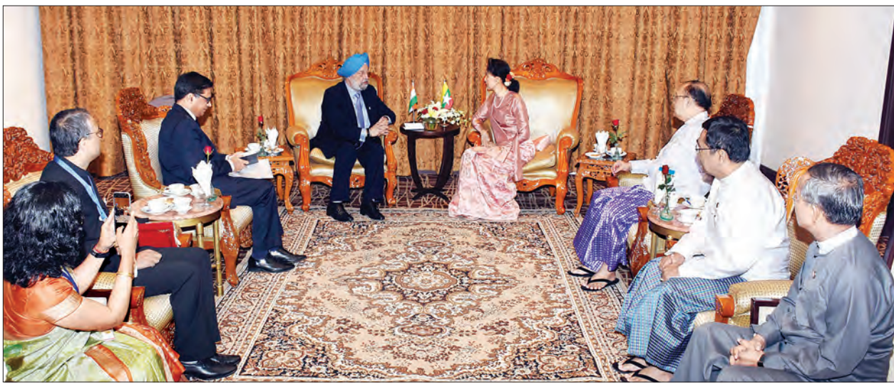
နိုင်ငံတော်၏ အတိုင်ပင်ခံပုဂ္ဂိုလ် ဒေါ်အောင်ဆန်းစုကြည် အိန္ဒိယသမ္မတနိုင်ငံမှ Minister of state and Housing and Urban Affairs H.E. Hardeep Singh Puri အား လက်ခံတွေ့ဆုံစဉ်။ သတင်းစဉ်

ဆီဒိုးနားဟိုတယ် အလံခန်းမ၌ သီးခြားစီတွေ့ဆုံသည်။ ရှေးဦးစွာ နိုင်ငံတော်၏ အတိုင်ပင်ခံပုဂ္ဂိုလ် ဒေါ်အောင်ဆန်းစုကြည်သည် တီမောလက်စ်တေ ဒီမိုကရက်တစ်သမ္မတနိုင်ငံမှ Senior Minister and National Security Advisor, Former President H.E. Mr. Jose Ramos - Horta အား နံနက် ၁၀ နာရီခွဲတွင် ဆီဒိုးနားဟိုတယ်၌ တွေ့ဆုံသည်။ ထို့နောက် နိုင်ငံတော်၏ အတိုင်ပင်ခံပုဂ္ဂိုလ် ဒေါ်အောင်ဆန်းစုကြည်သည် နံနက် ၁၁ နာရီတွင် ဂျပန်နိုင်ငံမှ Minister of Land, Infrastructure, Transport and Tourism H.E. Mr. Keiichi Ishii နှင့်လည်းကောင်း၊ နံနက် ၁၁ နာရီ ၂၅