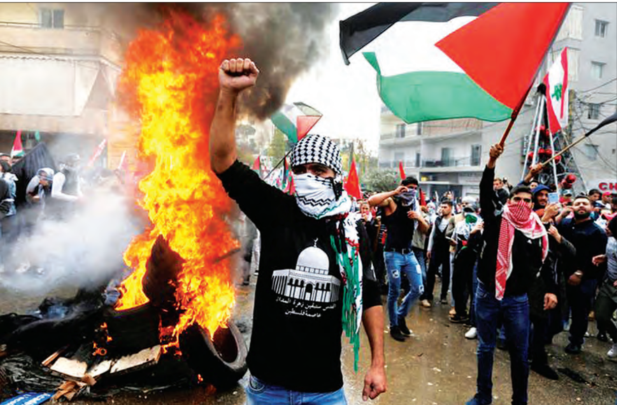
အချို့အပါအဝင် အစ္စလာမ့်နိုင်ငံရှိ မြို့ကြီးအများစုတွင် ဆန္ဒဖော်ထုတ်မှုများပေါ်ပေါက်ခဲ့သည်။ ပြီးခဲ့သည့်ရက်သတ္တပတ်က ဆန္ဒထုတ်ဖော်မှုများအတွင်း ဂါဇာဒေသနှင့် အနောက်ဘက်ကမ်းပါးတို့တွင် အစွရေးလုံခြုံရေးအင်အားစုများနှင့် ဆန္ဒထုတ်ဖော်သူများ ရုန်းရင်းဆန်ခတ်ဖြစ်ပွားမှုကြောင့် ပါလက်စတိုင်းပြည်သူ လေးဦး သေဆုံးကာ အများအပြားထိခိုက်ဒဏ်ရာရရှိခဲ့ပြီဖြစ်သည်။

တိုက်ခိုက်ခံရပြီးနောက် ပြင်းထန်သည့် ထိခိုက်ဒဏ်ရာများ ရရှိခဲ့သည့်အတွက် ဆေးရုံသို့ အလျင်အမြန်ပို့ဆောင်ခဲ့ရကြောင်း သိရသည်။ အမေရိကန်သမ္မတဒေါ်နယ် ထရန်က ဂျေရုဆလင်မြို့ကို အစွရေးမြို့တော်အဖြစ် သတ်မှတ်လိုက်သည့်အတွက် တင်းမာမှုများ ပိုမိုကြီးထွားလာခဲ့ချိန်တွင် ယင်းဖြစ်ရပ် ပေါ်ထွက်လာခဲ့ခြင်း ဖြစ်သည်။ ကမ္ဘာတစ်ဝန်းရှိ ပါလက်စတိုင်း ပြည်သူများနှင့် အစ္စလာမ်ဘာသာဝင်များက ယင်းဆုံးဖြတ်ချက်ကို အပြင်းအထန်ကန့်ကွက်ခဲ့ပြီး ဆန္ဒထုတ်ဖော်မှုများ ပြုလုပ်ခဲ့ကြသည်။ ထရန်သည် အစွရေးနိုင်ငံတော်အစစ်ရှိ အမေရိကန်သံရုံးကိုလည်း ဂျေရုဆလင်သို့ အမြန်ဆုံးရွှေ့ပြောင်းအခြေစိုက်ရန် ညွှန်ကြားခဲ့သည်။ ထရန်၏ ကြေညာချက်ကို ကန့်ကွက်သည့်အနေဖြင့် ပါလက်စတိုင်းက ဆန္ဒထုတ်ဖော်မှုများ ပြုလုပ်ကြရန် တိုက်တွန်းခဲ့သည်။ ပါလက်စတိုင်းနယ်နိမိတ် အတွင်းပြီးခဲ့သည့် ရက်များအတွင်းက ဆန္ဒဖော်ထုတ်မှုများစွာပေါ်ပေါက်ခဲ့ပြီး ဥပဒေပိတ်ဆို့ပြီး