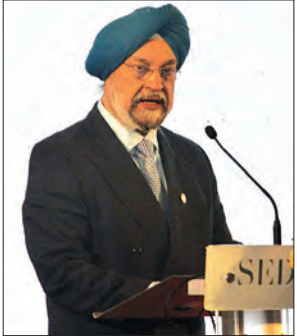
အိန္ဒိယသမ္မတနိုင်ငံမှ H.E Hardeep Singh Puri