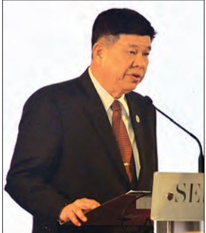
ထိုင်းနိုင်ငံမှ General Surasak Karnjanarat