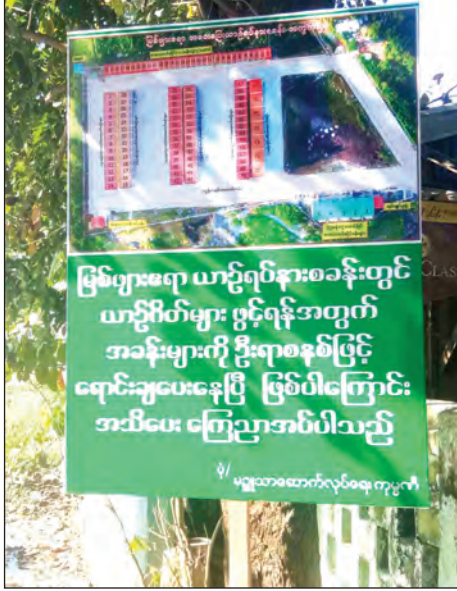
ကားကြီးဝင်းအသစ်မှ တိုက်ခန်းများကို ရောင်းချရန်အသိပေး ထားသောကြော်ငြာ

ကားကြီးဝင်းအသစ်မှ တိုက်ခန်းနေရာများမှာ ကျပ်သိန်း ၇၀၀ နီးပါးခန့် ဈေးနှုန်းများနှင့် ရောင်းချလျက်ရှိရာ ထိုသို့ ဈေးနှုန်းများမြင့်နေမှုကြောင့် ယာဉ်စီးခများနှင့် ကုန်တင်ပို့ရာ၌ တန်ဆာခနှုန်းထားများ မြင့်တက်လာမည်ကို ခရီးသွားပြည်သူ များနှင့် ကုန်သည်လုပ်ငန်းလုပ်ကိုင်သော စီးပွားရေးလုပ်ငန်းရှင်