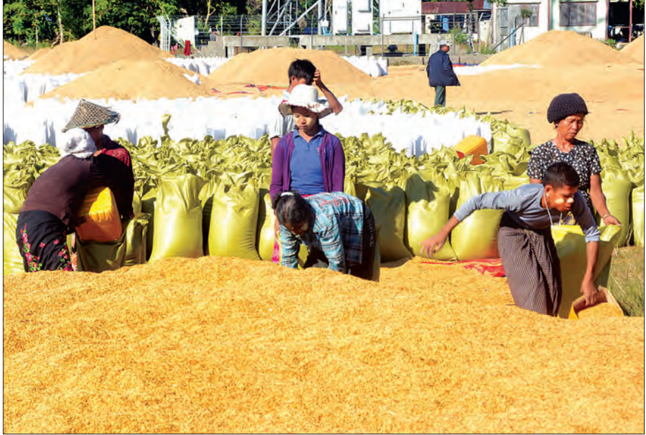
မောင်တောဒေသ ရိတ်သိမ်းခြေလှေ့ပြီး မိုးစပါးများ အခြောက်ခံသိမ်းဆည်းနေမှုကို တွေ့ရစဉ်။

ဖြေ။ ။ ဒေသတွင်းဖြစ်စဉ်ကြောင့် ရိတ်သိမ်းသူမဲ့ မိုးစပါးကေခြောက်သောင်းကျော်လောက် လျာထား တွက်ချက်ထားတာ ရှိပါတယ်။ ရိတ်သိမ်းခြေလှေ့တာ အခုဆို တစ်လကျော်လောက်ရှိနေပါပြီ။ မောင်တော တောင်ပိုင်းရော၊ မြောက်ပိုင်းရော တင်းပေါင်း တစ်သိန်းလေးသောင်းလောက် ရိတ်သိမ်းပြီး ဖြစ်ပါတယ်။ အခြောက်ခံ နေလှန်းတာ၊ ပြန်ဖြင့်တွယ်တာကအစ