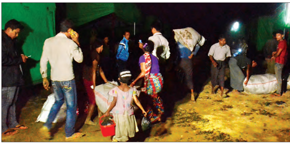
မောင်တောဒေသ တည်ငြိမ်အေးချမ်းလာသဖြင့် စစ်တွေမြို့ကယ်ဆယ်ရေးစခန်းတွင် ခိုလှုံနေသည့် ဟိန္ဒူဘာသာဝင်များ မောင်တောခရိုင် အုပ်ချုပ်ရေးမှူးရုံးဘေးရှိ ယာယီတန်းလျားသို့ ဒီဇင်ဘာ ၃ ရက်ညပိုင်းက ရောက်ရှိစဉ်။

ရောက်ရှိနေကြသကဲ့သို့ ယခုအခါတွင် ဟိန္ဒူဘာသာဝင်များလည်း မောင်တော မြို့သို့ ပြန်လည်ရောက်ရှိလာပြီ ဖြစ်သည်။ “တချို့နေရာတွေမှာတော့ သူတို့ အိမ်တွေ မီးလောင်သွားတာရှိတယ်။ မီးမလောင်တဲ့နေရာတွေကိုတော့ သူတို့ ရဲ့ အုပ်ချုပ်ရေးကိစ္စ၊ နေထိုင်မှုကိစ္စတွေ စီစဉ်ပြီးသွားရင် အိမ်တိုင်ရာရောက် ပြန်လည်ပို့ဆောင်ပေးမယ်။ လိုအပ်တဲ့