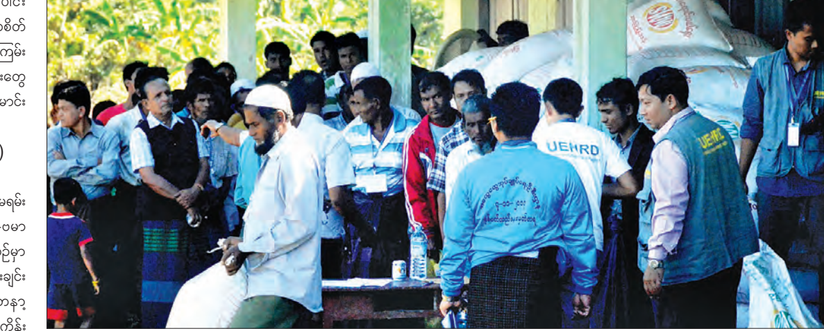
ရခိုင်ပြည်နယ်အတွင်း လူသားချင်းစာနာမှု အကူအညီအထောက်အပံ့ပေးမှုအဖြစ် မောင်တောမြို့နယ် ငါးခူရကျေးရွာရှိ အစ္စလာမ်ဘာသာဝင်များအား ထောက်ပံ့ပစ္စည်းများ ပေးအပ်စဉ်။

တွေ့ဆုံမေးမြန်း - သတင်းအဖွဲ့