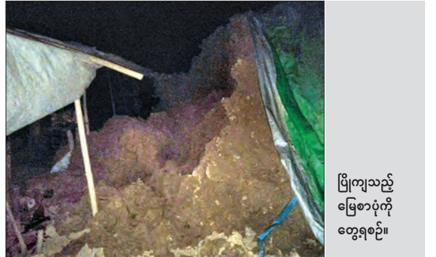
ပြိုကျသည့် မြေစာပုံကို တွေ့ရစဉ်။