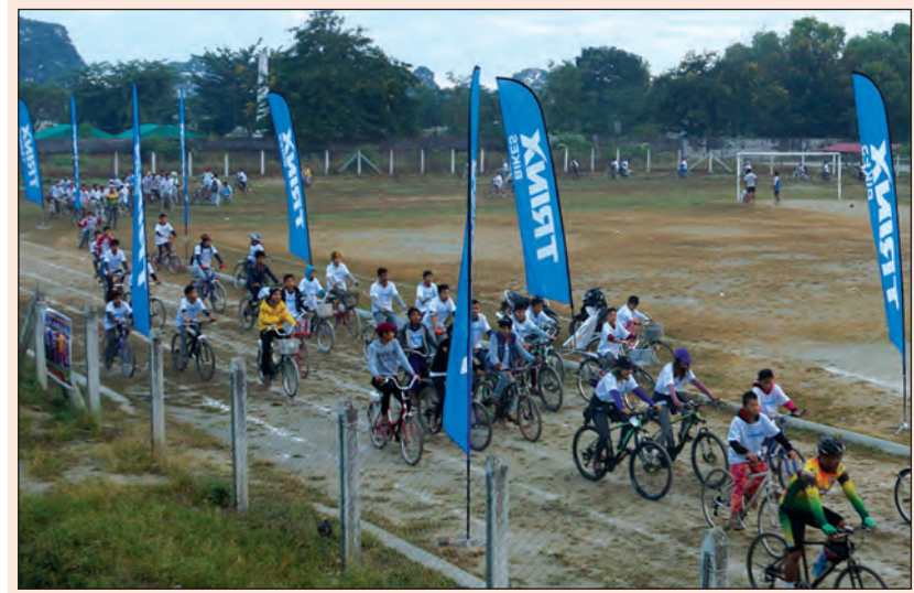
စစ်ကိုင်းတိုင်းဒေသကြီး ကလေးမြို့၌ ဒီဇင်ဘာအား ကစားလပထမပတ် လူထုစက်ဘီးစီးပွဲကို ဒီဇင်ဘာ ၃ ရက် နံနက် ၆ နာရီက ပြုလုပ်ရာ စက်ဘီးစီးဝါသနာရှင် ပြည်သူများ စုပေါင်းပါဝင်၍ ကလေးမြို့ လမ်းဆုံစီးပွဲနှင့် မှု ခရိုင်ပြည်သူ့အားကစားကွင်းအထိ ဝိုင်းရံလှည့်လမ်းမ အတိုင်း တပျော်တပါး စက်ဘီးစီးနေကြစဉ်။ (လူထု စက်ဘီးစီးပွဲကို ဒီဇင်ဘာလအတွင်း အပတ်စဉ် တနင်္ဂနွေနေ့ နံနက်တိုင်း ပြုလုပ်သွားမည်ဖြစ်ကြောင်း သိရသည်။) ပျူနိုင်

အဆိုပါရေလွှဲဆည်ကို ဒေသခံတောင်သူလယ်သမားများ စိုက်ပျိုးရေး လုပ်ငန်း များတွင် ရေလုံလောက်မှုရှိစေရန် စိုက်ပျိုးရေး၊ မွေးမြူရေးနှင့် ဆည်မြောင်းဝန်ကြီးဌာန ဆည်မြောင်းနှင့် ရေအသုံးချမှုစီမံခန့်ခွဲရေးဌာနက တည်ဆောက်နေခြင်းဖြစ်ပြီး အလျား ၁၄၇ ပေ၊ အကျယ် ၈၅ ပေ၊ ရေပေးမြောင်းအလျား ပေ ၅၀၀၀၊ ရေသွယ် လျှောက်တစ်ခုနှင့် ရေကျအဆောက်အအုံတစ်ခုလုံးတို့ ပါဝင်မည်ဖြစ်ကာ လုပ်ငန်းများ ပြီးစီးပါက မယ်ဆည်နယ်ကျေးရွာအုပ်စုအတွင်းရှိ မိုးစပါးစိုက်ပျိုးသည့် လယ်မြေများသို့ ရေလုံလောက်စွာ ပေးစေနိုင်မည်ဖြစ်ကြောင်း သိရသည်။ ဝတ်ရည် (ပြန်/ဆက်)