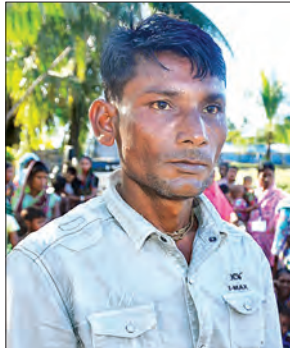
မော်နူရောလ်စွန်း (ဟိန္ဒူဘာသာဝင်) ငါးခုရကျေးရွာ