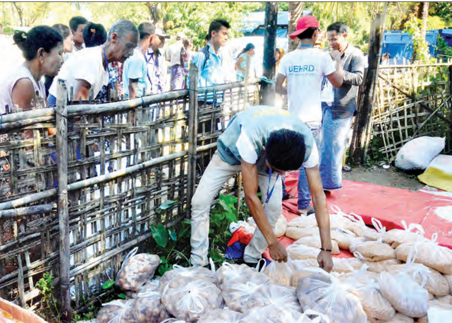
ရခိုင်ပြည်နယ်အတွင်း လူသားချင်းစာနာမှု အကူအညီ အထောက်အပံ့ပေးမှုအဖြစ် မောင်တောမြို့နယ် ငါးခုရကျေးရွာရှိ ရခိုင်တိုင်းရင်းသားများအား ထောက်ပံ့ပစ္စည်းများ ပေးအပ်စဉ်။

ကျွန်တော်တို့ UEHRD အစီအစဉ်ကို ဆောင်ရွက်နေတဲ့နေရာမှာ ကျွန်တော်တို့က အပိုင်း နှစ်ပိုင်းအနေနဲ့ သွားပါတယ်။ ပထမတစ်ပိုင်းက တစ်တိုင်းပြည်လုံးမှာရှိတဲ့ လူငယ်တွေပူးပေါင်းဆောင်ရွက်မှုနဲ့ လူသားချင်းစာနာမှု အကူအညီတွေကိုပေးအပ်ဖို့ ဆောင်ရွက်ပါတယ်။ နောက်တစ်ပိုင်းကတော့ တစ်နိုင်လုံးမှာရှိတဲ့ တိုင်းဒေသကြီးနဲ့ ပြည်နယ်အသီးသီးက အစိုးရအဖွဲ့တွေရဲ့ ဦးဆောင်မှုနဲ့ ဒီဒေသမှာရှိတဲ့ ပျက်စီးဆုံးရှုံးမှုတွေရှိနေတဲ့ ကျေးရွာတွေကို ပြန်လည် တည်ဆောက်မှုတွေ ဆောင်ရွက်သွားကြဖို့ဖြစ်ပါတယ်။ ထောက်ပံ့တဲ့အခါမှာ ဝေးလံခေါင်းပါးတဲ့ ဒေသတွေ၊ မြေပြင်အနေအထားအရ နေချင်းပြန်သွားလို့ရတဲ့ နေရာတွေကို ရွေးပါတယ်။ ရွေးပြီးတဲ့အခါမှာ အခု မောင်တောမြို့နယ်မှာ ဒုတိယအသုတ်အနေနဲ့ ဆောင်ရွက်တာက ဒီငါးခုရကျေးရွာ ဖြစ်ပါတယ်။ ငါးခုရမှာ ဒေသခံရခိုင်တိုင်းရင်းသားတွေ၊ ဟိန္ဒူဘာသာဝင်တွေနဲ့ အစွလာမ်ဘာသာဝင်တွေရှိတယ်။ ကျေးရွာ