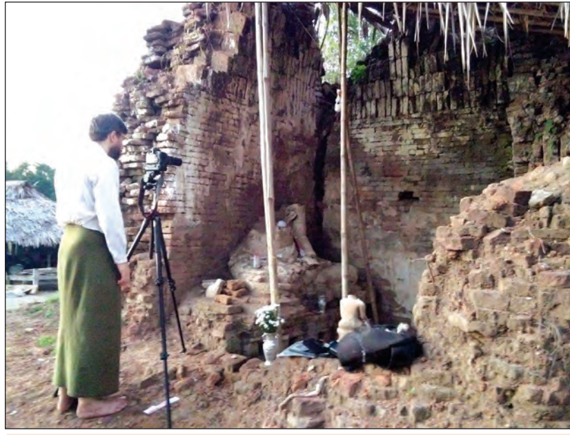
စေတီဟောင်းတစ်ဆူတွင် ရှားပါးသော သုတေသနပြုနေစဉ်။

ဝက်လက် ဒီဇင်ဘာ ၄ စစ်ကိုင်းတိုင်းဒေသကြီး ဝက်လက်မြို့နယ် သရက်ကြီးရွာ မြောက်ဘက်ရှိ သာဒွန်းကျောင်းမှ စေတီဟောင်း တစ်ဆူ၌ ၁၅ ရာစု(မြန်မာသက္ကရာဇ် ၇၀၀ ကျော်ခန့်)က နံရံဆေးရေးပန်းချီများကို တွေ့ရှိခဲ့ပြီး အဆိုပါ ပန်းချီ များမှာ အလွန်ရှားပါးသော ရှေးဟောင်းလက်ရာဖြစ်ကာ တစ်နိုင်ငံလုံးတွင် အနည်းငယ်သာ ကျန်ရှိတော့သဖြင့် ထိန်းသိမ်းစောင့်ရှောက်ရန်လိုအပ်နေကြောင်း သိရ သည်။