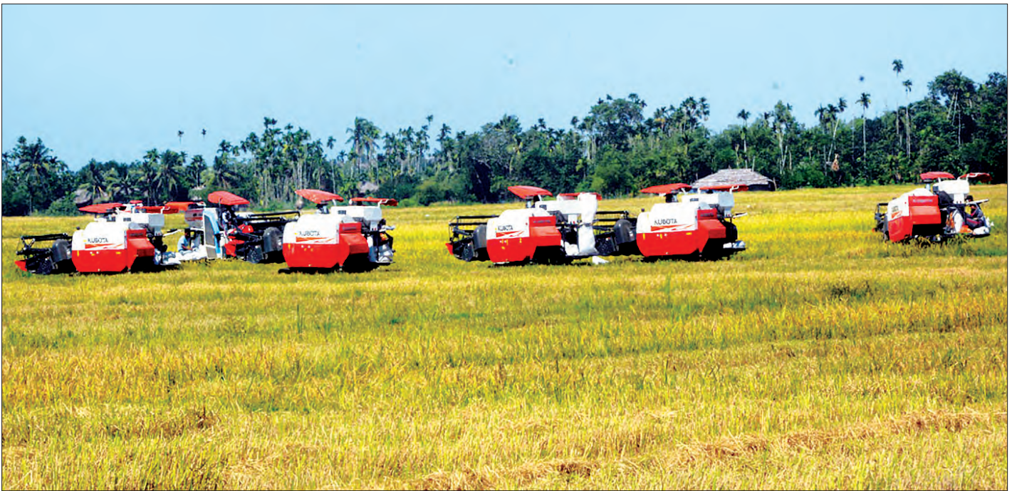
မောင်တောဒေသတွင်းရှိ မိုးစပါးများကို ရိတ်သိမ်းခြွေလှေ့စက်ကြီးများဖြင့် ရိတ်သိမ်းခြွေလှေ့နေမှုကို တွေ့ရစဉ်။