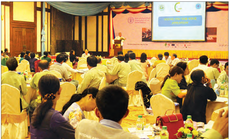
တိရစ္ဆာန်ကောင်ရေစာရင်း ကောက်ယူရေး ဆရာဖြစ်သင်တန်း (တတိယအဆင့်) ဖွင့်လှစ်သင်ကြားနေမှုကို တွေ့ရစဉ်။

ကျောစုံမှ ရည်ရွယ်ချက်အနေဖြင့် မြန်မာနိုင်ငံ ၏ တိရစ္ဆာန်ကောင်ရေနှင့် တိရစ္ဆာန်ထွက် ပစ္စည်း ထုတ်လုပ်မှု စာရင်းဇယားများ အား အတည်ပြုထုတ်ပြန်ရန် ဖြစ်သည်။ ရရှိနိုင်မည့် အကျိုးကျေးဇူးများအနေဖြင့် မြန်မာနိုင်ငံအတွင်းရှိ စီးပွားရေးအရ အရေးကြီးသော တိရစ္ဆာန်များ၏ ကောင် ရေစာရင်းကို အတိအကျ ရရှိနိုင်ခြင်း၊ ကောက်ယူရရှိသော တိရစ္ဆာန်ကောင်ရေ စာရင်းများအပေါ်အခြေခံ၍ မွေးမြူမှု ဖွံ့ဖြိုးတိုးတက်ရေးဆိုင်ရာ စီမံကိန်းများ ရေးဆွဲလျက်အောင်မြင်စွာ အကောင် အထည်ဖော်ဆောင်ရွက်ခြင်းဖြင့် နိုင်ငံ တော်၏စီးပွားရေးကို အထောက်အကူပြု နိုင်ခြင်း၊ ကောက်ယူရရှိသော တိရစ္ဆာန် ကောင်ရေ စာရင်းအပေါ်အခြေခံ၍ တိရစ္ဆာန်ကျန်းမာရေးဆိုင်ရာ လုပ်ငန်း စီမံချက်များကို ရေးဆွဲအကောင်အထည် ဖော်ဆောင်ရွက်နိုင်ခြင်း၊ နိုင်ငံတော် အစိုးရ၏ အစားအစာဖူလုံရေးနှင့် ဆင်းရဲနွမ်းပါးမှု ပပျောက်ရေးဆိုင်ရာ မူဝါဒများ၊ လုပ်ငန်းစီမံချက်များ ချမှတ် ရာတွင် မှန်ကန်သော အချက်အလက်များ ပံ့ပိုးပေးနိုင်ခြင်းတို့ ဖြစ်သည်။