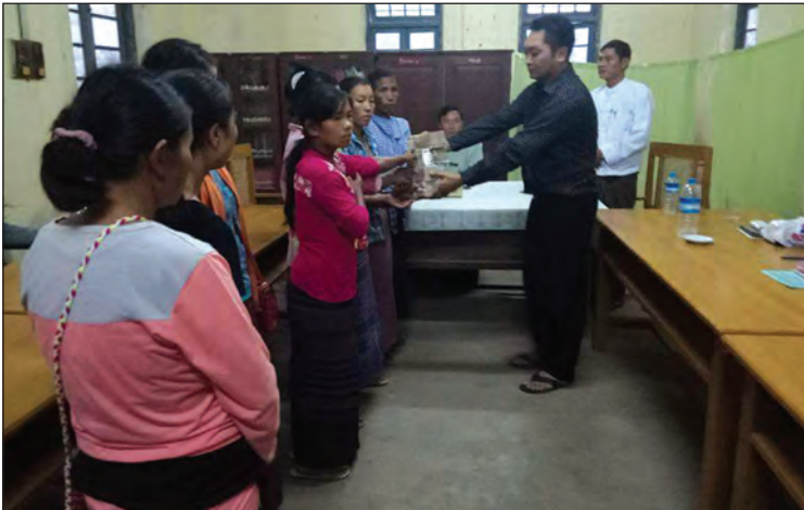
ကုမ္ပဏီပိုင်ရှင်နှင့် လုပ်ငန်းတာဝန်ခံကိုလည်း ရာဇနယ်မြေရဲစခန်းက အမှုဖွင့်ဆောင်ရွက်ထားသတ်ကြီး ဥပဒေပုဒ်မ ၃၀၄(က)ဖြင့် စလင်းမြို့ကြောင်း သိရသည်။ ဇေယျတု(မကွေး)

အဆိုပါ ကျောက်မီးသွေးတွင်း ပြိုကျမှုဖြစ်စဉ်တွင် တရုတ်နိုင်ငံသားတစ်ဦးနှင့် မြန်မာလုပ်သား ခုနစ်ဦး စုစုပေါင်း ရှစ်ဦးသေဆုံးသွားခဲ့ပြီး လေးဦး ဒဏ်ရာရခဲ့ကြောင်းနှင့် အဆိုပါဖြစ်စဉ်ကြောင့် ဟန်ထက်(၁) ကျောက်မီးသွေးတွင်းကို သတ္တုတွင်းဝန်ကြီးဌာနက ပြည်ထောင်စုအဆင့် အခွင့်အာဏာဖြင့် နိုဝင်ဘာ ၂၉ ရက်က အပြီးပိတ်လိုက်ကြောင်း သိရသည်။ ဖြစ်စဉ်နှင့်ပတ်သက်၍