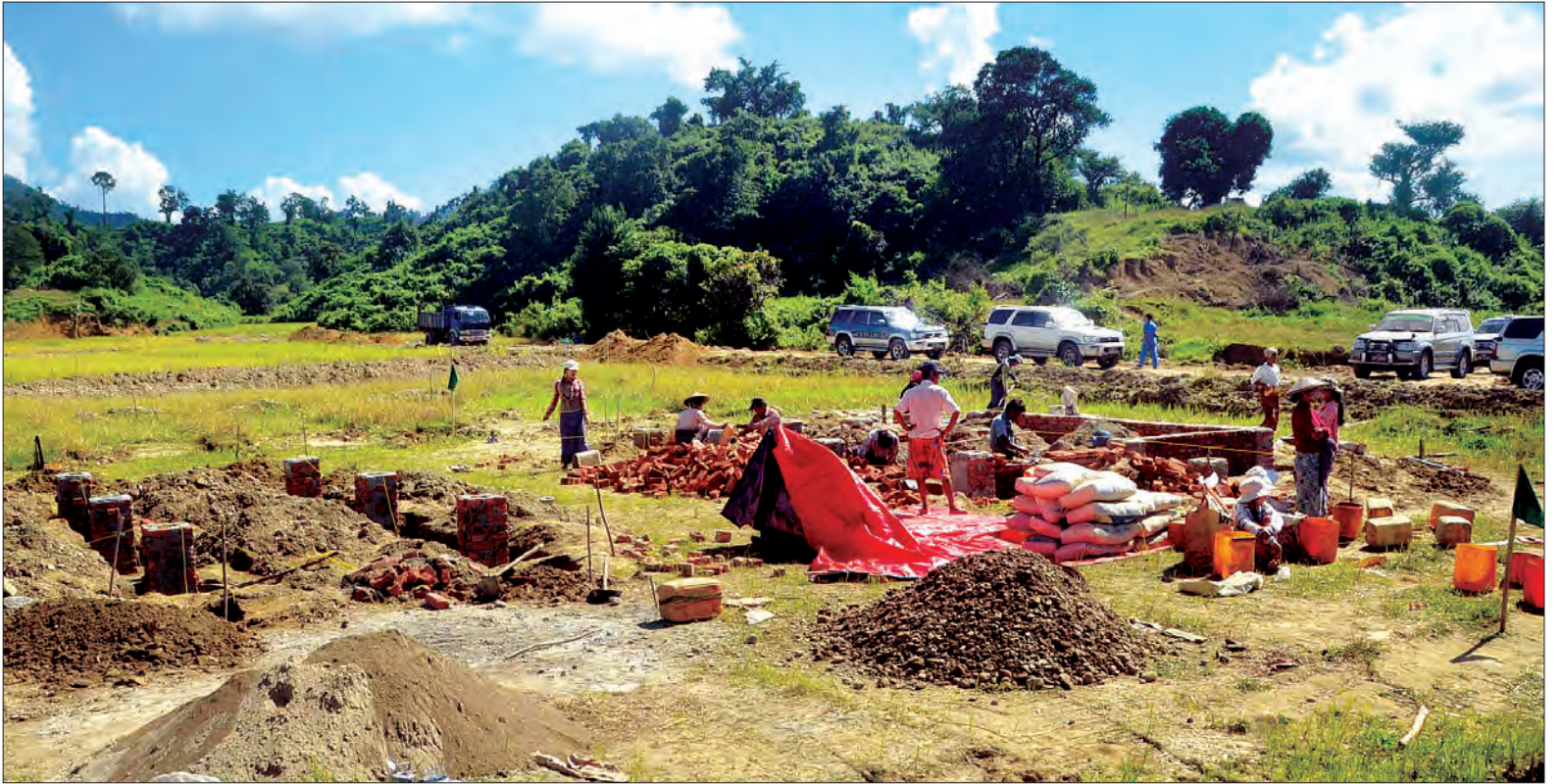
UEHRD ကော်မတီ၏ ဆောက်လုပ်ရေးနှင့် အခြေခံအဆောက်အအုံ တည်ဆောက်ရေးလုပ်ငန်းအဖွဲ့က မောင်တောဒေသ ခုံတိုင်ကျေးရွာသစ် တည်ဆောက်နေမှုကို ဒီဇင်ဘာ ၁၃ ရက်က တွေ့ရစဉ်။ သတင်းစဉ်

နေပြည်တော် ဒီဇင်ဘာ ၄ ယနေ့ မြန်မာ့တော်ချိန် ညနေ ၆ နာရီခွဲ တိုင်းထွာချက်အရ ဘင်္ဂလားပင်လယ်အော် အရှေ့တောင်ပိုင်းနှင့် ယင်းနှင့် ဆက်စပ်လျက်ရှိသော ကပ္ပလီပင်လယ်ပြင် တောင်ပိုင်းတို့တွင် ဖြစ်ပေါ်နေသော လေဖိအားနည်းရပ်ဝန်းသည် ဆက်လက်တည်ရှိနေပြီး နောက် ၂၄ နာရီအတွင်း ပိုမိုအားကောင်းလာကာ မှန်တိုင်းငယ် (Depression) အဖြစ်သို့ ရောက်ရှိလာနိုင်သည်ဟု ခန့်မှန်းရသည်။ မိုး/လေ