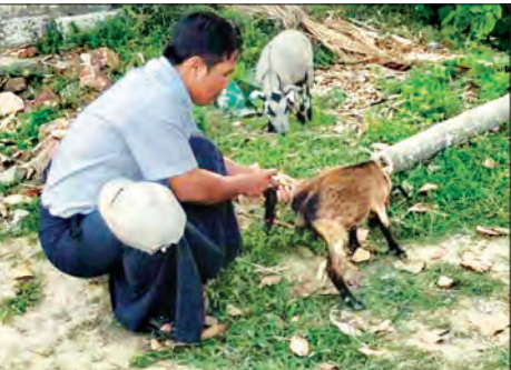
တိရစ္ဆာန်များအား ကာကွယ်ကုသ ဆေး ထိုးနှံပေး နေမှုကို တွေ့ရစဉ်။

○ ရှေ့မှ အမြင့် လေးပေရှိ Ground Tank တစ်လုံး၊ ရေ ၁၂၀၀ ဂါလန်ဆုံ Overhead Tank နှစ်လုံး၊ အလျား ပေ ၆၀၊ အနံ ပေ ၃၀၊ အမြင့် ၁၀ ပေရှိသော ထမင်းချက်၊ ထမင်းစားဆောင် တစ်လုံး၊ စက်ရေတွင်း နှစ်တွင်းနှင့် အဆောက်အအုံများရေရှိ လမ်း များ ကျောက်ခင်းခြင်းကို အသစ်ထပ်မံ ဆောင်ရွက်သွားမည်ဖြစ်ကြောင်း သိရသည်။ ထို့ပြင် ပြန်လည်လက်ခံရေးလုပ်ငန်းစဉ်များတွင် တာဝန်ထမ်းဆောင်ကြမည့် ဝန်ထမ်းများရုံးခန်းအဖြစ် အသုံးပြုရန် Modular House ၃၁ လုံး၊ ဝန်ထမ်းများ နေထိုင်နိုင်ရန် Modular House ရစ်လုံးနှင့် တစ်ဖက်နိုင်ငံမှ ပြန်လည်ဝင်ရောက်