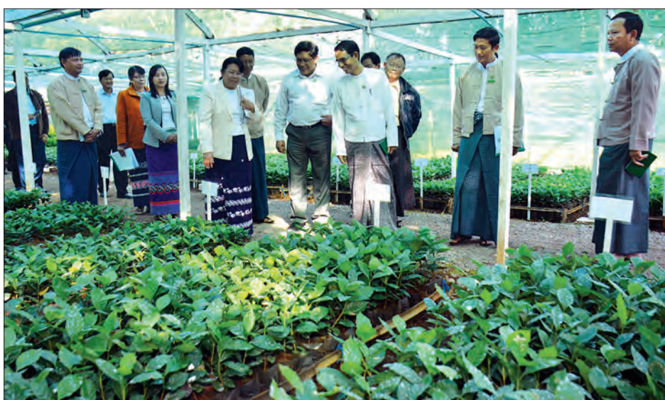
စနစ်တကျ စီမံဆောင်ရွက်ကြရန် လိုအပ် က ပြင်ဦးလွင်မြို့၊ ကော်ဖီ သုတေသနနှင့် စိုက်ပျိုးရေး၊ မွေးမြူရေးနှင့် ဆည်မြောင်း ဝန်ကြီးဌာန ပြည်ထောင်စုဝန်ကြီး

နေပြည်တော် ဒီဇင်ဘာ ၄ မြန်မာ့ကော်ဖီသီးနှံသည် နိုင်ငံတကာ စံချိန်စံညွှန်းမီ အရည်အသွေးပြည့်ဝ စွာ ဈေးကွက်ဝင်လျက်ရှိရာ စီးပွားဖြစ် စိုက်ပျိုးထုတ်လုပ်နိုင်ရေးအတွက် ပုဂ္ဂလိက ကဏ္ဍ ဖွံ့ဖြိုးလာရေး အားပေးကူညီရန်နှင့် မျိုးကောင်းမျိုးသန့် ပွားများဖြန့်ဖြူးပေးခြင်း၊ ချင်းပြည်နယ်နှင့် ကရင်ပြည်နယ် သံတောင်ကြီးဒေသများကဲ့သို့ ရေမြေ ရာသီဥတု အခြေအနေပေးသော ဒေသများတွင် ကျယ်ကျယ်ပြန့်ပြန့် စိုက်ပျိုး ထုတ်လုပ်နိုင်ရန် စီမံဆောင်ရွက်ပေးခြင်း စသည်လုပ်ငန်းများအပြင် သုတေသန လုပ်ငန်းကို အရှိန်အဟုန်မြှင့်တင် ဆောင်ရွက်ရန်နှင့် ကျွမ်းကျင်ပညာရှင်များ ခါးဆက်မပြတ် စေရေးအတွက် ပညာရပ်ပိုင်းဆိုင်ရာ လက်ဆင့်ကမ်း လေ့ကျင့်ခွင့်ပေးပေးနိုင်ရေးတို့ကိုပါ