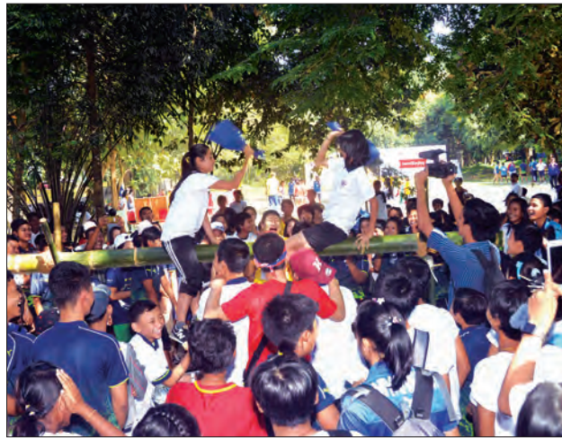
ကျန်းမာရေးနှင့် အားကစားဝန်ကြီးဌာန အားကစားလှုပ်ရှားမှုအဖြစ် လူငယ်များ ခေါင်းအုံးရိုက်ပြိုင်ပွဲ ဝင်ရောက်ယှဉ်ပြိုင်စဉ်။ သတင်းစဉ်