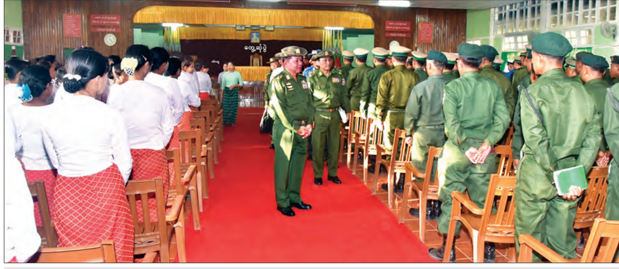
တပ်မတော်ကာကွယ်ရေးဦးစီးချုပ် ဗိုလ်ချုပ်မှူးကြီးမင်းအောင်လှိုင် စစ်တွေတပ်နယ်ရှိ အရာရှိ၊ စစ်သည်၊ မိသားစုများအား ရင်းရင်းနှီးနှီးနှုတ်ဆက်။

ယင်းနောက် မွန်းလွဲပိုင်းတွင် တပ်မတော်ကာကွယ်ရေးဦးစီးချုပ်သည် စစ်တွေ တပ်နယ်ရှိ အရာရှိ၊ စစ်သည်၊ မိသားစုများအား တွေ့ဆုံအမှာစကား ပြောကြားကြောင်း သတင်းရရှိသည်။ သတင်းစဉ်