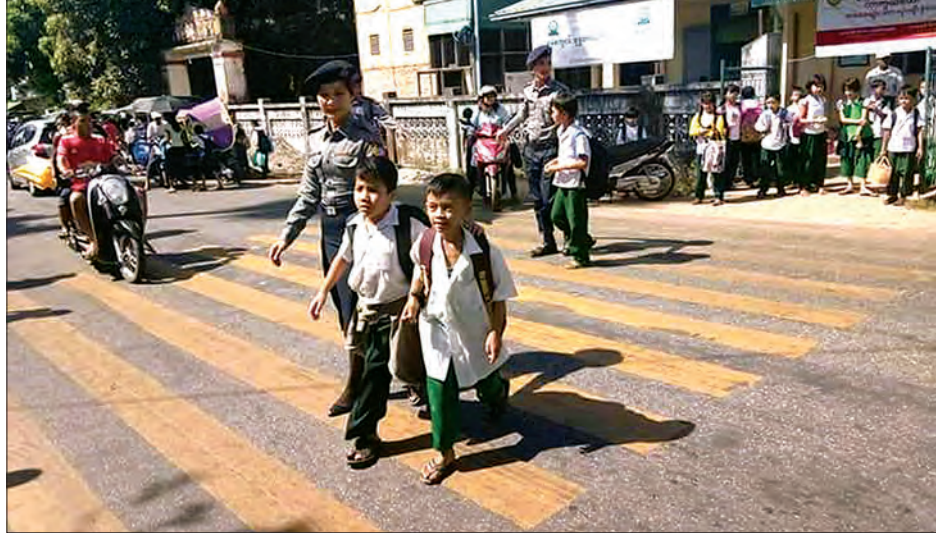
မွန်ပြည်နယ် ရဲတပ်ဖွဲ့မှူး ရဲမှူးကြီးတို့တို့၏ ညွှန်ကြားမှုဖြင့် ကျောင်းတက် ကျောင်းဆင်းချိန်များတွင် ကလေးများ ယာဉ်အန္တရာယ် ကင်းရှင်းစေရန် သတိပေးစဉ်။

ခဲ့ကြကြောင်းနှင့် အား/ကာမှ လမ်းလျှောက်ပွဲ ပါဝင်ဆင်နွှဲသူများကို နံနက် စာ ကောက်ညှင်းပေါင်း၊ အကြော် တို့ဖြင့် စည်းခေါင်းသိရသည်။ ထို့ပြင် မြို့နယ် ရပ်ကွက် အသီးသီးတို့၌လည်း အားကစား ပြိုင်ပွဲများကို ဒီဇင်ဘာလ၏ စနေ၊ တနင်္ဂနွေနေ့တိုင်းကျင်းပကြပြီး မြို့မိ မြို့ဖ များ၊ ရပ်ကွက် အုပ်ချုပ်ရေးမှူးများ၊ အား/ကာတို့နှင့်အတူ ပူးပေါင်းဆောင်ရွက်ကြသည်။ တင်မောင်(မန်ကုလ်ပွား)