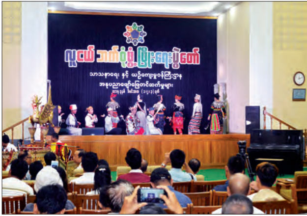
သာသနာရေးနှင့် ယဉ်ကျေးမှုဝန်ကြီးဌာနမှ တိုင်းရင်းသားအနုပညာရှင်များ ဖျော်ဖြေ တင်ဆက်နေစဉ်။ သတင်းစဉ်