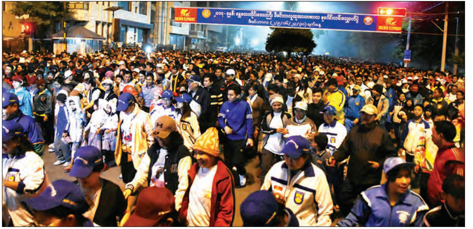
မန္တလေးမြို့မှ မိဘပြည်သူများ စုစုပေါင်း အင်အား ၁၀၅၀၀ ကျော်တို့သည် သတ်မှတ်စုရပ်နေရာတွင် ရောက်ရှိနေရာ ယူကြသည်။

မန္တလေး ဒီဇင်ဘာ ၂ ၂၀၁၇ ခုနှစ် မန္တလေးတိုင်းဒေသကြီး ဒီဇင်ဘာ လူထုအားကစား လှုပ်ရှားမှု ပထမပတ် စုပေါင်းလမ်းလျှောက်ပွဲကို ဒီဇင်ဘာ ၂ ရက် နံနက် ၅ နာရီခွဲက မန္တလေးမြို့ ကျွန်းတောင်ဘက် ၂၆ လမ်းနှင့် ၇၃ လမ်းဆုံ မင်္ဂလာတန်းထိပ် ခရပ် နေရာတွင် ကျင်းပသည်။ (ယာပုံ)