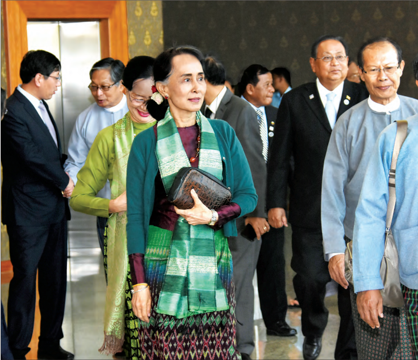
နိုင်ငံတော်၏ အတိုင်ပင်ခံပုဂ္ဂိုလ် ဒေါ်အောင်ဆန်းစုကြည် တရုတ်ပြည်သူ့သမ္မတနိုင်ငံမှ နေပြည်တော်သို့ ပြန်လည်ရောက်ရှိလာစဉ်။