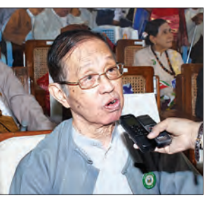
ဦးဝင်းမောင် (မင်းယုဝေ)

ရန်ကုန်တို့၊ လင်းယုန်တို့ လူထုတို့မှာ စာရေးခဲ့တာပါ။ အခုထက်ထိလည်း ရေးတုန်းပါပဲ။ စာရေးတဲ့သူတွေ ရေးဖော်ရေးဖက်ပုဂ္ဂိုလ်တွေ ပြန်ဆိုရတဲ့အတွက် ဝမ်းမြောက်ပါတယ်။ စာပေပညာရှင်တွေကို အခုလို ကန်တော့ရတဲ့အတွက် အလွန်ဝမ်းမြောက်ပါတယ်။ ကိုယ့်မျိုးဆက်သစ် စာရေးဆရာတွေကို တာဝန်လွှဲပြောင်းပေးချင်တယ်။ လူငယ်မျိုးဆက်သစ်တွေ အနေနဲ့ ကြိုးစားပါလို့ ပြောချင်တယ်။ တိုတိုပြောရင် ကြီးစား၊ ရိုးသား၊ နိုးကြားပါလို့ ပြောချင်တယ်။ ရိုးရာယဉ်ကျေးမှု သမိုင်းအစဉ်အလာမပျက်၊ စာပေအစဉ်အလာမပျက်၊ ပညာအစဉ်အလာမပျက် သုံးခုကို ထိန်းပါလို့ ပြောချင်တယ်။ နိုင်ငံကြီးလည်း ငြိမ်းချမ်းပါစေ၊ ဖွံ့ဖြိုးတိုးတက်ပါစေလို့ ဆုမွန်ကောင်းတောင်းပါတယ်။ အခုလိုပွဲမျိုးလုပ်ပေးတဲ့အတွက် ဝမ်းမြောက်ဝမ်းသာဖြစ်တယ်။ မျိုးဆက်သစ်တွေအနေနဲ့ စာပေကို များများဖတ်ပါ။ ဗဟုသုတတွေ တိုးပွားလာပါမယ်လို့ ပြောချင်ပါတယ်။