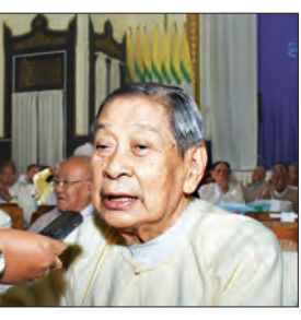
ဦးမောင်မောင် (ဥက္ကဋ္ဌ မြန်မာနိုင်ငံ စာကြည့်တိုက်များဖောင်ဒေးရှင်း)

ဒီကန်တော့ပွဲက နှစ်စဉ်ကျင်းပပါတယ်။ တက်ရောက်ရတဲ့အတွက် ဝမ်းသာပါတယ်။ စာရေးဆရာတွေ ပြန်လည်ဆုံတွေ့ရတယ်။ မျိုးဆက်သစ် လူငယ်တွေ စာဖတ် ရမှာပေါ့။ အခု စာပေပွဲတော်တွေလုပ်ပေးတာ သိပ်ဝမ်းသာတယ်။ စာဖတ်မှ သူတို့လေးတွေရဲ့ အနာဂတ်တွေကောင်းမယ်။ ထူးချွန်မယ့် လူအရင်းအမြစ်တွေဖြစ်မယ်။ စာပေက အင်မတန်မှ အရေးကြီးတယ်။ စာပေပွဲတော်တွေ၊ လူငယ်တွေ၊ လူရည်ချွန်တွေကို ပွဲတော်တွေ လုပ်ပေးခြင်းအားဖြင့် နိုင်ငံတော်ကြီး အစစအရာရာ တိုးတက်မှာပါ။ ပညာအလိမ္မာ စာပေရိုမူ စာပေ