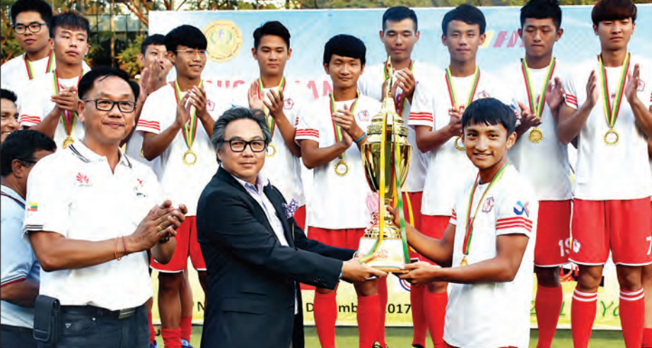
မြန်မာနိုင်ငံ ဟော်ကီအဖွဲ့ချုပ်ဥက္ကဋ္ဌ ဦးစောလှလှထော် ပထမဆုရ တရုတ်(တိုင်ပေ)အသင်းအား ဆုဇလားချီးမြှင့်စဉ်။

ရန်ကုန် ဒီဇင်ဘာ ၂ မြန်မာနိုင်ငံက အိမ်ရှင်အဖြစ် လက်ခံကျင်းပခဲ့သည့် 2017 Asian Challenge Cup ဟော်ကီပြိုင်ပွဲ နောက်ဆုံးနေ့ ဆုချီးမြှင့်ပွဲအခမ်းအနားကို ယနေ့ညနေပိုင်းက သိမ်ဖြူ ဟော်ကီ ကွင်း၌ ကျင်းပရာ တရုတ်(တိုင်ပေ)အသင်း ဗိုလ်ခွဲခဲ့ပြီး မြန်မာ အသင်း ဒုတိယနေရာရရှိခဲ့သည်။ နောက်ဆုံးနေ့တွင် တရုတ်(တိုင်ပေ) အသင်းက တရုန်အသင်းကို ငါးဂိုး-ဂိုးမရှိ အိမ်ရှင် မြန်မာအသင်းက ဟောင်ကောင် အသင်းကို ငါးဂိုး-ဂိုးမရှိဖြင့် အနိုင်ရခဲ့သည်။ စာမျက်နှာ ၁၃ ကော်လံ ၁ *