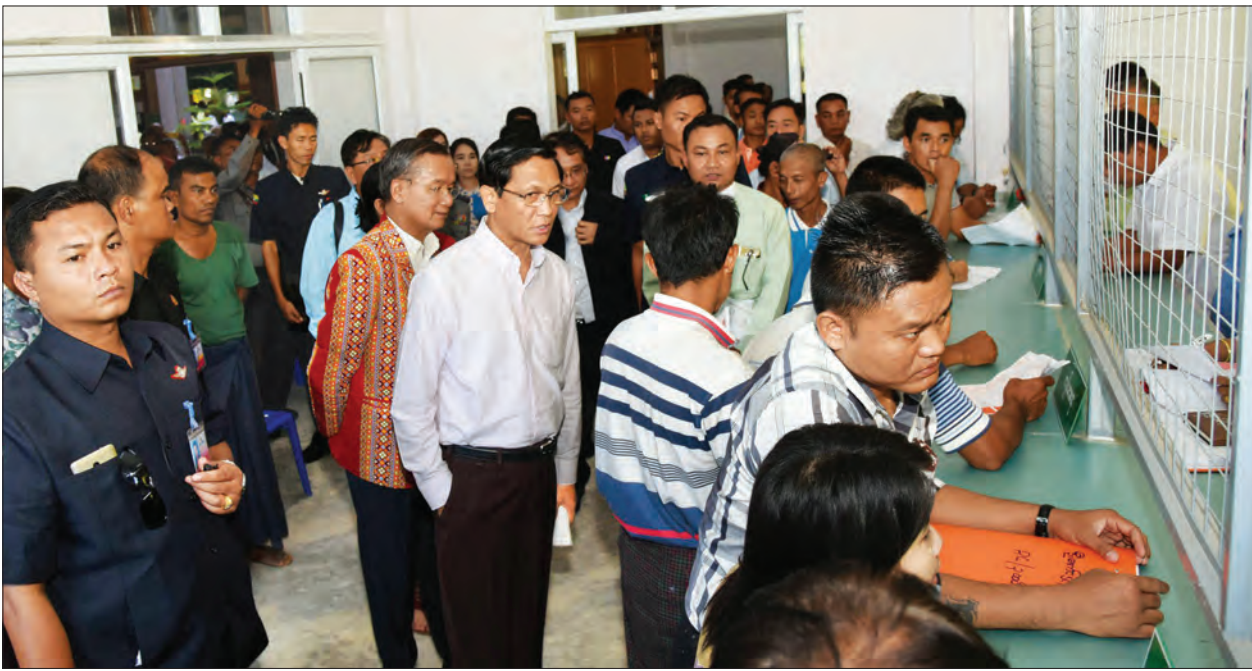
ဒုတိယသမ္မတ ဦးတင်နရီဝန်ထီးယူ ထားဝယ်မြို့၊ ပြည်သူ့ဝန်ဆောင်မှုရုံး၌ ပြည်သူ့ဝန်ဆောင်မှုလုပ်ငန်းများ လုပ်ဆောင်နေမှုကို ကြည့်ရှုအားပေးစဉ်။ သတင်းစဉ်

မွန်းလွဲပိုင်းတွင် ဒုတိယသမ္မတနှင့်အဖွဲ့အား ထားဝယ်ဟိုတယ်၌ တနင်္သာရီ