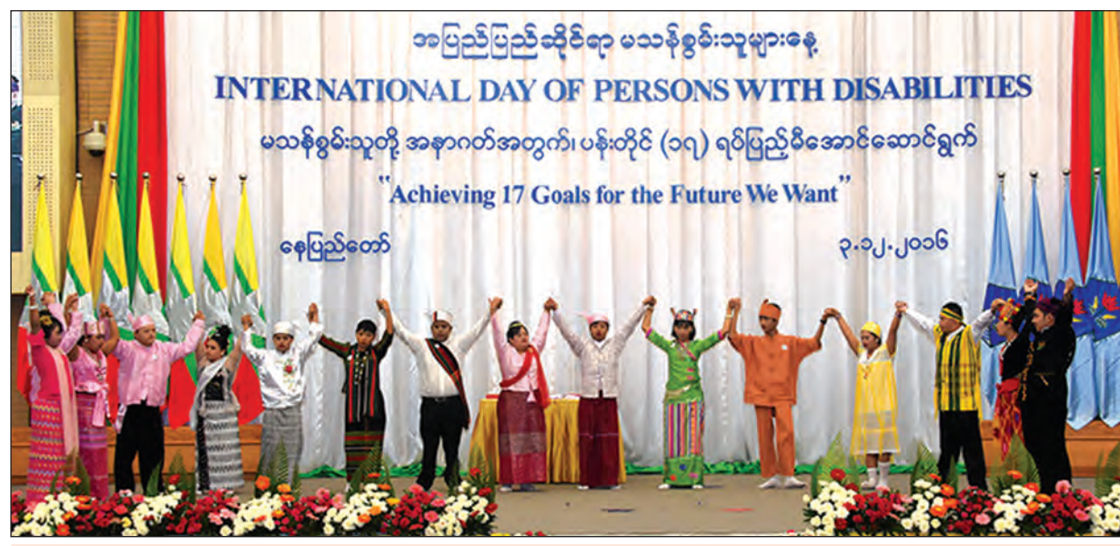
၂၀၁၆ ခုနှစ်က နေပြည်တော်၌ အပြည်ပြည်ဆိုင်ရာ မသန်စွမ်းသူများနေ့ အခမ်းအနားကျင်းပစဉ်။

“မသန်စွမ်းသူများအပေါ် ယခင်က ထားရှိသည့် မမှန်ကန် မသင့်လျော်သောခံယူချက်၊ အယူအဆ အတွေးအခေါ်ဟောင်း၊ စိတ်နေသဘောထား စသည်တို့ကို ဖယ်ရှားပြီး ရှုထောင့်သစ်၊ အမြင်သစ်နှင့် ရှုမြင်ပေးရန်လိုပါသည်။ မသန်စွမ်းသူများဆိုင်ရာ အရေးကိစ္စကို လူမှုရေးလုပ်ငန်း၊ ပရဟိတလုပ်ငန်းများနှင့်သာ သက်ဆိုင်သည်ဟု သတ်မှတ်ခြင်းမရှိဘဲ လူ့အသိုက်အဝန်း၊ လူ့အဖွဲ့အစည်းတစ်ရပ်လုံးနှင့် သက်ဆိုင်သည့် လူမှုဖွံ့ဖြိုးရေးကိစ္စတစ်ရပ်အဖြစ် လက်ခံဆောင်ရွက်ပေးကြရမည်ဖြစ်ပါသည်”