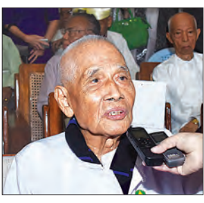
ဒေါက်တာ သန်းဦး

ဒီလိုပွဲမျိုးက လုပ်သင့်လုပ်ထိုက်တဲ့ ပွဲပါ။ တပ်မတော်ကာကွယ်ရေးဦးစီးချုပ်က တလေးတစားနဲ့ ကန်တော့တယ်။ လူကိုယ်တိုင်တော့ မလာနိုင်ဘူး။ သို့သော်လည်း လှူဖွယ်ပစ္စည်းတွေ ကန်တော့တဲ့အတွက် ကြည်နူးရတယ်။ ပြည်သူရယ်၊ တပ်မတော်ရယ်၊ စာပေရဲ့ အမိုးကြီးအောက်မှာ အတူတူရှိနေကြတယ်။ စာတတ်ပေတတ် ပညာရပ်တောထဲမှာ အတူတူရှိနေကြတယ်ဆိုတာ တကယ်ကို ကြည်နူးစရာပါ။