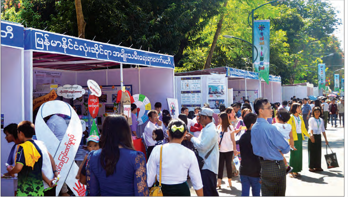
လူငယ်ဘက်စုံဖွံ့ဖြိုးရေးပွဲတော် ဒုတိယနေ့တွင် ပြခန်းများ၌ လေ့လာသူများဖြင့် စည်ကားလျက်ရှိသည်ကို တွေ့ရစဉ်။ သတင်းစဉ်