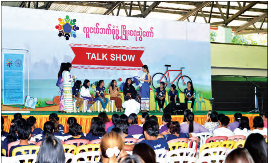
လူငယ်ဘက်စုံဖွံ့ဖြိုးရေးပွဲတော်၌ Talk Show အစီအစဉ် ကျင်းပစဉ်။ သတင်းစဉ်