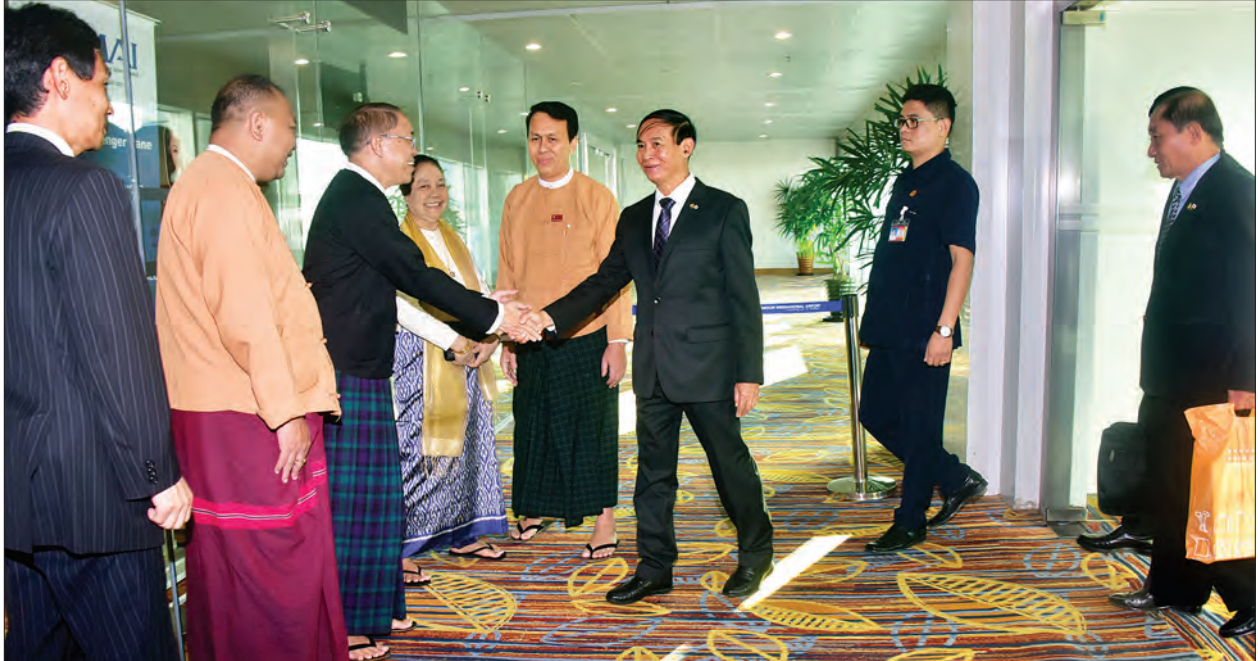
ပြည်သူ့လွှတ်တော်ဥက္ကဋ္ဌ ဦးဝင်းမြင့်အား ရန်ကုန်အပြည်ပြည်ဆိုင်ရာလေဆိပ်၌ ရန်ကုန်တိုင်းဒေသကြီးဝန်ကြီးချုပ် ဦးမြိုးမင်းသိန်း၊ တိုင်းဒေသကြီး လွှတ်တော်ဥက္ကဋ္ဌ ဦးတင်မောင်ထွန်းနှင့် တာဝန်ရှိသူများက ကြိုဆိုနှုတ်ဆက်ကြစဉ်။

နိုင်မြင့်နှင့် လွှတ်တော်ကိုယ်စားလှယ်များ၊ မြန်မာနိုင်ငံဆိုင်ရာ ဂျပန်သံရုံးမှ တာဝန်ရှိသူများနှင့် ပြည်သူ့လွှတ်တော်ရုံး တာဝန်ရှိသူများက ရန်ကုန်အပြည်ပြည်ဆိုင်ရာလေဆိပ်၌ ကြိုဆိုနှုတ်ဆက်ကြသည်။ အဆိုပါ ချစ်ကြည်ရေးကိုယ်စားလှယ်အဖွဲ့တွင် ပြည်သူ့လွှတ်တော် နိုင်ငံသားများ၏ မူလအခွင့်အရေးဆိုင်ရာ ကော်မတီအတွင်းရေးမှူး၊ ဦးဝင်းမြင့်အောင်၊ တိုင်းရင်းသားရေးရာနှင့် ပြည်တွင်းငြိမ်းချမ်းရေးဖော်ဆောင်မှု ကော်မတီအတွင်းရေးမှူး၊ ဦးအင်ထုံးခါးနော်ဆမ်၊ အစိုးရ၏ အာမခံချက်များ၊ ကတိများနှင့် တာဝန်ခံချက်များ စိစစ်ရေးကော်မတီအဖွဲ့ဝင် ဦးထွန်းထွန်း၊ နိုင်ငံသားများ၏ မူလအခွင့်အရေးဆိုင်ရာ ကော်မတီအဖွဲ့ဝင် ဦးထွန်းမြင့်၊ ပြည်သူ့လွှတ်တော်ကိုယ်စားလှယ် သူရဦးသက်ဆွေနှင့် ပြည်သူ့လွှတ်တော်ရုံးမှ တာဝန်ရှိသူများလည်း ပြန်လည်လိုက်ပါလာကြသည်။