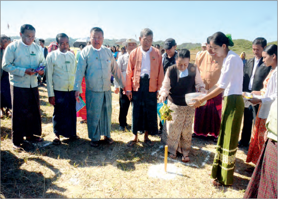
မင်းကြီးကျေးရွာသစ် တည်ဆောက်မည့်မြေနေရာတွင် တာဝန်ရှိသူများက ပန္နက်ရိုက်၍ အမွှေးနံ့သာရည်များ ပက်ဖျန်းပေးစဉ်။

မင်းကြီးကျေးရွာသစ်ကို ကရင်ပြည်နယ်နှင့် စစ်ကိုင်း တိုင်းဒေသကြီးတို့ ပူးပေါင်း၍ နေအိမ် ၇၄ လုံး တည်ဆောက် ပေးသွားမည်ဖြစ်ပြီး ရခိုင်တိုင်းရင်းသားများ နေထိုင်လျက်ရှိ သည့် မင်းကြီးကျေးရွာသည် မူလကတည်းက ရေတိုက်စားမှု