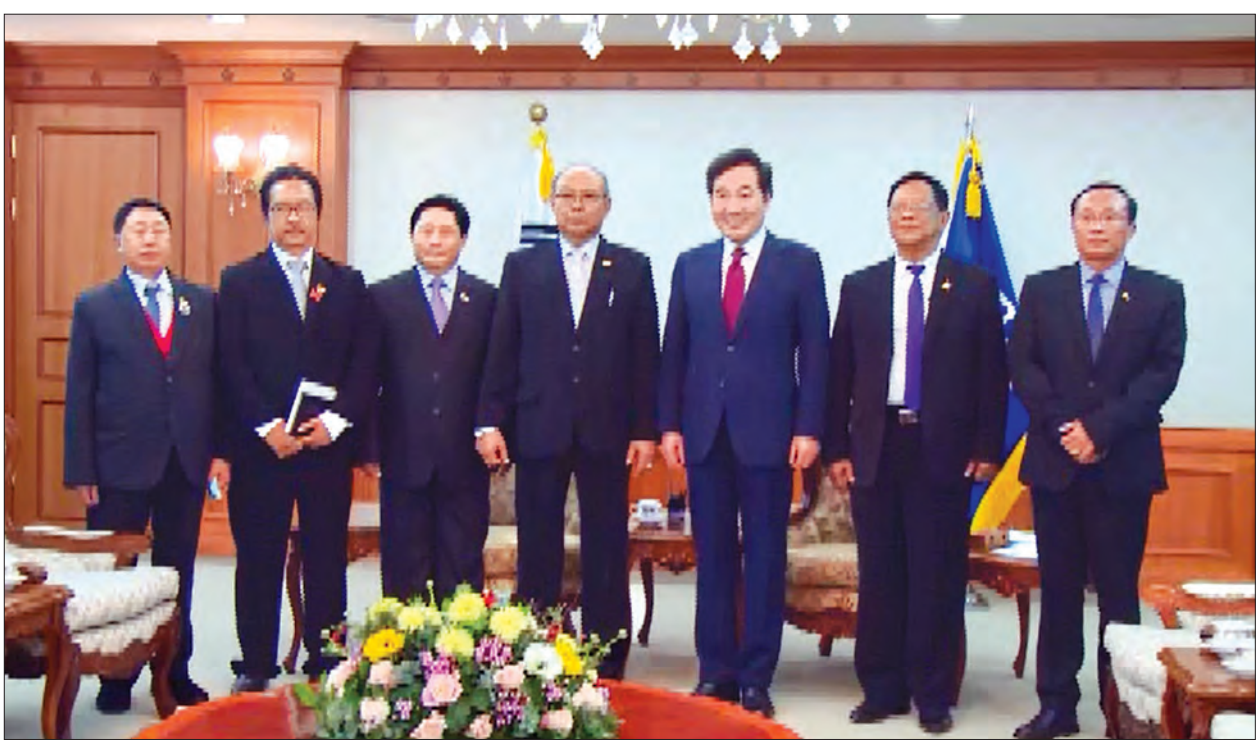
အမျိုးသားလွှတ်တော်ဥက္ကဋ္ဌ မန်းဝင်းခိုင်သန်းနှင့် ကိုရီးယားသမ္မတနိုင်ငံ ဝန်ကြီးချုပ် H.E.Mr. Lee Nak-yeon နှင့်အဖွဲ့တို့ မှတ်တမ်းတင်ဓာတ်ပုံရိုက်စဉ်။ သတင်းစဉ်

ဥက္ကဋ္ဌသည် ဒေသစံတော်ချိန် ညနေ ၃ နာရီတွင် ကိုရီးယားသမ္မတနိုင်ငံ ဝန်ကြီးချုပ် H.E.Mr. Lee Nak-yeon နှင့် ဝန်ကြီးချုပ်၏ ဧည့်ခန်းမဆောင်၌ တွေ့ဆုံပြီး မြန်မာ-ကိုရီးယားနှစ်နိုင်ငံ ချစ်ကြည်ရင်းနှီးမှုနှင့် ဆက်ဆံရေး တိုးတက်မြှင့်တင်ရေးအဖွဲ့ဝင် နှစ်နိုင်ငံ စီးပွားရေးကဏ္ဍ ပူးပေါင်းဆောင်ရွက်မှုများကို ပိုမိုမြှင့်တင်နိုင်ရန် ကောင်းမွန်သည့် အခြေအနေဖြစ်ပါကြောင်း၊ ကိုရီးယားသမ္မတနိုင်ငံမှ မြန်မာနိုင်ငံသို့ ကုမ္ပဏီပေါင်း ၂၀၀ ကျော်ခန့် လာရောက် လုပ်ကိုင်လျက်ရှိပြီး ကိုရီးယားသမ္မတ နိုင်ငံသည် မြန်မာနိုင်ငံတွင် ဆဋ္ဌမမြောက် ရင်းနှီးမြှုပ်နှံမှုအများဆုံးနိုင်ငံ ဖြစ်ပါကြောင်း၊ ရင်းနှီးမြှုပ်နှံသူများကို မြန်မာနိုင်ငံတွင် ပိုမိုရွှံ့လှောင်ရောင်းနှီးမြှုပ်နှံရန် ကြိုဆိုပါကြောင်း ရင်းနှီးပွင့်လင်းစွာ အမြင်ချင်းဖလှယ်ဆွေးနွေးခဲ့ကြသည်။ ဆက်လက်၍ အမျိုးသားလွှတ်တော်ဥက္ကဋ္ဌနှင့်အဖွဲ့သည် ကိုရီးယားရီးရာဒရပ်ပွဲ (Nanta) ကို ကြည့်ရှုအားပေးခဲ့သည်။ သတင်းစဉ်