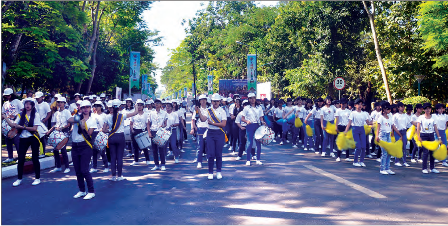
လူငယ်ဘက်စုံဖွံ့ဖြိုးရေးပွဲတော် ဖွင့်ပွဲအခမ်းအနားအတွက် ဘင်ခရာအဖွဲ့၊ ပန်းဖွားအကအဖွဲ့များ၏ တီးမှုတ်ဖျော်ဖြေ လေ့ကျင့်ပြင်ဆင်နေမှုကို တွေ့ရစဉ်။ သတင်းစဉ်