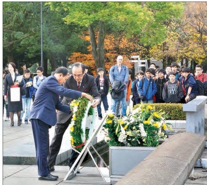
ပြည်သူ့လွှတ်တော်ဥက္ကဋ္ဌ ဦးဝင်းမြင့်နှင့် အဖွဲ့သည် ကျိုတိုမြို့ရှိ Kinkaku-ji Temple သို့ ရောက်ရှိလေ့လာခဲ့သည်။

ထို့ပြင် ယနေ့ ဒေသစံတော်ချိန် နံနက် ၉ နာရီတွင်