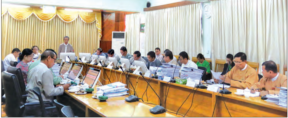
သော ကုမ္ပဏီများမှ တင်ပြလာသည့် အထွေထွေကိစ္စရပ်များနှင့် စပ်လျဉ်း၍ ဆွေးနွေးခဲ့ကြသည်။ မြန်မာနိုင်ငံ ရင်းနှီးမြှုပ်နှံမှုကော်မရှင်၏ (၁၆ / ၂၀၁၇) အစည်းအဝေးမှ အဆိုပြုလွှာတင်ပြလာသည့် ရင်းနှီးမြှုပ်နှံမှုလုပ်ငန်းများအား ခွင့်ပြုမိန့်လေးခုနှင့် အတည်ပြုမိန့်ငါးခု ခွင့်ပြုပေးရန် ဆုံးဖြတ်ခဲ့ကြောင်း သတင်းရရှိသည်။ သတင်းစဉ်

နေပြည်တော် နိုဝင်ဘာ ၃၀ မြန်မာနိုင်ငံ ရင်းနှီးမြှုပ်နှံမှုဥပဒေနှင့်အညီ တင်ပြလာသည့် အဆိုပြုချက်များအပေါ် ဆွေးနွေးစိစစ်မှုပြုရန်အတွက် မြန်မာနိုင်ငံ ရင်းနှီးမြှုပ်နှံမှုကော်မရှင်၏ (၁၆ / ၂၀၁၇) ကြိမ်မြောက် အစည်းအဝေးကို ယနေ့တွင် ရန်ကုန်မြို့၌ ကျင်းပသည်။ အစည်းအဝေးကို မြန်မာနိုင်ငံရင်းနှီးမြှုပ်နှံမှုကော်မရှင်ဥက္ကဋ္ဌ စီမံကိန်းနှင့် ဘဏ္ဍာရေးဝန်ကြီးဌာန ပြည်ထောင်စုဝန်ကြီး ဦးကျော်ဝင်းနှင့် မြန်မာနိုင်ငံ ရင်းနှီးမြှုပ်နှံမှုကော်မရှင် ဒုတိယဥက္ကဋ္ဌ၊ စီးပွားရေးနှင့် ကူးသန်းရောင်းဝယ်ရေးဝန်ကြီးဌာန ပြည်ထောင်စုဝန်ကြီး ဒေါက်တာ သန်းမြင့်၊ မြန်မာနိုင်ငံ ရင်းနှီးမြှုပ်နှံမှု ကော်မရှင်အဖွဲ့ဝင်များ တက်ရောက်ကြသည်။ အစည်းအဝေးတွင် ရင်းနှီးမြှုပ်နှံသူက တင်ပြလာသော ခွင့်ပြုမိန့်နှင့် အတည်ပြုမိန့် လျှောက်ထားလွှာများအား စိစစ်ခြင်း၊ မြန်မာနိုင်ငံရင်းနှီးမြှုပ်နှံမှု ကော်မရှင်ခွင့်ပြုမိန့်ရရှိပြီး