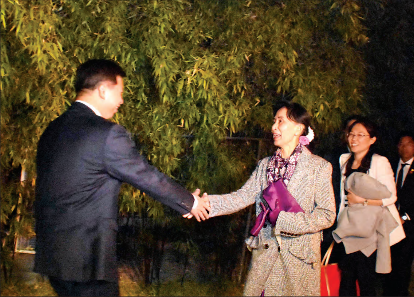
နိုင်ငံတော်၏ အတိုင်ပင်ခံပုဂ္ဂိုလ် ဒေါ်အောင်ဆန်းစုကြည် ညစာစားပွဲသို့ တက်ရောက်လာရာ တရုတ်ကွန်မြူနစ်ပါတီ နိုင်ငံတကာဆက်ဆံရေးဝန်ကြီး Mr. Song Tao က ကြိုဆိုနှုတ်ဆက်စဉ်။ သတင်းစဉ်

၁၃၇၉ ခုနှစ်၊ နတ်တော်လဆန်း ၁၃ ရက် ၂၀၁၇ ခုနှစ်၊ ဒီဇင်ဘာ ၁ ရက်၊ သောကြာနေ့ အတွဲ (၅၇)၊ အမှတ် (၀၆၂)