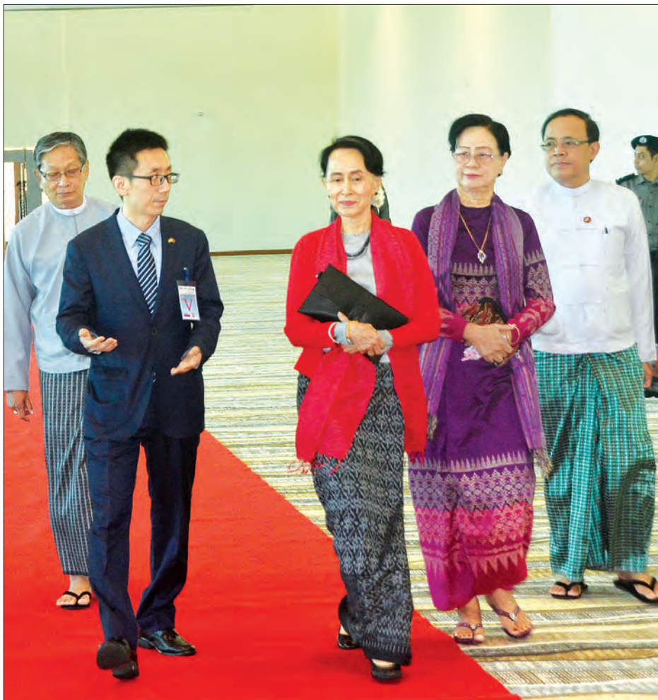
နိုင်ငံတော်၏ အတိုင်ပင်ခံပုဂ္ဂိုလ် ဒေါ်အောင်ဆန်းစုကြည်အား နေပြည်တော်အပြည်ပြည်ဆိုင်ရာလေဆိပ်၌ တာဝန်ရှိသူများက ပို့ဆောင်နှုတ်ဆက်စဉ်။