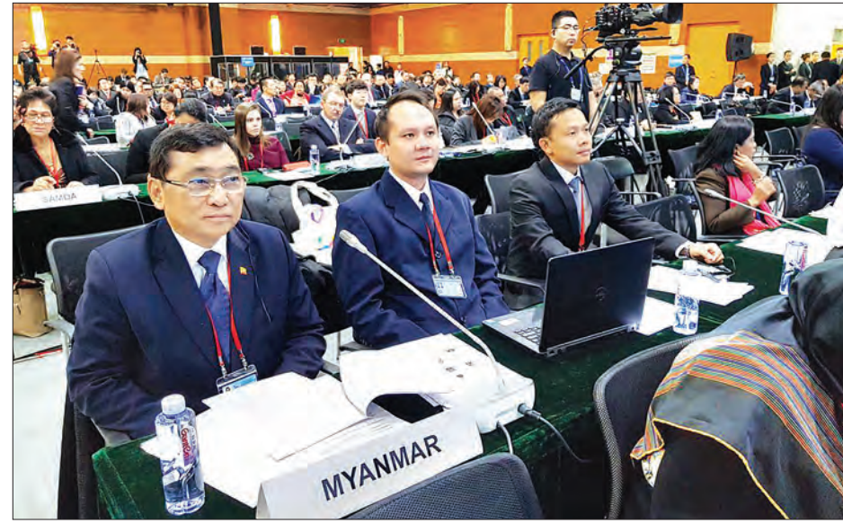
သုံးသပ်ရန်၊ ရှေ့ဆက်ဆောင်ရွက်မည့် မူဝါဒလမ်းညွှန်ချက်တို့ကို ဆွေးနွေးရန်၊ ကျန်ရှိသော ဆယ်စုနှစ်ဝက်အတွက် အကောင်အထည်ဖော်ခြင်းတို့ကို မြှင့်တင်ရန်နှင့် ကြေညာချက်တစ်ရပ် ဆွေးနွေးချမှတ်ရန် စသည့် ရည်ရွယ်ချက်တို့ဖြင့်

အစည်းအဝေးအား အာရှနှင့် ပစိဖိတ်ဒေသအတွင်းရှိ မသန်စွမ်းသူများဆိုင်ရာ ဆယ်စုနှစ်(၂၀၁၃-၂၀၂၂)နှင့် အင်ဒို-မဟာဗျူဟာကို ဆောင်ရွက်ရာတွင် ကြုံတွေ့ရမည့် ကွာဟချက်နှင့် စိန်ခေါ်မှုများအပေါ်အစည်းအဝေး တိုးတက်ပြောင်းလဲမှုအခြေအနေအား ပြန်လည်