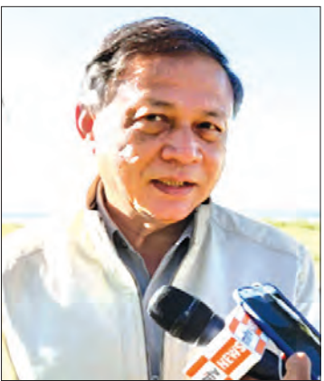
ဦးသိန်းဇော် (ခေတ္တ-ညွှန်ကြားရေးမှူးချုပ်)

မြန်မာနိုင်ငံမှာ နှစ်ပေါင်းများစွာ နေထိုင်ခဲ့တဲ့ အစ္စလာမ်ဘာသာဝင်တွေလည်း လူ့အခွင့်အရေးမဆုံးရှုံးအောင် ၁၉၈၂ ခုနှစ် နိုင်ငံသား ဥပဒေနဲ့အညီပဲ သူတို့ကိုစောင့်ရှောက်ပြီး လူ့အခွင့်အရေးတွေ အပြည့်အဝရရှိအောင် ကူညီဆောင်ရွက်ပေးမှာ ဖြစ်ပါတယ်။ အဓိကအချက်က မြန်မာနိုင်ငံ ထဲမှာ အေးအေးချမ်းချမ်းနဲ့ ဥပဒေနဲ့အညီ နေထိုင်တဲ့ လူတွေအနေနဲ့ ဘယ်လူမျိုးမဆို အေးအေးချမ်းချမ်းနေထိုင်နိုင်ပြီးတော့၊ ဥပဒေနဲ့အညီမနေဘူးဆိုရင် တည်ဆဲဥပဒေနဲ့အညီ ထိရောက်စွာ အရေးယူမှာ ဖြစ်ပါတယ်။