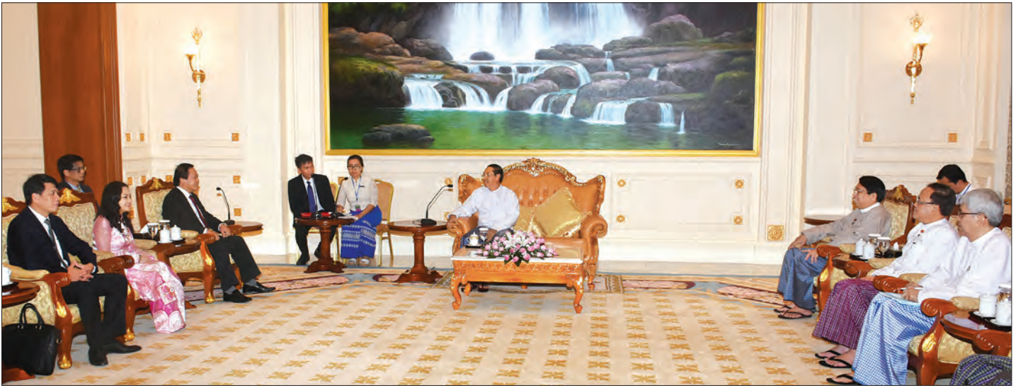
ဒုတိယသမ္မတ ဦးမြင့်ဆွေ ဗီယက်နမ်ဆိုရှယ်လစ်သမ္မတနိုင်ငံ ပြန်ကြားရေးနှင့်ဆက်သွယ်ရေးဝန်ကြီးဌာနဝန်ကြီး H.E. Mr. Truong Minh Tuan ဦးဆောင်သော ကိုယ်စားလှယ်အဖွဲ့အား လက်ခံတွေ့ဆုံ