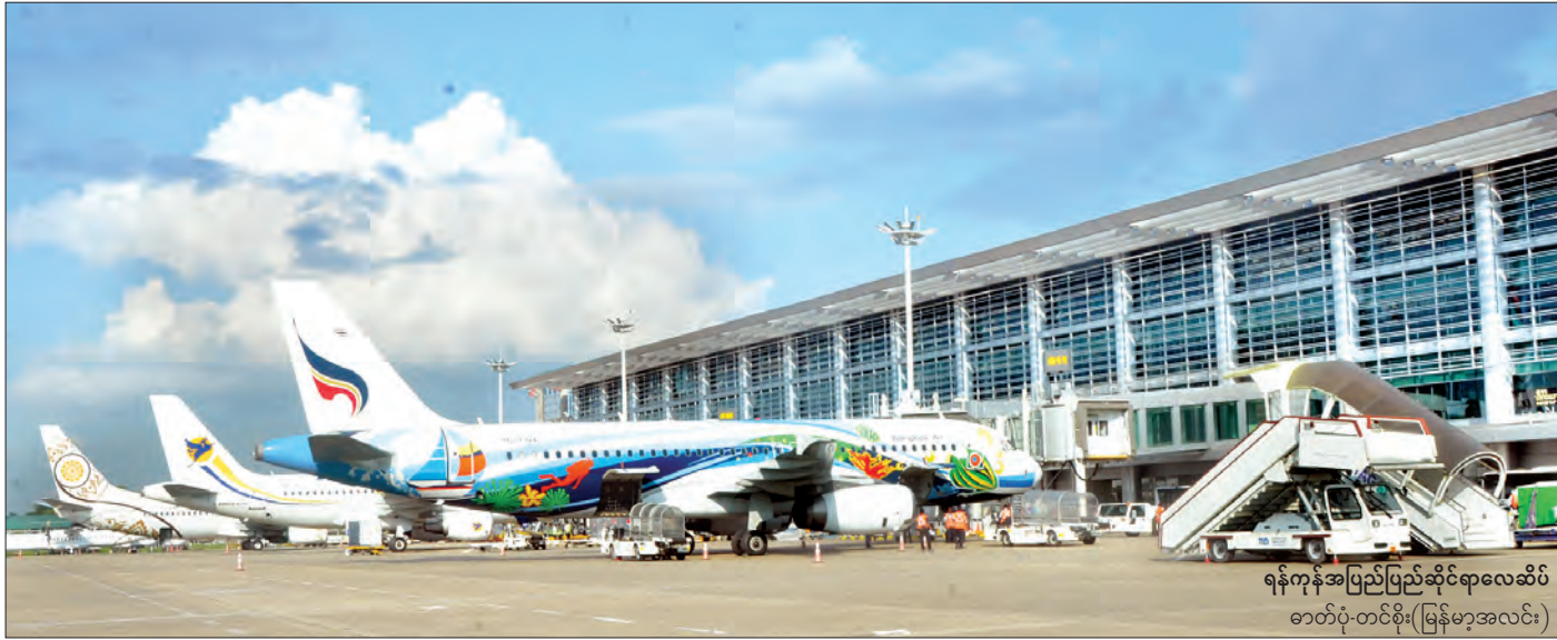
ရန်ကုန်အပြည်ပြည်ဆိုင်ရာလေဆိပ်