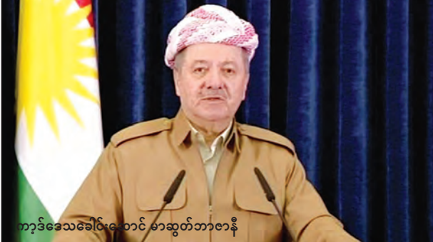
ကာဒီဒေသခေါင်းဆောင် မာဆူတ်ဘာဇာနီ

၎င်းအနေဖြင့် ကာဒီဒေသခေါင်းဆောင်ရာထူးကို လာမည့် နိုဝင်ဘာ ၁ ရက်တွင် စွန့်လွှတ်မည်ဖြစ်ကြောင်း ဘာဇာနီက ယမန်နေ့က ပြောခဲ့သည်။ ၎င်းရာထူးမှစွန့်လွှတ်မည်ကို အတည်ပြုနိုင်ရေးအတွက် လက်နက်ကိုင်ဆန္ဒပြသူများသည် ပီလီမန်ကို ဝင်ရောက်သောင်းကျန်းခဲ့ကြောင်း သိရသည်။ ဂိုရန်နှင့် ပီယူကေနှစ်ခုစလုံးက ကာဒီကိုယ်ပိုင်ဆုံးဖြတ်ချက်ကို ထောက်ခံခဲ့သော်လည်း ဂိုရန်က ပြည်လုံးကျွတ်ဆန္ဒခံယူပွဲကို ငြင်းဆိုခဲ့ကြောင်း သိရသည်။ (ရိုက်တာ)