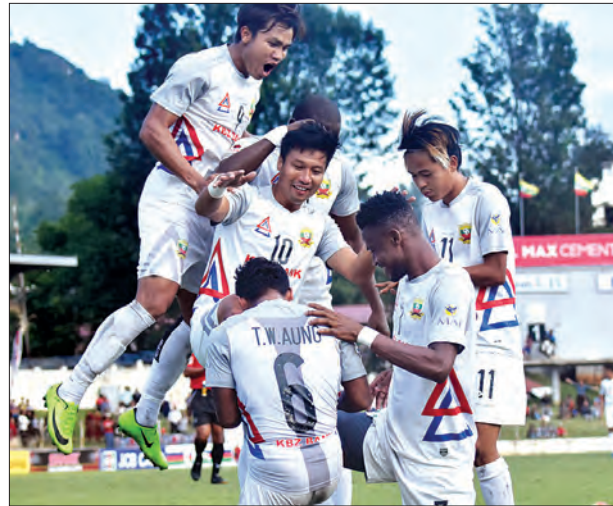
အမှတ်ပေးနှင့် ရှမ်း/ထွက် ချန်ပီယံ ရှမ်းယူနိုက်တက် အသင်း