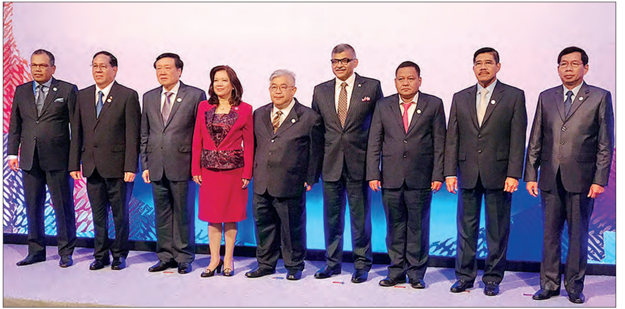
ပြည်ထောင်စုတရားသူကြီးချုပ် ဦးထွန်းထွန်းဦးနှင့် အာဆီယံတရားသူကြီးချုပ်များ စုပေါင်းမှတ်တမ်းတင်ဓာတ်ပုံရိုက်စဉ် (သတင်းစဉ်)

အာဆီယံတရားသူကြီးချုပ်များကောင်စီသည် အာဆီယံ၏အဖွဲ့အစည်းတစ်ရပ် ဖြစ်သည်နှင့်အညီ အမြဲတမ်းအတွင်းရေးမှူးချုပ်ရုံး (Standing CACJ Secretariat) ဖွင့်လှစ်ရန်နှင့် အာဆီယံ တရားသူကြီးချုပ်များကောင်စီ၏ ဖွဲ့စည်းပုံစည်းမျဉ်း (Charter of ASEAN Chief Justices Council) အပြီးသတ်ရေးဆွဲရေးအပါအဝင် လက်တလောဆောင်ရွက်ရန်ကိစ္စရပ်များကိုလည်း ဆွေးနွေး ဆုံးဖြတ်ခဲ့ကြသည်။ အစည်းအဝေးသို့ တက်ရောက်သည့် အာဆီယံတရားသူကြီးချုပ်များက အဆိုပါဆွေးနွေးဆုံးဖြတ်ချက်များကို မနီလာသဘောတူညီချက် (Manila Declaration) တွင်လည်းကောင်း၊ အာဆီယံတရားစီရင်ရေးအဖွဲ့အစည်းများ၏ သတင်းအချက်အလက်ဆိုင်ရာ Internet Portal အကောင်အထည်ဖော်ရေးအတွက်