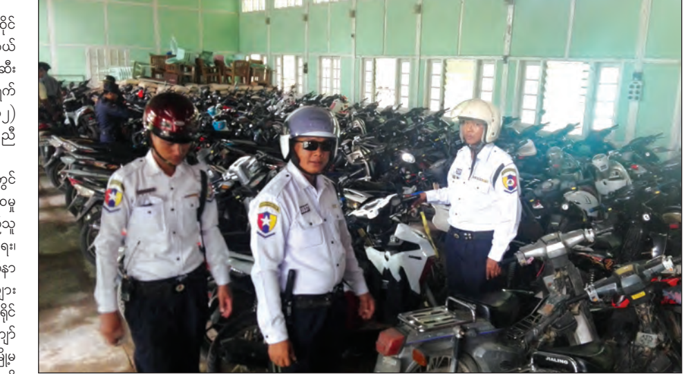
ဖမ်းဆီးထားသော ဆိုင်ကယ်များကို ရန်ကြီးအောင်ခန်းမအတွင်း ထိန်းသိမ်းထားစဉ်