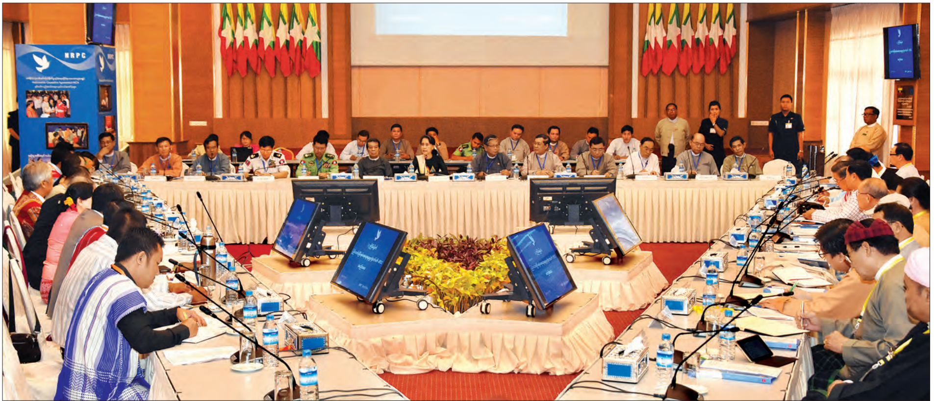
ပြည်ထောင်စုငြိမ်းချမ်းရေးဆွေးနွေးမှု ပူးတွဲကော်မတီ (UPDJC) ဥက္ကဋ္ဌ နိုင်ငံတော်၏အတိုင်ပင်ခံပုဂ္ဂိုလ် ဒေါ်အောင်ဆန်းစုကြည် (၁၂)ကြိမ်မြောက် ပြည်ထောင်စုငြိမ်းချမ်းရေးဆွေးနွေးမှုပူးတွဲကော်မတီ (UPDJC) အစည်းအဝေးတွင် အမှာစကား ပြောကြားစဉ် (သတင်းစဉ်)