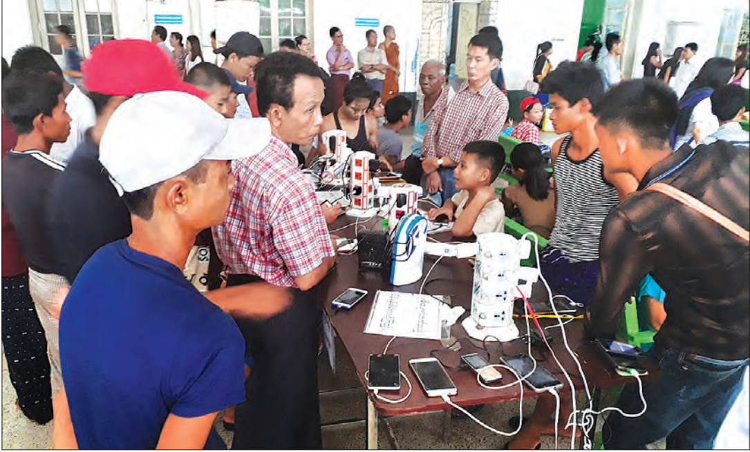
ရန်ကုန်ဘူတာကြီးအတွင်း၌ ခရီးသွားပြည်သူများ ဖုန်းအားသွင်းနေစဉ်