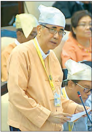
ဒုတိယဝန်ကြီး ဦးကျော်မျိုး

၂၀၁၆-၂၀၁၇ ဘဏ္ဍာနှစ်တွင် စုစုပေါင်း ငွေကျပ် ၁၂၂၉ ဒသမ ၆၁ သန်းကို လှူဒါန်းခဲ့ပါကြောင်း၊ ၂၀၁၇-၂၀၁၈ ဘဏ္ဍာနှစ် အောက်တိုဘာလအထိ စုစုပေါင်းငွေကျပ် ၂၁၂ ဒသမ ၉ သန်း လှူဒါန်းခဲ့ပါကြောင်း၊ ယခုအချိန်ကာလ အထိ ငွေကျပ် ၂၀၄၆ ဒသမ ၀၁ သန်း လှူဒါန်းခဲ့ပြီးဖြစ်ပါကြောင်း၊ ၂၀၁၇-၂၀၁၈ ဘဏ္ဍာနှစ် တစ်နှစ်လုံးအတွက် စုစုပေါင်း ငွေကျပ် ၁ ဒသမ ၃ ဘီလီယံကျော် လှူဒါန်းသွားရန် လျာထားပါကြောင်း၊ မြန်မာ့ဆက်သွယ်ရေးလုပ်ငန်းအနေဖြင့် ရပ်ရွာဖွံ့ဖြိုးတိုးတက်ရေးလုပ်ငန်းများအတွက် နေရာဒေသနှင့် အချိန်အခါအလိုက် ဆက်လက်ထောက်ပံ့ကူညီပေးသွားမည် ဖြစ်ကြောင်း ရှင်းလင်းဖြေကြားသည်။