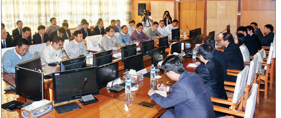
အကြား အပြန်အလှန် နားလည်မှုစာချွန်လွှာ MoU လက်မှတ်ရေးထိုးရေးကိစ္စရပ်များ၊ နှစ်နိုင်ငံ သတင်းအချက်အလက် ဖလှယ်ရေးဆိုင်ရာကိစ္စရပ်များ၊ မြန်မာနိုင်ငံတွင် ဝီယက်နမ် ရုပ်သံလွှင့်ချန်နယ်နှင့် သတင်းဌာနရုံးခွဲများ ဖွင့်လှစ်နိုင်ရေးကိစ္စရပ်များကို ရင်းနှီးပွင့်လင်းစွာ ဆွေးနွေးခဲ့ကြသည်။ (သတင်းစဉ်)

နေပြည်တော် အောက်တိုဘာ ၃၀ ပြန်ကြားရေးဝန်ကြီးဌာန ပြည်ထောင်စုဝန်ကြီး ဒေါက်တာစောမြင့်သည် ဝီယက်နမ်နိုင်ငံ ပြန်ကြားရေးနှင့် ဆက်သွယ်ရေးဝန်ကြီးဌာန ဝန်ကြီး H.E. Mr. Truong Minh Tuan နှင့်အဖွဲ့အား ယနေ့နံနက် ၉ နာရီတွင် ပြန်ကြားရေးဝန်ကြီးဌာန ဧည့်ခန်းမ၌ တွေ့ဆုံသည်။ (ယာဝု)