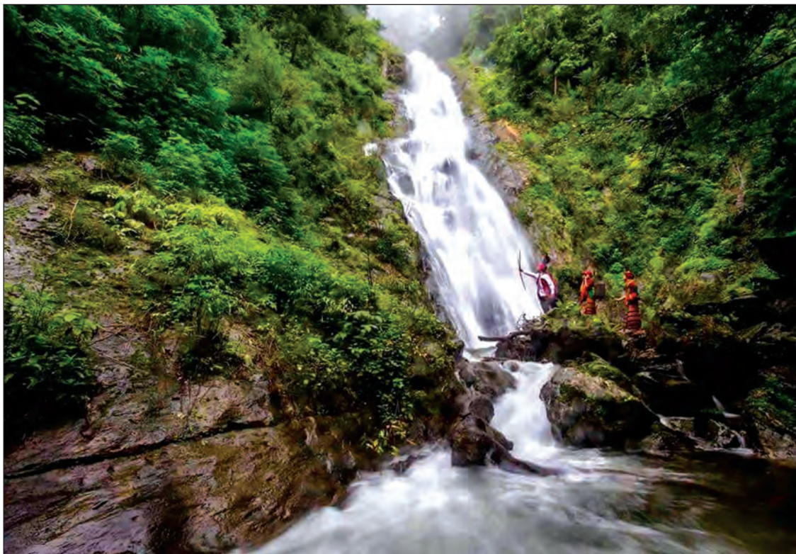
အကောင်းဆုံးနေရာတွေထဲမှာ တစ်ခုအပါအဝင် ဖြစ်ပါတယ်။ ရန်ကုန်ကနေ ပခုက္ကူ မင်းတပ်-မတူပီလမ်းအတိုင်း တိုက်ရိုက်ကားတွေ အများကြီးရှိပါတယ်။ မတူပီမြို့ကနေ ၁၀ မိုင်လောက် ပဲဝေးပြီး ကား၊ ဆိုင်ကယ်နဲ့သွားရင် မိနစ် ၃၀ လောက်ပဲ ကြာပါတယ်။ ပြီးမှ ခြေကျင်နဲ့ မိနစ် ၂၀ သာသာ သွားရပါတယ်” ဟု ဘုံတလာရေတံခွန်သို့ လေ့လာရေးခရီး သွားရောက်ခဲ့သူတစ်ဦးက ပြောသည်။ ဘုံတလာရေတံခွန်သည် မတူပီမြို့တောင်ဘက် ၁၀ မိုင်ခန့်အကွာ ဖခင်ကျေးရွာအုပ်စု ထိစောင်ကျေးရွာတောင်ဘက်တွင်ရှိပြီး ပင်လယ်ရေမျက်နှာပြင်အထက် အမြင့်ပေ ၄၂၀၀ ကျော်တွင် တည်ရှိနေသော ရေတံခွန်ဖြစ်သည်။ ရေတံခွန်သို့ ရောက်ရန် ခြေကျင်ခရီး မိနစ် ၂၀ ခန့် လျှောက်ရ

မတူပီ အောက်တိုဘာ ၃၀ ချင်းပြည်နယ်အတွင်းမှ ဒေသများ ပိုမိုဖွံ့ဖြိုးတိုးတက်လာစေရန်၊ လမ်းပန်းဆက်သွယ်ရေးကဏ္ဍ ပိုမိုအဆင်ပြေကောင်းမွန်ပြီး ဒေသတွင်းခရီးသွားနှုန်း မြှင့်တင်လာစေရန်၊ လာရောက်လည်ပတ်သည့် ပြည်တွင်းပြည်ပ ခရီးသည်များအလွယ်တကူ လည်ပတ်နိုင်စေရန်နှင့် လက်ရှိဖော်ဆောင်နေသော သဘာဝအခြေပြု ခရီးသွားလုပ်ငန်းများကို အထောက်အကူပြုနိုင်ရန် ရည်ရွယ်၍ မတူပီမြို့နယ်ရှိ ဘုံတလာရေတံခွန်သို့ ခရီးသွားများ ဝင်ရောက်လည်ပတ်မှု အဆင်ပြေစေရန် လမ်းဖောက်လုပ်မှုနှင့် အဆင့်မြှင့်တင်မှုများ ပြုလုပ်မည်ဖြစ်ကြောင်း ချင်းပြည်နယ်လွှတ်တော်ရုံးမှ သိရသည်။ လက်ရှိတွင် ဘုံတလာရေတံခွန်သို့ သွားရာလမ်းတွင် သံတံဆေးတစ်စင်းနှင့် ကြိုးတံတားတစ်စင်းတို့ကို ဖြတ်သွားရကြောင်း၊ ရေတံခွန်သို့ သွားရာလမ်းကို သွားလာမှုပိုမိုအဆင်ပြေစေရန် လမ်းဖောက်လုပ်မှုနှင့် အဆင့်မြှင့်တင်မှုများ ပြုလုပ်မည်ဖြစ်ကြောင်း၊ ရေတံခွန်သို့ လည်ပတ်ရာတွင်လည်း ပထမအဆင့်၊ ဒုတိယအဆင့်နှင့် တတိယအဆင့်များကိုသာ လည်ပတ်နိုင်သောကြောင့် ခရီးသွားလုပ်ငန်းအတွက် အပေါ်ဆုံးအထိ တက်ရောက်လည်ပတ်နိုင်ရန် လမ်းဖောက်လုပ်သွားမည်ဖြစ်ကြောင်း သိရသည်။ “မြန်မာနိုင်ငံမှာ အတော်လေးထူးဆန်းပြီး အဆင့် ခန့်ဆင့်ရုံတို ဘုံတလာရေတံခွန်ဟာ မရောက်ဖူးတဲ့သူတွေ သွားသင့်သွားထိုက်တဲ့ ရေတံခွန်လေးပါ။ ချင်းပြည်နယ်ရဲ့ လည်ချင်စရာ