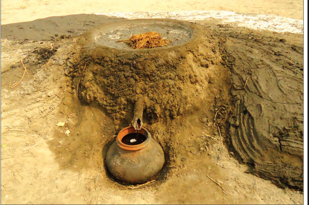
ဟန်လင်းဒေသ ဆားချက်လုပ်ငန်းတစ်ခုတွင် မြေပုံကားတည်၍ ဆားချက်နေစဉ်

ပင်လယ်ပိုင်းဒေသများတွင်မူ ပင်လယ်ရေကို နေလှန်းခြင်းဖြင့် ရေများခြောက်သွားချိန်တွင် နေလှန်းဆားကြမ်းခဲများကို ရရှိသည်။ ကုန်းတွင်းဆားလုပ်ငန်းတွင်မူ ဆားခင်းတွင် ရေခန်းခြောက်သွားသောအခါ၌ အငန်ဓာတ်ပါဝင်သော ဆားမြေများ ကျန်ရစ်နေခဲ့သည်။ ယင်းဆားငန်မြေများကို ထွန်ခြစ်များဖြင့်ခြစ်ယူကာ စုပုံထားပြီး ဆားမြေကို ပြန်လည်ထွန်ယက်ကာ ဒုတိယအကြိမ် ဆားရည်များသွင်းပြီး နေပူတွင်