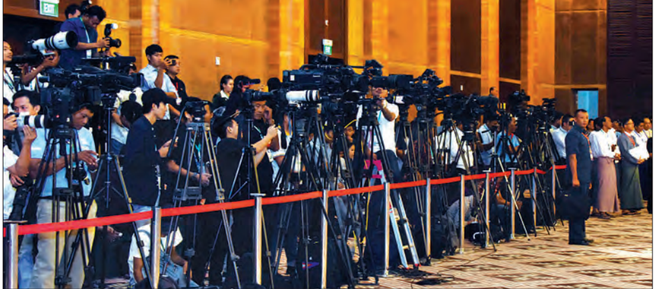
အောက်တိုဘာ ၁၅ ရက်က တစ်နိုင်ငံလုံး ပစ်ခတ်တိုက်ခိုက်မှုရပ်စဲရေး သဘောတူ စာချုပ် (Nationwide Ceasefire Agreement) လက်မှတ်ရေးထိုးခြင်း (၂)နှစ်မြောက် နှစ်ပတ်လည်နေ့ အထိမ်းအမှတ် အခမ်းအနားတွင် မီဒီယာများ သတင်းရယူနေကြစဉ် (သတင်းစဉ်)