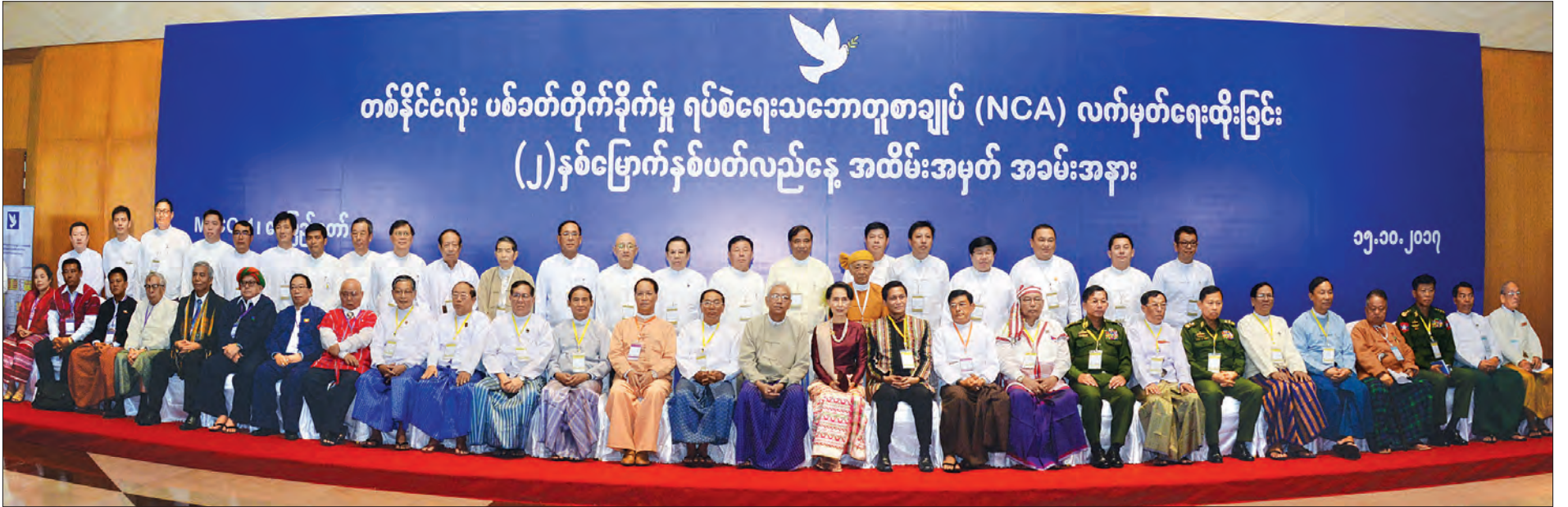
နိုင်ငံတော်သမ္မတ ဦးထင်ကျော်၊ နိုင်ငံတော်၏အတိုင်ပင်ခံပုဂ္ဂိုလ် ဒေါ်အောင်ဆန်းစုကြည်နှင့်အဖွဲ့ အခမ်းအနားသို့တက်ရောက်လာသော စီးပွားရေးလုပ်ငန်းရှင်များနှင့်အတူ စုပေါင်းမှတ်တမ်းတင်ဓာတ်ပုံရိုက်စဉ် (သတင်း-ရှေ့မှ) (သတင်း-စဉ်)