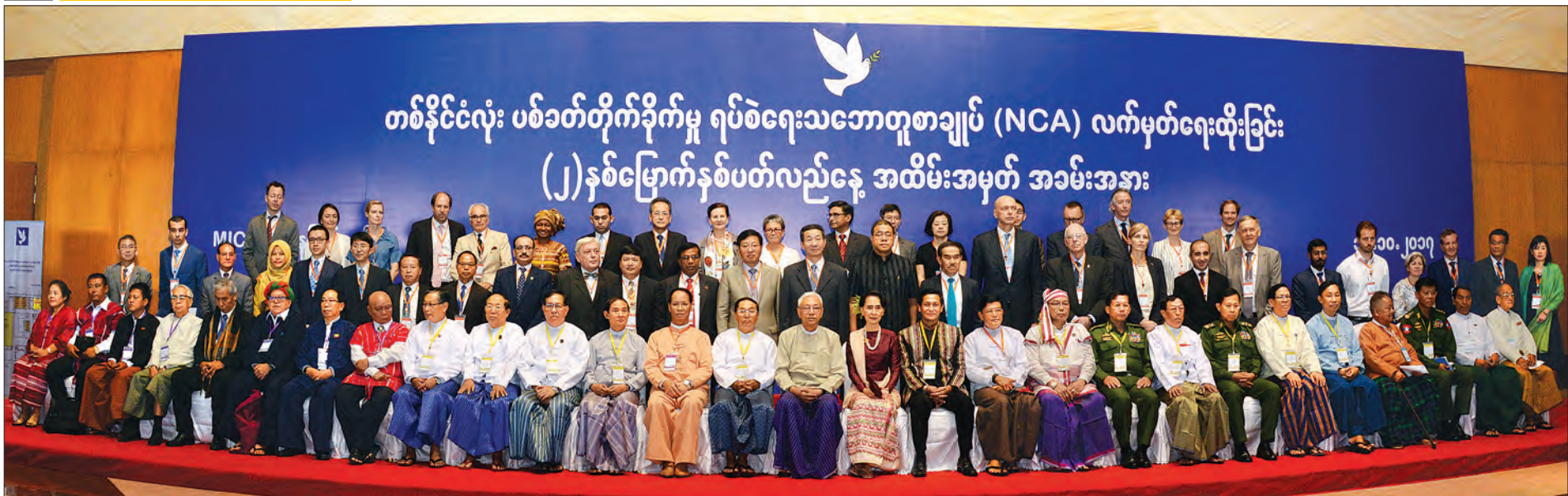
နိုင်ငံတော်သမ္မတ ဦးထင်ကျော်၊ နိုင်ငံတော်၏အတိုင်ပင်ခံပုဂ္ဂိုလ် ဒေါ်အောင်ဆန်းစုကြည်နှင့်အဖွဲ့အခမ်းအနားတက်ရောက်လာကြသည့် သံတမန်များနှင့်အတူ စုပေါင်းမှတ်တမ်းတင်ဓာတ်ပုံရိုက်စဉ် (သတင်းစဉ်)