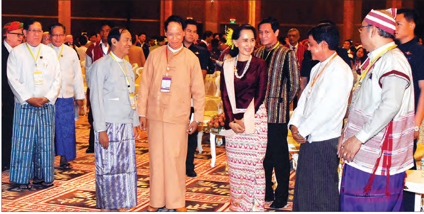
နိုင်ငံတော်၏ အတိုင်ပင်ခံပုဂ္ဂိုလ် ဒေါ်အောင်ဆန်းစုကြည် အခမ်းအနားတက်ရောက်လာသူများအား ရင်းရင်းနှီးနှီး နှုတ်ဆက်စဉ် (သတင်းစဉ်)