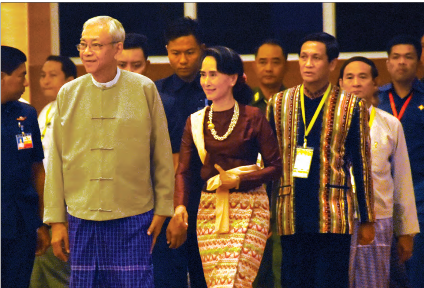
နိုင်ငံတော်သမ္မတ ဦးထင်ကျော်၊ နိုင်ငံတော်၏ အတိုင်ပင်ခံပုဂ္ဂိုလ် ဒေါ်အောင်ဆန်းစုကြည်၊ ဒုတိယသမ္မတ ဦးဟင်နရီဗန်ထီးယူနှင့် ပြည်သူ့လွှတ်တော်ဥက္ကဋ္ဌ ဦးဝင်းမြင့်တို့ ခန်းမအတွင်းမှ ပြန်လည်ထွက်ခွာလာစဉ် (သတင်းစဉ်)

အခမ်းအနားတွင် အမျိုးသားပြန်လည်သင့်မြတ်ရေးနှင့်