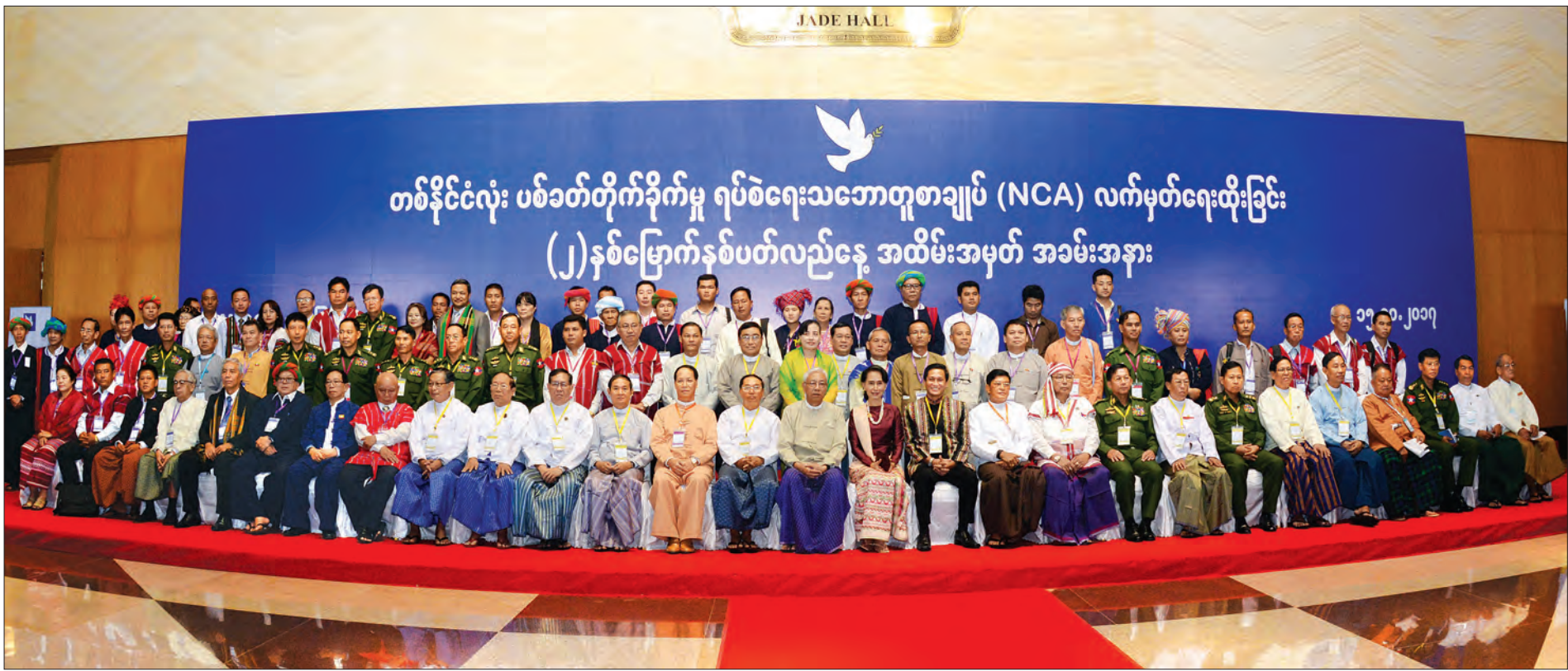
နိုင်ငံတော်သမ္မတ ဦးထင်ကျော်၊ နိုင်ငံတော်၏အတိုင်ပင်ခံပုဂ္ဂိုလ် ဒေါ်အောင်ဆန်းစုကြည်နှင့်အဖွဲ့ တိုင်းရင်းသားလက်နက်ကိုင်အဖွဲ့အစည်းများ၊ JMC နှင့် UPDJC ကိုယ်စားလှယ်များနှင့်အတူ စုပေါင်းမှတ်တမ်းတင်ဓာတ်ပုံရိုက်စဉ် (သတင်းစဉ်)