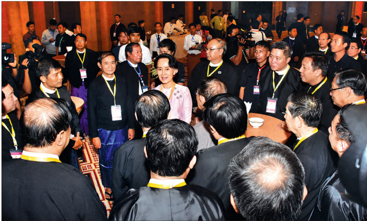
နိုင်ငံတော်၏ အတိုင်ပင်ခံပုဂ္ဂိုလ် ဒေါ်အောင်ဆန်းစုကြည် ညစာစားပွဲအခမ်းအနားသို့ တက်ရောက်လာကြသူများအား ရင်းရင်းနှီးနှီးနှုတ်ဆက်စဉ် (သတင်း-စဉ်)

နေပြည်တော် အောက်တိုဘာ ၁၅ အမျိုးသားပြန်လည်သင့်မြတ်ရေးနှင့်ငြိမ်းချမ်းရေး ဗဟိုဌာန ဥက္ကဋ္ဌ နိုင်ငံတော်၏ အတိုင်ပင်ခံပုဂ္ဂိုလ် ဒေါ်အောင်ဆန်းစုကြည်က တည်ခင်းဧည့်ခံသည့် ရခိုင်ပြည်နယ်အတွင်း လူသားချင်း စာနာမှုအကူအညီ အထောက်အပံ့ပေးရေး၊ ပြန်လည်နေရာချထားရေး ဖွံ့ဖြိုးရေးစီမံကိန်း (UEHRD)၏ ညစာစားပွဲ အခမ်းအနားကို ယနေ့ည ၇ နာရီတွင် နေပြည်တော်ရှိ မြန်မာအပြည်ပြည်ဆိုင်ရာ ကွန်ဗင်းရှင်းဗဟိုဌာန (၁)တွင် ကျင်းပသည်။ ရှေးဦးစွာ နိုင်ငံတော်၏အတိုင်ပင်ခံပုဂ္ဂိုလ်က အခမ်းအနားသို့ တက်ရောက်လာကြသူများကို ရင်းရင်းနှီးနှီး လိုက်လံနှုတ်ဆက်ပြီး ညစာအတူတကွ သုံးဆောင်ကြသည်။ ညစာစားပွဲ အခမ်းအနားသို့ ပြည်သူ့လွှတ်တော်ဥက္ကဋ္ဌ ဦးဝင်းမြင့်၊ အမျိုးသားလွှတ်တော်ဥက္ကဋ္ဌ မန်းဝင်းနိုင်သန်း၊ ပြည်ထောင်စုလွှတ်တော်ဥပဒေရေးရာနှင့် အထူးကိစ္စရပ်များလေ့လာဆန်းစစ် သုံးသပ်ရေးကော်မရှင်ဥက္ကဋ္ဌ သူရဦးရွှေမန်း၊ အမျိုးသားလွှတ်တော် ဒုတိယဥက္ကဋ္ဌ ဦးအေးသာအောင်၊ ပြည်ထောင်စုဝန်ကြီးများ၊ တိုင်းဒေသကြီးနှင့်ပြည်နယ် ဝန်ကြီးချုပ်များ၊ နေပြည်တော်ကောင်စီဥက္ကဋ္ဌ၊ တစ်နိုင်ငံလုံး ပစ်ခတ်တိုက်ခိုက်မှုရပ်စဲရေးသဘောတူစာချုပ် (NCA) လက်မှတ်ရေးထိုးထားသော တိုင်းရင်းသားလက်နက်ကိုင် အဖွဲ့အစည်းများမှ ခေါင်းဆောင်များနှင့် စီးပွားရေးလုပ်ငန်းရှင်ကြီးများ တက်ရောက်ကြသည်။ (သတင်း-စဉ်)