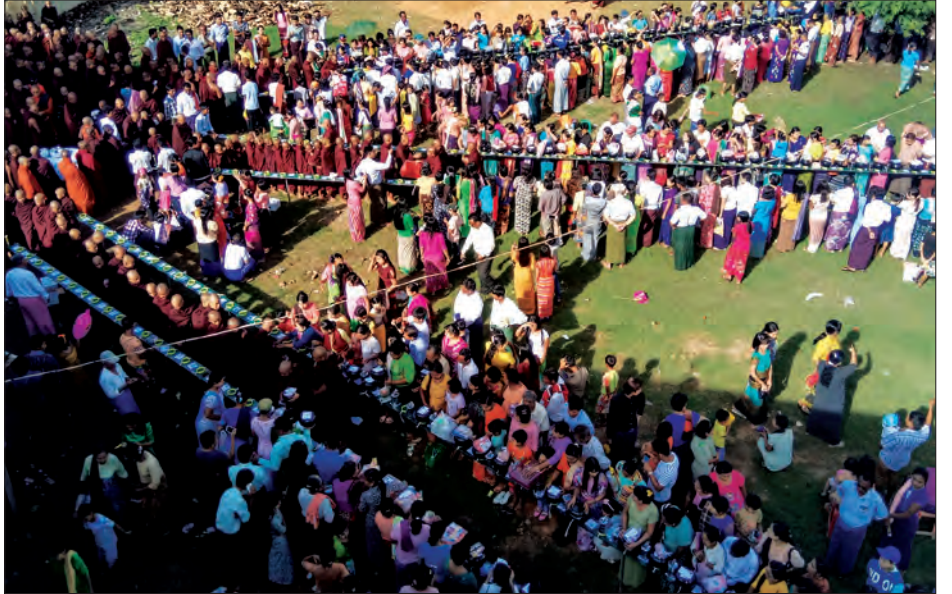
ယခုကဲ့သို့ ဆွမ်းသပိတ်လောင်းလှူပွဲနှင့် နိဗ္ဗာန်ဈေးပွဲတော်ကို ရန်အောင် မင်းကျောင်းဆရာတော် အမှူးထား၍ သရက်ပင်ကျောင်းဆရာတော် တပည့်၊ ရဟန်း၊ သံဃာ၊ အကျိုးဆောင်များ စီစဉ် ကျင်းပခြင်းဖြစ်ကြောင်း သိရပြီး ယခု နှစ်တွင် (၁၄) ကြိမ်မြောက်ဖြစ်သည်ဟု သိရသည်။

အဆိုပါ ဆွမ်းသပိတ်လောင်းလှူပွဲ သို့ ကျောင်းပေါင်း ၆၅ ကျောင်း၊ ပင့်သံဃာ အပါး ၁၀၅၀ ကြွရောက်ကြပြီး နံနက်ပိုင်း၌ သံဃာတော်များအား ဆွမ်း၊ ဘောဇဉ် တို့ကို ဆက်ကပ်လှူဒါန်းကာ ဆွမ်းသပိတ် လောင်းလှူပွဲသို့ လာရောက်ကြသူများ အား အာဟာရဒါန စားသောက်ဖွယ်ရာ အဖြာဖြာတို့ဖြင့် အလှူရှင်များက နိဗ္ဗာန် ဈေးပွဲတော်အဖြစ် တည်ခင်းဧည့်ခံ ကျွေးမွေးကုသလိမ့်ကြသည်။