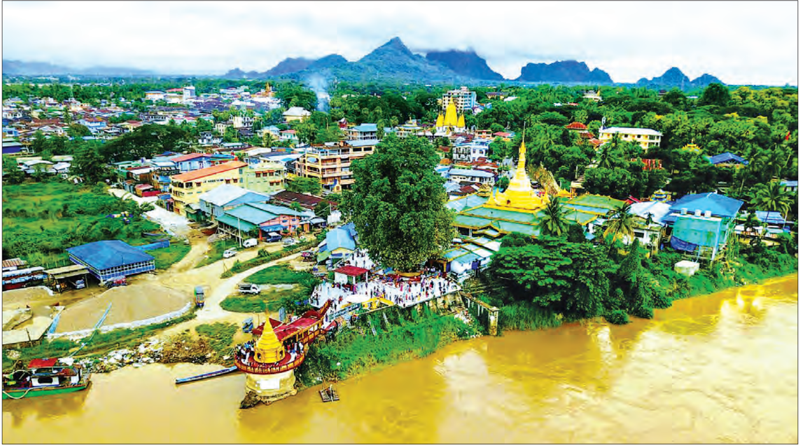
ကရင်ပြည်နယ် ဘားအံမြို့ သံလွင်မြစ်ကမ်း၏ အလှ

နေပြည်တော် အောက်တိုဘာ ၈ လွန်ခဲ့သော ၂၄ နာရီ အတွင်းက အနောက်တောင် မုတ်သုံလေသည် တာဝံလားပင်လယ်အော် အရှေ့ အလယ်ပိုင်းနှင့် မြန်မာနိုင်ငံ မြစ်ဝ ကျွန်းပေါ်ဒေသများမှ ဆုတ်ခွာခဲ့ပြီး ဖြစ်သည်။ (မိုး/လေ)