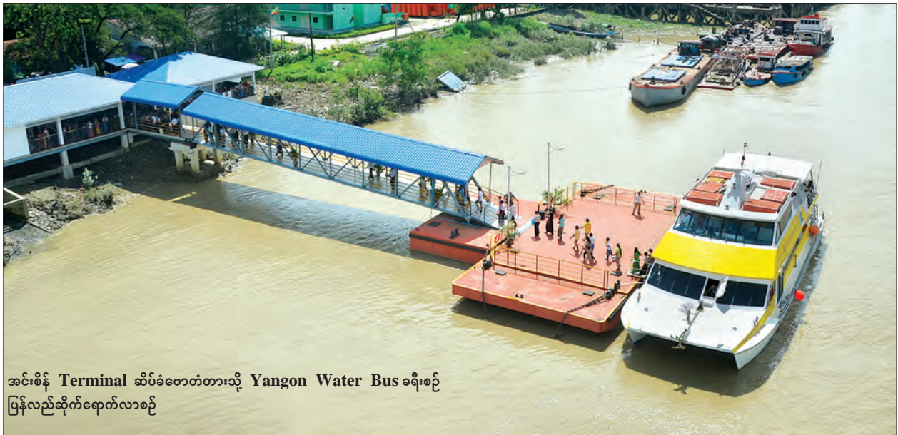
အင်းစိန် Terminal ဆိပ်ကမ်းတားသို့ Yangon Water Bus ခရီးစဉ် ပြန်လည်ဆိုက်ရောက်လာစဉ်

Yangon Water Bus ကို အပိုင်းသုံးပိုင်းဖြင့် တိုးချဲ့ပြေးဆွဲသွားရန် ဆောင်ရွက် လျက်ရှိပြီး လှိုင်သာယာနှင့် ရွှေပြည်သာအထိခရီးစဉ်ကိုလည်း ထပ်တိုးပြေးဆွဲပေး