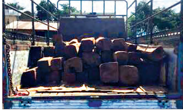
တရားဝင်စာရွက်စာတမ်းအထောက်အထားတစ်စုံတစ်ရာတင်ပြနိုင်ခြင်းမရှိသည့် ရင်းတိုက်သစ်နှင့် ပစ္စည်းသယ်ဆောင်သည့်ယာဉ်