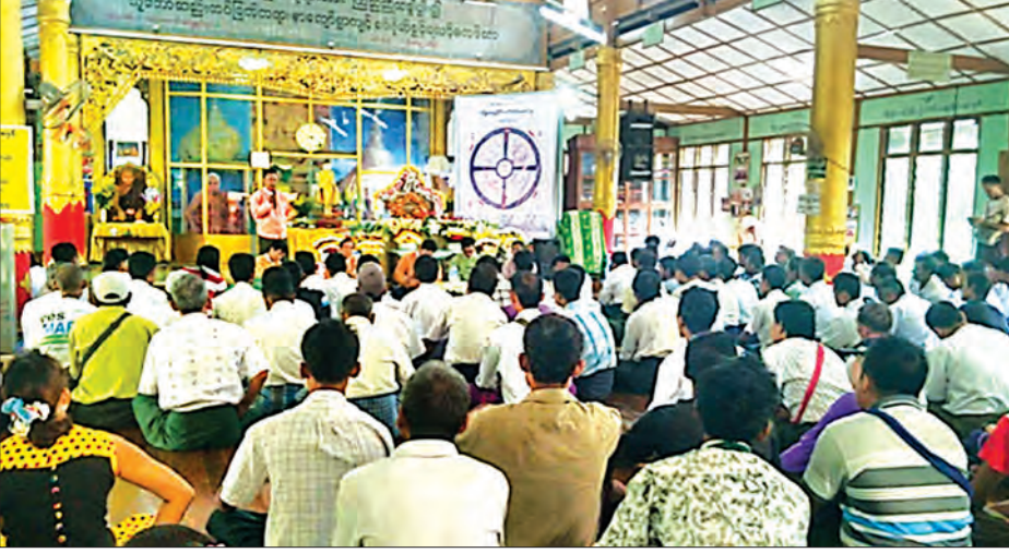
တွေ့ဆုံဆွေးနွေးခဲ့ကြောင်း သိရသည်။ ကျေးရွာအုပ်စု ၁၃ အုပ်စုမှ အုပ်ချုပ်ရေးအဆိုပါ တွေ့ဆုံဆွေးနွေးပွဲသို့ များများ၊ ဒေသခံပြည်သူများ၊ လွှတ်တော်ရန်ပုံငွေ အကောင်အထည်ဖော်ရေးကော်မတီဝင်များ တက်ရောက်ခဲ့သည်။

ပဲခူးတိုင်းဒေသကြီး ကျောက်ကြီးမြို့နယ်သည် ယခင်က တည်ငြိမ်အေးချမ်းမှု နည်းခဲ့သောကြောင့် ဖွံ့ဖြိုးတိုးတက်မှု လိုအပ်ချက်များစွာရှိခဲ့ပြီး ယခုအခါ ဒေသတွင်း တည်ငြိမ်အေးချမ်းလာသည်နှင့်အမျှ ဒေသဖွံ့ဖြိုးတိုးတက်ရေးအတွက် အရှိန်အဟုန်ဖြင့် အကောင်အထည်ဖော်ဆောင်ရွက်လျက်ရှိသည့်အပြင် ပြည်သူတို့၏ အသံ၊ လိုအပ်ချက်များကို သိရှိနိုင်ရန်အတွက် အမျိုးသားလွှတ်တော်၊ ပြည်သူ့လွှတ်တော်၊ တိုင်းဒေသကြီးလွှတ်တော် ကိုယ်စားလှယ်များသည် အောက်တိုဘာ ၈ ရက် နံနက် ၉ နာရီက မုန်းမြို့၊ ဝိပဿနာဓမ္မဓိပိသာန္တိ ဌာန ဆိုင်ရာများ၊ ဒေသခံပြည်သူများနှင့်