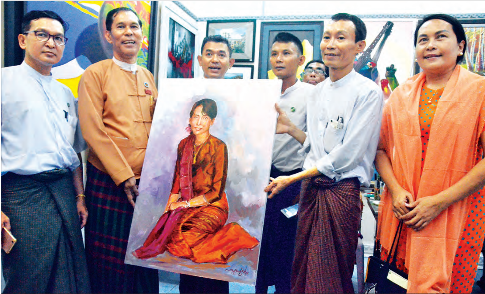
ငြိမ်းချမ်းရေးလုပ်ငန်းစဉ်များ ဖော်ဆောင်နေမှုအပေါ် ထောက်ခံကြိုဆိုသည့်အနေဖြင့် နိုင်ငံတော်၏အတိုင်ပင်ခံပုဂ္ဂိုလ် ဒေါ်အောင်ဆန်းစုကြည်၏ ပုံတူပန်းချီကား ရေးဆွဲထားသည်ကို တွေ့ရစဉ်

၁၃၇၉ ခုနှစ်၊ သီတင်းကျွတ်လပြည့်ကျော် ၄ ရက် ၂၀၁၇ ခုနှစ်၊ အောက်တိုဘာ ၉ ရက်၊ တနင်္လာနေ့၊ အတွဲ (၅၇)၊ အမှတ်(၀၀၉)