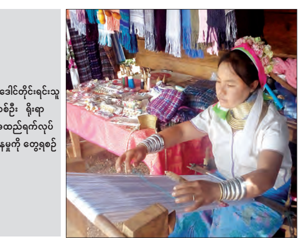
ပဒေါင်တိုင်းရင်းသူ တစ်ဦး ရိုးရာ အထည်ရက်လုပ် နေမှုကို တွေ့ရစဉ်

လျက်ရှိသည့် လည်ပင်းတွင် တပ်ဆင် သည့် ကြေးကွင်းများကိုလည်း ဝတ်ဆင် နေထိုင်လျက်ရှိနေသောကြောင့် ပဒေါင် တိုင်းရင်းသားတို့၏ လူနေမှု ဓလေ့စရိုက် တို့ကို လေ့လာကြည့်ရှုကြရန် ပြည်တွင်း ပြည်ပမှ ဧည့်သည်များဖြင့် နေ့စဉ် စည်ကားလျက်ရှိနေကြောင်း သိရ သည်။ (အောက်ပုံ) အဆိုပါ ပဒေါင်များနေထိုင်သည့် ရွာထိပ်တွင် ပဒေါင်တိုင်းရင်းသားများ အသုံးပြုသည့်ပစ္စည်းများ၊ အဝတ်အထည် များ၊ ရိုးရာပစ္စည်းများ၊ အမှတ်တရပစ္စည်း များကို ဝယ်ယူ၍ရသည့်အပြင် ပဒေါင်