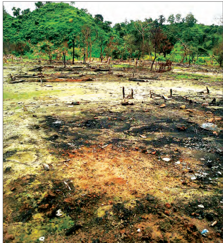
ARSA အစွန်းရောက် အကြမ်းဖက် သမားများ၏ မီးရှို့ဖျက်ဆီး ခံရသည့် ခုံတိုင်(မြို့)ရွာ၏ မီးလောင်ပြင်ကို တွေ့ရစဉ်

ပိုင်းပြီး ထွက်မပြေးနိုင်တဲ့သူတွေကို အကြမ်းဖက်တိုက်ခိုက် သတ်ဖြတ်ခဲ့တဲ့ပုံရိပ်တွေက ဦးမောင်လှအတွက် စိတ်ထဲမှာ တစ်သက်မမေ့နိုင်စရာ ပုံရိပ်ဆိုးတွေဖြစ်ခဲ့ပါပြီ။