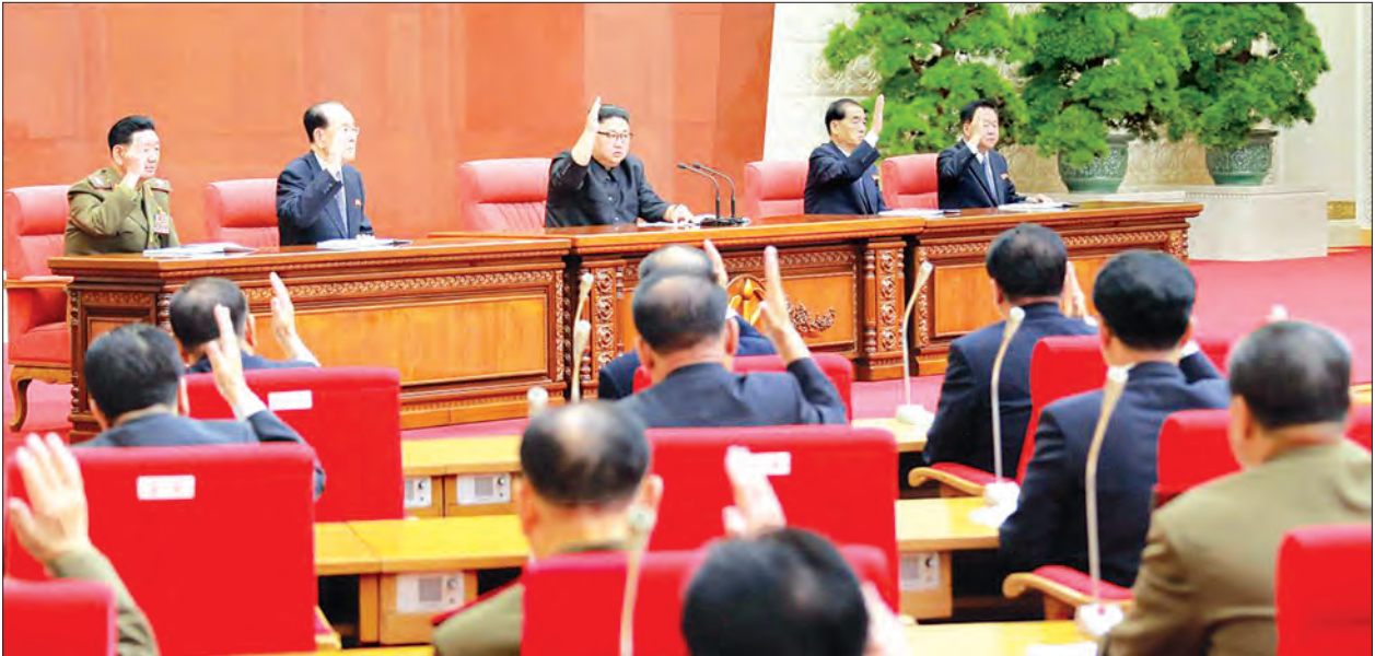
အောက်တိုဘာ ၈ ရက်က မြောက်ကိုရီးယားခေါင်းဆောင် ကင်ဂျုံအမ်း ကိုရီးယားအလုပ်သမားပါတီ ဗဟိုကော်မတီနှင့် တွေ့ဆုံစဉ်

အမေရိကန်သမ္မတ ဒေါ်နယ်ထရန်က မြောက်ကိုရီးယားနိုင်ငံနှင့် ပတ်သက်၍ ကိုင်တွယ်ဆောင်ရွက်ရန်နည်းလမ်းမှာ တစ်ခုတည်းသာရှိတော့ကြောင်း ပြောကြားခဲ့ပြီးနောက် နာရီများစွာအကြာတွင် မြောက်ကိုရီးယားခေါင်းဆောင် ကင်ဂျုံအမ်းသည် ၎င်း၏ နျူကလီးယားလက်နက်များမှာ စွမ်းအားပြည့်ဝသည့် ဟန်တားနိုင်စွမ်းရှိသော လက်နက်များဖြစ်ပြီး မြောက်ကိုရီးယားနိုင်ငံ၏ အချုပ်အခြာအာဏာကို အာမခံပေးနိုင်မည်ဖြစ်သည်ဟု ပြောကြားခဲ့ကြောင်း နိုင်ငံပိုင်သတင်းမီဒီယာက တနင်္ဂနွေနေ့တွင် ဖော်ပြခဲ့သည်။