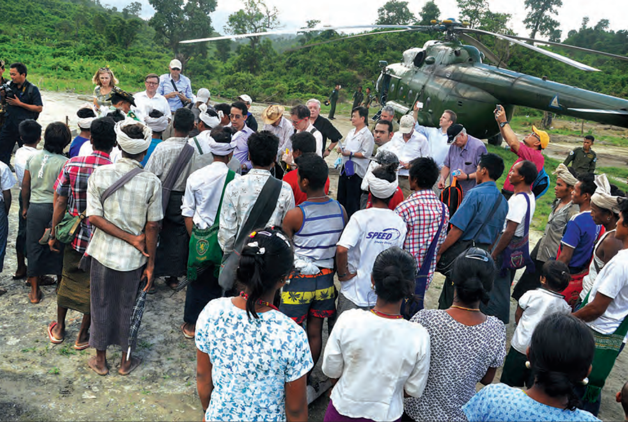
မီးရှို့ခံရသည့် ခုံတိုင်(မြို့)ရွာမှ ဒေသခံများအား နိုင်ငံခြား သံတမန်များက တွေ့ဆုံမေးမြန်းစဉ်

အခုလို အကြမ်းဖက်သမားတွေလက်က လွတ်မြောက်ဖို့ အသက်လူထွက်ပြေးရတဲ့အခါမှာ ခုံတိုင်ရွာ အရှေ့ဘက် မေယုတောင်တန်းဘက်ကို တောလမ်းကနေထွက်ပြေးခဲ့ပြီး ည ၈ နာရီခန့်မှာ ဘူးသီးတောင်မြို့နယ်ထဲမှာရှိတဲ့ တောင်ပေါ်