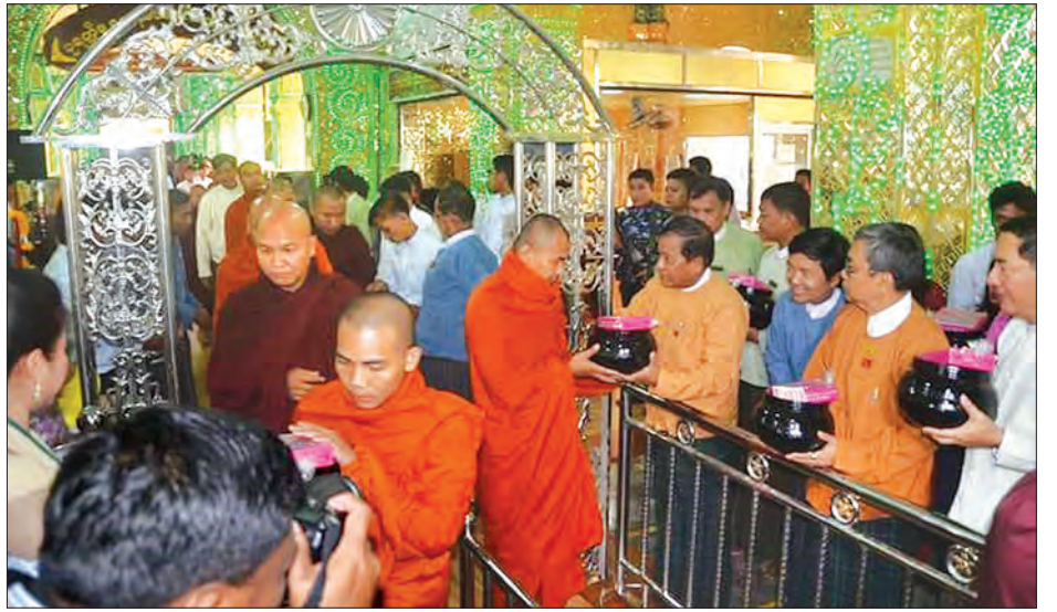
မန္တလေးမြို့လေးပြင်လေးရပ်မှ ဆရာတော် သံဃာတော် ၂၀၆၀ အား သပိတ်နှင့် လှူဖွယ်ပစ္စည်းအစုစုကို လောင်းလှူခဲ့ကြသည်။

မဟာသကျမာရဇိန် ကျောက်တော်ကြီးမြတ်စွာဘုရား၏ ဗုဒ္ဓပူဇော်ယဉ်တော် သံဃာဒါနဆွမ်းသပိတ် လောင်းလှူပွဲကို နှစ်စဉ်ပျက် ကျင်းပလာခဲ့ရာ ယခုနှစ်(၁၂၉)ကြိမ်မြောက်တွင်