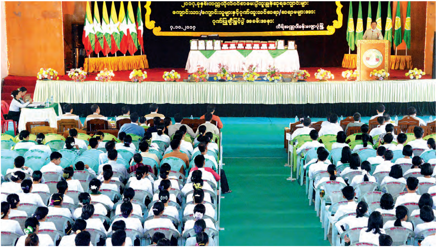
ပြည်ထောင်စုဝန်ကြီး ဒေါက်တာမျိုးသိမ်းကြီး ဖျာပုံမြို့ သီရိအက္ခဝါခန်းမ၌ကျင်းပသည့် ၂၀၁၇ ခုနှစ် တက္ကသိုလ်ဝင်စာမေးပွဲ ထူးချွန်ဆုကျောင်းများ၊ ကျောင်းသား ကျောင်းသူများနှင့် ဂုဏ်ထူးသင်ဆရာ ဆရာမများအား ဂုဏ်ပြုဆုချီးမြှင့်ပွဲအခမ်းအနားတွင် အမှာစကားပြောကြားစဉ်

ယခင်က ၁၁ တန်း အခြေခံပညာရေးစနစ်ကို နိုင်ငံတကာတွင် ကျင့်သုံးနေသည့် KG+12 အခြေခံပညာရေးစနစ်ကို စတင်ကူးပြောင်းနေပြီဖြစ်ကြောင်း၊ သူငယ်တန်းနှင့် မူလတန်း သင်ရိုးညွှန်းတမ်းများနှင့် ကျောင်းသုံးပြဋ္ဌာန်းစာအုပ်များ၊ ဆရာလမ်းညွှန်စာအုပ်များကို ဂျပန်နိုင်ငံ JICA နှင့် ပူးပေါင်းရေးဆွဲလျက်ရှိပြီး အလယ်တန်း၊ အထက်တန်းသင်ရိုးညွှန်းတမ်းများကို အာရှဖွံ့ဖြိုးရေးဘဏ် (ADB)၊ ဥရောပသမဂ္ဂ (EU) တို့နှင့် ပူးပေါင်းရေးဆွဲလျက်ရှိပါကြောင်း၊ သူငယ်တန်းသင်ရိုးသစ်ကို ၂၀၁၆-၂၀၁၇ ပညာသင်နှစ်တွင် စတင်ခဲ့ပြီး ၂၀၁၇-၂၀၁၈ ပညာသင်နှစ်တွင် Grade-1 သင်ရိုးအသစ်ကို စတင်သင်ကြား