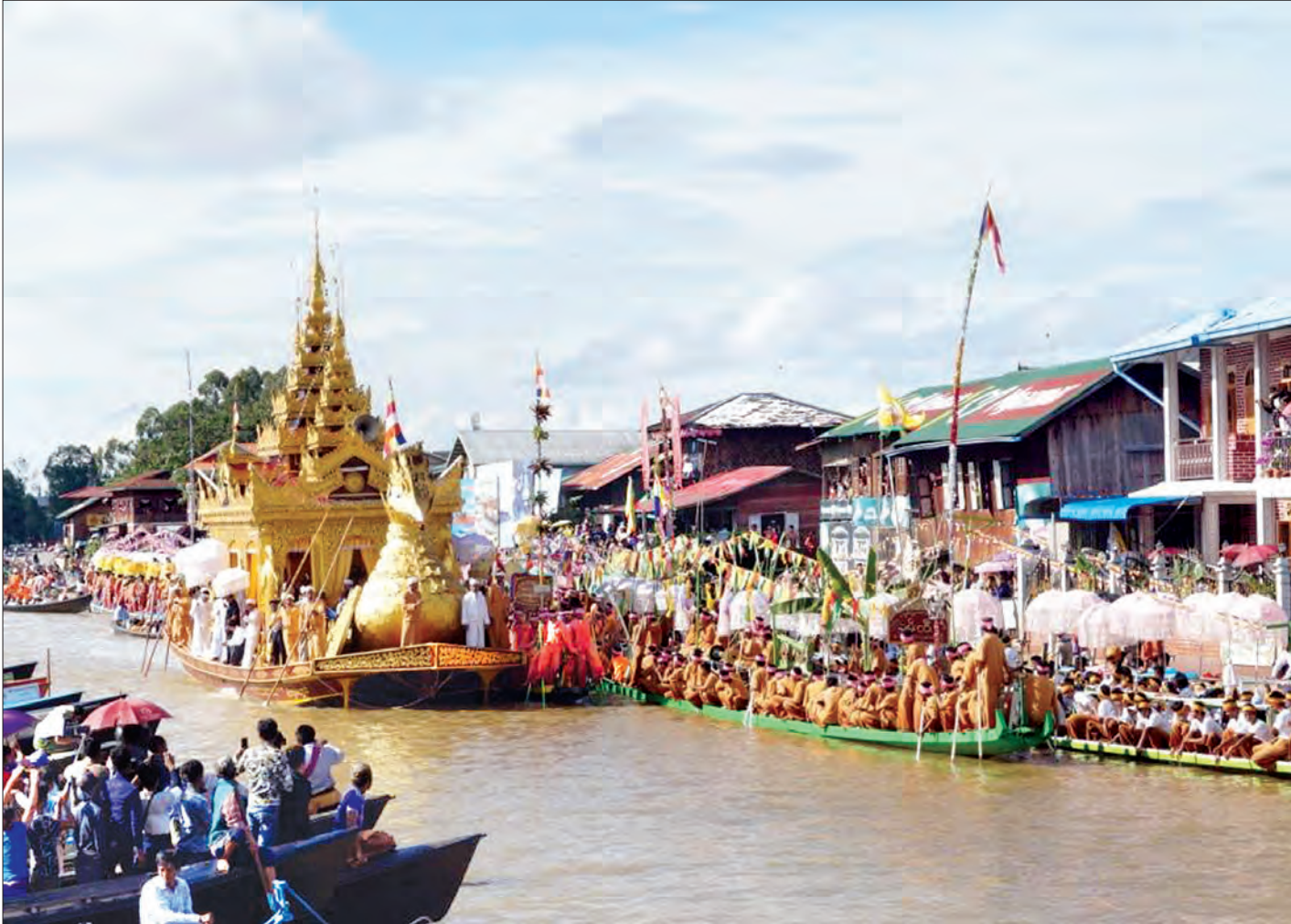
အင်းလေးဖောင်တော်ဦးမြတ်စွာဘုရား ရုပ်ရှင်တော်မြတ်များ ညောင်ရွှေမြို့သို့ ဒေသစာရီလှည့်လည်အပူဇော်ခံစဉ်

၁၃၇၉ ခုနှစ်၊ သီတင်းကျွတ်လဆန်း ၈ ရက် ၂၀၁၇ ခုနှစ်၊ စက်တင်ဘာ ၂၈ ရက်၊ ကြာသပတေးနေ့၊ အတွဲ (၅၆)၊ အမှတ် (၃၆၀)