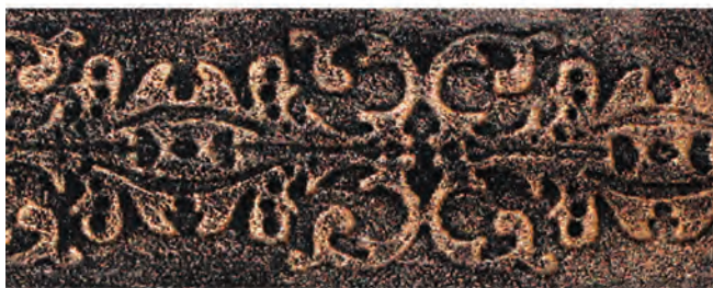
Karaweik Acrylic Antique Metal Paint Copper Gold (KG-AA22)