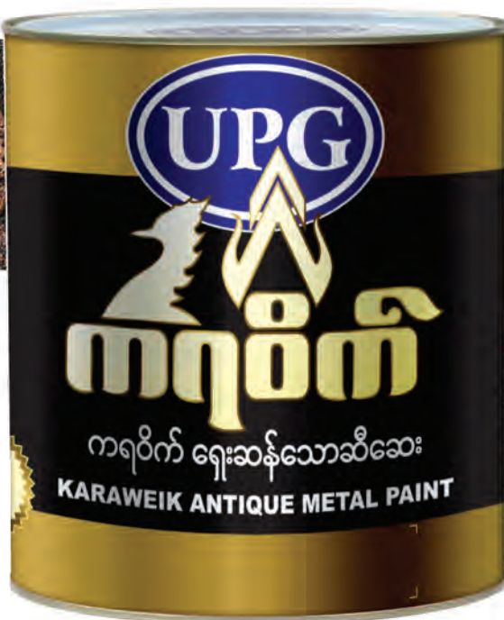
Karaweik Acrylic Antique Metal Paint Pale Gold (KG-AA44)