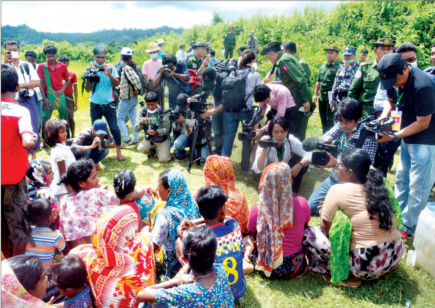
ခမောင်းဆိပ်ကျေးရွာမှ အသတ်ခံခဲ့ရသော ဟိန္ဒူဘာသာဝင် မိသားစုဝင်များနှင့် ပြည်တွင်း ပြည်ပမီဒီယာများ တွေ့ဆုံစဉ် (သတင်းစဉ်)