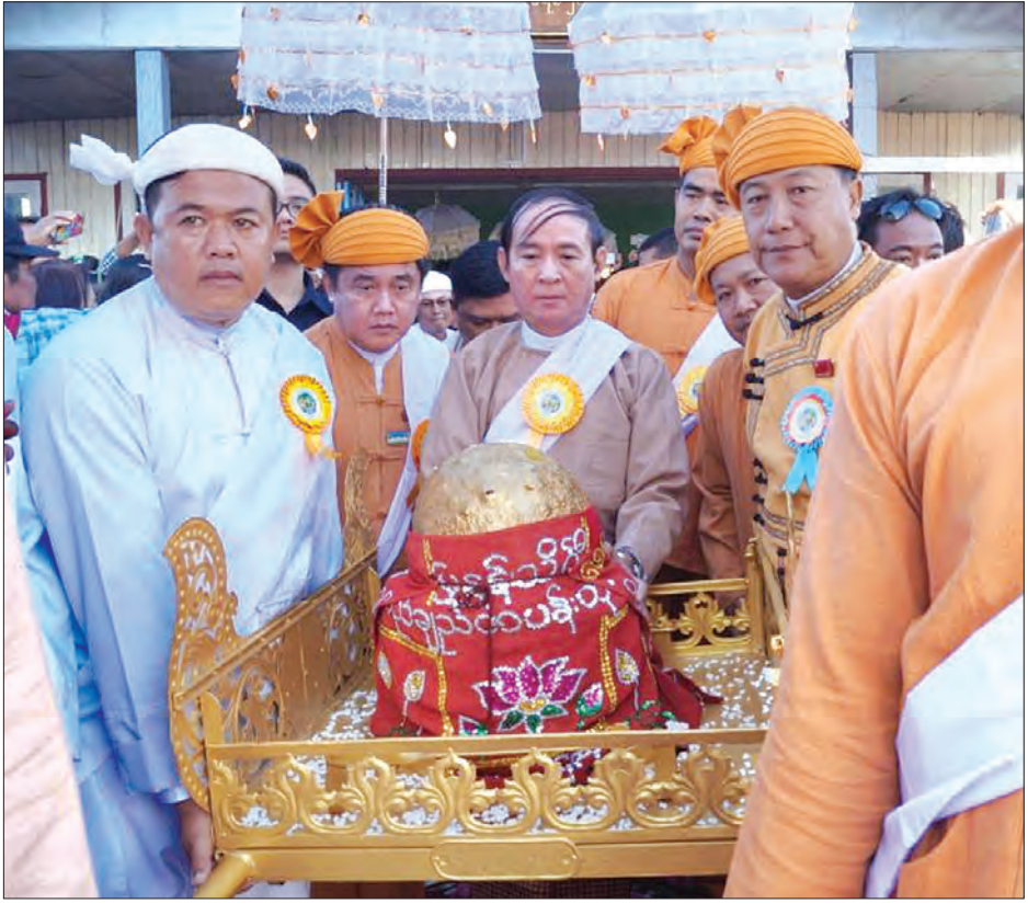
ပထမကိုယ်ပွားတော်မြတ်အား ပြည်သူ့လွှတ်တော်ဥက္ကဋ္ဌ ဦးဝင်းမြင့် ကရဝိက်ဖောင်တော်ပေါ်မှ ဘော်ယဉ်ပေါ်သို့ ပင့်ဆောင်စဉ်

* ရှေ့မှ လွှတ်တော်ကိုယ်စားလှယ်များက လည်းကောင်း၊ ဒုတိယကိုယ်စားလှယ်များကို ရှမ်းပြည်နယ်ဝန်ကြီးချုပ် ဒေါက်တာလင်းထွဋ်နှင့် ပြည်နယ်ဝန်ကြီးများက လည်းကောင်း၊ တတိယကိုယ်စားလှယ်များကို ကျန်းမာရေးနှင့်အားကစားဝန်ကြီးဌာန ပြည်ထောင်စုဝန်ကြီး ဒေါက်တာမြင့်ထွေးနှင့် ပြည်နယ်ဝန်ကြီးများက လည်းကောင်း၊ စတုတ္ထကိုယ်စားလှယ်များကို ပြည်နယ်လွှတ်တော်ဥက္ကဋ္ဌ ဦးစိုင်းလုံးဆိုင်နှင့် ပြည်နယ်တရားလွှတ်တော် တရားသူကြီးချုပ်၊ ပြည်နယ်ဝန်ကြီးများက လည်းကောင်း ပင့်ဆောင်ကြသည်။ ယင်းနောက် အင်းလေးဖောင်တော်ဦး မြတ်စွာဘုရား ရုပ်ရှင်တော်မြတ်များကိုဘော်ယဉ်ဖြင့် ညောင်ရွှေမြို့တွင်းသို့ လှည့်လည်အပူဇော်သံသည်။ ထို့နောက် ဖောင်တော်ဦးဘုရားပွဲတော် အင်းလေးရိုးရာ လှေပြိုင်ပွဲကို ကျင်းပရာ အမျိုးသား ၄၆ တက် လှေပြိုင်ပွဲတွင်