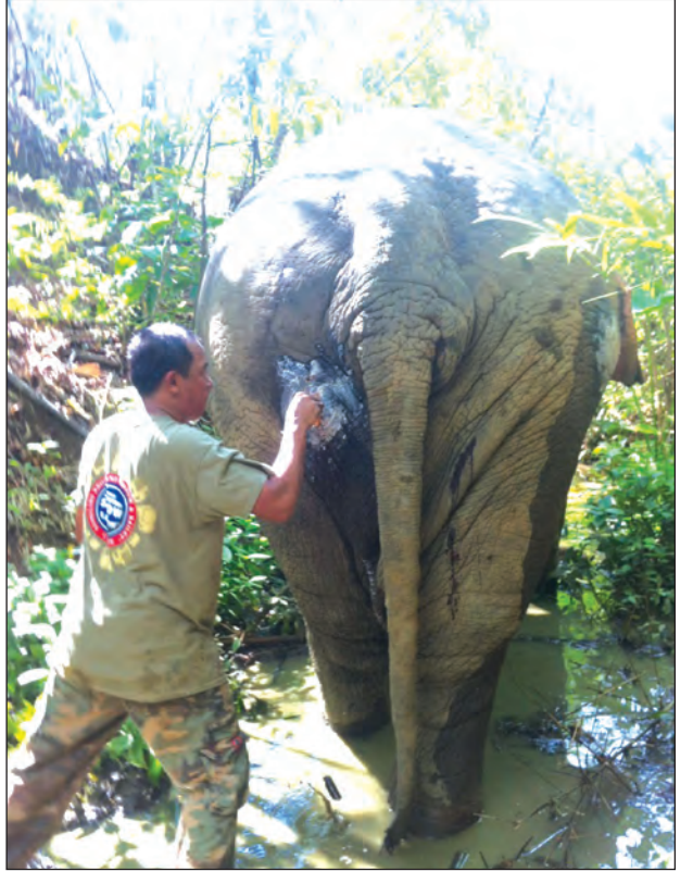
တောဆင်အားပစ်ခတ်ခဲ့သည့် အဆိပ်မြားကို ဖယ်ထုတ်ပေးစဉ်

လှည့်လည် စားသောက်တတ်သည့် အကျင့်ရိုလို့ နွယ်ပင်တွေ၊ ချုံပင်တွေကို ရှင်းလင်းရာရောက်လို့ သစ်တောလုပ်ငန်းမှာ အလင်းဖွင့်တာတို့၊ နွယ်ရှင်းတာ တို့အတွက် အထောက်အကူပြုလေ သလားလို့ ထင်မိပါသည်။ တောဆင်တွေ ဟာ အနည်းဆုံးတော့ တောကိုသစ်သွန်း ရန်ကနေ ကာကွယ်ပေးနိုင်တယ်လို့ ထင်မိပါသည်။