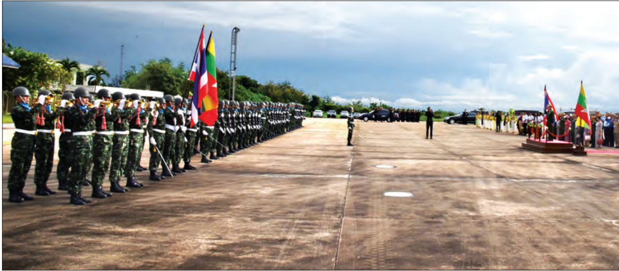
တပ်မတော်ကာကွယ်ရေးဦးစီးချုပ် ဝိုင်းချုပ်မှူးကြီး မင်းအောင်လှိုင် ထိုင်းဘုရင့်တပ်မတော် ဂုဏ်ပြုတပ်ဖွဲ့၏ အလေးပြုခြင်းကို ခံယူစဉ် (သတင်းစဉ်)