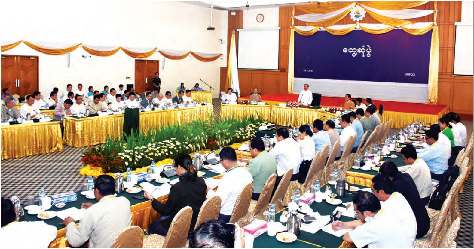
ဒုတိယသမ္မတ ဦးမြင့်ဆွေ မြန်မာ့စီးပွားရေးလုပ်ငန်းရှင်များနှင့် နဝမအကြိမ် တွေ့ဆုံဆွေးနွေးပွဲတွင် အမှာစကားပြောကြားစဉ် (သတင်းစဉ်)

ရန်ကုန် ဩဂုတ် ၂၈ ပုဂ္ဂလိကကဏ္ဍ ဖွံ့ဖြိုးတိုးတက်ရေး ကော်မတီသည် မြန်မာ့စီးပွားရေး လုပ်ငန်းရှင်များ၏ အခက်အခဲများနှင့် လိုအပ်ချက်များ အဆင်ပြေချောမွေ့စေ ရန် ရည်ရွယ်ချက်ဖြင့် မြန်မာ့စီးပွားရေး လုပ်ငန်းရှင်များနှင့် နဝမအကြိမ်ပုံမှန် တွေ့ဆုံ ဆွေးနွေးပွဲကို ယနေ့နံနက် ၉ နာရီ တွင် ရန်ကုန်မြို့ရှိ မြန်မာနိုင်ငံကုန်သည် များနှင့် စက်မှုလက်မှုလုပ်ငန်းရှင်များ အသင်းချုပ်(UMFCCI) အစည်း အဝေးခန်းမ၌ ကျင်းပရာ ပုဂ္ဂလိကကဏ္ဍ ဖွံ့ဖြိုးတိုးတက်ရေး ကော်မတီဥက္ကဋ္ဌ ဒုတိယသမ္မတ ဦးမြင့်ဆွေ တက်ရောက် အမှာစကားပြောကြားသည်။ တွေ့ဆုံဆွေးနွေးပွဲသို့ စီမံကိန်းနှင့် ဘဏ္ဍာရေးဝန်ကြီးဌာန ပြည်ထောင်စု ဝန်ကြီးဦးကျော်ဝင်း၊ ရန်ကုန်တိုင်းဒေသ ကြီး ဝန်ကြီးချုပ် ဦးမြိုးမင်းသိန်းနှင့် တိုင်းဒေသကြီးဝန်ကြီးများ၊ ဌာနဆိုင်ရာ တာဝန်ရှိသူများ၊ မြန်မာနိုင်ငံ ကုန်သည် များနှင့် စက်မှုလက်မှုလုပ်ငန်းရှင်များ အသင်းချုပ်ဥက္ကဋ္ဌ၊ ဗဟိုအလုပ်အမှု ဆောင်များနှင့် တာဝန်ရှိသူများ တက်ရောက်ကြသည်။ စာမျက်နှာ ၃ ကော်လံ ၁ ○