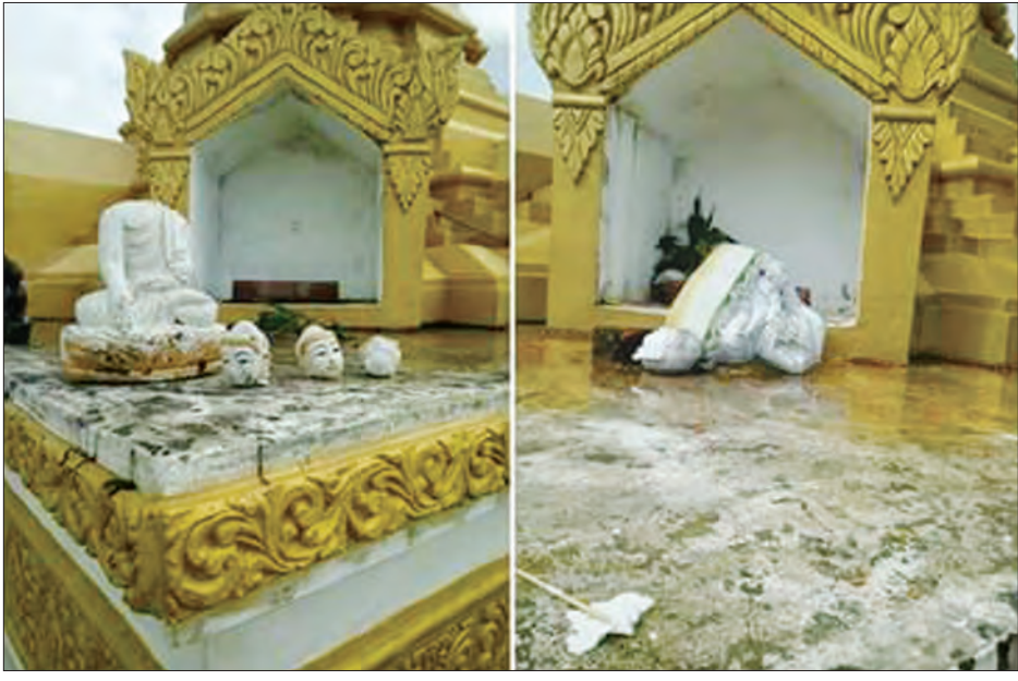
အစွန်းရောက်ဘင်္ဂါလီအကြမ်းဖက်သမားများ ဖျက်ဆီးခဲ့သဖြင့် ခရေမြိုင်ဘုန်းကြီးကျောင်းရှိ ဘုရားများ ပျက်စီးနေစဉ်

နံနက် ၁၁ နာရီ ၁၃ မိနစ်တွင် ဇင်ပိုင် ညာလမ်းဆုံ၌ အစွန်းရောက်ဘင်္ဂါလီ