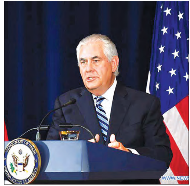
အမေရိကန်နိုင်ငံခြားရေးဝန်ကြီး ရက်တေလာဆန်

ဝါရှင်တန် ဩဂုတ် ၂၀ မြောက်ကိုရီးယားနိုင်ငံက မကြာသေးမီတွင် ဒုံးကျည်စမ်းသပ်ပစ်လွှတ်မှုများကို လုပ်ဆောင်ခဲ့သော်လည်း အမေရိကန်ပြည်ထောင်စုသည် ကိုရီးယားကျွန်းဆွယ်၏ နျူကလီးယားပြဿနာကို ငြိမ်းချမ်းစွာဖြေရှင်းနိုင်ရန် ဆက်လက်ကြိုးပမ်းသွားမည် ဖြစ်သည်ဟု အမေရိကန်နိုင်ငံခြားရေးဝန်ကြီးက ပြောကြားခဲ့ကြောင်း သိရသည်။ မည်သည့်တိုက်ချင်းပစ်ဒုံးကျည်ကိုမဆို စမ်းသပ်ပစ်ခတ်ခြင်းသည် ကုလသမဂ္ဂ လုံခြုံရေးကောင်စီ၏ စည်းမျဉ်းစည်းကမ်းများကိုချိုးဖောက်လိုက်ခြင်းပင်ဖြစ်ကြောင်း နှင့် အဆိုပါလုပ်ရပ်ကို ကျူးကျော်ရန်စသည့် အပြုအမူတစ်ခုအနေဖြင့်သာ ရှုမြင် ကြောင်း၊ ထိုသို့စမ်းသပ်ပစ်ခတ်သည်လုပ်ရပ်တိုင်းသည် အမေရိကန်နှင့် မဟာမိတ်များ ကို ကျူးကျော်ရန်စနစ်ပင်ဖြစ်ကြောင်း ရက်တေလာဆန်က ပြောကြားခဲ့သည်ဟု Fox News သတင်းတွင် ဖော်ပြခဲ့သည်။ အမေရိကန်သည် မြောက်ကိုရီးယားကို စေတနာတော်ပေးပို့ပေးရန် ရောဂါရှိလာ သည်ကိုတွေ့မြင်ခွင့်ရရှိရေးအတွက် တရုတ်နိုင်ငံနှင့်သာမက မဟာမိတ်များနှင့်အတူ လက်တွဲကာ ငြိမ်းချမ်းစွာဖိအားပေးသည့် စစ်ဆင်ရေးကို ဆက်လက်ပြုလုပ်သွားမည် ဖြစ်ကြောင်း တေလာဆန်က ဖြည့်စွက်ပြောကြားခဲ့သည်။ အမေရိကန်ပစ်ခတ် စစ်ရေးညွှန်ကြားမှုအဖွဲ့သည် မြောက်ကိုရီးယားက ပြီးခဲ့သည့် စနေနေ့တွင် ဒုံးကျည်သုံးစင်းကိုစမ်းသပ်ပစ်ခတ်ခဲ့ကြောင်း သို့သော်လည်း ဒုံးကျည် တစ်စင်းမျှ အန္တရာယ်ရှိသည့်ခြိမ်းခြောက်မှုမျိုးကိုမဖြစ်စေခဲ့ကြောင်း သောကြာနေ့က အတည်ပြုပြောကြားခဲ့သည်။ အမေရိကန်ပြည်ထောင်စုနှင့် တောင်ကိုရီးယားတို့သည် နှစ်စဉ်ပြုလုပ်မြဲဖြစ်သည့် နှစ်နိုင်ငံပူးတွဲစစ်ရေးလေ့ကျင့်မှုများကို ဆက်လက်ဆောင်ရွက်ခဲ့ပြီး နောက်တွင် မြောက်ကိုရီးယားက ဒုံးကျည်စမ်းသပ်မှုများကိုထပ်မံပြုလုပ်လာခဲ့ခြင်းဖြစ်ကြောင်း သိရသည်။ (ရိုက်တာ)