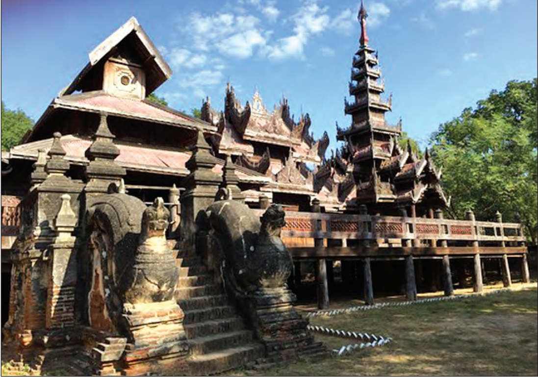
စလေရုပ်စုံကျောင်းတော်ကြီး