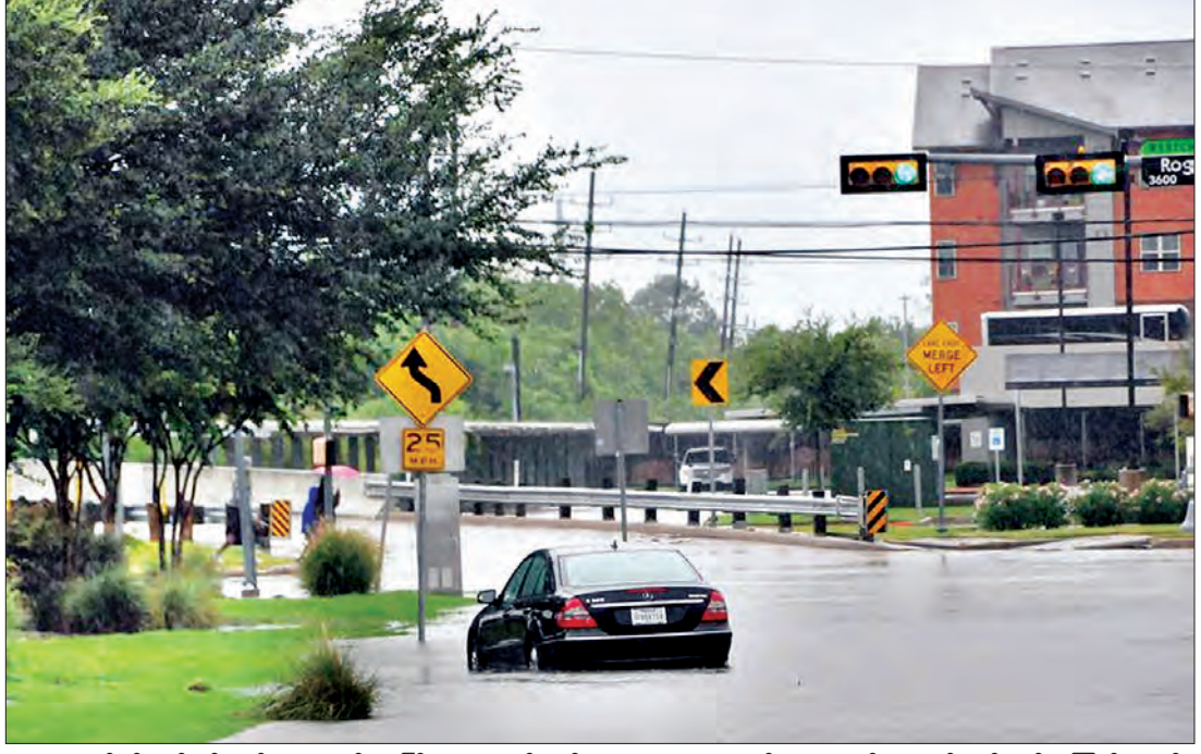
ဟူစတန်နှင့် အနီးဝန်းကျင်ဒေသများ၌ ရေကြီးမှုများ ဆက်လက် မြင့်တက်လျက်ရှိရာ အမေရိကန် ကမ်းခြေစောင့်တပ်ဖွဲ့အနေဖြင့်လည်း ရေဘေးဒုက္ခရောက်နေသူများကို ကူညီကယ်ဆယ်ခဲ့ကြောင်း သိရ သည်။

ဝါရှင်တန် ဩဂုတ် ၂၀ ဟာရီကီနီးမုန်တိုင်း ဟာပေးကြောင့် ရေကြီးမှုနှင့် ပျက်စီးမှုဖြစ်စဉ်များတွင် ရှာဖွေကယ်ဆယ်ရေး လုပ်ငန်းများ ပါဝင်ဆောင်ရွက်နိုင်ရေးအတွက် အမျိုးသားကာကွယ်စောင့်ရှောက်ရေးနှင့် ပြည်နယ် ကာကွယ်စောင့်ရှောက်ရေး အဖွဲ့ဝင် ၃၀၀၀ခန့်ကို အရန်သင့်ပြင်ဆင်ထားကြောင်း တက္ကဆက်မြို့တော် ဝန် ဂရက်ချ်အက်ဘော့တက်မကြာသေးမီတွင် ပြောခဲ့ သည်။ ယမန်နေ့က တက္ကဆက်အရှေ့တောင်ဘက် ကမ်းရိုးတန်းဒေသနှင့် သိပ်မဝေးသော နေရာတစ်ခု တွင် လူသေအလောင်းတစ်လောင်း တွေ့ရှိခဲ့ကြောင်း သိရပြီး ၎င်းသည် ဟာရီကီနီးမုန်တိုင်းဟာပေးကြောင့် သေဆုံးခြင်းဟုတ်မဟုတ် မသေချာသေးကြောင်း၊ ကျန်းမာရေးအခြေအနေကြောင့်လည်း သေဆုံးခြင်း ဖြစ်နိုင်ကြောင်း ရဲတပ်ဖွဲ့က သတင်းထုတ်ပြန်ခဲ့ သည်။ ယမန်နေ့က သတင်းစာရှင်းလင်းပွဲတစ်ခုတွင် ဟူစတန်မြို့တော်ဝန် ဆိုင်ဗတ်စတာ တာနာက အရေးပေါ် ဖုန်းလက်ခံမှု ၂၀၀၀ ကျော်ရရှိခဲ့ပြီး ခိုကိုးရာနေရာ အတော်များများကို ဖွင့်လှစ်ခဲ့ကြောင်း ပြောခဲ့သည်။