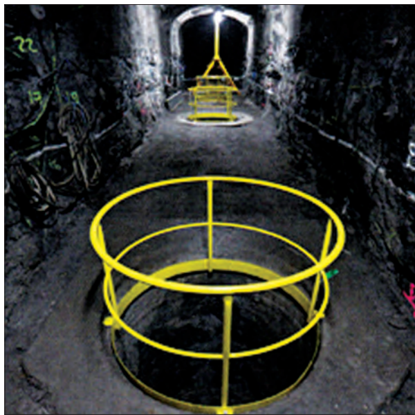
ပုံ (၁၃) Olkiluoto နျူကလီးယားစက်ရုံစွန့်ပစ်ပစ္စည်း ခြေအောက်ဥပမင်လိုက်အတွင်း သိုလှောင်မှုစနစ်