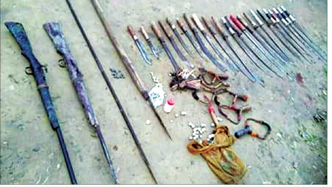
အစွန်းရောက်ဘင်္ဂါလီအကြမ်းဖက်သမားများထံမှ ဖမ်းဆီးရမိသည့် လက်နက်များကို တွေ့ရစဉ်

မွန်းလွဲ ၁၂ နာရီခွဲတွင် မောင်တော မြို့ပေါ် ရပ်ကွက် ၅ ကလာဘာ(ဘင်္ဂါလီ) ကျေးရွာတွင် မီးလောင်ကျွမ်းခဲ့ပြီး ၎င်းနေရာမှ လက်လုပ်မိုင်း သုံးလုံး ပေါက်ကွဲ ခဲ့ပြီး မွန်းလွဲ ၁၂ နာရီ ၄၅ တွင် မောင်တောခရိုင် အုပ်ချုပ်ရေးမှူးရုံး နောက်ရှိ ဘင်္ဂါလီများနေထိုင်သည့်နေအိမ်