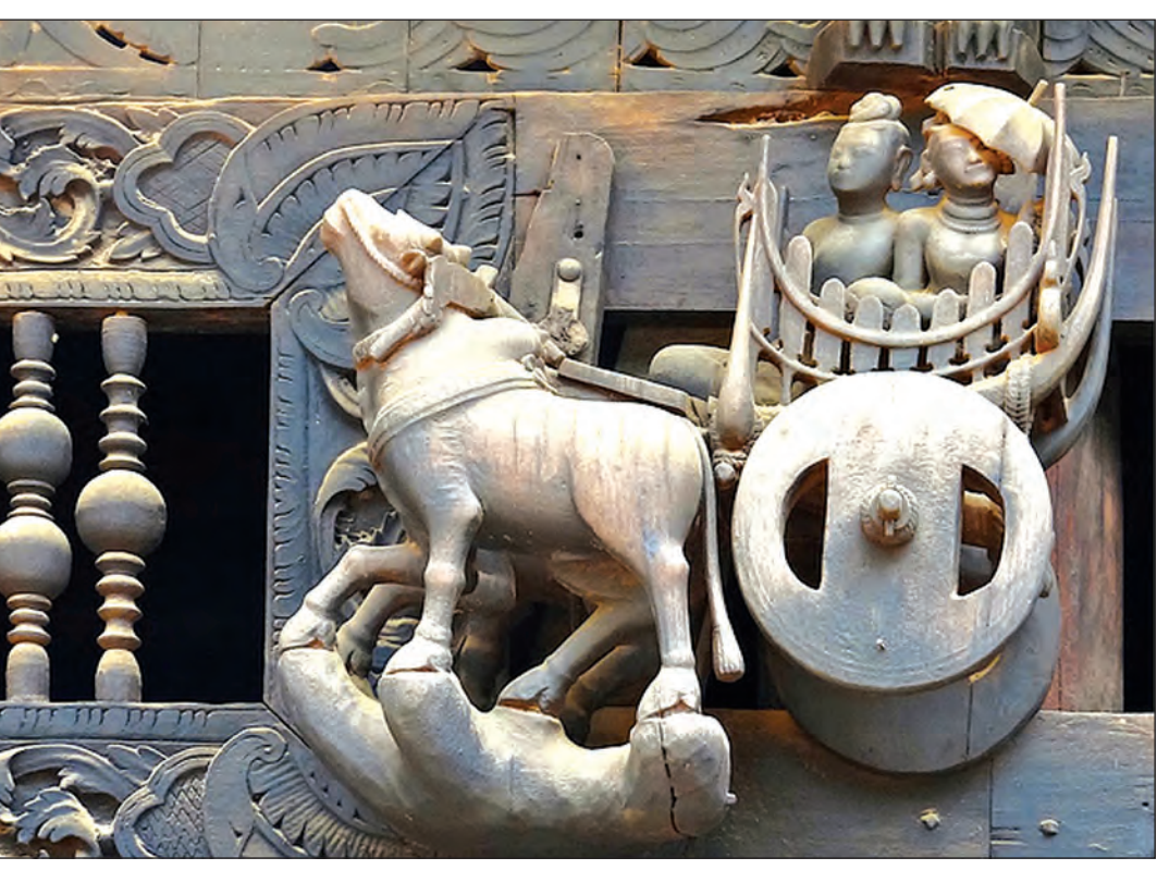
စလေရုပ်စုံကျောင်းမှ ပခန်းပုလက်ရာတစ်ခု

ရုပ်ပွားတော် မျိုးစုံ၊ သစ်စေးသုတ်တီရိုမူ၊ စုံ၊ စလေ ဦးပုည၏ လက်ရေးမူ ပေပုရပိုက်များ စသည့် ရှေးဟောင်းအထောက်အထား ပစ္စည်း များကို ထိန်းသိမ်းထားရှိသည်။ စလေ ပခန်းငယ် စလေဒေသရှိ ဒုတိယပုဂံဟုဆိုသည့် ပခန်း ငယ်သည် ကုန်းဘောင်ခေတ်နောင်းပိုင်း ရတနာ ပုံခေတ်မှ ကိုလိုနီခေတ်အထိ စည်ကားဖွံ့ဖြိုးခဲ့ ကာ မြို့စား၊ နယ်စားများအုပ်ချုပ်ခဲ့သည့် မြို့ငယ် တစ်ခုဖြစ်ခဲ့သည်။ ပခန်းငယ်သည် မကျွေးတိုင်း ဒေသကြီး ချောက်မြို့နယ်အတွင်း ဧရာဝတီမြစ်၏ အရှေ့ဘက်ကမ်း စလေနှင့် ကျောက်ရဲအကြား တွင် တည်ရှိသည်။ စလေပခန်းငယ်သည် ဆိပ် ကမ်းမြို့တစ်မြို့ဖြစ်ပြီး ကုန်းတွင်းပိုင်းဒေသ ထွက်ကုန်များကို ဧရာဝတီမြစ်ရိုးတစ်လျှောက် ရောင်းဝယ်ဖောက်ကားခဲ့သည့် နေရာလည်း ဖြစ်ခဲ့သည်။ ပခန်းငယ်တွင် ကုန်းဘောင်ခေတ်နှင့် ရတနာ ပုံခေတ်လက်ရာ စေတီပုထိုးများသည် ယနေ့တိုင် ကျန်ရှိနေရာ ရှေးဟောင်းသုတေသနနှင့် အမျိုးသားပြတိုက်ဦးစီးဌာန၏ စာရင်းများအရ စေတီ၊ ဘုရား၊ သိမ်၊ ပိဋကတ်တိုက်၊ ဥမင်နှင့် မြေတော်ရာများအပါအဝင် ရှေးဟောင်း အဆောက်အအုံ ၈၁ ခုရှိသည်။ မြေစိုက်စေတီ ၂၄ ဆူ၊ လိုဏ်ပါစေတီ ၁၁ ဆူ၊ ဘုရား ၃၈ ဆူ၊ သိမ်နှစ်လုံး၊ ပိဋကတ်တိုက် သုံးခု၊ မြေတော်ရာ နှစ်ဆူနှင့် ဥမင်တစ်ခုရှိပြီး အများစုသည် သမိုင်း အထောက်အထားများ မရှိကြပါချေ။ ကွမ်းတောင်ဘုရားဟုခေါ်တွင်သည့်အဆောက် အအုံအမှတ်(၁၃)၏ ဂန္ဓကုဋ်တိုက်လိုက်အတွင်း၌ သက္ကရာဇ် ၁၀၆၆ ခုနှစ် (ခရစ်နှစ် ၁၄၂၄ ခုနှစ် ဝန်းကျင်) ဘုရားဒကာ ငစုံမိ၊ ဘုရားဒကာမ မယ်စံသာ အမည်ပါ မင်းဇာနှင့် ဝေသန္တရာ ဇာတ် တော်ပါ နံရံဆေးပန်းချီရှိသည်။ ထို့အတူ