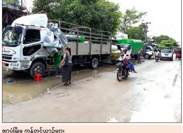
ဈာပုံမြို့မှ ကုန်တင်ယာဉ်များ

ယခင်နှစ်များက ဈာပုံမြို့ကုန်သည်များသည် ကုန်စည်ကူးသန်းရာဇလမ်းထက် ကားလမ်းကို ပိုအသုံးများလာကြောင်း သိရသည်။