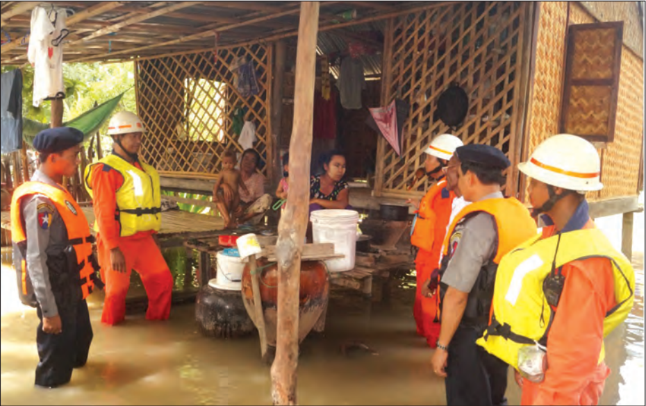
ကျေးရွာ အုပ်ချုပ်ရေးမှူးများနှင့်အတူ ဧရာဝတီမြစ်ရေ ဝင်ရောက်လျက်ရှိသည့် ကျေးရွာများသို့ စက်လှေများဖြင့် ကွင်းဆင်းကာ သဘာဝဘေးအန္တရာယ် ကြိုတင်ကာကွယ်ရေးအဖွဲ့များက ထိခိုက်ဆုံးရှုံးမှုနှင့်အောင် အသိပညာပေးခြင်းနှင့် လိုအပ်သော အကူအညီများပေးခြင်း ပြည်သူ

ဆိပ်ဖြူ၊ ဩဂုတ် ၂၀ မကွေးတိုင်းဒေသကြီး ဆိပ်ဖြူမြို့နယ်တွင် ဧရာဝတီမြစ်ရေ ဒုတိယအကြိမ်လျှောက်လာခြင်းကြောင့် ကျေးရွာအချို့တွင် မြစ်ရေဝင်ရောက်လျက်ရှိရာ အဆိုပါကျေးရွာများမှ ပြည်သူများနှင့် ရေဘေးရောက်နေရသော ပြည်သူများအား အကူအညီပေးခြင်းနှင့် သဘာဝဘေးအန္တရာယ် ကြိုတင်ကာကွယ်ရေးအဖွဲ့များက ထိခိုက်ဆုံးရှုံးမှုနှင့်အောင် အသိပညာပေးခြင်းများကို တာဝန်ရှိသူများ ဩဂုတ် ၂၄ ရက်က ကွင်းဆင်းဆောင်ရွက်ခဲ့ကြောင်း သိရသည်။ တိုင်းဒေသကြီးလွှတ်တော်ကိုယ်စားလှယ်များဖြစ်သည့် ဦးကျော်ဆန်းအောင်နှင့် ဒေါ်သက်မိနှင့်အဖွဲ့၊ မြို့နယ်ရဲတပ်ဖွဲ့မှူး၊ ရဲမှူးထွန်းမြင့်ဝင်းနှင့် ရဲတပ်ဖွဲ့ဝင်များ၊ မြို့နယ်မီးသတ်တပ်ဖွဲ့ဦးစီးမှူး၊ ဦးအောင်ဇော်လင်းနှင့် တပ်ဖွဲ့ဝင်များက သက်ဆိုင်ရာ ကျေးရွာအုပ်ချုပ်ရေးမှူးများနှင့်အတူ ဧရာဝတီမြစ်ရေ ဝင်ရောက်လျက်ရှိသည့် ကျေးရွာများသို့ စက်လှေများဖြင့် ကွင်းဆင်းကာ သဘာဝဘေးအန္တရာယ် ကြိုတင်ကာကွယ်ရေးအဖွဲ့များက ထိခိုက်ဆုံးရှုံးမှုနှင့်အောင် အသိပညာပေးခြင်းနှင့် လိုအပ်သော အကူအညီများပေးခြင်း ပြည်သူ