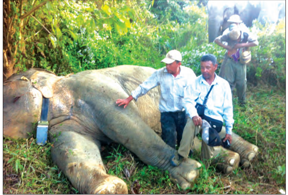
ရေဒီယိုကော်လာတပ်ဆင်ခဲ့သည့်တောဆင်ကြီးနှင့် ကျွန်တော်တို့အဖွဲ့

သို့သော် နိုင်ငံတော်၏ စီးပွားရေး စီမံကိန်းနှင့် လိုအပ်ချက်များအရ သဘာဝ တောများ စွန့်လွှတ်ခဲ့ရခြင်း၊ သစ်အလွန် အကျွတ်ထုတ်ယူခဲ့ခြင်းနှင့် စီမံကိန်းများကြောင့် သစ်တောပျက်စီးမှုများပြားလာခဲ့ပြီး ၂၀၁၇ ခုနှစ်တွင်သစ်တောဦးစီးဌာန၏ ထုတ်ပြန်ချက်အရ ၄၂ ဒသမ ၉ ရာခိုင်နှုန်းခန့် သစ်တောဖုံးလွှမ်းလျက်ရှိကြောင်း သိရပါသည်။ ဒါ့အပြင် ရိုးမဖြတ်ကျော် ဗျူဟာလမ်းမကြီးတွေကြောင့် သစ်တောကြီးများ အပိုင်းပိုင်းဖြစ်ခြင်း၊ စားကျက်လျော့နည်းလာခြင်းနှင့် လူများ တောတွင်း အခြေချနေထိုင်လာခြင်းတို့နှင့် အတူ အာရှဒေသတွင်းနိုင်ငံ အများစုတွင် တွင်တွင်ကျယ်ကျယ် ပြောနေသည့် Key species/ Umbrella species/ Back bone animal/ flagship species ဖြစ်သည့် အာရှတောဆင်များ တဖြည်းဖြည်းမှ သိသိသာသာ ကောင်ရေ ကျဆင်းလာပါသည်။ ၂၀၁၇ ခုနှစ် ဇွန် ၆ ရက် ကြေးမုံသတင်းစာပါ WWF ၏ ဆောင်းပါး “In a disturbing new trend, poachers are killing Myanmar's elephants for their skin, teeth, and tails” တွင် ဖော်ပြချက်အရ အာရှတွင် တောဆင်ကောင်ရေ ၅၀၀၀၀ အောက် သို့ကျလာခဲ့ပြီး၊ မြန်မာနိုင်ငံတွင် ၂၀၀၀ အောက်ကျခဲ့ပြီဖြစ်ကြောင်း ဖော်ပြထားပါသည်။ မှတ်တမ်းများအရ မြန်မာနိုင်ငံတွင် ၁၉၄၀ လွတ်လပ်ရေးမရခင်က တောဆင်ကောင်ရေ ၁၀၀၀၀ ကျော် ရှိခဲ့သည်ဟု မှတ်တမ်းများအရ