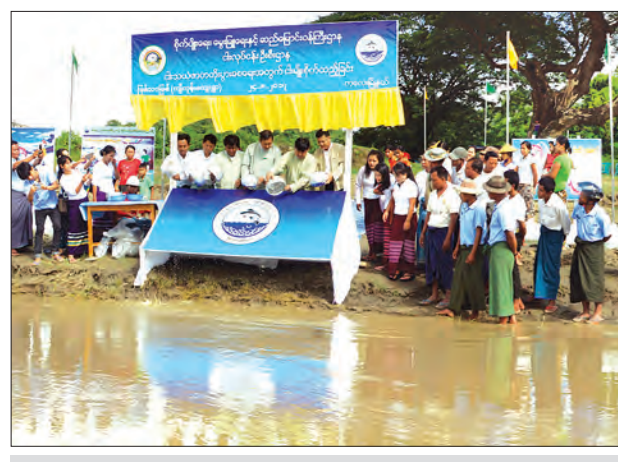
စိုက်ပျိုးရေး၊ မွေးမြူရေးနှင့် ဆည်မြောင်းဝန်ကြီးဌာန ကလေးခရိုင်ငါးလုပ်ငန်းဦးစီး ဌာနမှ သဘာဝရေပြင်အတွင်း လျော့နည်းသွားသောငါးမျိုးများကို တစ်ဖက်တစ်လမ်းမှ ဖြည့်ဆည်းပေးရန်နှင့် ငါးသယ်ဇာတများတိုးပွားလာစေရန် ရည်ရွယ်၍ ဩဂုတ် ၂၄ ရက်က ကျီးကုန်းကျေးရွာအနီးဖြစ်သောမြစ်အတွင်းသို့ ငါးမျိုးစိတ်များ စိုက်ထည့်နေစဉ် ဂျူနိုင်း

ရန်ကုန်မြို့တစ်ဝက်ကမ်းရှိ ဒလမြို့မှ ဧရာဝတီတိုင်းဒေသကြီးအတွင်း ဘိုကလေး မြို့အထိ ကားလမ်းခရီး ၇၉ မိုင်ခန့်ရှိပြီး အဆိုပါကားလမ်းသည် မိုးမကျခင်က ကား လမ်းကောင်းမွန်ခဲ့သော်လည်း ယခုအခါ မိုးလယ်ကာလတွင်တစ်နေ့လျှင်ခရီးသည် တင်ကားကြီး၊ ကားလေးအစီးရေ ၅၀၀ ခန့်နှင့် ကုန်တင်ကား ၇၅ စီးတို့တို့ အသွား အပြန်မောင်းနှင်မှုတို့ကြောင့် ကွမ်းခြံကုန်းမြို့နယ်အတွင်းရှိ တော်ခရမ်းလေး ကျေးရွာ အဝင်မှကျေးရွာအထွက် လေးမိုင်ခန့်မှာ ချိုင့်များစွာဖြင့်ရှောင်တိမ်းမရအောင် ပျက်စီးလျက်ရှိပါသည်။