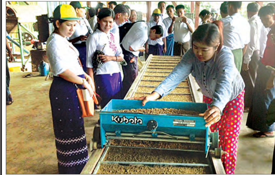
လယ်တော်ကြီးစိုက်ကွင်းတွင် ပျိုးပန်းဖြင့်ပျိုးထောင်ရန် စက်ဖြင့် စပါးမျိုးစေ့ထည့်ပကိုလည်း လေ့လာကြသည်။

ကာဗွန်နေးရှင်းစနစ်ဖြင့် သကြားထုတ်လုပ်နိုင်သည့် နဝင်းသကြားစက်လည်ပတ်ပုံနှင့် ကြိတ်ဝါးနိုင်သော ကြံတန်ချိန်အရေအတွက်များ၊ ကြံစိုက်ပျိုးမှုများကိုလည်း ဒေသခံများ၏ အကူအညီဖြင့် လေ့လာနိုင်ခဲ့သည်။