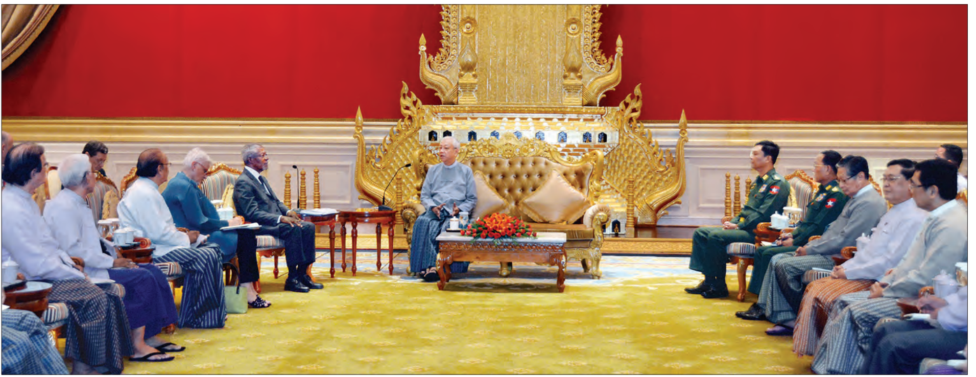
နိုင်ငံတော်သမ္မတ ဦးထင်ကျော် ရခိုင်ပြည်နယ်ဆိုင်ရာ အကြံပေးကော်မရှင်ဥက္ကဋ္ဌ ဒေါက်တာကိုဖီအာနန် ဦးဆောင်သည့်ကော်မရှင်အဖွဲ့ဝင်များအား လက်ခံတွေ့ဆုံစဉ် (သတင်းစဉ်)

နိုင်ငံတကာနှင့် ပြည်တွင်းမှ မိမိတို့နိုင်ငံ တွေ့ကြုံရင်ဆိုင်နေရသော စိန်ခေါ်မှုများနှင့် ပတ်သက်သည့် အခြေအနေအထားကို ကောင်းစွာနားလည်ပြီး ဝိုင်းဝန်းကူညီပံ့ပိုးပေးစေလိုကြောင်း နိုင်ငံတော်သမ္မတ ပြောကြား