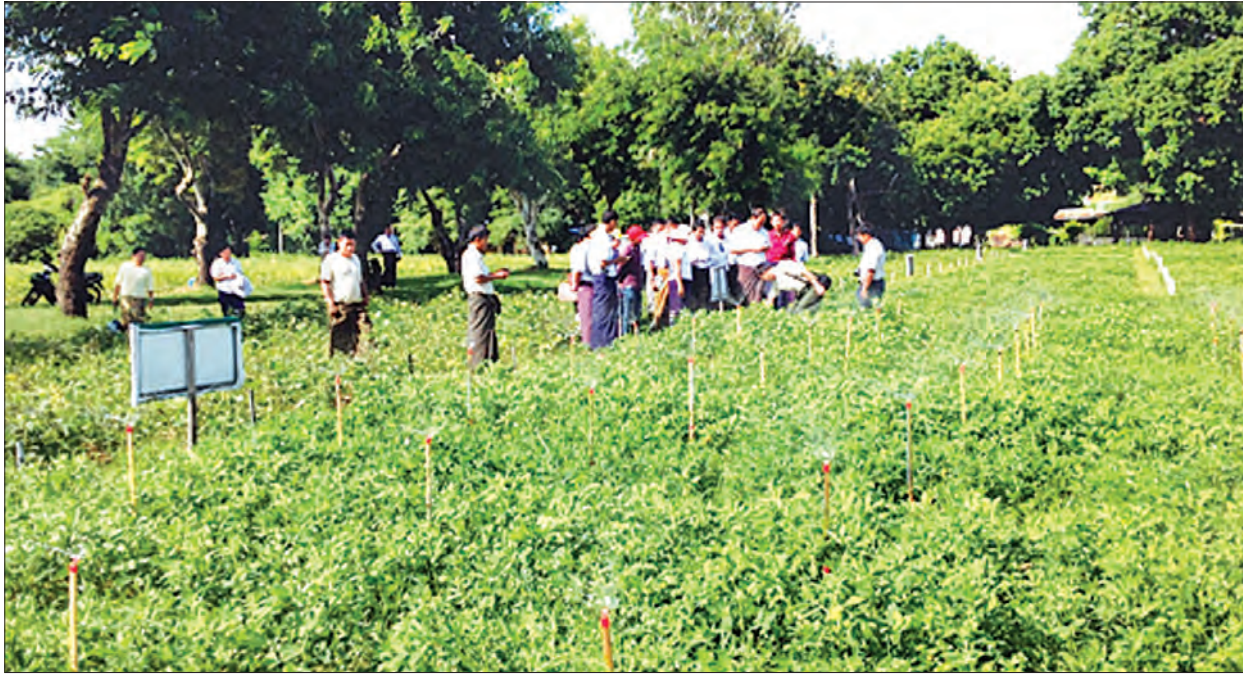
မကွေးမြို့၊ ဆီထွက်သီးနှံ ဝဟိုသုတေသန စိုက်ပျိုးရေး ဖြန့် သီးနှံ မျိုးသစ် စမ်းသပ် စိုက်ပျိုးထားမှု များအား တောင်သူများ လေ့လာနေစဉ်

စာမျက်နှာ ၁၈ မှ ထို့အပြင် မြစ်ရေတင်လုပ်ငန်းများ၊ ပင်မမြောင်းများ၊ လက်တံမြောင်းများနှင့် ဆည်ရေသောက်များတွင် အသုံးပြုရန် ရေစိုက်စက်များအကြောင်း၊ ရေပေးဝေမှုစနစ်နှင့် ရေသိုလောင် နိုင်မှုစနစ်၊ မိုးရာသီတွင် အကျိုးပြုနိုင်သော လယ်စက်အမျိုး အစားများ၊ နွေရာသီတွင် အကျိုးပြုနိုင်သော လယ်စက်များနှင့် ရေရရှိမှုအလိုက် စိုက်ပျိုးသင့်သည့် သီးနှံများအကြောင်းကို ရခိုင်ပြည်နယ်ရှိ တောင်သူများက လေ့လာမှတ်သားခဲ့ကြ ကြောင်း သိရသည်။