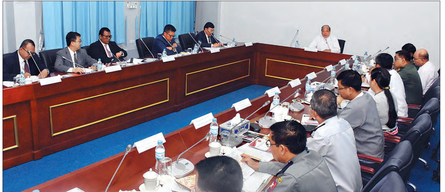
မြန်မာနိုင်ငံနှင့်အင်ဒိုနီးရှားနိုင်ငံတို့အကြား အကြမ်းဖက်မှုတိုက်ဖျက်ရေးဆိုင်ရာ စကားပိုင်းဆွေးနွေးပွဲကျင်းပစဉ် (သတင်းစဉ်)