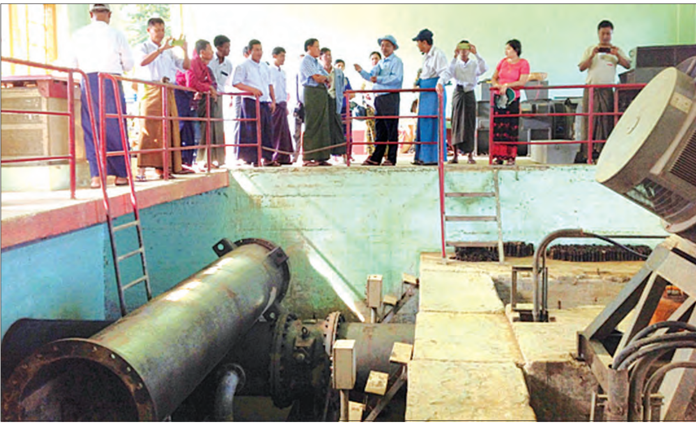
မကွေးတိုင်းဒေသကြီး အောင်လံမြို့နယ် ဒုရပ်ဝိုက်မြစ်ရေတင်လုပ်ငန်းအား လေ့လာကြစဉ်

ရိတ်သိမ်းချိန်လွန်နည်းပညာ ရခိုင်ပြည်နယ်အတွက် မှတ်သားစရာ ရခိုင်ပြည်နယ်စိုက်ပျိုးရေးဦးစီးဌာနမှ တာဝန်ရှိသူများနှင့် ရခိုင်ပြည်နယ်ရှိ တောင်သူများအတွက် ရိတ်သိမ်းချိန်လွန်နည်းပညာနှင့် သီးနှံအရည်အသွေးစစ်ဆေးရေးဆိုင်ရာ ဓာတ်ခွဲခန်းတို့ကို ကြည့်ရှုလေ့လာခွင့်ရရှိသည်မှာ များစွာအကျိုးကျေးဇူးများ ရရှိခဲ့သည်။ ပဲခူးတိုင်းဒေသကြီးသည် စပါးအပါအဝင် သီးနှံများစိုက်ပျိုးထုတ်လုပ်ခြင်းတွင် အဓိကကျသည့် တိုင်းဒေသကြီးတစ်ခုဖြစ်သည့်အတွက် ဂျီတီကာ၏ PROFIA အစီအစဉ်ဖြင့် ဓာတ်ခွဲခန်းအသုံးပြုမှုနှင့် လယ်ယာသုံးစက်ကိရိယာများအကြောင်းကို စနစ်တကျလေ့လာနိုင်ခဲ့