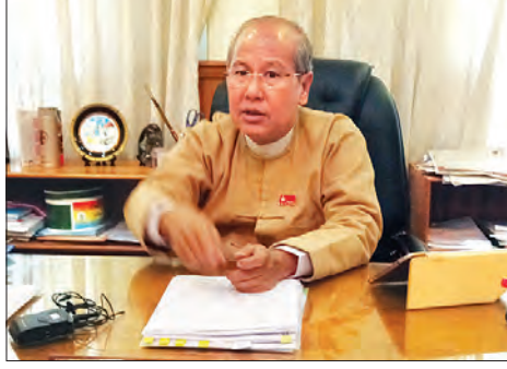
မကွေးတိုင်းဒေသကြီးဝန်ကြီးချုပ် ဒေါက်တာအောင်မိုးညို

တင်ပြခဲ့သည့် အချက် ငါးချက်တွင် မန်းရေနံမြေ ထောက်ရှာပင်ရေခံမြေနှင့် တစ်ဆက်တစ်စပ်တည်းဖြစ်နေသော အလျားမိုင် ၂၀၊ အနံ ၃မိုင်ခန့်ရှိ အလွန်အလားအလာကောင်းမွန်သော ရေနံမြေတစ်ခုကို တွေ့ရှိထားခြင်းကိစ္စ၊ မြေသိမ်းထားပြီး စီမံကိန်းများ အကောင်အထည်ဖော်ခြင်း၊ အကောင်အထည်ဖော်သော်လည်း မအောင်မြင်ခြင်းတို့နှင့်သက်ဆိုင်သည့် သိမ်းမြေများ အမြန်ဆုံးပြန်ပေးနိုင်ရေးကိစ္စ၊ ယခင်တိုင်းအစိုးရလက်ထက်မှ ရန်ရှိပြီး ပြန်လည်ရရှိခဲ့သော ရေနံလက်ယက်တွင်းတစ်ခု လုပ်ငန်းရန်ပုံငွေကျပ်သန်းပေါင်း ၃၂၇၀ အား မည်သည့်ကဏ္ဍများတွင် သုံးစွဲသွားရန် လျာထားခြင်းကိစ္စ၊ ကျေးရွာအနွယ်တော်တော်ဆိုင်ကယ်နှင့်ကားများ ရှိနေသည့်အပြင်