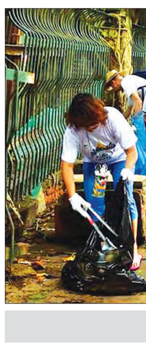
စံနမူနာပြု နိုင်ငံကြီးသားပီသမှု

ထပ်မံဆောင်ရွက်သွားမည်ဖြစ်သည်။ အဆိုပါ Clean Yangon Campaign တွင် ပတ်ဝန်းကျင်ထိန်းသိမ်းရေးနှင့် သန့်ရှင်းရေးဌာနနှင့်အတူ မင်္ဂလာပရိတ်တ Clean Yangon က ဦးဆောင်ကာ စုစုပေါင်း ပရိတ်တအဖွဲ့ ၄၀ ဝန်းကျင် ပါဝင်လှုပ်ရှားကြမည်ဖြစ်ပြီး ယင်းနေ့ မွန်းလွဲ ၂ နာရီတွင် ကမာရွတ်မြို့နယ် လှည်းတန်း တက္ကသိုလ်ရိပ်သာလမ်း၌ ရှိသော တက္ကသိုလ်ဓမ္မာရုံရှေ့တွင် စုရပ်အဖြစ် ထားရှိသွားမည်ဖြစ်သည်။ လမ်း