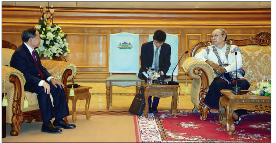
အမျိုးသားလွှတ်တော်ဥက္ကဋ္ဌ မန်းဝင်းခိုင်သည် တရုတ်ပြည်သူ့သမ္မတနိုင်ငံ၊ နိုင်ငံရေးအတိုင်ပင်ခံကွန်ဂရက်၊ နိုင်ငံတကာရေးရာကော်မတီ ဒုတိယဥက္ကဋ္ဌ H.E. Mr. Yuan Guiren အား လက်ခံတွေ့ဆုံစဉ် (သတင်းစဉ်)