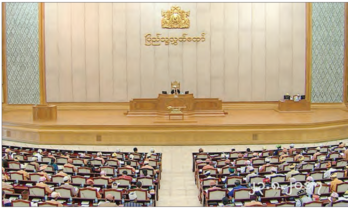
ဒုတိယအကြိမ်ပြည်သူ့လွှတ်တော် ပဌမပုံမှန်အစည်းအဝေး ၄၉ ရက်မြောက်နေ့ကျင်းပစဉ်

လားရှိုးမြို့ အမှတ်(၅)ရပ်ကွက်ရှိ ရေကန် လမ်းနှင့် ခိုင်ရွှေဝါလမ်းဆုံတွင် မီးပွင့်တပ်ဆင် မည်ဆိုပါက အဆိုပါနေရာသည် လမ်းအနေ