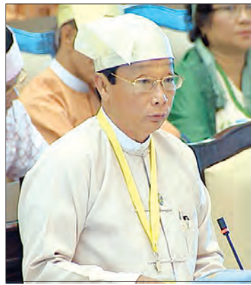
ဦးလှကျော် (ဒုတိယဝန်ကြီး၊ စိုက်ပျိုးရေး၊ မွေးမြူရေးနှင့် ဆည်မြောင်းဝန်ကြီးဌာန)

ရန်ကုန်တိုင်းဒေသကြီး မဲဆန္ဒနယ်အမှတ် (၅)မှ ဦးဘမျိုးသိန်း၏ မြန်မာနိုင်ငံရှိ လယ်ထွန် စက်ကြီးများကို သက်သာသောနှုန်းထားဖြင့် ယာဉ်မှတ်ပုံတင် စာရင်းသွင်းပြီး ယာဉ်နံပါတ်ထုတ် ပေးရန် အစီအစဉ် ရှိ၊ မရှိ မေးခွန်းနှင့်စပ်လျဉ်း ၍ စိုက်ပျိုးရေး၊ မွေးမြူရေးနှင့် ဆည်မြောင်း ဝန်ကြီးဌာန ဒုတိယဝန်ကြီး ဦးလှကျော်က လယ်ယာကဏ္ဍ စိုက်ပျိုးထုတ်လုပ်မှု တိုးတက်ရန် အတွက် နိုင်ငံပိုင်စီးပွားရေးအဖွဲ့အစည်းများနှင့် ပုဂ္ဂလိက ပို့ကုန်သွင်းကုန် လုပ်ငန်းရှင်များက ပြည်ပမှ မြန်မာနိုင်ငံအတွင်းသို့ တင်သွင်းလာ သည့် ဓာတ်မြေဩဇာ၊ လယ်ယာသုံးကိရိယာ များ၊ လယ်ယာသုံးစက်ပစ္စည်းများ၊ ပိုးသတ်ဆေး များအား သွင်းကုန်လိုင်စင်ကြေး ကင်းလွတ်ခွင့် ပြုကြောင်း စီးပွားရေးနှင့် ကူးသန်းရောင်းဝယ် ရေးဝန်ကြီးဌာနမှ ထုတ်ပြန်ထားပါကြောင်း၊ ထို့အတူ ပို့ဆောင်ရေးနှင့် ဆက်သွယ်ရေး