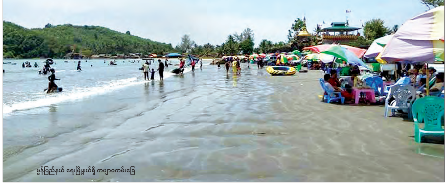
မွန်ပြည်နယ် ရေးမြို့နယ်ရှိ ကဗျာဝကမ်းခြေ