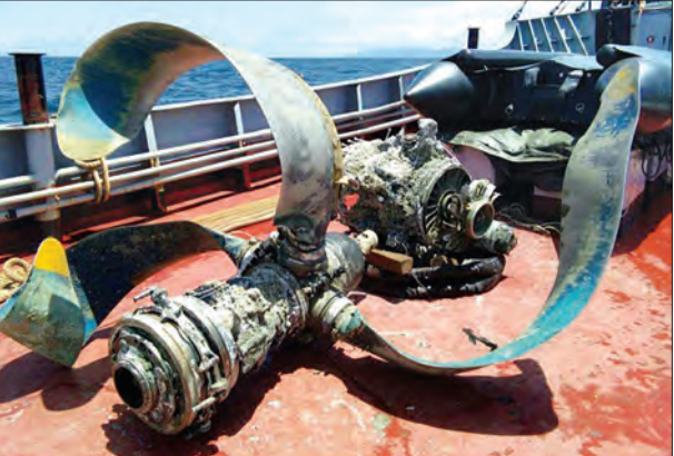
အပါအဝင် လေယာဉ်အစိတ်အပိုင်း ခွဲကြောင်း သတင်းရရှိသည်။ များကို ထပ်မံရှာဖွေဆယ်ယူရရှိ (သတင်းစဉ်)

နေပြည်တော် ဩဂုတ် ၂၂ ပျက်ကျ Y-8 လေယာဉ်၏ ကျန်ရှိ သေးသည့် လေယာဉ်အစိတ်အပိုင်း များအား တပ်မတော်(ရေ)မှ စစ်ရေယာဉ် များနှင့် ဒေသခံငါးဖမ်းစက်လှေများ ပူးပေါင်း၍ ရှာဖွေရေးလုပ်ငန်းများ ဆက်လက်လုပ်ဆောင်ခဲ့ရာ ယနေ့ ညနေပိုင်းတွင် ဆိုနာစနစ်ဖြင့် ရှာဖွေ ရရှိသည့် ပုံရိပ်များအပေါ် မူတည်၍ လေယာဉ်အခြားပိုင်း ရှာဖွေတွေ့ရှိခဲ့ သည့် နေရာအနီးတစ်ဝိုက်၌ ဒေသခံ ငါးဖမ်းစက်လှေ သုံးစင်းက ငါးဖမ်းပိုက် များဖြင့် တရွတ်ဆွဲရာ ရေယာဉ် အင်ဂျင်တစ်လုံးနှင့် ပန်ကာရွက်သုံးခု များကို ထပ်မံရှာဖွေဆယ်ယူရရှိ ခဲ့ကြောင်း သတင်းရရှိသည်။ (သတင်းစဉ်)