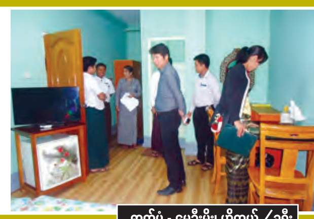
ဓာတ်ပုံ - မေဦးမိုး၊ ဟိုတယ် / ခရီး