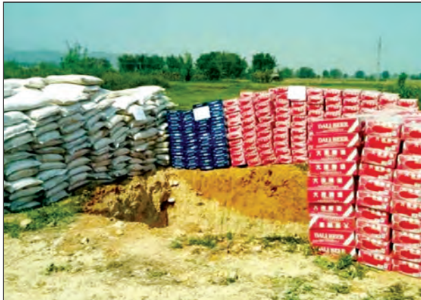
ဖမ်းမိထားသော အကောက်ခွန်မဲ့ တရားမဝင်ကုန်ပစ္စည်းများ

မူဆယ် ၁၀၅ မိုင် ကုန်သွယ်ရေးဇုန် ပြင်ပရှိ ရှောင်ကွင်းလမ်းများအပါအဝင် နေရာအနှံ့အပြားတွင် နေ့/ညအချိန်မရွေး တာဝန်များဖြင့် သွားလာလှုပ်ရှား စစ်ဆေးဖမ်းဆီးမှုများကို တာဝန်ယူဆောင်ရွက်နေရသော တာဝန်ရှိသူများအနေဖြင့် လုံခြုံရေးအသိ၊ သတိများ ရှိနေကြရမည်သာဖြစ်ပေသည်။