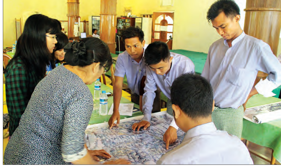
၈-၉-၂၀၁၆ ရက်က ညောင်ဦးမြို့နယ်၌ စီမံကိန်းအဆင့် တိရစ္ဆာန်ကောင်ရေစာရင်းရှေ့ပြေးကောက်ယူရေး ဆရာဖြစ်သင်တန်း သင်ကြားနေမှုကို တွေ့ရစဉ်

“ဒီလိုစာရင်းကောက်ယူနိုင်ဖို့အတွက် အရင်ဆုံးသင်တန်းတွေ ပို့ချပေးသွားမှာဖြစ်ပါတယ်။ ဒီလ ၁၀ ရက်ကစပြီး နေပြည်တော်မှာ ဆရာဖြစ်သင်တန်းတွေ ပို့ချပေးသွားမှာဖြစ်ပါတယ်။ ဒီသင်တန်းဆရာတွေကတစ်ဆင့် တိုင်းဒေသကြီး၊