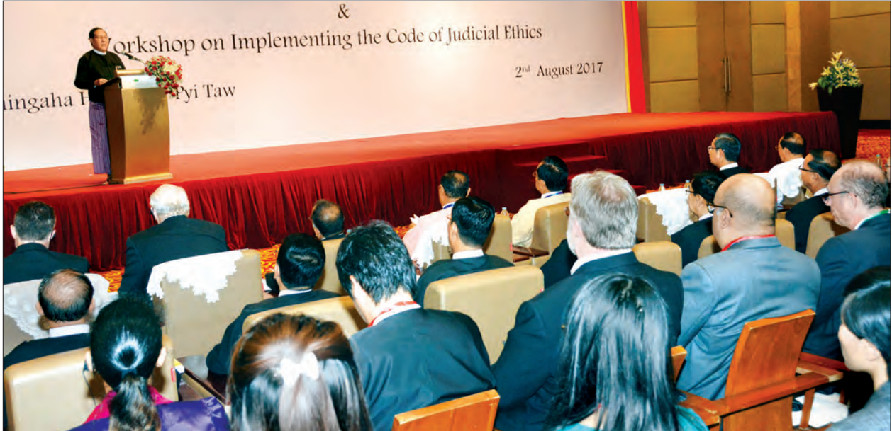
ပြည်ထောင်စုတရားသူကြီးချုပ် ဦးထွန်းထွန်းဦး မြန်မာနိုင်ငံတရားသူကြီးများအတွက် တရားစီရင်ရေးကျင့်ဝတ်မိတ်ဆက်ထုတ်ပြန်သည့်အခမ်းအနားတွင် အမှာစကား ပြောကြားစဉ်

ထို့ပြင် တရားစီရင်ရေးကျင့်ဝတ်တွင် ပါဝင်သော အခြေခံမူများသည် နိုင်ငံတော်၏ အုပ်ချုပ်မှုအာဏာပိုင်နှင့် ဥပဒေပြုအာဏာပိုင်များ ရှေ့နေများနှင့် ပြည်သူလူထုအား တရားစီရင်ရေးကဏ္ဍ၏ လုပ်ဆောင်ချက်များကို တိုင်းတာဆန်းစစ်နိုင်ရန် စံတစ်ခု အနေဖြင့် ရည်ရွယ်ရေးဆွဲခြင်းလည်းဖြစ်ပါကြောင်း၊ တရားစီရင်ရေးကျင့်ဝတ်ကို