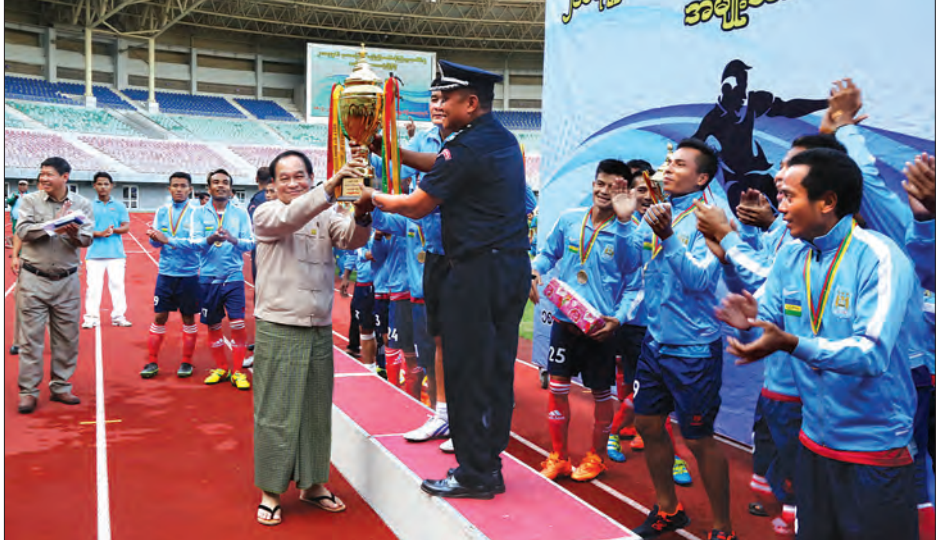
မြန်မာနိုင်ငံဘောလုံးအဖွဲ့ချုပ်မှ တာဝန်ရှိသူများ၊ ဝန်ကြီးဌာနအသင်းသီးသီးမှ ဝန်ထမ်းများ၊ အားကစားဝါသနာရှင် ပရိသတ်များ တက်ရောက်ကြည့်ရှုအားပေးသည်။ ဝိုင်းလှည့်ပွဲစဉ်အဖြစ် ပြည်ထောင်စုဝန်ကြီးဌာန ဘောလုံးအသင်းနှင့် လူမှုဝန်ထမ်း၊ ကယ်ဆယ်ရေးနှင့် ပြန်လည်နေရာချထားရေးဝန်ကြီးဌာန ဘောလုံးအသင်းတို့ ယှဉ်ပြိုင်ကစားကြရာ ပြည်ထောင်စုဝန်ကြီးဌာန ဘောလုံးအသင်းက သုံးဂိုး၊ နှစ်ဂိုးဖြင့် အနိုင်ရရှိခဲ့သည်။ ပြိုင်ပွဲအပြီး ဆုပေးပွဲအခမ်းအနားကို ဆက်လက်ကျင်းပရာ ပညာရေးဝန်ကြီးဌာန ပြည်ထောင်စုဝန်ကြီး ဒေါက်တာမျိုးသိမ်းကြီးက ပွဲစဉ်တစ်လျှောက် အကောင်းဆုံးဂိုးသမားဆုရ ကျန်းမာရေးနှင့် အားကစားဝန်ကြီးဌာန ဘောလုံးအသင်းမှ နေဇင်ဟိန်း ကျောနံပါတ် (၂၀) အား ငွေသားဆု ငါးသောင်းကိုလည်းကောင်း၊ အကောင်းဆုံး နောက်တန်းဆုရ လူမှုဝန်ထမ်း၊ ကယ်ဆယ်ရေးနှင့် ပြန်လည်နေရာချထားရေးဝန်ကြီးဌာန ဘောလုံးအသင်းမှ ဟိန်းဆွေ ကျောနံပါတ် (၁၇)

ဆက်လက်၍ ညနေ ၃ နာရီတွင် ဝဏ္ဏသိဒ္ဓိဘောလုံးကွင်း၌ ဝိုင်းလှည့်နှင့် ဆုချီးမြှင့်ပွဲအခမ်းအနားကို ပြည်ထောင်စုဝန်ကြီးဌာန ပြည်ထောင်စုဝန်ကြီး ဒုတိယ ဝိုင်းချုပ်ကြီးကျော်ဆွေ၊ ကျန်းမာရေးနှင့် အားကစားဝန်ကြီးဌာန ပြည်ထောင်စုဝန်ကြီး ဒေါက်တာမြင့်ထွေး၊ ပညာရေးဝန်ကြီးဌာန ပြည်ထောင်စုဝန်ကြီး ဒေါက်တာမျိုးသိမ်းကြီး၊ လူမှုဝန်ထမ်းကယ်ဆယ်ရေးနှင့် ပြန်လည်နေရာချထားရေးဝန်ကြီးဌာန ပြည်ထောင်စုဝန်ကြီး ဒေါက်တာဝင်းမြတ်အေး၊ ကျန်းမာရေးနှင့် အားကစားဝန်ကြီးဌာနမှ တာဝန်ရှိသူများ