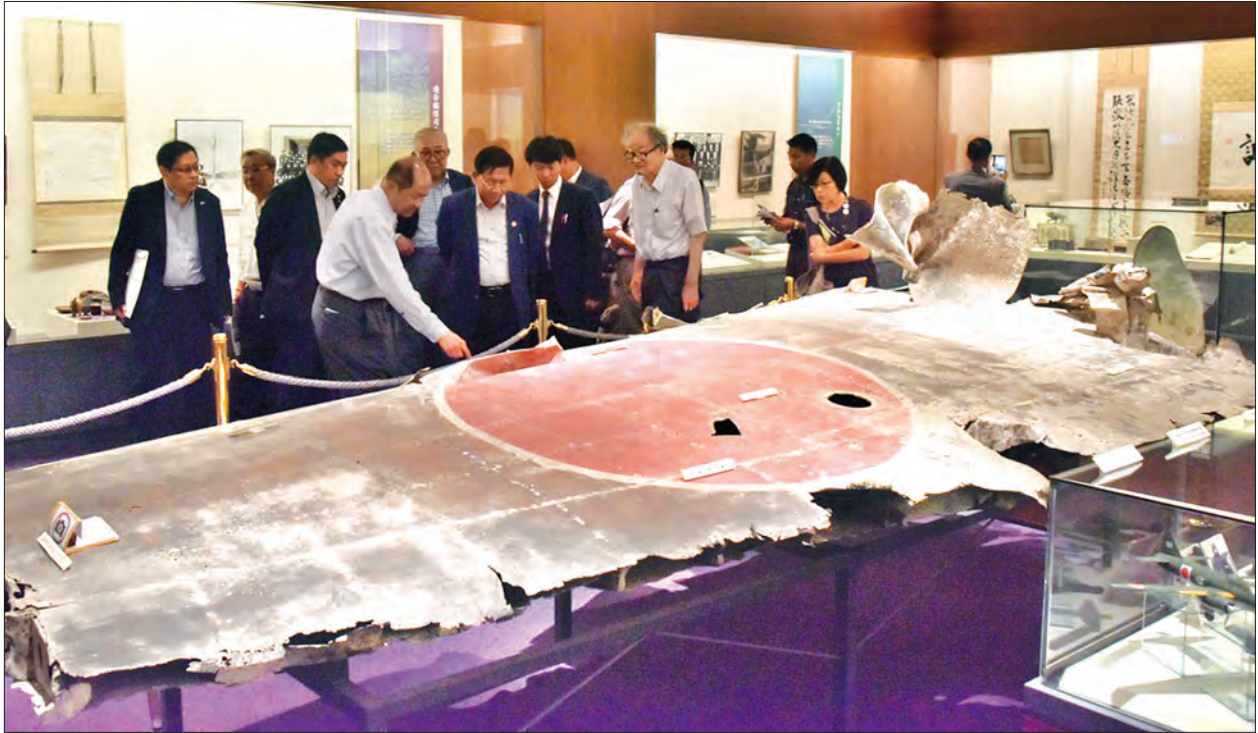
များအား လိုက်လံကြည့်ရှုလေ့လာကြရာ တာဝန်ရှိသူများက ရှင်းလင်းပြသကြသည်။ အဆိုပါပြတိုက်တွင် ရေတပ်ဝိုင်းချုပ်ကြီး Yamamoto Isoroku ၏ အသုံးအဆောင်ပစ္စည်းများနှင့် ဓာတ်ပုံမှတ်တမ်းများ၊ ၎င်း၏လေယာဉ်ပစ်ချစ်ရချိန်တွင် ကျန်ရှိသော အတောင်ပံတစ်ခု၊ ဝိုင်းချုပ်ကြီးလိုက်ပါစီးနင်းခဲ့သော ထိုင်ခုံနှင့် သမိုင်းမှတ်တမ်းစာအုပ်များအား ခင်းကျင်းပြသထားကြောင်း သတင်းရရှိသည်။ (သတင်းစဉ်)

ဆက်လက်၍ တပ်မတော်ကာကွယ်ရေးဦးစီးချုပ်နှင့် အဖွဲ့ဝင်များသည် ဒုတိယ ကမ္ဘာစစ်အတွင်း ထင်ရှားခဲ့သော ရေတပ်ဝိုင်းချုပ်ကြီး Yamamoto Isoroku ၏ အထိမ်းအမှတ်ပြတိုက်သို့ရောက်ရှိကြပြီး ပြတိုက်အတွင်းခင်းကျင်းပြသထားသည့် ဝိုင်းချုပ်ကြီး Yamamoto Isoroku ၏ သမိုင်းကြောင်းနှင့် အသုံးအဆောင်ပစ္စည်းများအား လိုက်လံကြည့်ရှုလေ့လာကြရာ တာဝန်ရှိသူများက ရှင်းလင်းပြသကြသည်။