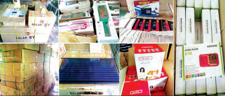
တရားဝင်စာရွက်စာတမ်း အထောက်အထားတစ်စုံတစ်ရာ တင်ပြနိုင်ခြင်းမရှိသော၊ Syh၊ Solar၊ Pan Cooker၊ FM Radio၊ Radio (sony)၊ Multifunction Wireless Speaker၊ Selfie Stick၊ Electric kettle၊ Rice Cooker၊ ကျောပိုးအိတ်၊ Gold Hills (Nut)၊ Sunny Instant Custard Mix၊ Chicken Floss နှင့် အဝတ်အထည်မျိုးစုံကို တွေ့ရစဉ်