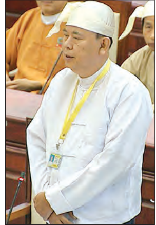
ဒုတိယဝန်ကြီး ဦးဝင်းမော်ထွန်း

ထို့ပြင် နန်းယွန်းမဲဆန္ဒနယ်မှ ဦးဝင်းလှ၊ တမူးမဲဆန္ဒနယ်မှ ဦးနိုင်နိုင်ဝင်း၊ ဆီဆိုင် မဲဆန္ဒနယ်မှ ဦးခွန်သန်းထူးနှင့် လှိုင်သာယာမဲဆန္ဒနယ်မှ ဦးဝင်းမင်းတို့၏ ပန်ဆောင်မြို့ပေါ်မှ ကတ္တရာခင်းခြင်း လုပ်ငန်းအား သတ်မှတ်ဘဏ္ဍာနှစ်အတွင်း ပြီးစီးအောင် ဆောင်ရွက်ခြင်းမရှိသော ကုမ္ပဏီအား အရေးယူပေးရေး၊ တမူးမြို့နယ် မြန်မာ-အိန္ဒိယနယ်စပ်ကုန်သွယ်ရေးစုန် အကောင်အထည်ဖော်ဆောင်ရွက်ပေးရေး၊ ထီးအုံစောက်ရွာအတွက် သင့်လျော်သော ကျောင်းဆောင်သစ်တစ်ဆောင် ဆောက်လုပ်ပေး