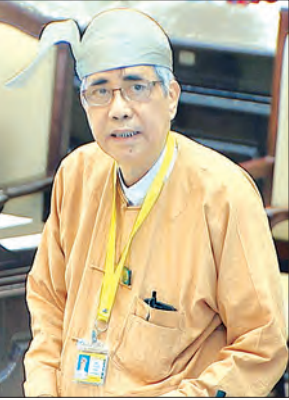
ဒုတိယဝန်ကြီး ဦးကျော်မျိုး

တည်ဆောက်ရေးလုပ်ငန်းများအား ၂၀၁၈ ခုနှစ် မတ်လအတွင်း ပြီးစီးအောင် တွန်းအားပေး ဆောင်ရွက်လျက်ရှိ သော်လည်း လှိုင်သာယာဓာတ်အားခွဲ