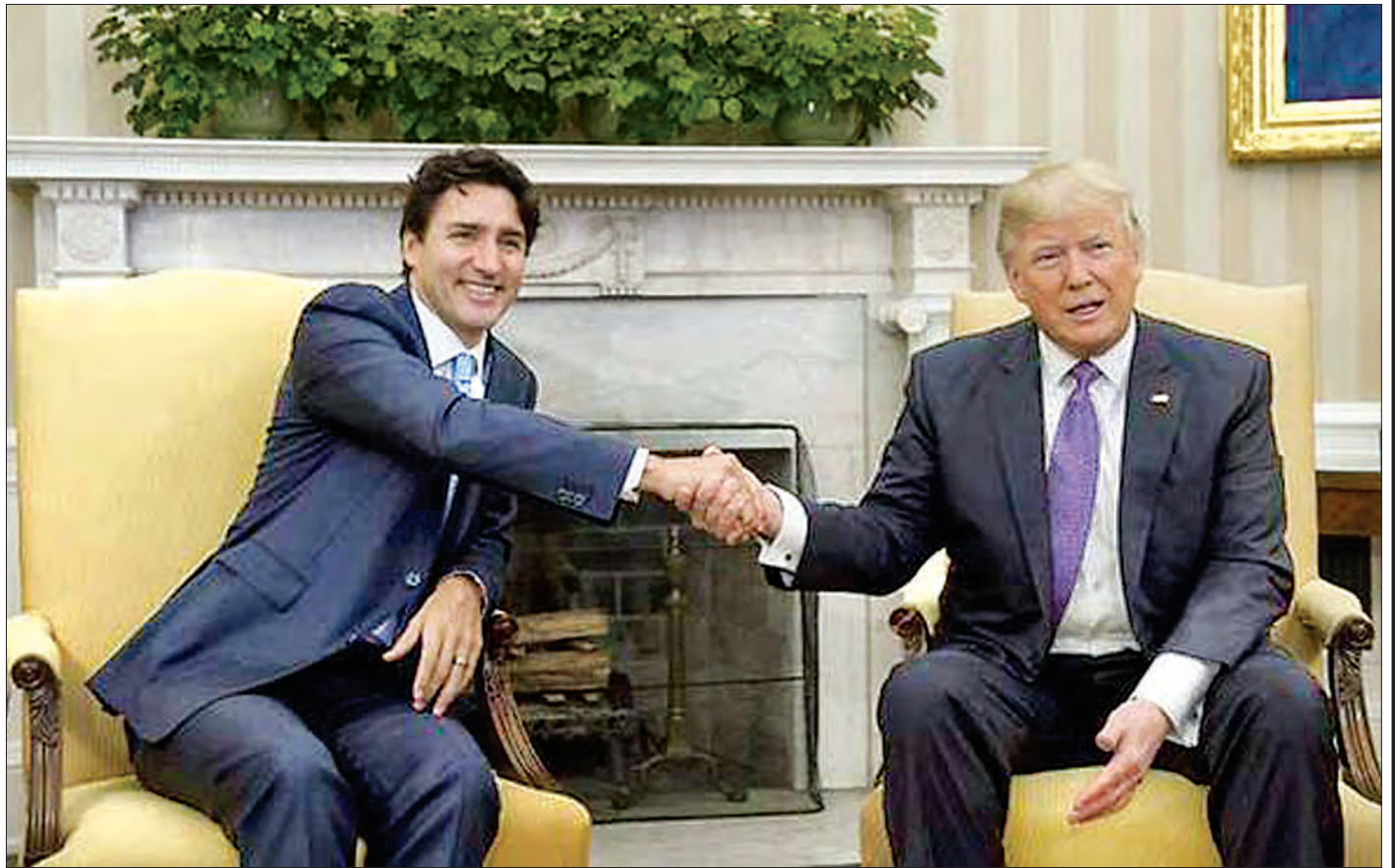
သမ္မတထရန်နဲ့ ပန်သင့်ခဲ့ပါတယ်။

လိမ္မာပါးနပ်စွာ ကနေဒါဝန်ကြီးချုပ် ထရူးဒီယူ ပြည်တွင်းမှာ ခက်ခဲတဲ့ အခြေအနေတွေနဲ့ ရင်ဆိုင်နေရပါတယ်။ သို့သော်လည်း သူ့ရဲ့ အစိုးရဟာ အဆိုပါရှုပ်ထွေးတဲ့ အခြေအနေတွေကို ကောင်းကောင်း လိမ္မာပါးနပ်စွာ ကိုင်တွယ်နိုင်ခဲ့ပြီး