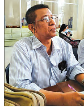
ဆရာဇော်ဝိတ်