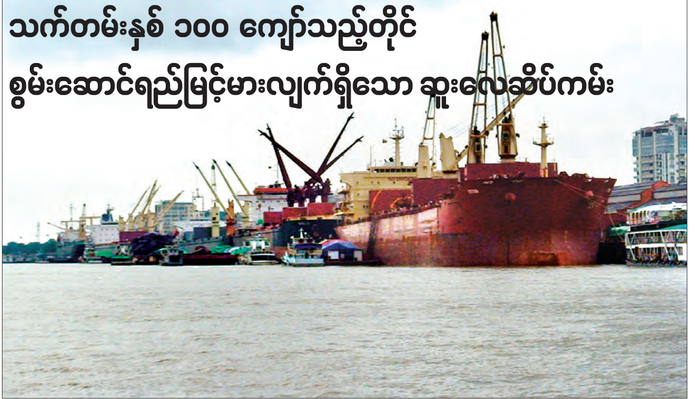
ဆူးလေဆိပ်ကမ်းတွင် ဇူလိုင် ၂၉ ရက်က ဆန်တင်သင်္ဘောများ အပြည့်ဆိုက်ကပ်၍ ပြည်ပဆန်တင်ပို့မှု ဆောင်ရွက်နေစဉ်