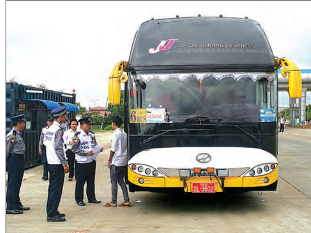
နေပြည်တော် ဩဂုတ် ၂ မြန်မာနိုင်ငံရဲတပ်ဖွဲ့ အမြန်လမ်းမကြီး ရဲတပ်ဖွဲ့ရှိ တပ်ဖွဲ့ဝင်များက အမျိုးသားယာဉ် အန္တရာယ်၊ လမ်းအန္တရာယ်ကင်းရှင်းရေးကောင်စီ၏ အမြန်လမ်းမကြီးအပေါ် မောင်းနှင် သွားလာသည့် ကိုယ်ပိုင်ယာဉ်ဝယ်ယူမှုနှင့် Express ယာဉ်များအား သတ်မှတ်ကိလိုစတေကာများ ကပ်ခြင်း

မောင်းနှင်ခွင့်ပြုရန် မော်တော်ယာဉ်များအား စတေကာကပ်ခြင်းနှင့် အသိပညာပေး ကွင်းဆင်းဆောင်ရွက်မှုကို ဩဂုတ် ၁ ရက်က အမြန်လမ်းမကြီး (နေပြည်တော်) တိုးဂိတ်ပြုလုပ်ခဲ့သည်။