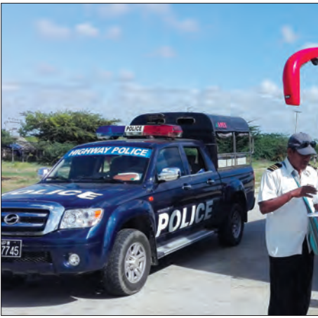
ရဲတပ်(ပြန်/ဆက်) မိုးပိုလာနိုင် နေပြည်တော် ဩဂုတ် ၂ နေပြည်တော်နှင့် ရန်ကုန်မြို့တို့အနီးတစ်ဝိုက်တွင် ယနေ့ မိုးတစ်ကြိမ်၊ နှစ်ကြိမ် ထပ်ချွန်ရွာမည်။ မန္တလေးမြို့နှင့်အနီးတစ်ဝိုက်တွင် ယနေ့ နေရာကွက်ကျား မိုးထပ်ချွန်ရွာမည်။ မနက်ဖြန်အတွက် ခန့်မှန်းချက်မှာ ပဲခူးတိုင်းဒေသကြီး၊ တနင်္သာရီတိုင်းဒေသကြီး၊ ကရင်ပြည်နယ်နှင့် မွန်ပြည်နယ်တို့တွင် မိုးပိုလာမည်။ (မိုး/လေ)

ဟိုက်ဂျက်မော်တော်ယာဉ်များနှင့် သုံးတန်းနှင့်အထက် ကုန်တင်ယာဉ်များမှာ တစ်နာရီလျှင် ၆၀ ကီလိုမီတာနှုန်းဖြင့်သာ မောင်းနှင်ကြရန်၊ လူစီးယာဉ်ငယ်များဖြစ်ကြသည့် ဆလွန်း၊ စတေရှင်ဝက်ဂွန်း၊ ဒဗယ်ကပ်မော်တော်ယာဉ်များသည် တစ်နာရီလျှင် ၁၀၀ ကီလိုမီတာနှုန်းအထိသာ မောင်းနှင်ကြရန် စသည်တို့ကို ယာဉ်မောင်းသူများအား အသိပေး ဟောပြောကြပြီး ယာဉ်များ၏ရှေ့လောကမှန်တွင် အသိပညာပေးစတစ်ကာများ ကပ်ပေးခဲ့သည်။