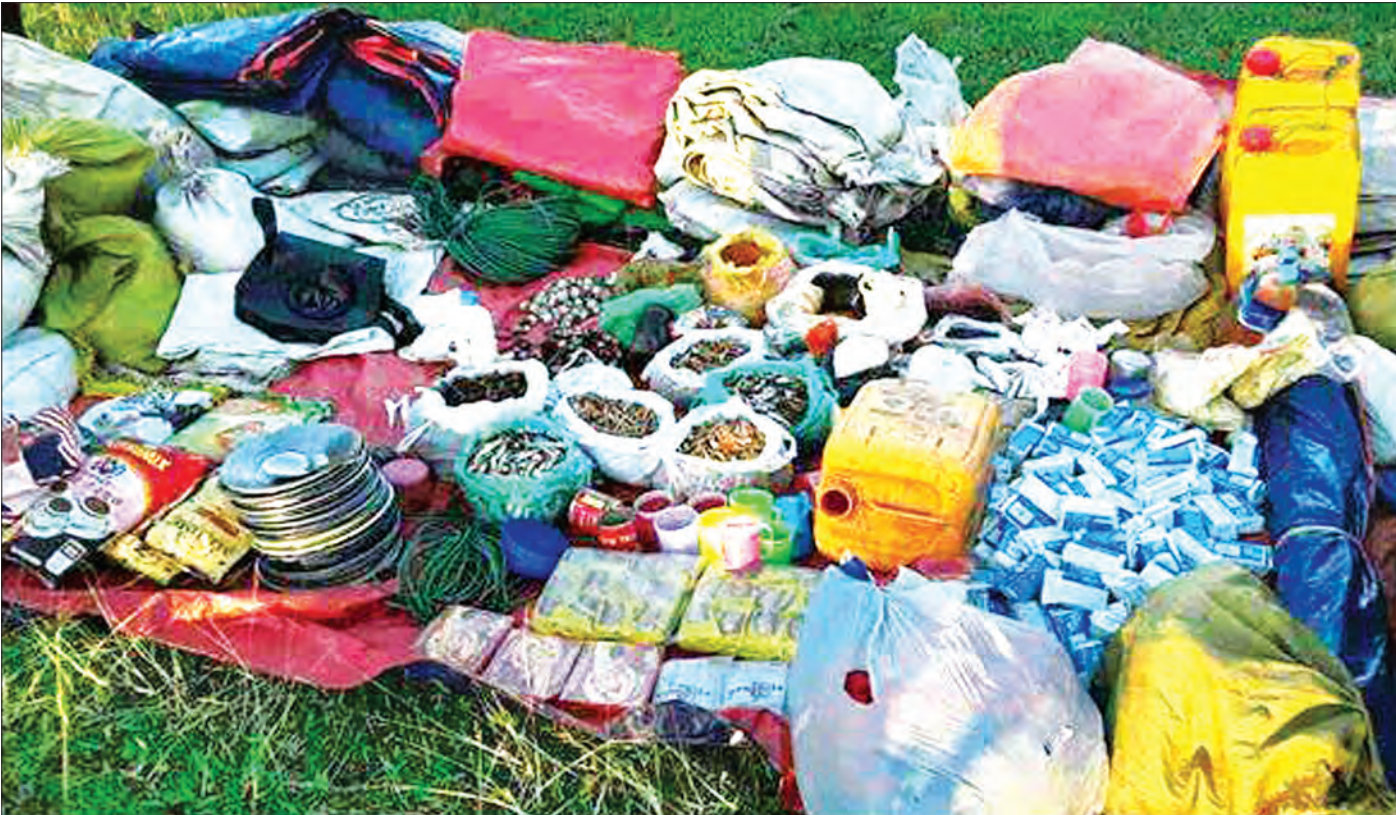
သိမ်းဆည်းရမိသည့်ပစ္စည်းများကို တွေ့ရစဉ်