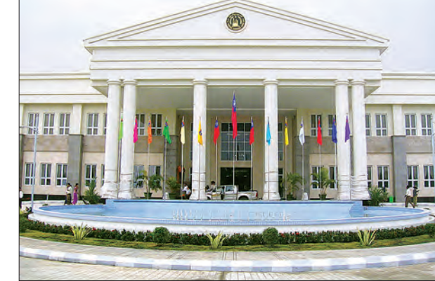
ဆန္ဒရှိသည့် ငွေပမာဏကို အလီလီထုတ်ယူနိုင်သည့်အပြင် ခရီးသွားနေစဉ်ဖြစ်ပါက မိမိရောက်ရှိရာနေရာဒေသရှိ နီးစပ်ရာ မည်သည့်မြန်မာ့စီးပွားရေးဘဏ်ခွဲ (သို့မဟုတ်) MMM မှ ခန့်အပ်ထားသော ပြင်ပအေးဂျင့်တို့တွင် အလွယ်တကူထုတ်ယူနိုင်မည် ဖြစ်သည်။ (သတင်းစဉ်)

နေပြည်တော် ဇူလိုင် ၃၁ မြန်မာ့စီးပွားရေးဘဏ်သည် မြန်မာ့စီးပွားရေးကော်ပိုရေးရှင်း၊ အင်းဝဘဏ်လီမိတက်၊ Myanmar Mobile Money (MMM) နှင့် အကျိုးတူပူးပေါင်းကာ Mobile Payment ဝန်ဆောင်မှုလုပ်ငန်းကို ချင်းပြည်နယ်မှအပ နေပြည်တော်နှင့် ကျန် တိုင်းဒေသကြီး၊ ပြည်နယ်များရှိ မြန်မာ့စီးပွားရေးဘဏ်၊ ခရိုင်နှင့် မြို့နယ်ဘဏ်ခွဲ (၂၆၃) ဘဏ်တွင် Cash in ငွေသားလက်ခံပေးခြင်း၊ Cash out ငွေသား ထုတ်ပေးခြင်း၊ Top-up တယ်လီဖုန်းပြောဆိုခ ဖြည့်တင်းပေးခြင်း၊ Pension Payment အငြိမ်းစား လစာထုတ်ပေးခြင်းတို့ကို အေးဂျင့်အဖြစ် ဆောင်ရွက်ပေးလျက်ရှိသည်။ MPT, MECTel Sim Card အသုံးပြုသူ ပြည်သူများနှင့် အငြိမ်းစားများ သည် မိုဘိုင်းဖုန်းအသုံးပြု၍ မိုဘိုင်းဝန်ဆောင်မှုစနစ် ချိတ်ဆက်ခြင်းဖြင့် မြန်မာ့ စီးပွားရေးဘဏ်၊ ဘဏ်ခွဲ (၂၆၃) ဘဏ်ရှိ Point of Sale (POS) စက်တွင် လည်းကောင်း၊ MMM က ခန့်အပ်ထားသော ပြင်ပအေးဂျင့်များရှိ POS စက်တွင် လည်းကောင်း ထုတ်ယူနိုင်ပြီး ကိုယ်တိုင်အငြိမ်းစားလစာဖြစ်ပါက မြောက်လတစ်ကြိမ်၊ မိသားစုအငြိမ်းစားလစာဖြစ်ပါက သုံးလတစ်ကြိမ် လူတွေ့စစ်ဆေးခံရန် လိုအပ်ပြီး မိမိတို့၏ မိုဘိုင်းဖုန်းအတွင်းသို့ အငြိမ်းစားလစာထည့်သွင်းပေးရန် Standing Instruction ပေးထားခြင်းဖြင့် ဘဏ်သို့ အကြိမ်ကြိမ်လာရောက်ရန်မလိုဘဲ အငြိမ်းစား