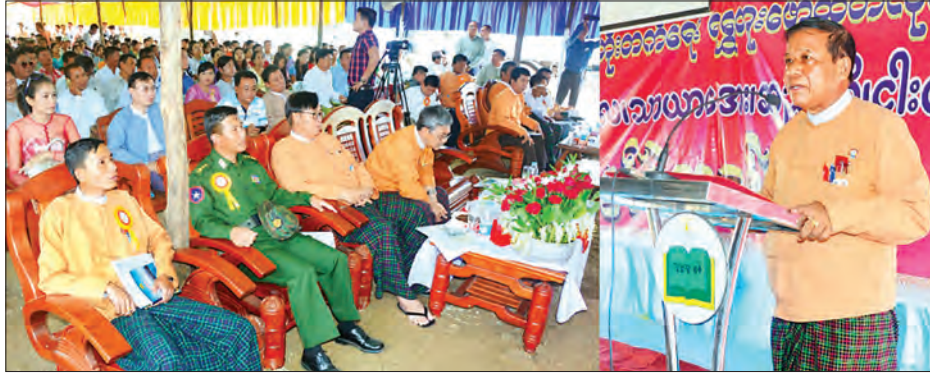
ကြေးမုံနှင့် အစိုးရနှင့်ပြည်သူ့ပေါင်းဆောင်ရွက်ဖို့ လိုကြောင်း ပြောကြားခဲ့သည်။

အဆိုပါလမ်းသည် ပျဉ်းမတော-ကံရိုးကြီး- ဓမ္မပါလ- သာယာအေး- ဆည်တိုင်းတန်းစုကျေးရွာများကို ဆက်သွယ် ထားခြင်းဖြစ်ပြီး အမျိုးသားကြီးပွားတိုးတက်ရေးကုမ္ပဏီက အဆင့်မြှင့်တင်ခင်း၍ လျှို့ဝှက်ခြင်းကြောင်း သိရသည်။ ဆက်လက်၍ ဝန်ကြီးချုပ်က ကုမ္ပဏီအနေဖြင့် လမ်း အဆင့်မြှင့်တင်ခင်းပေးသည့်အတွက် ကျေးဇူးတင်ရှိကြောင်းနှင့် လမ်းကို ရေရှည်တည်တံ့ရေးအတွက် ပိုင်းဝန်းဆောင်ရွက်