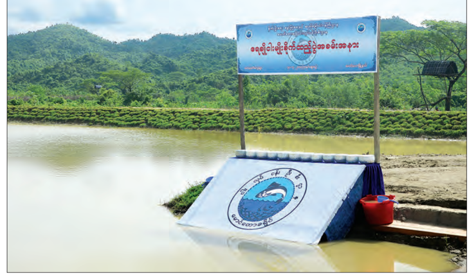
မောရဝတီ ကျေးရွာတွင် တူးဖော်ထားသည့် ငါးမွေးမြူရေးကန်

ယခု တူးဖော်ပေးထားသည့် ငါးမွေးမြူရေးကန်တစ်ကန်လျှင် အကြမ်းအားဖြင့် ငွေကျပ် သိန်း ၆၀ ကုန်ကျကြောင်း၊ ဤဒေသတွင် လူဦးရေနှင့် ဈေးကွက်တည်ရှိသည့်အတွက် နောက်ပိုင်းတွင် ပုဂ္ဂလိကတစ်ပိုင်တစ်နိုင် ငါးမွေးမြူရေးလုပ်ငန်းများ ဖွံ့ဖြိုးတိုးတက်လာမည်ဟု ယုံကြည်ပါကြောင်း ၎င်းက ဆက်လက်ပြောကြားသည်။