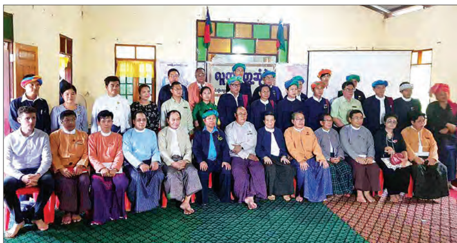
နိုင်ငံတော်အစိုးရနှင့် တိုင်းရင်းသားလက်နက်ကိုင်အဖွဲ့အစည်းများမှ နှစ်ဖက်ကိုယ်စားလှယ်များ စုပေါင်းမှတ်တမ်းတင် ဓာတ်ပုံရိုက်စဉ်

ပြည်နယ် သထုံခရိုင် သထုံမြို့နယ် အင်းကျေးကျေးရွာသို့ သွားရောက်ခဲ့ပြီး ကျေးရွာပြည်သူများနှင့် ရင်းရင်းနှီးနှီး တွေ့ဆုံဆွေးနွေးကြသည်။ ထိုသို့တွေ့ဆုံစဉ် ပူးတွဲကွင်းဆင်း လေ့လာရေးအဖွဲ့က ငြိမ်းချမ်းရေးနှင့် ဖွံ့ဖြိုးတိုးတက်ရေးကို ခွန်တွဲဆောင်ရွက် သွားရန် ဖြစ်ကြောင်း၊ ဒေသခံများ၏ လိုအပ်ချက်များကို ဖြည့်ဆည်းနိုင်ရန် ရည်ရွယ်၍ နှစ်ဖက်ပူးတွဲကာ ယခုကဲ့သို့ ကွင်းဆင်းလေ့လာမှု ပြုလုပ်ခြင်းဖြစ် ကြောင်း ရှင်းလင်းပြောကြားခဲ့သည်။ ကျေးရွာနေပြည်သူများက ရာသီ