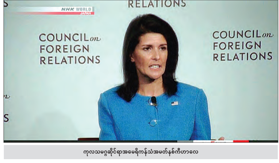
ကုလသမဂ္ဂဆိုင်ရာအမေရိကန်သံအမတ်နှစ်ကီဟာလေ

မော်စကို ဇူလိုင် ၃၁ ရုရှားနိုင်ငံဆိုင်ရာ အမေရိကန်နိုင်ငံသံတမန်နေရာအဖွဲ့အစည်းမှ လုပ်ငန်းဆောင် ရွက်သူပေါင်း ၇၅၅ ဦးလျှော့ချသင့်ကြောင်း၊ ထို့အပြင် ကွန်ဂရက်က သဘောတူခဲ့သော အမေရိကန်၏ တားမြစ်ပိတ်ဆို့မှုအသစ်များကိုလည်း တုံ့ပြန်မှုများဆောင်ရွက်သွားမည် ဖြစ်ကြောင်း ယမန်နေ့က ရုရှားရုပ်သံလိုင်း တွေ့ဆုံမေးမြန်းခန်းတစ်ခုတွင် ရုရှားသမ္မတ ဗလာဒီမာပူတင်က ပြောခဲ့သည်။ ရုရှားနိုင်ငံတွင်ရှိသော အမေရိကန်နိုင်ငံ၏ သံတမန်နေရာအဖွဲ့အစည်းမှ လုပ်ငန်း ဆောင်ရွက်သူပေါင်း ၇၅၅ ဦးလျှော့ချခြင်းဖြင့် နှစ်နိုင်ငံ ဆက်ဆံရေးတွင် လိုအပ်သော သံတမန်အရေအတွက်ဖြစ်သည့် ၄၅၅ ဦးအထိရောက်ရှိလာမည်ဖြစ်ကြောင်း ရုရှားက ပြောခဲ့သည်။