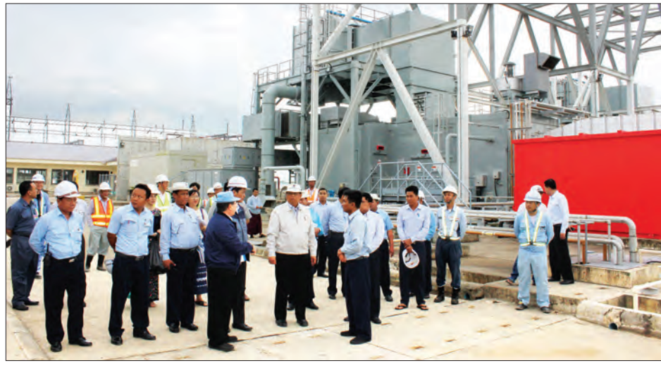
လုပ်ငန်းရှင်များနှင့် ဝန်ကြီးဌာနများ ပူးပေါင်းဆောင်ရွက်ရေး ကိစ္စရပ်များနှင့် ပတ်သက်၍ ဆွေးနွေးသည်။

ပြည်ထောင်စုဝန်ကြီး ဦးဝင်းခိုင်နှင့် ဒုတိယဝန်ကြီး ဒေါက်တာ ထွန်းနိုင်တို့သည် ဇူလိုင် ၃၀ ရက် နံနက်ပိုင်းတွင် ရန်ကုန်တိုင်းဒေသကြီးအတွင်းရှိ လမ်းတံတားဖွံ့ဖြိုးတိုးတက်ရေးနှင့် လျှပ်စစ်စွမ်းအင်ကဏ္ဍ ဖွံ့ဖြိုးတိုးတက်ရေးလုပ်ငန်းများအား ကြည့်ရှုစစ်ဆေးသည်။ (ယာပုံ)