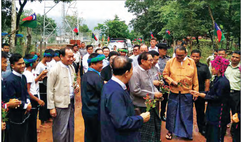
နိုင်ငံတော်အစိုးရနှင့် တိုင်းရင်းသားလက်နက်ကိုင်အဖွဲ့အစည်းများမှ နှစ်ဖက်ကိုယ်စားလှယ်များ သထုံမြို့နယ် အင်းကျေး ကျေးရွာ၌ ဒေသခံများအား ရင်းရင်းနှီးနှီးနှုတ်ဆက်စဉ်

မရွေး သွားလာနိုင်သောလမ်း၊ လျှပ်စစ် ဓာတ်အား၊ နေရပ်စွန့်ခွာ တိမ်းရှောင်နေရ သူများအတွက် အလုပ်အကိုင်အခွင့် အလမ်း ဖန်တီးပေးရေး အပါအဝင် ကျေးရွာ၏ ဖွံ့ဖြိုးရေးလိုအပ်ချက်များကို ထုတ်ဖော်ပြောကြားခဲ့ကြသည်။ ခရီးစဉ် ရလဒ်အဖြစ် ကျေးရွာ၏ ပကတိ လိုအပ်ချက်များကို အခြေခံ၍ လက်တွေ့ အကောင်အထည်ဖော် ဆောင်ရွက်သွား မည်ဖြစ်ကြောင်း ပူးတွဲကွင်းဆင်းလေ့လာ ရေးအဖွဲ့က ကတိပြုပြောကြားခဲ့သည်။ ပူးတွဲကွင်းဆင်း လေ့လာရေးအဖွဲ့ တွင် နိုင်ငံတော်အစိုးရ ကိုယ်စားလှယ် များအဖြစ် ငြိမ်းချမ်းရေးကော်မရှင်ဥက္ကဋ္ဌ