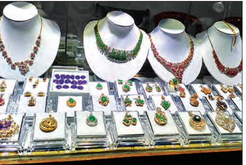
ပြပွဲတွင် ရောင်းချမည့် ကျောက်မျက်ရတနာများ

ဆက်လက်၍ အသင်းဥက္ကဋ္ဌက “အခုလက်ရှိအခြေအနေမှာ ကိုယ့်နိုင်ငံရဲ့ သယံဇာတဟာ သူများနိုင်ငံရဲ့ သယံဇာတဖြစ်နေပါတယ်။ ဒါကြောင့် အသင်းက အထူးရက်မြတ် မြန်မာ့ကျောက်မျက်ရတနာနေ့ သတ်မှတ်ပြီး နောင်အနာဂတ်မှာ လူသားအရင်းအမြစ်ဖြစ်တဲ့ ဉာဏ်အား၊ စွမ်းအားတွေကို