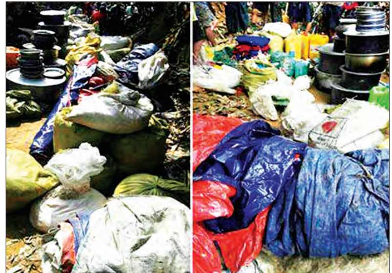
သိမ်းဆည်းရမိသည့် ပစ္စည်းများအား တွေ့ရစဉ်

မသင်္ကာဖွယ်တဲများနှင့်အတူ လူအသုံးအဆောင်ပစ္စည်းများ၊ အစားအသောက်များ တွေ့ရှိခဲ့မှုနှင့်ပတ်သက်၍ ဖြစ်စဉ်မှန်ပေါ်ပေါက်ရေး ဆက်လက်စုံစမ်းစစ်ဆေးလျက်ရှိကြောင်း သိရသည်။ (သတင်းစဉ်)