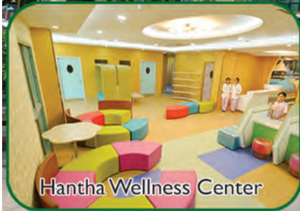
Hantha Wellness Center