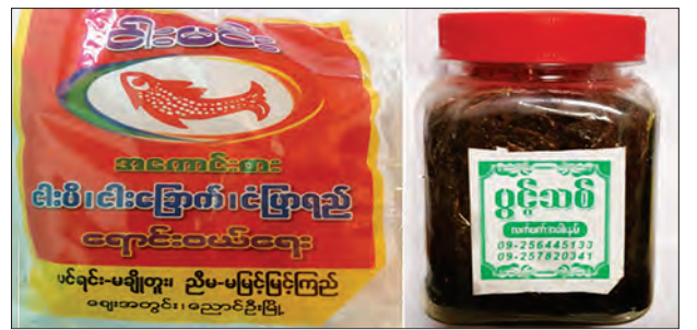
ငါးမင်းအမှတ်တံဆိပ် ငါးပိ ပွင့်သစ်အမှတ်တံဆိပ်လက်ဖက်အခါးနပ်

ကျန်းမာရေးနှင့်အားကစားဝန်ကြီးဌာန စားသုံးရန်မသင့်သောအစားအသောက်နမူနာများ