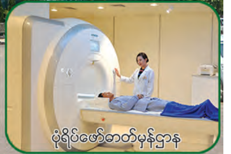
ပုံရိပ်ဖော်ဓာတ်မှန်ဌာန