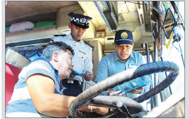
မြင့်မိုးရဲ(တာချီလိတ်)

မော်တော်ယာဉ်မောင်းနှင်ရာတွင် ယာဉ်များကျော်တက်နိုင်ကြောင်း အချက်ပြမှု မှားယွင်းအသုံးပြုနေခြင်းနှင့် နောက်မှကျော်တက်လိုသောယာဉ်ကို ကျော်တက်နိုင်ကြောင်း မီးအချက်ပြမှု မှန်ကန်စွာအသုံးပြုနိုင်ရေးအတွက် အသိပညာပေး လက်ကမ်းစာစောင်များ ဖြန့်ဝေခြင်းတို့ တာချီလိတ်-ကျိုင်းတုံ အဝေးပြေးလမ်းမကြီး ဟောင်လိတ်လမ်းဆုံနှင့် ပါဆပ်အဆင့်မြင့်ကားလေးကွင်းတို့၌ တာချီလိတ်ခရိုင် ကုန်းလမ်းပို့ဆောင်ရေးညွှန်ကြားမှုဦးစီးဌာနမှ ဝန်ထမ်းများနှင့် မိတ်ဖက်ဌာနများက ဇူလိုင် ၂၈ ရက်က ဒုတိယအကြိမ် ဖြန့်ဝေပေးစဉ်