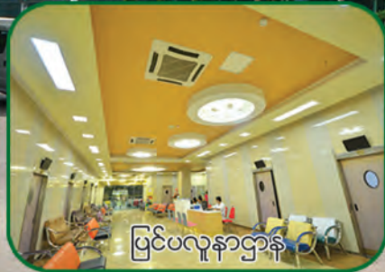
ပြင်ပလူနာဌာန