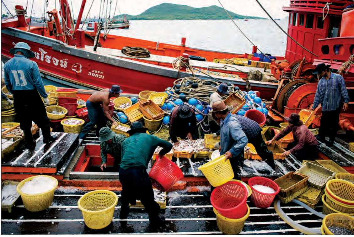
ထိုင်းနိုင်ငံရောက် မြန်မာရွှေ့ပြောင်းအလုပ်သမားများ၏ ရေလုပ်ငန်းခွင်တစ်နေရာ

တာဝန်ယူဖြေရှင်းပေးပြီး အေဂျင်စီများ၊ တစ်ဦး ချင်းစေလွှတ်သူများနှင့် ပတ်သက်သည်များကို စုံစမ်းဖော်ထုတ်ခြင်း၊ စီရင်ဆုံးဖြတ်ခြင်းများ ပြုလုပ်သည်။ ထို့အပြင် ရွှေ့ပြောင်းအလုပ်သမား