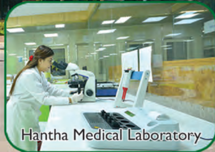
Hantha Medical Laboratory