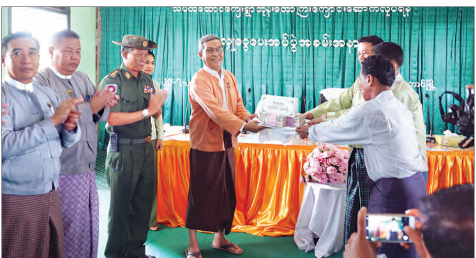
သပိတ်တောင်ကျေးရွာ သူနာ့ဆေးရုံကြီး၊ ဘုန်းတော်ကြီးကျောင်း ဆောက်လုပ်ပေးအပ်ပွဲ

ရခိုင်ပြည်နယ်ဝန်ကြီးချုပ် ဦးညီပုသည် ယနေ့နံနက် ၁၀ နာရီတွင် ဘူးသီးတောင် မြို့နယ် အထွေထွေအုပ်ချုပ်ရေးဦးစီးဌာန အစည်းအဝေးခန်းမ၌ ကျင်းပသည့် သပိတ်တောင်ကျေးရွာ ဘုန်းတော်ကြီးကျောင်း ဆောက်လုပ်ရေးအတွက် အလှူငွေ ပေးအပ်ခြင်းအခမ်းအနားသို့ တက်ရောက်သည်။