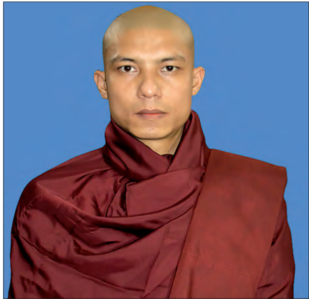
အရှင်အာဒိစ္စဝံသ

ဥပေက္ခာသည် သတ္တဝါတို့အပေါ် အလယ်အလတ်ထားခြင်း လက္ခဏာ ရှိသည်။ ညီမျှစွာရှုခြင်း (မျှမျှတတ ရှုခြင်း) ကိစ္စရှိသည်။ ရန်လိုမှုကို ငြိမ်းစေလိုသော သရုပ်သကန်(ပစ္စုပဋ္ဌာန်) ရှိသည်။ ကံအတိုင်း ဖြစ်ကြ၏ဟု ရှုမြင်ခြင်း အနီးကပ်အကြောင်း တရား (ပဒဋ္ဌာန်) ရှိသည်။