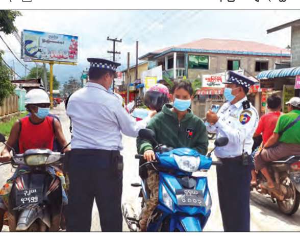
ညောင်ရွှေ၌ ယာဉ်ထိန်းရဲတပ်ဖွဲ့ဝင်များက H1N1 တုပ်ကွေးရောဂါကာကွယ်ရေး နှာခေါင်းစည်းများ ဝေငှပေးစဉ်

ညောင်ရွှေ ရာသီတုပ်ကွေး H1N1 ရောဂါကူးစက်မှု မရှိစေရေးအတွက် ညောင်ရွှေမြို့၌ ဇူလိုင် ၂၉ ရက် နံနက် ၁၀ နာရီက အမှတ်(၁၈) ယာဉ်ထိန်းရဲတပ်ဖွဲ့၊ အမှတ်(၁၁၃) ယာဉ်ထိန်းရဲတပ်ဖွဲ့ (တောင်ကြီး)၊ ညောင်ရွှေတပ်ဖွဲ့စိတ်မှ ရဲအုပ်ကြည်စိုးနှင့် တပ်ဖွဲ့ဝင် များက မြို့အဝင်လမ်းမ၊ လမ်းဆုံလမ်းခွဲများတွင် သွားလာနေသော ပြည်သူများ၊ မော်တော်များယာဉ်နှင့် ဆိုင်ကယ်မောင်းနှင်သူများကို H1N1 ရောဂါနှင့် အခြား ရောဂါများ ကာကွယ်ရေးအတွက် နှာခေါင်းစည်းများကို အခမဲ့ ဖြန့်ဝေတပ်ဆင်ပေးခဲ့ ကြောင်း သိရသည်။