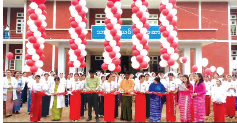
ပြင်ဦးလွင် ဇူလိုင် ၂၉ ပြင်ဦးလွင်မြို့ ခုတင် ၃၀၀ ဆံ့ ပြည်သူ့ဆေးရုံကြီး၌ ဇူလိုင် ၂၈ ရက်က သားဖွားနှင့်မီးယပ် လူနာဆောင် အသစ်ကို ဖွင့်လှစ်ပေးနိုင်ခဲ့ပြီဖြစ်ကြောင်း သိရသည်။ ယခု အသစ်တည်ဆောက်ဖွင့်လှစ်ခဲ့သော သားဖွားနှင့်မီးယပ် ကုသဆောင်မှာ နှစ်ထပ်ကုသဆောင်ဖြစ်ပြီး ၂၀၁၅-၂၀၁၆ ဘဏ္ဍာနှစ် သုံးစွဲငွေဖြင့် ငွေကျပ် ၃၂၈ ဒသမ ၉၂၇ သန်း အကုန်အကျခံကာ တည်ဆောက်ခဲ့ခြင်းဖြစ်ကြောင်း သိရသည်။ အဆိုပါ ကုသဆောင်အသစ် ဖွင့်လှစ်နိုင်ခြင်းကြောင့် ယခင်က