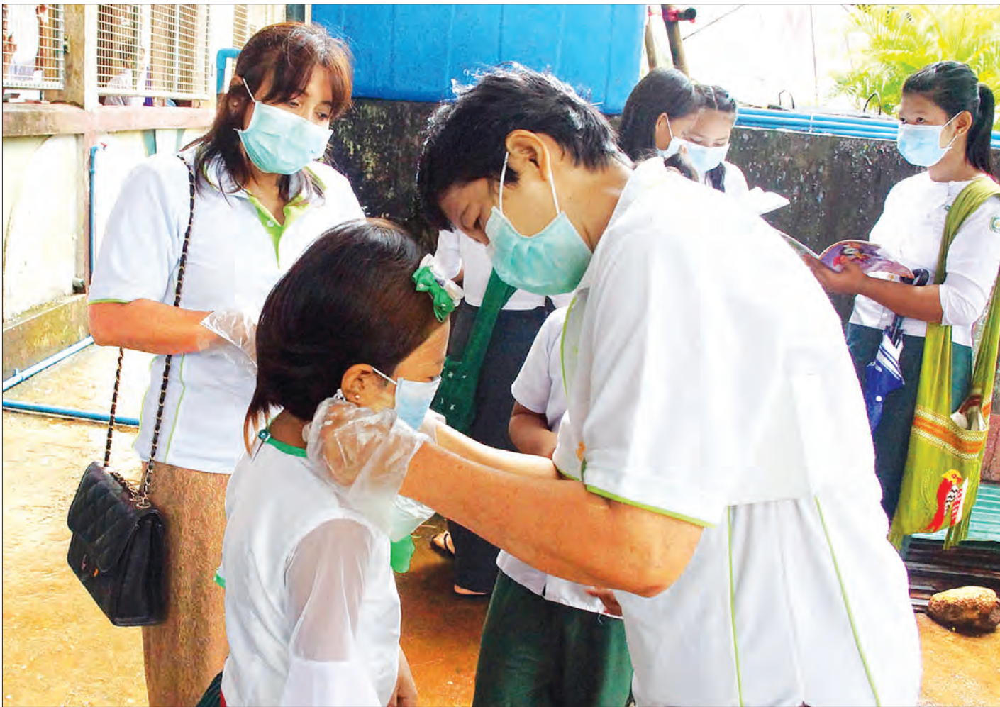
ရာသီတုပ်ကွေး (H1N1) နှင့် ကြက်ငှက်တုပ်ကွေး (H5N1) ရောဂါကူးစက်မှုမှစီစဉ်ရေးအတွက် ဇူလိုင် ၂၉ ရက်က ကော့သောင်းမြို့၊ အထက(၁)၌ ကျောင်းသူတစ်ဦးကို တာဝန်ရှိသူက ရောဂါကာကွယ်ရေးလုပ်ငန်းဆောင်ရွက်ပေးစဉ်

နေပြည်တော် ဇူလိုင် ၂၉ ကျန်းမာရေးနှင့် အားကစားဝန်ကြီးဌာနအနေဖြင့် လတ်တလောဖြစ်ပွားနေသော ရာသီတုပ်ကွေးရောဂါ (Seasonal Influenza A(H1N1) pdm 09) နှင့် ပတ်သက်၍ အရေးပေါ်တုံ့ပြန်ဆောင်ရွက်ခြင်း၊ ရောဂါ စောင့်ကြပ်ကြည့်ရှုခြင်း၊ ကာကွယ်ထိန်းချုပ်ခြင်းနှင့် ကုသမှု ပေးခြင်းလုပ်ငန်းများအား အရှိန်အဟုန်မြှင့်ဆောင်ရွက်လျက် ရှိရာ ၂၀၁၇ ခုနှစ် ဇူလိုင် ၂၈ ရက် မွန်းလွဲ ၂ နာရီမှ ဇူလိုင် ၂၉ ရက် မွန်းလွဲ ၂ နာရီအထိ သံသယလူနာ ၁၇ ဦးအား ထပ်မံ ဓာတ်ခွဲစမ်းသပ်စစ်ဆေးခဲ့ရာ Seasonal Influenza A(H1N1) pdm 09 အတည်ပြုလူနာ ခြောက်ဦးတွေ့ရှိ ခဲ့ကြောင်း ကျန်းမာရေးနှင့် အားကစားဝန်ကြီးဌာန၏ သတင်းထုတ်ပြန်ချက်အရ သိရသည်။ အဆိုပါထုတ်ပြန်ချက်တွင် ၂၀၁၇ ခုနှစ် ဇူလိုင် ၂၅ ရက်က ရန်ကုန်ပြည်သူ့ဆေးရုံကြီး၌ စတင်တက်ရောက်ပြီး ဇူလိုင် ၂၇ ရက် နံနက်ပိုင်းတွင် မြောက်ဥက္ကလာပမြို့နယ်ရှိ အထူးကု ဆေးရုံ(ဝေဘာဂီ)သို့ လွှဲပြောင်းကုသမှုပေးခဲ့သော လူနာ တစ်ဦးသည် ဇူလိုင် ၂၈ ရက်တွင် သေဆုံးခဲ့ကြောင်း။ လတ်တလော ပြင်းထန်အသက်ရှူလမ်းကြောင်းပိုးဝင် ရောဂါ လူနာများကို ရောဂါပျံ့နှံ့မှု လျှင်မြန်စွာထိန်းချုပ်နိုင်ရန် အတွက် မြောက်ဥက္ကလာပမြို့နယ်ရှိ အထူးကုဆေးရုံ (ဝေဘာဂီ)သို့ ဦးစားပေးပို့ဆောင်ကုသသွားမည်ဖြစ်ပြီး အဆိုပါဆေးရုံ၌ ကူးစက်ရောဂါအထူးကုဆရာဝန်ကြီးများ၊ ဆရာဝန်များ၊ သူနာပြုဆရာမနှင့် ဆရာမကြီးများ၊ အလို အလျောက် အသက်ရှူစက်များ၊ ဆေးနှင့် ဆေးပစ္စည်းများ၊ အထူးကြပ်မတ်ကုသဆောင်၌ လိုအပ်သော ပစ္စည်း ကိရိယာများ အလုံအလောက် ဖြည့်ဆည်းထားရှိကြောင်း သိရသည်။