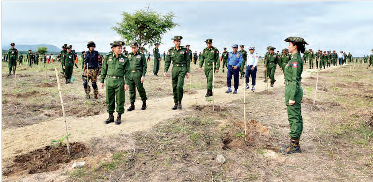
တပ်မတော်ကာကွယ်ရေးဦးစီးချုပ် ဝိုင်းချုပ်မှူးကြီး မင်းအောင်လှိုင်နှင့် အဖွဲ့ဝင်များ အရာရှိ၊ စစ်သည်၊ မိသားစုများ စုပေါင်းသစ်ပင်စိုက်ပျိုးနေမှုကို ကြည့်ရှုအားပေးစဉ်