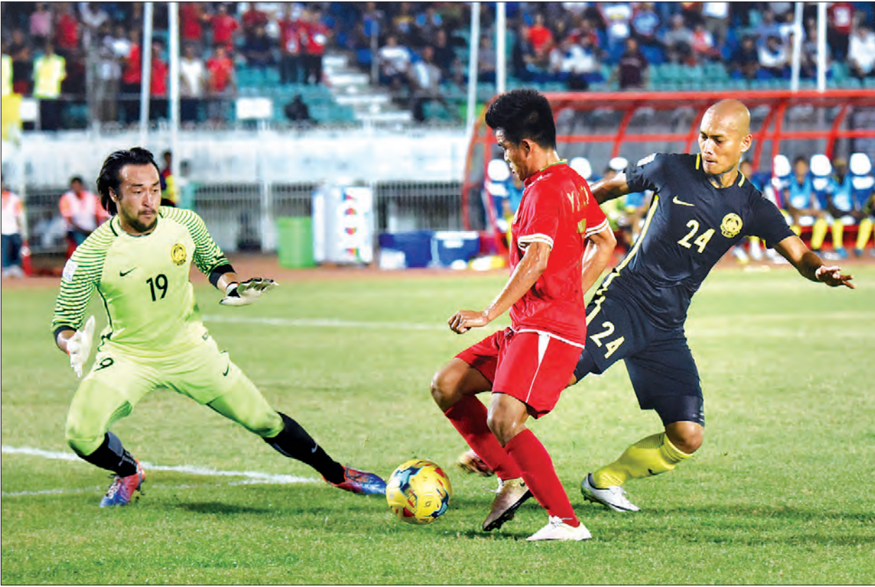
ယခင်နှစ် ဆူဂူကီးဖလားပြိုင်ပွဲတွင် မြန်မာ့လက်ရွေးစင်အသင်းနှင့် မလေးရှားလက်ရွေးစင်အသင်းတို့ ယှဉ်ပြိုင်မှုကို တွေ့ဆုံခဲ့စဉ်