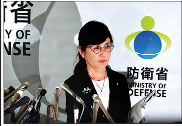
ဂျပန်နိုင်ငံ ကာကွယ်ရေးဝန်ကြီး အီနာဒါ