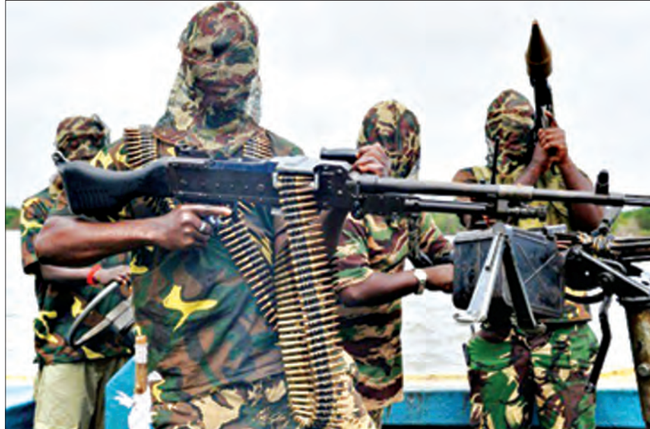
ဘော်နိုပြည်နယ်၌ ရေနံရှာဖွေနေသော နိုင်ဂျီးရီးယားရေနံကုမ္ပဏီမှ အဖွဲ့ဝင်များကို တိုက်ခိုက်ခဲ့သည့် ဘိုကိုဟာရမ် စစ်သွေးကြွများကို တွေ့ရစဉ်

လွန်ခဲ့သော ၁၀နှစ်ကျော်ကာလက ဘိုကိုဟာရမ် အစွန်းရောက်အဖွဲ့ကို တည် ထောင်ခဲ့ပြီးနောက် နိုင်ဂျီးရီးယားအနီးတစ်ဝိုက်တွင် အကြမ်းဖက်တိုက်ခိုက်မှုများကို လုပ်ဆောင်ခဲ့ရာ ယခုအချိန်အထိ လူပေါင်း ၂၀၀၀၀ထက်မနည်းသေဆုံးခဲ့ပြီး ၂ ဒသမ ၆ သန်းကျော် အိုးမဲ့အိမ်မဲ့ဖြစ်ခဲ့ကြောင်း သိရသည်။ (ဆင်ဟွာ)