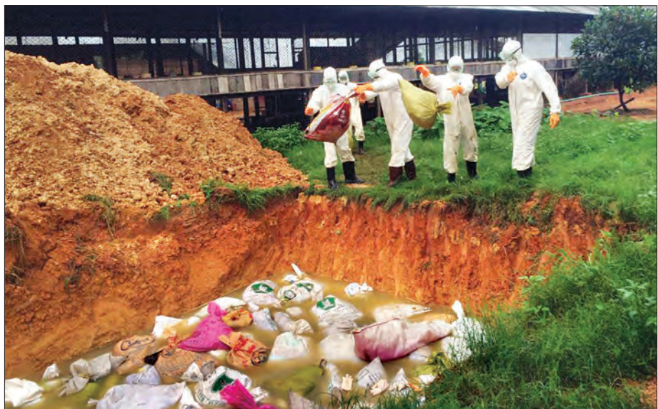
ထားဝယ်မြို့ ဝဲကျွန်းထိန်းသစ်ရပ်ကွက်ရှိ ကြက်ငှက်တုပ်ကွေးရောဂါဖြစ်ပွားခဲ့သည့် ကြက်မွေးမြူရေးခြံများအား သုတ်သင် ရှင်းလင်းခြင်းလုပ်ငန်း ဆောင်ရွက်နေသည့်ကို ဇူလိုင် ၂၇ ရက်က တွေ့ရစဉ်

“ကြက်ငှက်တုပ်ကွေးက အေ၊ ဘီ၊ စီ အုပ်စု သုံးခုရှိပါတယ်။ အေ အုပ်စုက လူသားနဲ့တိရစ္ဆာန်မှာ အများဆုံးဖြစ်တတ်ပြီးတော့ ကပ်ရောဂါအသွင်ဖြစ်ပွားနိုင်တဲ့ ပိုးအမျိုးအစားလည်း ဖြစ်ပါ တယ်။ H5N1 ရောဂါဟာ ကြက်ငှက်တွေမှာတင်မကဘဲ လူသားတွေကို ကူးစက်ဖြစ်ပွားခဲ့တာ ရှိခဲ့ပါတယ်။ WHO ရဲ့ ၂၀၁၇ ဇူလိုင် ၁၅ ရက်အထိစာရင်းတွေအရ နိုင်ငံ ၁၆ နိုင်ငံ