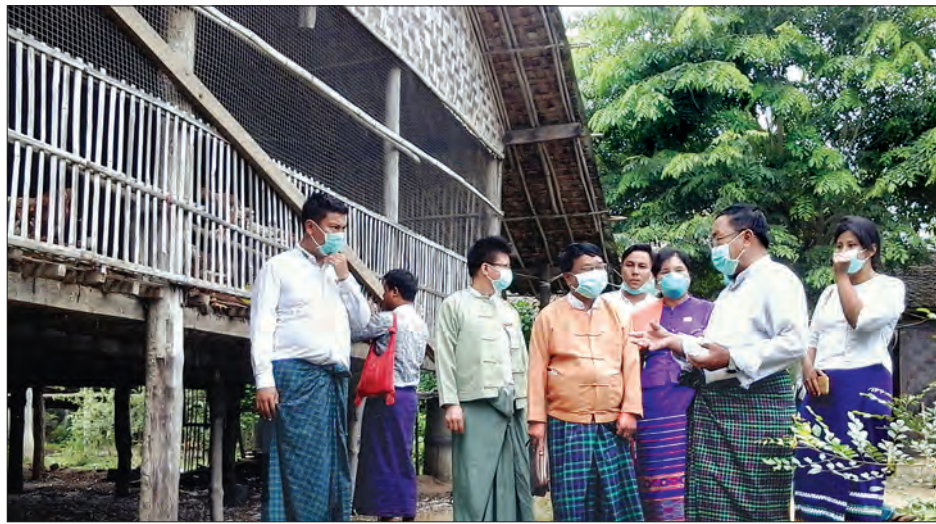
ပုံရွာဆေးရုံကြီးမှာ H1N1 က အခုလောလောဆယ်မှာဖြစ်တဲ့သူ မရှိသေးပါဘူး။ ဒါပေမယ့် အားလုံးကိုတော့ လှုံ့ဆော်ထားပါ တယ်။ ဇူလိုင် ၂၆ ရက်ကလည်း မြို့နယ်၊ ခရိုင်တွေက ဆရာဝန် တွေအားလုံး ညှိနှိုင်းဆွေးနွေးထားပြီး ပညာပေးတာ ကာကွယ်

ကောလာဟလဖြစ်ကာ လူအများကြား အလန်တကြားဖြစ် အောင် လူမှုကွန်ရက်မှတစ်ဆင့် ပုံရွာတွင် H1N1 ဖြစ်နေသူ တစ်ဦးတွေ့သည့်အကြောင်းနှင့် ပုံရွာကြက်မွေးမြူရေးဇုန်တွင် ယခင်ကကဲ့သို့ ကြက်ငှက်တုပ်ကွေးဖြစ်၍ ကြက်စတင်သေနေပြီ ဆိုသောသတင်းများကို တိတိကျကျသိရှိစေရန် ကြိုတင် ကာကွယ်ရေးကို အရှိန်မြှင့်ဆောင်ရွက်ကြရန်အတွက် မမှန် သတင်းဖြန့်သည့် ဇူလိုင် ၂၈ ရက် မွန်းလွဲပိုင်းတွင် တိုင်း ဒေသကြီး လူမှုရေးဝန်ကြီး ဒေါက်တာဇော်ဝင်းနှင့်အဖွဲ့သည် ပုံရွာဆေးရုံကြီးနှင့် ပုံရွာကြက်မွေးမြူရေးဇုန်တို့သို့ ကွင်းဆင်း ကြည့်ရှုစစ်ဆေးခဲ့သည်။ (ယာပုံ)