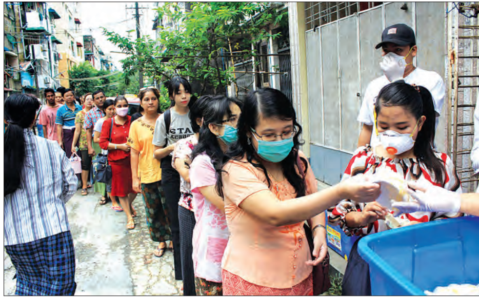
များအဖွဲ့က ယင်းနှာခေါင်းစည်းများကို အမြတ်မယူ မူရင်း ဈေးနှုန်းထက်လျော့၍ တစ်ခုလျှင် ငွေကျပ် ၅၀၀ နှုန်းဖြင့် လူတစ်ယောက်လျှင် လေးရစ် မျှဝေရောင်းချပေးလျက်ရှိနေ

လက်ရှိအသုံးပြုနေသော နှာခေါင်းစည်းရောင်းရုံများထက် ပိုမိုကောင်းမွန်သော N95 Mask (နှာခေါင်းစည်း) များကို ဇူလိုင် ၂၈ ရက် နံနက်က ရန်ကုန်တိုင်းဒေသကြီးအလုံမြို့နယ် ဌာနချုပ်တွင် နံ့သာလမ်းအတွင်း၌ ဒါနစုဘူးပရဟိတလူငယ်