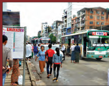
YBS နှင့် သူ၏မှတ်တိုင်များ | အချပ်ပို - (ဂ)