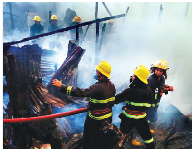
ရန်ကုန် ဇူလိုင် ၂၅

ရန်ကုန်မြို့ မင်္ဂလာတောင်ညွန့်မြို့နယ် ကျိုတော်ရပ်ကွက် မဟာသုခလမ်းနှင့် ကျိုတော်မီးရထား ရဲတပ်ဖွဲ့ရုံးလမ်းထိပ်တွင် ဇူလိုင် ၂၅ ရက် နံနက် ၁၀ နာရီခွဲခန့်က မီးလောင်မှု ဖြစ်ပွားခဲ့သည်။ (ဝဲပုံ)