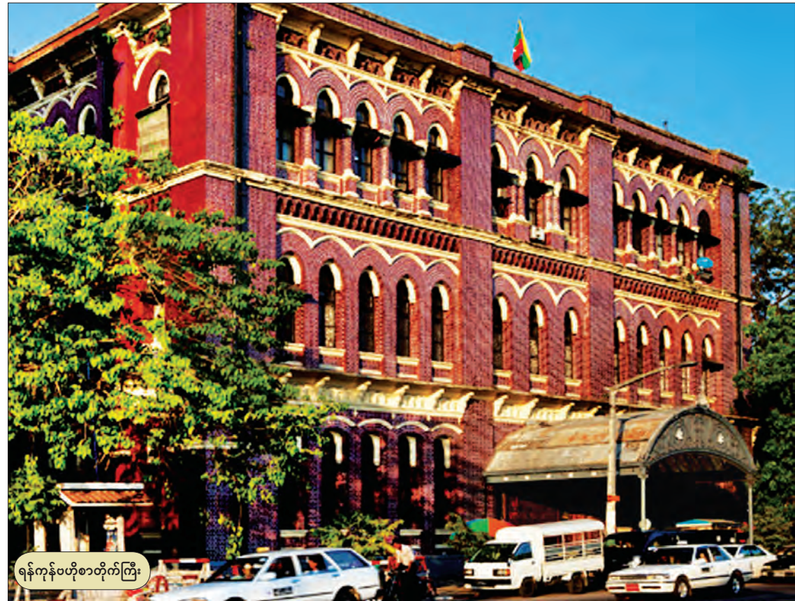
ရန်ကုန်တိုက်ကြီး

ခရီးတစ်ထောက် နားခိုရာရှာရသည်က ရှားပါးမောလှပါတီ၊ သွားခိုမိသော စမ်းချောင်းမြို့နယ်က တိုက်ကြီးများ ဆောက်နေဆဲ ဆောက်လုပ်ဆဲ လွန်စွာကြီးသော ဘိလပ်မြေကားကြီးများဖြင့် ကန်ထရိုက်တိုက်များက ယခုတိုင်အောင် ဆောက်လုပ်ဆဲဖြစ်တွေ့ခဲ့ရပေသည်။