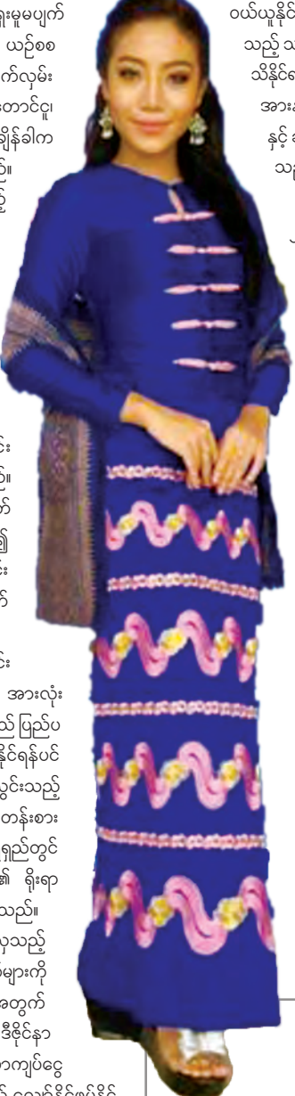
ပြည်ပမှ တင်သွင်းလာသည့် ချိတ်များသည် ပိုမိုချစ်ဖွယ် အရောင် သွေးတောက်ပသကဲ့သို့ ပိုမိုချစ်ဖွယ် အသုံးခံ နေသည်ကို တွေ့ရသည်။ ခက်သည်မှာ ယင်းချိတ် များ၏ မူရင်းဒီဇိုင်းသည် မြန်မာ့ရိုးရာစစ်စစ် ချိတ် ဒီဇိုင်းများဖြစ်နေသည်မှာ ဝမ်းနည်းဖွယ်ပင် ဖြစ်သည်။

ပြင်ဦးလွင်တွင် အနွေးထည်ဆိုင်များစွာရှိသည်။ လက်ဖြစ်သုံးမွှေး အင်္ကျီထက် ပြည်ပက တင်သွင်းလာသည့် ဒီဇိုင်းလှပ စာတုချည်မျှင်အနွေးထည်