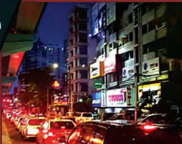
မြို့ပြပြောင်းလဲလာသည့် ရန်ကုန်တိုင်းဒေသကြီး မြို့နယ်များ တစ်ခဏလေ့လာမှု | အချပ်ပို - (ခ)