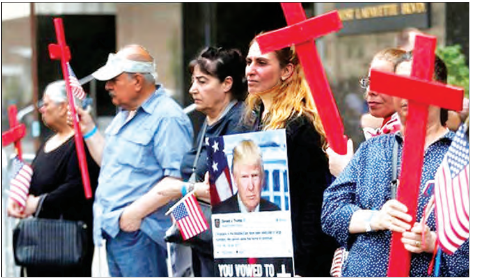
ဇွန်လအတွင်းက မီချီဂန်၌ ပြည်နှင့်ဒဏ်ပေးခံရမှုနှင့် ရင်ဆိုင်နေရသည့် အီရတ်နိုင်ငံသားများကိုယ်စား ဆန္ဒထုတ်ဖော်နေသူများကို တွေ့ရစဉ်

ပြည်နှင့်ဒဏ်ပေးခြင်းကို ရပ်နားလိုက်သည့် ဆုံးဖြတ်ချက်သည် လအနည်းငယ်ကြာသည်အထိ မည်သည့်အီရတ်နိုင်ငံသားကိုမျှ အမေရိကန်ပြည်ထောင်စုမှ နှင်ထုတ်ခွင့်မရှိဟုဆိုလိုသည့်အမိန့်ပေးခြင်းဖြစ်ကြောင်း သိရသည်။ (ရိုက်တာ)