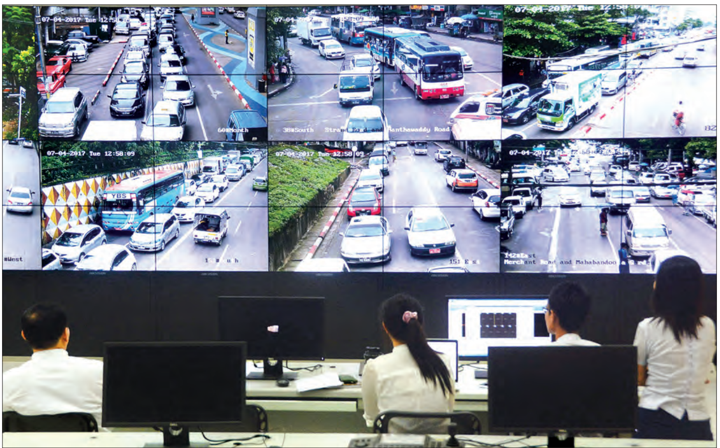
ရန်ကုန်မြို့တွင်း ယာဉ်သွားလာဖြတ်သန်းမှုမြင်ကွင်းများကို ဗဟိုထိန်းချုပ်ရေးစင်တာမှ တွေ့မြင်နေရစဉ်

ရေယာဉ် သုံးစင်းမှ ကမ္ဘာ့ပုဒ်-၁ အမည်ရှိ ခရီးသည်တင် ရေယာဉ်အား ပြီးခဲ့သည့် မတ် ၂၉ ရက်က ပထမဆုံး တရားဝင် လွှဲပြောင်း လက်ခံရယူကာ ရခိုင်ပြည်နယ်အတွင်း ဒေသခံ ပြည်သူများအတွက် ခရီးသည်တင်သီးသန့် အမြန်ရေယာဉ်အဖြစ် ပြေးဆွဲလျက်ရှိပြီး စာမျက်နှာ ၄ ကော်လံ ၅