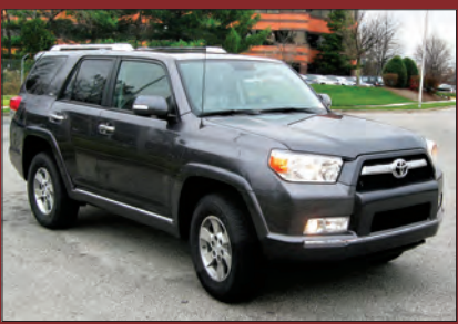
နယ်လိုင်စင်နှင့် နယ်အကြိုက် အရောင်းသွက်လာသည့် ရန်ကုန်ကားဈေးကွက် | အချပ်ပို - (ဃ)