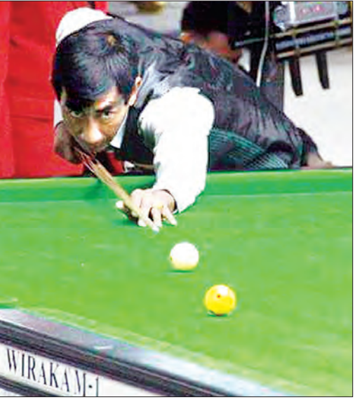
အားကစားသမားများအား စည်းကမ်းနည်းလမ်းများ ကြီးကြပ်ဆောင်ရွက်ပေးလျက်ရှိကြောင်း သိရသည်။