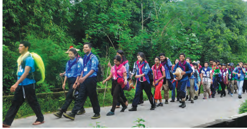
နေပြည်တော် ဇူလိုင် ၂၅ - အုပ်ချုပ်သူ ဆရာ/ ဆရာမ ၁၂ ဦးနှင့် အဖွဲ့ဝင် တက္ကသိုလ်ခြေလျင်နှင့် တောင်တက်အသင်း၊ သဘာဝ ခေါ်သံဖောင်အေးရှင်းဥက္ကဋ္ဌ ဦးမျိုးသန့်ဦးဆောင်သည့် တက်ခရီးကြမ်းအဖွဲ့သည် ဇူလိုင် ၁၄ ရက်မှ ၁၅

ရက်အတွင်း မွန်ပြည်နယ် သထုံခရိုင် ဘီးလင်းမြို့နယ် ရှေးဟောင်းသုဝဏ္ဏဘူမိ နယ်မြေ၊ ဝေပုလ္လ-ကောလာသ-တိုက် ကုလားတောင်တန်းဒေသသို့ ခရီးထွက်ခွာလေ့ကျင့်ခဲ့ကြ ကြောင်း သိရသည်။