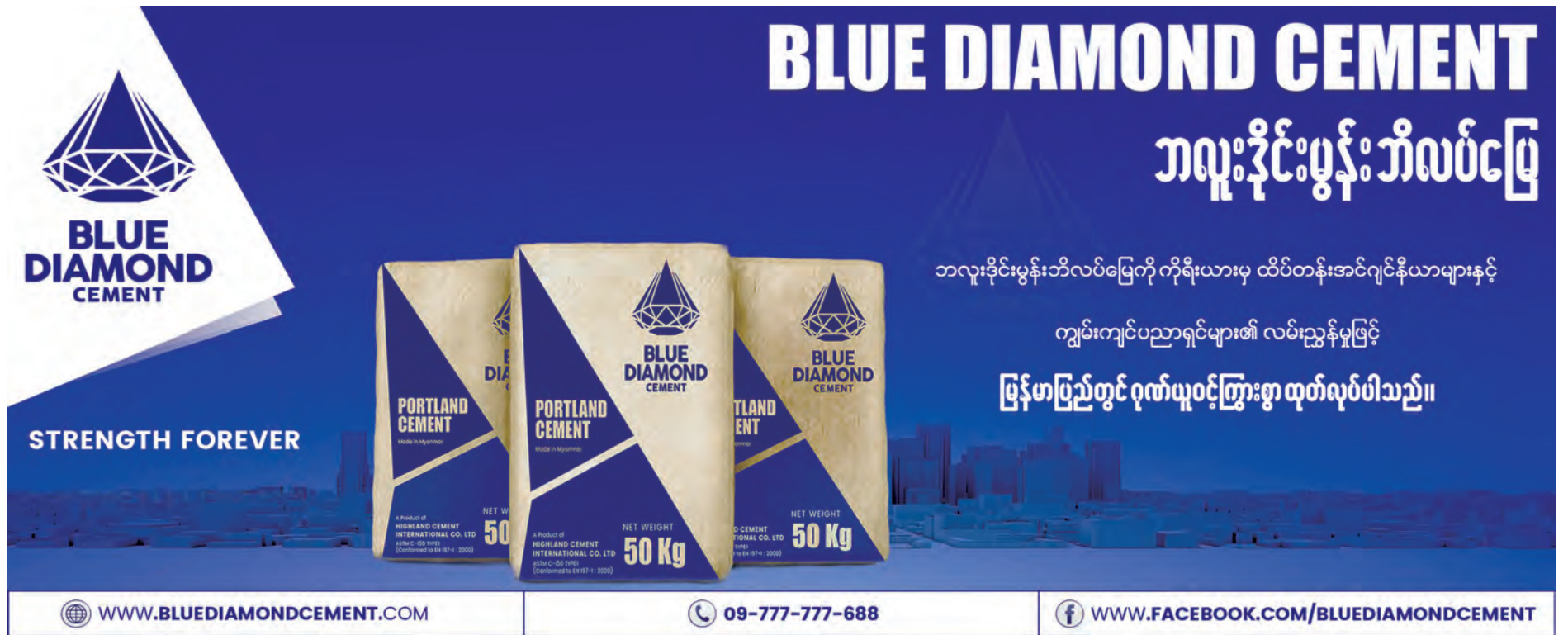
စာမျက်နှာ ၈ ကော်လံ ၁ ❖