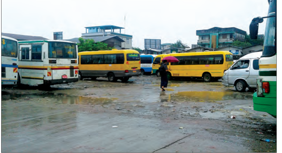
ဖျာပုံသို့ ကွန်ကရစ် သို့မဟုတ် ကတ္တရာ ခင်းပေးရန်လိုအပ်ကြောင်း ပြောသည်။ မိုးရာသီရောက်ပါက ကားရပ်တန့်ရန် နေရာခက်ခဲခြင်းနှင့် ခရီးသည်များ ကားဝင်းများသို့ ကူးပြောင်းသွားလာရာ တွင် ခက်ခဲခြင်းတို့ကြောင့် သက်ဆိုင်ရာ

ဖျာပုံ ဇူလိုင် ၂၃ ဖျာပုံ အဝေးပြေးကားဝင်းကို ၂၀၀၀ ပြည့်နှစ်က ဖွင့်လှစ်ခဲ့ပြီး ယခုအခါ မော်တော်ယာဉ်လိုင်း ၁၉ လိုင်းမှ မော်တော်ယာဉ်အစီးရေ ၃၂၅ စီးတို့ ဧရာဝတီတိုင်းဒေသကြီးနှင့် ရန်ကုန်တိုင်း ဒေသကြီးတို့မှ မြို့နယ်အသီးသီးသို့ ခရီး သည်နှင့်ကုန်စည်များ ပို့ဆောင်ပေးဆွဲ လျက်ရှိနေကြသည်။