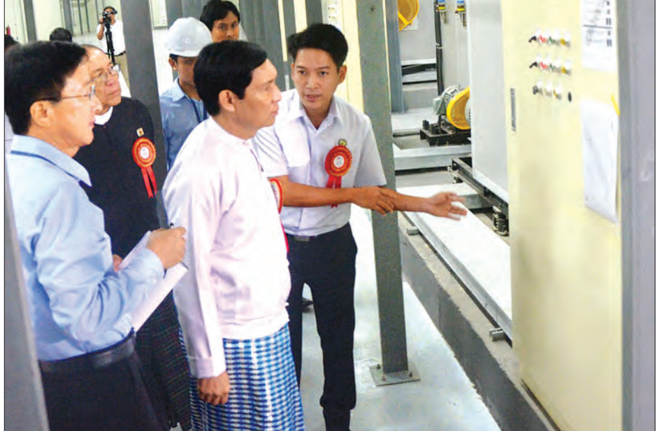
အဆိုပါ ဆေးဝါးထုတ်လုပ်ရေး စက်ရုံသစ်ကြီးကို အမေရိကန်ဒေါ်လာ သန်း ၂၀ အကုန်အကျခံကာ တည် ဆောက်ခဲ့ခြင်းဖြစ်ကြောင်း သိရသည်။ သတင်း- ထင်ပေါင်း(ကမာရွတ်)၊ ဓာတ်ပုံ - တင်စိုး(မြန်မာ့အလင်း)

ဆေးပြားတွေ၊ ဆေးတောင့်တွေ၊ ဆေး အမှုန့်တွေထုတ်ပါတယ်။ စက်တွေတော့ စတင်လည်ပတ်နေပါပြီ။ ဆေးအမျိုး အစား ၅၀ ထုတ်မှာပါ။ အဓိက ရည်ရွယ် တာကတော့ မြန်မာနိုင်ငံသားတွေအနေနဲ့ ပြည်တွင်းမှာထုတ်တဲ့ ဆေးတွေကို အဆင့်အတန်းမြင့်မြင့် သုံးစွဲစေချင်တဲ့ စေတနာနဲ့ ဒီစက်ရုံကြီးကို ဖွင့်လှစ်တာ ဖြစ်ပါတယ်” ဟု ပြောကြားသည်။ ဆေးဝါးထုတ်လုပ်ရေးကို ရောဂါ အမျိုးမျိုးအတွက် ထုတ်လုပ်မည်ဖြစ် ကြောင်းနှင့် နောက်ပိုင်းတွင် ပင်နီဆီလင်း၊ ပိုးသတ်ဆေးများ ထုတ်လုပ်ခြင်းအထိ တိုးချဲ့မည်ဖြစ်ကြောင်း သိရသည်။ စက်ရုံအနေဖြင့် ၂၀၁၇ ခုနှစ် ဧပြီလ တွင် မြန်မာနိုင်ငံ အစားအသောက် နှင့် ဆေးဝါးကွပ်ကဲရေးဦးစီးဌာန (FDA) ၏ ဆေးဝါးထုတ်လုပ်ခွင့် ထောက်ခံချက် (ယာယီ) ရရှိထား ကြောင်း သိရသည်။