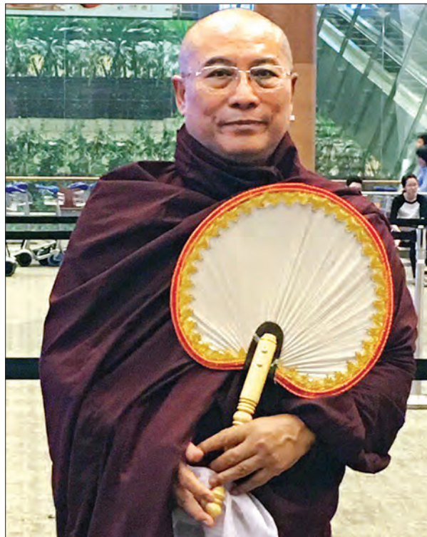
ဒေါက်တာဘဒ္ဒန္တစန္ဒာဝရာဘိဝံသ

လစဉ် လပြည့်နေ့တိုင်း လကွယ်နေ့တိုင်းတွင် မိမိတို့ ရောက်လေရာဒေသ