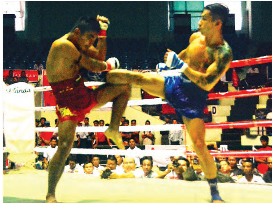
ရဲသွေးနီ(တောင်ကလေး)နှင့် ကရင်လေး(ခ)ဖဒါဝယ် တို့ယှဉ်ပြိုင်ထိုးသတ်စဉ်