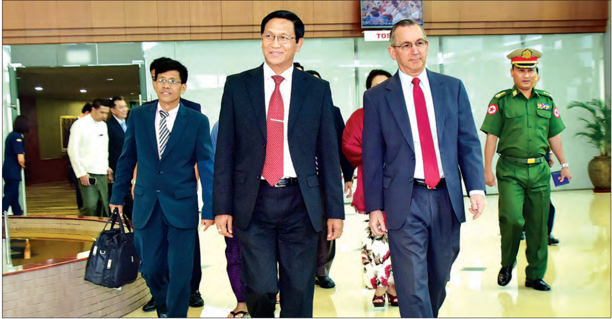
ဒုတိယသမ္မတ ဦးဟင်နရီပန်ထီးယူအား ရန်ကုန်အပြည်ပြည်ဆိုင်ရာလေဆိပ်၌ ကြိုဆိုကြသူများနှင့်အတူ တွေ့ရစဉ် (သတင်းစဉ်)

ဒုတိယသမ္မတနှင့်အဖွဲ့အား ရန်ကုန်တိုင်းဒေသကြီးအစိုးရအဖွဲ့မှ ရန်ကုန် မြို့တော်ဝန် ဦးမောင်မောင်စိုး၊ လုံခြုံရေးနှင့်နယ်စပ်ရေးရာဝန်ကြီး ဝိုင်းမူ၊ ကြီး အောင်စိုးမိုး၊ နိုင်ငံခြားရေးဝန်ကြီးဌာန ဒုတိယညွှန်ကြားရေးမှူးချုပ် ဦးဇော်ထွန်းဦး၊ လူမှုဝန်ထမ်း၊ ကယ်ဆယ်ရေးနှင့် ပြန်လည်နေရာချထားရေးဝန်ကြီးဌာနမှ တာဝန်ရှိ သူများ၊ မြန်မာနိုင်ငံဆိုင်ရာ အမေရိကန်သံအမတ်ကြီး မစ္စတာ စကော့မာစီရယ်လ်နှင့် တာဝန်ရှိသူများက ရန်ကုန်အပြည်ပြည်ဆိုင်ရာလေဆိပ်၌ ကြိုဆိုနှုတ်ဆက်ကြ သည်။ (သတင်းစဉ်)