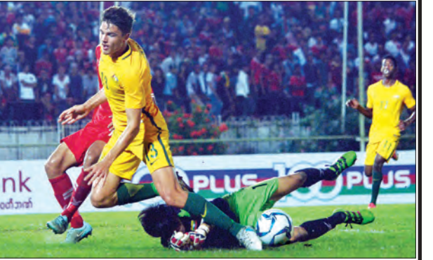
ဩစတြေးလျအသင်း၏ ဂိုးရရှိရေးကြိုးပမ်းမှုကို မြန်မာဂိုးသမားကာကွယ်စဉ်

သွင်းယူခဲ့ခြင်းဖြစ်သည်။ မြန်မာအသင်းသည် သုံးဂိုးပြတ်ရှုံးနိမ့်နေသော်လည်း စိတ်ဓာတ်မကျဘဲ ချေပဂိုး ရရှိရန် ကြိုးပမ်းခဲ့ပြီး ၆၅ မိနစ်တွင် ဩစတြေးလျဂိုးသမားဆီမှ အောင်သူ ရယူပြီး ကန်သွင်းခဲ့သော်လည်း နောက်ခံလူက ဖျက်ထုတ်နိုင်ခဲ့သည်။ ပွဲပြီးသည့်အထိ မြန်မာအသင်း ချေပဂိုးမသွင်းနိုင်သဖြင့် သုံးဂိုး-ဂိုးမရှိဖြင့် ရှုံးနိမ့်ခဲ့ရသည်။ ညနေ ၃ နာရီ၌ ယှဉ်ပြိုင်သည့် ပထမပွဲတွင် စင်ကာပူအသင်းက ဘရူနိုင်းအသင်း ကို လေးဂိုး-တစ်ဂိုးဖြင့် အနိုင်ရရှိခဲ့သည်။ အုပ်စု (F) ပွဲစဉ်များအပြီးတွင် ဩစတြေးလျ အသင်းက သုံးပွဲစလုံးနိုင် ကိုးမှတ်ဖြင့် အုပ်စုပထမရကာ ခြေစစ်ပွဲအောင်မြင်ခဲ့ပြီး မြန်မာက ခြောက်မှတ်၊ စင်ကာပူက သုံးမှတ်၊ ဘရူနိုင်းက အမှတ်မရခဲ့ပေ။ ယခုခြေစစ်ပွဲကို အုပ်စု ၁၀ ခုခွဲ၍ ကျင်းပလျက်ရှိပြီး ခြေစစ်ပွဲအောင် အသင်း ၁၅ သင်းထွက်ပေါ်လာမည်ဖြစ်ကာ မြန်မာအသင်းသည် ဒုတိယနေရာသာ ရခဲ့သော ကြောင့် အခြားအုပ်စုများ၏ ရလဒ်များကို စောင့်ကြည့်ရမည်ဖြစ်သည်။