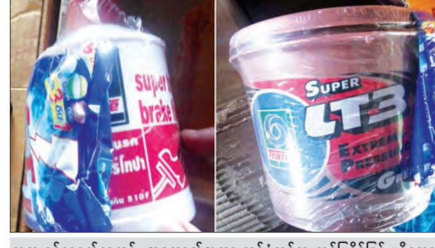
တရားဝင်စာရွက်စာတမ်း အထောက်အထားတစ်စုံတစ်ရာ တင်ပြနိုင်ခြင်းမရှိသော Brake Fluid နှင့် Grease

သန်းခန်းအား တွေ့ရှိ၍ ဖမ်းဆီးခဲ့ကြောင်း သတင်းရရှိသည်။ (သတင်းစဉ်)