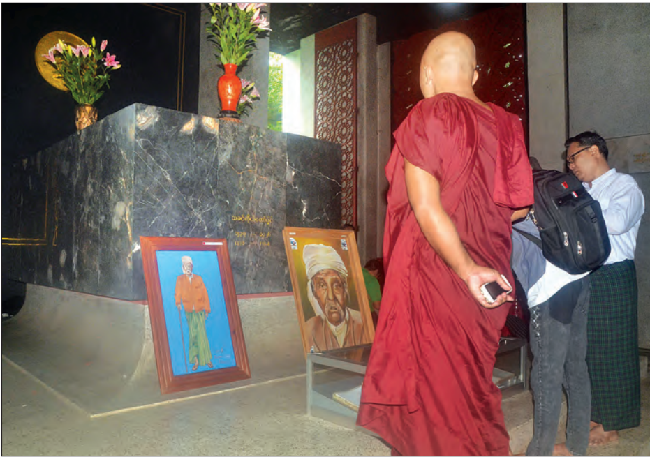
ဆရာကြီး သခင်ကိုယ်တော်မှိုင်း ဂူဗိမာန်သို့ လာရောက်ကြသည့် သံဃာတော်နှင့် လူများကိုတွေ့ရစဉ်

ဆရာကြီး သခင်ကိုယ်တော်မှိုင်း ကွယ်လွန်ခြင်း(၅၃)နှစ် မြောက် အထိမ်းအမှတ်အဖြစ် ယနေ့ နံနက်ပိုင်းတွင် သံဃာတော်များအား ဆွမ်းဆက်ကပ်လှူဒါန်းခြင်း၊ ဂူဗိမာန်၌ ဂါရဝပြုခြင်းတို့အပြင် ဆရာကြီး သခင်ကိုယ်တော်မှိုင်းအား လူငယ်များပိုမိုသိရှိလာစေရန် ဆရာကြီး၏ မိန့်ကြားချက်များ၊ မျှော်မှန်းချက်များနှင့် ငြိမ်းချမ်းရေးစဉ်များကို တက်ရောက် လာကြသူများက ဟောပြောကြသည်။ ထို့အပြင် ဆရာကြီး ရေးသားခဲ့သောစာအုပ်များနှင့်အတူ ဆရာကြီးအား သတိရ စေမည့်အထိမ်းအမှတ် ရုပ်ပုံများပါရှိသော အမှတ်တရပစ္စည်း