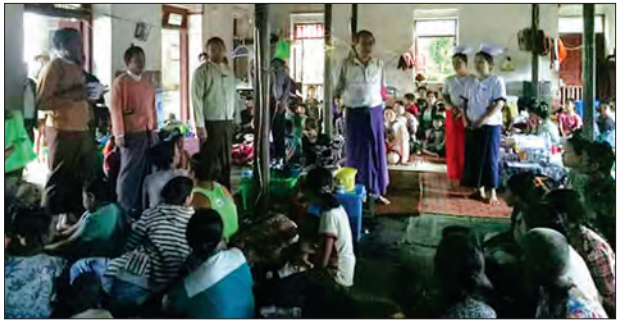
ဘီးလင်းမြို့နယ်တွင် ရေဘေးကယ်ဆယ်ရေးစခန်းကို ဖွင့်လှစ်ထားရှိရာ အိမ်ထောင်စု ၁၉၄ စု၊ လူဦးရေ ၈၀၆ ဦး နေထိုင်လျက်ရှိပြီး ၎င်းတို့အတွက် မြို့နယ်သဘာဝဘေး စီမံခန့်ခွဲမှုအဖွဲ့မှ ငွေနှင့် အစားအသောက်များကို သက်ဆိုင်ရာ စခန်းတာဝန်ခံများထံသို့ အမြန်ဆုံးပြန်လည်ခွဲဝေပေးသွားမည်ဖြစ်ကြောင်း သိရသည်။ (မြို့နယ် ပြန်/ဆက်)

မွန်ပြည်နယ်ဝန်ကြီးချုပ် ဒေါက်တာအေးဝင်းသည် ဇူလိုင် ၂၃ ရက်က ပြည်နယ်ခရိုင်သဘာဝဘေးအန္တရာယ်ဆိုင်ရာ စီမံခန့်ခွဲမှုအဖွဲ့များနှင့်အတူ ဘီးလင်းမြို့နယ် အုပ်ချုပ်ရေးမှူးရုံးခန်း၌ မြို့နယ်သဘာဝဘေးအန္တရာယ်ဆိုင်ရာ စီမံခန့်ခွဲမှုအဖွဲ့နှင့် တွေ့ဆုံ၍ ရေခဲအေးအိတ်များ ထောက်ပံ့ပေးပေးခဲ့သည်။