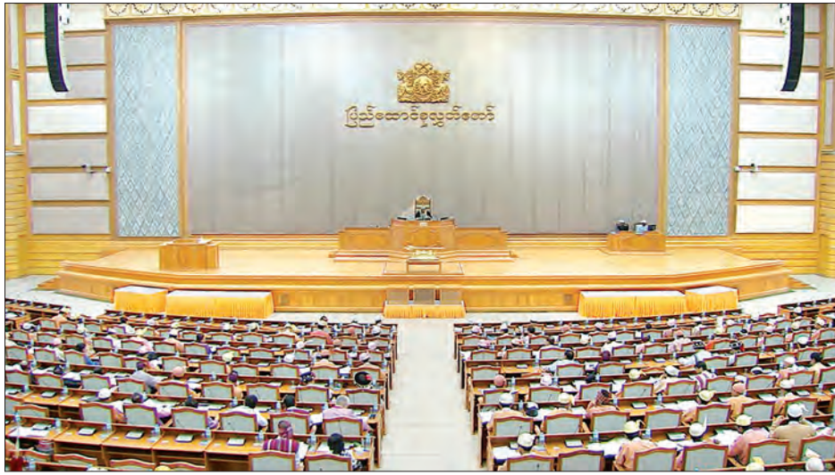
ဒုတိယအကြိမ် ပြည်ထောင်စုလွှတ်တော် ပဋိပညာအစည်းအဝေးကျင်းပစဉ်

ယင်းနောက် နိုင်ငံတော်သမ္မတထံမှ သဘောထားမှတ်ချက်ဖြင့် ပြန်လည်ပေးပို့ထားသော အထူးကုန်စည်ဥပဒေကို