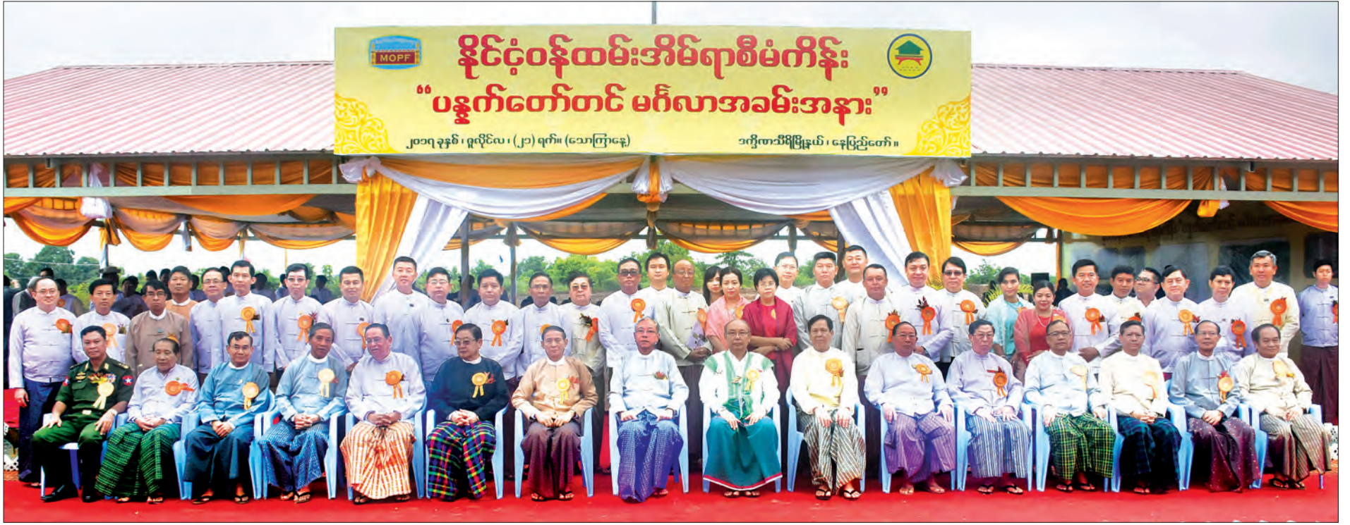
နိုင်ငံတော်သမ္မတ ဦးထင်ကျော်နှင့် နိုင်ငံ့ဝန်ထမ်းအိမ်ရာ ပန္နက်တော်တင် မင်္ဂလာအခမ်းအနားသို့ တက်ရောက်လာကြသူများ စုပေါင်းမှတ်တမ်းတင်ဓာတ်ပုံရိုက်စဉ်