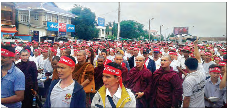
မီးပွိုင့်လမ်းဆုံမှ အထက်လမ်းမကြီး လမ်းမှ ချိုးကျေ့၍ ဗဟိုလမ်းလမ်းအတိုင်း ခဲ့ကြသည်။ အတိုင်း ချီတက်ပြီး အ.ထ.က(၁)သိပ္ပံ မီးပွိုင့်မှ တားဝယ်တံတားသို့ ပြန်လည် တင်ထွင်(မော်လမြိုင်)

မော်လမြိုင် ဇူလိုင် ၂၁ မော်လမြိုင်မြို့ ကမ်းနားလမ်း ရေပေါ် ညဈေးကွက်လပ်၌ ဇူလိုင် ၂၁ ရက် နံနက် ၉ နာရီခွဲက ကျိုက်မရောမြို့ ပျားတောင် ဒေသ Mcl ကျောက်မီးသွေးဓာတ် အားပေးစက်ရုံကို ဆန့်ကျင်ဆန္ဒပြပွဲ ပြုလုပ်ခဲ့ကြောင်း သိရသည်။ ငြိမ်းချမ်းစွာ စီတန်းလှည့်လည်ရာသို့ ကျေးရွာရှစ်ရွာမှ ဒေသခံ ၁၀၀၀ ခန့် ချီတက် လမ်းလျှောက်ခဲ့ကြ သည်။ အဆိုပါ ဆန္ဒဖော်ထုတ်ပွဲကို မြို့မရဲစခန်းရှေ့ မြေကွက်လပ်တွင် စုဝေး၍ ကမ်းနားလမ်းအတိုင်း တားဝယ်တံတားလမ်း၊ အ.ထ.က (၆)