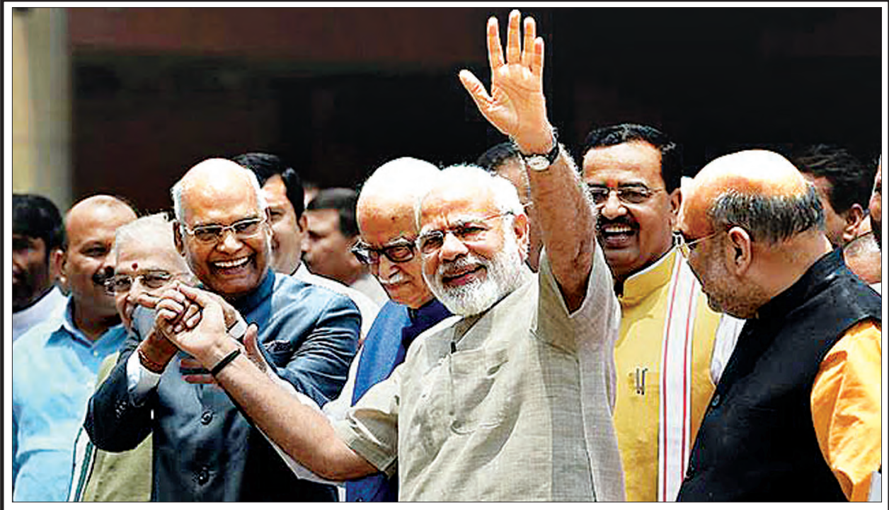
အိန္ဒိယနိုင်ငံ၏ သမ္မတအဖြစ် ရွေးချယ်တင်မြောက်ခံရသော ရမ်နက်သ်ကိုပင်းကို ဝန်ကြီးချုပ် နရိန္ဒြာ မိုဒီနှင့် အတူတွေ့ရစဉ်