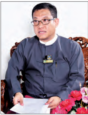
ဒေါက်တာကိုကိုအောင်

တယ်။ ကုလသမဂ္ဂနိုင်ငံတွေထဲက နိုင်ငံ ၁၇၁ နိုင်ငံကို လေ့လာလိုက်တဲ့အခါ မြန်မာနိုင်ငံဟာ သဘာဝဘေးဖြစ်မယ့် အခြေအနေနဲ့ ဆုံးရှုံးမှုရှိမယ့်အခြေအနေက ၄၂ မှာ ရောက်နေတယ်။ ၁၇၁ နိုင်ငံမှာအဆင့် ၄၂ ဆိုတော့ အခြေမဲ့များတယ်ပေါ့။ သဘာဝဘေးဖြစ်လာရင် တုံ့ပြန်မှုအတွက် မြန်မာနိုင်ငံက ဘယ်လောက်မှာ သွားရောက်နေလဲဆိုရင် အဆင့် ၁၅၇ မှာ ကျရောက်နေပါတယ်။