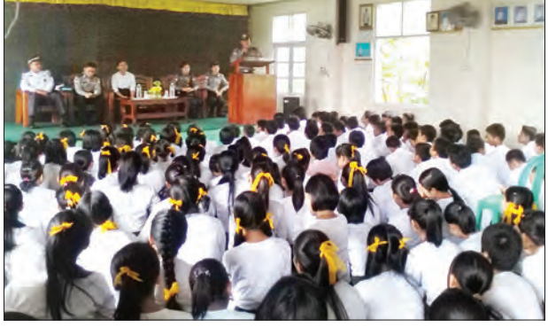
မွန်ပြည်နယ် ရဲတပ်ဖွဲ့မှ ရဲမှူးကြီးဘိုဘိုဦးနှင့် မုဒုံမြို့နယ် ရဲမှူးမြအောင် ဦးဆောင်သော မှုခင်းအသိပညာပေး ပြခန်း မော်တော်ယာဉ်သည် မုဒုံမြို့ မြို့မှ(၃)ရပ်ကွက် အထက် (၃)ကျောင်းသို့ သွားရောက်ပြီး ဇူလိုင် ၂၀ ရက်က မှုခင်းအသိပညာပေးဟောပြောစဉ် ကိုရဲ