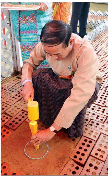
ပြည်သူ့လွှတ်တော်ဥက္ကဋ္ဌ ဦးဝင်းမြင့် ပန္နက်တော်တင်ပေးစဉ် (သတင်းစဉ်)

ဝန်ထမ်းအိမ်ရာ ပန္နက်တော်တင်ခြင်း အခမ်းအနားနှင့် စပ်လျဉ်း၍ မြန်မာ့ ဓလေ့ထုံးတမ်းအစဉ်အလာများနှင့်အညီ ဆောင်ရွက်ပေးပြီး အခမ်းအနားကို ရုပ်သိမ်းလိုက်သည်။ အခမ်းအနားအပြီးတွင် နိုင်ငံတော် သမ္မတသည် တက်ရောက်လာသည့် ဧည့်သည်တော်များနှင့်အတူ စုပေါင်း မှတ်တမ်းတင်ဓာတ်ပုံရိုက်ကြသည်။ နိုင်ငံတော်ဝန်ထမ်း အိမ်ရာများကို နေပြည်တော်ကောင်စီ ဒက္ခိဏသီရိ