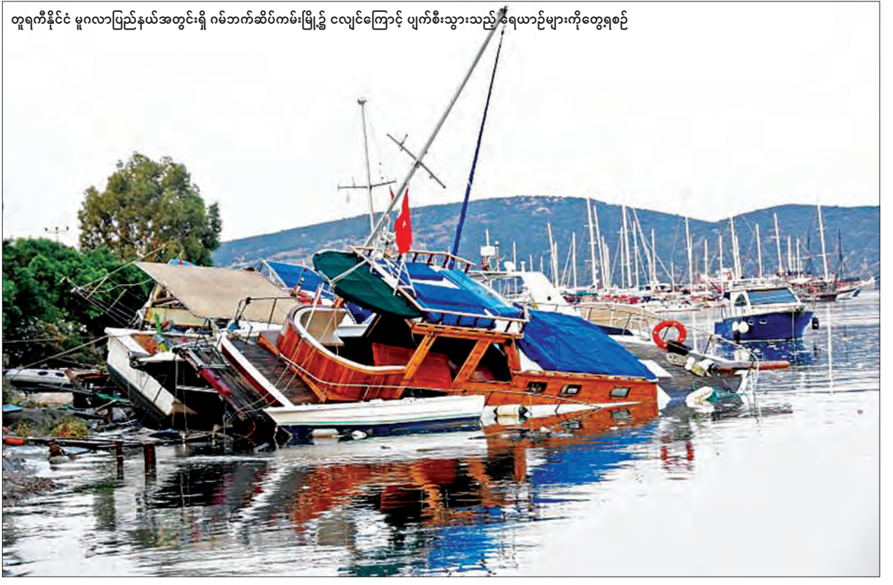
ရန် ရဟတ်ယာဉ်များစေလွှတ်ခဲ့ကြသည်ဟု တောင်ပိုင်း အေဂျီယံဒေသအကြီးအကဲ ယေဘိုဗီဟာဂျီမာကူက ပြောကြားခဲ့သည်။

ဂရိအာဏာပိုင်များသည် ထိခိုက်ဒဏ်ရာရရှိသူများကို လေကြောင်းမှ ကယ်ဆယ်