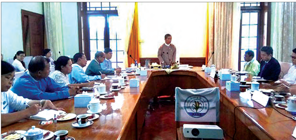
ကျေးလက်ဒေသဖွံ့ဖြိုးရေးအတွက် နှစ်ဆင့်ချေးငွေ Two Step Loan သည် တောင်သူလယ်သမား များအတွက် လိုအပ်သော လယ်ယာသုံး စက်ကိရိယာများ ဝယ်ယူနိုင်ရန် ၂၀၁၇-၂၀၁၈ ခုနှစ်မှ စတင်ဆောင်ရွက်မည့် နှစ်(၄၀) စီမံကိန်းဖြစ်ပြီး ယခုနှစ်တွင် Pilot Project အဖြစ် ပဲခူးတိုင်း ဒေသကြီး ပြည်မြို့နယ်တွင် လာမည့် ဇူလိုင် ၂၃ ရက်မှ စတင်ထုတ်ချေးမည်

ရန်ကုန် ဇူလိုင် ၂၁ ပြည်နယ်/တိုင်း ဒေသကြီးများတွင် လယ်ယာသုံးစက်ကိရိယာများ ရောင်းချ သည့် ဇုန်များဖွင့်လှစ်နိုင်ရန် စီစဉ် ဆောင်ရွက်လျက် ရှိကြောင်း၊ မြန်မာနိုင်ငံ လူဦးရေ၏ ၇၀ ရာခိုင်နှုန်းမှာ ကျေးလက် ဒေသတွင် နေထိုင်သူတောင်သူလယ် သမားများဖြစ်၍ လယ်ယာကဏ္ဍဖွံ့ဖြိုး တိုးတက်ရေးအတွက် အဓိကအရေးကြီးပါ ကြောင်း၊ နိုင်ငံတော်အစိုးရအနေဖြင့် ပုဂ္ဂလိကဖွံ့ဖြိုးရေးအတွက် Public Private Partnership (PPP) ကို ဖော် ဆောင်လျက်ရှိပါကြောင်း စီမံကိန်းနှင့် ဘဏ္ဍာရေးဝန်ကြီးဌာန ပြည်ထောင်စု ဝန်ကြီး ဦးကျော်ဝင်းက ရန်ကုန်မြို့ရှိ မြန်မာ့လယ်ယာဖွံ့ဖြိုးရေးဘဏ်(ရုံးချုပ်) တွင် ပြီးခဲ့သည့် ဇူလိုင် ၁၈ ရက်က ကျင်းပ သည့် မြန်မာ့လယ်ယာဖွံ့ဖြိုးရေးဘဏ်မှ စိုက်ပျိုးရေးနှင့် ကျေးလက်ဒေသဖွံ့ဖြိုးရေး နှစ်ဆင့်ချေးငွေ Two Step Loan စီမံကိန်း တွင် ပါဝင်ကာလယ်ယာသုံးစက်ကိရိယာ