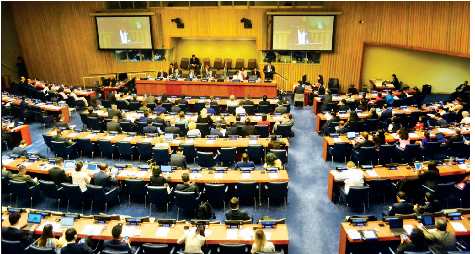
ကုလသမဂ္ဂဌာနချုပ်၌ ကျင်းပသည့် ရေသယံဇာတနှင့် ဘေးအန္တရာယ်များဆိုင်ရာ တတိယအကြိမ် ကုလသမဂ္ဂအထူးအစည်းအဝေးတွင် ဒုတိယသမ္မတ ဦးဟင်နရီပန်ထီးယူ မိန့်ခွန်းပြောကြားစဉ် (သတင်းစဉ်)

လက်ရှိတွင် လူဦးရေသန်းပေါင်း ၆၆၀ ကျော်သည် ရေရှားပါးသည့် နေရပ်ဒေသတွင် စာမျက်နှာ ၄ ကော်လံ ၁ *