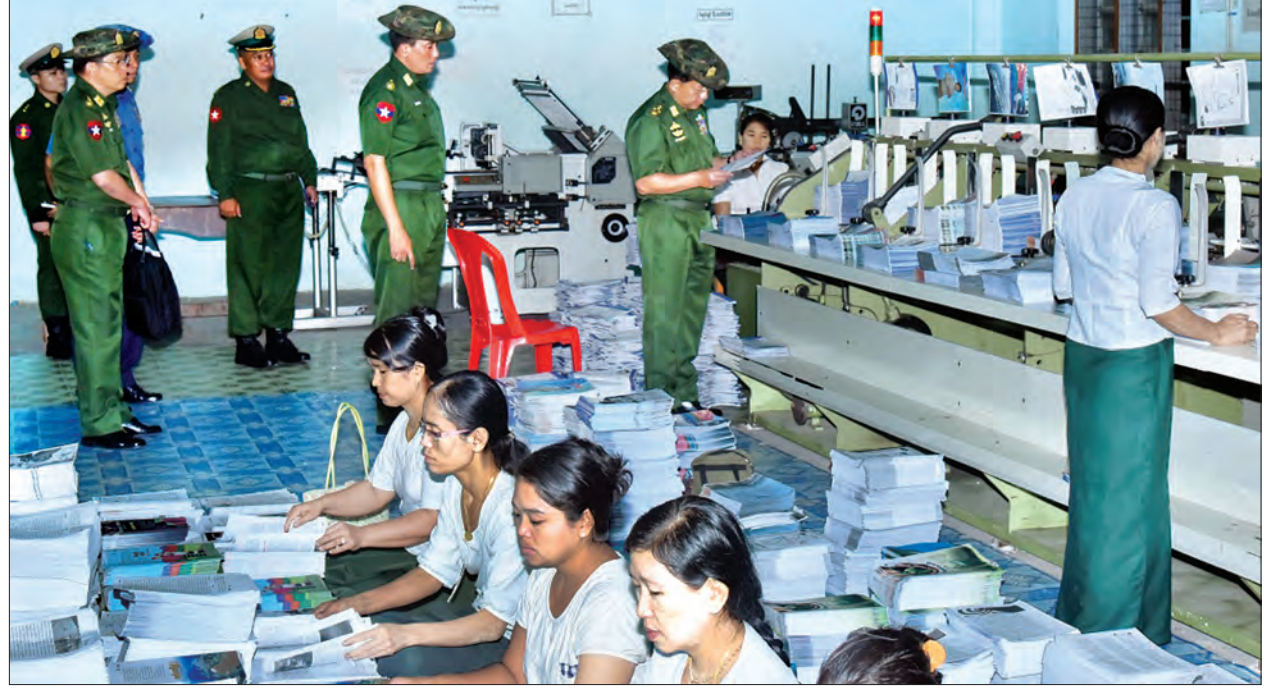
တပ်မတော်ကာကွယ်ရေးဦးစီးချုပ် ဝိုင်းချုပ်မှူးကြီးမင်းအောင်လှိုင် မြဝတီစာပေတိုက်၌ ပုံနှိပ်ဖြန့်ချိရေးလုပ်ငန်းများ ကြည့်ရှုစစ်ဆေးစဉ်

နေပြည်တော် ဇူလိုင် ၂၁ တပ်မတော် ကာကွယ်ရေးဦးစီးချုပ် ဝိုင်းချုပ်မှူးကြီး မင်းအောင်လှိုင်သည် ယနေ့ နံနက်ပိုင်းတွင် ရန်ကုန်မြို့ရှိ မြဝတီစာပေတိုက်သို့ သွားရောက်ကြည့်ရှုစစ်ဆေးသည်။