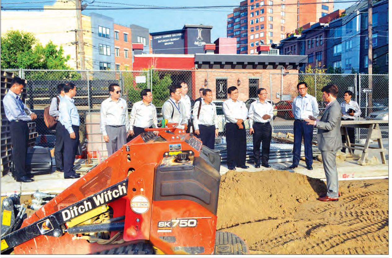
ဒုတိယသမ္မတ ဦးဟင်နရီပန်ထီးယူ နုယူးဂျာစီပြည်နယ် ဂျာစီမြို့နှင့် ဟိုဘိုကမ်မြို့များ သဘာဝဘေးအန္တရာယ်နှင့် ရေကြီးရေလျှံမှု တားဆီးရေးမြို့ပြလုပ်ငန်းများကို ကြည့်ရှု လေ့လာစဉ်

ပူးပေါင်းပါဝင် မြန်မာနိုင်ငံအနေဖြင့် သဘာဝ ဘေးဒဏ်ကို ခုခံရင်ဆိုင်ရာတွင် ငွေကြေးထောက်ပံ့နိုင်ရန်နှင့် သဘာဝ ဘေးအန္တရာယ်ဆိုင်ရာ အာမခံထားရှိ နိုင်ရန်အတွက် ကမ္ဘာ့ဘဏ်၏ အရှေ့ တောင်အာရှ သဘာဝဘေးအန္တရာယ်