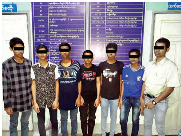
မြဝတီမြို့ရှိ ကရင်ပြည်နယ် မြဝတီမြို့တွင် တစ်ဖက်ထိုင်းနိုင်ငံမှ ပြန်လည်ဝင်ရောက်လာသော ရွှေပြောင်းလုပ်သားများ ပြန်လည်လက်ခံရေး ကျောက်လုံးကြီးကြိုဆိုရေးစခန်း၌

မြဝတီ ဇူလိုင် ၂၁ ကရင်ပြည်နယ် မြဝတီမြို့တွင် တစ်ဖက်ထိုင်းနိုင်ငံမှ ပြန်လည်ဝင်ရောက်လာသော ရွှေပြောင်းလုပ်သားများ ပြန်လည်လက်ခံရေး ကျောက်လုံးကြီးကြိုဆိုရေးစခန်း၌