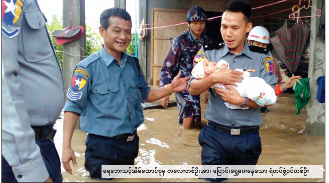
ရေဘေးသင့်အိမ်ထောင်စုမှ ကလေးတစ်ဦးအား ပြောင်းရွှေ့ပေးနေသော ရဲတပ်ဖွဲ့ဝင်တစ်ဦး

လှိုင်းဘွဲမြို့နယ်တွင် သံလွင်မြစ်ရေ၏ စိုးရိမ် ရေမှတ်မှာ ၉၈၀ စင်တီမီတာဖြစ်ရာ ဇူလိုင် ၁၉ ရက် နံနက် ၉ နာရီ ၄၅ မိနစ်အချိန်တွင် မြစ် ရေသည် ၁၀၀၀ စင်တီမီတာအထိ မြင့်တက်လာ ခြင်းကြောင့် အနိမ့်ပိုင်းရပ်ကွက်များတွင် ရေများ ဝင်ရောက်နေသဖြင့် ပြည်သူများအား ဘေးလွတ် ရာသို့ ပြောင်းရွှေ့ပေးနေရခြင်းဖြစ်ကြောင်း သိရ သည်။ မင်းသူ / ထွန်းထွန်းထွေး(ဘားအံ)