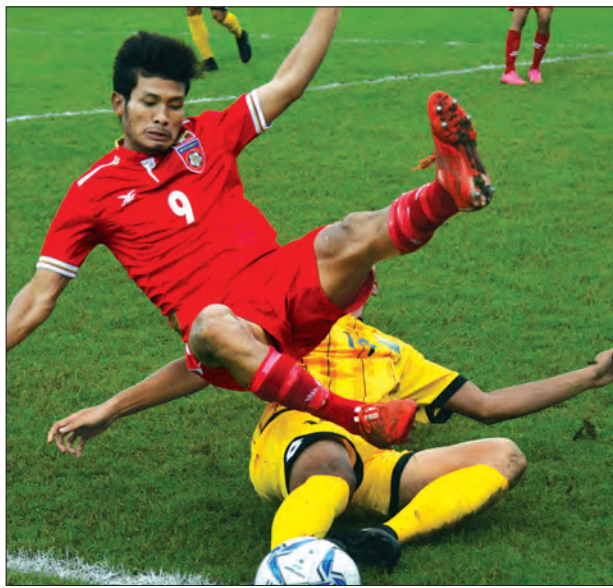
မြန်မာနှင့်ဘရူနိုင်းအသင်း ယှဉ်ပြိုင်နေစဉ်