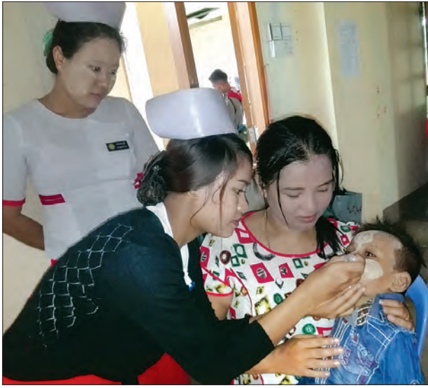
သာသနာ့ဗိမာန်၌ ပြုလုပ်သော ကာကွယ် ဆေးတိုက်ကျွေးခြင်း အခမ်းအနားတွင် ပြောသည်။ အဆိုပါ ပိုလီယိုကာကွယ်ဆေး တိုက်ကျွေးခြင်းကို ရခိုင်ပြည်နယ် ၁၇ မြို့နယ်တွင် ဇူလိုင် ၂၁ ရက်မှ ၂၅ ရက်အထိ