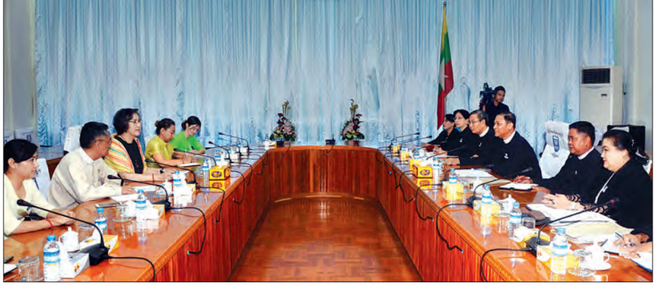
ပြည်ထောင်စုရှေ့နေချုပ် ဦးထွန်းထွန်းဦးနှင့် မစ္စ ယန်ဟီလီတို့ တွေ့ဆုံဆွေးနွေးစဉ်

ပြည်ထောင်စုရှေ့နေချုပ်ရုံးအနေဖြင့် ဥပဒေနှင့်အညီ ဖြစ်ရေး၊ မှန်ကန်တရားမျှတမှုရှိရေး၊ နှောင့်နှေးကြန့်ကြာမှု မရှိစေရေးတို့ အတွက် ဆောင်ရွက်လျက်ရှိသည့် အခြေအနေများနှင့် တိုင်းဒေသကြီးနှင့် ပြည်နယ်အလိုက် တရားဥပဒေစိုးမိုးရေးဌာန နှင့် တရားမျှတမှုဆိုင်ရာလုပ်ငန်းများ ပေါင်းစပ်ညှိနှိုင်းရေးအဖွဲ့ ခွဲများ ဖွဲ့စည်းဆောင်ရွက်လျက်ရှိသည့် အခြေအနေများနှင့် စပ်လျဉ်း၍လည်းကောင်း၊ လယ်ယာမြေနှင့် အခြားမြေများ သိမ်းဆည်းခံရမှုများ ပြန်လည်စိစစ်ရေးပဟိုကော်မတီ အတွင်း ရေးမှူး ဝိုလ်ချုပ်အောင်စိုးနှင့် တွေ့ဆုံစဉ် သိမ်းဆည်းလယ်ယာ မြေများနှင့် အခြားမြေများ မူလပိုင်ရှင်ထံ ပြန်လည်လွှဲပြောင်း ပေးအပ်နိုင်ရေး ဆောင်ရွက်လျက်ရှိသည့် အခြေအနေများနှင့် စပ်လျဉ်း၍လည်းကောင်း ဆွေးနွေးခဲ့ကြောင်း သိရသည်။ (သတင်းစဉ်)