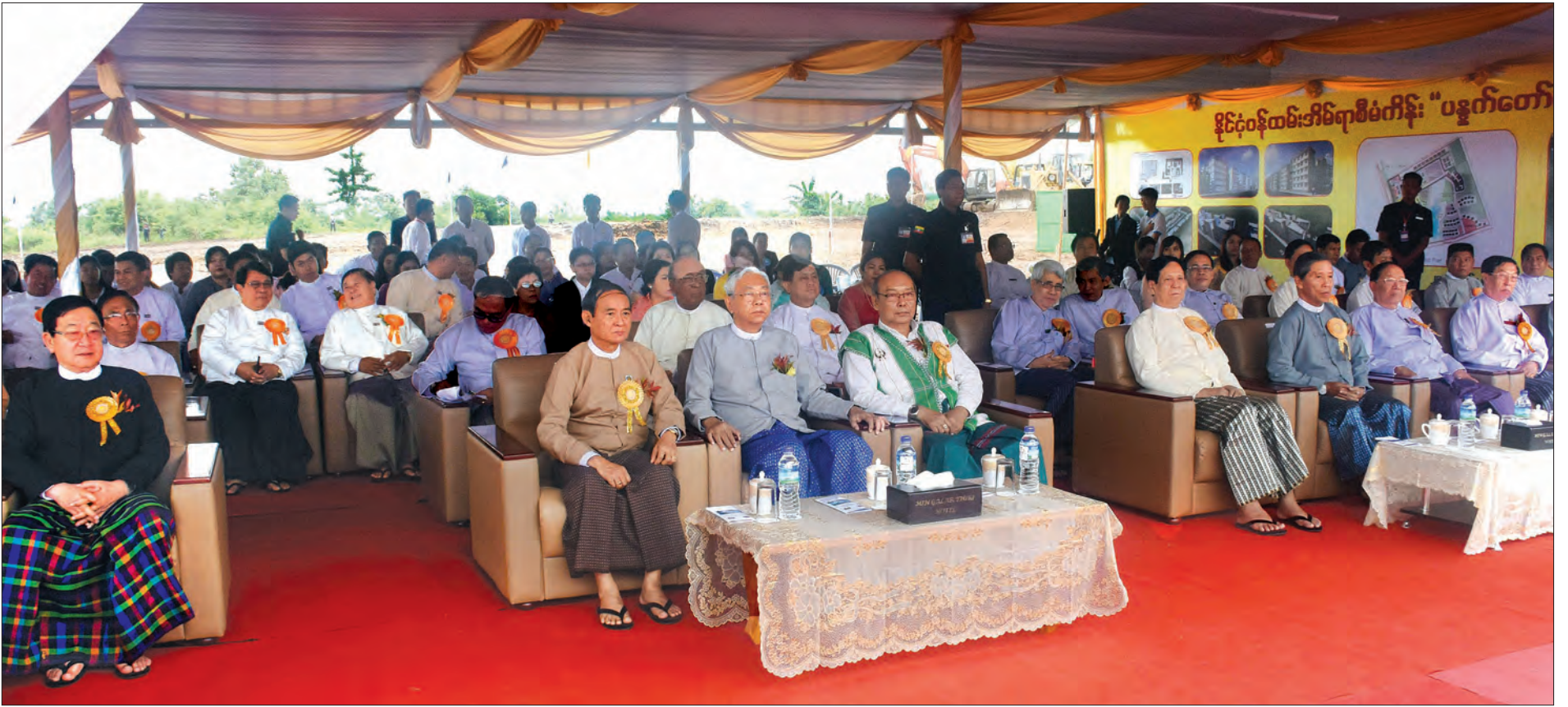
နိုင်ငံတော်သမ္မတ ဦးထင်ကျော် နေပြည်တော် နိုင်ငံတော်ဝန်ထမ်းအိမ်ရာ ပန္နက်တော်တင်ခြင်းအခမ်းအနားသို့ တက်ရောက်စဉ်

* ရှေ့မှ နေပြည်တော်ကောင်စီဥက္ကဋ္ဌ ဒေါက်တာ မျိုးအောင်၊ ဒုတိယဝန်ကြီးများ၊ နေပြည်တော်ကောင်စီဝင်များ၊ ဌာနဆိုင်ရာ အကြီးအကဲများ၊ မြန်မာနိုင်ငံ ဆောက်လုပ်ရေး လုပ်ငန်းရှင်များ အသင်းဥက္ကဋ္ဌနှင့် အသင်းဝင်များ၊ ဖိတ်ကြားထားသူများနှင့် တာဝန်ရှိသူများ တက်ရောက်ကြသည်။