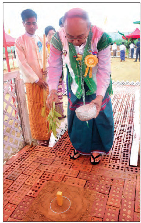
အမျိုးသားလွှတ်တော်ဥက္ကဋ္ဌ မန်းဝင်းခိုင်သန်း ပန္နက်တော်အား နံ့သာရည်ပတ်ဖျန်းပေးစဉ် (သတင်းစဉ်)