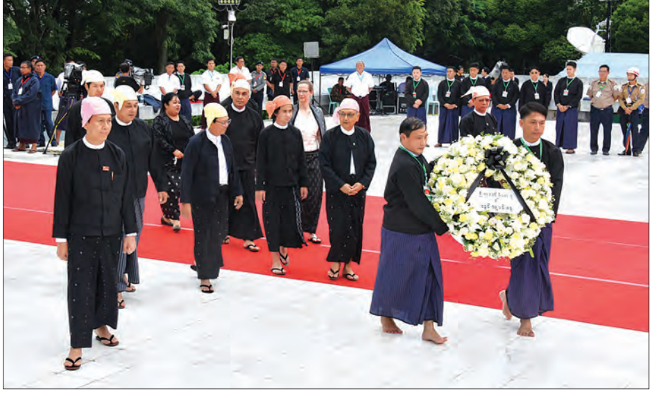
ဦးရာဇတ်ဂူပိမာန်၌ ဦးရာဇတ်၏မိသားစုများ လွမ်းသွပ်ပန်းခွေချရန် လာရောက်စဉ် (သတင်းစဉ်)