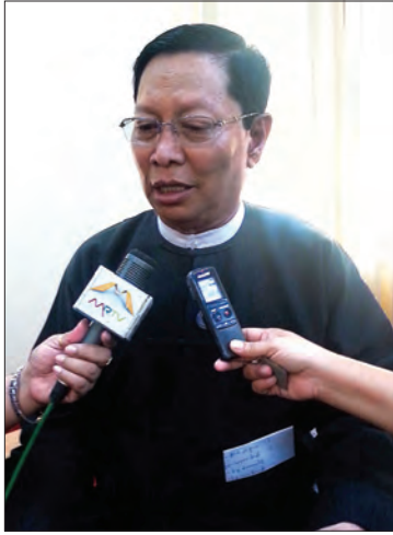
သာသနာရေးနှင့် ယဉ်ကျေးမှုဝန်ကြီးဌာန ပြည်ထောင်စုဝန်ကြီး သူရဦးအောင်ကို