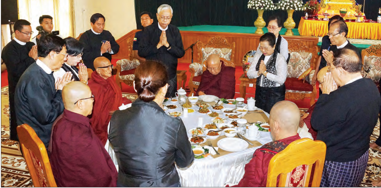
နိုင်ငံတော်သမ္မတ ဦးထင်ကျော်နှင့် ဇနီး ဒေါ်စုစုလွင်နှင့် ဧည့်ပရိသတ်များ ဆရာတော် သံဃာတော်များအား နေ့ဆွမ်းဆက်ကပ်လှူဒါန်းကြစဉ် (သတင်းစဉ်)

ဒုတိယ တပ်မတော်ကာကွယ်ရေး ဦးစီးချုပ်ကာကွယ်ရေးဦးစီးချုပ် (ကြည်း) ဒုတိယဗိုလ်ချုပ်မှူးကြီး စိုးဝင်းနှင့် ဇနီးဒေါ်သန်းသန်းနွယ်တို့က ဆရာတော် သံဃာတော်များအား လှူဖွယ်ဝတ္ထု ပစ္စည်းများ ဆက်ကပ်လှူဒါန်းကြ သည်။