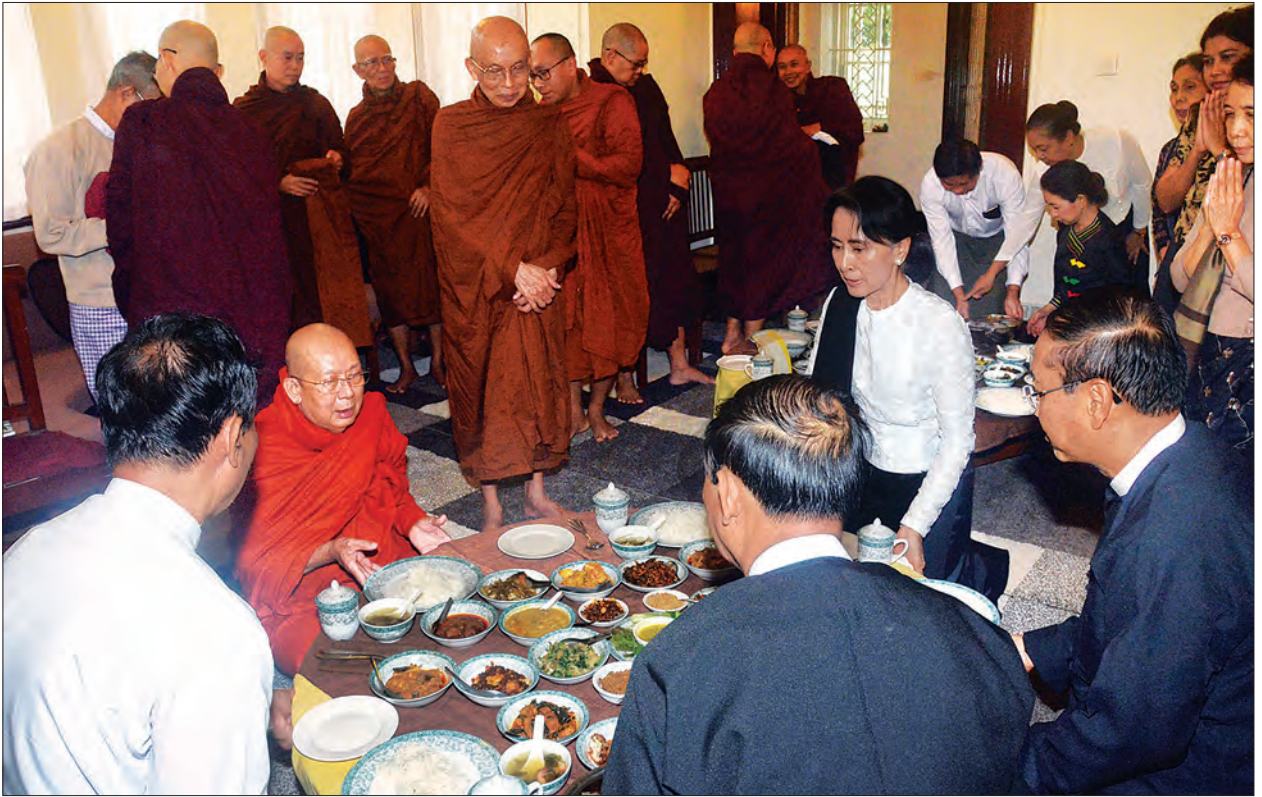
ဖခင်ဖြစ်သူ ဝိုလ်ချုပ်အောင်ဆန်းနှင့်တကွ အာဇာနည်ခေါင်းဆောင်ကြီးများအား ရည်စူး၍ သံဃာတော်အရှင်သူမြတ်များအား နိုင်ငံတော်၏ အတိုင်ပင်ခံပုဂ္ဂိုလ် ဒေါ်အောင်ဆန်းစုကြည်နှင့် ဧည့်ပရိသတ်များ နေဆွမ်းဆက်ကပ်လှူဒါန်းကြစဉ် (သတင်းစဉ်)

ရှေးဦးစွာ အရှင်ဝိရိယ (ဓမ္မဘေရီ) တောင်စွန်းဆရာတော်ထံမှ နိုင်ငံတော်၏ အတိုင်ပင်ခံပုဂ္ဂိုလ် ဒေါ်အောင်ဆန်းစုကြည်နှင့်အတူ ဧည့်ပရိသတ်များက ငါးပါးသီလခံယူဆောက်တည်ကြပြီး ဆရာတော် သံဃာတော်များအား လှူဖွယ်ဝတ္ထုပစ္စည်းများ ဆက်ကပ်လှူဒါန်းကြသည်။ ဆက်ကပ်လှူဒါန်း ထို့နောက် ဖခင်ဖြစ်သူ ဝိုလ်ချုပ်အောင်ဆန်းနှင့်တကွ အာဇာနည်ခေါင်းဆောင်ကြီးများအား ရည်စူး၍ နိုင်ငံတော်၏ အတိုင်ပင်ခံပုဂ္ဂိုလ် ဒေါ်အောင်ဆန်းစုကြည်နှင့် ဧည့်ပရိသတ်များက ရေစက်သွန်းချအမျှပေးဝေကာ ဆရာတော် သံဃာတော်များအား နေဆွမ်းဆက်ကပ်လှူဒါန်းခဲ့သည်။ (သတင်းစဉ်)