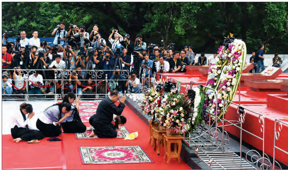
သခင်မြဂူဝိမာန်နှင့် သခင်မြ၏မိသားစုများ လွမ်းသူပန်းခြေချကန်တော့စဉ် (သတင်းစဉ်)