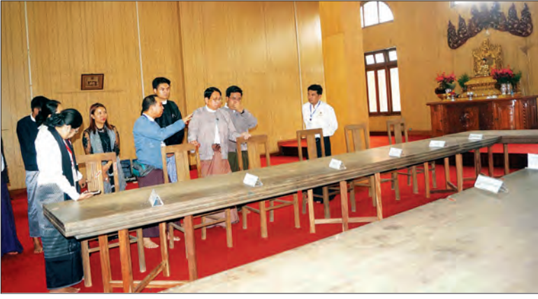
ပြန်ကြားရေး ဝန်ကြီးဌာန ပြည်ထောင်စု ဝန်ကြီး ခေါက်တာစေမြင့် နှစ်(၇၀) ပြည့် အာဇာနည်နေ့တွင် ဝန်ကြီးများရုံး (ယခင် အတွင်းဝန်ရုံး)၌ ဖွင့်လှစ် ပြသထားသော အာဇာနည် ခေါင်းဆောင်ကြီးများ၏ အထိမ်းအမှတ်ပြခန်းများကို လှည့်လည်ကြည့်ရှုစဉ် (ပြန်/ဆက်)