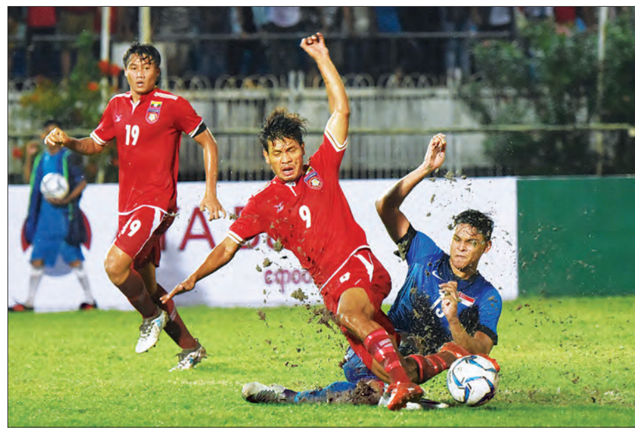
မြန်မာအသင်းနှင့် စင်ကာပူအသင်းတို့ ယှဉ်ပြိုင်ကစားစဉ်