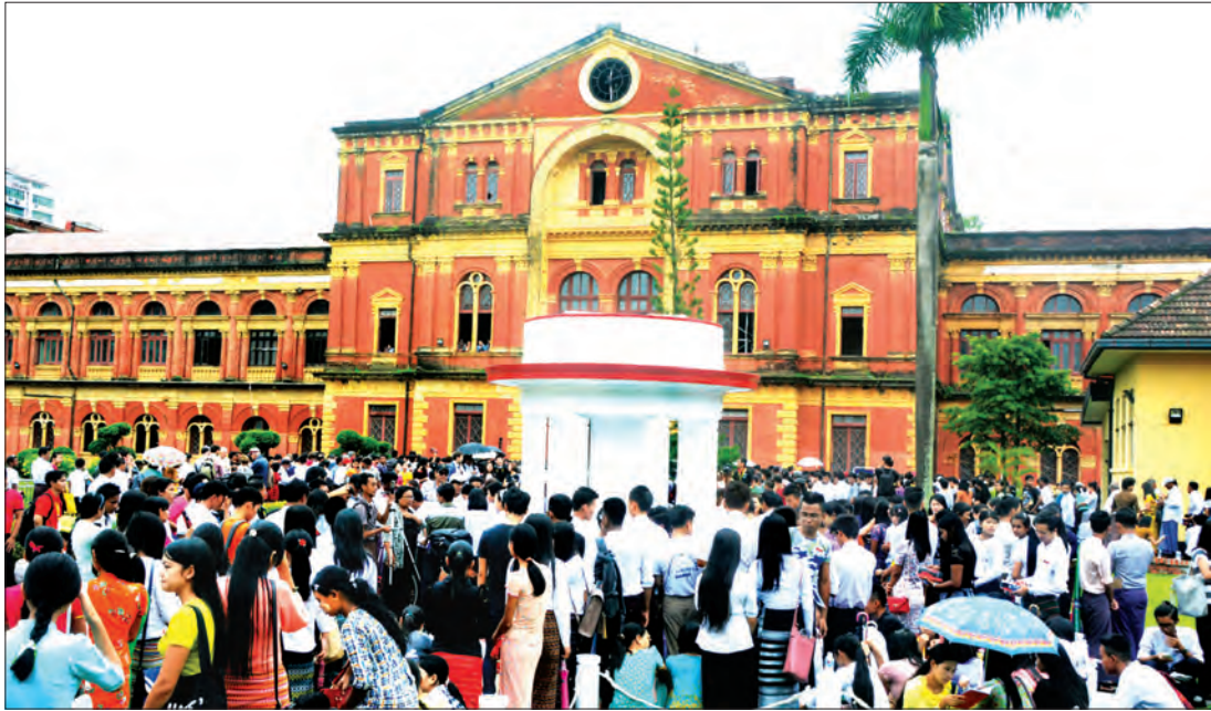
အာဇာနည်နေ့တွင် သိမ်ဖြူလမ်းရှိ ဝန်ကြီးများရုံး (ယခင်အတွင်းဝန်ရုံး)သို့ လာရောက်ကြည့်ရှု လေ့လာသူများကို တွေ့ရစဉ်

ရန်ကုန်မြို့သိမ်ဖြူလမ်းရှိ ယခင်အတွင်းဝန်ရုံး(ဝန်ကြီးများရုံး)ဟောင်းကို ၂၀၁၅ ခုနှစ်မှစတင်ကာ နှစ်စဉ် အာဇာနည်နေ့ကျရောက်တိုင်း လွတ်လပ်ရေးဖေ့ဒေကြီး ဗိုလ်ချုပ်အောင်ဆန်းနှင့် ကျဆုံးအာဇာနည်ခေါင်းဆောင်ကြီးများအား လုပ်ကြံခံခဲ့ရသည့် အတွင်းဝန်ရုံး ပထမထပ် အစည်းအဝေးခန်းမအပါအဝင် အာဇာနည်ခေါင်းဆောင်ကြီးများ ကြိုးပမ်းလှုပ်ရှားခဲ့သော ပုံရိပ်များကို ပြည်သူများအား ဖွင့်လှစ်ပြသပေးခဲ့သည်။ နှစ်စဉ် နံနက် ၈ နာရီမှ ညနေ ၅ နာရီအထိ ဖွင့်လှစ်ခဲ့ပြီး ယနေ့အပါအဝင် ပြည်သူများအား လေ့လာခွင့်ပြုခဲ့သည်မှာ သုံးနှစ်ပြည့်မြောက်ခဲ့ပြီ ဖြစ်သည်။ သုံးနှစ်ပြည့်မြောက်သည့် ယနေ့ နှစ်(၇၀)ပြည့် အာဇာနည်နေ့တွင် ရဟန်း၊ သံဃာ၊ သီလရှင် အပါအဝင် ပြည်သူ ၃၂၀၀၀ ဦး လာရောက်လေ့လာခဲ့ပြီး ပြည်ပ နိုင်ငံခြားသား လာရောက်လေ့လာမှုသည်လည်း ၂၀၅ ဦး လာရောက်လေ့လာကြည့်ရှုခဲ့ကြောင်း သိရသည်။