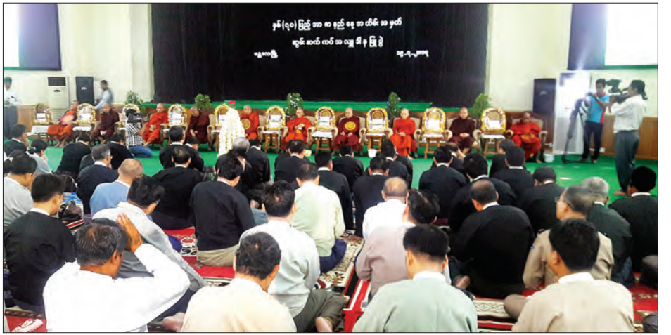
တိုတွင်းလည်း နှစ်(၇၀) ပြည့် အာဇာနည်နေ့အထိမ်းအမှတ် ကြီးများ ဆောင်ရွက်ခဲ့ကြကြောင်း သိရသည်။ အာဇာနည်ခေါင်းဆောင်ကြီးများအား ရည်စူး၍ ဆွမ်းဆက်ကပ် တင်မောင် (မန်းကိုယ်ပွား)

ထို့နောက် တိုင်းဒေသကြီး သံဃာယကအဖွဲ့ဥက္ကဋ္ဌ မစိုးရိမ်တိုက်သစ် ပါဠိနယူ ပဒေသာကျောင်းဆရာတော်ထံမှ အနုမောဒနာတရားတော်များ နာယူကြည့်ညိကြပြီး တိုင်း ဒေသကြီးဝန်ကြီးချုပ်နှင့် တာဝန်ရှိသူများက ရေစက်သွန်းချ အမှုပေးကြောင်းအကြောင်း အလားတူ တိုင်းဒေသကြီးအတွင်းရှိ မြို့နယ်အသီးသီး