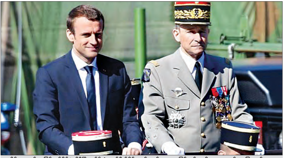
ဇူလိုင် ၁၄ ရက်က ပြင်သစ်နိုင်ငံ ပါရီမြို့ ချမ်းသာလက်စီရိပ်သာ၌ ကျင်းပသော ပြင်သစ်အမျိုးသားနေ့ စစ်ရေးပြအခမ်းအနားတွင် ပြင်သစ်သမ္မတ မက်ရွန်နှင့် ကာကွယ်ရေးဦးစီးချုပ် ဝိုလ်ချုပ် ပီယဲဒီဗီလီရာတို့ကို တွေ့ရစဉ်

ပါရီ ဇူလိုင် ၁၉ ပြင်သစ်နိုင်ငံတွင် ကာကွယ်ရေးဆိုင်ရာ ဘတ်ဂျက်အသုံးပြုမှုကို သမ္မတမက်ရွန်က လျှော့ချလိုက်သည်ကိုစွန့်ခွာ စီမံလျှော့ချမှုမကျေမချမ်းဖြစ်ဖွယ်ရာ အငြင်းပွားမှုများ ပေါ်ပေါက်လာပြီးနောက်တွင် ပြင်သစ်ကာကွယ်ရေးဦးစီးချုပ် ဝိုလ်ချုပ် ပီယဲ ဒီဗီလီရာက ငွေပေးရန်နှင့် ရာထူးမှ နုတ်ထွက်ခဲ့ကြောင်း သိရသည်။ ကာကွယ်ရေးအသုံးစရိတ်လျှော့ချမှုသည် အသစ်ရွေးချယ်တင်မြှောက်ထားသည့် သမ္မတမက်ရွန်၏ ကြံ့ကြံခံနိုင်စွမ်းကိုကနဦးစမ်းသပ်သည့် အခြေအနေတစ်ရပ်အဖြစ်သို့ ရောက်ရှိစေခဲ့သည်။ ဖော်ပြချက်၌ အသက် ၆၀ ရှိပြီဖြစ်သည့် ပီယဲဒီဗီလီရာက ၎င်းသည်ဘဏ္ဍာရေးစည်းမျဉ်းကန့်သတ်ချက်များစွာရှိနေသည့်အထဲတွင် အင်အားစိုက်ထုတ်လျက်ပြင်သစ် ကာကွယ်ရေးအင်အားစိုက်ထုတ်စီမံထိန်းသိမ်းရန် ကြိုးစားခဲ့ကြောင်း သို့သော်လည်း လက်ရှိအခြေအနေကို ရေရှည်ထိန်းသိမ်းရန် မစွမ်းဆောင်နိုင်တော့ကြောင်း ပြောကြားခဲ့သည်ဟု သိရသည်။ ရာထူးမှ နုတ်ထွက်မှုကို သမ္မတမက်ရွန်ကလက်ခံခဲ့ကြောင်း ဒီဗီလီရာက ပြောကြားခဲ့သည်။ မက်ရွန်အား ပြင်သစ်သမ္မတအဖြစ် ရွေးကောက်တင်မြှောက်ခဲ့ပြီး နှစ်လခန့်အကြာတွင် မက်ရွန်နှင့် ဒီဗီလီရာတို့အကြား အငြင်းအထန်မကျေမလည်ဖြစ်မှုများပေါ်ပေါက်ခဲ့သည်ဟု သတင်းရင်းမြစ်များက ပြောသည်။ ၎င်းသည်မက်ရွန်က ကာကွယ်ရေးအသုံးစရိတ်ယူရိုသန်း ၅၅၀ (အမေရိကန်ဒေါ်လာ ၉၇၉ ဒသမ ငွေသန်း) ကို လျှော့ချလိုက်ခြင်းကို ပြင်းထန်သည့် စကားလုံးများဖြင့် ကန့်ကွက်ပြောဆိုမှုများပြုလုပ်ခဲ့သည်ဟု သိရသည်။ ယခုကဲ့သို့ရွေးချယ်သောလုပ်ရပ်များပြုလုပ်ရန် မိမိကိုယ်ကိုယ်အဖြစ်ခံလိမ့်မည်မဟုတ်ဟု ပြောဆိုခဲ့ကြောင်း လွှတ်တော်နှစ်ရပ်မှ သတင်းရင်းမြစ်များက ပြောကြားခဲ့သည်။ (ရိုက်တာ)