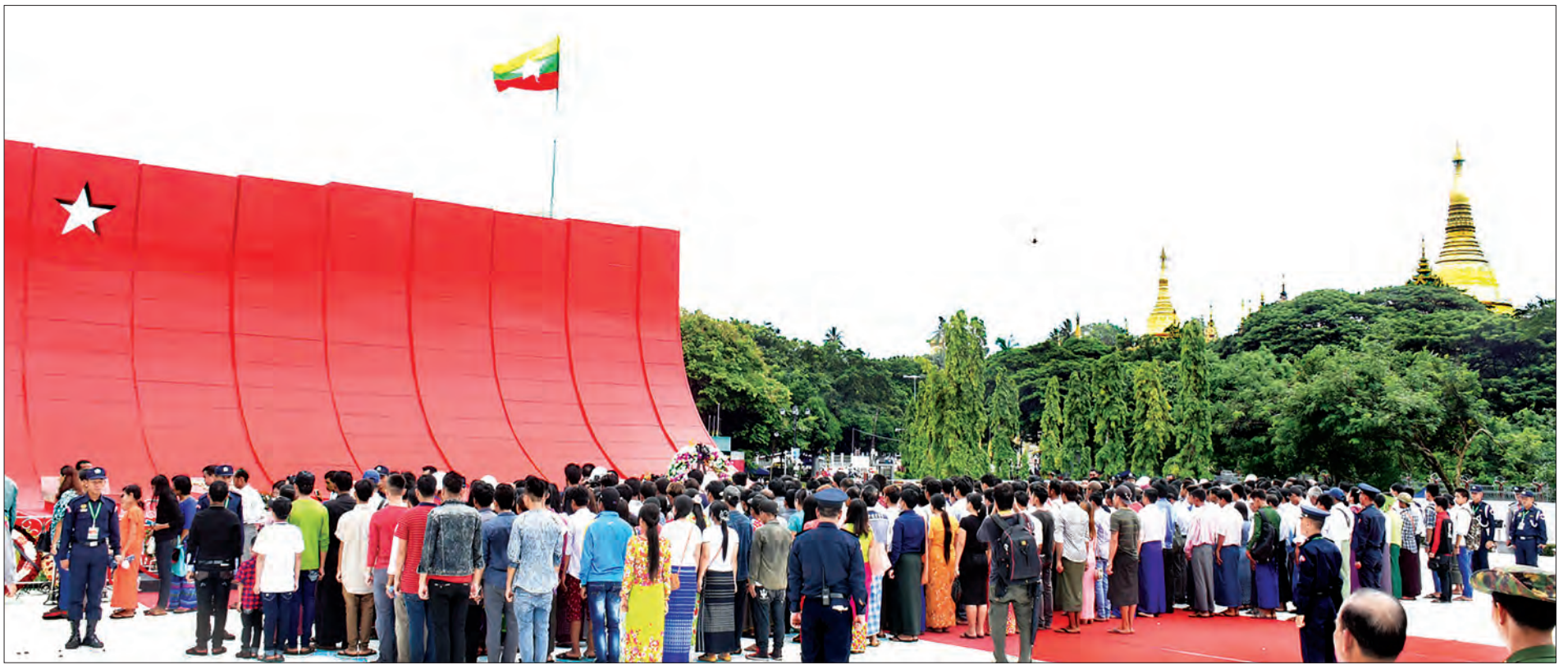
နှစ်(၇၀)ပြည့် အာဇာနည်နေ့အခမ်းအနားတွင် ရန်ကုန်မြို့ပဟန်းမြို့နယ်ရှိ အာဇာနည်ပိမာန်၌ ပြည်သူများ အလေးပြုကြစဉ်

အာဇာနည်ခေါင်းဆောင်ကြီးများ၏ အထိမ်းအမှတ်ဂူပိမာန်၌ လွမ်းသူ့ပန်းခွေချဂါရဝပြု