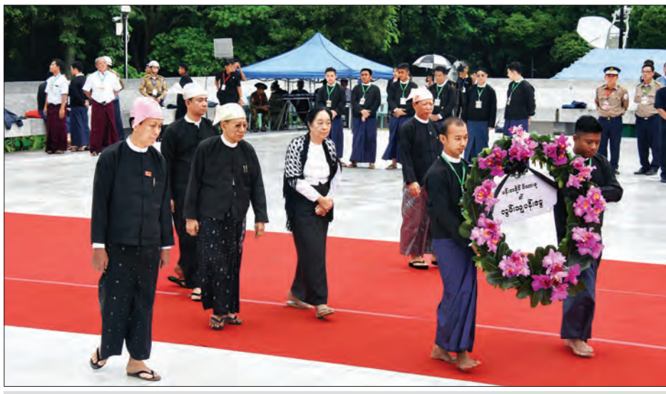
မန်းဘခိုင်ဂူဝိမာန်နှင့် မန်းဘခိုင်၏မိသားစုများ လွမ်းသူပန်းခြေချရန် လာရောက်စဉ် (သတင်းစဉ်)