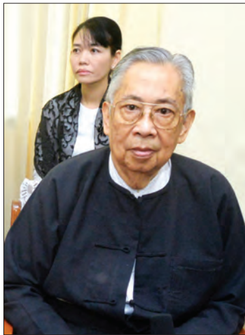
အာဇာနည်ခေါင်းဆောင်ကြီး မိုင်းပွန်စော်ဘွားကြီး စစ်စံထွန်း၏သား စစ်ကိုင်း