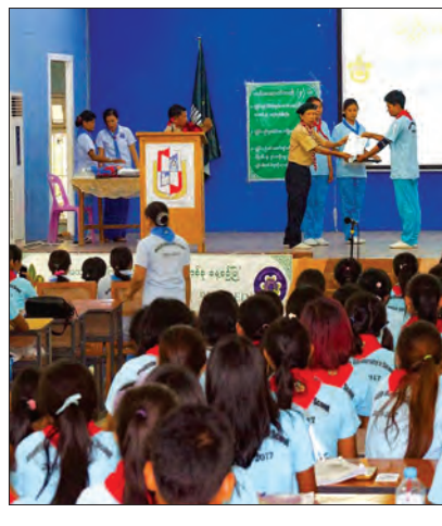
ချမ်းသာ (မိတ္ထီလာ)

ဒဿကဗေဒဌာန ပါမောက္ခ (ဌာနမှူး) ဒေါက်တာအေးအေးမာထံ ပေးအပ်ခဲ့သည်။