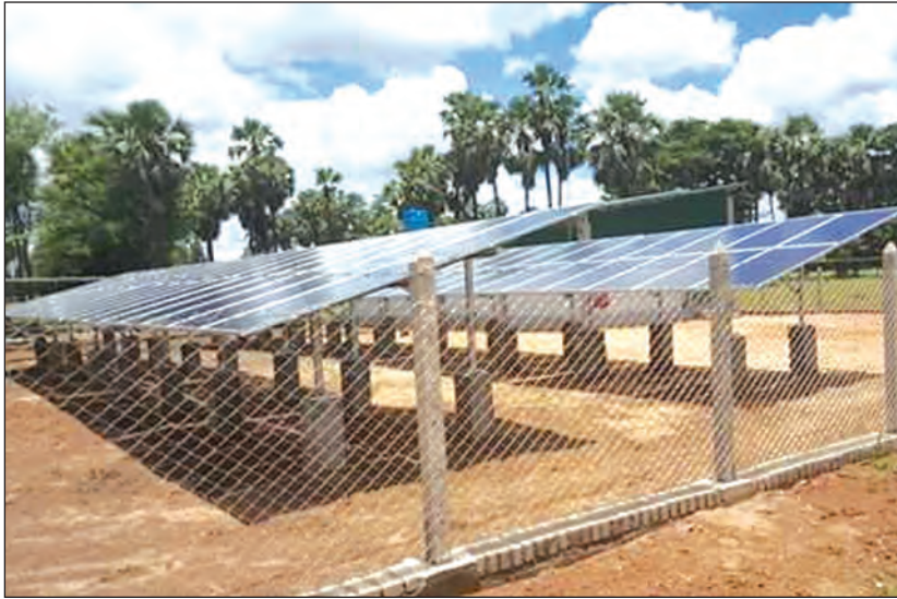
အသေးစား ဆိုလာမီးပေးစနစ်အတွက် တပ်ဆင်ထားသော ဆိုလာပြားများ

ယခုလက်ရှိတွင် NEP စီမံချက်ဖြင့် မီးလင်းရေးလုပ်ငန်းများကို တစ်အိမ်သုံးဆိုလာစနစ်ဖြင့်လည်းကောင်း၊ အသေးစား ဆိုလာမီးပေးစနစ်ဖြင့်လည်းကောင်း ဆောင်ရွက်လျက်ရှိကာ မီးရရှိသောကျေးရွာများတွင် အိမ်သွယ်ရေတိုင်ဖြင့် ရေရယူသုံးစွဲခြင်းများကို ဆောင်ရွက်လာနိုင်ပြီး ရေနှင့် လျှပ်စစ်မီးများ ရရှိလာ