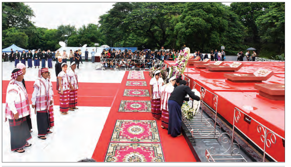
မန်းဘခိုင်ဂူဝိမာန်နှင့် မန်းဘခိုင်၏မိသားစုများ လွမ်းသူပန်းခြေချစဉ် (သတင်းစဉ်)