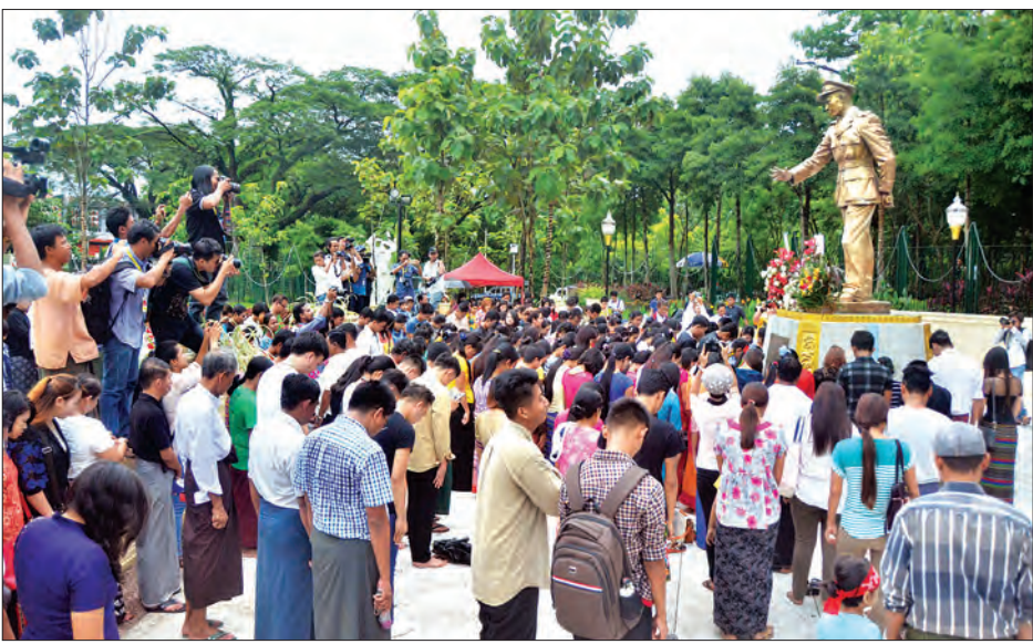
နှစ်(၇၀)ပြည့် အာဇာနည်နေ့တွင် ဗိုလ်ချုပ်အောင်ဆန်းကြေးရုပ်တုအား လာရောက်အလေးပြုသူများကို တွေ့ရစဉ်

ယနေ့တွင် နံနက်ပိုင်းစ၍ လူပုဂ္ဂိုလ်များ၊ မိသားစုများ၊ ကျောင်းသားများနှင့် ရဟန်းသံဃာတော်များသည် တစ်ဦးတစ်ယောက်ချင်းသော်လည်းကောင်း၊ အစုအဖွဲ့အလိုက် သော်လည်းကောင်း ဗိုလ်ချုပ်အောင်ဆန်းကြေးရုပ်တုရိရာသို့ ပန်းစည်းများ လာရောက်ချမ်းမြေ့ခြင်း၊ ဗိုလ်ချုပ်အောင်ဆန်း အမှတ်တရစကားများပြောဆိုခြင်း၊ နိုင်ငံတော်သီချင်းကို သံပြိုင် သီဆိုခြင်းစသော ဦးညွှတ်ဂါရဝပြုခြင်းများဖြင့် လာရောက် အလေးပြုခဲ့ကြသည်။ ဗိုလ်ချုပ်အောင်ဆန်းအပါအဝင် နိုင်ငံခေါင်းဆောင်ကြီးများ ကျဆုံးချိန်ဖြစ်သော ၁၀ နာရီ ၃၇ မိနစ်တွင် လာရောက်ဂါရဝပြုသူအားလုံး ငြိမ်သက်စွာအလေးပြုခဲ့ကြပြီး အနီးအနားရှိ ကြက်ခြေနီယာဉ်များမှ ပြည့်သံရှည်များဆွဲ၍ လည်းကောင်း၊ ကားတွန်းများ အဆက်မပြတ်တီးခြင်းများဖြင့် လည်းကောင်း အာဇာနည်ခေါင်းဆောင်ကြီးများအား အလေးပြုခဲ့ကြသည်။ သင်တန်းတက်ရောက်ရန်အတွက် ရန်ကုန်မြို့သို့ ရောက်ရှိနေသည့် ရှမ်းပြည်နယ်တောင်ပိုင်း ဟိုပုံးမြို့ နောင်တောင်းဘုန်းတော်ကြီးသင်ပညာရေးကျောင်းမှ အဖိုးခင်က ဗိုလ်ချုပ်အောင်ဆန်းကြေးရုပ်တုကို လာရောက်ဂါရဝပြု