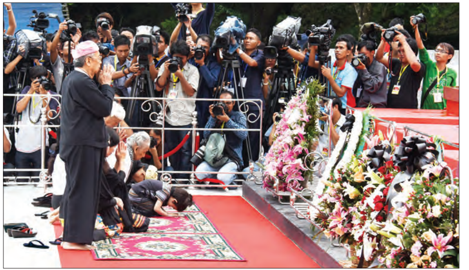
မိုင်းပွန်စော်ဘွားကြီး စဝ်စံထွန်းဂူဝိမာန်နှင့် မိုင်းပွန်စော်ဘွားကြီး စဝ်စံထွန်း၏ မိသားစုများ လွမ်းသူပန်းခြေချကန်တော့စဉ် (သတင်းစဉ်)