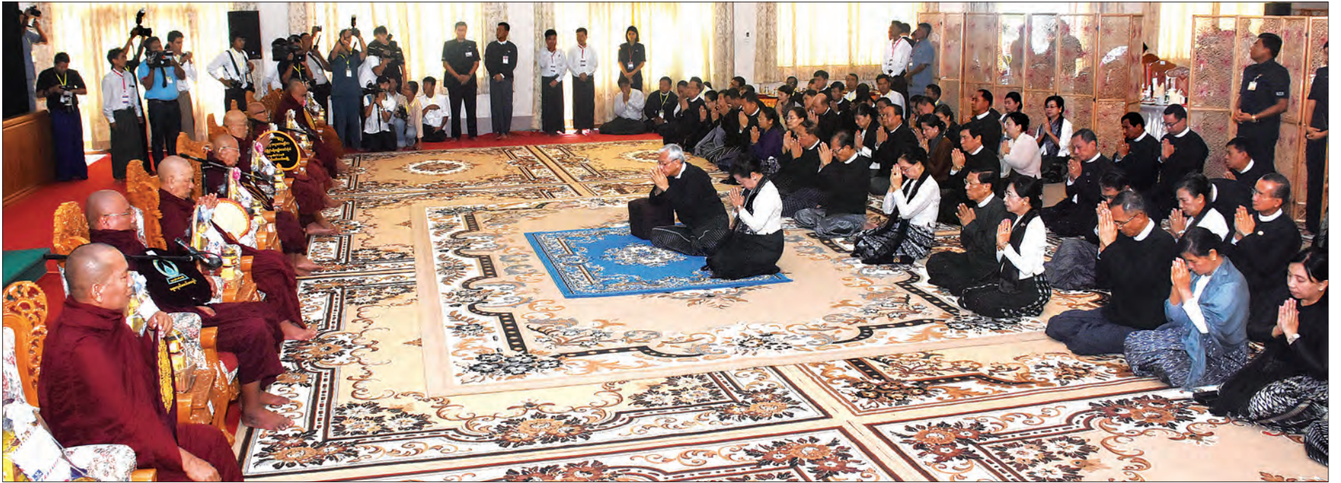
နိုင်ငံတော်သမ္မတ ဦးထင်ကျော်နှင့် ဇနီး ဒေါ်စုစုလွင်နှင့် ဧည့်ပရိသတ်များ နိုင်ငံတော်ဩဝါဒါစရိယ အဘိဓဇမဟာရဋ္ဌဂုရု မဟာဝိသုတာရာမ ဈေးကုန်းကျောင်းတိုက် ပဓာနနာယကဆရာတော် ဘဒ္ဒန္တ ကဝိသာရထံမှ ငါးပါးသီလ ခံယူဆောက်တည်ကြစဉ် (သတင်းစဉ်)

နေပြည်တော် ဇူလိုင် ၁၉ နှစ်(၇၀)ပြည့် အာဇာနည်နေ့တွင် နိုင်ငံတော်အတွက် အသက်ပေးလှူ သွားကြသည့် အာဇာနည်ခေါင်းဆောင် ကြီးများအားရည်စူး ကုသိုလ်ပြုအမျှ ပေးဝေခြင်း အခမ်းအနားကို ယနေ့ နံနက် ၁၀ နာရီတွင် နေပြည်တော်ကောင်စီရုံး ဗဟိုဌာနခန်းမ၌ ကျင်းပရာ နိုင်ငံတော်