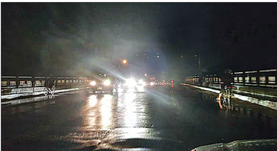
အတွက် လမ်းအသုံးပြုသွားလာနေရသည့် ပြည်သူများ ဘေးအန္တရာယ်မရှိစေရေး မီးတိုင်များအား ညအချိန်မီးလင်းစေချင် ဆောင်ရွက်ပေးစေလိုကြောင်း ဒေသခံများနှင့်ခရီးသွားပြည်သူများက ဆန္ဒရှိကြောင်း သိရသည်။ သန့်စင်(ပဲခူး)

ပဲခူးမြို့မီးရထား ခုံးကျော်တံတားကြီးကို ဖြတ်၍ မွန်ပြည်နယ်အပါအဝင် အထက်မြန်မာပြည်သို့ ယာဉ်ကြီး၊ ယာဉ်ငယ်များ ဥဒဟိုသွားလာနေကြသည်။ ထိုတံတားသည် မြို့တွင်းသာမက ဆက်စပ်တိုင်းဒေသကြီးနှင့် ပြည်နယ်များသို့ ကူးလူးဖြတ်သန်းသွားလာရာ အဓိက လမ်းတံတားကြီး တစ်ခုပင်ဖြစ်သည်။ အဆိုပါ ခုံးကျော်တံတားပေါ်ရှိ မီးတိုင်များ မီးမလင်းသည့်မှာ လနှင့်ချည်ကြာခဲ့ပြီဖြစ်၍ ညအချိန်မီးကြီးသည့်အခါ မီးအားစူးသော ယာဉ်ကြီးများကြောင့် အချို့ယာဉ်များမှာ အမြင်အာရုံ မရှင်းလင်းမှုများရှိသဖြင့် ယာဉ်အန္တရာယ် စိုးရိမ်ကြရသည်။ ထို့အပြင် အမှောင်ထုကို အမှိုက်ပြုပြီး ဒုစရိုက်မှုများလည်း ဖြစ်ပေါ်လာနိုင်သည့်