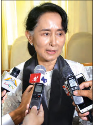
ဗိုလ်ချုပ်အောင်ဆန်း၏သမီး၊ နိုင်ငံတော်၏ အတိုင်ပင်ခံပုဂ္ဂိုလ် ဒေါ်အောင်ဆန်းစုကြည်