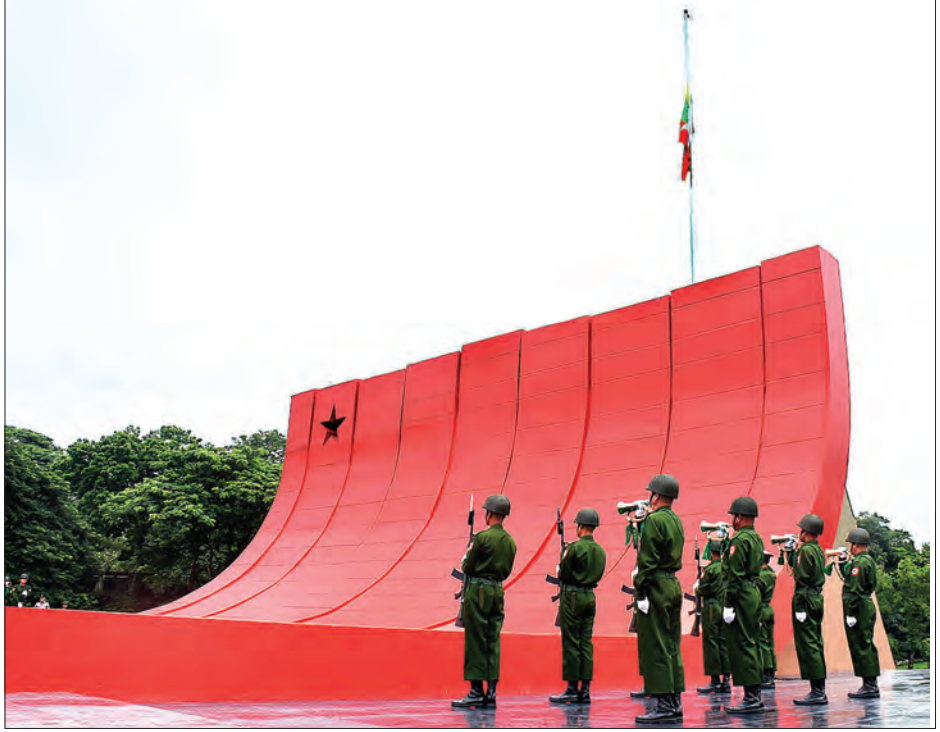
ဒုတိယသမ္မတ ဦးမြင့်ဆွေ၊ ပြည်သူ့လွှတ်တော်ဥက္ကဋ္ဌ ဦးဝင်းမြင့်၊ အမျိုးသားလွှတ်တော် ဥက္ကဋ္ဌ မန်းဝင်းခိုင်သန်း၊ ပြည်ထောင်စုတရားသူကြီးချုပ် ဦးထွန်းထွန်းဦး၊ တပ်မတော် ကာကွယ်ရေးဦးစီးချုပ် ဝိုလ်ချုပ်မှူးကြီး မင်းအောင်လှိုင်တို့ အထိမ်းအမှတ်ဂူပိမာန်၌ ပြည်ထောင်စုသမ္မတ မြန်မာနိုင်ငံတော်၏ လွမ်းသွပ်ပန်းခွေကိုချ၍ အလေးပြုကြစဉ် (သတင်းစဉ်)

ဆက်လက်၍ မြန်မာနိုင်ငံ စစ်မှုထမ်း ဟောင်းအဖွဲ့၊ မြန်မာနိုင်ငံမီးသတ်တပ်ဖွဲ့၊ မြန်မာနိုင်ငံ ကြက်ခြေနီအသင်း၊ မြန်မာ နိုင်ငံ ရုပ်ရှင်အစည်းအရုံး၊ မြန်မာနိုင်ငံ ဂီတအစည်းအရုံး၊ မြန်မာနိုင်ငံ သဘင် ပညာရှင်များအစည်းအရုံး၊ မြန်မာနိုင်ငံ ပန်းချီ၊ ပန်းပုအစည်းအရုံး၊ မြန်မာနိုင်ငံ စာပေထုတ်ဝေသူနှင့် ဖြန့်ချိသူများ အသင်း၊ မြန်မာနိုင်ငံ စာရေးဆရာအသင်း၊