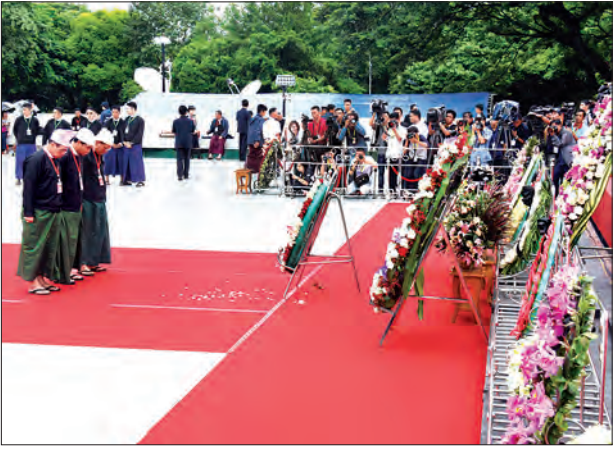
နှစ်(၇၀)ပြည့် အာဇာနည်နေ့အခမ်းအနားတွင် နိုင်ငံရေးပါတီများ အာဇာနည်ခေါင်းဆောင်ကြီးများ၏ ဂူပိမာန်၌ လွှမ်းသူပန်းခွေချ အလေးပြုစဉ် (သတင်းစဉ်)