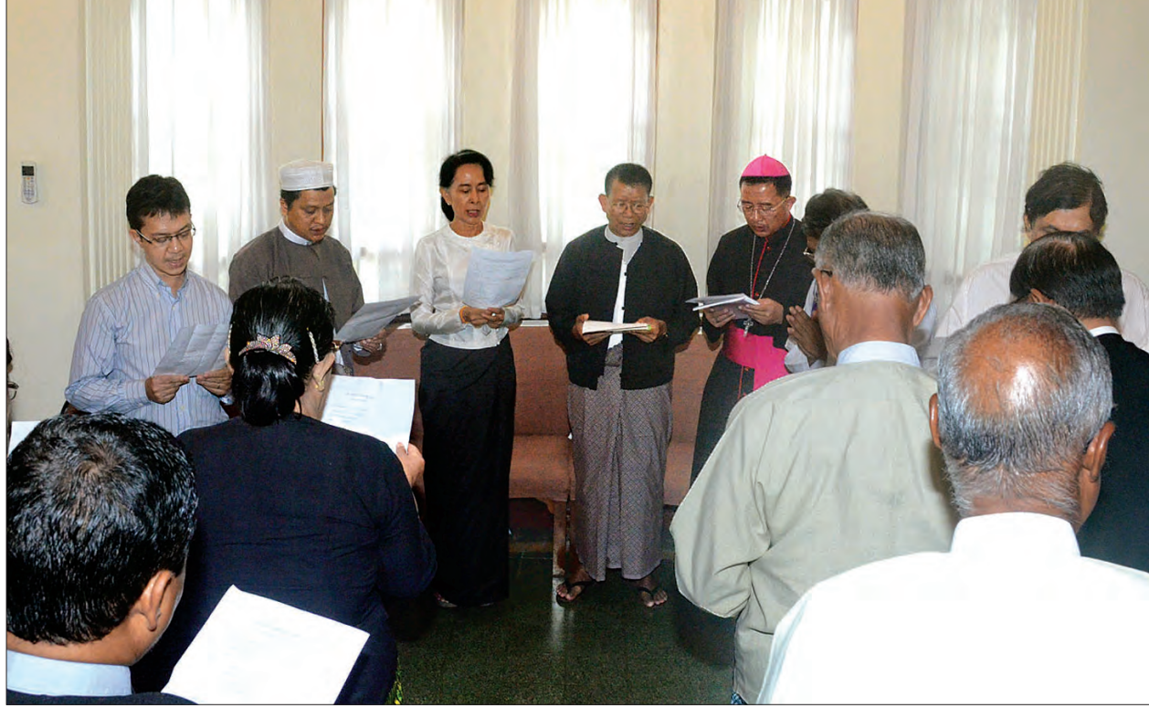
နှစ်(၇၀)ပြည့် အာဇာနည်နေ့အထိမ်းအမှတ် အမျိုးသားခေါင်းဆောင်ကြီး ဝိုလ်ချုပ်အောင်ဆန်း အောက်မေ့ဖွယ်ရာ ဘာသာပေါင်းစုံ ဆုတောင်းပွဲအခမ်းအနားတွင် နိုင်ငံတော်၏ အတိုင်ပင်ခံပုဂ္ဂိုလ် ဒေါ်အောင်ဆန်းစုကြည်နှင့် ကိုးကွယ်ရာဘာသာများအလိုက် ဆုတောင်းမေတ္တာပို့သကြစဉ် (သတင်းစဉ်)