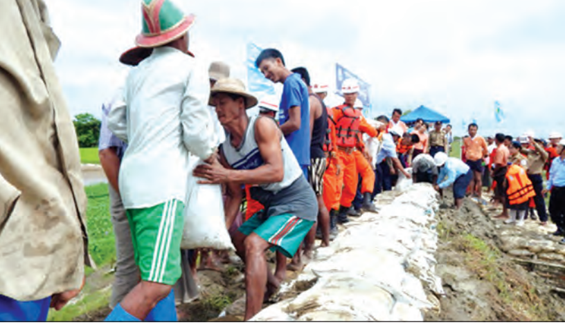
တော၊ အမှိုက်ပစ်တာ၊ စက်တပ်ယာဉ်တွေ အရှိန်နဲ့ မောင်းနှင်တာတွေကို ထိန်းသိမ်းစောင့်ရှောက်ပေးဖို့ လိုအပ်ပါတယ်။ ဒါမှသာ ရေစီးရေလာကောင်းမွန်ပြီး ချောင်းကောမူတွေ သက်သာပြီးတော့ မိုးရာသီ ရေကြီးနစ်မြုပ်မှုကို လျော့နည်းစေမှာပါ” ဟု ခရိုင်ဆည်မြောင်းနှင့် ရေအသုံးချမှုစီမံခန့်ခွဲရေးဦးစီးဌာနမှူး ဦးကျော်ကျော်က ဒေသခံပြည်သူများအား ပြောကြားသည်။ အဆိုပါပုလဲကျွန်းတာမှာ ရန်ကုန်မြစ်၏ အနောက်ဘက်ကမ်းတွင်ရှိပြီး မိုးရာသီတွင် ဒီရေမြင့်တက်လာသည့် ကွမ်းခြံကုန်း၊ ကော့မှူးမြို့နယ်များအတွင်းရှိ ကျေးရွာများနှင့် မိုးစပါးစိုက်စေရိယာ ၇၅၀၀၀ ကျော်ကို ရေနစ်မြုပ်မှုအန္တရာယ်မှ ကာကွယ်ပေးနေသည့်အပြင် နွေရာသီတွင် ပင်လယ်ဒီရေများ ကုန်းတွင်းသို့မဝင်ရောက် နိုင်စေရန် ကာကွယ်ပေးထားသောတာဖြစ်ကြောင်း သိရသည်။ လက်ရှိအချိန်တွင် ရန်ကုန်မြစ်အတွင်းရှိ ရေလယ်တွင် သောင်ထွန်းလာသောကြောင့် မြစ်အနောက်ဘက်ခြမ်းသို့ ရေကြောင်းပြောင်းလဲလာကာ ပင်လယ်ကူးသင်္ဘောများနှင့် စက်တပ်ရေယာဉ်များမှာ အနောက်ဘက်ခြမ်း မုတ်ကျွန်းတာအနီးမှ ခုတ်မောင်းခြင်းကြောင့်လည်းကောင်း၊ ဒီရေလှိုင်းများကြောင့်လည်းကောင်း မုတ်ကျွန်းတာတစ်လျှောက်တွင် ကမ်းပါးရေတိုက်စားမှုများရှိလာသောကြောင့် ဆည်မြောင်းနှင့်ရေအသုံးချမှုစီမံခန့်ခွဲရေးဦးစီးဌာနက နှစ်စဉ် ကာကွယ်ထိန်းသိမ်းရေးလုပ်ငန်းများ ဆောင်ရွက်နေကြောင်း သိရသည်။ (၁၆၄)၊ ဓာတ်ပုံ-သစ္စာ