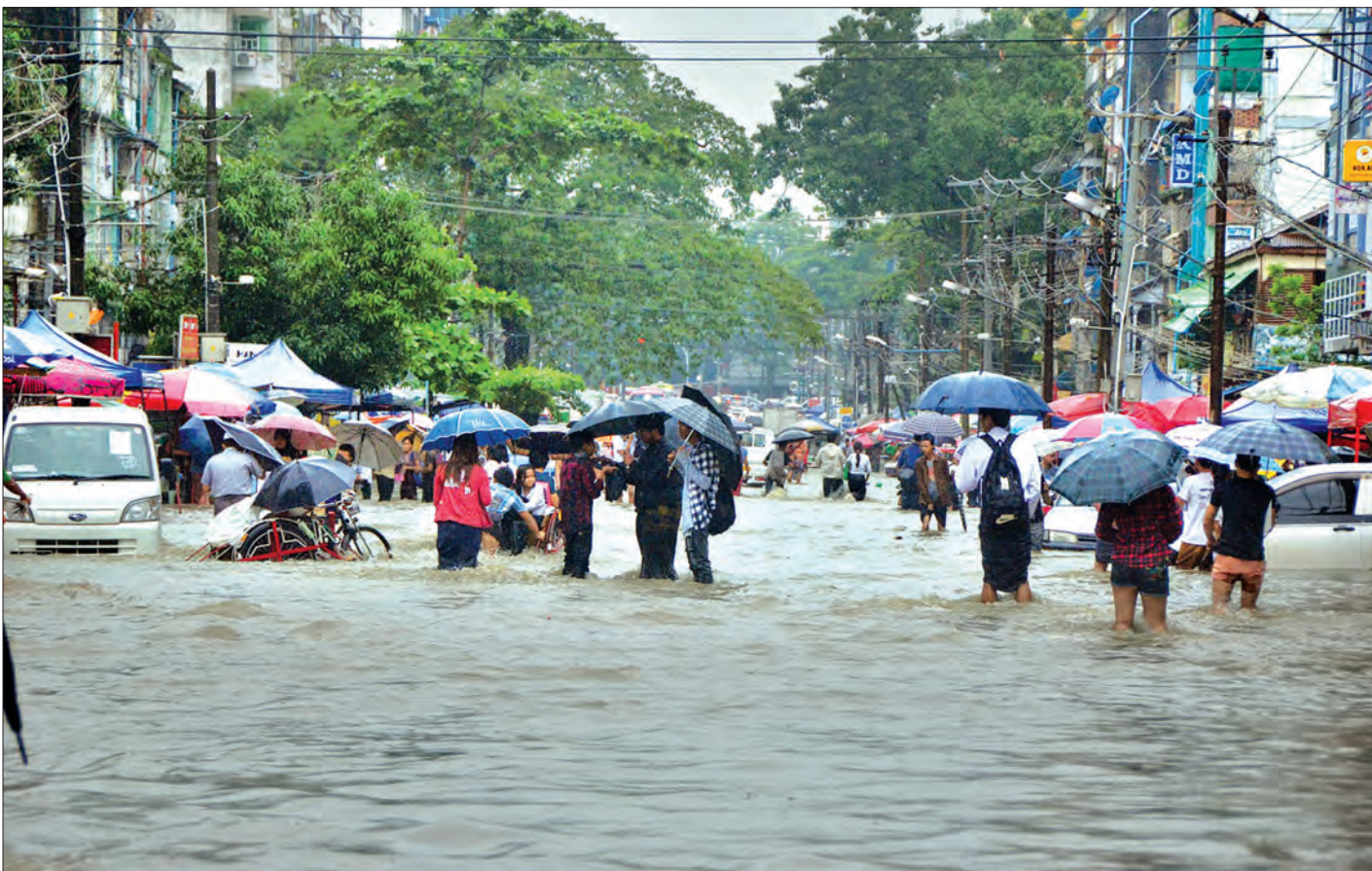
ရန်ကုန်မြို့၊ မင်္ဂလာတောင်ညွန့်မြို့နယ် မြန်မာ့ဂုဏ်ရည်လမ်း၌ ရေကြီးရေလျှံဖြစ်ပွားနေစဉ်