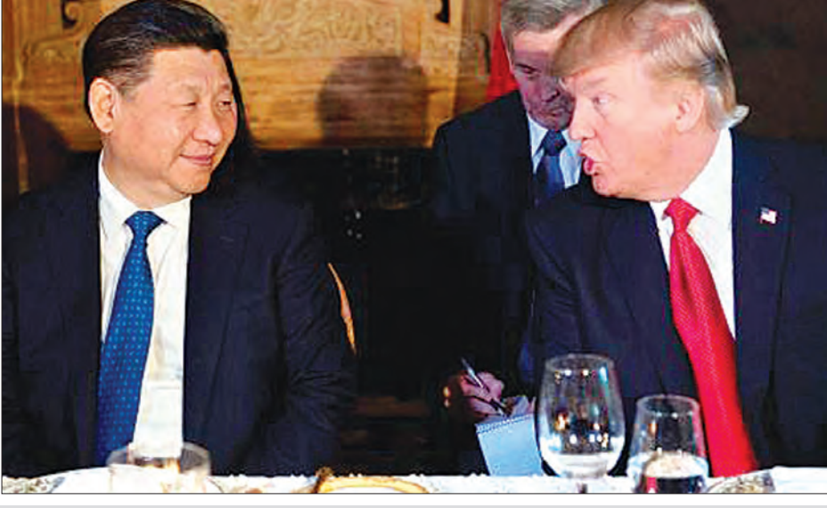
ဂျီ - ၂၀ ထိပ်သီးအစည်းအဝေးအတွင်း၌ သမ္မတရှီကျင့်ဖျင်နှင့် သမ္မတထရန်ကိုအတူတကွ တွေ့ရစဉ်