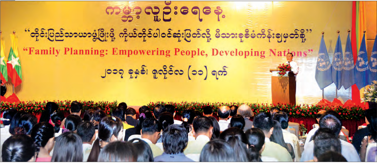
၂၀၁၇ ခုနှစ်၊ ဇူလိုင်လ (၁၁) ရက်

ဒုတိယ သမ္မတ ဦးမြင့်ဆွေ ၂၀၁၇ ခုနှစ် ကမ္ဘာ့လူဦးရေနေ့ အထိမ်းအမှတ်အခမ်းအနားတွင် အမှာစကားပြောကြားစဉ်