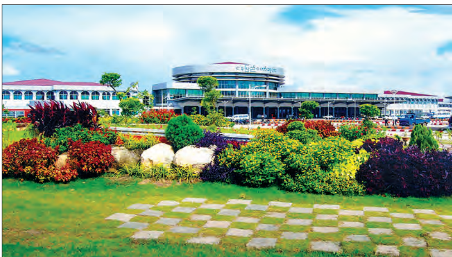
နေပြည်တော်ဘူတာကြီးနှင့် ပန်းဥယျာဉ်အား ပန်သင့်စွာ တွေ့မြင်ရစဉ် (ဓာတ်ပုံ-ပြန်/ဆက်)

လူဆိုသည့် သက်ရှိသတ္တဝါသည် အောက်ဆီဂျင်ကို ရှူရှိုက်ပြီး ကာဗွန်ဒိုင်အောက်ဆိုက်ကို စွန့်ထုတ်ပါသည်။ သို့သော် သစ်တောသစ်ပင်များက လူနှင့်မတူဘဲ လူသားတို့ အတွက်အဆိပ်အတောက်ဖြစ်စေသည့် ကာဗွန်ဒိုင်အောက် ဆိုက်ကို ရှူရှိုက်စားသုံးကာ အောက်ဆီဂျင်ကို ပြန်လည်စွန့်ထုတ်