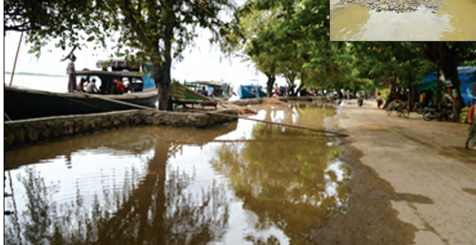
ကျောက်ရိုးစီရေကာကိုဖြတ်၍ မြစ်ရေများစိမ့်ဝင်လာစဉ်

“နှစ်တိုင်းတော့ စိုးရိမ်ရေမှတ်ရောက် ရင် မြစ်ကမ်းဝန်းကျင်မှာရှိတဲ့ လူနေအိမ် တွေထဲကို မြစ်ရေက လူတစ်ရပ်နီးပါး အထိ ဝင်လာတာပါ။ ရေဝင်တာလည်း အတော်မြန်ပါတယ်။ ဒီနှစ်တော့ ရေကာ တာအထက်မှာ ကျောက်ရိုးစီရေကာ တည်ဆောက်ပေးထားတော့ နှစ်တိုင်း လောက်တော့ ရေဝင်မမြန်ဘူး။ ရေ လည်းနှစ်တိုင်းလောက်ထိ မရောက်လာ သေးဘူး။ ကျောက်ရိုးစီရေကာက ရေ မလုံတော့ ရေတွေစိမ့်ထွက်နေပါတယ်။ ကျောက်ရိုးစီရေကာသာ ရေလုံခဲ့ရင် တော့ ကျွန်တော်တို့ရပ်ကွက်တွေမှာ မြစ်ရေမဝင်လောက်ဘူး။ အဲဒါကြောင့် ကျွန်တော်တို့ရပ်ကွက်တွေဘက် ရေ မရောက်အောင် ကျောက်ရိုးစီရေကာကို ရေစိမ့်မထွက်အောင်ဆောင်ရွက်ပေးစေ