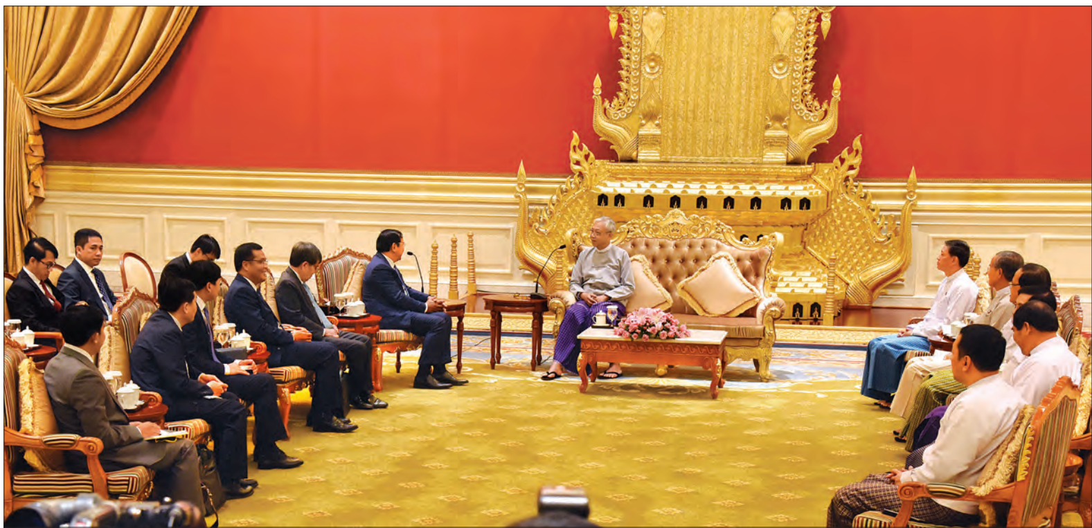
တာဝန်ရှိသူများ တက်ရောက်ကြပြီး နိုင်ငံ သံအမတ်ကြီး H.E. Mr. Sok Chea လည်း တက်ရောက်သည်။ (သတင်းစဉ်)

တွေ့ဆုံပွဲသို့ နိုင်ငံတော်သမ္မတနှင့် အတူ ပြည်ထောင်စုဝန်ကြီး ဒေါက်တာမျိုးသိမ်းကြီး၊ ဦးအုန်းမောင်၊ ဒုတိယဝန်ကြီး ဦးကျော်တင်၊ ဦးမင်းသူနှင့်