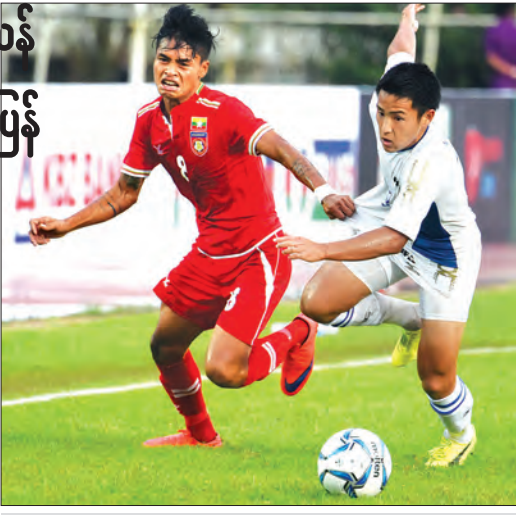
မြန်မာ ယူ-၂၂ အသင်း လေးနိုင်ငံပြိုင်ပွဲတွင် ယှဉ်ပြိုင်နေစဉ်