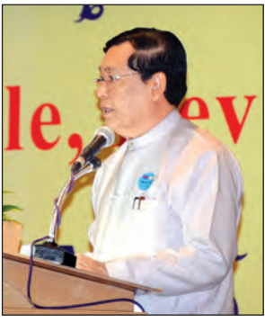
ပြည်ထောင်စုဝန်ကြီး ဦးသိန်းဆွေ ရှင်းလင်းပြောကြားစဉ်

ကမ္ဘာ့နိုင်ငံအသီးသီးတွင် အရေးကြီး ဖြေရှင်းရမည့် လူဦးရေဆိုင်ရာပြဿနာများကို အာရုံစိုက်မိလာစေရန်အတွက် ၁၉၉၀ ပြည့်နှစ်ကစပြီး ကမ္ဘာ့လူဦးရေနေ့ အထိမ်းအမှတ်အခမ်းအနားကို နှစ်စဉ် ကျင်းပခဲ့ပါကြောင်း၊ ယခုနှစ် ကမ္ဘာ့လူဦးရေနေ့၏ ဆောင်ပုဒ်မှာ “တိုင်းပြည်သာ ယာဇံမြို့ဖို့ ကိုယ်တိုင်ပါဝင်ဆုံးဖြတ်လို့၊ မိသားစုစီမံကိန်းချမှတ်ဖို့” “Family Planning: Empowering People, Developing Nations” ဖြစ်ပါကြောင်း၊ ယခုနှစ်ဆောင်ပုဒ်၏ အဓိကဦးတည်ချက်သည် လုံခြုံစိတ်ချရသည့်မိသားစုစီမံကိန်းများကို အမျိုးသမီးများကိုယ်တိုင် လိုလားလာချမှတ်ဆောင်ရွက်လာစေရေး စီမံဆောင်ရွက်ပေးရန် ဖြစ်ပါကြောင်း။