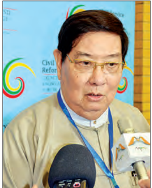
ဦးမြသိန်း နိုင်ငံတော် စွဲစည်းပုံ အခြေခံ ဥပဒေဆိုင်ရာ ခုံရုံးအဖွဲ့ဝင် (အငြိမ်းစား) ပြည်ထောင်စု ရာထူးဝန်အဖွဲ့ အကြံပေးအရာရှိ