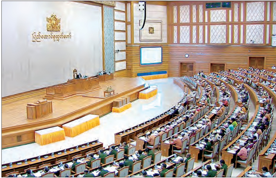
ဒုတိယအကြိမ် ပြည်ထောင်စုလွှတ်တော် ပဌမပုံမှန်အစည်းအဝေးကျင်းပစဉ်

အဆိုပါ အစီရင်ခံစာကို လွှတ်တော်က သဘောတူအတည်ပြုကြောင်းနှင့် ပြည်ထောင်စုအဆင့် အဖွဲ့အစည်းများ၏