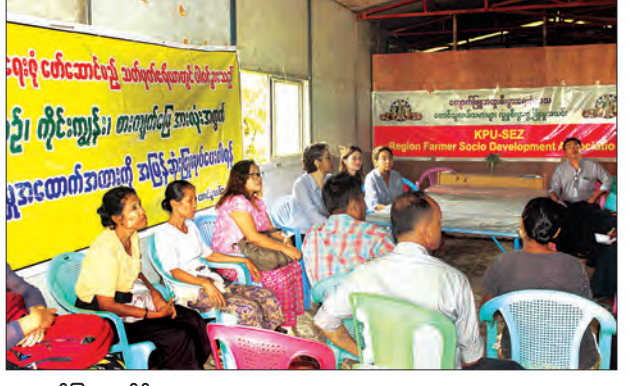
ကျောက်ဖြူ ဇူလိုင် ၁၁