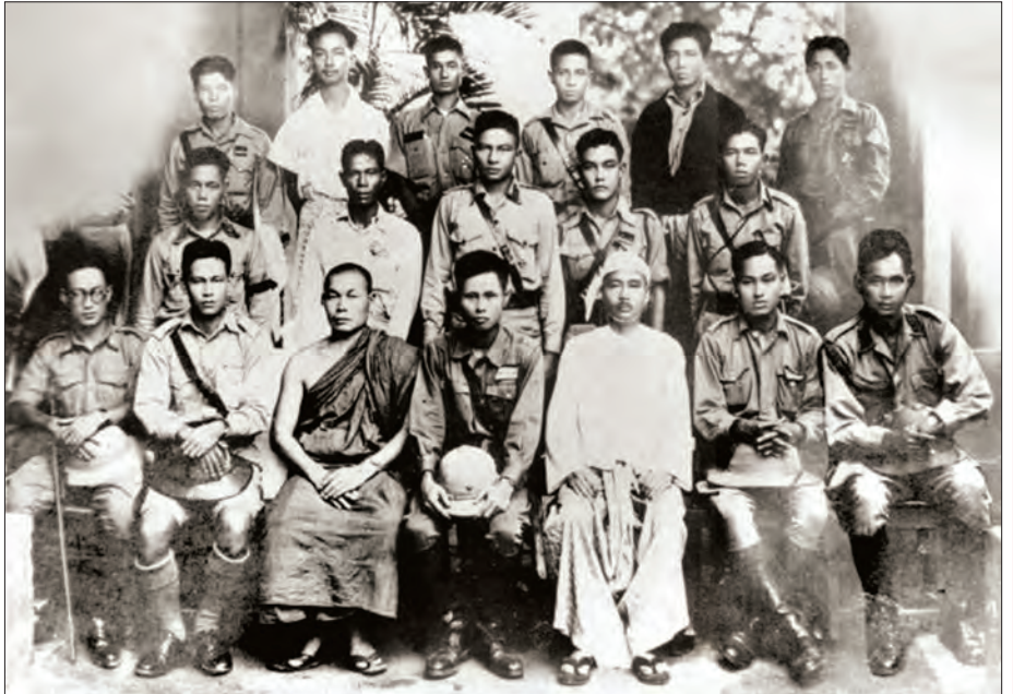
လွတ်လပ်ရေးကြိုးပမ်းစဉ်ကာလ ဗိုလ်ချုပ်အောင်ဆန်း၊ ဆရာတော်ဦးဥတ္တမနှင့် ရဲဘော်သုံးကျိပ်ဝင် အချို့၏ စုပေါင်းမှတ်တမ်းဓာတ်ပုံ

ဝါဆိုမိုးများက တဖွဲဖွဲရွာသွန်းနေသည်။ တစ်မျိုးသားလုံးက လေးစားအားကျအတုယူရသည့် ဗိုလ်ချုပ်အောင်ဆန်း ကျဆုံးခဲ့သော်လည်း “အမျိုးသားနိုင်ငံရေးဦးဆောင်” အဖြစ် ထာဝရတည်ရှိနေမည်သာဖြစ်သည်။ ကျဆုံးလေပြီးသော ဗိုလ်ချုပ်အောင်ဆန်းနှင့်တကွ အာဇာနည်အပေါင်းကို တမ်းတ၍ လွမ်းဆွတ်၍ မဆုံးနိုင်ပါပြီ။