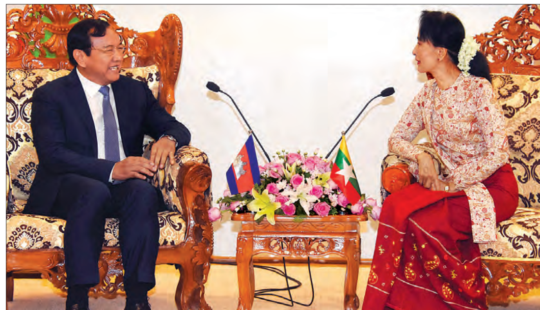
နိုင်ငံတော်သမ္မတ ဦးထင်ကျော် ကမ္ဘောဒီးယားနိုင်ငံ၏ ဝါရင့်ဝန်ကြီး၊ နိုင်ငံခြားရေးနှင့် အပြည်ပြည်ဆိုင်ရာ ပူးပေါင်းဆောင်ရွက်ရေးဝန်ကြီး မစ္စတာ ပရတ်ဆုတ်ခွန်း ဦးဆောင်သည့် ကိုယ်စားလှယ်အဖွဲ့တို့ လက်ခံတွေ့ဆုံစဉ် (သတင်းစဉ်)