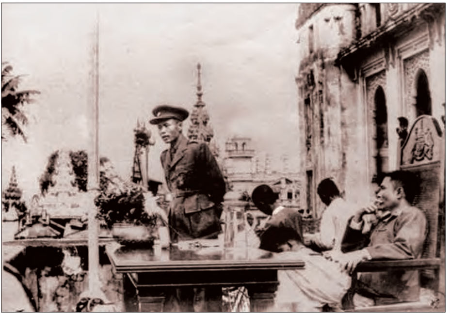
လွတ်လပ်ရေးကြိုးပမ်းမှုကာလအတွင်း ဗိုလ်ချုပ်အောင်ဆန်း လူထုအား မိန့်ခွန်းပြောကြားစဉ် (အစွန်ဆုံးထိုင်နေသူမှာ သခင်နုဖြစ်သည်)

ဗိုလ်ချုပ်အောင်ဆန်းသည် တောင်တန်းဒေသများပါ မကျန် လုံးဝလွတ်လပ်ရေးရရှိစေရန် တိုင်းရင်းသားစည်းလုံး ညီညွတ်ရေးကို ဦးစားပေးဆောင်ရွက်ခဲ့သည်။ ၁၉၄၇ ခုနှစ် ဖေဖော်ဝါရီလ ၁၁ ရက်တွင် ပင်လုံစော်ဘွားများနှင့် ထမင်း စားပွဲ၌ ဗိုလ်ချုပ်အောင်ဆန်းက “တစ်တိုင်းပြည်လုံးကြီးပွား စေချင်ရင် လူအား၊ ငွေအား၊ ပစ္စည်းအားနဲ့ စုပေါင်းပြီး အင်တိုက် အားတိုက်လုပ်နိုင်မှ အကျိုးခံစားခွင့်ရှိကြမှာပဲ။ အကွဲကွဲ အပြားပြားလုပ်နေကြရင် အကျိုးရှိမှာမဟုတ်ဘူး။ စုပေါင်း လုပ်ကြမှာသာ အကျိုးရှိနိုင်မယ်။ လုပ်ကြည့်မှလည်း အကျိုး