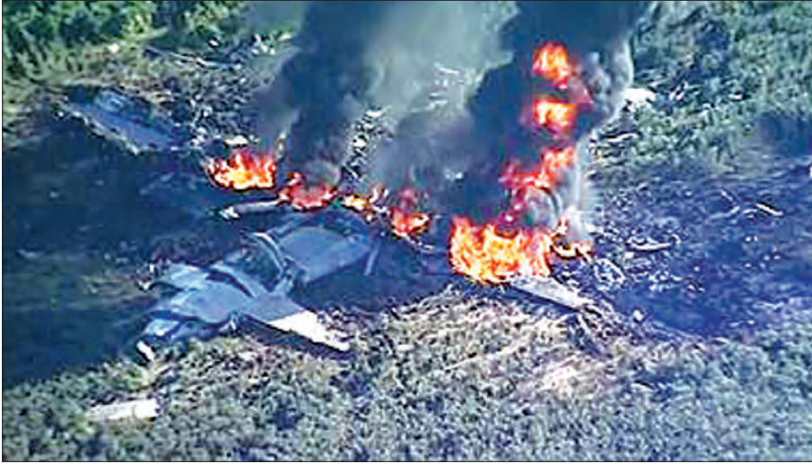
ဝါရှင်တန် ဇူလိုင် ၁၁ အမေရိကန် တပ်မတော်လေယာဉ် တစ်စင်းသည် တနင်္လာနေ့က မစ္စစ္စပီ၌ ပျက်ကျခဲ့ရာ လူငယ် ဦးထက်မနည်း သေဆုံးသွားကြောင်း ဒေသဆိုင်ရာ အစိုးရပေါ်စီမံခန့်ခွဲမှုအဖွဲ့ အာဏာပိုင် များက ပြောကြားခဲ့သည်။ လေယာဉ်သည် ဂျက်ဆန်မြို့ မြောက်ပိုင်းမှ မိုင် ၁၀၀ ခန့်