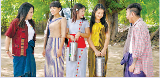
နောက်ပိုင်း ဟာသအလှူလေးတွေနဲ့ ကိုယ့်ဘဝအမှန်ကိုယ်ပြန်ရောက်အောင်လုပ်ကြတဲ့ ပုံစံ ရိုက်ကူးထားတာပါ” ဟု မြင့်မြတ်က ပြောသည်။

“ဒီဇာတ်ကားရဲ့ရည်ရွယ်ချက်က ပရိသတ်ကြီးကို အပျော်တွေ ပေးချင်တာပါ။ ဘဝ အမောတွေ ပြေစေချင်တဲ့စိတ်နဲ့ ပုံဖော်ရိုက်ကူးခဲ့ပါတယ်။ ကျွန်တော်က ဒီဇာတ်ကား မှာ ပစ်တိုင်းထောင်အဖြစ် သရုပ်ဆောင်ရတယ်။ သစ်ရွက်စိမ်းဆိုတဲ့ ရွာသား၊ မိဘတွေ က ရွာမှာသူဌေးတွေဆိုတော့ ရွာမှာ ကျွန်တော်က အားလုံးရဲ့ အော့ကြောလန် ဖြစ်နေတယ်။ သိပ်ဆိုတဲ့ ကောင်လေးဖြစ်တယ်။ ရွာမှာ ကြိတ်ကြိတ်နေရတဲ့ ဟင်္သာ ဆိုတဲ့ ကောင်မလေးတစ်ယောက်ရှိတယ်။ သူက ကျွန်တော်ကို လုံးဝစိတ်မဝင်စားဘူး။ တစ်နေ့ ကျွန်တော်က ပြင်ဦးလွင်ကို အလုပ်ကိစ္စနဲ့သွားတုန်း မထင်မှတ်ဘဲ ဝတ်ရည်မွှေး ဆိုတဲ့ ကောင်မလေးတစ်ယောက်နဲ့ ဆုံတယ်။ သူက ဖွေးဖွေးပါ။ ဒါနဲ့ ကျွန်တော်နဲ့သူက မိတ္တူလာကနေ ပြင်ဦးလွင်သွားတဲ့လမ်းမှာ ဘေးချင်းကပ်ထိုင်ရတယ်။ မထင်မှတ်ဘဲ ဝတ်ရည်မွှေးကို ကြိုက်သွားခဲ့ပြီး တစ်လမ်းလုံး သူ့နံရံနဲ့အတူဖြစ်ရင် ဘယ်လို ဘယ်ညာ စဉ်းစားနေရကနေ သူ့နံရံနဲ့အတူ စိတ်ချင်းပြောင်းလဲပြီး ဝတ်ရည်မွှေး နေရာကနေ ကျွန်တော် ရောက်သွားတယ်။ ကျွန်တော်နဲ့အတူ သူ့ကို အစားထိုးလိုက်တယ်။