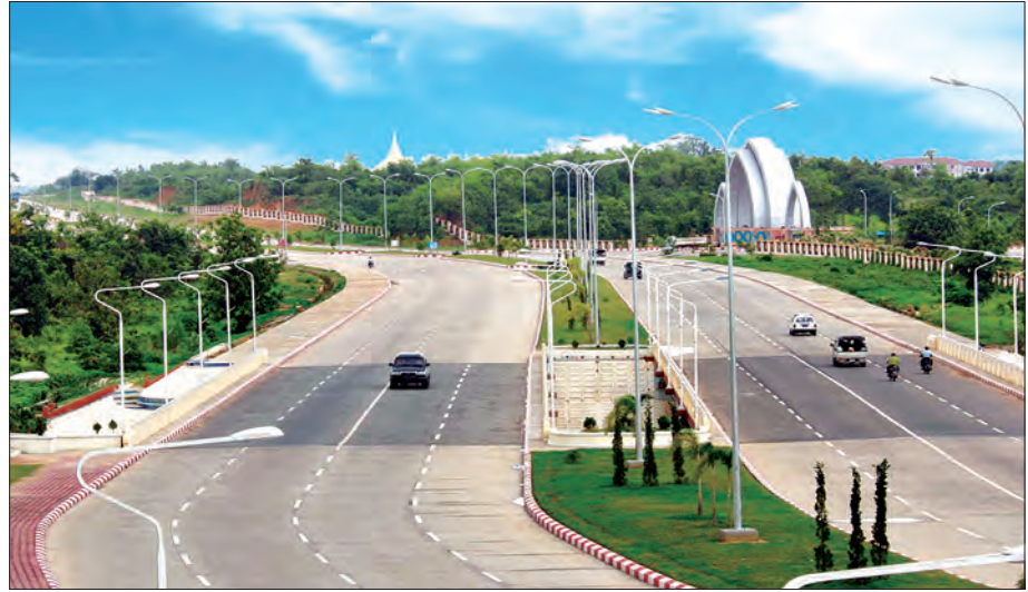
နေပြည်တော်ရှိ ရေပန်းဥယျာဉ်နှင့် လမ်းမကြီးကလည်း မြို့တော်၏အလှကို ဖော်ကျူးလျက်ရှိစဉ်

ထိုမှတစ်ဆင့် အရပ်ရပ်မျက်နှာရှိ တိုင်းဒေသကြီးနှင့် ပြည်နယ်များသို့ သွေးကြောများသဖွယ် ယုန်နှယ်ဖောက် လုပ်ထားသည့် လမ်းများဆုံရာ နှလုံးသားမြို့တော်ကြီး တစ်ခုအဖြစ်လည်းကောင်း၊ အမျိုးသား အထိမ်းအမှတ်ဥယျာဉ်၊ ပရဆေး ဥယျာဉ်၊ ပန်းမြိုင်လယ်ဥယျာဉ် စသည့် ဥယျာဉ်ပေါင်း များစွာ တန်ဆာဆင်ထားသည့် ဥယျာဉ်မြို့တော်ကြီး တစ်ခု အဖြစ်လည်းကောင်း ပိုမိုကြားဝင်စွာ ဖြစ်ပေါ်လာအောင် အားလုံးက ပေါင်းရုံးဆောင်ရွက်ကြပါစို့လို့ တိုက်တွန်းနှိုးဆော် လိုက်ရပါသည်။ ။