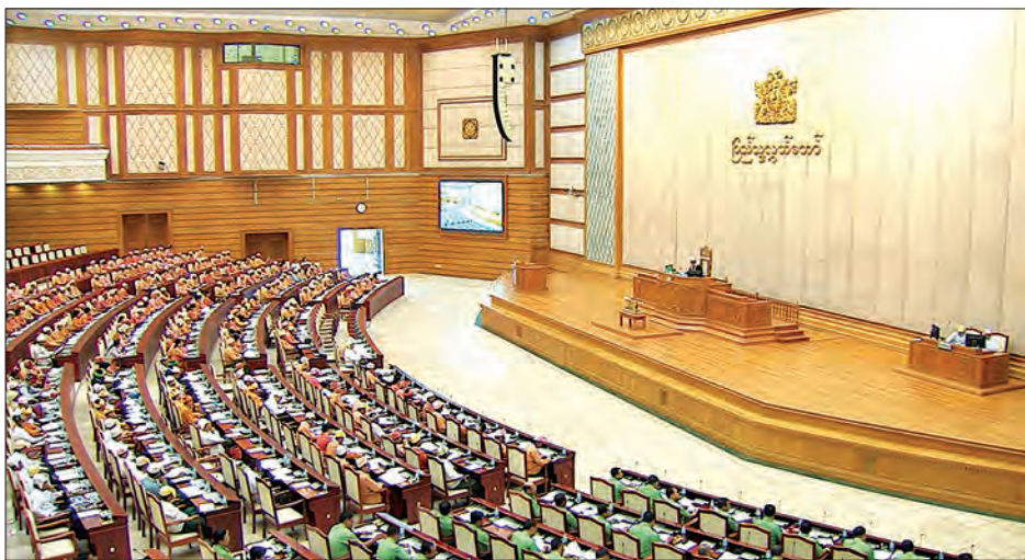
ဒုတိယအကြိမ် ပြည်သူ့လွှတ်တော် ပဋိပက္ခပုံမှန်အစည်းအဝေးကျင်းပစဉ်

အစားထိုးပြောင်းလဲ လက်ရှိတွင် ယခင်စက်မှုဇုန်ခေတ်မှ ပစ္စည်းဟောင်းများဖြင့် မော်တော်ယာဉ် ထုတ်လုပ်ခဲ့သည့်စနစ်ကို ဆက်လက်ခွင့်မပြုတော့ဘဲ နိုင်ငံတကာမှပညာရှင်များနှင့်ပူးပေါင်း၍ နိုင်ငံတကာ အဆင့်မီ ထုတ်လုပ်နိုင်ရန်အတွက် မြန်မာနိုင်ငံရင်းနှီးမြှုပ်နှံမှုကော်မရှင် (MIC)၏ ခွင့်ပြုချက်ဖြင့် ပြည်တွင်းပုဂ္ဂလိကနှင့် ဖက်စပ်လုပ်ငန်းများမှ ထုတ်လုပ်မည့် Brand New မော်တော်ယာဉ်အသစ်များကိုသာ SKD စနစ်ဖြင့် ထုတ်လုပ်ခွင့်ပြုလျက်ရှိပါကြောင်း၊ ပြည်တွင်းစက်မှုဇုန်ထုတ်ယာဉ်များ၏ အစိတ်အပိုင်းများကို ပြည်ပစက်ရုံထုတ်ပုံစံဖြင့် အစားထိုးပြောင်းလဲခြင်းအား လက်ခံ