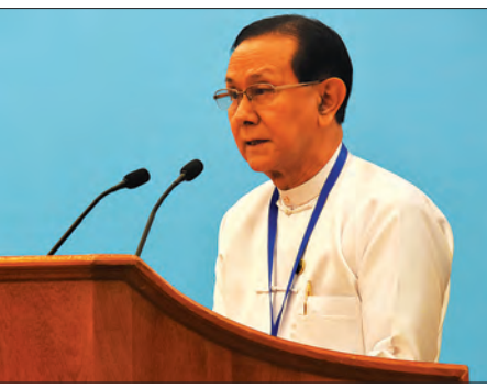
ပြည်ထောင်စုရာထူးဝန်အဖွဲ့ဥက္ကဋ္ဌ ဒေါက်တာဝင်းသိမ်း