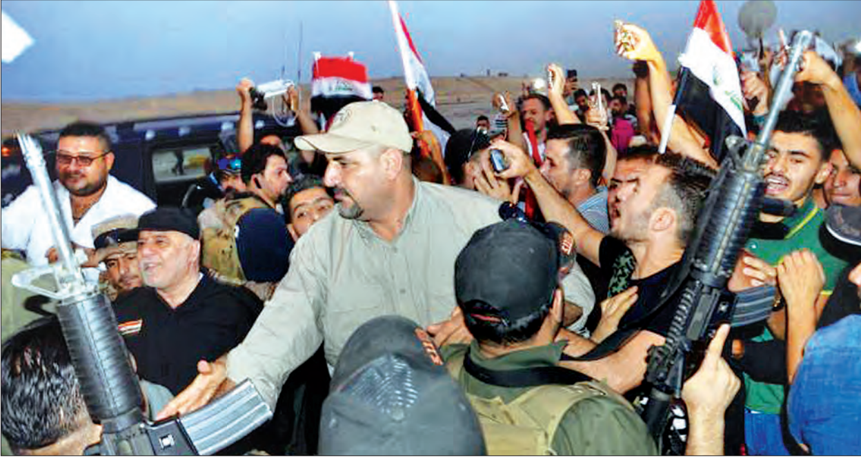
ဝန်ကြီးချုပ်ဟေဒါအယ်လ်အဘာဒီကို မိုဆူးလ်၌ အီရတ်တပ်ဖွဲ့ဝင်များနှင့်အတူ တွေ့ရစဉ်