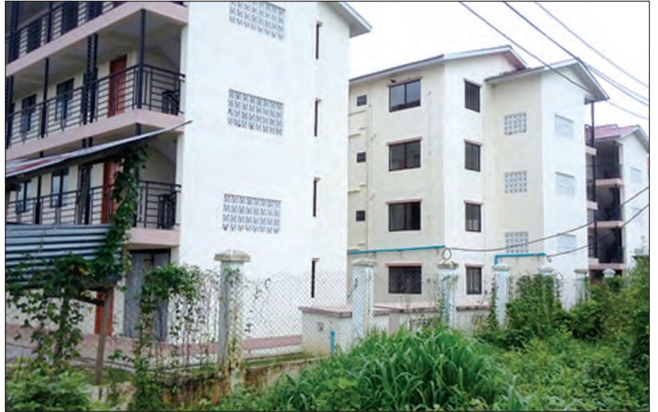
သတ်မှတ်ထားကြောင်း သိရသည်။

ဒဂုံဆိပ်ကမ်း ကနောင်အိမ်ရာရှိ ရှစ်ခန်းတွဲ လေးထပ် အဆောက်အအုံ အကျယ် ၅၂၂ စတုရန်းပေ သို့မဟုတ် ၄၈၄ စတုရန်းပေအတွက် မြေညီထပ် ၁၂၅ သိန်း၊ ပထမထပ် ၁၂၅ သိန်းမှ ၁၁၅ သိန်း၊ ဒုတိယထပ် ၁၂၀ သိန်းမှ ၁၀၈ သိန်း၊ တတိယ ထပ် ၁၁၇ သိန်းမှ ကျပ်သိန်း ၁၀၀ ဖြစ်ပြီး ဒဂုံဆိပ်ကမ်း ယုဇန (၁) (၂)နှင့် Shop House မပါ ခြောက်ခန်းတွဲ လေးထပ် အဆောက်အအုံ အကျယ် ၄၆၄ စတုရန်းပေအတွက် မြေညီ ထပ် ငွေကျပ်သိန်း ၁၂၀၊ ပထမထပ် ငွေကျပ် ၁၁၂ သိန်း၊ ဒုတိယ ထပ် ငွေကျပ် ၁၀၆ သိန်း နှင့် တတိယထပ် ၉၈ သိန်း ဈေးနှုန်း