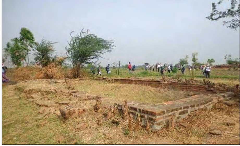
မိုင်းမောမြို့ဟောင်းတူးဖော်မှုကုန်းအမှတ်(MM13)

မြန်မာ့ရှေးဟောင်းမြို့တော်များ(ဦးအောင်မြင့်) မိုင်းမောမြို့ဟောင်း(ယဉ်ကျေးမှုဝန်ကြီးဌာန)