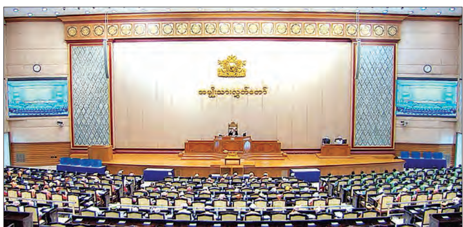
ဒုတိယအကြိမ် အမျိုးသားလွှတ်တော် ပဋိပက္ခပုံမှန်အစည်းအဝေးကျင်းပစဉ်

နေပြည်တော် ဇူလိုင် ၁၀ ဒုတိယအကြိမ် အမျိုးသားလွှတ်တော် ပဋိပက္ခပုံမှန်အစည်းအဝေး ၂၇ ရက်မြောက်နေ့ကို ယနေ့ မွန်းလွဲ ၁ နာရီခွဲတွင် နေပြည်တော်ရှိ အမျိုးသားလွှတ်တော် အစည်းအဝေးခန်းမ၌ ကျင်းပသည်။