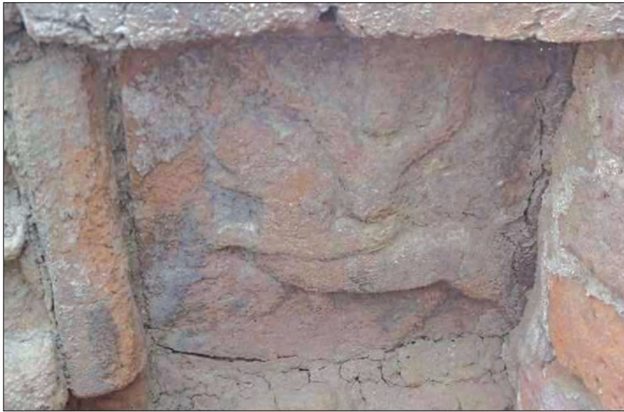
ပင်လယ်မြို့ဟောင်း ကုန်းအမှတ်(၂၀)မှ တူးဖော်ရရှိသည့် မြင်းစီးနေပုံ မြေမီးဖုတ်ရုပ်ကြွ

ပင်လယ်မြို့ဟောင်းသည် ပြည်မြို့နယ်ရှိ သရေခေတ္တရာ၊ ထားဝယ်မြို့နယ်ရှိ သာဂရ၊ နွားထိုးကြီးမြို့နယ်ရှိ ဝတီးစသည် ရှေးဟောင်းမြို့များကဲ့သို့ အပိုင်းပုံရှိပြီး မြို့ရိုးသုံးထပ်ရှိသည်။ အပြင်ဆုံးနှင့် အတွင်းဆုံးမြို့ရိုးတို့သည် အပိုင်းပုံရှိ၍ ယင်းတို့အကြားရှိ အလယ်မြို့ရိုးသည် စတုဂံပုံဖြစ်သည်။ ရှေးဟောင်းသုတေသနဦးစီးဌာန၏ တိုင်းတာချက်များအရ အပိုင်းပုံအပြင်မြို့ရိုး၏ အချင်းသည် အရှေ့မှအနောက်သို့ ၁ ဒဿမ ၈ မိုင်နှင့် တောင်မှမြောက်သို့ ၁ ဒဿမ ၆ မိုင်ရှိသည်။ မြို့ရိုးပတ်လည်သည် ၅ မိုင် ၄ ဇာလုံ ရှည်လျားပြီး ဧရိယာ ၂၂၂ ဟက်တာကျယ်ဝန်းသည်။ ကုန်းအမှတ်(၁၉)တူးဖော်မှု တွေ့ရှိ