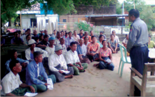
တပ်ကုန်းမြို့နယ် ရေအေးကျေးရွာအုပ်စု ရေအေးရွာတွင် ဇူလိုင်လပထမပတ်က ရွှေမြို့နယ်မြေ ရဲစခန်း စခန်းမှူး ရဲအုပ်စိုင်းဗိုလ်က သက်ငယ်မုဒိမ်းမှု ပပျောက်ရေးနှင့် မှုခင်းကျဆင်းရေး ပညာပေးဟောပြောစဉ်ကိုရ

ရွာငယ်မြို့နယ် ဇူလိုင် ၁၀ ရှမ်းပြည်နယ် ဇနကိုယ်ပိုင်အုပ်ချုပ်ခွင့်ရ ဒေသ ရွာငယ်မြို့နယ်၌ မြို့နယ်ရဲတပ်ဖွဲ့၊ အခြေခံပညာဦးစီးဌာနနှင့် ပြန်ကြားရေးနှင့် ပြည်သူ့ဆက်ဆံရေးဦးစီးဌာနတို့ ပူးပေါင်း၍ မြို့ကြီးကျေးရွာ၌ ယာဉ်စည်းကမ်း၊ လမ်းစည်းကမ်း၊ လူကုန်ကုမ္ပဏီ၊ မူးယစ်ဆေးဝါးနှင့် မှုခင်းအသိပညာပေးဟောပြောပွဲနှင့် လက်ကမ်းစားစောင်များဖြန့်ဝေခြင်းကို ဇူလိုင်လပထမပတ်က ကျင်းပခဲ့သည်။ ကျောင်းသူ ကျောင်းသားများအား အသိပညာပေးခဲ့ပြီး သိမှတ်နားလည်မှုများအား မေးခွန်းများမေးမြန်းကာ ဆုများချီးမြှင့်ခဲ့ကြောင်း သိရသည်။ ထွန်းထွန်းဝင်း(ရွာငယ်)