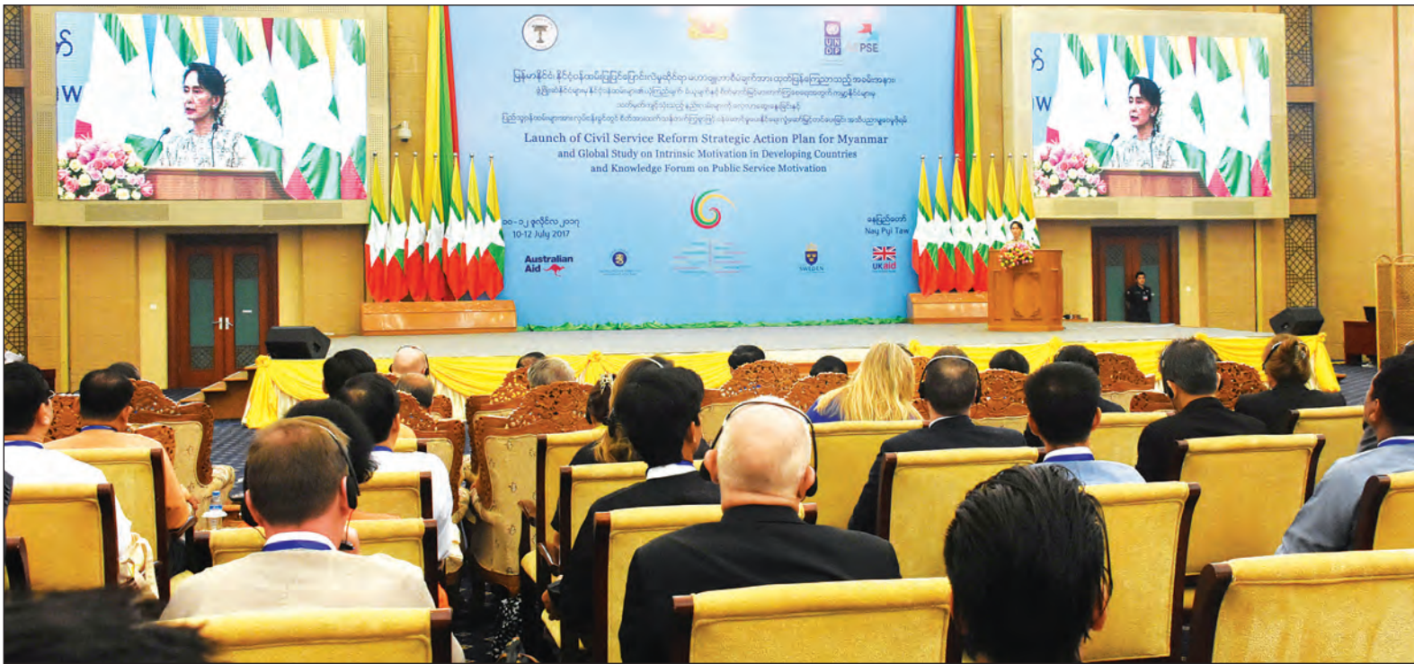
နိုင်ငံတော်အတိုင်ပင်ခံပုဂ္ဂိုလ် ဒေါ်အောင်ဆန်းစုကြည် မြန်မာနိုင်ငံ နိုင်ငံ့ဝန်ထမ်းပြုပြင်ပြောင်းလဲမှုဆိုင်ရာ မဟာဗျူဟာစီမံချက်ထုတ်ပြန်ကြေညာသည့်အခမ်းအနားတွင် အမှာစကားပြောကြားစဉ် (သတင်းစဉ်)

အခမ်းအနားတွင် နိုင်ငံတော်၏ အတိုင်ပင်ခံပုဂ္ဂိုလ် ဒေါ်အောင်ဆန်းစုကြည်က ပြောကြားရာတွင် နိုင်ငံ့ဝန်ထမ်းပြုပြင်ပြောင်းလဲမှုဆိုင်ရာ မဟာဗျူဟာစီမံချက်သည် လာမည့်နှစ်များအတွင်း မိမိနိုင်ငံအတွက် အကျိုးရှိစေမည့် အထူးလိုအပ်လျက်ရှိနေသည့် ဆန်းသစ်တီထွင်ထားသည့် ကျယ်ပြန့်သည့် ပြုပြင်ပြောင်းလဲမှုများ အကောင်အထည်ဖော်နိုင်ရန်အတွက် တန်ဖိုးရှိသည့် မူဘောင်တစ်ခုဖြစ်ပါကြောင်း၊ ကျင့်ဝတ်သိက္ခာကောင်းမွန်ခြင်း၊ ဘက်လိုက်မှုကင်းရှင်းခြင်း၊ တာဝန်ခံမှုရှိခြင်းဆိုသည့် “မူ”များအပေါ်အခြေခံပြီး လုပ်ရည်ကိုင်ရည်နှင့် ယုံကြည်ချက် ခိုင်မာမှုရှိသည့် ဝန်ထမ်းအဖွဲ့အစည်းသည် ကောင်းမွန်သော ဒီမိုကရေစီအုပ်ချုပ်ရေး၏ ကျောရိုးမထူရှင်ပင်ဖြစ်ပါကြောင်း။