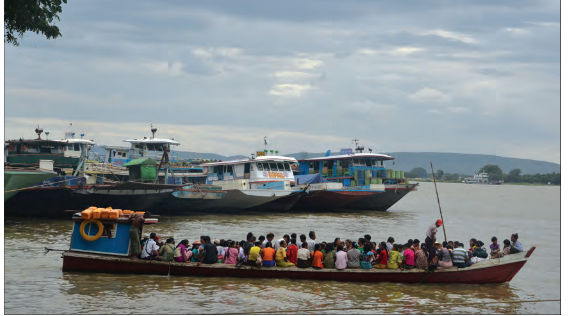
ဒေသများတွင် မိုးရွာသွန်းမှု ပြန့်လှည့်အားကောင်း လာမည်ဟု ခန့်မှန်းထားသည်။ မန္တလေးမြို့တွင် မြစ်ရေမြင့်တက်မှုအနေဖြင့်

လက်ရှိတွင် မန္တလေးမြို့၏ ဧရာဝတီမြစ်ရေမြင့် တက်မှု အခြေအနေမှာ ဇူလိုင် ၇ ရက် နေ့လယ် ၁၂ နာရီခွဲအချိန် တိုင်းထွာချက်များအရ မြစ်ရေ သည် ၁၀၅၅ စင်တီမီတာအထိ ရောက်ရှိနေပြီး မန္တလေးမြို့၏စိုးရိမ်ရေမှတ် ၁၂၆၀ စင်တီမီတာသို့ ရောက်ရှိရန် ၂၀၀ စင်တီမီတာ(ခုနှစ်ပေ)ခန့် လိုအပ်နေသေးသော်လည်း ဇူလိုင် ၉ ရက်မှ ၁၂ ရက်အထိ ကာလအတွင်း မြန်မာနိုင်ငံ မြောက်ပိုင်း