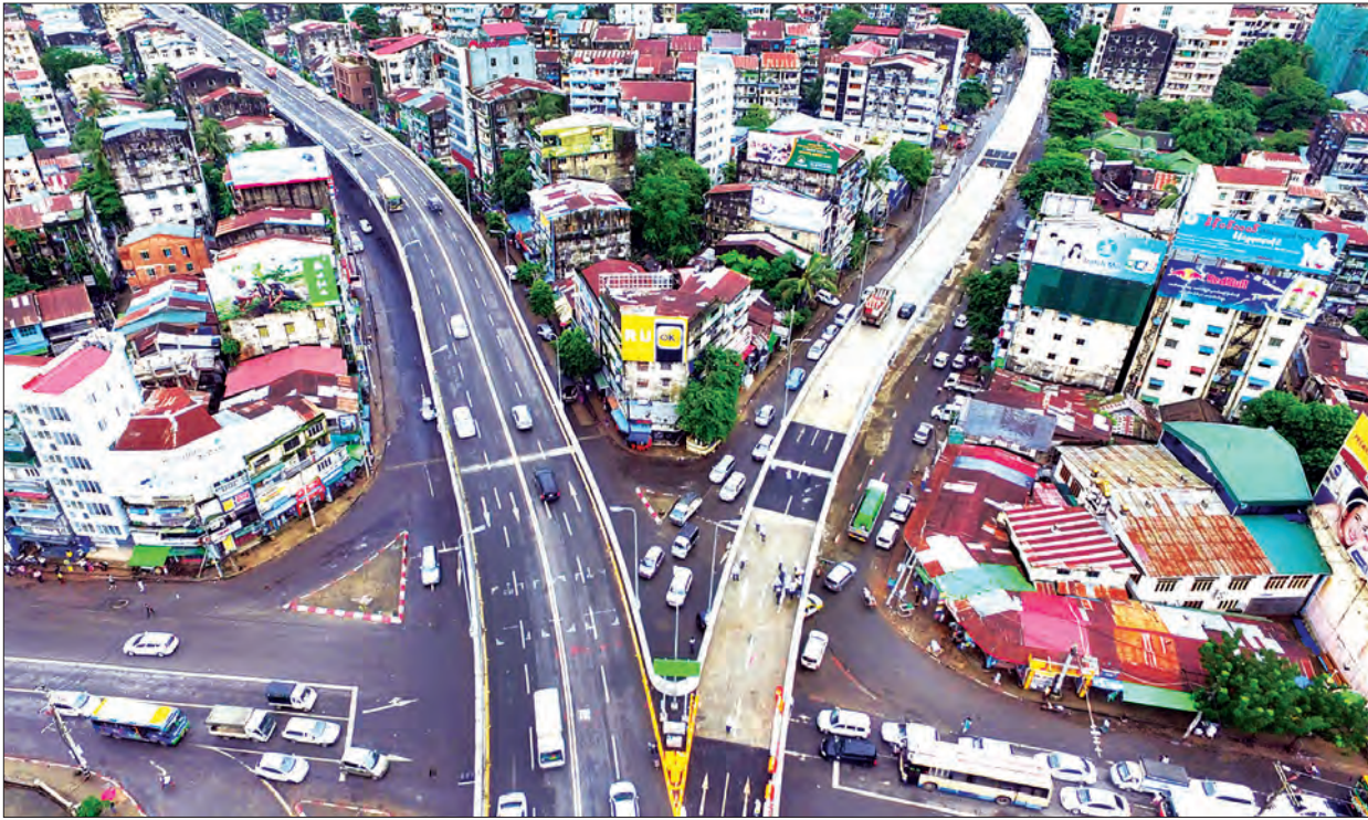
တာမွေမြို့နယ်နှင့် ဝဟန်းမြို့နယ်ကြားရှိ Y ပုံသဏ္ဍာန်ခုံးကျော်တံတားနှင့် မြို့မြင်ကွင်းကျယ်ကို ဝေဟင်မှတွေ့မြင်ရစဉ်