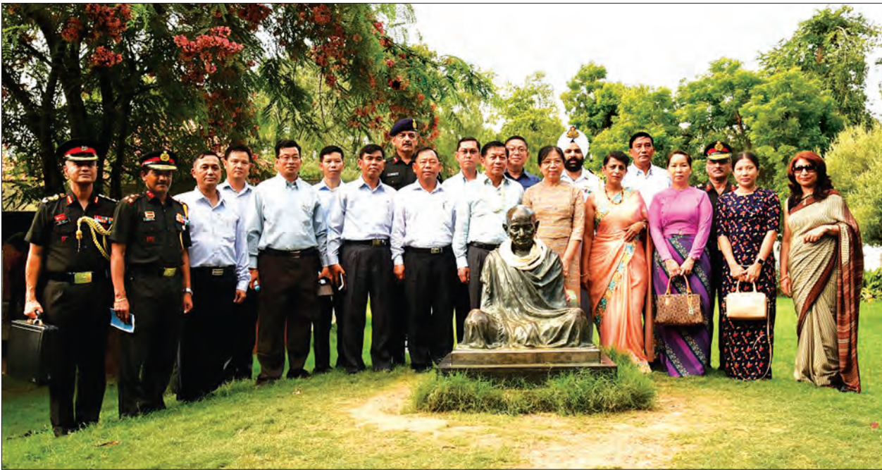
တပ်မတော်ကာကွယ်ရေးဦးစီးချုပ် ဗိုလ်ချုပ်မှူးကြီး မင်းအောင်လှိုင်၊ နေီးနှင့် အဖွဲ့ဝင်များ မဟာတ္ထမဂန္ဓိပြတိုက်ရှေ့တွင် အမှတ်တရရုပ်ပေါင်းဓာတ်ပုံရိုက်စဉ် (သတင်းစဉ်)

ယင်း Solar Plant သည် ဧရိယာအားဖြင့် ငါးဧကခန့်ရှိပြီး ဆိုလာပြားလေးထောင်ကျော်အသုံးပြု၍ နေရောင်ခြည်မှ လျှပ်စစ်စွမ်းအင် ထုတ်ယူလျက်ရှိသည်။ နေရောင်ခြည်မှ လျှပ်စစ်စွမ်းအင်ထုတ်ယူရာတွင် ဘက်ထရီများဖြင့် တစ်ဆင့်ခံ စုဆောင်းခြင်းမဟုတ်ဘဲ နေရောင်ခြည်မှ လျှပ်စစ်စွမ်းအင်ကို တိုက်ရိုက်မဟာဓာတ်အားလိုင်း