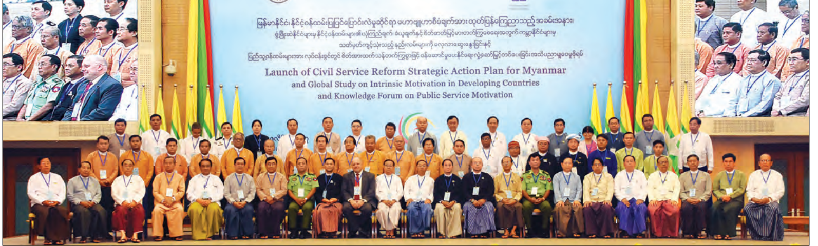
ဒုတိယသမ္မတ ဦးမြင့်ဆွေနှင့် အခမ်းအနားသို့ တက်ရောက်လာကြသူများ စုပေါင်းမှတ်တမ်းတင်ဓာတ်ပုံရိုက်စဉ် (သတင်းစဉ်)

နိုင်ငံဝန်ထမ်း ပြုပြင်ပြောင်းလဲမှုဆိုင်ရာ မဟာဗျူဟာစီမံချက်သည် အင်္ဂတီလိုက်စားမှုတိုက်ဖျက်ရေးအတွက် ပြည်သူ့ဝန်ထမ်းကျင့်ဝတ် တောင့်တင်းခိုင်မာရေး၊ ကိုယ်ကျင့်တရား ကောင်းမွန်ရေးနှင့် အင်္ဂတီလိုက်စားမှု တိုက်ဖျက်ရေးအတွက်