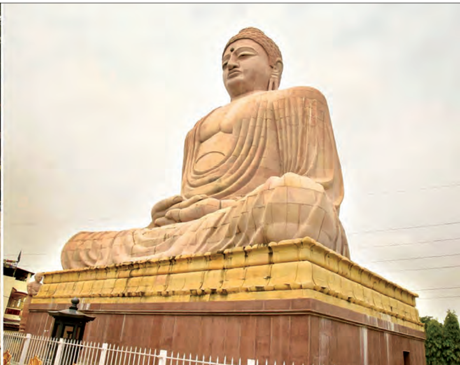
တပ်မတော်ကာကွယ်ရေးဦးစီးချုပ် ဝိုင်းချုပ်မှူးကြီးမင်းအောင်လှိုင်၊ ဇနီးနှင့် အဖွဲ့ဝင်များ ဂျပန်ဘုရားကြီးအား ဖူးမြော်ကြည့်စဉ်