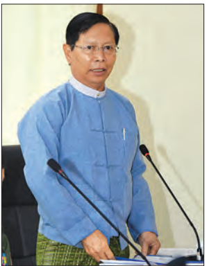
ပြည်ထောင်စုဝန်ကြီး သူရဦးအောင်ကို ရှင်းလင်းတင်ပြစဉ်

ယင်းနောက် ၂၀၁၇ ခုနှစ် နှစ်(၇၀) ပြည့် အာဇာနည်နေ့ အခမ်းအနားကျင်းပ