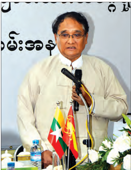
ပြည်ထောင်စုဝန်ကြီး ဒေါက်တာ သန်းမြင့် အမှာစကား ပြောကြားစဉ်