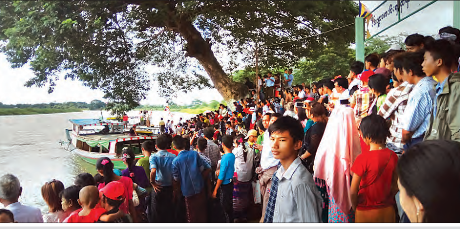
စန္ဒကူးနံ့သာ ကျောင်းတော်ရာစေတီမြတ်ကြီး၏ နှစ်စဉ်နှစ်တိုင်း ဘုရားဖူးလာငါးကြီးများကြိုဆိုပွဲကို ဘုရားဖူးများနှင့် စည်ကား သိုက်မြိုက်နေသည်ကို တွေ့ရစဉ်

ဘုရားဖူးငါးကြီးများမှာ ယခင် ၂၀၁၂ ခုနှစ်ခန့်က နောက်ဆုံးပေါ်ခဲ့ပြီး ယနေ့တိုင် ဘုရားဖူးငါးကြီးများကို ငါးကျွေး လာရောက်နေကြတဲ့ အနယ်နယ်အရပ်ရပ်မှ ပြည်သူများ မြင်တွေ့ခွင့်မရဘဲ ပြန်ခဲ့ကြရသည်ကို မြင်တွေ့နေရကြောင်း