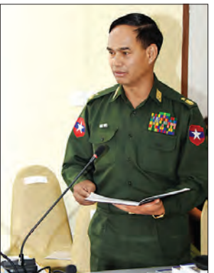
ပြည်ထောင်စုဝန်ကြီးဌာန ဒုတိယဝန်ကြီး ဗိုလ်ချုပ်အောင်စိုးရှင်းလင်းတင်ပြစဉ်

ဦးမြိုးမင်းသိန်းနှင့် လုံခြုံရေးကော်မတီဥက္ကဋ္ဌ ပြည်ထောင်စုဝန်ကြီးဌာန ဒုတိယဝန်ကြီး ဗိုလ်ချုပ်အောင်စိုးတို့က အာဇာနည်နေ့အခမ်းအနား အောင်မြင်စွာကျင်းပနိုင်ရေးအတွက် လုပ်ငန်းများ ဆောင်ရွက်ထားရှိမှု အခြေအနေများ