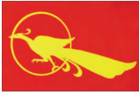
ရန်ကုန်တက္ကသိုလ် ကျောင်းသားသမဂ္ဂအလံ

ကျောင်းသားသမဂ္ဂစည်းကမ်းတကျ ဖွဲ့စည်းနိုင်ရေးနှင့် ကျောင်းသားသမဂ္ဂအဆောက်အအုံ ပြန်လည်တည်ဆောက်ရေး အတွက်လည်း နိုင်ငံတော်သမ္မတ ဒေါက်တာမောင်မောင်က ၁၉၈၈ ခုနှစ် စက်တင်ဘာ ၁ ရက်နေ့တွင် “ကျောင်းသားလူငယ်