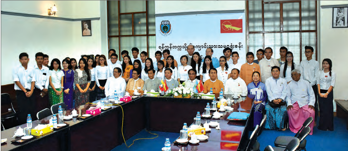
ရန်ကုန်တက္ကသိုလ် ကျောင်းသားသမဂ္ဂရုံးခန်းဖွင့်ပွဲအခမ်းအနားတွင် စုပေါင်းမှတ်တမ်းတင်ဓာတ်ပုံရိုက်ကြစဉ်

“ဒီနေရာကနေ ရန်ကုန်တက္ကသိုလ် ဖွံ့ဖြိုးတိုးတက်ရေး၊ ရန်ကုန်တိုင်းဒေသကြီးဖွံ့ဖြိုးတိုးတက်ရေးနဲ့ နိုင်ငံတော်ရဲ့ လူမှု စီးပွားစဉ်ဆက်မပြတ် ဖွံ့ဖြိုးတိုးတက်ရေးအတွက် အထောက် အကူပြုနိုင်တဲ့ တူးချွန်ထက်မြက်ပြီး နိုင်ငံတကာနဲ့ ယှဉ်ပြိုင်နိုင် စွမ်းရှိတဲ့ လူငယ်မောင်မယ်များမွေးထုတ်ပေးနိုင်ပါစေ” ဟူသည့် ပညာရေးဝန်ကြီးဌာန ပြည်ထောင်စုဝန်ကြီး၏ ဆုတောင်း စကားကလည်း ခေတ်အဆက်ဆက်ကျောင်းသား လှုပ်ရှားမှု များတွင် ပါဝင်ခဲ့သူ ကျောင်းသားသမဂ္ဂခေါင်းဆောင်များနှင့် သမဂ္ဂအဖွဲ့ဝင် ကျောင်းသားများအတွက် ကျေနပ်စရာပင်။