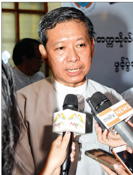
ပြည်ထောင်စုဝန်ကြီး ဒေါက်တာ မျိုးသိမ်းကြီး မီဒီယာများ ကိုဖြေကြားစဉ်