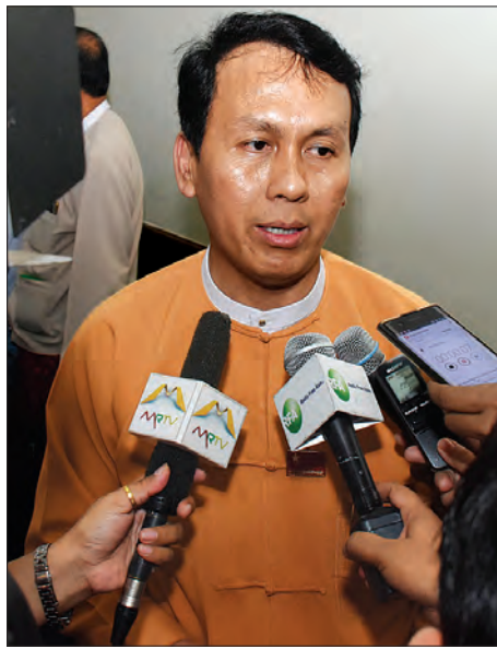
ရန်ကုန်တိုင်းဒေသကြီးဝန်ကြီးချုပ် ဦးမြိုးမင်းသိန်း မီဒီယာများ ကိုဖြေကြားစဉ်