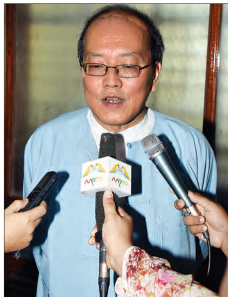
ရန်ကုန်တက္ကသိုလ် ပါမောက္ခချုပ် ဒေါက်တာ ဖိုးကောင်း မီဒီယာ များကိုဖြေကြားစဉ်