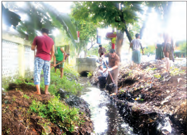
ပဲခူးတိုင်းဒေသကြီး တရားလွှတ်တော်တရားသူကြီးချုပ် ဦးမောင်မောင်ရွှေနှင့် တရားရေးဝန်ထမ်းမိသားစုများစုပေါင်း၍ ဇူလိုင် ၉ ရက်က တရားရုံးဝင်းအတွင်းနှင့် အပြင်တို့တွင် စုပေါင်းသန့်ရှင်းရေးများ ဆောင်ရွက်ကြစဉ် သန့်စင်(ပဲခူး)