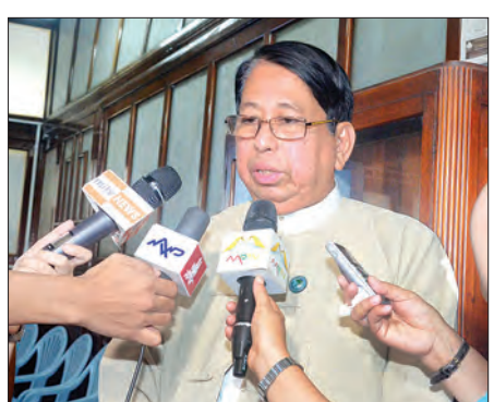
ပြည်ထောင်စုဝန်ကြီး ဒေါက်တာစေမြင့် မိဒီယာများအား ဖြေကြားစဉ်

ဒီစာအုပ်တစ်အုပ်ဆိုရင် ဘယ်စာအုပ်တိုက်က ထုတ်ဝေ ထားတာရှိသလဲ၊ သို့သော် စာအုပ်ပိုင်ရှင်က စာရေးသူသာ ဖြစ်ပါတယ်။ စာရေးသူဆိုတာ မှုပိုင်ခွင့်ကိုတောင်းခံပြီး သူကျ သင့်ကျထိုက်သော ဉာဏ်ပူဇော်ခပေးပြီးတော့ စာစဉ်ထဲမှာ ထည့်သွင်းခွင့်တောင်းပြီး စာအုပ်ကိုပြန်ပြီး တည်းဖြတ်ရတဲ့ အပိုင်းလေးတွေရှိမယ်။တချို့စာအုပ်တွေကြတော့ နဂိုရှိပြီးသား