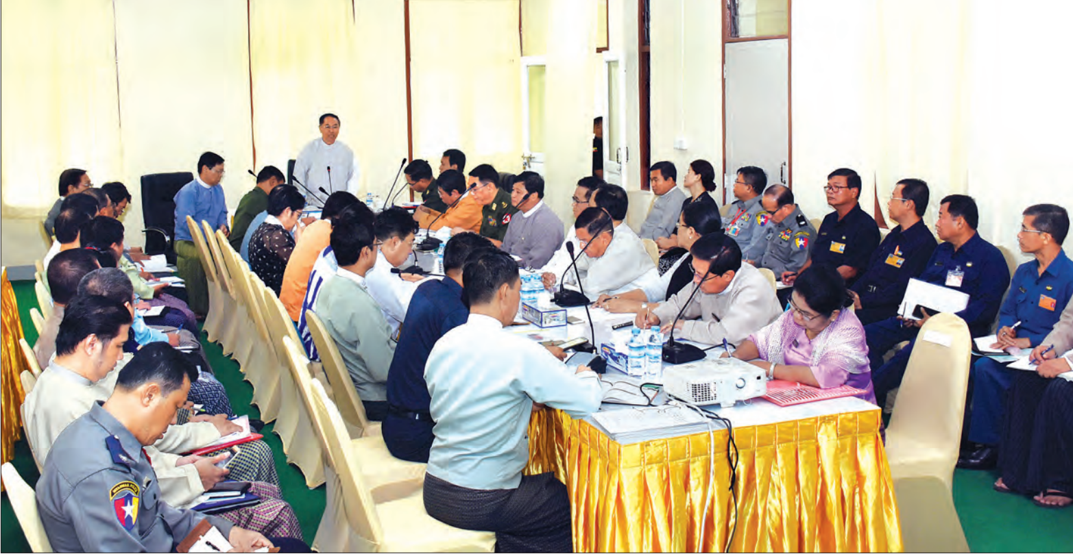
ဒုတိယသမ္မတ ဦးမြင့်ဆွေ ၂၀၁၇ ခုနှစ် နှစ်(၇၀)ပြည့် အာဇာနည်နေ့ အခမ်းအနားကျင်းပရေးပဟိုက်မတ်စ် ဒုတိယအကြိမ် ညှိနှိုင်းအစည်းအဝေးတွင် အမှာစကားပြောကြားစဉ် (သတင်းစဉ်)

ရန်ကုန် ဇူလိုင် ၉ ၂၀၁၇ခုနှစ် နှစ်(၇၀)ပြည့် အာဇာနည်နေ့ အခမ်းအနားကျင်းပရေး ပဟိုက်မတ်စ် ၏ ဒုတိယအကြိမ် ညှိနှိုင်းအစည်းအဝေးကို ယနေ့နံနက် ၇ နာရီခွဲတွင် ရန်ကုန်မြို့၊ ပဟန်းမြို့နယ် အာဇာနည်မိမိရီ ကွပ်ကဲရေးရုံး၌ကျင်းပရာ ၂၀၁၇ ခုနှစ် နှစ်(၇၀) ပြည့် အာဇာနည်နေ့အခမ်းအနား ကျင်းပရေး ပဟိုက်မတ်စ်နာယက ဒုတိယသမ္မတ ဦးမြင့်ဆွေ တက်ရောက်အမှာစကားပြောကြားသည်။ အခမ်းအနားတွင် ဒုတိယသမ္မတက အာဇာနည်နေ့သည် လွတ်လပ်ရေးအတွက် အသက်ပေးခဲ့သည့် အမျိုးသားခေါင်းဆောင်ကြီး ပိုလ်ချုပ်အောင်ဆန်းနှင့် အတူကျဆုံးခဲ့သည့် ခေါင်းဆောင်ကြီးများကို အမြဲတမ်းအမှတ်ရစေရန် အာဇာနည်နေ့အခမ်းအနားကို ကျင်းပပြုလုပ်ရခြင်းဖြစ်ကြောင်း၊ လွတ်လပ်ရေးသည် အသက်ပေးချွေးများကို စတေးပြီးမှ ခက်ခက်ခဲခဲရရှိခဲ့ခြင်း ဖြစ်ပါကြောင်း၊ လွတ်လပ်ရေးရရှိရန် အသက်ပေးခဲ့သည့် ပိုလ်ချုပ်အောင်ဆန်းနှင့် ခေါင်းဆောင်ကြီးများအား နောင်လာနောက်သားများ စာမျက်နှာ ၃ ကော်လံ ၁ *