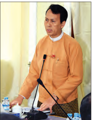
ရန်ကုန်တိုင်းဒေသကြီး ဝန်ကြီးချုပ် ဦးမြိုးမင်းသိန်း ရှင်းလင်းတင်ပြစဉ်

ရေးဗဟိုကော်မတီဥက္ကဋ္ဌ သာသနာရေးနှင့် ယဉ်ကျေးမှုဝန်ကြီးဌာန ပြည်ထောင်စုဝန်ကြီး သူရဦးအောင်ကို၊ ၂၀၁၇ ခုနှစ် နှစ်(၇၀)ပြည့် အာဇာနည်နေ့အခမ်းအနား ကျင်းပရေးလုပ်ငန်းကော်မတီ ဥက္ကဋ္ဌ ရန်ကုန်တိုင်းဒေသကြီး ဝန်ကြီးချုပ်