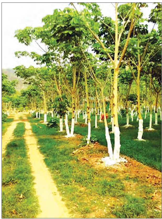
ယခုအခါလျှော်ဖြူဈေးကွက်မှာ ဒေသတွင်းနိုင်ငံများဖြစ်သည့် တရုတ်၊ ထိုင်းနိုင်ငံ များ၏ ဈေးကွက် လိုအပ်ချက်ကိုပင် ပြည့်မီနိုင်စွမ်းမရှိသေးသော်လည်း ကမ္ဘာ့ ဈေးကွက်၏ အဆင့်မြင့်စက်မှု ကုန်ကြမ်း သီးနှံဖြစ်လာသည့် လျှော်ဖြူဈေးကွက်ကို ဂျပန်၊ အမေရိကန်စသည့် နိုင်ငံများအထိ တင်ပို့နိုင်ရန် ဆောင်ရွက်သွားမည်ဖြစ်ကြောင်း သိရသည်။