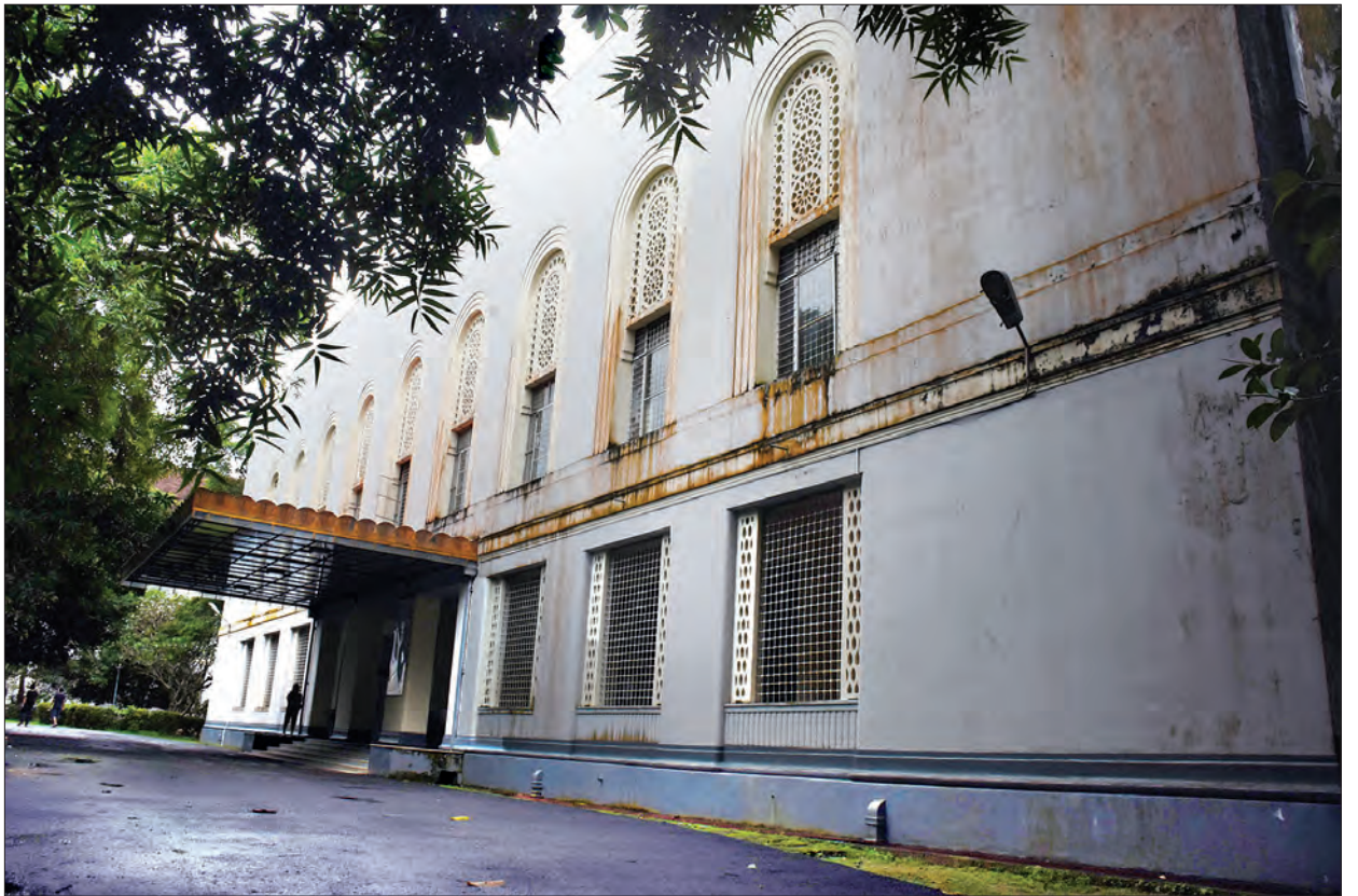
ရန်ကုန်တက္ကသိုလ်သို့ပို့ဆောင် အဆောက်အအုံနှင့် ရန်ကုန်တက္ကသိုလ်ကျောင်းသားသမဂ္ဂရုံးခန်းဝင်ပေါက်အား တွေ့ရစဉ်

သတင်းဆောင်းပါး- ခင်မောင်ထွေး ၊ ဝင်းဝင်းမော်၊ နန္ဒာဝင်း ၊ ဓာတ်ပုံ- ဇော်မင်းလတ် ၊ ရဲထွဋ်